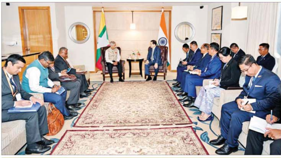
ပြည်ထောင်စုသမ္မတမြန်မာနိုင်ငံတော် နိုင်ငံတော်သမ္မတ ဦးမင်းအောင်လှိုင်နှင့် အိန္ဒိယနိုင်ငံ ပြည်ပရေးရာဝန်ကြီး H.E. Dr. Subrahmanyam Jaishankar တို့ တွေ့ဆုံဆွေးနွေးစဉ်။

နေပြည်တော် မေ ၃၀ အိန္ဒိယနိုင်ငံ နယူးဒေလီမြို့၌ တရားဝင်ခရီးစဉ် ရောက်ရှိနေသည့် ပြည်ထောင်စုသမ္မတမြန်မာနိုင်ငံတော် နိုင်ငံတော်သမ္မတ ဦးမင်းအောင်လှိုင်ထံ အိန္ဒိယနိုင်ငံ ပြည်ပရေးရာဝန်ကြီး H.E. Dr. Subrahmanyam Jaishankar က ယနေ့ညနေပိုင်းတွင် လာရောက် ဂါရဝပြုတွေ့ဆုံသည်။ ထိုသို့တွေ့ဆုံရာတွင် မြန်မာ-အိန္ဒိယ နှစ်နိုင်ငံအကြား ချစ်ကြည် ရင်းနှီးမှုနှင့် ပူးပေါင်းဆောင်ရွက်မှု များ တိုးတက်ကောင်းမွန်လျက် ရှိမှုအခြေအနေများ၊ ယခုကဲ့သို့ တရားဝင်ခရီးစဉ်မှ တစ်ဆင့် နှစ်နိုင်ငံအကြား ချစ်ကြည်ရင်းနှီးမှု နှင့် ပူးပေါင်းဆောင်ရွက်မှုများ ပိုမိုတိုးတက် ကောင်းမွန်လာမည့် အခြေအနေများ၊ အိန္ဒိယနိုင်ငံ အနေဖြင့် မြန်မာနိုင်ငံတွင် ကျင်းပ ပြုလုပ်ခဲ့သည့် ပါတီစုံဒီမိုကရေစီ အထွေထွေရွေးကောက်ပွဲအပေါ် ထောက်ခံမှု အခြေအနေများ၊ နှစ်နိုင်ငံအကြား ဖွံ့ဖြိုးတိုးတက်