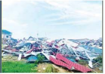
ကရင်ပြည်နယ် မြဝတီခရိုင် ရွှေကုက္ကိုလ်ဒေသရှိ အွန်လိုင်းလောင်းကစား လုပ်ကိုင်ခဲ့သည့် တရားမဝင် အဆောက်အအုံများကို ဖောက်ခွဲဖျက်ဆီးမှု။