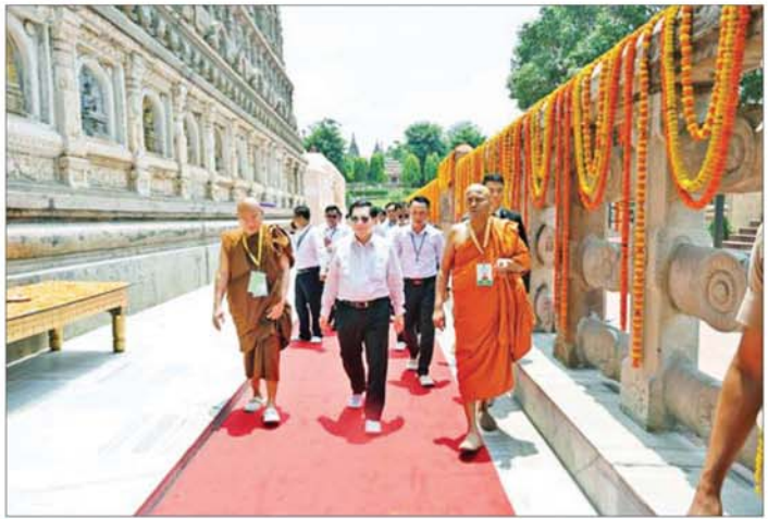
နိုင်ငံတော်သမ္မတ ဦးမင်းအောင်လှိုင် မဟာဗောဓိဓမ္မရိပ်သာ မြောက်ဘက်ခြမ်းအား လှည့်လည်ဖူးမြော်ကြည့်ည့်စဉ်။

* ရှေ့ဖိုးမှ ဦးစွာ နိုင်ငံတော်သမ္မတနှင့်အဖွဲ့ဝင်များသည် မဟာဗောဓိ မဟာဝိဟာရဘုရားကျောင်းသို့ ရောက်ရှိကြပြီး မဟာဗောဓိဓမ္မရိပ်သာအတွင်းရှိ ဗုဒ္ဓရုပ်ပွားတော်မြတ်အား ဖူးမြော်ကြည့်ည့်၍ မြသပတ်ဆွမ်းတော်၊ သောက်တော်ရေချမ်း၊ ဆီမီး၊ ပန်းနှင့် သက်န်းများကပ်လှူပူဇော်သည်။ ထို့နောက် နိုင်ငံတော်သမ္မတကိုယ်စား ဆရာတော်ကြီးတစ်ပါးက ဗုဒ္ဓရုပ်ပွားတော်မြတ်အား သက်န်းကပ်လှူပူဇော်သည်။