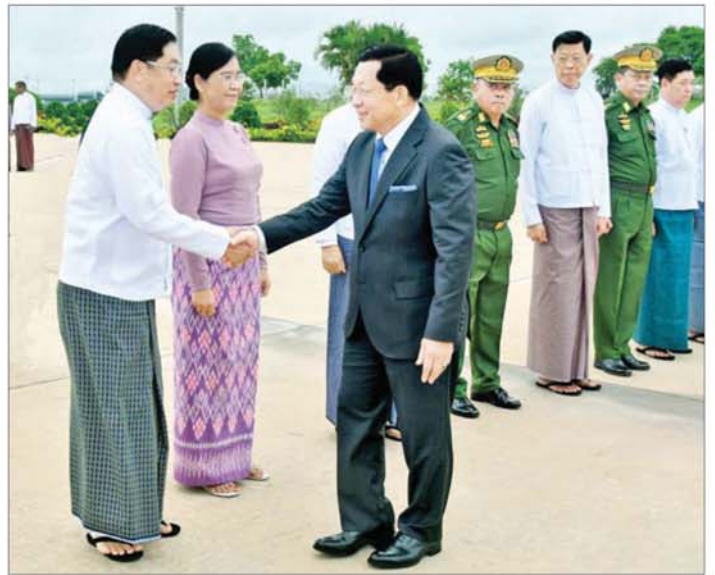
ရောက်ရှိကြရာ တာဝန်ပိုင်ဆိုင်သူ အုပ်ချုပ်ရေးမှူး Lt. Gen. (Retd) Syed Ata Hasnain နှင့် အစိုးရအဖွဲ့မှ တာဝန်ရှိသူများ အိန္ဒိယသမ္မတနိုင်ငံဆိုင်ရာ မြန်မာနိုင်ငံသံအမတ်ကြီး ဦးခင်ဦး၊ မြန်မာစစ်သံကြွယ်ဝ ဗိုလ်မှူးချုပ် ဇော်မိုးလွင်၊ မြန်မာကောင်စစ်ဝန်ချုပ်နှင့် တာဝန်ရှိသူများက လေဆိပ်၌ လိုက်လံနွှော့ထွေးစွာ ဖြင့် ဂုဏ်ပြုတပ်ပွဲနှင့်အတူ ကြိုဆိုနှုတ်ဆက်ကြသည်။

ပို့ဆောင်နှုတ်ဆက် နိုင်ငံတော် သမ္မတ ဦးမင်းအောင်လှိုင်အား ဒုတိယသမ္မတ ဦးညိုစော၊ ဒုတိယသမ္မတ ဒေါ်နန်းနီနီအေး၊ အမျိုးသားလွှတ်တော်ဥက္ကဋ္ဌ ဦးအောင်လင်း၊ တပ်မတော်ကာကွယ်ရေး ဦးစီးချုပ် ဗိုလ်ချုပ်ကြီး ရဲဝင်းဦး၊ ပြည်ထောင်စု ဝန်ကြီးများနှင့် တာဝန်ရှိသူများက နေပြည်တော် လေဆိပ်တွင် ပို့ဆောင်နှုတ်ဆက်ကြစဉ်။