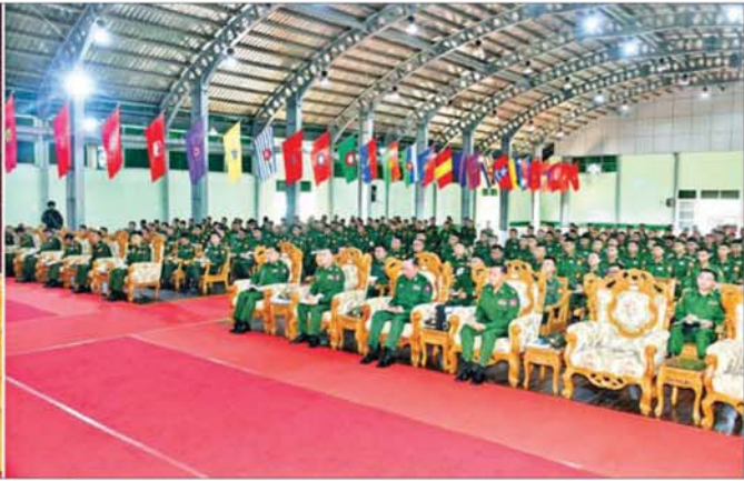
ဒုတိယတပ်မတော်ကာကွယ်ရေးဦးစီးချုပ် ကာကွယ်ရေးဦးစီးချုပ်(ကြည်း) ဗိုလ်ချုပ်ကြီး ကျော်စွာလင်း ဟိုပုံးတပ်နယ် တပ်မတော်ကွန်ပျူတာနှင့် နည်းပညာသိပ္ပံကျောင်းမှ နည်းပြများနှင့် သင်တန်းသားများအား တွေ့ဆုံအမှာစကားပြောကြားစဉ်။

ဦးစွာ ဒုတိယတပ်မတော် ကာကွယ်ရေးဦးစီးချုပ် ကာကွယ်ရေးဦးစီးချုပ်(ကြည်း) ဗိုလ်ချုပ်ကြီး ကျော်စွာလင်းနှင့် အဖွဲ့ဝင်များသည် တပ်မတော်ကွန်ပျူတာနှင့် နည်းပညာသိပ္ပံကျောင်း ဌာနချုပ်ရုံး အစည်းအဝေးခန်းမသို့ ရောက်ရှိကြရာ ခေတ္တကျောင်းအုပ်ကြီးက လေ့ကျင့်သင်ကြားရေး ဆိုင်ရာ ဆောင်ရွက်နေမှုများ၊ သင်ထောက်ကူ ဖွဲ့စည်းများအား အဆင့်မြင့်တင် လေ့ကျင့်သင်ကြားပေးနေမှုများနှင့် တပ်တည်ဆောက်ရေးလုပ်ငန်းများ ဆောင်ရွက်နေမှုများကို ရှင်းလင်းတင်ပြရာ ဒုတိယတပ်မတော်ကာကွယ်ရေးဦးစီးချုပ် ကာကွယ်ရေးဦးစီးချုပ်(ကြည်း)က သင်တန်းသားများအတွက် သင်ယူလျက်ရှိသည့် ဘာသာရပ်များနှင့် ပတ်သက်၍ လေ့လာဆည်းပူးနိုင်မည့် စာအုပ်၊ စာစောင်များအား စာကြည့်တိုက်များတွင်ထားရှိပေးရန်နှင့် အခြားလိုအပ်သည့်များကို မှာကြားကာ တင်ပြချက်များအပေါ် တာဝန်ရှိသူများနှင့် ပေါင်းစပ်ညှိနှိုင်းဆောင်ရွက်ပေးသည်။ ထို့နောက် ဒုတိယတပ်မတော် ကာကွယ်ရေးဦးစီးချုပ် ကာကွယ်ရေးဦးစီးချုပ်(ကြည်း) ဗိုလ်ချုပ်ကြီး ကျော်စွာလင်းသည် သင်တန်းကျောင်းရှိ ဘုရင့်နောင်ခန်းမတွင် နည်းပြအရာရှိများ၊ သင်တန်းသားများအား သွားရောက်တွေ့ဆုံ၍ အမှာစကား ပြောကြားရာတွင် တပ်မတော်အတွက် လိုအပ်သော လူသား အရင်းအမြစ်များကို