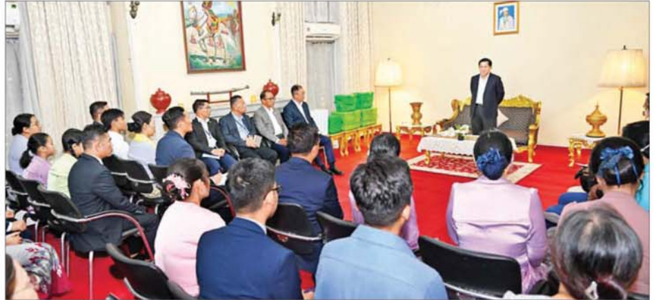
ပြည်ထောင်စုသမ္မတမြန်မာနိုင်ငံတော် နိုင်ငံတော်သမ္မတ ဦးမင်းအောင်လှိုင် အိန္ဒိယနိုင်ငံဆိုင်ရာ မြန်မာသံရုံး၊ စစ်သံရုံးမိသားစုများ၊ ပညာတော်သင် သင်တန်းသားများအား တွေ့ဆုံအမှာစကားပြောကြားစဉ်။

တင်လက်မှတ်ရေးထိုးသည်။ ထို့နောက် အိန္ဒိယနိုင်ငံဆိုင်ရာ မြန်မာနိုင်ငံ သံအမတ်ကြီးနှင့် သံရုံး၊ စစ်သံရုံးမိသားစုများက တစ်ဦးချင်းမိတ်ဆက်ကြသည်။ ယင်းနောက် နိုင်ငံတော်သမ္မတ က ယခုကဲ့သို့ သံရုံး၊ စစ်သံရုံးမိသားစု ဝင်များနှင့် တွေ့ဆုံရာသည့်အတွက် ဝမ်းမြောက်ကြောင်း၊ မိမိအနေဖြင့် ယခုလာရောက်ခဲ့သည့် ခရီးစဉ် သည် နိုင်ငံတော်သမ္မတအဖြစ် တာဝန်ထမ်းဆောင်ပြီးနောက်ပိုင်း အိန္ဒိယနိုင်ငံအစိုးရ၏ မိတ်ကြား ချက်အရ နိုင်ငံတော်အကြီးအကဲ အနေဖြင့် ပြည်ပနိုင်ငံသို့ ပထမဆုံး လာရောက်သည့် ခရီးစဉ်ဖြစ် ကြောင်း၊ အိန္ဒိယနိုင်ငံနှင့် မြန်မာ နိုင်ငံတို့သည် နယ်စပ်ဒေသများ ထိစပ်လျက်ရှိပြီး ရှေးယခင် ကတည်းက ကောင်းမွန်သည့် ဆက်ဆံရေးများရှိခဲ့ကာ သမိုင်း ကြောင်းအရလည်း တူညီမှုများရှိခဲ့ ကြောင်း၊ ၂၀၂၀ ပြည့်နှစ် ပါတီစုံ ဒီမိုကရေစီ အထွေထွေရွေးကောက် ပွဲတွင် မဲမသမာမှုများဖြစ်ပေါ်ခဲ့မှု ကြောင့် တပ်မတော်အနေဖြင့် နိုင်ငံတော်တာဝန်ကို ဖွဲ့စည်းပုံ အခြေခံဥပဒေနှင့်အညီ ထမ်းဆောင် ခဲ့ကြောင်း၊ သို့သော် တပ်မတော် အနေဖြင့် ပြည်သူများလိုလားသည့် ပါတီဒီမိုကရေစီ လမ်းကြောင်း