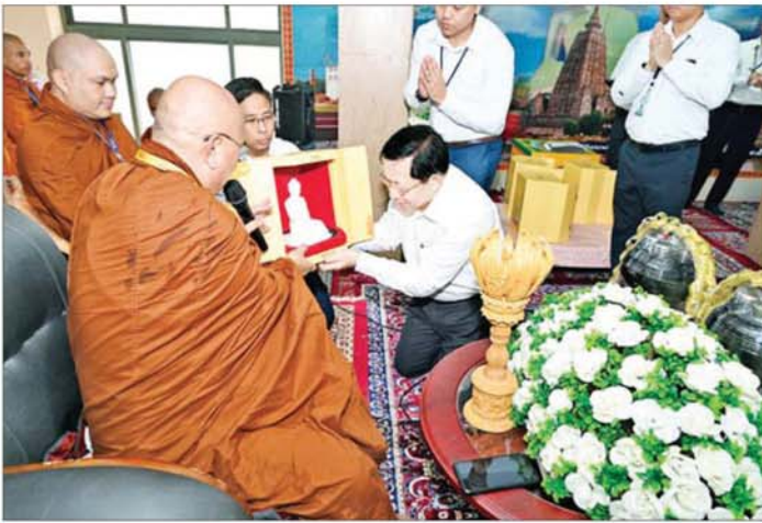
နိုင်ငံတော်သမ္မတ ဦးမင်းအောင်လှိုင် မဟာဗောဓိဓမ္မရိပ်သာ မြန်မာဘုန်းတော်ကြီးကျောင်းသို့ လှူဖွယ်ပစ္စည်းများ ဆက်ကပ်လှူဒါန်းစဉ်။