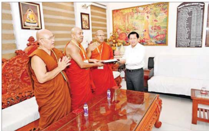
နိုင်ငံတော်သမ္မတ ဦးမင်းအောင်လှိုင် မဟာဗောဓိဓမ္မရိပ်သာ မြောက်ဘက်ခြမ်းအတွက် စုပေါင်းအလှူငွေများအား မဟာဗောဓိကျောင်း ဆရာတော်ထံ ဆက်ကပ်လှူဒါန်းစဉ်။

ထို့နောက် နားနေဆောင်တွင် နိုင်ငံတော်သမ္မတက မဟာဗောဓိဓမ္မရိပ်သာမြတ်ကြီး ဘက်စုံပြုပြင်