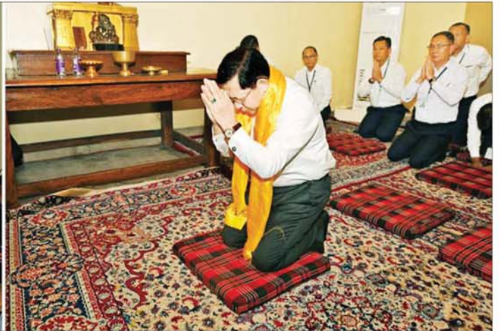
နိုင်ငံတော်သမ္မတ ဦးမင်းအောင်လှိုင် မဟာဗောဓိစေတီတော်မြတ်ကြီး အထက်ပစ္စယရှိ ဗုဒ္ဓရုပ်ပွားတော်မြတ်အား ဖူးမြော်ကြည်ညိုစဉ်။