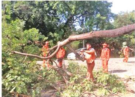
ပိုးရွာသွန်းမှုကြောင့် သစ်ပင်လဲကျပြီး လမ်းပိတ်ဆို့မှုဖြစ်ပွားသဖြင့် ရှင်းလင်းရေးလုပ်ငန်းများ ဆောင်ရွက်