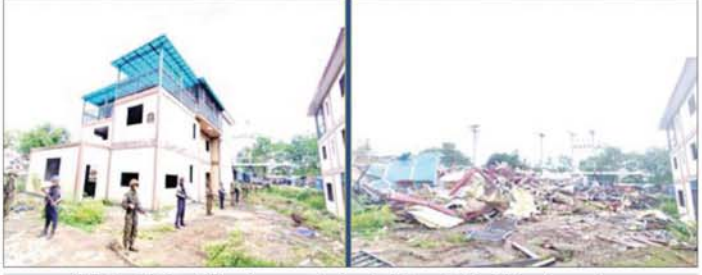
ကရင်ပြည်နယ် မြဝတီမြို့နယ် ရွှေကုက္ကိုလ်နယ်မြေရှိ အွန်လိုင်းလိမ်လည်လောင်းကစားမှုများ လုပ်ကိုင်ခဲ့သည့် တရားမဝင်အဆောက်အအုံများ မဖြိုဖျက်မီ(ဝဲပုံ)နှင့် ဖြိုဖျက်ပြီး(ယာပုံ)ကို တွေ့ရစဉ်။