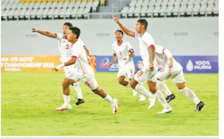
တီမော့အသင်းကို အနိုင်ရပြီး မြန်မာအသင်းကစားသမားများ အောင်ပွဲခံနေစဉ်။

မြန်မာအသင်းရော့ တီမော့အသင်းပါ နောက်တစ်ဆင့်တက်ရောက်ရန် အခွင့်အရေးမရှိသော်လည်း အနိုင်ရရှိရေးအတွက် ကြိုးစားကစားခဲ့ပြီး မြန်မာအသင်းသည် နောက်မှလိုက်ကစားကာ အနိုင်ရခဲ့ခြင်းဖြစ်သည်။ မြန်မာအသင်းသည် ခြေအသာဖြင့် ကစားနိုင်ပြီး ဂိုးသွင်းခွင့်များစွာ ရခဲ့သော်လည်း အသုံးမချနိုင်သဖြင့် ရုန်းကန်ခဲ့ရပြီး ပထမပိုင်းပြီးခါနီးတွင် ဦးဆောင်ဂိုးပေးလိုက်ရသဖြင့် နောက်မှလိုက်ကစားရကာ ဒုတိယပိုင်းသွင်းဂိုးများကြောင့် အနိုင်ရခဲ့ခြင်းဖြစ်သည်။