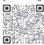
မြန်မာနိုင်ငံအမျိုးသားလူ့အခွင့်အရေးကော်မရှင်

၄။ ကော်မရှင်သည် ယင်းတိုင်ကြားချက်များကို စိစစ်၍ ကော်မရှင်ဥပဒေ၊ လူ့အခွင့်အရေးနှင့်အညီ စုံစမ်းစစ်ဆေးပြီး သက်ဆိုင်ရာ ဌာန၊ အဖွဲ့အစည်းများနှင့် ဆက်သွယ်ညှိနှိုင်းပူးပေါင်းဆောင်ရွက်ပေးသွားမည်ဖြစ်ပါသည်။