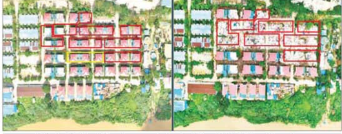
ကရင်ပြည်နယ် မြဝတီမြို့နယ် ရွှေကုက္ကိုလ်နယ်မြေရှိ အွန်လိုင်းလိမ်လည်လောင်းကစားမှုများ လုပ်ကိုင်ခဲ့သည့် တရားမဝင်အဆောက်အအုံများ မဖြိုဖျက်မီ(ဝဲပုံ)နှင့် ဖြိုဖျက်ပြီး(ယာပုံ)ကို တွေ့ရစဉ်။