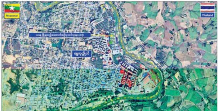
ကရင်ပြည်နယ် မြဝတီမြို့နယ် ရွှေကုက္ကိုလ်နယ်မြေရှိ အွန်လိုင်းလိမ်လည်လောင်းကစားမှုများ လုပ်ကိုင်ခဲ့သည့် တရားမဝင်အဆောက်အအုံများအား ဖောက်ခွဲဖျက်ဆီးမှု။

နေပြည်တော် ၈ ဇွန် ၇ အွန်လိုင်းလိမ်လည် လောင်းကစားမှုများကို အခြေချလုပ်ကိုင်ခဲ့ကြသည့် ကရင်ပြည်နယ် မြဝတီမြို့နယ်၊ ရွှေကုက္ကိုလ်နယ်မြေနှင့် KK Park နယ်မြေများရှိ တရားမဝင်အဆောက်အအုံများအား အပြီးတိုင် ဖြိုချဖျက်ဆီးခြင်းများနှင့် လုပ်ငန်းလုပ်ဆောင်ရာတွင် အသုံးပြုခဲ့သည့် ပစ္စည်းများအား စနစ်တကျဖျက်ဆီးခြင်းများကို ဌာနဆိုင်ရာပူးပေါင်းအဖွဲ့များဖြင့် ဆောင်ရွက်လျက်ရှိရာ ယနေ့တွင် ရွှေကုက္ကိုလ်နယ်မြေအတွင်းရှိ တရားမဝင် သုံးထပ်လူနေ အဆောက်အအုံ သုံးလုံးကို ထပ်မံ၍ စနစ်တကျဖြိုချဖျက်ဆီးခဲ့ကြောင်း သိရသည်။