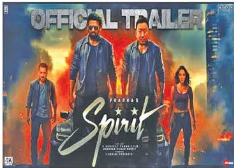
ဘောလိဝုဒ် အနုပညာရှင် နှင့် ကိုရီးယားထိပ်တန်းသရုပ် ဘာဟုဘာလီမင်းသား ပရဘာတစ် ဆောင် မာဒုံဆော့တို့ ပါဝင်ထား

သည့် Spirit မှာ အိန္ဒိယ-ကိုရီးယား အက်ရှင်ဒရာမာဇာတ်ကားကြီးဖြစ်ကြောင်း ဘောလိဝုဒ် ဝက်ဘ်ဆိုက်တွင် ဖော်ပြသည်။ အဆိုပါဇာတ်ကားတွင် လူ့ဘဝကို မာနနှင့် အာဏာသုံးပြီး လမ်းကြောင်းမှန်မသွားသည့် လူတစ်ယောက်၊ မိမိဆုံးဖြတ်ချက်နှင့် အန္တရာယ်ကြီးထဲ ဝင်ရောက်သွားပုံကို ရိုက်ကူးထားသည်။ သူ့ဘဝတွင် ရန်သူများ၊ လှည့်စားမှုများ၊ သစ္စာဖောက်မှုများ ဆက်တိုက်ဝင်လာ၍ ယုံကြည်မှု ကင်းမဲ့လာရာမှ အတိတ်က လှူပိုင်ချက်များ ပေါ်လာ၍ နောက်ဆုံးတွင် မိမိဆုံးဖြတ်ချက်နှင့် ရွေးချယ်ခဲ့သည့် လမ်းကြောင်းအတွက် တန်ဖိုးကြီးပေးဆပ်မှုနှင့်အတူ အမှန်တရားကို ရင်ဆိုင်ရပုံအကြောင်း အက်ရှင်ဒရာမာအဖြစ် တင်ဆက်ထားသည်။ ဘာဟုဘာလီမင်းသား ပရဘာတစ်နှင့် မာဒုံဆော့တို့နှစ်ဦးကို အတူတွဲမြင်တွေ့ကြရသဖြင့် ပရိသတ်အားပေးမှုကို တစ်ခက်ရရှိထားသည်။ (SKY)