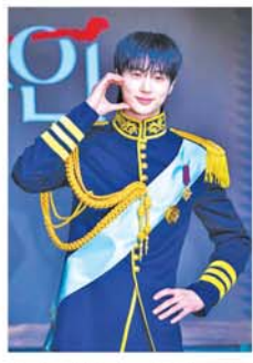
လိုက်ဖက်ညီစွာ ဇာတ်အိမ်ထူးခြားစွာနှင့် ဆွဲဆောင်မှုရှိပြီး ဧပြီ ၁၀ ရက်တွင် ထွက်ရှိခဲ့ရာ ပရိသတ်ကြား၌ ဝတ်စုံနှင့်လိုက်ဖက်နေ၍ ရေပန်းစားခဲ့သည်။ (SKY) 0-0-0-0-0

အမ်ဘီစီ၏ Romance Comedy ဇာတ်လမ်းတွဲသစ်တွင် Perfect Crown ဇာတ်ဝင် မင်းသားအဖြစ် ဖြောင်ခွဲထွက်ကို ခေတ်သစ်နန်းတွင်းဝတ်စုံနှင့်မြင်တွေ့ရ၍ ပရိသတ်ကြား၌ ရေပန်းစားနေကြောင်း ကိုရီးယားဘိုးဝက်ဘ်ဆိုက်တွင် ဖော်ပြသည်။ အဆိုပါ ဇာတ်ကားတွင် Byeon Woo Seok က ဇော်ဝင်မျိုးနွယ် မင်းသားလေးအဖြစ် ပါဝင်ထားပြီး သူ့အရုပ်နှင့် လိုက်ဖက်သော ခေတ်သစ်နန်းတွင်းဝတ်စုံနှင့် ခန့်ညားစွာ မြင်တွေ့ရမည်ဖြစ်သည်။ အဆိုတော်၊ သရုပ်ဆောင် IU (ခေါ်) Lee Ji Eun နှင့်တွဲ၍