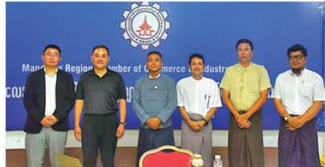
ဆိုင်ရာများ တင်ပြရာ မန္တလေးတိုင်းဒေသကြီးကုန်သည်များနှင့် စက်မှုလက်မှုလုပ်ငန်းရှင်များက ပညာသင်ကြားခွင့်နှင့် အလုပ်အကိုင်အခွင့်အလမ်းများ၊ EV မော်တော်ဆိုင်ကယ်စက်ရုံ မန္တလေးစက်မှုဇုန်တွင် လာရောက်ဖွင့်လှစ်