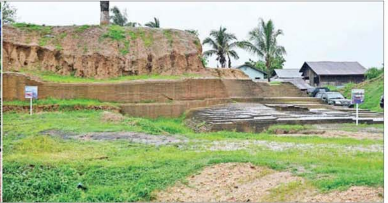
နိုင်ငံတော်သမ္မတ ဦးမင်းအောင်လှိုင် ကေတုမတီမြို့ဟောင်း ရှေးဟောင်းယဉ်ကျေးမှုအမွေအနှစ်များနှင့် မြို့ရိုး၊ ကျုံးနှင့် နန်းတော်ရာ ပြန်လည်ဖော်ထုတ်ထိန်းသိမ်းရေးလုပ်ငန်းများ ဆောင်ရွက်နေမှု အခြေအနေများကို ကြည့်ရှုစစ်ဆေးစဉ်။

စာမျက်နှာ ၄ မှ သုတေသနပြုလုပ်၍ ဖော်ထုတ် ထိန်းသိမ်းခြင်းများ ဆောင်ရွက် သွားရန်လိုကြောင်း၊ ရှေးဟောင်း အမွေအနှစ်နေရာများကို ဥပဒေ နှင့်အညီ ကာကွယ်ထိန်းသိမ်း ဆောင်ရွက်သွားရန် လိုကြောင်း၊ ကျုံးကျားတံတားများနှင့် ဆက်စပ် လျက်ရှိသည့်လမ်းများ ပြန်လည် ဖော်ထုတ် တည်ဆောက်ခြင်း လုပ်ငန်းများ ဆောင်ရွက်ရာတွင် ရှေးမုဗျက် မူလပုံစံများအတိုင်း ဖြစ်ရန်နှင့် ရေရှည်တည်တံ့ခိုင်မြဲ မှုရှိရန် လိုကြောင်းနှင့် အခြား လိုအပ်သည်များကို လမ်းညွှန် မှာကြားပြီး ကေတုမတီ နန်းမြို့ရိုး တစ်လျှောက် မော်တော်ယာဉ်များ ဖြင့် ကြည့်ရှုစစ်ဆေးကာ တာဝန်ရှိ သူများအား လိုအပ်သည်များ