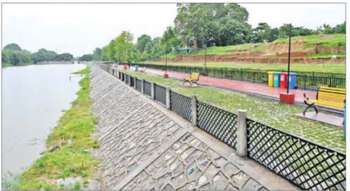
ကေတုမတီမြို့ဟောင်းကျုံး ပြန်လည်ဖော်ထုတ်ထိန်းသိမ်းထားမှုကို တွေ့ရစဉ်။

သည်လာရောက်လေ့လာကြည့် တောင်သူများနှင့် ရင်းရင်းနှီးနှီး တွေ့ဆုံကာ စိုက်ပျိုးရေးလုပ်ငန်း များ ဆောင်ရွက်နေမှုကို မေးမြန်း အားပေးစကား ပြောကြားပြီး မျိုးစပါးများရရှိရေး၊ ပန်းတိုင် အထွက်နှုန်းများ ရရှိစေရေး၊ သီးထပ်စွမ်းအားများ ကောင်းမွန် မှုရှိစေရေးတို့နှင့် ပတ်သက်၍ ဆွေးနွေးအကြံပြု ပြောကြား သည်။ တောင်ငူခရိုင် ဖွံ့ဖြိုးတိုးတက် ရေး ဆွေးနွေးမှာကြား ထိုနောက် နိုင်ငံတော်သမ္မတ သည် ပဲခူးတိုင်းဒေသကြီး တောင်ငူခရိုင်အတွင်းရှိ ခရိုင်၊ မြို့နယ်အဆင့် ဌာနဆိုင်ရာတာဝန် ရှိသူများအား နယ်မြေခံလေတပ် စဉ်ခန်းမဆောင်၌ တွေ့ဆုံ၍