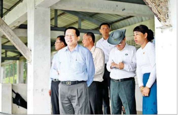
နိုင်ငံတော်သမ္မတ ဦးမင်းအောင်လှိုင် တောင်ငူခရိုင် အားကစားကွင်းကို ကြည့်ရှုစစ်ဆေးစဉ်။