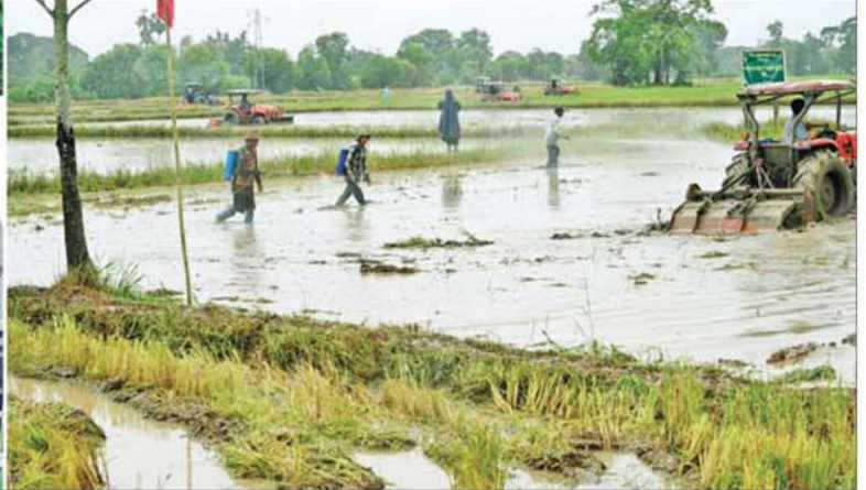
နိုင်ငံတော်သမ္မတ ဦးမင်းအောင်လှိုင် တောင်ငူမြို့နယ် နှစ်ဆောင်မြိုင်ကျေးရွာအနီး၌ စိုက်ပျိုးရေးဦးစီးဌာနမှ တန်ဖိုးနည်းသဘာဝပိုးသတ်ဆေးနှင့် အာဟာရဖျော်ရည်များ ထည့်သွင်း၍ မြေပြုပြင်ခြင်းလုပ်ငန်း ဆောင်ရွက်နေမှုကို ကြည့်ရှုစစ်ဆေးစဉ်။