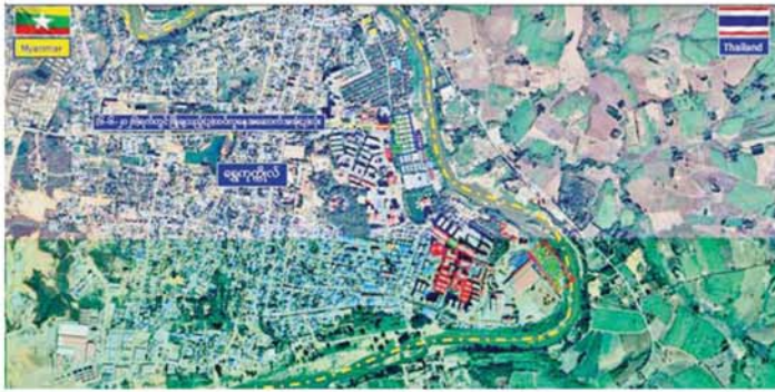
ကရင်ပြည်နယ် မြဝတီမြို့နယ် ရွှေကုက္ကိုလ်နယ်မြေရှိ အွန်လိုင်းလိမ်လည်လောင်းကစားမှုများ လုပ်ကိုင်ခဲ့သည့် တရားမဝင်အဆောက်အအုံများအား ဖောက်ခွဲဖျက်ဆီးမှု။