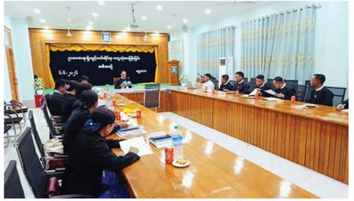
အညီ ဥပဒေအရာရှိများ ကျင့်ဝတ်ဆိုင်ရာတွေ့ဆုံမေးမြန်းခြင်းအစီအစဉ်များ ဆက်လက်ဆောင်ရွက်သွားမည်ဖြစ်ကြောင်း သိရသည်။

တိုင်းဒေသကြီးအတွင်းရှိ ခရိုင်နှင့် မြို့နယ်ဥပဒေရုံးများကလည်း ဆောင်ရွက်ရမည့်အစီအစဉ်များနှင့်