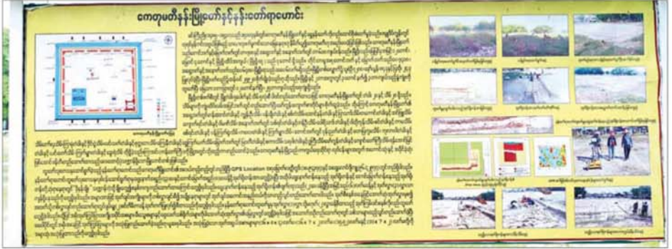
ကေတုမတီနန်းမြို့တော်နှင့် နန်းတော်ရာဟောင်း ပြန်လည်ဖော်ထုတ်ထိန်းသိမ်းမှု မှတ်တမ်းများ။

ရရှိအောင် စိုက်ပျိုးဆောင်ရွက်နိုင် မှု၊ မိုးသီးနှံများစိုက်ပျိုးလျက်ရှိမှု၊ ရေကြီးရေလျှံမှုများ မဖြစ်ပေါ်စေ ရေး ကြိုတင်ဆောင်ရွက်လျက်ရှိမှု၊ တိုင်းဒေသကြီးအတွင်း ဒေသ ဝမ်းစာဖူလုံမှု၊ ရေဆင်းပေါ်ဆန်း စပါးစိုက်ပျိုးရန် လျာထားဆောင် ရွက်လျက်ရှိမှု၊ ဆီထွက်သီးနှံများ ပိုမိုစိုက်ပျိုးနိုင်မှုနှင့် ဆီဖူလုံမှုများ တိုးတက်လာမှု ရိုဘက်စတာ ကော်ဖီများ စိုက်ပျိုးနိုင်ရေး ဆောင်ရွက်လျက်ရှိမှု၊ ဟင်းသီး ဟင်းရွက်များနှင့် တစ်အုပ်တစ်မ စိုက်ခင်းများ စတင်အကောင် အထည်ဖော် ဆောင်ရွက်လျက်ရှိမှု၊ သဘာဝမြေဩဇာများ ထုတ်လုပ် လျက်ရှိမှု၊ စာမျက်နှာ ၆ သို့