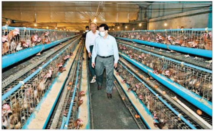
နိုင်ငံတော်သမ္မတ ဦးမင်းအောင်လှိုင် ကေတုမတီမြို့သစ် ကျွန်းကျွန်းကျေးရွာရှိ ရွှေဝါကြက်မွေးမြူရေး မြဲတွင် ကြည့်ရှုစစ်ဆေးစဉ်။

များအသုံးပြု၍ ဧကကွက်များ ဖော်ဆောင်ပြီး ဆောင်ရွက်မည် ဆိုပါက များစွာအထောက်အကူပြု မည်ဖြစ်သဖြင့် တောင်သူများအား စည်းရုံးဆောင်ရွက်သွားရန် လို ကြောင်း၊ ကော်ဖီစိုက်ပျိုးရာတွင် ကော်ဖီသည် တိုင်းပြည်အတွက် ထုတ်ကုန်အဖြစ် ရည်ရွယ်ဆောင် ရွက်နေခြင်းဖြစ်သဖြင့် ပိုမိုစိုက်ပျိုး ထုတ်လုပ်နိုင်မည်ဆိုပါက များစွာ အကျိုး ဖြစ်ထွန်းစေမည်ဖြစ် ကြောင်း၊ ပြည့်စွက်မှာကြားသည်။ ဆက်လက်၍ ဆောက်လုပ်ရေး ဝန်ကြီးဌာန ပြည်ထောင်စုဝန်ကြီး