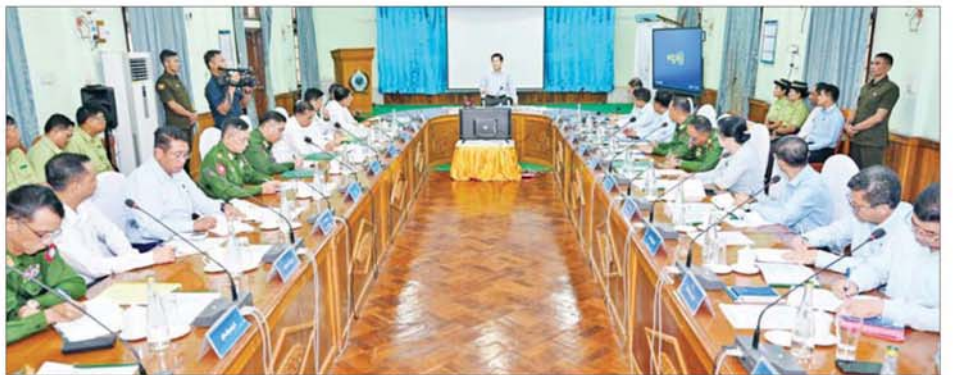
နိုင်ငံတော်သမ္မတ ဦးမင်းအောင်လှိုင် တောင်ငူခရိုင်အတွင်းရှိ ခရိုင်၊ မြို့နယ်အဆင့် ဌာနဆိုင်ရာတာဝန်ရှိသူများအား တွေ့ဆုံဆွေးနွေး မှာကြားစဉ်။

ဒေသဖွံ့ဖြိုးတိုးတက်ရေးဆိုင် ရာများ ဆွေးနွေးပြောကြား ယင်းနောက် နိုင်ငံတော်သမ္မတ က တောင်ငူဒေသဖွံ့ဖြိုးတိုးတက် ရေးအတွက် ဆွေးနွေးပြောကြား ရာတွင် မိမိအနေဖြင့် တောင်ငူ ခရိုင်ကို အထူးဖွံ့ဖြိုးရေးဇုန်အဖြစ် အကောင်အထည်ဖော်ဆောင်ရွက် လျက်ရှိပြီး နေပြည်တော်နှင့် ဆက်စပ်၍ ဒေသဖွံ့ဖြိုးရေးဆိုင်ရာ များကို ဖော်ဆောင်ပေးလျက်ရှိ ကြောင်း၊ တောင်ငူဒေသကို ဖွံ့ဖြိုး တိုးတက်အောင် ဆောင်ရွက်ခြင်း အားဖြင့် ဒေသနှင့်ဆက်စပ်လျက်