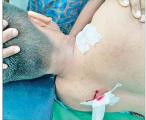
ကျောင်းသူများနှင့် ဒေသခံပြည်သူများအား အဆိုပါကျောင်း၏ အရှေ့တောင်ဘက် ဗီတာ ၂၀ ခန့်အကွာရှိ ရထားသံလမ်း လမ်းဆုံမှနေ၍ လက်နက်ငယ်များဖြင့် အကြောင်းမဲ့လူရောက် ပစ်ခတ်တိုက်ခိုက်ခဲ့ ကြောင်း သိရသည်။

PDF အမည်ခံ အကြမ်းဖက်သမားများအနေဖြင့် ယခုကဲ့သို့ စစ်ရေး ပစ်မှတ်နှင့် သက်ဆိုင်ခြင်းမရှိသည့်အပြင် နိုင်ငံတော်၏ လူ့စွမ်းအား အရင်းအမြစ်များမွေးထုတ်ပေးရာ စာသင်ကျောင်းများကို တိုက်ခိုက် ဖျက်ဆီးပြီး ပညာရေးဝန်ထမ်းများနှင့် ဆရာ ဆရာမများအပေါ် အကြမ်းဖက်လုပ်ရပ်များကို အသိတရားကင်းမဲ့စွာ လုပ်ဆောင်ခဲ့ခြင်း အတွက် ဒေသခံပြည်သူများအနေဖြင့် ပြင်းပြင်းထန်ထန် ကန့်ကွက် ရှုတ်ချလျက်ရှိကြောင်းနှင့် အကြမ်းဖက်မှုကျူးလွန်သူများအား အမြန်ဆုံး ဖမ်းဆီးဖော်ထုတ်နိုင်ရေးအတွက် လုံခြုံရေးတပ်ဖွဲ့ဝင်များက ပြည်သူများ နှင့် ပူးပေါင်း၍ စုံစမ်းဖော်ထုတ်လျက်ရှိကြောင်း သိရသည်။ သတင်းစဉ်