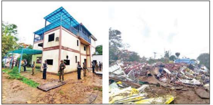
ကရင်ပြည်နယ် မြဝတီမြို့နယ် ရွှေကုက္ကိုလ်နယ်မြေရှိ အွန်လိုင်းလိမ်လည်လောင်းကစားမှုများ လုပ်ကိုင်ခဲ့သည့် တရားမဝင်အဆောက်အအုံများ မဖြိုဖျက်မီ(ဝဲပုံ)နှင့် ဖြိုဖျက်ပြီး(ယာပုံ)ကို တွေ့ရစဉ်။