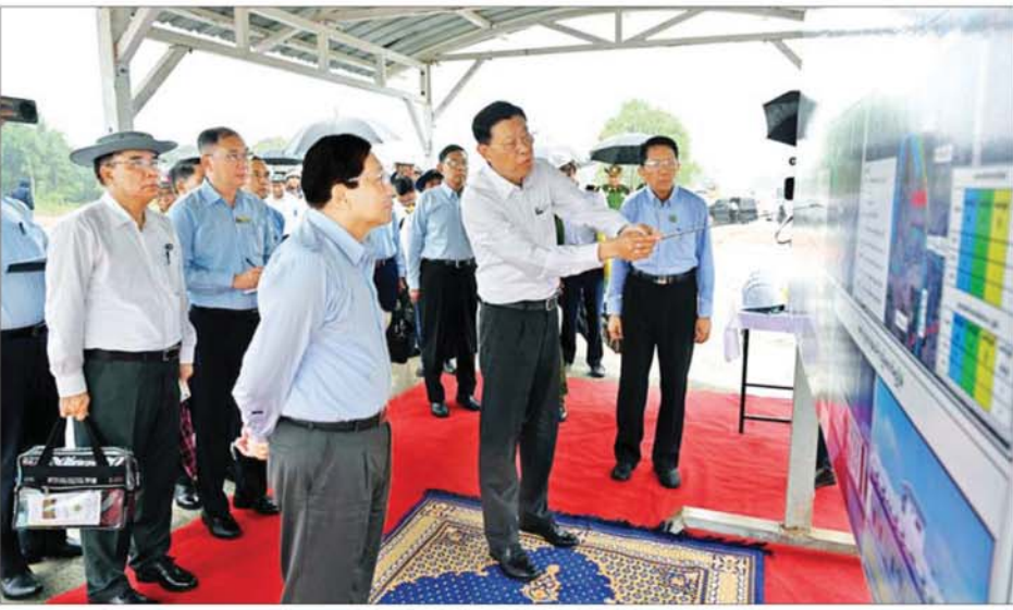
နိုင်ငံတော်သမ္မတ ဦးမင်းအောင်လှိုင်အား တောင်ငူမြို့ရှောင်ရထားလမ်းနှင့် တောင်ငူဘူတာအသစ် ဆောက်လုပ်မည့်နေရာနှင့်ပတ်သက်၍ ပြည်ထောင်စုဝန်ကြီး ဦးမြထွန်းဦးက ရှင်းလင်းတင်ပြစဉ်။

နေပြည်တော် ၅ နံနက် ၆ နာရီခန့်တွင် နိုင်ငံတော်သမ္မတ ဦးမင်းအောင်လှိုင်သည် ယနေ့ နံနက်ပိုင်းတွင် စနေ၊ ဒေါက်ကြွကြွလှ တပ်မတော်ကာကွယ်ရေး ဦးစီးချုပ် ဗိုလ်ချုပ်ကြီး ရဲဝင်းဦးနှင့် စနေ၊ ပြည်ထောင်စု ဝန်ကြီးများဖြစ်ကြသည့် ဦးခင်မောင်ရီ၊ ဦးမြထွန်းဦး၊ ဦးမင်းနောင်၊ ဦးမျိုးစေတီသိမ်း၊ ဦးမျိုးသန့်၊ ကာကွယ်ရေးဦးစီးချုပ် ရုံးမှ အဆင့်မြင့်တပ်မတော်အရာရှိကြီးများ၊ ဒုတိယဝန်ကြီးများနှင့် တာဝန်ရှိသူများ လိုက်ပါ၍ တောင်ငူ ဒေသဖွံ့ဖြိုးတိုးတက်ရေး ဆိုင်ရာများကို သွားရောက်ကြည့်ရှု စစ်ဆေးပြီး လိုအပ်သည်များ လမ်းညွှန်မှာကြားသည်။ နေပြည်တော်-တောင်ငူ မီးရထားလမ်းပိုင်း အဆင့်မြင့်တင်ထားရှိမှု ဦးစွာ နိုင်ငံတော်သမ္မတနှင့် အဖွဲ့ဝင်များသည် နေပြည်တော် ပျဉ်းမနားဘူတာမှ RBE အထူးရထားတွင်ဖြင့် လိုက်ပါစီးနင်း၍ နေပြည်တော်-တောင်ငူ မီးရထားလမ်းပိုင်း အဆင့်မြင့်တင်ထားရှိမှု၊ မီးရထားလမ်းပိုင်း တစ်လျှောက် သန့်ရှင်းသာယာ လှပရေးနှင့် စီမံခန့်ခွဲခြင်း၊ ဆောင်ရွက်ထားရှိမှု၊ စိုက်ပျိုးရေးလုပ်ငန်း ဆောင်ရွက်ထားရှိမှု တူတာအဝင်၊ အထွက်နေရာများ စနစ်တကျရှိ စေရေး ဆောင်ရွက်ထားရှိမှုတို့ကို ကြည့်ရှုစစ်ဆေးခဲ့ပြီး တာဝန်ရှိသူများ၏ တင်ပြချက်များအပေါ် မီးရထားပို့ဆောင်ရေး လုပ်ငန်း ဥပဒေနှင့်အညီ စနစ်တကျ ထိန်းသိမ်း ဆောင်ရွက်သွားရန် လိုကြောင်း၊ အသုံးပြုခြင်းမရှိသည့် မီးရထားသံလမ်းများအား ပြန်လည်ထိန်းသိမ်းဆောင်ရွက် သွားရန်လိုကြောင်း၊ ရထား သွားလာရေးစနစ်တွင် လမ်းများသည် အဓိကကျသည့်အတွက်