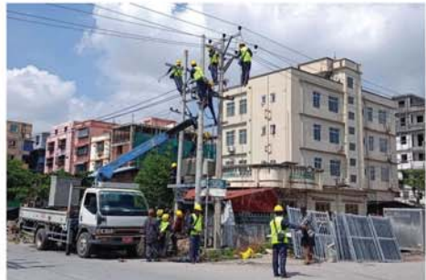
ဝင်များ၊ ချမ်းမြသာစည် မြို့နယ် လျှပ်စစ် မန်နေဂျာမှူး တာဝန်ရှိ သူများနှင့် ပေါင်းစပ်ညှိနှိုင်း၍ ဆောင်ရွက်ခဲ့ကြောင်း သိရသည်။ အလင်းသစ် (ချမ်းစည် မြန်/ဆက်)