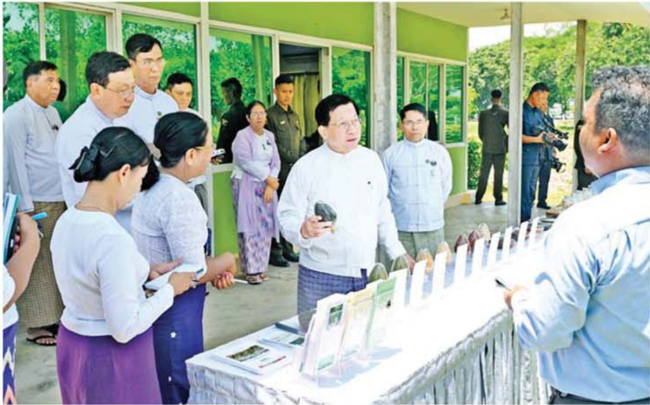
နိုင်ငံတော်သမ္မတ ဦးမင်းအောင်လှိုင် စိုက်ပျိုးရေး၊ မွေးမြူရေးနှင့် ဆည်မြောင်းဝန်ကြီးဌာန စိုက်ပျိုးရေးသုတေသနဦးစီးဌာန ပဲမျိုးစုံသီးနှံသုတေသနဌာနစုမှ သုတေသနပြုထုတ်လုပ်ထားသည့် သီးနှံမျိုးစေ့များကို ကြည့်ရှုစစ်ဆေးစဉ်။

နေပြည်တော် ၅ နိုဝင်ဘာ ၂၀၂၆ - ပြည်ထောင်စုသမ္မတ မြန်မာ နိုင်ငံတော် နိုင်ငံတော်သမ္မတ ဦးမင်းအောင်လှိုင်သည် ယနေ့ နံနက်ပိုင်းတွင် တာဝန်ရှိသူများ လိုက်ပါ၍ နေပြည်တော် ရေဆင်း တက္ကသိုလ်များနယ်မြေရှိ စိုက်ပျိုး ရေး၊ မွေးမြူရေးနှင့် ဆည်မြောင်း ဝန်ကြီးဌာန စိုက်ပျိုးရေးသုတေ သနဦးစီးဌာန ပဲမျိုးစုံသီးနှံသုတေ သနဌာနစုမှ သုတေသနပြု ထုတ်လုပ်ထားသည့် သီးနှံမျိုးစေ့ များကို သွားရောက်ကြည့်ရှု စစ်ဆေးသည်။