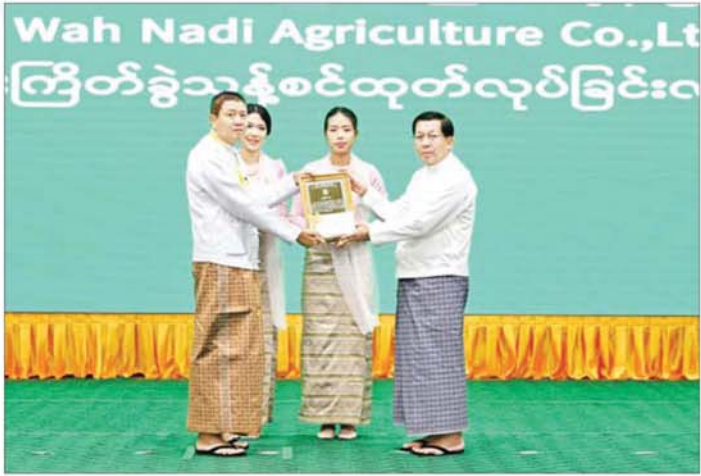
နိုင်ငံတော်သမ္မတ ဦးမင်းအောင်လှိုင် အမျိုးသားအဆင့် ပတ်ဝန်းကျင်စီမံခန့်ခွဲမှု ကောင်းမွန်သော စက်ရုံ/ လုပ်ငန်းဆိုင်ရာသည့် ဧရာဝတီတိုင်းဒေသကြီး ညောင်တုန်းမြို့နယ်မှ Shwe Wah Nadi Agriculture Co.Ltd ၏ ဆန်စပါးကြိတ်ခွဲသန့်စင်ထုတ်လုပ်ခြင်းလုပ်ငန်းအား ဆုပေးအပ်ချီးမြှင့်စဉ်။