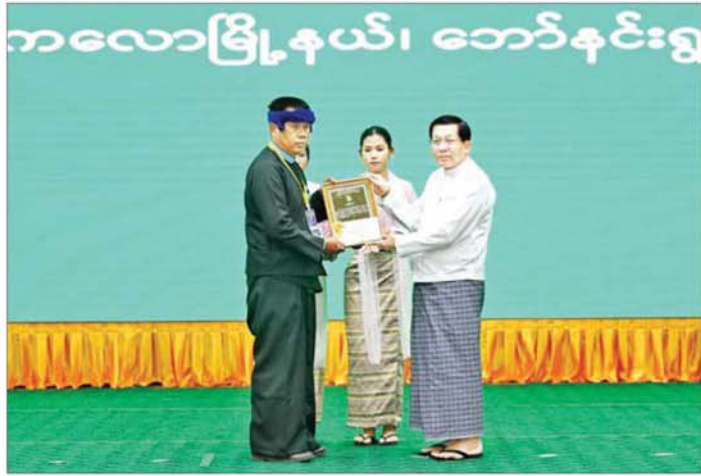
နိုင်ငံတော်သမ္မတ ဦးမင်းအောင်လှိုင် အမျိုးသားအဆင့် ပတ်ဝန်းကျင်စီမံခန့်ခွဲမှု ကောင်းမွန်သော ကျေးရွာဆုရရှိသည့် ရှမ်းပြည်နယ် ကလောမြို့နယ် ဘော်နင်းရွာသစ်ကျေးရွာအတွက် ဆုပေးအပ်ချီးမြှင့် စဉ်။

ဘင်းမိစတက်အထိမ်းအမှတ်နေ့သည် မိမိတို့ဒေသအတွင်းရှိ ကြီးမားသော အလားအလာများနှင့် ထိုအလားအလာများကို အသုံးချ ရာတွင် ညီညွတ်မှု၏ အရေးပါပုံကို သတိပြုမြင်စေရန် နှိုးဆော်ပေးသည့် အချိန်အခါသယံပင်ဖြစ်ပါသည်။ မိမိတို့အားလုံးပူးပေါင်း၍ လက်ရှိ မျိုးဆက်နှင့် နောင်မျိုးဆက်သစ်များအတွက် ပိုမိုကြံ့ခိုင်နိုင်ငံပြီး တက်ကြွကာ ပြည်သူ့ကိုဗဟိုပြုသော ဘင်းမိစတက်အသိုက်အဝန်း တစ်ခုကို တည်ဆောက်သွားကြရန် တိုက်တွန်းအပ်ပါသည်။