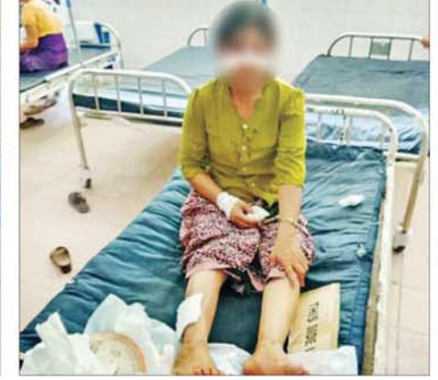
စစ်ကိုင်းမြို့ လူဝင်မှုကြီးကြပ်ရေးမှူးရုံးတွင် PDF အမည်ခံအကြမ်းဖက်သမားများ၏ ချိန်ကိုက်ပုံးဖောက်ခွဲမှုကြောင့် ထိခိုက်ဒဏ်ရာရရှိသူများကို တွေ့မြင်ရစဉ်။

ပန်းမန်သစ်ပင် လေသန့်စင်၍ ဥယျာဉ်တောတန်း စိတ်ရွှင်လန်း၏။