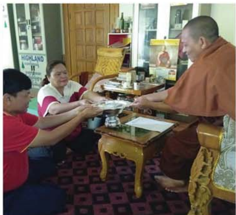
လိုတရပြည်လုံးချမ်းသာ အောင်တော်မူ စေတီတော်ကြီးအတွက် အလှူငွေ လှူဒါန်း ဖြင့်ဦးလွင် ဇွန် ၅ ရှာ၊ သာသနာရာမရွှေမင်းဝံရိပ် ပြင်ဦးလွင်မြို့၊ ပွဲကောက် သာကြီးအတွင်း၌ ဉာဏ်တော်