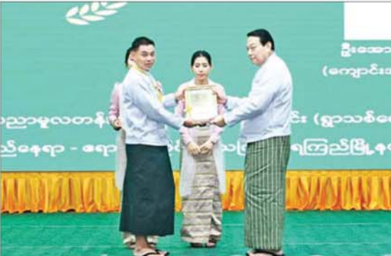
ပြည်သူ့လွှတ်တော် ဥက္ကဋ္ဌ ဦးခင်ရီ အမျိုးသားအဆင့် သန့်ရှင်းစိုစွတ်စိမ်းလန်း စိုပြည်သောကျောင်း (မူလတန်းအဆင့်) ပထမဆုရရှိသည့် ကျောင်းအား ဆုပေးအပ် ချီးမြှင့်စဉ်။

ဖွဲ့စည်း တည်ထောင်ပြီးဖြစ်သည့် သစ်တောနယ်မြေ၊ သစ်တောနယ်မြေ ပြင်ပနေရာများနှင့် ကုန်းတွင်းဒေသများ တွင် ရာသီဥတုပြောင်းလဲမှုဒဏ်ကို ကာကွယ်နိုင်ရေးကြိုးစားလျှော့ချမှုမြှင့်တင် စားမှုများမှ ကာကွယ်နိုင်ရန်နှင့် သဘာဝ ဘေးအန္တရာယ်များကို ကြိုတင်ကာကွယ် နိုင်ရေးအတွက် သစ်တောများ ပြန်လည် တည်ထောင်ရေး လုပ်ငန်းများကို အရှိန်အဟုန်မြှင့် ဆောင်ရွက်လျက် ရှိကြောင်း၊ ၂၀၂၃ ခုနှစ်မှ ၂၀၂၅ ခုနှစ်အထိ နိုင်ငံပိုင်စိုက်ခင်း၊ စီးပွားရေးစိုက်ခင်း၊ စက်မှုကုန်ကြမ်းစိုက်ခင်း၊ ရေဝေရေလဲ စိုက်ခင်း၊ ဒီရေတောစိုက်ခင်း၊ ကျေးရွာ ထင်းစိုက်ခင်း စသည် စိုက်ခင်းဧကပေါင်း ၁၆၀၀၀၀ ကျော်၊ အပင်ပေါင်း ၁၂ သန်း ကျော်ကို စိုက်ပျိုးခဲ့ပါကြောင်း။ ယခုနှစ် အထိမ်းရောင်စီးပွားရေးလုပ်ငန်းများ ဖွံ့ဖြိုး