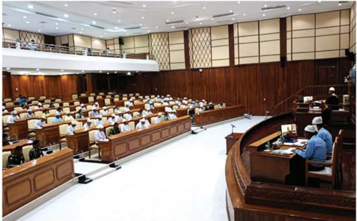
မန္တလေးတိုင်းဒေသကြီးလွှတ်တော် ဒုတိယပုံမှန်အစည်းအဝေး (တတိယနေ့)ကို နံနက် ၁၁ နာရီခွဲတွင် ရပ်နားကြောင်းနှင့် အစည်းအဝေး (စတုတ္ထနေ့)ကို ဇွန် ၈ ရက်(တနင်္လာနေ့) နံနက် ၁၀ နာရီတွင် ကျင်းပသွားမည်ဖြစ်ကြောင်း သိရသည်။

ထို့နောက် “စစ်ဘေးကြောင့် အပြစ်မပြုသူများ ထိခိုက်သေဆုံး၊ ပျက်စီးဆုံးရှုံးမှုများအပေါ် ပြန်လည်ပြုမှုပျိုးထောင်နိုင်ရေးအတွက် ဒေသန္တရစီမံကိန်းတွင်ထည့်သွင်းရေးဆွဲ အကောင်အထည်ဖော် ဆောင်ရွက်နိုင်ရေး” အဆိုကို လွှတ်တော်သို့တင်သွင်းခြင်းနှင့် လွှတ်တော်ကိုယ်စားလှယ်တစ်ဦးက ထောက်ခံခြင်း၊ ၎င်းအဆိုကို ဆွေးနွေးရန် သင့်၊ မသင့် လွှတ်တော်၏ သဘောထားရယူခြင်းတို့ဆောင်ရွက်ရာ လွှတ်တော်က သဘောတူသည့်အတွက် အဆိုနှင့်ပတ်သက်၍ ဆွေးနွေးလိုသည့် လွှတ်တော်ကိုယ်စားလှယ်များရှိပါက အမည်စာရင်းပေးသွင်းနိုင်ကြောင်းနှင့် ဆွေးနွေးမည့်နေ့ရက်ကို ကြေညာခဲ့သည်။