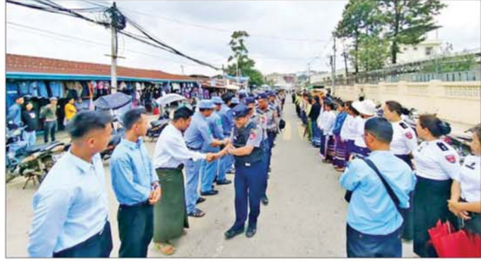
ဟားခါးမြို့သို့ ဌာနဆိုင်ရာတာဝန်ရှိသူများ ရောက်ရှိလာစဉ်။