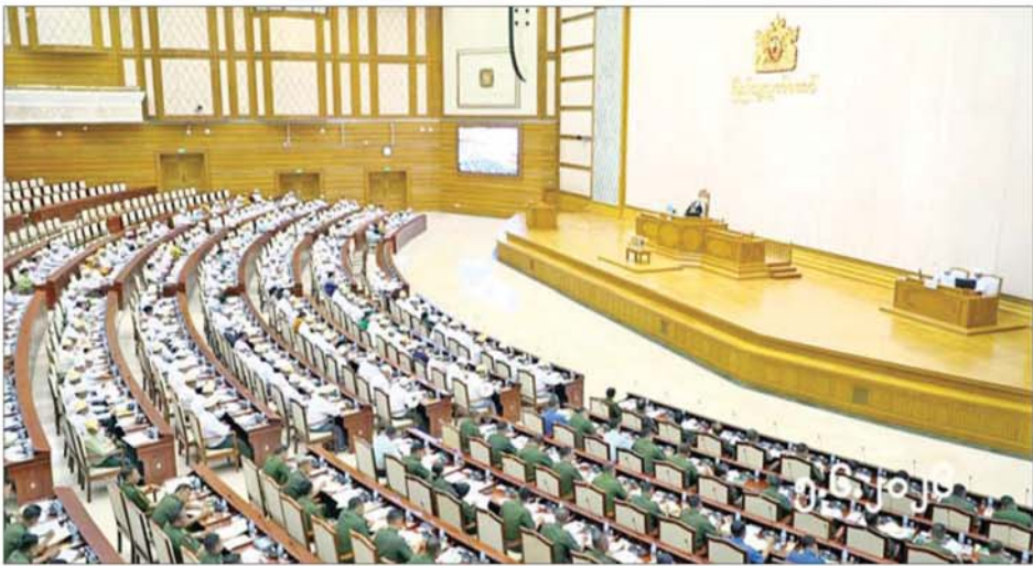
တတိယအကြိမ် ပြည်သူ့လွှတ်တော် ဒုတိယပုံမှန်အစည်းအဝေး တတိယနေ့ ကျင်းပစဉ်။

သရက်ခရိုင်ရုံး အနေဖြင့် အောင်လံခရိုင်သို့ နယ်လှည့် ကွင်းဆင်းသည့်အခါ မော်တော် ယာဉ်နှင့် သက်ဆိုင်သည့် အာမခံ လုပ်ငန်းကို တစ်ပါတည်း One Stop Service ပုံစံဖြင့် ဆောင်ရွက် ပေးလျက် ရှိပါကြောင်း၊ လတ်တလော ကာလတွင် အောင်လံခရိုင်၊ သရက်ခရိုင်နှင့် တွဲဖက်၍ One Stop Service ပုံစံဖြင့် ဆောင်ရွက်ပေးနေပြီး ခရိုင်ရုံးအသစ်များ ဖွင့်လှစ်နိုင်ရန် ကန့်သတ်ချက်များရှိနေခြင်းတို့ ကြောင့် အောင်လံခရိုင်အတွက် ခရိုင်ရုံးဖွင့်လှစ်ရန် အစီအစဉ် မရှိသေးပါကြောင်း ပြန်လည် ဖြေကြားသည်။ မာန်အောင် မဲဆန္ဒနယ်မှ ဦးကျော်သန်း၏ မာန်အောင် မြို့နယ် စနစ်လေယာဉ်ကွင်း အား တိုးချဲ့ဆောက်လုပ်ပေးရန် အစီအစဉ် ရှိ၊ မရှိနှင့် တိုးချဲ့ ဆောက်လုပ်ပေးမည် ဆိုပါက မည်သည့် ဘဏ္ဍာနှစ်တွင် တည်ဆောက်ပေးမည်ကို သိရှိလို ခြင်း မေးခွန်းနှင့် စပ်လျဉ်း၍ ဒုတိယဝန်ကြီး ဦးထွန်းလှက ပုံဆောင်ရေဝန်ကြီးဌာန အနေဖြင့် မာန်အောင် လေယာဉ်ပြေးလမ်း တွင် ATR 72-600 အမျိုးအစား လေယာဉ်များ ဆင်း၊ တက် အသုံး ပြုနိုင်ရေးအတွက် လက်ရှိ လေယာဉ်ပြေးလမ်း ၄၅၀၀ x ၁၀၀ ပေအား ဆောင်ရွက်ရမည်ဖြစ်ပြီး ပထမအဆင့် အနေဖြင့် တောင်ဘက်သို့ ၁၅၀၀ x ၁၀၀ ပေ လေယာဉ်ပြေးလမ်း တိုးချဲ့ခြင်းနှင့် ထပ်ပို့လွှာတင်ခြင်းလုပ်ငန်းကို ဆောင်ရွက်နိုင်ရန် ၂၀၂၅-၂၀၂၆ ဘဏ္ဍာနှစ်တွင် ရန်ပုံငွေ တင်ပြ တောင်းခံသည့် မည်သည့် နှစ်မှ ငွေရရှိပါက အကောင်အထည်ဖော် ဆောင်ရွက်သွားမည် ဖြစ်ကြောင်း ပြန်လည်ဖြေကြားသည်။ မိုးနဲမဲဆန္ဒနယ်မှ မိုးခင်စိတ် မဲဆန္ဒနယ်မှ ဦးခိုင်ဝန်းဆစ်၏ မိုးခင်စိတ်မြို့နယ် မိုးခင်စိတ်ကျေးရွာအုပ်စု တပ်မိုင်