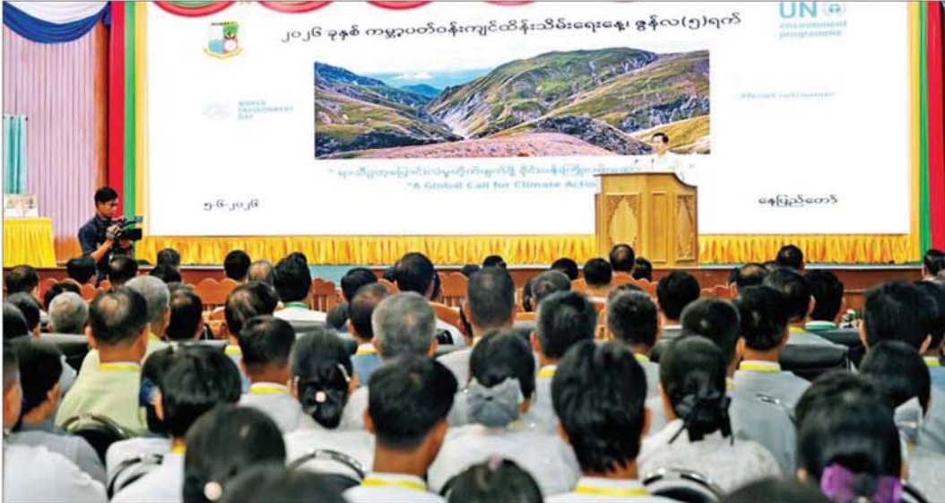
နိုင်ငံတော်သမ္မတ ဦးမင်းအောင်လှိုင် ၂၀၂၆ ခုနှစ် ကမ္ဘာ့ပတ်ဝန်းကျင်ထိန်းသိမ်းရေးနေ့ အထိမ်းအမှတ်အခမ်းအနားတွင် အမှာစကားပြောကြားစဉ်။

၂၀၂၆ ခုနှစ် ကမ္ဘာ့ပတ်ဝန်းကျင်ထိန်းသိမ်းရေးနေ့ အထိမ်းအမှတ်အခမ်းအနား ကို ယနေ့နံနက်ပိုင်းတွင် နေပြည်တော်ရှိ ရေဆင်း သစ်တောနှင့် ပတ်ဝန်းကျင် ဆိုင်ရာတက္ကသိုလ်၌ ကျင်းပရာ ပြည်ထောင်စုသမ္မတမြန်မာနိုင်ငံတော် နိုင်ငံတော်သမ္မတ ဦးမင်းအောင်လှိုင် တက်ရောက်အမှာစကားပြောကြားသည်။ စာမျက်နှာ ၃ သို့ ၂