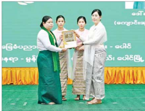
ဒုတိယသမ္မတ ဒေါ်နန်းနီနီအေး အမျိုးသားအဆင့်သန့်ရှင်း၍ စိမ်းလန်းစိုပြည် သောကျောင်း(အထက်တန်းနှင့် အလယ်တန်းအဆင့်) ဒုတိယရရှိသည့်ကျောင်းအား ဆုပေးအပ်ချီးမြှင့်စဉ်။

အခမ်းအနားသို့ ဒုတိယသမ္မတ ဒေါ်နန်းနီနီအေး၊ ပြည်သူ့လွှတ်တော်ဥက္ကဋ္ဌ ဦးခင်ရီ၊ အမျိုးသားလွှတ်တော်ဥက္ကဋ္ဌ ဦးအောင်လင်းဒွေး၊ တပ်မတော်ကာကွယ် ရေးဦးစီးချုပ် ဗိုလ်ချုပ်ကြီး ရဲဝင်းဦး၊ ပြည်ထောင်စုအဆင့် ပုဂ္ဂိုလ်များနှင့် ပြည်ထောင်စုဝန်ကြီးများ၊ နေပြည်တော် ကောင်စီဥက္ကဋ္ဌ၊ ကာကွယ်ရေးဦးစီးချုပ် ရုံးမှ အဆင့်မြင့်တပ်မတော်အရာရှိကြီး များ၊ ပတ်ဝန်းကျင်ထိန်းသိမ်းရေးကော်မတီ အဖွဲ့ဝင်များ၊ ဒုတိယဝန်ကြီးများ၊ ဌာန ဆိုင်ရာတာဝန်ရှိသူများ၊ ဖိတ်ကြားထား သူများ၊ ဆုရရှိကြသူများ၊ သစ်တောနှင့် ပတ်ဝန်းကျင်ဆိုင်ရာ တက္ကသိုလ်နှင့် အခြေခံပညာ အထက်တန်းကျောင်းမှ ကျောင်းသား ကျောင်းသူများနှင့် တာဝန်ရှိသူများ တက်ရောက်ကြသည်။