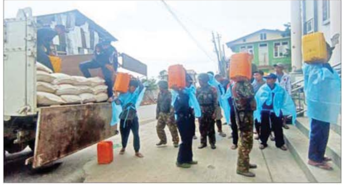
ဖလမ်းမြို့သို့ စားသောက်ကုန်ပစ္စည်းများ ရောက်ရှိမှုကို တွေ့ရစဉ်။

အဆိုပါ ထောက်ပံ့ပစ္စည်းများသည် ဌာနဆိုင်ရာဝန်ထမ်းများနှင့် ဒေသခံတိုင်းရင်းသားပြည်သူများ၏ စားဝတ်နေရေး၊ ကျန်းမာရေး၊ ကျောင်းသားလူငယ်များ၏ ပညာရေး၊ မြို့ရွာများပြန်လည်ထူထောင်ရေးနှင့် အခြားသော လိုအပ်ချက်များအတွက် အထောက်အကူဖြစ်မည်ဖြစ်သဖြင့် ဒေသခံတိုင်းရင်းသားပြည်သူများက ဝမ်းမြောက်ကျေးဇူးတင်လျက် ရှိကြောင်းနှင့် နိုင်ငံတော်အစိုးရအနေဖြင့် ဒေသ၏ လိုအပ်ချက်အပေါ်မူတည်၍ ထပ်မံဖြည့်ဆည်းပေးနိုင်ရေးအတွက် စဉ်ဆက်မပြတ် ဆက်လက်ဆောင်ရွက်ပေးသွားမည်ဖြစ်ကြောင်း သိရသည်။