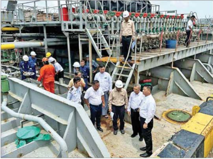
သီလဝါရီ Terminal များသို့ ပြည်ပမှစက်သုံးဆီများ တင်သွင်းရောက်ရှိမှု၊ သို့လှောင်ထားရှိမှု၊ ဖြန့်ဖြူးနေမှုတို့ကို တာဝန်ရှိသူများ စစ်ဆေးစဉ်။

နေပြည်တော် ဇွန် ၅ လျှပ်စစ်နှင့် စွမ်းအင်ဝန်ကြီးဌာန ရေနံထွက်ပစ္စည်းကြီးကြပ် စစ်ဆေးရေးဦးစီးဌာနမှ ညွှန်ကြားရေးမှူးချုပ်သည် ယမန်နေ့ နံနက် ပိုင်းတွင် ရန်ကုန်မြို့၊ သီလဝါရီ Terminal များသို့ စက်သုံးဆီတင် သင်္ဘောများ ရောက်ရှိဆီဆီချယူနေမှု အခြေအနေများ၊ တင်သွင်းခွင့်ပြု သည့် ဆီပမာဏတန်ချိန်နှင့် ဆီတင်သင်္ဘောတွင် တင်ဆောင် ရောက်ရှိလာသည့် ဆီပမာဏ တန်ချိန်များကိုညီမှု ရှိ မရှိ၊ တင်သွင်းလာသည့် ဆီအရည် အသွေးကိုညီမှု ရှိ မရှိ စစ်ဆေး နိုင်ရေး ဆီနမူနာ ရယူနေမှုများ၊ Terminal များတွင် စက်သုံးဆီ သို့လှောင်ထားရှိမှု အခြေအနေများ နှင့် စက်သုံးဆီတင်ယာဉ်များဖြင့် စာမျက်နှာ ၉ သို့ ✪