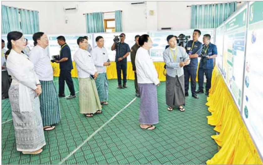
နိုင်ငံတော်သမ္မတ ဦးမင်းအောင်လှိုင် ၂၀၂၆ ခုနှစ် ကမ္ဘာ့ပတ်ဝန်းကျင်ထိန်းသိမ်းရေးနေ့ အထိမ်းအမှတ်ပြခန်းများကို လှည့်လည်ကြည့်ရှုစဉ်။

ရာသီဥတုပြောင်းလဲမှုသည် ကမ္ဘာ တစ်ဝန်း ရင်ဆိုင်ကြုံတွေ့နေရသည့်