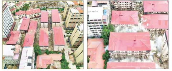
ကရင်ပြည်နယ်မြဝတီမြို့နယ် ရွှေကုက္ကိုလ်နယ်မြေရှိ အွန်လိုင်းလိမ်လည်လောင်းကစားမှု လုပ်ကိုင်ခဲ့သည့် တရားမဝင် ခုနစ်ထပ်လူနေအဆောက်အအုံများကို ယမ်းဖြင့် ဖောက်ခွဲပျက်ဆီးမှု။