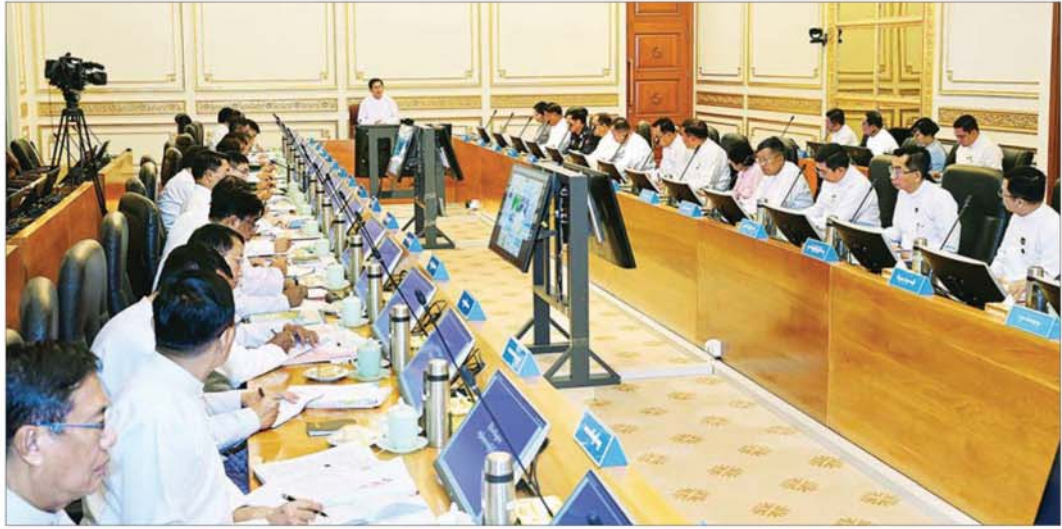
နိုင်ငံတော်သမ္မတ ဦးမင်းအောင်လှိုင် ပြည်ထောင်စုအစိုးရအဖွဲ့အစည်းအဝေးတွင် အမှာစကားပြောကြားစဉ်။

နေပြည်တော် ၉ ဇူလိုင် ၂၀၂၆ ပြည်ထောင်စုသမ္မတ မြန်မာနိုင်ငံတော် ပြည်ထောင်စုအစိုးရအဖွဲ့အစည်းအဝေးကို ယနေ့ မွန်းလွဲပိုင်းတွင် နေပြည်တော်ရှိ နိုင်ငံတော်သမ္မတ ရုံးတော် ပြည်ထောင်စုအစိုးရအဖွဲ့ အစည်းအဝေး ခန်းမ၌ ကျင်းပပြုလုပ်ရာ နိုင်ငံတော်သမ္မတ ဦးမင်းအောင်လှိုင် တက်ရောက်အမှာစကား ပြောကြားသည်။ အစည်းအဝေးသို့ ဒုတိယသမ္မတများဖြစ်ကြသည့် ဦးညိုစောနှင့် ဒေါ်နန်းနီနီအေး၊ ပြည်ထောင်စုဝန်ကြီး များနှင့် နေပြည်တော်ကောင်စီဥက္ကဋ္ဌတို့ တက်ရောက် ကြပြီး တိုင်းဒေသကြီးနှင့် ပြည်နယ်ဝန်ကြီးချုပ်များက Video Conferencing ဖြင့် တက်ရောက်ကြသည်။ တိုင်းပြည်သာယာဝပြောရေးအတွက် အားလုံးပူးပေါင်းအကောင်အထည်ဖော် ဦးစွာနိုင်ငံတော်သမ္မတက အဖွဲ့အမှာစကား ပြောကြားရာတွင် တိုင်းပြည်သာယာဝပြောရေး အတွက် နိုင်ငံတော်အစိုးရမှ တာဝန်ယူဆောင်ရွက် ရခြင်းဖြစ်ပြီး တိုင်းဒေသကြီးနှင့် ပြည်နယ်များ စာမျက်နှာ ၃ သို့ ၉