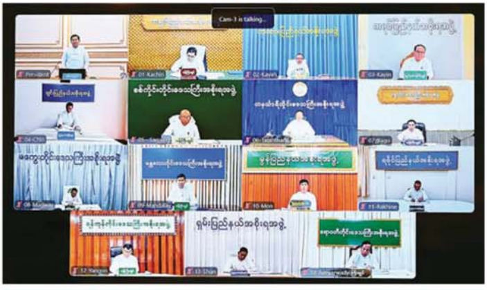
“ မိမိတို့နိုင်ငံသည် စိုက်ပျိုးရေးနှင့်မွေးမြူရေးကို အဓိကထားဆောင်ရွက်သည့်နိုင်ငံဖြစ်သဖြင့် စိုက်ပျိုး ရေးနှင့် မွေးမြူရေးပညာရပ်များကို တတ်ကျွမ်းမည် လူသားအရင်းအမြစ်များစွာလို၊ ထို့ကြောင့် အခြေခံပညာအလယ်တန်းမှစတင်၍ စိုက်ပျိုးမွေးမြူရေး အခြေခံပညာရပ်များကို သင်ကြားပေးလျက်ရှိ၊ တိုင်းဒေသကြီးနှင့်ပြည်နယ်များအလိုက် ပညာတတ်လူသားအရင်းအမြစ်များ ပိုမိုတိုးတက် ကြွယ်ဝလာစေ ရေးအတွက် ကျောင်းနေရာခိုင်နှုန်းများ မြှင့်တင်လာစေရေး ပိုင်းဝန်းကြိုးပမ်း ”

ယခုအခါ မိုးရာသီသို့ ရောက်ရှိပြီဖြစ်သဖြင့် စိုက်ပျိုးရန်သတ်မှတ်ထားသည့် သီးနှံများ ရာနှုန်း ပြည့်စုံစိုက်ပျိုးနိုင်ရေး ကြိုတင်ပြင်ဆင်ဆောင်ရွက်သွား ရန်လိုကြောင်း၊ စိုက်ပျိုးရေးလုပ်ငန်းများတိုးတက် စေရေးအတွက် မျိုး၊ မြေ၊ ရေ၊ နည်း စသည် (၄) ဘက် ကို လိုက်အကူဆောင်ရွက်ရန်လိုကြောင်း၊ မျိုးကောင်း မျိုးသန့်များရရှိမှုသာ အထွက်နှုန်းများ တိုးတက်လာ မည်ဖြစ်သဖြင့် မျိုးကောင်းမျိုးသန့်များရရှိစေရေး ဆောင်ရွက်သွားကြရန်လိုကြောင်း၊ မြေကောင်းမွန် ရေးအတွက်လည်း လိုအပ်သည့် သွင်းအားစုများ