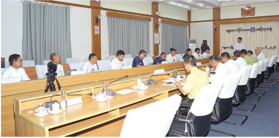
မန္တလေးတိုင်းဒေသကြီးအစိုးရအဖွဲ့ဝင် ဝန်ကြီးများနှင့် တာဝန်ရှိသူများက အကြံပြု မြည့် တင်ပြမှုများအပေါ် အမှာစကား ကြီးအစိုးရအဖွဲ့ဝင် ဝန်ကြီးများနှင့် စွက်ပြောကြားပြီးနောက် တိုင်း စကားပြောကြားခဲ့ကြောင်း သိရ သည်။ (မန္တလေးနေ့စဉ်)

မန္တလေး ဇွန် ၂၃ အစိုးရအဖွဲ့ဝင် ဝန်ကြီးများနှင့် မန္တလေးတိုင်းဒေသကြီး တာဝန်ရှိသူများ၊ ဌာနဆိုင်ရာများ၊ အစိုးရအဖွဲ့ရုံး အစည်းအဝေး အမရပူရမြို့ပြဖွံ့ဖြိုးရေးစီမံကိန်း ခန်းမ၌ ဇွန် ၂၂ ရက် မွန်းလွဲပိုင်း မှ တာဝန်ရှိသူများ တက်ရောက် က အမရပူရခရိုင်၊ အမရပူရ မြို့နယ်တွင် ဆောင်ရွက်လျက် ရှိသည့် အမရပူရမြို့ပြဖွံ့ဖြိုးရေး စီမံကိန်းဆိုင်ရာ လုပ်ငန်းဆောင် ရွက်နေမှုများနှင့် ပတ်သက်၍ အမရပူရမြို့ပြဖွံ့ဖြိုးရေးစီမံကိန်း မှ တာဝန်ရှိသူများက ရှင်းလင်း တင်ပြခြင်းအခမ်းအနား ကျင်းပ ခဲ့သည်။ အခမ်းအနားသို့ မန္တလေး တိုင်းဒေသကြီး ဝန်ကြီးချုပ် ဦးမျိုးအောင်၊ တိုင်းဒေသကြီး