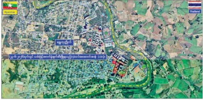
ကရင်ပြည်နယ်မြဝတီမြို့နယ် ရွှေကုက္ကိုလ်နယ်မြေရှိ အွန်လိုင်းလိမ်လည်လောင်းကစားမှုများ လုပ်ကိုင်ခဲ့သည့် တရားမဝင်အဆောက်အအုံများ ဖောက်ခွဲပျက်ဆီးမှု။

ရွှေကုက္ကိုလ်နယ်မြေအတွင်း၌ အွန်လိုင်းလိမ်လည်လောင်းကစားလုပ်ငန်းများ ကျူးလွန်ရာတွင် အသုံးပြုခဲ့သည့် တရားမဝင် အဆောက်အအုံ စုစုပေါင်း ၆၃ လုံးအား စနစ်တကျ ဖြိုချပျက်ဆီးပြီးဖြစ်ကြောင်းနှင့် ဖျက်ဆီးရန် ကျန်ရှိသည့် တရားမဝင်အဆောက်အအုံ ၁၄ လုံးကိုလည်း ဆက်လက်၍ စနစ်တကျ ဖျက်ဆီးသွားမည်ဖြစ်ကြောင်း သိရသည်။ သတင်းစဉ်