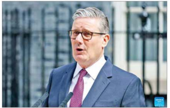
အရှုပ်အထွေးကိစ္စများကြောင့် ဝန်ကြီးချုပ် ရှိခဲ့ကြောင်း သိရသည်။ ကီးယား - ဆင်ယူဘာသာပြန် - စိုးသုရ

အမျိုးသား အမှုဆောင်ကော်မတီအား မိမိက ပန်ကြားမည်ဟု ၎င်းကပြောကြားသည်။ ၂၀၂၄ ခုနှစ် ဇူလိုင်လတွင်ကျင်းပခဲ့သည့် ရွေးကောက်ပွဲတွင် လေဘာပီတီအနိုင်ရရှိခဲ့ပြီးနောက် ကီးယားစတန်မာ ဝန်ကြီးချုပ် ဖြစ်လာခဲ့သည်။ နိုင်ငံအား ပြုပြင်ပြောင်းလဲမှုများ ဆောင်ရွက်မည်ဟု ၎င်းက ကြွေးကြော်ခဲ့သော်လည်း ရွှေ့ပြောင်းအခြေချသူများအရေး စွမ်းအင်အရေးဆိုင်ရာ မူဝါဒအရေးများကိုအကောင်အထည်ဖော် ဆောင်ရွက်ရာတွင် အောင်မြင်မှုမရှိခြင်းအပေါ် ဝေဖန်မှုများ ရှိလာပြီး အမေရိကန်နိုင်ငံဆိုင်ရာ ဗြိတိန်သံအမတ်ဟောင်း ပီတာမင်ဒယ်ဆန်၏