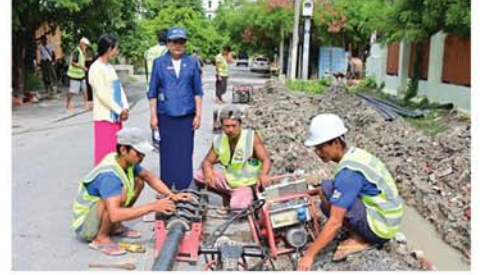
သတင်း-စာမျက်နှာ ၁၃

များ၊ ရေစိတာများ ပြင်ဆင်ထိန်းသိမ်းခြင်းလုပ်ငန်းများလည်း ဆောင်ရွက်လျက်ရှိပြီး ပြည်သူများအနေဖြင့် ရေနှင့်ပတ်သက်၍ အမှန် တကယ်လိုအပ်ချက်ရှိပါက MCDC website တွင် လိပ်စာနှင့် ဖုန်းနံပါတ် အပြည့်အစုံ ဖော်ပြပေးခြင်းဖြင့် အချိန်တိုအတွင်း အမြန်ဆုံးဆောင်ရွက်ပေးသွားမည် ဖြစ်ကြောင်း သိရသည်။ (မန္တလေးနေ့စဉ်-၅) ၀-၀-၀-၀ ၀-၀-၀