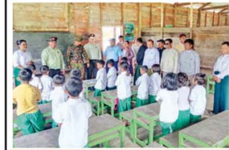
တွန်းခံမြို့နယ်၌ ကျောင်းသား၊ ကျောင်းသူများ ပညာ သင်ကြားနေမှုကို တာဝန်ရှိသူများ ကြည့်ရှုအားပေးစဉ်။