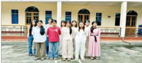
အွန်လိုင်းလိမ်လည်လောင်းကစားမှု ကျူးလွန်ရာတွင် ပါဝင် ပတ်သက်သည့် မြန်မာနိုင်ငံသား အမျိုးသမီး ၁၀ ဦးကို တွေ့ရစဉ်။

အွန်လိုင်းလိမ်လည်လောင်း ကစားမှု ကျူးလွန်ရာတွင် ပါ ဝင်ပတ်သက်သည့် မြန်မာနိုင်ငံ သား အမျိုးသား ၄၇ ဦးကို တွေ့ရစဉ်။