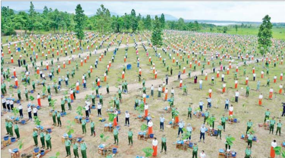
နေပြည်တော် စေယျာသီရိမြို့နယ်၌ မိုးရာသီသစ်ပင်စိုက်ပျိုးပွဲ ကျင်းပစဉ်။

သည်ကို တွေ့မြင်ရမည်ဖြစ်ကြောင်း၊ ထို့ကြောင့် သစ်ပင်သစ်တော၊ သဘာဝရာသီဥတုနှင့် သက်ရှိမျိုးစုံတို့၏ သက်ရှည်ကျန်းမာရေးဆိုင်ရာ အကျိုးဆက်ကောင်းများဖြစ်ပေါ်ရန် သစ်ပင်စိုက်ပျိုးခြင်းသည် အခြေခံအကျဆုံးနှင့် အကောင်းဆုံးလုပ်ငန်းတစ်ရပ်ဖြစ်ကြောင်းကို အသိပေးပြောကြားလိုကြောင်း။