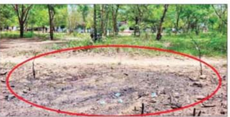
ရေစကြိုမြို့နယ် ဖူလုံကျေးရွာ အထက်၌ PDF အမည်ခံ အကြမ်း ဖက်သောင်းကျန်းသူများ Drop bomb ချတိုက်ခိုက်ခဲ့၍ ကျရောက် ပေါက်ကွဲခဲ့သည့် မှတ်တမ်းဓာတ်ပုံ။

နေပြည်တော် ဇွန် ၂၂ အကြမ်းဖက် လုပ်ရပ်များ လုပ်ဆောင်လျက်ရှိကြသည့် PDF အမည်ခံ အကြမ်းဖက်သမားများ သည် ယနေ့မွန်းလွဲပိုင်းတွင် မကွေးတိုင်းဒေသကြီး ရေစကြို မြို့နယ် ဖူလုံကျေးရွာရှိ အခြေခံ ပညာအထက်တန်းကျောင်း(ဖူလုံ) အား Drop Bomb များဖြင့် အကြောင်းမဲ့ ပစ်ချတိုက်ခိုက်မှု များ ပြုလုပ်ခဲ့ခြင်းကြောင့် ကျောင်းဝင်းအပြင်ဘက် မျက်နှာ စာနေရာတွင် ကျရောက်ပေါက်ကွဲ ခဲ့ခြင်းဖြစ်သည်။ အဆိုပါဦးသီး