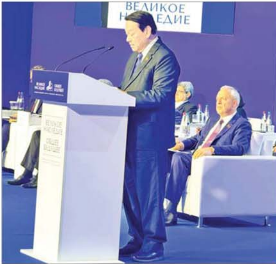
ပြည်သူ့လွှတ်တော်ဥက္ကဋ္ဌ ဦးခင်ရီ 2 nd International Forum of the Union State “Great Heritage – Common Future” ဖိုရမ်၌ မိန့်ခွန်းပြောကြားစဉ်။

ဘရက်စ် ဇွန် ၂၂ 2 nd International Forum of the Union State “Great Heritage – Common Future” ဖိုရမ်သို့ တက်ရောက်ရန် ဘယ်လာရုစ်နိုင်ငံ ဘရက်စ်မြို့၌ ရောက်ရှိနေသော ပြည်သူ့လွှတ်တော်ဥက္ကဋ္ဌ ဦးခင်ရီ ဦးဆောင်သော မြန်မာလွှတ်တော်ကိုယ်စားလှယ် အဖွဲ့သည် ယနေ့ ဒေသစံတော်ချိန် ၁၂ နာရီတွင် ဘရက်စ်မြို့ Brest Regional Community and Cultural Center ကျင်းပပြုလုပ်သည့် 2 nd International Forum of the Union State “Great Heritage – Common Future” ဖိုရမ်သို့ ဖိတ်ကြားထားသော နိုင်ငံ ၁၇ နိုင်ငံမှ လွှတ်တော်ဥက္ကဋ္ဌများ၊ အဆင့်မြင့် နိုင်ငံတကာကိုယ်စားလှယ် အဖွဲ့များနှင့်အတူ တက်ရောက်ကာ စုံညီအစည်းအဝေးတွင် ပြည်သူ့လွှတ်တော်ဥက္ကဋ္ဌက မိန့်ခွန်းတစ်ရပ် ပြောကြားသည်။