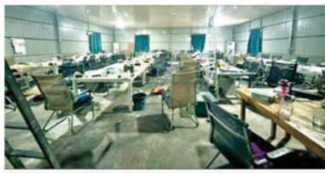
အွန်လိုင်းလိမ်လည်လောင်းကစားမှု ကျူးလွန်ရာတွင် အသုံးပြု သည့် အဆောက်အအုံနှင့် လုပ်ငန်းလုပ်ကိုင်သည့်အခန်းကို တွေ့ရစဉ်။

ဦးတို့ အား ဖုန်းမျိုးစုံ အလုံး ၂၀၀၊ All in One ကွန်ပျူတာ ၁၀ လုံး၊ Laptop ၄ လုံး၊ ဆိုင်ကယ်မျိုးစုံ ၁၀ စီးတို့နှင့်အတူ ဖမ်းဆီးရမိခဲ့ သည်။