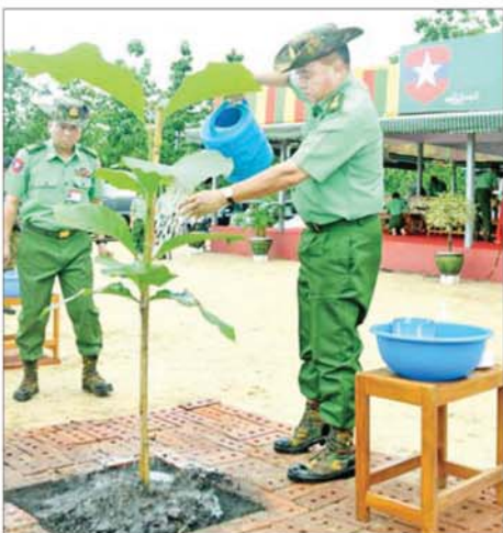
ပေးနိုင်ခြင်းပင် ဖြစ်ကြောင်း၊ ကောင်းမွန်သည့် ရာသီဥတုက တစ်ဆင့် လူသားများ၏ သက်ရှည်ကျန်းမာရေးကို များစွာအထောက်အကူပြုနေသလို ဖိစီးမှုမျိုးကွဲများ တိုးပွားရေးအတွက်လည်း များစွာ အထောက်အကူပြုနေ

သဘာဝရာသီဥတုက သစ်ပင်သစ်တောများကို ရှင်သန်စေပြီး သစ်ပင်သစ်တောများက ကောင်းမွန်သည့် သဘာဝရာသီဥတုကို ပြန်လည်ထိန်းညှိ