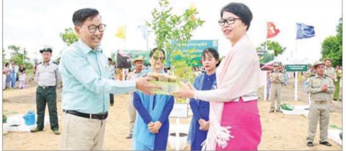
မိတ္ထီလာစီးပွားရေးတက္ကသိုလ်၌ မိုးရာသီစုပေါင်းသစ်ပင်စိုက်ပျိုးပွဲနှင့် လူငယ်တွေ့ဆုံပွဲကျင်းပ

တိုင်းရင်းသားရေးကြောင့်ဖြစ်လာတဲ့ ပြဿနာတွေ ဖြစ်ပါတယ်။ ဒါတွေကို ဥပဒေနဲ့အညီ လွှတ်တော်မှာ မြေရှင်းရပါတယ်။ လိုအပ်တဲ့ လုံခြုံရေးအကာအကွယ် တွေကို သက်ဆိုင်တဲ့အဖွဲ့အစည်းတွေက ပေးပါတယ်။ တစ်ယောက်ချင်းတော့ မပေးနိုင်ပေမယ့် ဌာနနဲ့ပတ်သက်တဲ့ လုပ်ငန်းနဲ့ပတ်သက်တဲ့ လုံခြုံရေးကို သက်ဆိုင်ရာအဖွဲ့အစည်းတွေက ဆောင်ရွက်ပေးပါတယ်။ ဒါနဲ့ပတ်သက်ပြီး ထိထိရောက်ရောက်လည်း အရေးယူပါတယ်။ လက်ရှိဖြစ်ပျက်နေတဲ့ ပြဿနာထဲမှာ နယ်စပ်ဒေသမှာ အွန်လိုင်းလောင်းကစားမှု ပြဿနာတွေရှိတယ်။ ဒါတွေကို နှိမ်နင်းနေတယ်။ တရုတ်နိုင်ငံနဲ့ မြန်မာနိုင်ငံ ပူးပေါင်းပြီး နှိမ်နင်းနေတာ တွေလည်းရှိပါတယ်။ ကျူးလွန်သူတွေကိုလည်း တရုတ်နိုင်ငံကို အကုန်လုံးပြောင်းပေးလိုက်ပါပြီ။ ဥပဒေကိုချိုးဖောက်ပြီး လာရောက်လုပ်ကိုင်မယ့် လုပ်ငန်းတွေ မလာရအောင်လုပ်လို့ရမယ်။ မလုပ်နိုင်အောင်လည်းလုပ်ရမယ်။ နှစ်ဖက်လုပ်ပွဲရမယ်။ တစ်ဖက်တည်းကတော့ လုပ်လို့မရဘူး။ ဒါကတော့ နယ်စပ်ဒေသ Cross Border နဲ့ပတ်သက်တာပါ။ ပြည်တွင်းလုံခြုံရေးကျတော့ ကျွန်တော်တို့နဲ့ဆိုင်ပါတယ်။ လုပ်ပေးပါတယ်။ အဲဒီအပြင် တရုတ်နိုင်ငံရဲ့ လုံခြုံရေးနဲ့ပတ်သက်ပြီး နှစ်ဖက်ပူးပေါင်းပြီး လုပ်ဆောင်တဲ့အဖွဲ့အစည်းကိုလည်း ခွင့်ပြုပေးထားပါတယ်။ ဒီလိုမျိုး ရင်းနှီးမြှုပ်နှံမှုနဲ့ လူပုဂ္ဂိုလ်လုံခြုံရေး တွေလုပ်ပေးထားတာဆိုတာလည်း ပြောချင်ပါတယ်။ တွေ့ဆုံမေးမြန်းသူ။ ဟုတ်ကဲ့၊ သမ္မတကြီးကို အခုလို မေးမြန်းခွင့်ရတဲ့အတွက် အထူးကျေးဇူးတင်ရှိပါတယ်။ သမ္မတကြီးရဲ့ ဦးဆောင်မှုအောက်မှာ မြန်မာနိုင်ငံရဲ့ စီးပွားရေးလုပ်ငန်းတွေ ဖွံ့ဖြိုးတိုးတက်လာမယ်ဆိုတာ ကျွန်မတို့ယုံကြည်ပါတယ်ရှင်း။ နိုင်ငံတော်သမ္မတ။ ကောင်းပါပြီ။