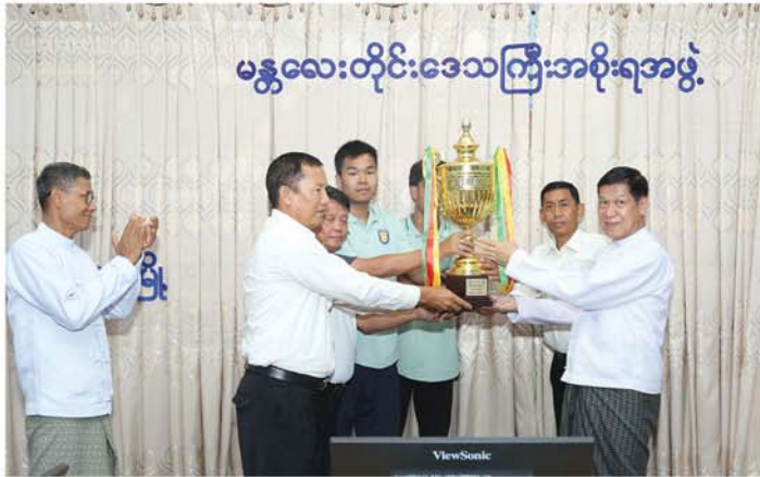
မန္တလေးတိုင်းဒေသကြီးအစိုးရအဖွဲ့

မန္တလေး၊ ဇွန် ၂၂ ၂၀၂၆ ခုနှစ်၊ တိုင်းဒေသကြီးနှင့် ပြည်နယ် ဘော်လီဘောပြိုင်ပွဲတွင် ပထမတံခွန်စိုက်ဆုပေးရရှိခဲ့သည့် မန္တလေးတိုင်းဒေသကြီး အမျိုးသား ဘော်လီဘောအသင်းနှင့် ဒုတိယဆုရရှိခဲ့သည့် အမျိုးသမီး ဘော်လီဘောအသင်းတို့အား ကြိုဆိုဂုဏ်ပြုပွဲအခမ်းအနားကို ယနေ့ မွန်းလွဲပိုင်းက မန္တလေးတိုင်းဒေသကြီးအစိုးရအဖွဲ့ရုံး အစည်းအဝေး ခန်းမတွင် ကျင်းပသည်။