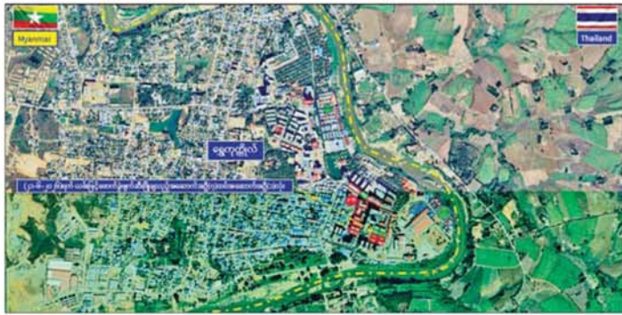
ကရင်ပြည်နယ် မြဝတီမြို့နယ် ရွှေကုက္ကိုလ်နယ်မြေရှိ အွန်လိုင်းလိမ်လည်လောင်းကစားမှု လုပ်ကိုင်ခဲ့ သည့် တရားမဝင်အဆောက်အအုံအား ဖောက်ခွဲဖျက်ဆီးမှု။

ဖြိုချဖျက်ဆီးပြီးဖြစ်ကြောင်းနှင့် ဖျက်ဆီးရန်ကျန်ရှိ သည့် တရားမဝင်အဆောက်အအုံ ၁၅ လုံးကို လည်း ဆက်လက်၍ စနစ်တကျဖျက်ဆီးသွားမည် ဖြစ်ကြောင်း သိရသည်။ နိုင်ငံတော်အစိုးရအနေဖြင့် အွန်လိုင်းလိမ်လည် လောင်းကစားမှုတိုက်ဖျက်ရေး လုပ်ငန်းစဉ်များကို အမျိုးသားရေးတာဝန်တစ်ရပ်အဖြစ်ခံယူ၍ မြန်မာ နိုင်ငံအတွင်း လုံးဝအခြေမပြုနိုင်ရေးအတွက် ပြည်တွင်းအင်အားစုများအပြင် အိမ်နီးချင်းနိုင်ငံများ နှင့်လည်း ပေါင်းစပ်ညှိနှိုင်း၍ တက်ကြွစွာ ဆောင်ရွက် လျက်ရှိကြောင်း သိရသည်။