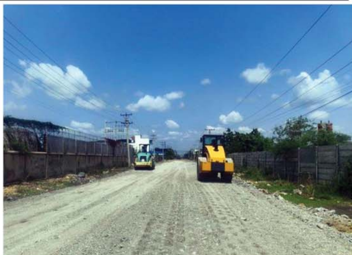
ရေစီးရေလာကောင်းမွန်စေရေး ဖွံ့ဖြိုးတိုးတက်ရေးအတွက် လျက်ရှိကြောင်း သိရသည်။ (မန္တလေးနေ့စဉ်-၆) ၀-၀-၀-၀-၀