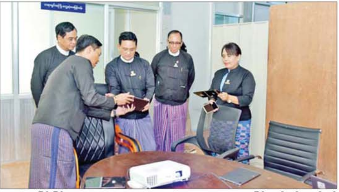
တွေ့ဆုံမေးမြန်းခြင်း (Pre-Trial Interview, PTI) ရုံး (Pilot Law Office) အဖြစ် သတ်မှတ်ဆောင်ရွက် များကို ဆောင်ရွက်နိုင်ရန် စံနမူနာပြုစမ်းသပ်ခြင်း ခဲ့သည့် မြို့နယ်ဥပဒေရုံးများကို ကြည့်ရှုစစ်ဆေးခဲ့ ဖြစ်ကြောင်း ဆွေးနွေးမှာကြားပြီး စံပြုရှေ့ပြေးဥပဒေ ကြောင်း သိရသည်။

မန္တလေး ဇွန် ၂၁ ပြည်ထောင်စုဝန်ကြီးနှင့် ပြည်ထောင်စု ရှေ့နေချုပ် ဒေါက်တာသီတာဦးသည် ဇွန် ၂၀ ရက် တွင် မန္တလေးတိုင်းဒေသကြီး မိတ္တီလာမြို့နယ် ဥပဒေ ရုံးအား စံပြုရှေ့ပြေး ဥပဒေရုံးသစ်တိုးချဲ့ဖော်ဆောင်မှု အခြေအနေနှင့် စံပြုရှေ့ပြေးဥပဒေရုံးများဖြစ်သည့် ပြင်ဦးလွင်ခရိုင် ဥပဒေရုံးနှင့် ချမ်းအေးသာစံမြို့နယ် ဥပဒေရုံးတို့ကို သွားရောက်ကြည့်ရှုစစ်ဆေး သည်။ ထို့နောက် တိုင်းဒေသကြီး ဥပဒေချုပ်ရုံးခန်းမ၌ တိုင်းဒေသကြီး၊ ခရိုင်နှင့် မြို့နယ်ဥပဒေအရာရှိများနှင့် တွေ့ဆုံသည်။ တွေ့ဆုံစဉ် ရှေ့ပြေးဥပဒေရုံး (Pilot Law Office) များ ဖွင့်လှစ်ခြင်းဖြင့် ရုံးလုပ်ငန်းများ ဆောင်ရွက် သောအခါ မှတ်ပုံတင်ရေးသွင်းခြင်း၊ မှတ်တမ်းတင် ခြင်း၊ အစီရင်ခံစာ ပေးပို့ခြင်းတို့ကို Manual စနစ်မှ Digitization စနစ်သို့ ကူးပြောင်းနိုင်ရန်၊ အမှုလိုက် ဥပဒေအရာရှိနှင့် တာဝန်ခံဥပဒေအရာရှိများအကြား နည်းပညာအသုံးပြုကာ မြန်မြန်ဆန်ဆန် ဆောင်ရွက် နိုင်ရန်၊ ရှေ့ပြေးဥပဒေရုံးများတွင် တရားခွင်အကြို