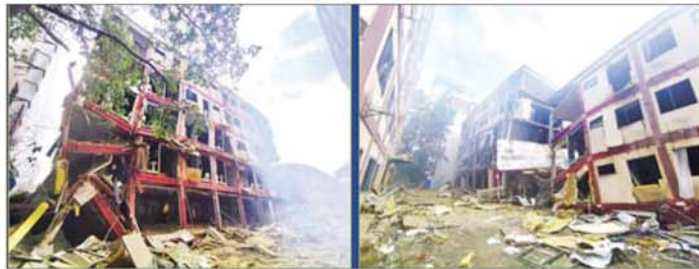
ကရင်ပြည်နယ် မြဝတီခရိုင် ရွှေကုက္ကိုလ်နယ်မြေရှိ အွန်လိုင်းလိမ်လည်လောင်းကစားမှု လုပ်ကိုင်ခဲ့ သည့် တရားမဝင် ခုနစ်ထပ်လူနေအဆောက်အအုံအား ယစ်ဖြင့်ဖောက်ခွဲဖျက်ဆီးပြီးမှု။