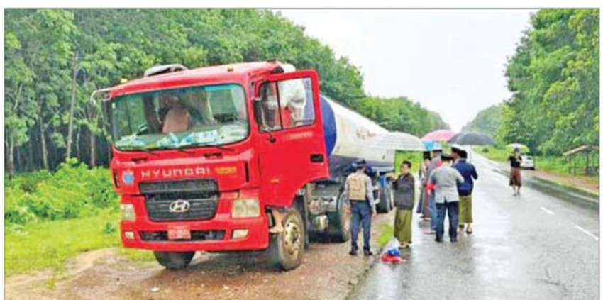
လျှပ်စစ်နှင့်စွမ်းအင်ဝန်ကြီးဌာန ရေနံနှင့် ရေနံထွက်ပစ္စည်းဆိုင်ရာလုပ်ငန်းများ ထိန်းသိမ်းကြီးကြပ်ရေးကော်မတီက ဆီသယ်ယာဉ်များ သတ်မှတ်လမ်းကြောင်းများအတိုင်း သွားလာမှု ရှိ၊ မရှိ စောင့်ကြည့်စစ်ဆေးစဉ်။

နေပြည်တော် ၅ နှစ် ၂၀ လျှပ်စစ်နှင့် စွမ်းအင်ဝန်ကြီးဌာန ရေနံထွက်ပစ္စည်းကြီးကြပ်စစ်ဆေးရေး ဦးစီးဌာနအနေဖြင့် ဆီသယ်ယာဉ် (ဘောက်ဆာ)များတွင် GPS များ တပ်ဆင်ထားရှိစေပြီး သတ်မှတ်လမ်းကြောင်းအတိုင်း မောင်းနှင်သွားလာမှု ရှိ၊ မရှိနှင့် စက်သုံးဆီများအား မသက်ဆိုင်သည့် နေရာများသို့ ရောက်ရှိမှုမရှိစေရေး Online Monitoring Center မှ တိုက်ရိုက် စောင့်ကြည့် စစ်ဆေးလျက်ရှိသည်။ ထိုသို့စောင့်ကြည့်စစ်ဆေးရာ ဆီသယ်ယာဉ် အမှတ် 5P/8614၊ နောက်တွဲအမှတ် 1TLR-9177 သည် ရန်ကုန်မြို့ (သီလဝါ) မှ ကရင်ပြည်နယ်ဘားအံမြို့သို့ စက်သုံးဆီ ပို့ဆောင်ရန်ဖြစ်သော်လည်း ကျိုက်ထိုမြို့ စာမျက်နှာ ၃ သို့ ။