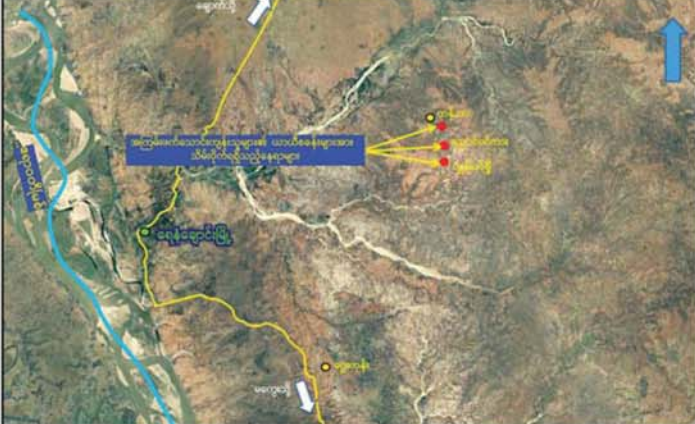
လုံခြုံရေးတပ်ဖွဲ့ဝင်များက ရေနံချောင်းမြို့နယ်အတွင်းရှိ ကျေးရွာအချို့၌ အကြမ်းဖက်သောင်းကျန်းသူများ၏ ယာယီစခန်းများအား သိမ်းပိုက်ရရှိမှု နေရာပြမြေပုံ။

အကြမ်းဖက်သောင်းကျန်းသူများ၏ အသုံးအဆောင်ပစ္စည်းများ ဖြစ်သည့် မော်တော်ဆိုင်ကယ် တစ်စီး၊ စားဆီ ငါးဂါလန် ငါးပုံး၊ စာမျက်နှာ ၅ သို့။