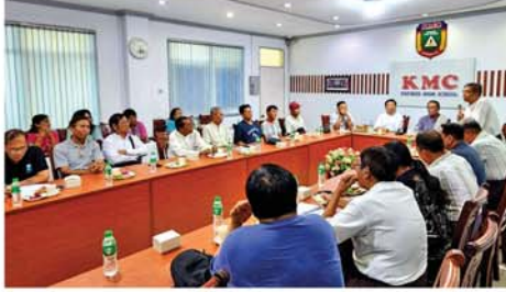
မန္တလေး ဇွန် ၂၁ အာစရိယပူဇော်ပွဲနှင့် ကျောင်းသား၊ မန္တလေးဒေသ ကောလိပ် ကျောင်းသားများ တွေ့ဆုံပွဲ နှစ်(၅၀)ပြည့် ရွှေရတနာအထိမ်းအမှတ် ကျောင်းသားများ ပထမအကြိမ် ညှိနှိုင်း

အစည်းအဝေးကို ဇွန် ၂၀ ရက် မိတ်ဆုံပွဲနှင့် ဖျော်ဖြေရေး၊ အခမ်းအနားပြင်ဆင်ရေး၊ ဧည့်ခံကျွေးမွေးရေး အစီအစဉ်များကို ဆွေးနွေးကြသည်။ မန္တလေးဒေသကောလိပ်နှစ် (၅၀)ပြည့်ရွှေရတနာ အာစရိယပူဇော်ပွဲကို ၂၀၂၇ ခုနှစ်၊ ဇန်နဝါရီ ၂၃ ရက် စနေနေ့တွင် ကျင်းပသွားမည်ဖြစ်ပြီး ဆရာ၊ ဆရာမကြီး ၁၃၇ ဦးအား ကန်တော့သွားမည်ဖြစ်ကြောင်း သိရသည်။ (အပေါ်ပုံ) (၀၄၅)