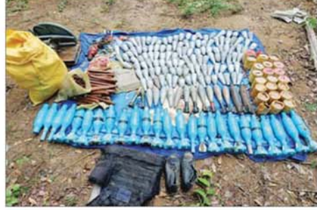
လုံခြုံရေးတပ်ဖွဲ့ဝင်များက ရေနံချောင်းမြို့နယ် ကန်သာကျေးရွာအနီး၌ အကြမ်းဖက်သောင်းကျန်းသူများ၏ ယာယီစခန်းအား သိမ်းပိုက်ရရှိမှု နှင့် သိမ်းဆည်းရမိမှုများကို တွေ့ရစဉ်။