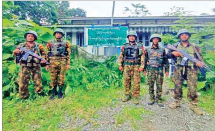
တပ်မတော်စစ်ကြောင်းများက ကလေး-တမူးလမ်းကြောင်းပေါ်ရှိ မြန်မာ-အိန္ဒိယ နယ်နိမိတ်နယ်စပ်ကုန်သွယ်ရေးနှင့် ဆက်သွယ်ရေးအရ အရေးပါသည့် ခါမ်းပါတ်မြို့အား ပြန်လည်သိမ်းပိုက်ရရှိမှုကို တွေ့ရစဉ်။

ကလေး-တမူးလမ်းကြောင်း ပြန်လည်ဖွင့်လှစ်နိုင်ရေး အရှိန်အဟုန်ဖြင့် ဆက်လက်ဆောင်ရွက်လျက်ရှိ