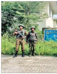
တပ်မတော်စစ်ကြောင်းများက ကလေး - တမူးလမ်းကြောင်း ပေါ်ရှိ မြန်မာ - အိန္ဒိယ နှစ်နိုင်ငံနယ်စပ်ကုန်သွယ်ရေးနှင့် ဆက်သွယ် ရေးအရ အရေးပါသည့် ခါမ်းပါတမြို့အား ပြန်လည်သိမ်းပိုက်ရရှိမှု မှတ်တမ်းဓာတ်ပုံ။

စခန်းတို့အား လည်းကောင်း၊ ဇွန် ၁၃ ရက်တွင် ရာဇပြိုဟ်ကျေးရွာနှင့် ရာဇပြိုဟ် ရေလှောင်တံစံတို့အား လည်းကောင်း၊ ဇွန် ၁၅ ရက်တွင် ရန်မျိုးအောင်ကျေးရွာအား လည်း ကောင်း၊ ဇွန် ၁၆ ရက်တွင် စော်ဘွား ရေရှည်ကျေးရွာအား လည်းကောင်း၊ ဇွန် ၁၇ ရက်တွင် ကွန်းတောရေရှည် ကျေးရွာအား လည်းကောင်း သိမ်းပိုက်ရရှိခဲ့ပြီး ဖြစ်သည်။ ပြန်လည်သိမ်းပိုက်ထိန်းချုပ် တပ်မတော် စစ်ကြောင်းများ သည် နယ်မြေလုံခြုံရေးလုပ်ငန်း များကို အရှိန်အဟုန်ဖြင့် ဆက်လက် ဆောင်ရွက်ခဲ့ရာ ကလေးမြို့ဘက် မှ ချီတက်လာသော တပ်မတော် စစ်ကြောင်းများသည် ဇွန် ၁၉ ရက် တွင် ခွန်နီကျေးရွာနှင့် နန်းခေါက်ခေါက်ကျေးရွာတို့အား လည်းကောင်း၊ ယနေ့တွင် နန်းကတီတံကျေးရွာနှင့် ခါမ်းပါတ