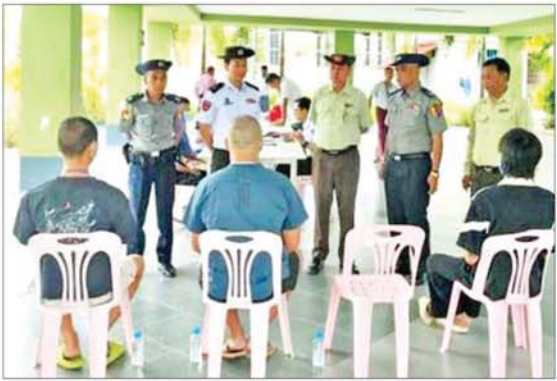
ဆိုက်များအတွင်းသို့ တရားမဝင် ခဲ့သည့် တရုတ်နိုင်ငံသားလေးဦးကို ထပ်မံလမ်းကြောင်းမှတစ်ဆင့် ဝင်ရောက်နေထိုင် ဖော်ထုတ်ထိန်းသိမ်းနိုင်ခဲ့ပြီး ပြည်နှင့်နိုင်

နေပြည်တော် ၅ နှစ် ၂၀ နိုင်ငံတော်အစိုးရအနေဖြင့် နယ်စပ်ဒေသများ၌ တရားမဝင် ဝင်ရောက်နေထိုင်ပြီး အွန်လိုင်းလောင်းကစားမှု၊ အွန်လိုင်းလိမ်လည်မှုအပါအဝင် ခုစရိုက်မှုလုပ်ငန်းများတွင် ပါဝင်ဆောင်ရွက်ခဲ့ကြသည့် ပြည်ပနိုင်ငံသားများကို စုံစမ်းစစ်ဆေးဖော်ထုတ်၍ သက်ဆိုင်ရာနိုင်ငံများသို့ ဥပဒေ၊ လုပ်ထုံးလုပ်နည်းများနှင့်အညီ စနစ်တကျ ပြည်နှင့်လွှဲပြောင်းပေးအပ်လျက်ရှိသည်။