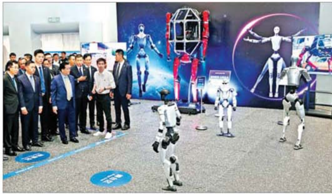
နိုင်ငံတော်သမ္မတ ဦးမင်းအောင်လှိုင် Unitree Robotics Co., Ltd. ၌ စက်ရုံမှ ထုတ်လုပ်ထားသော စွမ်းဆောင်ရည်မြင့် အသိဉာဏ်တူနည်းပညာသုံးမော်ဒယ်လ်အသုံးပြုထားသည့် လူသားပုံသဏ္ဍာန်စက်ရုပ် များ၏ စွမ်းရည်ပြသမှုကို ကြည့်ရှုလေ့လာစဉ်။

ညနေပိုင်းတွင်နိုင်ငံတော်သမ္မတ ဦးမင်းအောင်လှိုင် ဦးဆောင်သည့် မြန်မာအဆင့်မြင့်ကိုယ်စားလှယ် အဖွဲ့သည် နေပြည်တော်လေဆိပ်သို့ ပြန်လည်