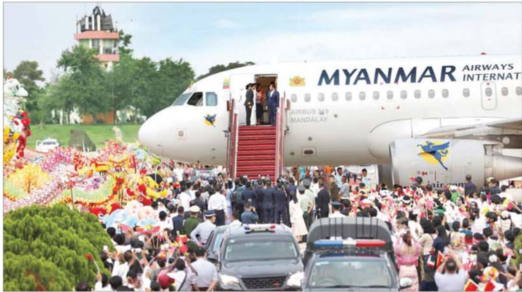
တရုတ်ပြည်သူ့သမ္မတနိုင်ငံနှင့် မြန်မာနိုင်ငံတို့အကြား ချစ်ကြည်ရင်းနှီးမှုနှင့် ပူးပေါင်းဆောင်ရွက်မှုများ ပိုမိုတိုးတက်ခိုင်မာအောင် ဆောင်ရွက်နိုင်ခဲ့သည့် နိုင်ငံတော်သမ္မတ ဦးမင်းအောင်လှိုင် ဦးဆောင်သည့် မြန်မာအဆင့်မြင့်ကိုယ်စားလှယ်အဖွဲ့ နေပြည်တော်လေဆိပ်သို့ ပြန်လည်ရောက်ရှိစဉ်။

Leapmotor မှ ကနဦးစတင်ထွက်ပေါ်လာသည့် S01 သည် အောင်မြင်မှုမရခဲ့။ ထိုစဉ်က ဈေးကွက် အတွင်းမှ လူကြိုက်များလျက်ရှိသည့် အခြားပြိုင်ဘက် များကို မယှဉ်နိုင်ခြင်းနှင့် ဈေးကွက်အတွေ့အကြုံ အားနည်းချက်များကြောင့် S01 မှာ အခြေအနေ ဆိုးခဲ့ရသည်။ သို့ရာတွင် နောက်တစ်နှစ်တွင် Leapmotor က ထုတ်လုပ်သည့် T03 Electric City Car မှာမူ အလွန်အောင်မြင်ပြီး အရောင်းရဆုံးဖြစ်ခဲ့ သည်။ မြို့တွင်းသုံး လျှပ်စစ်ကားငယ် (Micro EV) ကလေးဖြစ်သည့် T03 သည် တရုတ်နိုင်ငံတွင် သာမ က ဥရောပနှင့် နိုင်ငံတကာဈေးကွက်များအထိပါ ထိုးဖောက်အောင်မြင်လျက်ရှိသည်။ ၂၀၂၃ ခုနှစ်တွင် ကမ္ဘာ့အကြီးဆုံး ကားကုမ္ပဏီကြီးတစ်ခုဖြစ်သည့် Stellantis က Leapmotor ၏ ရှယ်ယာ ၂၀ ရာခိုင် နှုန်းကိုဝယ်ယူပြီး ၂၀၂၄ ခုနှစ်တွင် ဥရောပနိုင်ငံများ ၌ Leapmotor ကားများကို စတင်ရောင်းချခဲ့ရာ ယခုနှစ်အစပိုင်းစာရင်းများအရ ရောင်းအား ၆၇၇