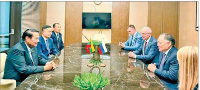
ပြည်သူ့လွှတ်တော်ဥက္ကဋ္ဌ ဦးခင်ရီနှင့် ရုရှားနိုင်ငံ ဒုတိယဥက္ကဋ္ဌ H.E. Mr. Sholban Valerievich Kara-ool တို့ တွေ့ဆုံဆွေးနွေးစဉ်။