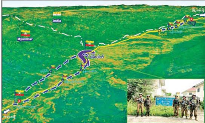
တပ်မတော်စစ်ကြောင်းများက အကြမ်းဖက်သောင်းကျန်းသူများ ယာယီစိုးမိုးထားသော ကလေး - တမူး လမ်းကြောင်းပေါ်ရှိ မြန်မာ - အိန္ဒိယ နှစ်နိုင်ငံနယ်စပ်ကုန်သွယ်ရေးအတွက် အရေးပါအချက်အချာကျ သည့် ခါမ်းပါတမြို့အား ပြန်လည်သိမ်းပိုက်ရရှိမှု။

အရှေ့မှ ကလေး - တမူး လမ်းကြောင်း အားအပြည့်အဝပြန်လည်ထိန်းချုပ် နိုင်ရေးအတွက် တပ်မတော် စစ်ကြောင်းများခွဲ၍ ဟန့်ချက် ညီညီချီတက်၍ နယ်မြေလုံခြုံရေး လုပ်ငန်းများကို အဆင့်ဆင့် ဆောင်ရွက်ခဲ့ရာ ကလေးမြို့ဘက် မှ ချီတက်လာသော တပ်မတော် စစ်ကြောင်းများသည် ဇွန် ၇ ရက် တွင် ကလေး - တမူး လမ်းကြောင်း ပေါ်ရှိ အကြမ်းဖက်သောင်းကျန်း သူများ ယာယီစိုးမိုးထားသည့် အရှေ့နံ့သာကျေးရွာ၊ ၅၆ မိုင် ကျေးရွာ၊ ၅၅ မိုင် ကျေးရွာတို့အား လည်းကောင်း၊ အလားတူ တမူး မြို့ဘက်မှ ချီတက်လာသော တပ်မတော်စစ်ကြောင်းများသည် နန်းမွတ်တားကျေးရွာ၊ ရန်လင်းပိုင် ကျေးရွာနှင့် ၄ ကျေးရွာအနီး နှစ်နိုင်ငံနယ်စပ်ရှိ အကြမ်းဖက် သမားများအခြေချနေထိုင်သည့်