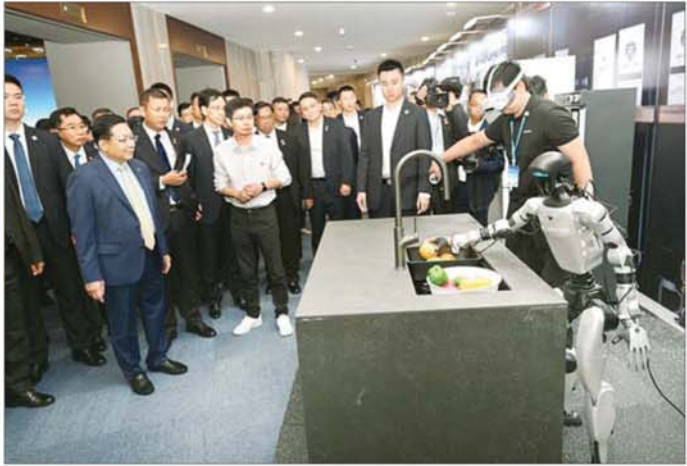
နိုင်ငံတော်သမ္မတ ဦးမင်းအောင်လှိုင် Unitree Robotics Co., Ltd. ၌ စက်ရုံမှ ထုတ်လုပ်ထားသည့် နေ့အိမ်ဝန်ဆောင်မှုလုပ်ငန်းများတွင် အသုံးပြုသည့် စက်ရုပ်သရုပ်ပြသခြင်းကို ကြည့်ရှုလေ့လာစဉ်။