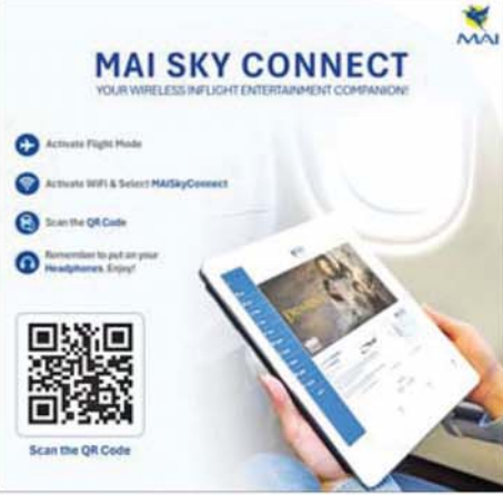
ရန်ကုန် ၉ ဇွန် ၂၀ အပြည်ပြည်ဆိုင်ရာ မြန်မာလေကြောင်း(MAI)အနေဖြင့် Aerohub ၊ Aeroplay တို့နှင့် ပူးပေါင်း၍ လေယာဉ်ပေါ်တွင်

လွယ်ကူစွာ ဝိုင်ဖိုင်ချိတ်ဆက်အသုံးပြုနိုင်သည့် Wireless In-Flight Entertainment (IFE) စနစ်သစ်ကို ၉ ဇွန် ၁၇ ရက်တွင် တရားဝင်စတင် မိတ်ဆက်ခဲ့ကြောင်း MAI ၏ ထုတ်ပြန်ကြေညာချက်အရ သိရသည်။ MAI အနေဖြင့် မြန်မာနိုင်ငံအတွင်းရှိ လေကြောင်းလိုင်းများ အကြား fully wireless, bring-your-own-device (BYOD) onboard entertainment platform ကို ပထမဆုံးအကောင်အထည် ဖော်အသုံးပြုခြင်းဖြစ်ပြီး အဆိုပါစနစ်သစ်တွင် Aerohub က onboard wireless entertainment platform ကို ပံ့ပိုးပေးထားကာ Aeroplay Entertainment က ခရီးသည်များအတွက် ရွေးချယ် စီစဉ်ပေးထားသည့် Entertainment Content များကို တာဝန်ယူ ပံ့ပိုးပေးထားသည်။ ထို့ကြောင့် လေယာဉ်စီးခရီးသည်များအနေဖြင့် onboard Wi-Fi အား ထိုင်ခုံရှေ့ရှိ QR code ကို Scan ဖတ်ကာ လွယ်ကူစွာ ချိတ်ဆက်ပြီး မိမိတို့၏ စမတ်ဖုန်း၊ တက်ဘလက်၊ လက်ပံတော့ စသည့် ကိုယ်ပိုင် device များပေါ်တွင် တိုက်ရိုက် Streaming အနေဖြင့် အဆင်ပြေချောမွေ့စွာ ကြည့်ရှုနိုင်မည်ဖြစ်ကာ လေယာဉ်စီး ခရီးသွားလာရင်း ခေတ်မီသော Wireless In-Flight Entertainment