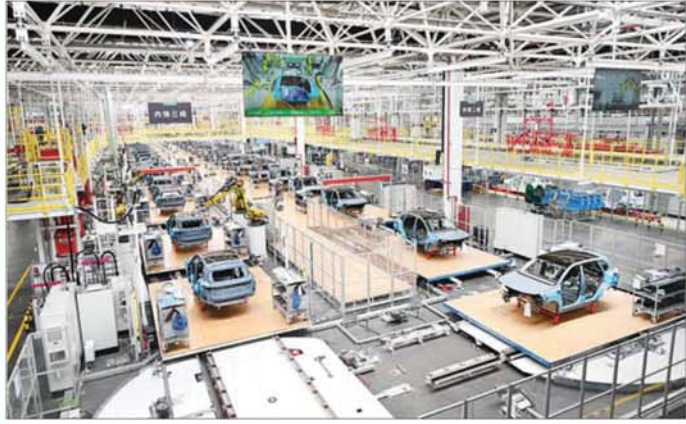
Zhejiang Leapmotor Technology Co., Ltd. ၌ မော်တော်ယာဉ်တပ်ဆင်ထုတ်လုပ်ပုံ လုပ်ငန်းအဆင့်ဆင့်ကို မြင်တွေ့ရစဉ်။

မိမိတို့နိုင်ငံသည် ရေခဲ၊ မြေခဲ ကောင်းသည့် နိုင်ငံ၊ သဘာဝတရားက မျက်နှာသာပေးထားသည့် နိုင်ငံ၊ ပထဝီနိုင်ငံရေး၊ ပထဝီစီးပွားရေးတို့တွင်ပါ အရေးပါ အရာရောက်နေသည့် နိုင်ငံဖြစ်သည်။ သို့ရာတွင် မျက်နှာသာပေးမှုများ၊ အရေးပါမှုများ၏ နောက်တွင် စိန်ခေါ်မှုများကလည်း ရှိနေသည်။ သဘာဝအတိုင်းရလာသည့် အခွင့်အလမ်းများကို ရအောင်ယူနိုင်ရန်မှာ မိမိတို့တွင် စည်းလုံးညီညွတ် မှု၊ တိုင်းပြုပြည်ပြု စိတ်ဓာတ်ကောင်းများရှိမှု၊ ဉာဏ်ပညာပြည့်ဝမှု၊ ဇွဲ လုံ့လ ဝီရိယရှိမှုတို့နှင့်အတူ ဖွံ့ဖြိုးတိုးတက်လိုသည့် အလိုဆန္ဒလည်း အဓိပတိ တင်နေဖို့လိုသည်။ နိုင်ငံဖွံ့ဖြိုးတိုးတက်ရေးတွင် သယံဇာတအရင်း အမြစ်အားလုံးထက် လူသားအရင်းအမြစ်ကသာ လျှင် အဓိကဖြစ်ရာ မိမိတို့အားလုံး တစည်းတလုံး သော အင်အားကိုစုစည်းကာ နိုင်ငံသမိုင်းသစ်ကို ရေးထိုးကြပါစို့ဟူ၍။