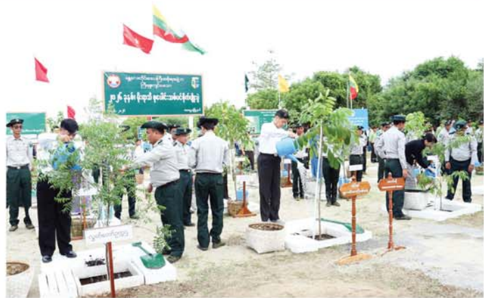
တပေဘူတစသည့် သစ်မျိုး (၁၇) ၁၇၄၀ ပင်ကို တက်ရောက်လာ ခဲ့ကြကြောင်း သိရသည်။ မျိုး စုစုပေါင်းအပင်အရေအတွက် ကြည့် ၁၇၄၀ ဦးတို့က စိုက်ပျိုး (မန္တလေးနေ့စဉ်)

အစိုးရအဖွဲ့ဝင် ဝန်ကြီးများနှင့် တာဝန်ရှိသူများ၊ တက်ရောက် လာကြသူများက သတ်မှတ်နေရာ များတွင် သစ်ပင်များကို အတူ တကွ တပျော်တပါး စိုက်ပျိုးခဲ့ ကြပြီး တိုင်းဒေသကြီးဝန်ကြီး ချုပ်နှင့် အဖွဲ့သည် သစ်ပင်စိုက်ပျိုး နေမှုများကို လိုက်လံကြည့်ရှု အားပေးခဲ့ကြောင်းနှင့် ယနေ့ ၂၀၂၆ ခုနှစ် မိုးရာသီသစ်ပင်စိုက် ပျိုးပွဲတွင် မဟော်ဂနီ၊ ကျွန်း၊ ပိတောက်၊ ကံကော်၊ မယ်ဇယ်၊ ခရေ၊ ယင်းမာ၊ လင်းလွန်း၊ သင်္ဘောတည်၊ စိန်ပန်းနီ၊ တမာ၊ တပေဘူတ (အပြာ)၊ ကုတ္တီ၊ မယ်ဇယ်၊ မန်ကျည်း၊ မန်ဂျန်ရှား၊