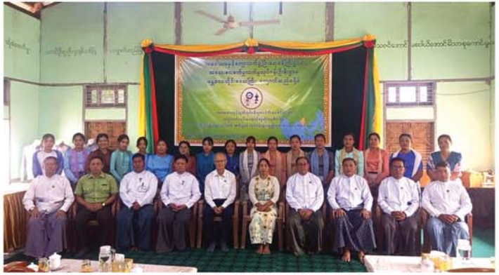
တန်းသူ မမြပွင့်က ကျေးဇူးကြောင်းနှင့်စုပေါင်း၍ အမှတ်တရ သည်။ တင်စကားပြန်လည်ပြောကြားခဲ့ စာတံပုံရိုက်ခဲ့ကြကြောင်း သိရ ကျော်စွာ(စဉ့်ကိုင်)

နှင့် သဘာဝပတ်ဝန်းကျင်ထိန်းသိမ်းရေးဝန်ကြီး ဒေါ်သီရိအောင်နှင့် ပြည်သူ့လွှတ်တော်ကိုယ်စားလှယ်တို့က ထူးချွန်သင်တန်းသူများအား သုံးစွဲခွင့်ပြုမည့် ဒေသဖွံ့ဖြိုးရေးလုပ်ငန်းသုံးပစ္စည်းများကိုလည်းကောင်း၊ တိုင်းဒေသကြီးလွှတ်တော်ကိုယ်စားလှယ်များနှင့်တာဝန်ရှိသူများက သင်တန်းဆင်းလက်မှတ်များ၊ သင်တန်းမှထွက်ရှိသည့် ထွက်ကုန်ပစ္စည်းများကိုလည်းကောင်း အသီးသီးပေးအပ်ခဲ့ကြရာ သင်တန်းသူများက လက်ခံရယူခဲ့ကြပြီး သင်