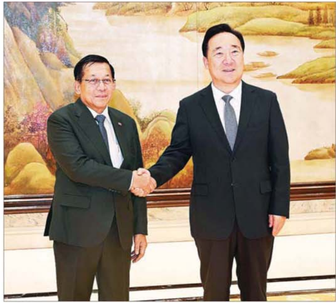
နိုင်ငံတော်သမ္မတ ဦးမင်းအောင်လှိုင်နှင့် ကျွဲကျန်းပြည်နယ် ပါတီအတွင်းရေးမှူး မစ္စတာဝမ်ဟောက် တို့ ရင်းနှီးနှီးနှုတ်ဆက်စဉ်။

ဆက်လက်၍ နိုင်ငံတော်သမ္မတ ဦးဆောင်သည့် မြန်မာအဆင့်မြင့် ကိုယ်စားလှယ်အဖွဲ့သည် ရန်ဟိုင်းမြို့၊ Hongqiao Railway Station မှ ဟန်ကျိုးမြို့၊ Hangzhou East Railway Station သို့ မြန်မာနိုင်ငံခြားသို့ရောက်ရှိရန် ရန်ဟိုင်းမြို့၊ ဒုတိယမြို့တော်ဝန်နှင့် တာဝန်ရှိသူများက ပို့ဆောင် နှုတ်ဆက်ကြသည်။ ရန်ဟိုင်း-ဟန်ကျိုး မြန်မာနိုင်ငံခြားသို့ ခုတ်မောင်းချိန် ၄၅ မိနစ်မျှသာ။ နိုင်ငံတော်သမ္မတဦးဆောင်သည့် မြန်မာအဆင့်မြင့် ကိုယ်စားလှယ်အဖွဲ့ ဟန်ကျိုးမြို့၊ Hangzhou East Railway Station သို့ ရောက်ရှိ