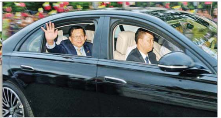
နိုင်ငံတော်သမ္မတ ဦးမင်းအောင်လှိုင် ဦးဆောင်သည့် မြန်မာအဆင့်မြင့် ကိုယ်စားလှယ်အဖွဲ့အား တရုတ်-မြန်မာ ချစ်ကြည်ရေးအသင်းမှ တာဝန်ရှိသူများ၊ အသင်းအဖွဲ့များအလိုက်မှ တာဝန်ရှိသူများနှင့် ဒေသခံပြည်သူများက သောင်းသောင်းမြဖြူ ကြိုဆိုဂုဏ်ပြုနှုတ်ဆက်စဉ်။