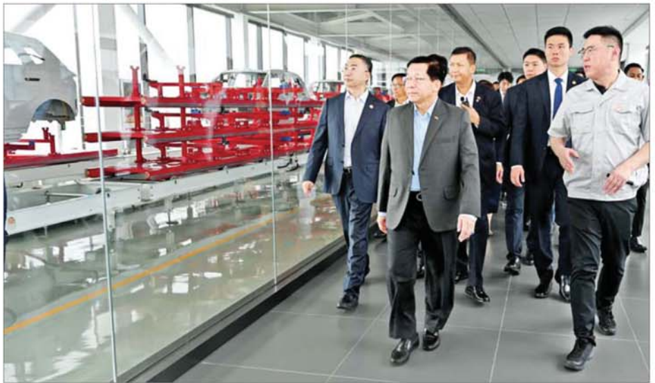
နိုင်ငံတော်သမ္မတ ဦးမင်းအောင်လှိုင် ဟန်ကျိုးမြို့ရှိ Zhejiang Leapmotor Technology Co., Ltd. ၌ မော်တော်ယာဉ် တပ်ဆင်ထုတ်လုပ်ပုံ လုပ်ငန်းအဆင့်ဆင့်ကို ကြည့်ရှုလေ့လာစဉ်။