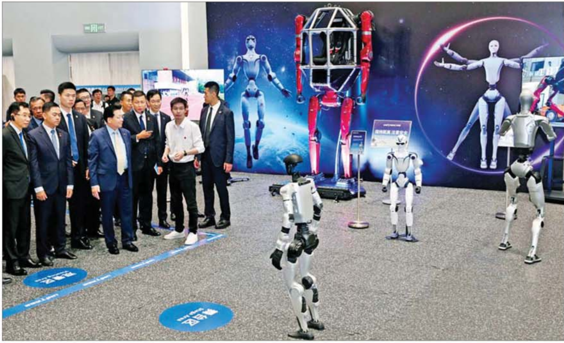
နိုင်ငံတော်သမ္မတ ဦးမင်းအောင်လှိုင် Unitree Robotics Co., Ltd. မှ ထုတ်လုပ်ထားသည့် စွမ်းဆောင်ရည်မြင့် လူသားပုံသဏ္ဍာန်စက်ရုပ်နှင့် အသိဉာဏ်တူနည်းပညာ သုံးမော်ဒယ်များ အသုံးပြု၍ လူသားတစ်ဦးအသွင်ကဲ့သို့ စွမ်းရည်ပြသမှုများကို ကြည့်ရှုလေ့လာစဉ်။

နေပြည်တော် ၈ွန် ၁၉ တရုတ်ပြည်သူ့သမ္မတနိုင်ငံသမ္မတ မစ္စတာရှီကျင့်ဖျင်၏ ဖိတ်ကြားချက်အရ တရုတ်ပြည်သူ့သမ္မတနိုင်ငံ၌ နိုင်ငံတော် အဆင့်ချစ်ကြည်ရေးခရီးစဉ်(State Visit) ရောက်ရှိနေသည့် ပြည်ထောင်စုသမ္မတ မြန်မာနိုင်ငံတော် နိုင်ငံတော်သမ္မတ ဦးမင်းအောင်လှိုင်သည် ခရီးစဉ်တွင် လိုက်ပါလာသည့် အဖွဲ့ဝင်များနှင့် တာဝန် ရှိသူများလိုက်ပါ၍ ယနေ့တွင် ကျဲ့ကျန်း ပြည်နယ် ဟန်ကျီးမြို့ရှိ နည်းပညာမြင့် စက်ရုံ၊ အလုပ်ရုံများသို့ သွားရောက် လေ့လာကြသည်။