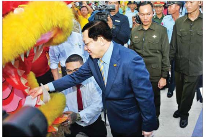
နိုင်ငံတော်သမ္မတ ဦးမင်းအောင်လှိုင်အား မြန်မာနိုင်ငံဆိုင်ရာ တရုတ်ပြည်သူ့ သမ္မတနိုင်ငံ သံရုံးနှင့် စစ်သံရုံးတို့မှ တာဝန်ရှိသူများက နေပြည်တော်လေဆိပ်၌ ကြိုဆိုနှုတ်ဆက်ကြစဉ်။

* စာမျက်နှာ ၄ မှ တို့ပြင် နိုင်ငံတော်သမ္မတ ဦးမင်းအောင်လှိုင် ဦးဆောင်သည့် မြန်မာအဆင့်မြင့် ကိုယ်စားလှယ် အဖွဲ့အနေဖြင့် နိုင်ငံတော် အကျိုးစီးပွားကို တစ်စိတ်မတိတ်တည်း ပြီးခရီးစဉ်အတွင်း တရုတ်ပြည်သူ့ သမ္မတနိုင်ငံနှင့် ပြည်ထောင်စု သမ္မတ မြန်မာနိုင်ငံတို့အကြား ချစ်ကြည်ရင်းနှီးမှုနှင့် ပူးပေါင်းဆောင်ရွက်မှုများ တိုးမြှင့်နိုင်ခဲ့မှု၊