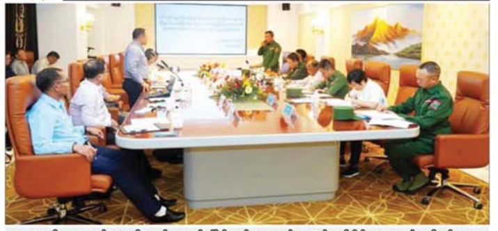
အမျိုးသားစည်းလုံးညီညွတ်ရေးနှင့် ငြိမ်းချမ်းရေးဖော်ဆောင်မှုညှိနှိုင်းရေးကော်မတီနှင့် "ဝ" ပြည်သွေးစည်းညီညွတ်ရေးပါတီ (UWSP) တို့ ငြိမ်းချမ်းရေး တွေ့ဆုံဆွေးနွေးစဉ်။