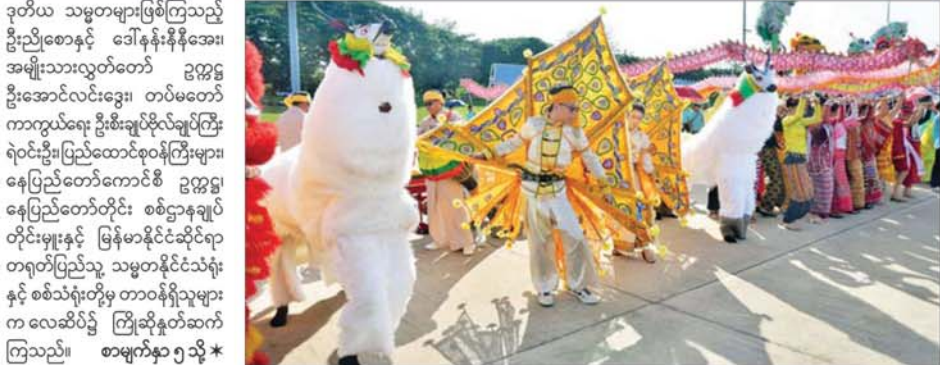
ဒုတိယ သမ္မတများဖြစ်ကြသည့် ဦးညီစောနှင့် ဒေါ်နန်းနီအေး၊ အမျိုးသားလွှတ်တော် ဥက္ကဋ္ဌ ဦးအောင်လင်းဒွေး၊ တပ်မတော် ကာကွယ်ရေး ဦးစီးချုပ်ဗိုလ်ချုပ်ကြီး ရဲဝင်းဦး၊ ပြည်ထောင်စုဝန်ကြီးများ နေပြည်တော်ကောင်စီ ဥက္ကဋ္ဌ၊ နေပြည်တော်တိုင်း စစ်ဌာနချုပ် တိုင်းမှူးနှင့် မြန်မာနိုင်ငံဆိုင်ရာ တရုတ်ပြည်သူ့ သမ္မတနိုင်ငံသံရုံး နှင့် စစ်သံရုံးတို့မှ တာဝန်ရှိသူများ က လေဆိပ်၌ ကြိုဆိုနှုတ်ဆက် ကြသည်။ စာမျက်နှာ ၅ သို့ *

»» စာမျက်နှာ ၃ မှ ယင်းနောက် Unitree Robotics Co., Ltd. မှ ထုတ်လုပ်ထားသည့် စွမ်းဆောင်ရည်မြင့် တီရော့နစ် ပုံသဏ္ဍာန်စက်ရုပ် (quadruped robots)၊ လူသားပုံသဏ္ဍာန် စက်ရုပ် (humanoid robots) နှင့် အသိဉာဏ်တူနည်းပညာသုံး မော်ဒယ် (AI model) များ အသုံးပြု၍ လူသားတစ်ဦး အသွင်ကဲ့သို့ လှုပ်ရှားသွားလာခြင်း၊ သဘာဝဘေးအန္တရာယ်များတွင် အသုံးပြုခြင်း၊ မြန်မာသံစဉ် တရုတ်သံစဉ် တို့ဖြင့် နှစ်နိုင်ငံမှ ရိုးရာအကများကို ကျွမ်းကျင်ပိုင်နိုင်စွာသရုပ်ပြသခြင်း၊ လက်ဝှေ့ထိုး၍ သရုပ်ပြသခြင်း၊ စက်ရုံအလုပ်ရုံများ၊ နေအိမ်များ၊ ဝန်ဆောင်မှုလုပ်ငန်းများ၌ အသုံးပြုရာတွင် အသုံးပြုမှုသရုပ်ပြသခြင်းတို့ကို လုပ်ဆောင်ပြသရာ နိုင်ငံတော်သမ္မတနှင့် အဖွဲ့ဝင်များက စိတ်ပါဝင်စားစွာဖြင့် လေ့လာ