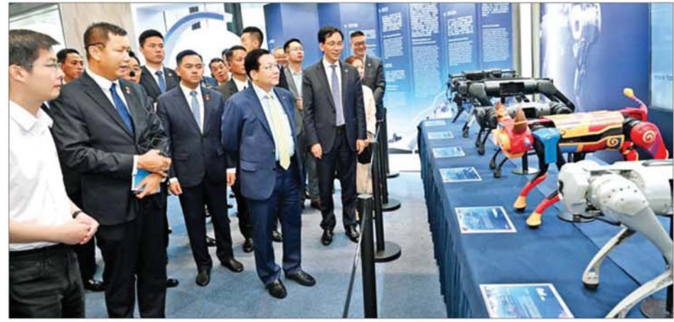
နိုင်ငံတော်သမ္မတ ဦးမင်းအောင်လှိုင် ဟန်ကျိုးမြို့ရှိ Unitre Robotics Co., Ltd. မှ ထုတ်လုပ်ထားသည့် စွမ်းဆောင်ရည်မြင့် တီရော့နစ် ပုံသဏ္ဍာန် စက်ရုပ်များကို ကြည့်ရှုလေ့လာစဉ်။

»» စာမျက်နှာ ၃ မှ ယင်းနောက် Unitree Robotics Co., Ltd. မှ ထုတ်လုပ်ထားသည့် စွမ်းဆောင်ရည်မြင့် တီရော့နစ် ပုံသဏ္ဍာန်စက်ရုပ် (quadruped robots)၊ လူသားပုံသဏ္ဍာန် စက်ရုပ် (humanoid robots) နှင့် အသိဉာဏ်တူနည်းပညာသုံး မော်ဒယ် (AI model) များ အသုံးပြု၍ လူသားတစ်ဦး အသွင်ကဲ့သို့ လှုပ်ရှားသွားလာခြင်း၊ သဘာဝဘေးအန္တရာယ်များတွင် အသုံးပြုခြင်း၊ မြန်မာသံစဉ် တရုတ်သံစဉ် တို့ဖြင့် နှစ်နိုင်ငံမှ ရိုးရာအကများကို ကျွမ်းကျင်ပိုင်နိုင်စွာသရုပ်ပြသခြင်း၊ လက်ဝှေ့ထိုး၍ သရုပ်ပြသခြင်း၊ စက်ရုံအလုပ်ရုံများ၊ နေအိမ်များ၊ ဝန်ဆောင်မှုလုပ်ငန်းများ၌ အသုံးပြုရာတွင် အသုံးပြုမှုသရုပ်ပြသခြင်းတို့ကို လုပ်ဆောင်ပြသရာ နိုင်ငံတော်သမ္မတနှင့် အဖွဲ့ဝင်များက စိတ်ပါဝင်စားစွာဖြင့် လေ့လာ