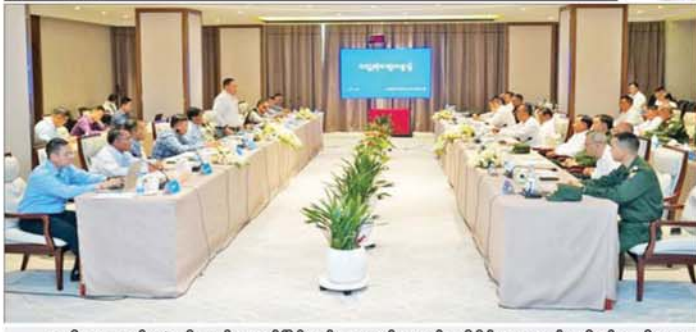
အမျိုးသားစည်းလုံးညီညွတ်ရေးနှင့် ငြိမ်းချမ်းရေးဖော်ဆောင်မှုညှိနှိုင်းရေးကော်မတီနှင့် အမျိုးသား ဒီမိုကရက်တစ်မဟာမိတ်အဖွဲ့ (NDAA) တို့ ငြိမ်းချမ်းရေး တွေ့ဆုံဆွေးနွေးစဉ်။