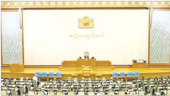
ရေးထိုးပေးပါကြောင်း။

မြေရှင်းဆောင်ရွက်ပေးရာတွင် နိုင်ငံသားနံပါတ်တစ်ခုတည်းဖြင့် ထုတ်ပေးထားသော နိုင်ငံသားစိစစ်ရေးကော်မရှင်းများသည် မှန်ကန်စွာထုတ်ပေးထားသော ကတ်ပြားများဖြစ်ပါက နံပါတ်ပေးသည့်စာအုပ်တွင် ဖော်ပြထားသူအား အတည်ပြုပေးပြီး ကျန်တစ်ဦးအား နံပါတ်အသစ်ဖြင့်လည်းကောင်း၊ နံပါတ်အရ သားဥပဒေအုပ်တွင် နှစ်ဦးစလုံးအား နိုင်ငံသားနံပါတ် တူညီစွာ မှတ်တမ်းသွင်းထားပါက နံပါတ်ထပ်နေသူ နှစ်ဦးအား တွေ့ဆုံညှိနှိုင်းစေ၍ စောစွာထုတ်ယူသူအား အတည်ပြုပြီး ကျန်တစ်ဦးအား နိုင်ငံသားနံပါတ်အသစ်ရယူခွင့်ဖြင့်လည်းကောင်း၊ နိုင်ငံသားနံပါတ်ကို အတည်ပြုဆောင်ရွက်ပေးလျက်ရှိပါကြောင်းထို့ပြင်တစ်ဦးသည် ယင်းနိုင်ငံသားနံပါတ်ဖြင့် ဘွဲ့လက်မှတ်၊ ဝန်ထမ်းပင်စင်စာအုပ်များတွင် အသုံးပြုထား၍ ကျန်တစ်ဦးမှာ အသုံးမပြုပါက ယင်းပုဂ္ဂိုလ်အား နံပါတ်အသစ်ထုတ်ပေးပြီး ယခင်နိုင်ငံသားနံပါတ်အသေးကိုင် ပညာရေး၊ စီးပွားရေး၊ ရုံးဌာနများနှင့် ဆက်စပ်သည့်နေရာများတွင် သုံးစွဲထားပါက အခက်အခဲမရှိစေရန်အတွက် နံပါတ်အသစ်ဖြင့် ထုတ်ပေးသည့် နိုင်ငံသားစိစစ်ရေးကော်မရှင်း၏ နောက်ကျောတွင် ယခင်ကိုင်ဆောင်ခဲ့သော နိုင်ငံသားစိစစ်ရေးကတ်ပြားအမှတ်ဟု ရေးသွင်း၍ မူလနံပါတ်အား ဖော်ပြပေးပြီး မြို့နယ်ဦးစီးမှူးမှ အတည်ပြုလက်မှတ်