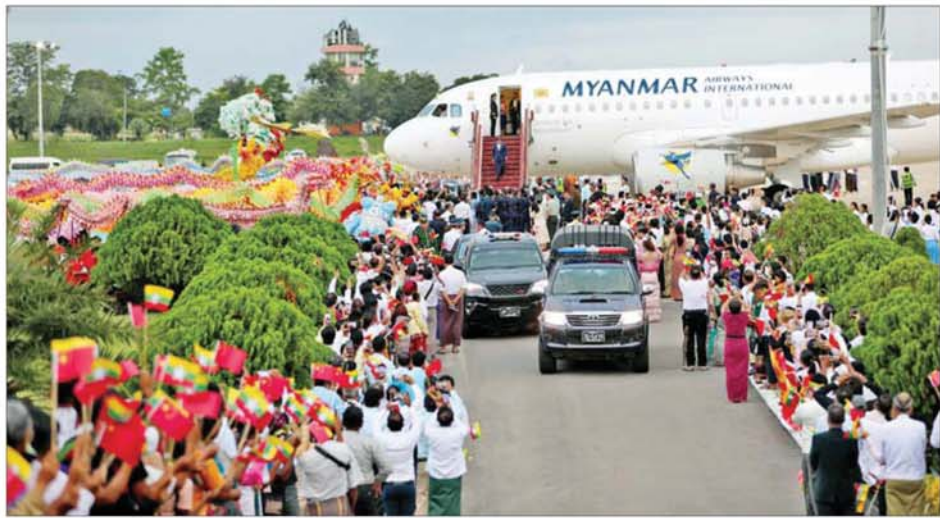
နိုင်ငံတော်သမ္မတ ဦးမင်းအောင်လှိုင် ဦးဆောင်သည့် မြန်မာအဆင့်မြင့် ကိုယ်စားလှယ်အဖွဲ့အား တရုတ် - မြန်မာ ချစ်ကြည်ရေးအသင်းမှ တာဝန်ရှိသူများ၊ အသင်းအဖွဲ့များအလိုက်မှ တာဝန်ရှိသူများ၊ ဒေသခံပြည်သူများနှင့် တိုင်းရင်းသားရိုးရာ အကအလှအဖွဲ့များက နေပြည်တော် လေဆိပ်၌ သောင်းသောင်းဖြဖြ ကြိုဆိုဂုဏ်ပြုနှုတ်ဆက်စဉ်။

အရာရှိကြီးများ၊ ဒုတိယဝန်ကြီး များနှင့် တာဝန်ရှိသူများ၊ စစ်ဘက်၊ နယ်ဘက်မှ တာဝန်ရှိသူများ ပြန်လည်လိုက်ပါလာကြသည်။ နိုင်ငံတော်သမ္မတသည် ခရီးစဉ် အတွင်း တရုတ်ပြည်သူ့ သမ္မတ နိုင်ငံသမ္မတနှင့်တွေ့ဆုံ၍ နှစ်နိုင်ငံ ဆွေးနွေးပွဲ ကျင်းပပြုလုပ်ခြင်း၊ တရုတ်နိုင်ငံ ဝန်ကြီးချုပ်နှင့် တရုတ် အမျိုးသားပြည်သူ့ ကွန်ဂရက် အမြဲတမ်းကော်မတီ ဥက္ကဋ္ဌတို့နှင့် တွေ့ဆုံခြင်းတို့အပြင် ပြည်နယ် အကြီးအကဲများနှင့် တွေ့ဆုံခြင်း၊ စီးပွားရေးကွန်ဗရင့် သို့ တက်ရောက်ခြင်းနှင့် အဆင့်မြင့် နည်းပညာသုံး ဓက်မှုလုပ်ငန်းများ သို့ သွားရောက်လေ့လာခြင်းတို့ကို ဆောင်ရွက်ခဲ့ပြီး မြန်မာနိုင်ငံနှင့် တရုတ်နိုင်ငံတို့အကြား ရှိရင်းစွဲ ဆွေးနွေးပေါက်ဖော်ဆောင်ဆဲရေးကို ပိုမိုတိုးတက်ခိုင်မာအောင်ဆောင် ရွက်နိုင်ခဲ့ကာ နှစ်နိုင်ငံအစိုးရနှင့် ပြည်သူများအကြား စီးပွားရေး၊ လုံခြုံရေးဆိုင်ရာများနှင့် ကဏ္ဍ ပေါင်းစုံတွင် ပူးပေါင်းဆောင်ရွက်မှု တိုးမြှင့်နိုင်ရေးဆိုင်ရာကိစ္စရပ်များကို ပိုမိုတိုးတက်ခိုင်မာအောင် နိုင်ငံ တော်နှင့်ပြည်သူတို့အတွက် အကျိုး ရှိစေနိုင်မည့် ဆွေးနွေးချက်များကို ဆွေးနွေးဆောင်ရွက်နိုင်ခဲ့သည်။ ညနေပိုင်းတွင် နိုင်ငံတော်သမ္မတ ဦးမင်းအောင်လှိုင် ဦးဆောင်သည့် မြန်မာအဆင့်မြင့် ကိုယ်စားလှယ် အဖွဲ့သည် နေပြည်တော်လေဆိပ် သို့ ပြန်လည်ရောက်ရှိကြရာ