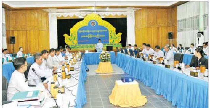
ဒုတိယသမ္မတ ဒေါ်နန်းနီနီအေး မြန်မာနိုင်ငံအမျိုးသားယဉ်ကျေးမှုပဟိုကော်မတီ နဝမအကြိမ် အစည်းအဝေးတွင် အမှာစကားပြောကြားစဉ်။

အစည်းအဝေးသို့ ဒုတိယဥက္ကဋ္ဌနှင့် ကော်မတီဝင်များဖြစ်ကြသည့် ပြည်ထောင်စုဝန်ကြီးများ၊ ဒုတိယဝန်ကြီးများ၊ ဌာနဆိုင်ရာအကြီးအကဲများ၊ ပညာရှင်များ၊ အသင်းအဖွဲ့ကိုယ်စားလှယ်များနှင့် တာဝန်ရှိသူများ တက်ရောက်ကြသည်။