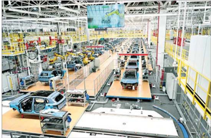
ဟန်ကျိုးမြို့ရှိ Zhejiang Leapmotor Technology Co., Ltd. ၌ မော်တော်ယာဉ်များ တပ်ဆင်ထုတ်လုပ်နေမှုကို တွေ့ရစဉ်။

ယင်းနောက် နိုင်ငံတော်သမ္မတသည် ကျွန်းကျွန်းချင်းရှိနည်းပညာကုမ္ပဏီ (Zhejiang Qingshi New Material Technology Co.,Ltd.) ၏ ဧည့်သည်တော်မှတ်တမ်းစာအုပ်တွင် အမှတ်တရ လက်မှတ်ရေးထိုးသည်။