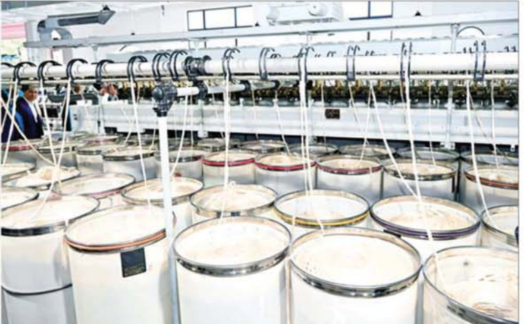
နိုင်ငံတော်သမ္မတ ဦးမင်းအောင်လှိုင် ဟန်ကျိုးမြို့ရှိ Zhejiang Qingshi New Material Technology Co., Ltd. ၌ ဝါးချည်မျှင်ထုတ်လုပ်ပုံ လုပ်ငန်းအဆင့်ဆင့်ကို ကြည့်ရှုလေ့လာစဉ်။