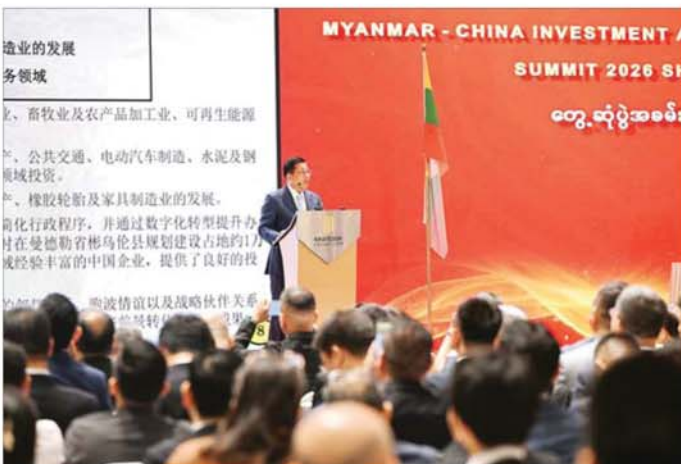
နိုင်ငံတော်သမ္မတ ဦးမင်းအောင်လှိုင် “ Myanmar-China Investment and Trade Networking Summit” (MCITP - 2026) Shanghai ဖွင့်ပွဲအခမ်းအနားတွင် အမှာစကားပြောကြားစဉ်။

“ Myanmar - China Investment and Trade Networking Summit” (MCITP - 2026) Shanghai တွင် မြန်မာ- တရုတ် ကုမ္ပဏီများမှ ပြခန်းပေါင်း ၃၅ ခန်းကို ကဏ္ဍစုံလင်စွာ ခင်းကျင်းပြသထားရာ နိုင်ငံတော်သမ္မတ ဦးမင်းအောင်လှိုင်က ပြခန်းများ ကို စိတ်ပါဝင်စားစွာ လိုက်လံကြည့်ရှုလေ့လာခဲ့ပြီး စီးပွားရေးလုပ်ငန်းရှင်များနှင့် တာဝန်ခံများ၏ ရှင်းလင်းတင်ပြမှုများအပေါ် သိရှိလိုသည်များ ပြန်လည်မေးမြန်းဆွေးနွေးသည်။ မြန်မာ-တရုတ် ရင်းနှီးမြှုပ်နှံမှုနှင့် ကုန်သွယ်မှုများ ပိုမိုတိုးတက် မြှင့်တင်ပေးရန် ရည်ရွယ်ကျင်းပမည့် အဆိုပါ ဆွေးနွေးပွဲသို့ မြန်မာ- တရုတ်စီးပွားရေးလုပ်ငန်း