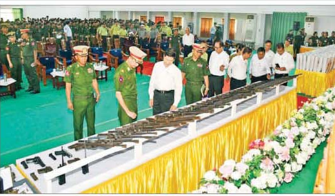
ဥပဒေဘောင်အတွင်း ပြန်လည်ဝင်ရောက်လာသူများက အပ်နှံသည့် လက်နက်၊ ခဲယမ်းများကို တာဝန်ရှိသူများ ကြည့်ရှုစစ်ဆေးစဉ်။

နေပြည်တော် ၇ ဇူလိုင် ၂၀၂၆ နိုင်ငံတော်အစိုးရသည် PDF အပါအဝင် အဖွဲ့အစည်းအမျိုးမျိုး အမည်ခံ၍ လက်နက်ကိုင် ဆန့်ကျင်လျက်ရှိသည့် အဖွဲ့အစည်းများအတွင်း ရောက်ရှိ နေသူများအား ဥပဒေဘောင်အတွင်းသို့ ပြန်လည်ဝင်ရောက်ရန် ဖိတ်ခေါ်၍ ဥပဒေဘောင်အတွင်း သို့ ပြန်လည်ဝင်ရောက်လာကြသူ များကိုလည်း လိုအပ်သည့် ကူညီပံ့ပိုးမှုများ ဆောင်ရွက်ပေးလျက် ရှိရာ နိုင်ငံတော်နှင့် တပ်မတော်၏ ငြိမ်းချမ်းရေးလုပ်ငန်းစဉ်များကို နားလည်သဘောပေါက်လာသည့် စာမျက်နှာ ၁၃ သို့ ။