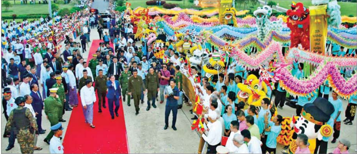
နိုင်ငံတော်သမ္မတ ဦးမင်းအောင်လှိုင်အား တရုတ်-မြန်မာ ချစ်ကြည်ရေးအသင်းမှ တာဝန်ရှိသူများနှင့် ဒေသခံပြည်သူများ၊ တရုတ်အကအလှအဖွဲ့များ၊ တိုင်းရင်းသားရိုးရာ အကအလှအဖွဲ့များက သောင်းသောင်းမြဖြူ ကြိုဆိုဂုဏ်ပြုနှုတ်ဆက်စဉ်။

ကြိုးပမ်းဆောင်လည်းကောင်း၊ ပြည်ထောင်စု သမ္မတ မြန်မာနိုင်ငံတော်အလံ၊ တရုတ်ပြည်သူ့သမ္မတ နိုင်ငံအလံတို့ကို ကိုင်ဆောင်ဝေဖွယ်ခမ်းကာ “တရုတ် - မြန်မာ ချစ်ကြည်ရေး (အခွန်ရှည်ပါစေ၊ အခွန်ရှည်ပါစေ)။ အမျိုး၊ ဘာသာ၊ သာသနာအတွက် ကြိုးပမ်းဆောင်ရွက်နေသည့် သမ္မတကြီး ဦးမင်းအောင်လှိုင် (ကျန်းမာပါစေ၊ ကျန်းမာပါစေ)။ ပြည်ထောင်စုသမ္မတ မြန်မာနိုင်ငံတော်သမ္မတကြီး ဦးမင်းအောင်လှိုင်