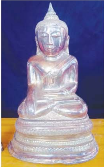
ရွှေဂူကြီးဘုရားမှ ရွှေဆင်းတုတော်။

ယနေ့ခေတ် နည်းပညာလို့ ပိုပြီးခိုင်မာအောင် သံကျွန်ကရစ်တို့ ဘီလပ်မြေတို့ မပါဘဲ ပြန်လည်တည်ဆောက်ဖယ်ဆိုတာ ဝမ်းသာစရာပါ။ ဒါကြောင့် စာရေးသူကလည်း မိမိတတ်စွမ်းတဲ့ဘက်ကနေ သမိုင်းဆိုင်ရာ အနုပညာဆိုင်ရာနဲ့ လက်တွေ့ အတွေ့အကြုံလေးတွေကို ပူးပေါင်းလို့ တစ်ထောင့်တစ်နေရာကနေ အကူအညီပေးလျက်ရှိနေပါတယ်။ အခုလောလောဆယ်တော့ ရန်ကုန်နည်းပညာတက္ကသိုလ်ကနေ ကျောင်းသားတစ်စု ခေါ်လာပြီး စေတီတော်အပြင် အခြားအရံစေတီများအားလုံးကို နည်းပညာဖြင့် မှတ်တမ်းတင်တာ၊ ပုံဆွဲပုံထုတ်တာတွေစရာ ပြီးသွားပြီလို့ သိရပါတယ်။ စာရေးသူမှတ်မိပါသေးတယ်။ ပုဂံဘုရားတွေ အကြီးအကျယ် ထိန်းသိမ်းနေတဲ့အချိန်ကပေါ့။ အကြီးအကဲတစ်ဦးကနေ စေတီငယ်တစ်ဆူကို ရှေးမူစနစ်အတိုင်း ပြန်လည်ထိန်းသိမ်းကြည့်ဖို့ ညွှန်ကြားခဲ့ပါတယ်။ ရှေးမူစနစ်ဆိုတာ အတော်များများ