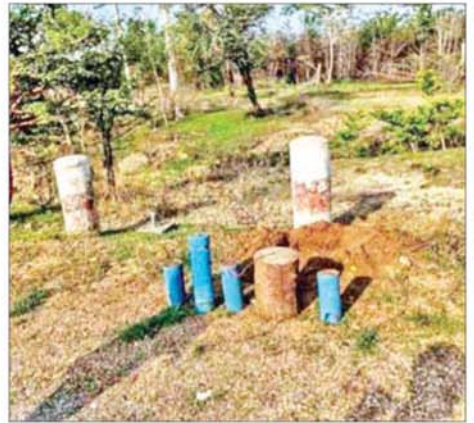
PDF အမည်ခံ အကြမ်းဖက်သောင်းကျန်းသူများ ထောင်ထားသည့် လက်လုပ်မိုင်းများအား တွေ့ရစဉ်။

လုံခြုံရေးတပ်ဖွဲ့ဝင်များမှ ထိုသို့ လုပ်ဆောင်လျက်ရှိရာ မန္တလေးတိုင်းဒေသကြီး နှားထိုးကြီး မြို့နယ်ရှိ နှားထိုးကြီး-ပြင်စည် ကားလမ်းမကြီးတစ်လျှောက်တွင် PDF အမည်ခံ အကြမ်းဖက်သမားများက မိုင်းထောင်ခြင်းများ ဆောင်ရွက်နေကြောင်း တာဝန်သိ ပြည်သူများ၏ သတင်းပေးပို့ချက် အရ ယနေ့နံနက်ပိုင်းတွင် လုံခြုံရေး ပူးပေါင်းအဖွဲ့များက နှားထိုးကြီး မြို့နယ်အတွင်း နယ်မြေရှင်းလင်းခြင်းလုပ်ငန်းများ ဆောင်ရွက်ခဲ့ရာ ဖက်ဆူးကျေးရွာနှင့် ရှောက်တောဝ ကျေးရွာအကြား ကားလမ်းဘေး ဝဲ/ယာဉ် မိုင်းရှင်းလင်းခြင်းများ ဆောင်ရွက်ခဲ့ရာ အများပြည်သူ ထိခိုက်ဒဏ်ရာရရှိစေရန် ရည်ရွယ်၍ PDF အမည်ခံ အကြမ်းဖက်အဖွဲ့ ထောင်ထားသည့် PVC ဝိုက်ဖြင့် ပြုလုပ်ထားသော အချင်း ၆ လက်မခန့်၊ အလျား ၁ ပေခန့်ရှိ လက်လုပ်မိုင်း နှစ်လုံး၊ အချင်း ၆ လက်မခန့်၊ အလျား ၁ ပေခန့်ရှိ လက်လုပ်မိုင်း သုံးလုံး၊ အရှည် ၁ ပေခွဲခန့်ရှိ လက်လုပ်မိုင်း တစ်လုံး နှင့် သံပိုက်ဖြင့် ပြုလုပ်ထားသော