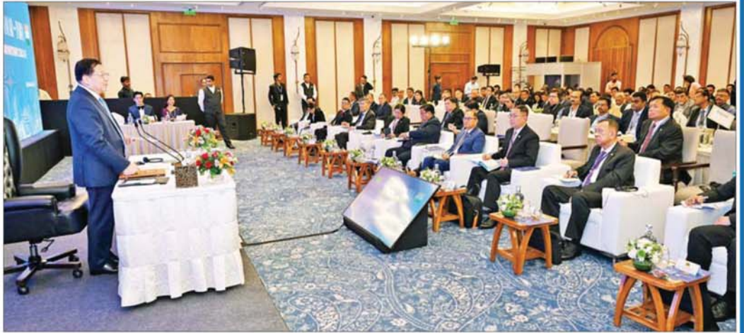
နိုင်ငံတော်သမ္မတ ဦးမင်းအောင်လှိုင် မေ ၃၁ ရက်က ကျင်းပသည့် မြန်မာ-အိန္ဒိယ ကုန်သွယ်မှုနှင့် ရင်းနှီးမြှုပ်နှံမှုဆိုင်ရာ ဆွေးနွေးပွဲအခမ်းအနားတွင် ဆွေးနွေးပြောကြားစဉ်။

မြန်မာ-အိန္ဒိယကုန်သွယ်မှုနှင့် ရင်းနှီးမြှုပ်နှံမှု ဆိုင်ရာဆွေးနွေးပွဲကို ပြည်ထောင်စုသမ္မတမြန်မာ နိုင်ငံတော် ကုန်သည်များနှင့် စက်မှုလက်မှုလုပ်ငန်း ရှင်များအသင်းချုပ် (UMFCCI) နာယကနဲ့ အဖွဲ့ဝင် များ၊ မြန်မာ-အိန္ဒိယ ချစ်ကြည်ရေးအသင်းဥက္ကဋ္ဌနဲ့ အဖွဲ့ဝင်များ၊ အိန္ဒိယနိုင်ငံ ကုန်သည်များနှင့် စက်မှု အသင်းချုပ်(FICCI) အတွင်းရေးမှူးချုပ်၊ အိန္ဒိယ စက်မှုလက်မှုလုပ်ငန်းရှင်များအဖွဲ့ချုပ် (CII) မှ Senior Advisor တို့ အပါအဝင် မြန်မာ-အိန္ဒိယ နှစ်နိုင်ငံ စီးပွားရေးလုပ်ငန်းရှင်များနဲ့ ဖိတ်ကြား ထားတဲ့ ဧည့်သည်တော်များ စုံလင်စွာတက်ရောက် ခဲ့ပြီး နှစ်ဖက်အပြန်အလှန် ဆွေးနွေးမှုတွေကို