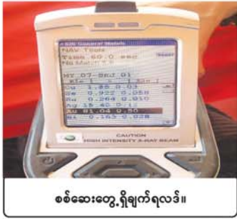
စစ်ဆေးတွေ့ရှိချက်ရလဒ်။

ဒီတော့ စစ်ဆေးပြီး မှတ်တမ်းတင်တော့လည်း ရွှေဟုယူဆရသော သတ္တုလိုပဲ ရေးခဲ့ကြတာပေါ့။ ဂေါပကအဖွဲ့ အားလုံးကလည်း ကျွန်တော်တို့လိုပဲ ရွှေမဟုတ်ဘူးဆိုတော့ ပေါ့ပေါ့ဆဆ သာမန်သံဆန်ခါတပ် အခန်းထဲမှာ ဒီအတိုင်းပဲ သိမ်းထားခဲ့တာပေါ့။ ပတ္တမြားမှန်ရဲ့ နှံနက်ဘုန်းလို့ ပြောရမလား။ ဘုရားဆင်းတုတော်ရဲ့ ဘုန်းတန်ခိုးလို့ ပြောရမလားဘဲ။ ငလျင်ကြီးအပြီး ကိုးလတင်းတင်းပြည့်တဲ့နေ့ ၂၈-၁၂-၂၀၂၅ ရက်မှာ ထိုင်းနိုင်ငံ ချူလာလောင်ကွန်း တက္ကသိုလ်က ပညာရှင်တစ်ဖွဲ့ မြန်မာနိုင်ငံကို ရောက်လာပါ