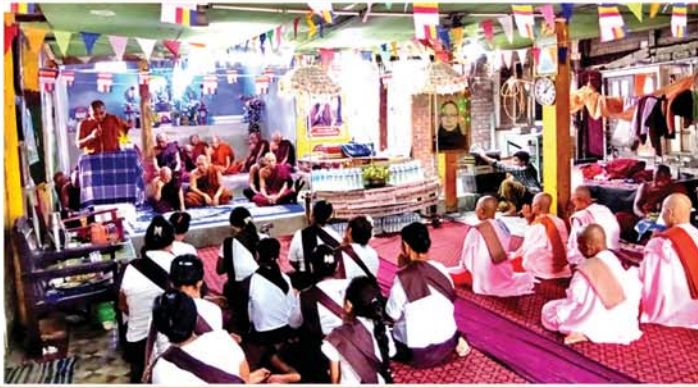
(၂၁)ကြိမ်မြောက် အသံမစဲမဟာပဋ္ဌာန်းရွတ်ဖတ်ပူဇော်ပွဲ ဖွင့်ပွဲ ကျင်းပ

မန္တလေး ဇွန် ၁ မန္တလေး၊ ပြည်ကြီးတံခွန် မြို့နယ်၊ ချမ်းမြသာယာရပ်ကွက်၊ မဟာဝိဇိတာရာမတိုက်၊ ဝိနယ ဓမ္မရိပ်သာစိန့်ယန်းမြိုင်ကျောင်းတွင် (၂၁)ကြိမ်မြောက် အသံမစဲမဟာပဋ္ဌာန်းရွတ်ဖတ်ပူဇော်ပွဲဖွင့်ပွဲကို ယမန်နေ့ မွန်းလွဲ ၂ နာရီက အဆိုပါမဟာပဋ္ဌာန်းရွတ်ဖတ်ပူဇော် မည့်နေရာ၌ ကျင်းပသည်။ ရှေးဦးစွာ အခမ်းအနားကို နမောတာသာသနာကြီးရွတ်ဆိုဘုရား ကန်တော့၌ ဖွင့်လှစ်ကြပြီး ကုမ္ဘာ