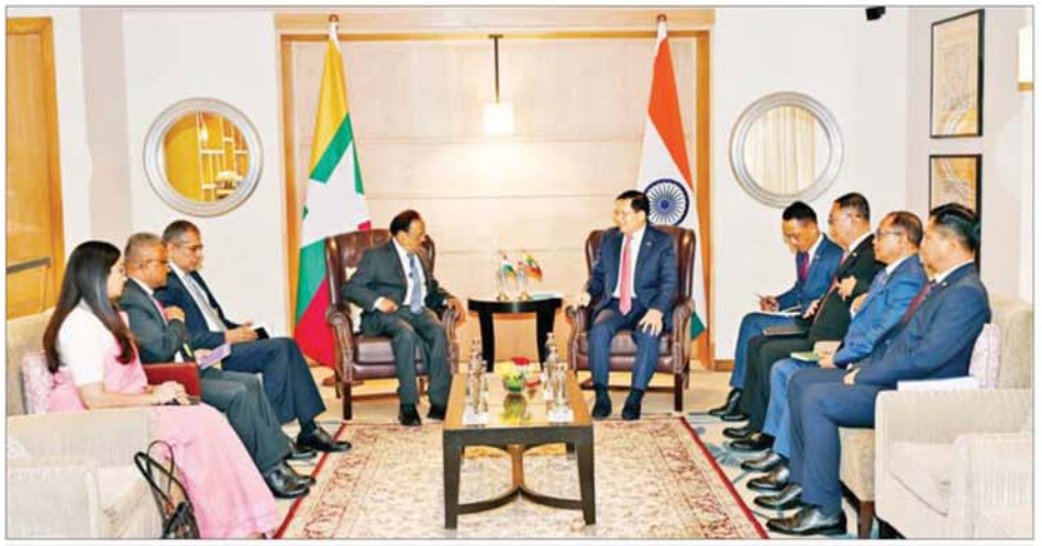
ပြည်ထောင်စုသမ္မတမြန်မာနိုင်ငံတော် နိုင်ငံတော်သမ္မတ ဦးမင်းအောင်လှိုင်နှင့် အိန္ဒိယနိုင်ငံ အမျိုးသားလုံခြုံရေးဆိုင်ရာ အကြံပေး ပုဂ္ဂိုလ် H.E. Mr. Ajit Doval တို့ တွေ့ဆုံဆွေးနွေးစဉ်။

ပေါင်းစုံ၌ ပူးပေါင်းဆောင်ရွက်မှု များ ဆက်လက်မြှင့်တင် ဆောင်ရွက်သွားမည့်ကိစ္စရပ်များ နှင့် ပတ်သက်၍ ရင်းနှီးပွင့်လင်းစွာ အမြင်ချင်းဖလှယ် ဆွေးနွေးခဲ့ကြ သည်။ အဆိုပါ တွေ့ဆုံပွဲတွင် နိုင်ငံတော် သမ္မတနှင့်အတူ ခရီးစဉ် လိုက်ပါသွားသည့် ပြည်ထောင်စု ဝန်ကြီးများ ဖြစ်ကြသည့် ဦးခင်မောင်ရီ၊ ဦးတင်မောင်ဆွေနှင့် တာဝန်ရှိ သူများ တက်ရောက်ကြပြီး အိန္ဒိယနိုင်ငံ အမျိုးသားလုံခြုံရေး ဆိုင်ရာ အကြံပေးပုဂ္ဂိုလ်နှင့်အတူ မြန်မာနိုင်ငံဆိုင်ရာ အိန္ဒိယနိုင်ငံ သံအမတ်ကြီး H.E. Shri Abhay Thakur နှင့် တာဝန်ရှိသူများ တက်ရောက်ခဲ့ကြကြောင်း သိရ သည်။ သတင်းစဉ်