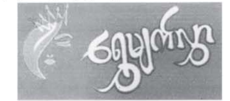
မှတ်ပုံတင်စာချုပ်အမှတ် (၁၃၄၄/ ၂၀၂၃)