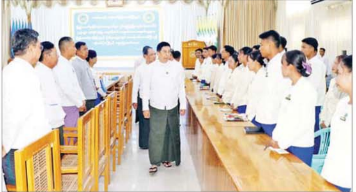
ကုန်ထုတ်လုပ်မှု မြှင့်တင်ရေး ဆောင်ရွက်ကြရန် လိုအပ် တင်ပြချက်များကို ပေါင်းစပ် လုပ်ငန်းများနှင့် MSME လုပ်ငန်း ကြောင်း တိုက်တွန်းမှာကြားပြီး ဖြည့်ဆည်း ဆောင်ရွက်ပေးခဲ့ များကို စေတနာထား ကြိုးပမ်း ကျောင်းဆင်း ဝန်ထမ်းများ၏ ကြောင်း သိရသည်။ သတင်းစဉ်

နေပြည်တော် ဇွန် ၁ ပြည်ထောင်စု တိုင်းရင်းသား လူငယ်များ စွမ်းရည်ဖွံ့ဖြိုးရေး ဒီဂရီကောလိပ် (ရန်ကုန်နှင့် စစ်ကိုင်း) တို့မှ ၂၀၂၆ ခုနှစ် မေလ တွင် ကျောင်းဆင်းသည့် ကျောင်း သားကျောင်းသူ ၆၁ ဦးနှင့်တွေ့ဆုံ ပွဲအခမ်းအနားကို ယနေ့နံနက် ပိုင်းက ပြည်ထောင်စုဝန်ကြီးရုံး အစည်းအဝေးခန်းမ၌ ကျင်းပရာ သမဝါယမနှင့် ကျေးလက်ဖွံ့ဖြိုး ရေးဝန်ကြီးဌာန ပြည်ထောင်စု ဝန်ကြီး ဦးမျိုးဇော်သိမ်း၊ ဒုတိယ ဝန်ကြီး ဦးသိုက်စိုးနှင့် တာဝန်ရှိ သူများ တက်ရောက်ကြသည်။ အခမ်းအနားတွင်ပြည်ထောင်စု ဝန်ကြီးက ဝန်ကြီးဌာန၏ မူဝါဒ၊