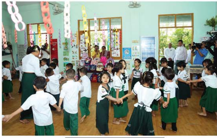
မန္တလေး၊ ဇွန် ၁

၂၀၂၆-၂၀၂၇ ပညာသင်နှစ် အခြေခံပညာကျောင်းများကို နိုင်ငံတစ်ဝန်းရှိ အခြေခံပညာကျောင်းများ၊ ဘုန်းတော်ကြီးသင်ပညာရေးကျောင်းများနှင့် ကိုယ်ပိုင်ကျောင်းများတွင် ဇွန် ၁ ရက်မှ စတင်၍ ဖွင့်လှစ်ပြီး ကျောင်းသား၊ ကျောင်းသူများ အေးချမ်းပျော်ရွှင်စွာဖြင့် တက်ရောက်သင်ကြားလျက်ရှိရာ မန္တလေးတိုင်းဒေသကြီး ဝန်ကြီးချုပ် ဦးမျိုးအောင်နှင့်အဖွဲ့သည် တာဝန်ရှိသူများလိုက်ပါပြီး ယနေ့နံနက်ပိုင်းက ချမ်းအေးသာစံမြို့နယ်ရှိ အမှတ်(၁၆)အခြေခံပညာအထက်တန်းကျောင်း၊ အောင်မြေသာစံမြို့နယ်ရှိ အမှတ်(၈)အခြေခံပညာအထက်တန်းကျောင်း၊ အမှတ်(၄)အခြေခံပညာအထက်တန်းကျောင်းနှင့် အမှတ်(၁)အခြေခံပညာအထက်တန်းကျောင်းများသို့ သွားရောက်ကြည့်ရှုခဲ့ကြသည်။