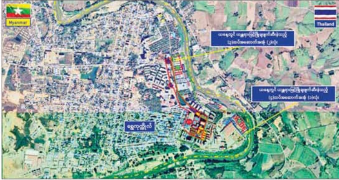
ကရင်ပြည်နယ် မြဝတီခရိုင် ရွှေကုက္ကိုလ်ဒေသရှိ အွန်လိုင်းလောင်းကစားလုပ်ငန်း လုပ်ကိုင်ခဲ့သည့် တရားမဝင် အဆောက်အအုံများအား ဖောက်ခွဲဖျက်ဆီးမှု။

လုံခြုံရေးတပ်ဖွဲ့ဝင်များမှ ထိုသို့ လုပ်ဆောင်လျက်ရှိရာ မန္တလေးတိုင်းဒေသကြီး နှားထိုးကြီး မြို့နယ်ရှိ နှားထိုးကြီး-ပြင်စည် ကားလမ်းမကြီးတစ်လျှောက်တွင် PDF အမည်ခံ အကြမ်းဖက်သမားများက မိုင်းထောင်ခြင်းများ ဆောင်ရွက်နေကြောင်း တာဝန်သိ ပြည်သူများ၏ သတင်းပေးပို့ချက် အရ ယနေ့နံနက်ပိုင်းတွင် လုံခြုံရေး ပူးပေါင်းအဖွဲ့များက နှားထိုးကြီး မြို့နယ်အတွင်း နယ်မြေရှင်းလင်းခြင်းလုပ်ငန်းများ ဆောင်ရွက်ခဲ့ရာ ဖက်ဆူးကျေးရွာနှင့် ရှောက်တောဝ ကျေးရွာအကြား ကားလမ်းဘေး ဝဲ/ယာဉ် မိုင်းရှင်းလင်းခြင်းများ ဆောင်ရွက်ခဲ့ရာ အများပြည်သူ ထိခိုက်ဒဏ်ရာရရှိစေရန် ရည်ရွယ်၍ PDF အမည်ခံ အကြမ်းဖက်အဖွဲ့ ထောင်ထားသည့် PVC ဝိုက်ဖြင့် ပြုလုပ်ထားသော အချင်း ၆ လက်မခန့်၊ အလျား ၁ ပေခန့်ရှိ လက်လုပ်မိုင်း နှစ်လုံး၊ အချင်း ၆ လက်မခန့်၊ အလျား ၁ ပေခန့်ရှိ လက်လုပ်မိုင်း သုံးလုံး၊ အရှည် ၁ ပေခွဲခန့်ရှိ လက်လုပ်မိုင်း တစ်လုံး နှင့် သံပိုက်ဖြင့် ပြုလုပ်ထားသော