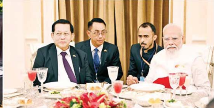
ပြည်ထောင်စုသမ္မတမြန်မာနိုင်ငံတော် နိုင်ငံတော်သမ္မတ ဦးမင်းအောင်လှိုင် အိန္ဒိယသမ္မတနိုင်ငံဝန်ကြီးချုပ် H.E. Shri Narendra Modi က တည်ခင်းစဉ်သည့် ဂုဏ်ပြုနေ့လယ်စာစားပွဲတွင် အိန္ဒိယနိုင်ငံ ယဉ်ကျေးမှုအဖွဲ့က နှစ်နိုင်ငံရိုးရာတေးသီချင်းများဖြင့် တီးမှုတ်ဖျော်ဖြေတင်ဆက်နေမှုကို ကြည့်ရှုအားပေးစဉ်။