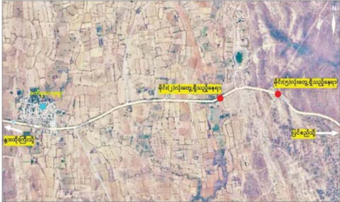
လုံခြုံရေးတပ်ဖွဲ့ဝင်များက နွားထိုးကြီးမြို့နယ် နွားထိုးကြီး-ပြင်စည်ကားလမ်းဘေး၌ PDF အမည်ခံ အကြမ်းဖက်သောင်းကျန်းသူများထောင်ထားသည့် လက်လုပ်မိုင်း ခုနှစ်လုံးအား ဖယ်ရှားရှင်းလင်းနိုင်ခဲ့သည့် နေရာပြပုံ။

နေပြည်တော် ၉ နံနက် ၁ PDF အမည်ခံ အကြမ်းဖက်သောင်းကျန်းသူများသည် အများပြည်သူ သွားလာအသုံးပြုလျက်ရှိသည့် လမ်း၊ တံတားများတွင် ဒေသခံပြည်သူများနှင့် ခရီးသွားပြည်သူများ ထိခိုက်ဒဏ်ရာ ရရှိစေရန်၊ လမ်းပန်းဆက်သွယ်ရေး ထိခိုက်ပျက်ပြားစေပြီး ဒေသတွင်း ဖွံ့ဖြိုးတိုးတက်မှုကို နှောင့်ယှက်ဖျက်ဆီးရန်ရည်ရွယ်၍ ဖောက်ခွဲရေးပစ္စည်းကိရိယာများ အသုံးပြုကာ မိုင်းထောင်ခြင်း၊ ဖောက်ခွဲဖျက်ဆီးခြင်းများကို ဆင်ခြင်တုံတရားကင်းမဲ့စွာ ပြုလုပ်လျက်ရှိသည်။ စာမျက်နှာ ၉ သို့ ။