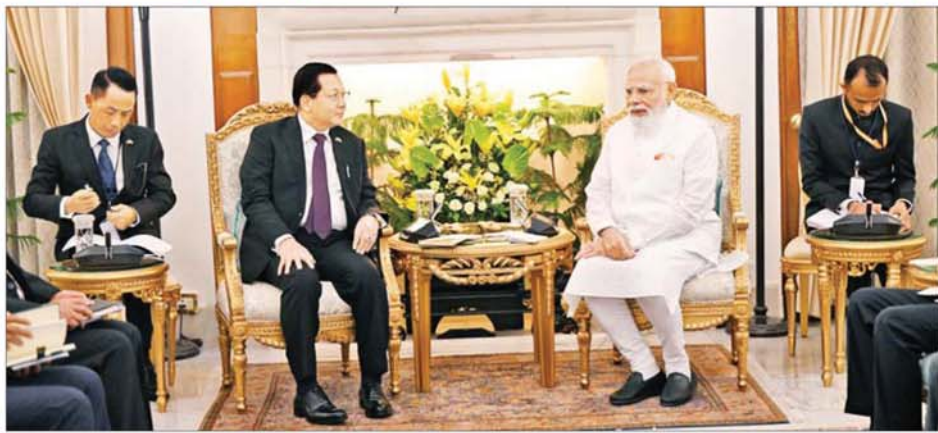
ပြည်ထောင်စုသမ္မတမြန်မာနိုင်ငံတော် နိုင်ငံတော်သမ္မတ ဦးမင်းအောင်လှိုင်နှင့် အိန္ဒိယသမ္မတနိုင်ငံဝန်ကြီးချုပ် H.E. Shri Narendra Modi တို့ တွေ့ဆုံဆွေးနွေးစဉ်။

နေပြည်တော် ၇ ဇူလိုင် ၂၀၂၆ - အိန္ဒိယသမ္မတနိုင်ငံ ဝန်ကြီးချုပ် H.E. Shri Narendra Modi ၏ ဖိတ်ကြားချက်အရ အိန္ဒိယနိုင်ငံ၌ တရားဝင်ခရီးစဉ် ရောက်ရှိနေသော ပြည်ထောင်စုသမ္မတမြန်မာနိုင်ငံတော် နိုင်ငံတော်သမ္မတ ဦးမင်းအောင်လှိုင်သည် ယနေ့နံနက်ပိုင်းတွင် အိန္ဒိယနိုင်ငံဝန်ကြီးချုပ်ရုံး (Hyderabad House)၌ အိန္ဒိယနိုင်ငံဝန်ကြီးချုပ် H.E. Shri Narendra Modi နှင့် တွေ့ဆုံဆွေးနွေးသည်။