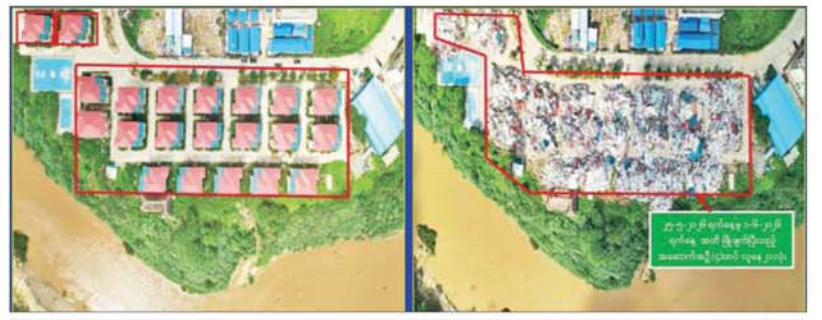
ကရင်ပြည်နယ် မြဝတီခရိုင် ရွှေကုက္ကိုလ်ဒေသ၌ တရားမဝင်အွန်လိုင်းလောင်းကစားလုပ်ငန်းများ လုပ်ကိုင်ခဲ့သည့် တရားမဝင်အဆောက်အအုံများအား မဖြိုဖျက်မီနှင့် ဖြိုဖျက်ပြီးနောက် တွေ့ရစဉ်။

မပြုနိုင်စေရေးတို့အတွက် အပြီးတိုင်ဖြိုချဖျက်ဆီးခြင်းများကို ဆောင်ရွက်လျက်ရှိရာ ယနေ့တွင် ရွှေကုက္ကိုလ်နယ်မြေအတွင်းရှိ တရားမဝင် လေးထပ်လူနေအဆောက်အအုံ တစ်လုံးနှင့် သုံးထပ်လူနေအဆောက်အအုံ နှစ်လုံးအား ထပ်မံ၍ စနစ်တကျဖြိုချဖျက်ဆီးခဲ့ကြောင်း သိရသည်။ ရွှေကုက္ကိုလ်နယ်မြေအတွင်း၌ အွန်လိုင်းလိမ်လည် လောင်းကစားလုပ်ငန်းများ ကျူးလွန်ရာတွင် အသုံးပြုသည့် အဆောက်အအုံ ၇၇ လုံးအနက် ယာဉ်ယန္တရားများဖြင့် ဖြိုချဖျက်ဆီးမည့် အဆောက်အအုံ ၅၇ လုံးနှင့် ဖောက်ခွဲ၍ ဖျက်ဆီးမည့် အဆောက်အအုံ စာမျက်နှာ ၉ သို့ ။