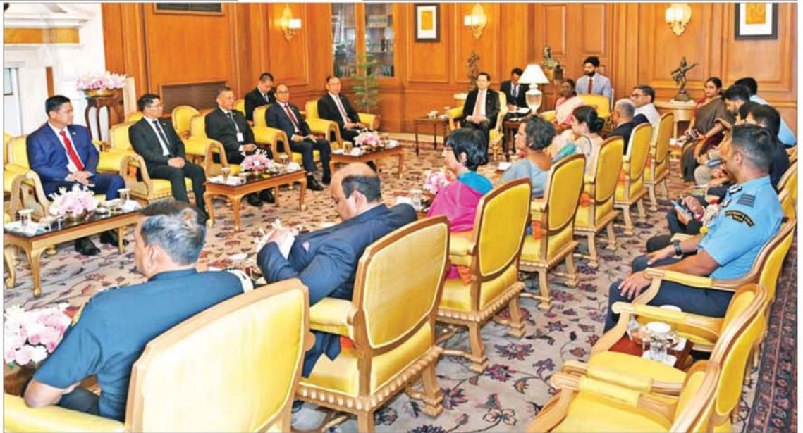
ပြည်ထောင်စုသမ္မတမြန်မာနိုင်ငံတော် နိုင်ငံတော်သမ္မတ ဦးမင်းအောင်လှိုင်နှင့် အိန္ဒိယသမ္မတနိုင်ငံသမ္မတ H.E. Smt. Droupadi Murmu တို့ တွေ့ဆုံဆွေးနွေးစဉ်။ ရှက်မှူးများ ဆက်လက်တိုးမြှင့်ဆောင်ရွက် ရင်းနှီးပွင့်လင်းစွာဖြင့် အမြင်ချင်းဖလှယ် ထိုနောက် နိုင်ငံတော်သမ္မတသည် တမ်းစာအုပ်တွင်မှတ်တမ်းတင် လက်မှတ် သွားမည့် အခြေအနေများနှင့်ပတ်သက်၍ ဆွေးနွေးခဲ့ကြသည်။ သမ္မတ အိမ်တော်ညော်သည်တော်မှတ် ရေးထိုးခဲ့ကြောင်း သိရသည်။ သတင်းစဉ်

ထိုသို့တွေ့ဆုံရာတွင် မြန်မာနိုင်ငံ၏ နိုင်ငံရေး ဖြစ်ပေါ်ပြောင်းလဲမှုများနှင့် လက်ရှိ ရွေးကောက်ပွဲအစိုးရ၏ နိုင်ငံ ဖွံ့ဖြိုးတိုးတက်ရေးအပေါ် အိန္ဒိယနိုင်ငံ အနေဖြင့် အပြည့်အဝ ထောက်ခံအားပေး လျက်ရှိမှု၊ နှစ်နိုင်ငံအကြား ပူးပေါင်း ဆောင်ရွက်လျက်ရှိသည့် စီမံကိန်းများ သတ်မှတ်ကာလအတွင်း ပြီးစီးရေး ဆောင်ရွက်သွားမည့် အခြေအနေများ၊ နှစ်နိုင်ငံကုန်သွယ်မှုနှင့် ရင်းနှီးမြှုပ်နှံမှုများ တိုးတက်စေရေး ဆက်လက်ဆောင်ရွက် သွားမည့်အခြေအနေများ၊ နှစ်နိုင်ငံအကြား ယဉ်ကျေးမှုအမွေအနှစ်များ အပြန်အလှန် ထိန်းသိမ်းရေး၊ ခရီးသွားကဏ္ဍဖြင့်တင်ရေး ဆက်လက်ဆောင်ရွက်သွားမည့် အခြေ အနေများ၊ နှစ်နိုင်ငံအကြား မိတ်ဆွေကောင်း မိတ်ဆွေရင်း မိတ်ဆွေကောင်းနိုင်ငံများဖြစ်မှုအခြေအနေ များ၊ အမျိုးသမီးများ ကဏ္ဍဖြင့်တင်ရေး အတွက် အတွေ့အကြုံများမျှဝေနိုင်သည့် အခြေအနေများ၊ နှစ်နိုင်ငံအကြား ချစ်ကြည်ရင်းနှီးမှုနှင့် ပူးပေါင်းဆောင်