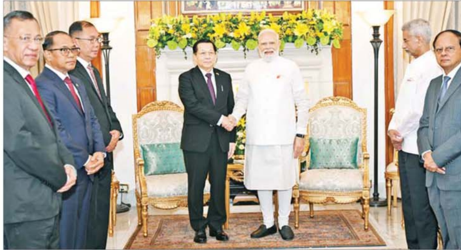
ပြည်ထောင်စုသမ္မတမြန်မာနိုင်ငံတော် နိုင်ငံတော်သမ္မတ ဦးမင်းအောင်လှိုင်နှင့် အိန္ဒိယသမ္မတနိုင်ငံဝန်ကြီးချုပ် H.E. Shri Narendra Modi တို့ ရင်းရင်းနှီးနှီးနှုတ်ဆက်စဉ်။