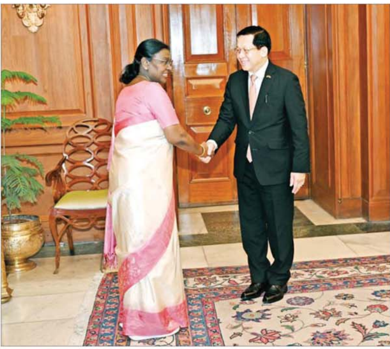
ပြည်ထောင်စုသမ္မတမြန်မာနိုင်ငံတော် နိုင်ငံတော်သမ္မတ ဦးမင်းအောင်လှိုင်အား အိန္ဒိယသမ္မတနိုင်ငံသမ္မတ H.E. Smt. Droupadi Murmu က ရင်းရင်းနှီးနှီးကြိုဆိုနှုတ်ဆက်စဉ်။

နေပြည်တော် ၇ နံနက် ၁ အိန္ဒိယသမ္မတနိုင်ငံ၌ တရားဝင် ခရီးစဉ် ရောက်ရှိနေသော ပြည်ထောင်စုသမ္မတ မြန်မာနိုင်ငံတော် နိုင်ငံတော်သမ္မတ ဦးမင်းအောင်လှိုင်သည် ယနေ့ညနေ ပိုင်းတွင် အိန္ဒိယသမ္မတနိုင်ငံသမ္မတ H.E. Smt. Droupadi Murmu နှင့် ရင်းရင်းနှီးနှီး သမ္မတအိမ်တော် ဧည့်ခန်းမ၌ တွေ့ဆုံဆွေးနွေးသည်။