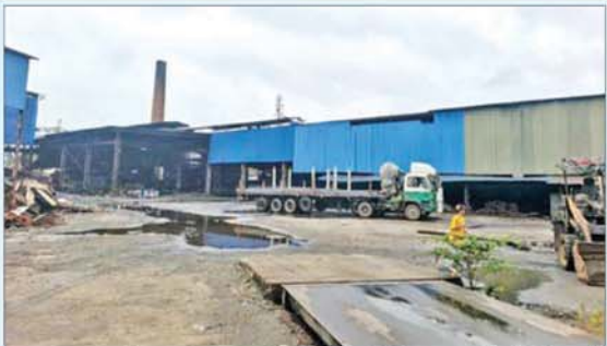
တရားမဝင်ဓာတ်အားရယူသုံးစွဲထားသည့် မြောင်းတကာစက်မှုဇုန် မြေကွက်အမှတ်(၅၂/၅၃)ရှိ ZON TAI STEEL Co.,Ltd သံရည်ကျိုစက်ရုံကို တွေ့ရစဉ်။

နေပြည်တော် ဇွန် ၁၄ လျှပ်စစ်နှင့် စွမ်းအင်ဝန်ကြီးဌာန ရန်ကုန် လျှပ်စစ်ဓာတ်အားပေးရေး ကော်ပိုရေးရှင်းအနေဖြင့် မသမာသော နည်းဖြင့် လျှပ်စစ်ဓာတ်အားရယူသုံးစွဲနေမှုများကို စောင့်ကြည့်စစ်ဆေးဖော်ထုတ် လျက်ရှိပြီး မသကာဖွယ်တွေ့ရှိရသည့် မြောင်းတကာစက်မှုဇုန် မြေကွက်အမှတ် (၅၂/၅၃) ရှိ ZON TAI STEEL Co.,Ltd သံရည်ကျိုစက်ရုံကို ဝင်ရောက်စစ်ဆေးရာ မိတာအတွင်း မသမာသောနည်းဖြင့် ဖွင့်၍ ပြုပြင်ပြီး ဓာတ်အားခိုးယူသုံးစွဲထားကြောင်း စစ်ဆေးတွေ့ရှိခဲ့သည်။