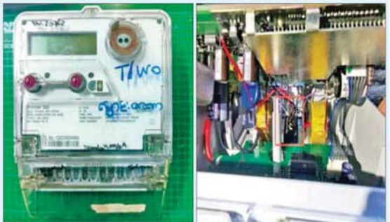
မိတာအတွင်း မသမာသောနည်းဖြင့် ပြုပြင်ထားသည့် မှတ်တမ်းဓာတ်ပုံများကို တွေ့ရစဉ်။

အရေးယူဆောင်ရွက် ယင်းသို့ မသမာမှုဖြစ်စဉ်ကြောင့် နိုင်ငံတော်အနေဖြင့် လျှပ်စစ်ဓာတ်အား ယူနစ် ၅၀၆၈၀၀ အတွက် ငွေကျပ်သန်း ၄၅၀၀ ကျော် ဆုံးရှုံးနစ်နာခဲ့သဖြင့် လျှပ်စစ်မိတာအား ချက်ချင်းပိတ်သိမ်း