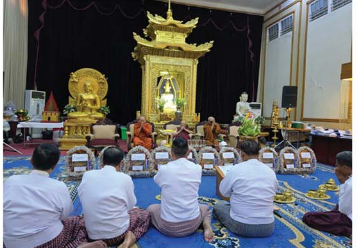
ရေစက်သွန်းချအမျှပေးဝေကြပြီး ဗုဒ္ဓသာသနံ စိရံ တိဋ္ဌဘု သုံးကြိမ်ရွတ်ဆို ဆုတောင်းကြ၍ ဩဝါဒခံယူပွဲ ကို အောင်မြင်စွာပြီးစီးခဲ့ကြောင်း သိရသည်။