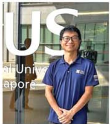
စင်ကာပူ ဇွန် ၁၄ စင်ကာပူအမျိုးသားတက္က သိုလ်မှ သုတေသနပညာရှင် တစ်ဦးသည် မိုးခေါင်ရှေးရာမှနှင့်

ဆက်စပ်သော ရေပြတ်လပ်မှုများ ကို လျှော့ချရန်အတွက် ရေကြီး ရေလုံမှုများမှ ရေကိုစုဆောင်းပြီး ဖြန့်လှည့်အသုံးပြုမည့် နည်းလမ်း များကို ဖော်ထုတ်နိုင်ခဲ့သော ကြောင့် ပထမဆုံးအကြိမ်အဖြစ် ဖေးအပ်သည့် ကမ္ဘာ့ရာသီဥတု သုတေသနဆုကို ဆွတ်ခူးရရှိခဲ့ ကြောင်း စီအင်နီအေသတင်း ဌာနက ဖော်ပြသည်။ စင်ကာပူအမျိုးသား တက္က သိုလ်၏ မြို့ပြနှင့် ပတ်ဝန်းကျင်