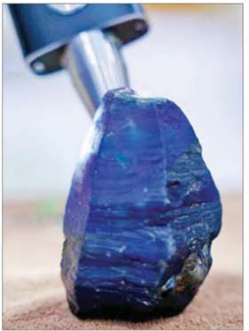
မြန်မာနိုင်ငံ မိုးကုတ်ရတနာမြေမှ ရှာဖွေတွေ့ရှိသည့် လှေခြားလှပပြီး အရွယ်အစားကြီးမားသော နီလာအရိုင်းတုံးကြီးနှင့် နီလာပုံဆောင်ခဲတို့ကို တွေ့ရစဉ်။

သောကြောင့် ရှာဖွေတွေ့ရှိရန် ခက်ခဲပြီးရှားပါးကြောင်း၊ အပြာရောင်ဖြစ်ပြီး အလင်းပေါက်မှု အနေဖြင့် အလင်းမှန်အဆင့်ရှိပြီး ပြုပြင်ထားခြင်းမရှိသော သဘာဝ ကြီးမြစ်ကြောင်း သိရသည်။ သတင်းစဉ်