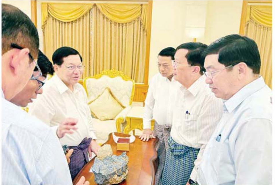
နိုင်ငံတော်သမ္မတ ဦးမင်းအောင်လှိုင် မြန်မာနိုင်ငံ မိုးကုတ်ရတနာမြေမှ ရှာဖွေတွေ့ရှိသည့် ထူးခြားလှပပြီး အရွယ်အစားကြီးမားသည့် နီလာအရိုင်းတုံးကြီးအား ကြည့်ရှုစဉ်။