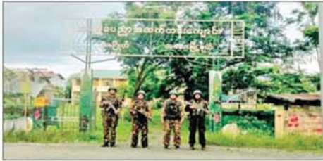
တပ်မတော်စစ်ကြောင်းများက ကလေး-တမူးလမ်းကြောင်း ပေါ်ရှိ ရာဇဂြိုဟ်ကျေးရွာအား ပြန်လည်ထိန်းချုပ်နိုင်မှုကို တွေ့ရစဉ်။

ကလေး-တမူးလမ်းကြောင်းမှ ရာဇဂြိုဟ် ရေလှောင်တံခါးအား ပြန်လည် ထိန်းချုပ်နိုင်ခဲ့ခြင်းကြောင့် ဒေသနှင့် ဒေသတွင်း နေထိုင်ကြသည့် ပြည်သူလူထု၏ လူမှု စီးပွားဘဝ ပျက်စီးခြင်းများမှ ကာကွယ်ပေးနိုင်ခဲ့ပြီး ဒေသတွင်း တည်ငြိမ်အေးချမ်းရေး လုပ်ငန်းများကို လုပ်ဆောင်နိုင်တော့မည် အပြင် ရေထိန်းတံခါးများအား ပုံမှန်ချိန်အတိုင်း စနစ်တကျ ဖွင့်/ပိတ်ခြင်း၊ ရေထိန်းရေလှောင်ခြင်း၊ ရာသီအလိုက် စနစ်တကျရေးပေး ဝေခြင်း၊ ရေလွှတ်ခြင်းများ ဆောင်ရွက်ပြီး ဒေသခံပြည်သူများအတွက် လျှပ်စစ်မီးများ၊ သောက်သုံးရေများ၊ စိုက်ပျိုးရေးများ ဖူလုံစွာရရှိအောင် ဆောင်ရွက်နိုင်တော့မည် ဖြစ်သောကြောင့် ဒေသခံပြည်သူ