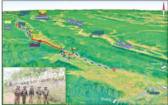
တပ်မတော်စစ်ကြောင်းများက အကြမ်းဖက်သောင်းကျန်းသူများ ယာယီစိုးမိုးထားသည့် ကလေး-တမူး ဆက်သွယ်ထားသော နယ်စပ်ကုန်သွယ်ရေးလမ်းကြောင်းပေါ်ရှိ ရာဇဂြိုဟ်ရေလှောင်တံခါးအား ပြန်လည်ထိန်းချုပ်ရန်ရှိ။

များကလည်း ဝမ်းမြောက်ဝမ်းသာစွာဖြင့် တပ်မတော်စစ်ကြောင်းများအပေါ် ကျေးဇူးတင်မဆုံးဖြတ်နေကြောင်း သိရသည်။ ယခုအခါ တပ်မတော်စစ်ကြောင်းများက ဒေသတွင်း ပြည်သူများ စိတ်အေးချမ်းသာစွာဖြင့် နေထိုင်လုပ်ကိုင်စားသောက်နိုင်ရန်အတွက် ကလေး-တမူး