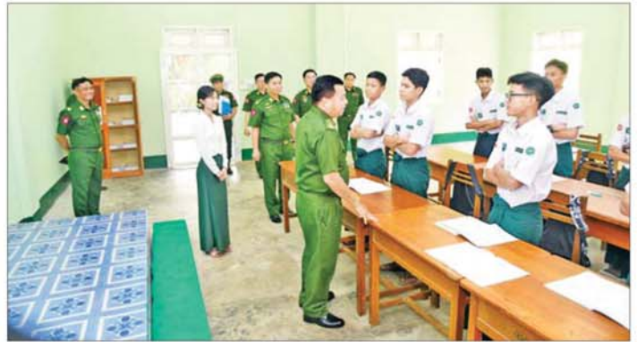
တပ်မတော်ကာကွယ်ရေးဦးစီးချုပ် ဗိုလ်ချုပ်ကြီး ရဲဝင်းဦး အမှတ်(၂) တပ်မတော်လူငယ်ပညာရေး သင်တန်းကျောင်းတွင် တက်ရောက်နေသည့် ကျောင်းသားများအား အားပေးစကားပြောကြားစဉ်။

သည်။ ထို့နောက် တပ်မတော် ကာကွယ်ရေးဦးစီးချုပ်နှင့် အဖွဲ့ဝင်များသည် ဆရာ ဆရာမများအား တွေ့ဆုံနှုတ်ဆက်ပြီး ၂၀၂၆-၂၀၂၇ ပညာသင်နှစ် တပ်မတော်လူငယ်ပညာရေး သင်တန်းကျောင်း၌ Grade-10၊ Grade-11၊ Grade-12 တို့တွင် ကျောင်းသားများ တက်ရောက် ပညာသင်ကြားနေမှုများကို လိုက်လံကြည့်ရှုပြီး အားပေးစကား ပြောကြားသည်။ ယင်းနောက် တပ်မတော် ကာကွယ်ရေး ဦးစီးချုပ်သည် သင်တန်းကျောင်းနှင့် ဆရာ ဆရာမများအတွက် ချီးမြှင့်ငွေများ ပေးအပ်ရာ ဆရာ ဆရာမများက လက်ခံရယူသည်။