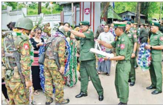
မိုင်းခတ်မြို့တွင် ရှေ့တန်းပြန် နိုင်ငံ့သားကောင်း တပ်မတော်သားများအား တာဝန်ရှိသူများ၊ ဒေသခံပြည်သူများက သောင်းသောင်းဖြဖြ ဂုဏ်ပြုကြိုဆိုကြစဉ်။

နေပြည်တော် ဇွန် ၁၂ နိုင်ငံတော်တည်ငြိမ်ရေးနှင့် နယ်မြေ အေးချမ်းသာယာရေးအတွက် တောင်သာ ဒေသတစ်ဝိုက် စစ်ဆင်ရေးနှင့် နယ်မြေ လုံခြုံရေးတာဝန်များကို ထမ်းဆောင်၍ ပြန်လည်ရောက်ရှိလာသော ရှေ့တန်းပြန် နိုင်ငံ့သားကောင်း တပ်မတော်သားများ အား ဂုဏ်ပြုကြိုဆိုခြင်းကို ဇွန် ၁၁ ရက် မွန်းလွဲပိုင်းတွင် ရှမ်းပြည်နယ်(အရှေ့ပိုင်း) မိုင်းခတ်မြို့ နယ်မြေခံတပ်ရင်း၌ ပြုလုပ် ရာ တြိဂံဒေသတိုင်းစစ်ဌာနချုပ်မှ တာဝန် ရှိသူများ၊ မိုင်းခတ်ခရိုင် ဌာနဆိုင်ရာ တာဝန်ရှိသူများ၊ မြန်မာနိုင်ငံ ရဲတပ်ဖွဲ့ဝင် များ၊ မြန်မာနိုင်ငံစစ်မှတ်တမ်းဟောင်း စာမျက်နှာ ၉ သို့ ။