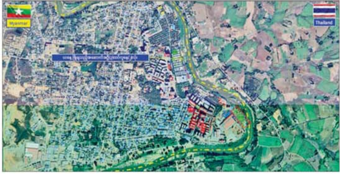
ကရင်ပြည်နယ် မြဝတီမြို့နယ် ရွှေကုက္ကိုလ်နယ်မြေရှိ အွန်လိုင်းလိမ်လည်လောင်းကစားမှုများ လုပ်ကိုင်ခဲ့သည့် တရားမဝင် အဆောက်အအုံများ ဖောက်ခွဲဖျက်ဆီးမှုကို တွေ့ရစဉ်။

နိုင်ငံသား ၁၆၇ ဦးတွင် မြန်မာနိုင်ငံလူဝင်မှုကြီးကြပ်ရေး(လတ်တလော)ပြဋ္ဌာန်းချက်များ အက်ဥပဒေပုဒ်မ ၃(၁)/၁၃(၁)နှင့် မူးယစ်ဆေးဝါးနှင့် စိတ်ကိုပြောင်းလဲစေသော ဆေးဝါးများဆိုင်ရာဥပဒေအရ အပြစ်ပေးအရေးယူခဲ့သည့် ပြည်ပနိုင်ငံသား ၆၆၂ ဦးရှိသည့် အတွက် ကျန်ရှိသည့် ပြည်ပနိုင်ငံသား ၅၀၅ ဦးတို့အား သက်ဆိုင်ရာနိုင်ငံများသို့ လွှဲပြောင်းပေးရန် အသင့်ဖြစ်နေပြီဖြစ်ကြောင်းနှင့် ၎င်းတို့ကို ကောင်းမွန်စွာ ထိန်းသိမ်းစောင့်ရှောက်ထားရှိသည်။ နိုင်ငံတော်အနေဖြင့် Online Scam Center လုပ်ငန်းများတွင် ပါဝင်ပတ်သက်နေသူများနှင့် နောက်ကွယ်မှကြိုးကိုင်သော နိုင်ငံခြားသားများကို ဖော်ထုတ်ဖမ်းဆီးပြီး ထိထိရောက်ရောက် ပြင်းပြင်းထန်ထန်အရေးယူနိုင်ရေး အိမ်နီးချင်းနှင့် ဒေသတွင်း နိုင်ငံများ၊ နိုင်ငံတကာအဖွဲ့အစည်းများနှင့် တက်ကြွစွာ ပူးပေါင်းဆောင်ရွက်လျက်ရှိသည့်အပြင် အကြောင်းအမျိုးမျိုးကြောင့် ဒုက္ခရောက်နေကြသော နိုင်ငံခြားသားများနှင့် လူကုန်ကူးခံရသည့် နိုင်ငံခြားသားများကို သက်ဆိုင်ရာနိုင်ငံများသို့ အမြန်ဆုံး ပြည်နှင့်လွှဲပြောင်းပေးနိုင်ရေး ထိရောက်စွာညှိနှိုင်းဆောင်ရွက်လျက် ရှိကြောင်း သိရသည်။ သတင်းစဉ်