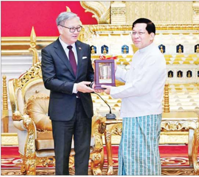
နိုင်ငံတော်သမ္မတ ဦးမင်းအောင်လှိုင်နှင့် လာအိုပြည်သူ့ဒီမိုကရက်တစ်သမ္မတနိုင်ငံ ဒုတိယဝန်ကြီးချုပ် နှင့် နိုင်ငံခြားရေးဝန်ကြီး H.E. Mr. Thongsavan PHOMVIHANE တို့ အမှတ်တရလက်ဆောင်ပစ္စည်းများ အပြန်အလှန်ပေးအပ်စဉ်။

ဦးစွာ နိုင်ငံတော်သမ္မတက လာအိုပြည်သူ့ ဒီမိုကရက်တစ်သမ္မတနိုင်ငံ ဒုတိယဝန်ကြီးချုပ်နှင့် နိုင်ငံခြားရေးဝန်ကြီးဦးဆောင်သည့် ကိုယ်စားလှယ် အဖွဲ့အား မြန်မာနိုင်ငံမှ လှိုက်လှဲဆွေးနွေးစွာဖြင့် ကြိုဆိုပါကြောင်း၊ မိမိနိုင်ငံတော်သမ္မတ တာဝန် ထမ်းဆောင်ပြီးနောက်ပိုင်း အာဆီယံအဖွဲ့ဝင်နိုင်ငံများ နှင့် အိမ်နီးနားချင်းနိုင်ငံများမှ အထူးကိုယ်စားလှယ် များနှင့် နိုင်ငံခြားရေးဝန်ကြီးများအနေဖြင့် ယခုကဲ့သို့ တရားဝင်ခရီးစဉ်များ လာရောက်တွေ့ဆုံခြင်းသည် လိုသည့် မိမိတို့နိုင်ငံ၏ နိုင်ငံရေးဖြစ်ပေါ်ပြောင်းလဲ တိုးတက်မှု အခြေအနေအထားအပေါ်တွင် အပြည့်အဝ နားလည်ပြီး မြန်မာနှင့် အာဆီယံဆက်ဆံရေး ပိုမို ကောင်းမွန်တိုးတက်အောင် ဆောင်ရွက်ရန် အခွင့်အလမ်းများ ဖော်ဆောင်နိုင်ရေးလာရောက်ခြင်း ဖြစ်သည်ဟု မိမိအနေဖြင့် နားလည်သဘောပေါက် ပါကြောင်း၊ မိမိတို့ မြန်မာနိုင်ငံအစိုးရအနေဖြင့် ပြည်သူများ၏ရွေးချယ်မှု၊ လွှတ်တော်စင်မြင့်တွင် စနစ်တကျ ရွေးကောက်တင်မြောက်မှုများဖြင့် ဖြစ်ပေါ်လာသည့် ရွေးကောက်ခံအစိုးရတစ်ရပ်ဖြစ် ကြောင်း၊ သို့ဖြစ်၍ အာဆီယံနိုင်ငံများ၊ ဒေသတွင်း နိုင်ငံများအနေဖြင့်လည်း မိမိတို့နိုင်ငံရေးအစိုးရအပေါ် ထောက်ခံခံပေးခဲ့ကြသည့် ပြည်သူများ၏ဆန္ဒနှင့် လွှတ်တော်ကိုယ်စားလှယ်များ၏ ဆန္ဒအပေါ် မျက်ကွယ်မပြုကြရန်လိုကြောင်း၊ မိမိတို့အစိုးရ အနေဖြင့် စတင်တာဝန်ယူစဉ်ကတည်းကပင်ပြည်တွင်း ငြိမ်းချမ်းရေးအတွက် ဖိတ်ခေါ်ဆောင်ရွက်ခဲ့ပြီး ငါးနှစ်တာကာလအတွင်း ထာဝရငြိမ်းချမ်းရေးရရှိ အောင် ကြိုးပမ်းဆောင်ရွက်သွားမည်ဟု ပြောကြား လိုကြောင်း၊ ထာဝရငြိမ်းချမ်းရေးရရှိမှသာလျှင် တိုင်းပြည်တည်ငြိမ်အေးချမ်းပြီး ဖွံ့ဖြိုးတိုးတက်မည် ကို ကောင်းစွာနားလည်လက်ခံထားကြောင်း၊ မိမိ၏သမ္မတအဖြစ် ကျမ်းသစ္စာပြန်ဆိုမှု အခမ်းအနားတွင် လာအိုနိုင်ငံမှ အထူးကိုယ်စားလှယ်