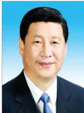
တရုတ်ပြည်သူ့သမ္မတနိုင်ငံ သမ္မတ မစ္စတာရှီကျင့်ဖျင်