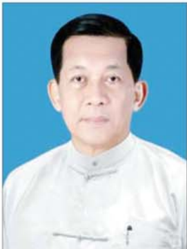
နိုင်ငံတော်သမ္မတ ဦးမင်းအောင်လှိုင်

နေပြည်တော် ၅ ဇူလိုင် ၂၀၂၆ - ပြည်ထောင်စုသမ္မတမြန်မာနိုင်ငံတော် နိုင်ငံတော်သမ္မတ ဦးမင်းအောင်လှိုင်သည် တရုတ်ပြည်သူ့သမ္မတနိုင်ငံ သမ္မတ မစ္စတာရှီကျင့်ဖျင် ၏ ဖိတ်ကြားချက်အရ တရုတ်ပြည်သူ့သမ္မတနိုင်ငံသို့ မကြာမီရက်ပိုင်း အတွင်း နိုင်ငံတော်အဆင့်ချစ်ကြည်ရေးခရီးစဉ်(State Visit) သွားရောက် မည်ဖြစ်သည်။ ခရီးစဉ်အတွင်း နိုင်ငံတော်သမ္မတသည် တရုတ်သမ္မတနှင့်တွေ့ဆုံ၍ နှစ်နိုင်ငံ ဆွေးနွေးပွဲကျင်းပပြုလုပ်ခြင်း၊ တရုတ်နိုင်ငံဝန်ကြီးချုပ်နှင့် တရုတ် အမျိုးသားပြည်သူ့ကွန်ဂရက် အမြဲတမ်းကော်မတီဥက္ကဋ္ဌတို့နှင့် တွေ့ဆုံခြင်း တို့အပြင် ပြည်နယ်အကြီးအကဲများနှင့် စီးပွားရေးအဖွဲ့အစည်းများမှ ပုဂ္ဂိုလ်များကိုလည်း လက်ခံတွေ့ဆုံသွားမည်ဖြစ်သည်။ ထို့အပြင် စီးပွားရေး ကွန်ဖရင့်သို့ တက်ရောက်ရန်ရှိပြီး အဆင့်မြင့်နည်းပညာသွား စက်မှုလုပ်ငန်း များသို့ သွားရောက်လေ့လာသွားမည်ဖြစ်ပါသည်။ ခရီးစဉ်အတွင်း မြန်မာ- တရုတ် နှစ်နိုင်ငံအကြား စာမျက်နှာ ၃ သို့ ။