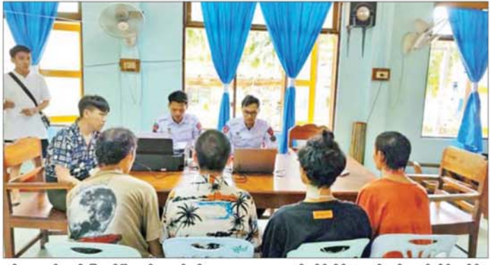
ဇွန် ၁၂ ရက်အထိ မြဝတီမြို့နယ်အတွင်းသို့ တရားမဝင် ဝင်ရောက်လာသည့် ပြည်ပနိုင်ငံသား စုစုပေါင်း ၁၄၇၀၇ ဦး ထိန်းသိမ်းနိုင်ခဲ့ကြောင်းနှင့် ယင်းနိုင်ငံသား အားလုံးကို စစ်ဆေးပြီးစီးခဲ့ပြီး ၎င်းတို့အနက်မှ

နေပြည်တော် ၅ နိုဝင်ဘာ ၂၀၂၆ - အွန်လိုင်းလိမ်လည်မှုလုပ်ငန်းများအား ဆက်လက်စစ်ဆေး ဆောင်ရွက်လျက်ရှိပြီး ပြည်ပနိုင်ငံသား လေးဦး ထပ်မံဖော်ထုတ်ထိန်းသိမ်းနိုင်ခဲ့ကာ ပြည်နှင့်နိုင်ရေး စစ်ဆေးနိုင်ခဲ့သည်။ ထိုသို့ ပြည်ပနိုင်ငံသား လေးဦးထပ်မံဖော်ထုတ်ထိန်းသိမ်းနိုင်ခဲ့ခြင်းမှာ အောက်ဖော်ပြပါအတိုင်း ဖြစ်ပေါ်ခဲ့ခြင်းဖြစ်ပြီး ဖြစ်ရပ်ကြားက ဖြစ်ပေါ်ခဲ့ခြင်းဖြစ်ပြီး ဆိုက်များအတွင်းသို့ တရားမဝင်လမ်းကြောင်းမှ တစ်ဆင့်ဝင်ရောက်နေခဲ့သည့် တရားမဝင်လမ်းကြောင်းမှ ထပ်မံဖော်ထုတ်ထိန်းသိမ်းနိုင်ခဲ့ပြီး ပြည်နှင့်နိုင်ရေး စစ်ဆေးနိုင်ခဲ့သည်။ ၂၀၂၅ ခုနှစ် ဇန်နဝါရီ ၃၀ ရက်မှ ၂၀၂၆ ခုနှစ်