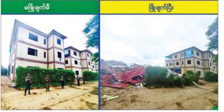
ကရင်ပြည်နယ် မြဝတီမြို့နယ် ရွှေကုက္ကိုလ်နယ်မြေရှိ အွန်လိုင်းလိမ်လည်လောင်းကစားလုပ်ငန်း လုပ်ကိုင်ခဲ့သော တရားမဝင် အဆောက်အအုံကို မဖြိုဖျက်မီနှင့် ဖြိုဖျက်ပြီးနောက် တွေ့ရစဉ်။