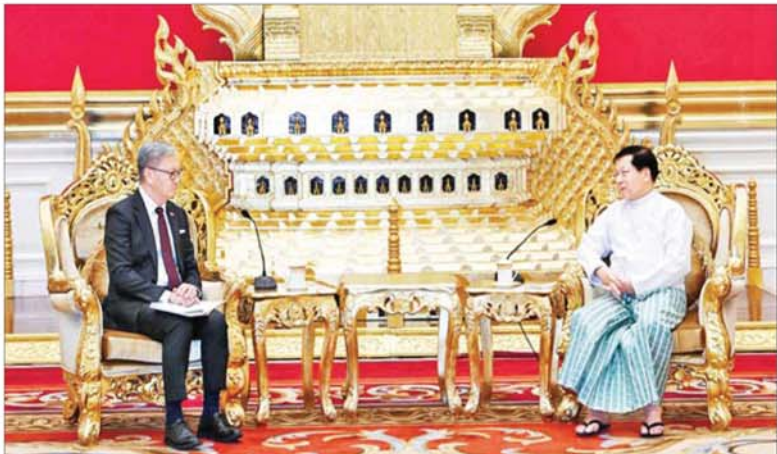
နိုင်ငံတော်သမ္မတ ဦးမင်းအောင်လှိုင် လာအိုပြည်သူ့ဒီမိုကရက်တစ်သမ္မတနိုင်ငံ ဒုတိယဝန်ကြီးချုပ်နှင့် နိုင်ငံခြားရေး ဝန်ကြီး H.E. Mr. Thongsavan PHOMVIHANE အား လက်ခံတွေ့ဆုံစဉ်။

နေပြည်တော် ၅ ဇူလိုင် ၂၀၂၆ - ပြည်ထောင်စုသမ္မတမြန်မာနိုင်ငံတော် နိုင်ငံတော်သမ္မတ ဦးမင်းအောင်လှိုင် ထံ လာအိုပြည်သူ့ ဒီမိုကရက်တစ်သမ္မတ နိုင်ငံ ဒုတိယဝန်ကြီးချုပ်နှင့် နိုင်ငံခြားရေး ဝန်ကြီး H.E. Mr. Thongsavan PHOMVIHANE ဦးဆောင်သော ကိုယ်စား လှယ်အဖွဲ့က ယနေ့နံနက်ပိုင်းတွင် နေပြည်တော်ရှိ နိုင်ငံတော်သမ္မတ၏ ဧည့်ဆောင်တော်၌ လာရောက်ဂါရဝပြု တွေ့ဆုံသည်။ အဆိုပါတွေ့ဆုံပွဲသို့ နိုင်ငံတော် သမ္မတနှင့်အတူ နိုင်ငံတော်သမ္မတရုံး ပြည်ထောင်စုဝန်ကြီး ဦးခင်မောင်ရီ၊ နိုင်ငံခြားရေးဝန်ကြီးဌာန ပြည်ထောင်စု ဝန်ကြီး ဦးတင်မောင်ဆွေနှင့် တာဝန်ရှိသူ တို့ တက်ရောက်ကြပြီး လာအိုပြည်သူ့ စာမျက်နှာ ၃ သို့ ။