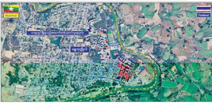
ကရင်ပြည်နယ် မြိတ်မြို့နယ် ရွှေကုက္ကိုလ်နယ်မြေရှိ အွန်လိုင်းလိမ်လည်လောင်းကစားမှုများ လုပ်ကိုင်ခဲ့သည့် တရားမဝင် အဆောက်အအုံများ ဖောက်ခွဲဖျက်ဆီးမှုကို တွေ့ရစဉ်။