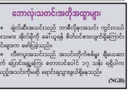
ဘောလုံးသတင်းအတိုအထွာများ

သင်းပါ။ ကစားသမားဘဝကို လည်း ဒီအသင်းမှာပဲ ကုန်ဆုံးသွား လိုပါတယ်' ဟု ပြောသည်။ (အောက်ပုံ) (NGB)