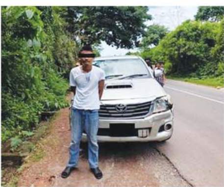
အရ ကျိုက်ထိုမြို့၊ မရဲစခန်းမှ တပ်ဖွဲ့ဝင်များပါဝင်သော ပူးပေါင်းအဖွဲ့က သွားရောက်စစ်ဆေးခဲ့ရာ မော်လမြိုင်မှ ရန်ကုန်ဘက်သို့ မော်လမြိုင်မြို့၊ ရွှေမြိုင်သီရိ

ကျိုက်ထို ၅.၆.၂၆ - မွန်ပြည်နယ်၊ ကျိုက်ထိုမြို့နယ်၌ မော်တော်ယာဉ်အား လမ်းပြောင်းပြန် မောင်းနှင်ပြီး ဘီးခွန်ဂိတ်အား ဝင်တိုက်ကာ မောင်းနှင်ထွက်ပြေးသည့် အမျိုးသား တစ်ဦးအား ဖမ်းဆီးအရေးယူထားသည်။