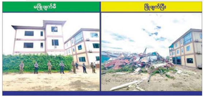
ကရင်ပြည်နယ် မြိတ်မြို့နယ် ရွှေကုက္ကိုလ်နယ်မြေရှိ အွန်လိုင်းလိမ်လည်လောင်းကစားလုပ်ငန်း လုပ်ကိုင်ခဲ့သော တရားမဝင် အဆောက်အအုံကို မဖြိုဖျက်မီနှင့် ဖြိုဖျက်ပြီးနောက် တွေ့ရစဉ်။