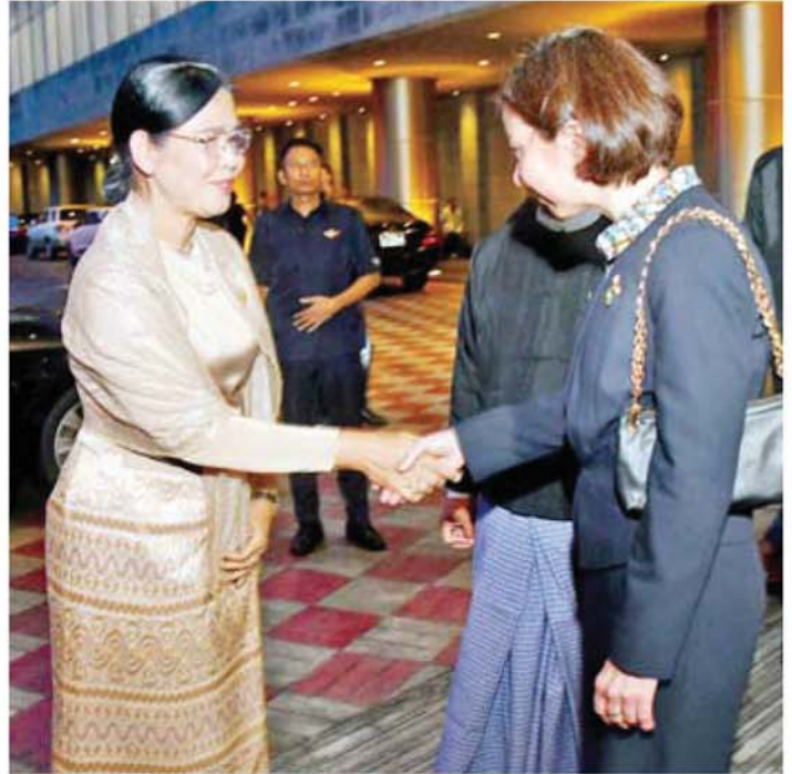
ဒုတိယသမ္မတ ဒေါ်နန်းနီနီအေးအား မြန်မာနိုင်ငံဆိုင်ရာ ရုရှားဖက်ဒရေးရှင်းနိုင်ငံ သံရုံးယာယီတာဝန်ခံ Ms.Natalia Nefedova က ကြိုဆိုနှုတ်ဆက်စဉ်။