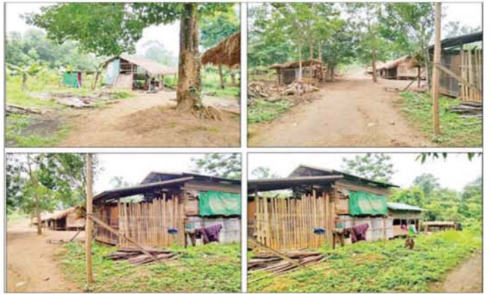
တပ်မတော်စစ်ကြောင်းများက တမူးမြို့နယ် ရန်လင်းပိုင်ကျေးရွာအနောက်တောင်ဘက် မြန်မာ-အိန္ဒိယ နယ်စပ်အနီး အကြမ်းဖက်သောင်းကျန်းသူများ အခြေပြုနေထိုင်သည့်စခန်းအား သိမ်းပိုက်ရရှိစဉ်။

၀ ကလေး-တမူးမှ ယနေ့တွင် အဆိုပါကျေးရွာ၏ အနောက်မြောက်ဘက် မီတာ ၂၅၀၀ ခန့်အကွာ မြန်မာ - အိန္ဒိယ နယ်စပ်အနီး အဆောက်အအုံများ တွေ့ရှိသဖြင့် စစ်နည်းဗျူဟာ မြောက် ချီတက်ရှင်းလင်းခဲ့ရာ အကြမ်းဖက်သောင်း ကျန်းသူများနှင့် ထိတွေ့တိုက်ပွဲ ဖြစ်ပွားခဲ့ပြီး ၎င်းတို့ အခြေပြုနေထိုင်သည့်စခန်းအား သိမ်းပိုက်ရရှိခဲ့ကာ အကြမ်းဖက်သောင်းကျန်းသူများသည် ထိခိုက်ကျဆုံး များစွာဖြင့် တစ်ဖက်နိုင်ငံအတွင်းသို့ ဖရိုဖရဲ ဆုတ်ခွာ