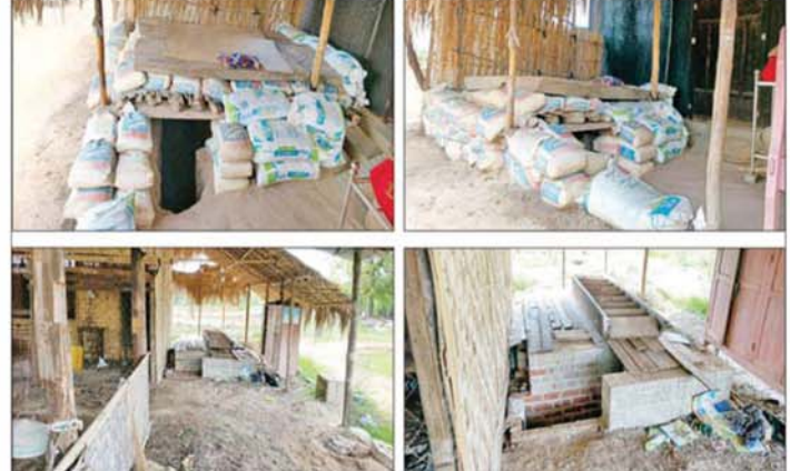
မင်းခေါင်ရွာအတွင်း အကြမ်းဖက်သောင်းကျန်းသူများက နေအိမ်များ၊ ဌာနဆိုင်ရာအဆောက်အအုံ များကို အကာအကွယ်ပြုလုပ်၍ ခံစစ်ကျင်းများ၊ ဘန်ကာများပြုလုပ်ကာ စစ်ခန်းအဖြစ်အသုံးပြုထား စဉ်။

❖ တပ်မတော်မှ ဆက်လက်၍ တပ်မတော်စစ်ကြောင်းများက ငါးလုံးတင်ကျေးရွာမှတစ်ဆင့် ချောင်းဦး - ရေစကြို လမ်းကြောင်းတစ်လျှောက် နယ်မြေလုံခြုံရေးလုပ်ငန်း များ ဆက်လက်ဆောင်ရွက်ခဲ့ရာ အကြမ်းဖက် သောင်းကျန်းသူများ ဝင်ရောက်အခြေပြုနေထိုင်ပြီး စစ်ခန်းအဖြစ် အသုံးပြုထားသည့် မထိသာကျေးရွာ