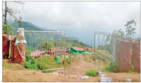
တပ်မတော်စစ်ကြောင်းများက ဟားခါး-ထန်တလန် လမ်းကြောင်းရှိ တာဝါတိုင်စခန်းအား သိမ်းပိုက်ရရှိစဉ်။

နိုင်တော့မည်ဖြစ်ကာ ဒေသတွင်း အခဲမရှိ ပြန်လည်အသုံးပြု သွား သိရသည်။ ကုန်စည်ပို့ဆောင်မှုများတွင် အခက် လာနိုင်တော့မည် ဖြစ်ကြောင်း သတင်းစဉ်