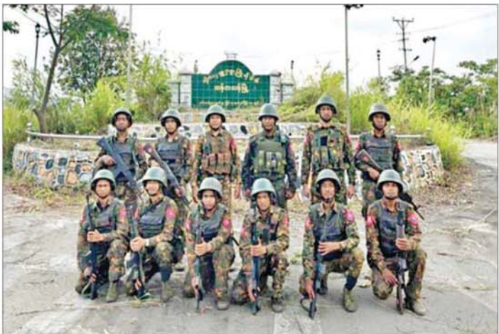
တပ်မတော်စစ်ကြောင်းများက ထန်တလန်မြို့အား ထိန်းချုပ်ထားမှု။

ယာယီထိန်းချုပ်ထားခဲ့သည့် ထန်တလန်မြို့အား ၂၀၂၃ ခုနှစ် အောက်တိုဘာ ၂၉ ရက်တွင် တပ်မတော်စစ်ကြောင်းများက အောင်မြင်စွာထိန်းချုပ်ထားနိုင်ခဲ့သည်။ ထိုသို့ပြန်လည်ထိန်းချုပ်ပြီး တပ်မတော်စစ်ကြောင်းများအနေဖြင့် အကြမ်းဖက်သောင်းကျန်းသူများ ယာယီစိုးမိုးထားသည့် မြို့ရွာများအား ပြန်လည်တိုက်ခိုက်ထိန်းချုပ်ကာ ဆက်သွယ်ရေးလမ်းကြောင်းများ ပြန်လည်ဖွင့်လှစ်၍ ပြန်လည်ထူထောင်ရေးပစ္စည်းများနှင့် ထောက်ပံ့ရေးပစ္စည်းများကို မော်တော်ယာဉ်များဖြင့် အင်တိုက်အားတိုက်ပို့ဆောင်ပေးလျက် ရှိသည်။ စာမျက်နှာ ၁၀ သို့ ၆