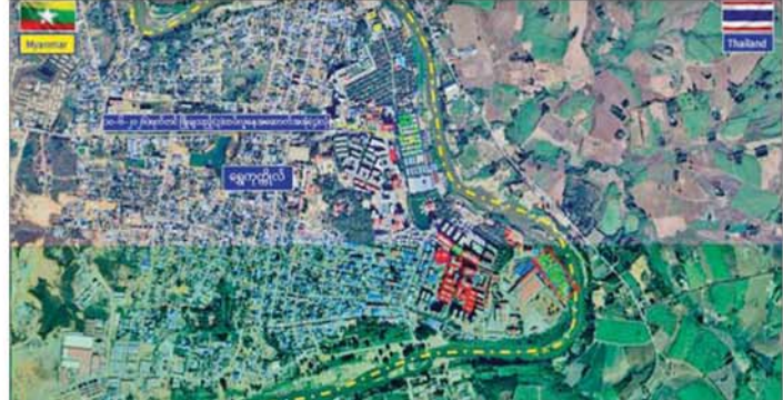
ကရင်ပြည်နယ် မြဝတီမြို့နယ် ရွှေကုက္ကိုလ်နယ်မြေရှိ အွန်လိုင်းလိမ်လည်လောင်းကစားမှုများ လုပ်ကိုင်ခဲ့သည့် တရားမဝင် အဆောက်အအုံများအား ဖောက်ခွဲဖျက်ဆီးမှုကို တွေ့ရစဉ်။

နေပြည်တော် ဇွန် ၁၀ ရွှေကုက္ကိုလ်နယ်မြေအတွင်းရှိ အွန်လိုင်းလိမ်လည်လောင်းကစားမှုကျူးလွန်ရာတွင် အသုံးပြုခဲ့သည့် တရားမဝင် သုံးထပ်လူနေအဆောက်အအုံ လေးလုံးကို ဌာနဆိုင်ရာ ပူးပေါင်းအဖွဲ့များက ယနေ့တွင် စနစ်တကျ ဖြိုချဖျက်ဆီးခဲ့ကြောင်း သိရသည်။ ရွှေကုက္ကိုလ်နယ်မြေအတွင်း၌ အွန်လိုင်းလိမ်လည်လောင်းကစားလုပ်ငန်းများ ကျူးလွန်ရာတွင် အသုံးပြုခဲ့သည့် အဆောက်အအုံ ၇၇ လုံးအနက် ယာဉ်ယန္တရားများဖြင့် ဖြိုချဖျက်ဆီးမည့် အဆောက်အအုံ ၅၇ လုံးနှင့် ဖောက်ခွဲ၍ ဖျက်ဆီးမည့် အဆောက်အအုံ ၂၀ တို့ကို အဆောက်အအုံအမျိုးအစားအလိုက် ခွဲခြားသတ်မှတ်ပြီး စနစ်