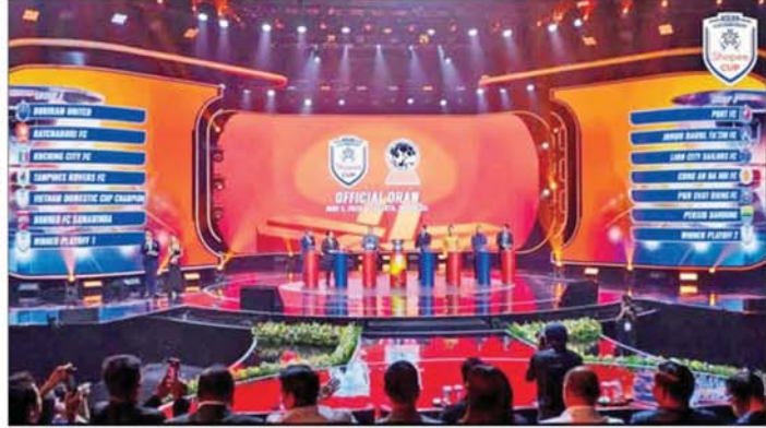
၂၀၂၆-၂၀၂၇ ရာသီ အာဆီယံကလပ် ချန်ပီယံရှစ်ပြိုင်ပွဲ အုပ်စုမဲခွဲပွဲ ကျင်းပစဉ်။

ရန်ကုန် ၅ နို ၁၀ ၂၀၂၆-၂၀၂၇ ရာသီအာဆီယံကလပ် ချန်ပီယံရှစ်ပြိုင်ပွဲတွင် ခြေစစ်ပွဲအဆင့်မှ စတင်ယှဉ်ပြိုင် ရမည့် မြန်မာကလပ် ရှမ်းယူနိုက်တက်တက်အသင်းသည် လာအိုကလပ်အသင်းနှင့် တွေ့ဆုံနေသည်။ ယင်းပြိုင်ပွဲအတွက် အုပ်စုမဲခွဲပွဲကို ၅ ရက်က အင်ဒိုနီးရှားနိုင်ငံ၌ ကျင်းပခဲ့ပြီး ခြေစစ်ပွဲအဆင့်တွင် ဝေးသင်းယှဉ်ပြိုင် ရမည့်မြစ်က မြန်မာကလပ်ရှမ်းယူနိုက်တက်အသင်းနှင့် လာအိုကလပ် EZRA အသင်း၊ ဖိလစ်ပိုင်ကလပ် မနီလာဒီဂါအသင်းနှင့် ဘရူနိုင်းကလပ်ကာဆူကာအသင်းတို့ တွေ့ဆုံနေသည်။ ခြေစစ်ပွဲ