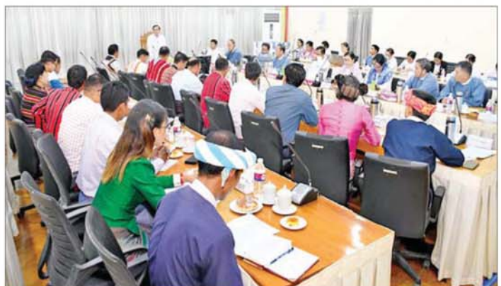
ရွက်နိုင်ရန် ပြည်ထောင်စုနယ်မြေ နေပြည်တော် အဖွဲ့ ၁၀ ဖွဲ့အား ချီးမြှင့်ငွေနှင့် လက်ဆောင်ပစ္စည်း အတွင်းရှိ တိုင်းရင်းသားစာပေနှင့် ယဉ်ကျေးမှုအသင်း များ ပေးပို့ခဲ့ကြောင်း သိရသည်။ သတင်းစဉ်

ဆောင်ရွက်ကြရန် တိုက်တွန်းပြောကြားသည်။ ဖြည့်ဆည်းဆောင်ရွက် ထိုနောက် ဒုတိယဝန်ကြီးက အသင်းအဖွဲ့များ၏ ဒေသဖွံ့ဖြိုးရေး၊ အသင်းအဖွဲ့မှတ်ပုံတင်ရေး၊ တိုင်းရင်းသားစာပေဖော်ထုတ်ရေး၊ တိုင်းရင်းသားဘာသာစာပေသင်(TA/LT) ဆရာ ဆရာမများ ခန့်ထားရေးနှင့် သက်မွေးပညာသင်တန်းများ တက်ရောက်နိုင်ရေးတို့နှင့်စပ်လျဉ်း၍ သုံးသပ် ဆွေးနွေးပြီး တက်ရောက်လာကြသူများက အထွေထွေဆွေးနွေးကြရာ ပြည်ထောင်စုဝန်ကြီးက တင်ပြချက်များအပေါ် ပေါင်းစပ်ညှိနှိုင်းဖြည့်ဆည်း ဆောင်ရွက်ပေးသည်။ ယင်းနောက် ပြည်ထောင်စုဝန်ကြီးနှင့် ဒုတိယ ဝန်ကြီးတို့က တိုင်းရင်းသားစာပေနှင့် ယဉ်ကျေးမှု ဆိုင်ရာကိစ္စရပ်များ ပိုမိုထိန်းသိမ်းမြှင့်တင်ဆောင်