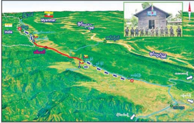
တပ်မတော်စစ်ကြောင်း များက အကြမ်းဖက် သောင်းကျန်းသူများ ယာယီစိုးမိုးထား သည့် ကလေး-တမူး ဆက်သွယ်ထားသော နယ်စပ်ကုန်သွယ်ရေး လမ်းကြောင်းအား ပြန်လည်ဖွင့်လှစ်နိုင်ရေး ဆောင်ရွက်နေမှု။

ပြန်လည်ထိန်းချုပ်ဖွင့်လှစ်ပေးနိုင်တော့ မည်ဖြစ်ကြောင်း သိရှိရသည်။ တပ်မတော်စစ်ကြောင်းများ အနေ ဖြင့် ကလေး-တမူးလမ်းကြောင်းအား အမြန်ဆုံး ပြန်လည်ထိန်းချုပ် ဖွင့်လှစ်နိုင်ရေးအတွက် ဒေသခံပြည်သူ များ၏ ပူးပေါင်းပါဝင်မှုဖြင့် ဆက်လက် ကြိုးပမ်း ဆောင်ရွက်သွားမည်ဖြစ်ပြီး လမ်းကြောင်းတစ်လျှောက်ရှိ အကြမ်း ဖက်သောင်းကျန်းသူများ ထောင်ခွဲသည့် မိုင်းများအား ဖယ်ရှားရှင်းလင်းခြင်းနှင့် ဖျက်ဆီးခဲ့သည့် လမ်းတံတားများအား ပြုပြင်တည်ဆောက်ခြင်းလုပ်ငန်းများကို ဆက်လက်ဆောင်ရွက်ပေးသွားမည်ဖြစ် ကြောင်း သိရသည်။ သတင်းစဉ်