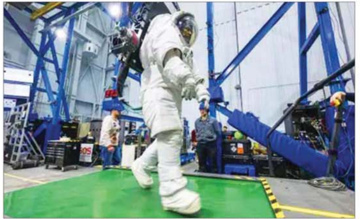
ဖြစ်သည်။ သို့သော်လည်းကောင်းစမ်းသပ်ယာဉ်များအတွက် နိုင်မည်ဟု ယုံကြည်ကြောင်း နာဆာမှ တာဝန်ရှိသူ ခိုးယူစနစ်များကို အဆင်သင့်ဖြစ်အောင် လုပ်ဆောင် တစ်စီးက ပြောကြားသည်။ အင်န်အီတီချီကေ

မေလအတွင်းက ဖလော်ရီဒါ၌ ပြုလုပ်ခဲ့သည့် စမ်းသပ်မှုတစ်ခုတွင် Blue Origin ၏ ဒုံးပျံသစ်ပေါက်ကွဲမှု ဖြစ်ပွားခဲ့ပြီးနောက်ယခုကြေညာချက်ထက်ပိုလာခြင်း