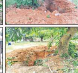
တပ်မတော်စစ်ကြောင်းများက ရန်လင်းမိုင်ရွာအား ရှင်းလင်းစဉ် အကြမ်းဖက် သောင်းကျန်းသူများက နေအိမ်များ၊ ဌာနဆိုင်ရာ အဆောက်အအုံများအား အကာ အကွယ်ပြုလုပ်၍ ခံစစ်ကျင်းများ၊ ဘန်ကာများပြုလုပ်ကာ စစ်ခန်းအဖြစ် အသုံးပြု ထားပုံ။