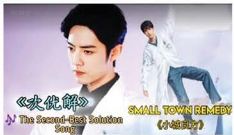
Xiao Zhan in A Small Town Remedy