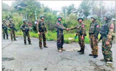
တပ်မတော်စစ်ကြောင်းများက ဟားခါး-ထန်တလန် ဆက်သွယ်ရေးလမ်းကြောင်းအား ပြန်လည်ထိန်းချုပ်နိုင်ခဲ့ပြီး ထန်တလန်မြို့မှ တပ်မတော်စစ်ကြောင်းနှင့် ပူးပေါင်းနိုင်ခဲ့မှုကို တွေ့ရစဉ်။

နိုင်တော့မည်ဖြစ်ကာ ဒေသတွင်း အခဲမရှိ ပြန်လည်အသုံးပြု သွား သိရသည်။ ကုန်စည်ပို့ဆောင်မှုများတွင် အခက် လာနိုင်တော့မည် ဖြစ်ကြောင်း သတင်းစဉ်