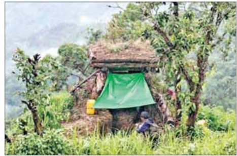
တပ်မတော်စစ်ကြောင်းများက ဟားခါး-ထန်တလန် လမ်းကြောင်းရှိ ရွှိင် ၁၉၂၁ စခန်းအား သိမ်းပိုက်ရရှိစဉ်။