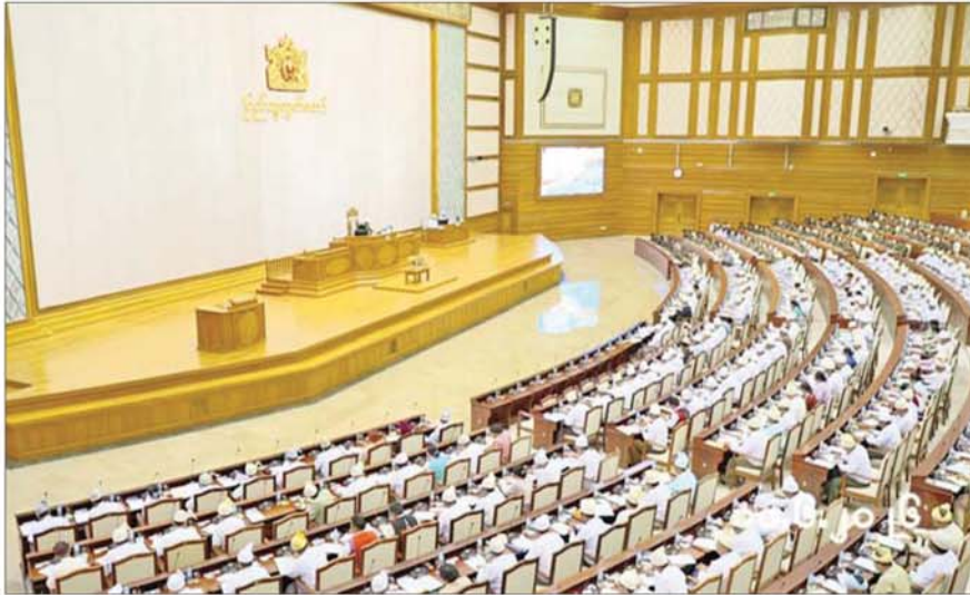
တတိယအကြိမ် ပြည်သူ့လွှတ်တော် ဒုတိယပုံမှန်အစည်းအဝေး ပဉ္စမနေ့ကျင်းပစဉ်။

နေပြည်တော် စွန့် ၁၀ တတိယအကြိမ် ပြည်သူ့လွှတ်တော် ဒုတိယပုံမှန်အစည်းအဝေး ပဉ္စမနေ့ကို ယနေ့နံနက် ၁၀ နာရီတွင် နေပြည်တော်ရှိ လွှတ်တော်အဆောက်အအုံ ပြည်သူ့လွှတ်တော်အစည်းအဝေးခန်းမ၌ ကျင်းပသည်။ ဦးစွာ ပြည်သူ့လွှတ်တော်ဥက္ကဋ္ဌဦးခင်ရှိက တတိယအကြိမ် ပြည်သူ့လွှတ်တော် ဒုတိယပုံမှန်အစည်းအဝေး ပဉ္စမနေ့သို့ တက်ရောက်ခွင့်ရှိသည့် ပြည်သူ့လွှတ်တော် ကိုယ်စားလှယ်ဦးရေ ၃၅၁ ဦးရှိသည့် အနက် ယနေ့အစည်းအဝေးသို့ ၃၄၉ ဦး တက်ရောက်သဖြင့် တက်ရောက်မှုရာခိုင်နှုန်း ၉၉ ဒသမ ၄၃ ရှိသည့်အတွက် အစည်းအဝေးအထမြောက်ကြောင်းနှင့် စတင် ကျင်းပကြောင်း ကြေညာပြီး အစည်းအဝေး တက်ရောက်မှုအခြေအနေကို လွှတ်တော်၏ အတည်ပြုချက်ရယူ၍ မှတ်တမ်းတင်သည်။ စာမျက်နှာ ၃ သို့ ၁*