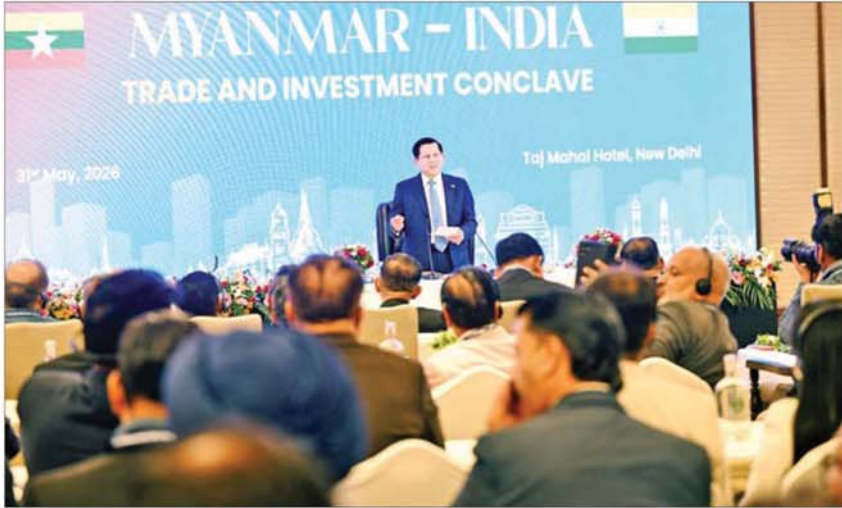
နိုင်ငံတော်သမ္မတ ဦးမင်းအောင်လှိုင် မြန်မာ-အိန္ဒိယ ကုန်သွယ်မှုနှင့် ရင်းနှီးမြှုပ်နှံမှုဆိုင်ရာ ဆွေးနွေးပွဲအခမ်းအနားတွင် နိဂုံးချုပ်အမှာစကားပြောကြားစဉ်။

ယင်းနောက် အခမ်းအနားကို ကျင်းပရာ နိုင်ငံတော်သမ္မတနှင့်အတူ ခရီးစဉ်တွင် လိုက်ပါလာသည့် ပြည်ထောင်စုဝန်ကြီးများနှင့် အဖွဲ့ဝင်များ၊ အိန္ဒိယနိုင်ငံ အစိုးရအဖွဲ့မှ တာဝန်ရှိသူများ၊ အိန္ဒိယနိုင်ငံ ဆိုင်ရာ မြန်မာနိုင်ငံသံအမတ်ကြီး၊ မြန်မာနိုင်ငံဆိုင်ရာ အိန္ဒိယနိုင်ငံသံအမတ်ကြီးနှင့် တာဝန်ရှိသူများ ပြည်ထောင်စုသမ္မတမြန်မာနိုင်ငံ ကုန်သည်များနှင့် စက်မှုလက်မှုလုပ်ငန်းရှင်များ အသင်းချုပ် နာယကနှင့် အဖွဲ့ဝင်များ၊ မြန်မာ-အိန္ဒိယ ချစ်ကြည်ရေးအသင်းဥက္ကဋ္ဌနှင့် အဖွဲ့ဝင်များ၊ အိန္ဒိယနိုင်ငံ ကုန်သည်များနှင့် စက်မှုအသင်းချုပ်(FICCI) အတွင်းရေးမှူးချုပ် Mr. Anant Swarup Jii အိန္ဒိယ စက်မှုလက်မှုလုပ်ငန်းရှင်များ အဖွဲ့ချုပ် (CII)မှ Senior Advisor Dr. Vikramjit Singh Sahney Ji၊ ဖိတ်ကြားထားသော မြန်မာ-အိန္ဒိယ နှစ်နိုင်ငံစီးပွားရေးလုပ်ငန်းရှင်များနှင့် ဖိတ်ကြားထားသည့် ဧည့်သည်တော်များ တက်ရောက်ကြသည်။