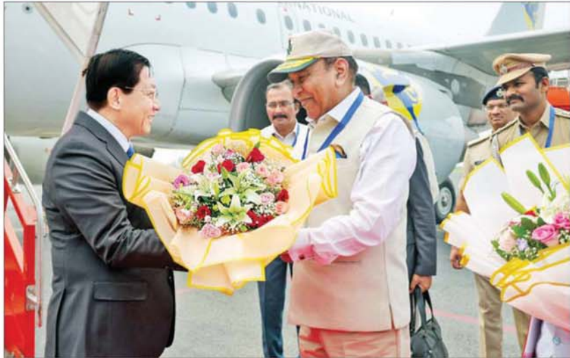
မေ ၃၀ ရက်က အိန္ဒိယနိုင်ငံသို့ ရောက်ရှိလာသော နိုင်ငံတော်သမ္မတ ဦးမင်းအောင်လှိုင်အား ဘီဟာပြည်နယ်အုပ်ချုပ်ရေးမှူးနှင့် အစိုးရအဖွဲ့မှ တာဝန်ရှိသူများက ဂုဏ်ပြုတပ်ဖွဲ့နှင့်အတူ ဂါယာလေဆိပ်၌ လိုက်လံနွေးထွေးစွာ ကြိုဆိုနှုတ်ဆက်ကြစဉ်။

ယနေ့အချိန်မှာတော့ လွတ်လပ်ပြီး တရားမျှတတဲ့ ပါတီစုံဒီမိုကရေစီ အထွေထွေရွေးကောက်ပွဲကို အောင်မြင်စွာ ကျင်းပပြုလုပ်နိုင်ခဲ့ပြီး ပြည်သူများရဲ့ ဆန္ဒနဲ့အညီ ရွေးချယ်တင်မြှောက်ခဲ့တဲ့ နိုင်ငံတော်သမ္မတ ဦးမင်းအောင်လှိုင် ဦးဆောင်တဲ့ ဒီမိုကရေစီအစိုးရသစ်တစ်ရပ်ဟာ နိုင်ငံတော်ကို ဦးဆောင်ပြီး ဒီမိုကရေစီလမ်းကြောင်းပေါ်မှာ လျှောက်လှမ်းနေပြီဖြစ်ပါတယ်။ ဒီလိုလွတ်လပ်ပြီး တရားမျှတတဲ့ ပါတီစုံဒီမိုကရေစီရွေးကောက်ပွဲမှာ မဲဆန္ဒရင် စုစုပေါင်းစာ ၅၄ ဒသမ ၂၂ ရာခိုင်နှုန်းက ၎င်းတို့ ဆန္ဒအလျောက် ဆန္ဒမဲပေးခဲ့ကြပြီး အဓိအထုတ်မှာ လူငယ်