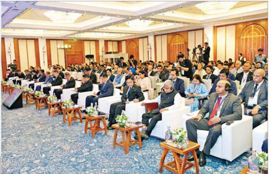
နိုင်ငံတော်သမ္မတ ဦးမင်းအောင်လှိုင် မြန်မာ-အိန္ဒိယ ကုန်သွယ်မှုနှင့် ရင်းနှီးမြှုပ်နှံမှုဆိုင်ရာ ဆွေးနွေးပွဲအခမ်းအနားတွင် အမှာစကားပြောကြားစဉ်။