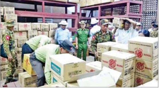
ကချင်ပြည်နယ်ဝန်ကြီးချုပ် ဦးခက်ထိန်နန်နှင့် တာဝန်ရှိသူများ မြစ်ကြီးနားမြို့သို့ ရောက်ရှိလာသည့် ကုန်ပစ္စည်းများကို ကြည့်ရှုစစ်ဆေးစဉ်။

တိုင်းရင်းသား ပြည်သူများအနေဖြင့် ၎င်းတို့၏နေရပ်ဒေသများ၌ ပြန်လည်အခြေချနေထိုင်စဉ် စားဝတ်နေရေးအဆင်ပြေချောမွေ့စေရေး၊ ကျောင်းသားကျောင်းသူများအတွက် ကျောင်းသုံးပြဌာန်းစာအုပ်များနှင့် စာရေးကိရိယာများ အချိန်မီရောက်ရှိရေး၊ ကျန်းမာရေးစောင့်ရှောက်မှု လုပ်ငန်းများအတွက် ဆေးပစ္စည်းလိုအပ်ချက်များ ဖြည့်ဆည်းပေးနိုင်ရေးနှင့် အခြားသော လိုအပ်ချက်များကို ပြန်လည်ဖြည့်ဆည်းပေးနိုင်ရေး