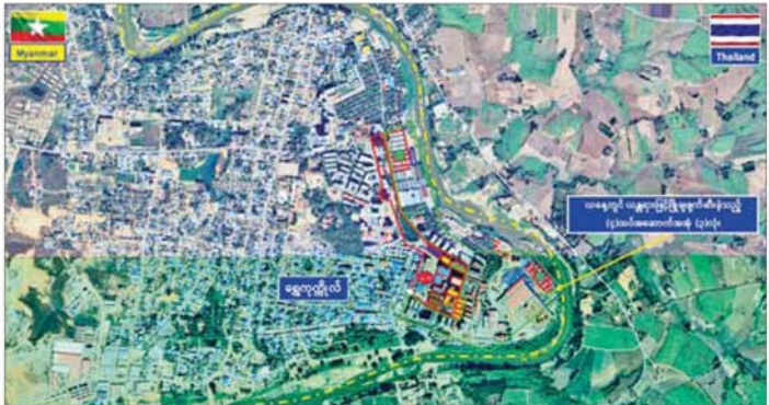
ကရင်ပြည်နယ် မြဝတီခရိုင် ရွှေကုက္ကိုလ်ဒေသရှိ အွန်လိုင်းလောင်းကစားလုပ်ငန်း လုပ်ကိုင်ခဲ့သည့် တရားမဝင်အဆောက်အအုံများအား ဖောက်ခွဲဖျက်ဆီးမှု။

ကြောင်း သိရသည်။ တက်ကြွစွာ ဆောင်ရွက်လျက်ရှိ နိုင်ငံတော်အစိုးရ အနေဖြင့် နိုင်ငံတကာနှင့် တစ်ကမ္ဘာလုံးကို အန္တရာယ်ပေးနေသည့် အွန်လိုင်း လိမ်လည် လောင်းကစားမှု တိုက်ဖျက်ရေး လုပ်ငန်းစဉ်များ ကို အမျိုးသားရေးတာဝန်တစ်ရပ် အဖြစ်ခံယူကာ မြန်မာနိုင်ငံ အတွင်း လုံးဝအခြေမပြုနိုင်ရေး အတွက် ပြည်တွင်းအင်အားစုများ အပြင် အိမ်နီးချင်းနိုင်ငံ အစိုးရများ နှင့်လည်း ပေါင်းစပ်ညှိနှိုင်း၍ တက်ကြွစွာ ဆောင်ရွက်လျက် ရှိကြောင်း သိရသည်။ သတင်းစဉ်