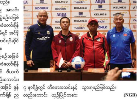
၇ နာရီခွဲတွင် ဝီမောအသင်းနှင့် သွားရမည့်ဖြစ်သည်။ လည်းကောင်း ယှဉ်ပြိုင်ကစား