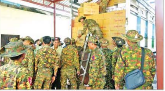
ပြန်လည်ထူထောင်ရေးလုပ်ငန်းများ ဆောင်ရွက်ရန် အထောက်အကူပြု ကုန်ပစ္စည်းများ တင်ဆောင်လာသည့် မော်တော်ယာဉ်များ မြစ်ကြီးနားမြို့သို့ ဒုတိယအကြိမ် ရောက်ရှိစဉ်။