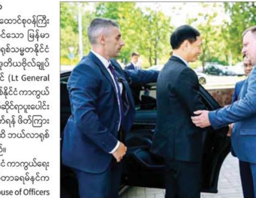
ရေးခန်းကြီးများ တွေ့ဆုံ၍ မြန်မာ-ဘယ်လာရစ်ကိစ္စရပ်များကို ဆွေးနွေးခဲ့ကြသည်။ ထို့နောက် နှစ်နိုင်ငံ ကာကွယ်ရေးဝန်ကြီးများ

ရန်ကုန် မေ ၃၁ ကာကွယ်ရေးဝန်ကြီးဌာန ပြည်ထောင်စုဝန်ကြီး ဗိုလ်ချုပ်ကြီး ထွန်းအောင် ဦးဆောင်သော မြန်မာ့ကိုယ်စားလှယ်အဖွဲ့သည် ဘယ်လာရစ်သမ္မတနိုင်ငံ ကာကွယ်ရေးဝန်ကြီးဌာနဝန်ကြီး ဒုတိယဗိုလ်ချုပ်ကြီး ဗစ်တာ ဂနဒီယာဗီချီ ခရမ်နှင့် (Lt General Viktar Ganediavich Khrenin) ၏ နှစ်နိုင်ငံ ကာကွယ်ရေးဝန်ကြီးဌာနများအကြား စစ်ဘက်ဆိုင်ရာပူးပေါင်းဆောင်ရွက်မှုကိစ္စရပ်များ ဆောင်ရွက်ရန် ဖိတ်ကြားချက်အရ မေ ၂၅ ရက်မှ ၃၀ ရက်အထိ ဘယ်လာရစ်နိုင်ငံ မင်စ်မြို့သို့ သွားရောက်ခဲ့သည်။