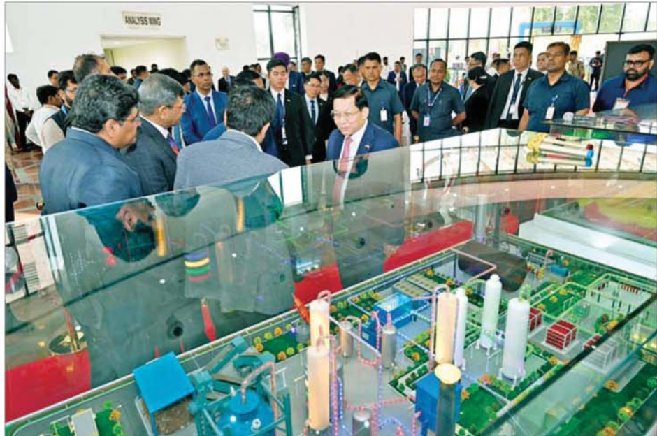
နိုင်ငံတော်သမ္မတ ဦးမင်းအောင်လှိုင် အဆင့်မြင့်သိပ္ပံနည်းကျစွမ်းအင်အမျိုးမျိုး ထုတ်လုပ်မှုလုပ်ငန်းစဉ်များနှင့်ပတ်သက်သည့် ပုံစံငယ်များကို ကြည့်ရှုလေ့လာစဉ်။

Pudimadaka တွင် စတင်ဆောင်ရွက်နေမှု ဂရင်းဟိုက်ဒရိုဂျင်ထုတ်လုပ်မှု လုပ်ငန်းများ ဆောင်ရွက်လျက်ရှိမှု၊ ကြာရှည်ခံစွမ်းအင် သိုလှောင်မှုစနစ်၊ ရေ/ရေအရင်းအမြစ်နည်းပညာများ၊ နေရောင်ခြည် စွမ်းအင်သုံးစနစ်၊ အဆင့်မြင့်သိပ္ပံနည်းကျ စွမ်းအင်ထုတ်လုပ်မှုများ၊ NETRA (NTPC Energy Technology Research Alliance) ၏ ITEC စွမ်းရည်တိုးတက်ရေးအစီအစဉ်များ၊ မြန်မာနိုင်ငံသား ကျွမ်းကျင်ပညာရှင်များ မွေးထုတ်ပေးနိုင်ခဲ့မှုများနှင့် ပတ်သက်၍ ရှင်းလင်းတင်ပြသည်။ ယင်းနောက် နိုင်ငံတော်သမ္မတသည် အဆင့်မြင့်သိပ္ပံနည်းကျ စွမ်းအင်အမျိုးမျိုး ထုတ်လုပ်မှု လုပ်ငန်းစဉ်များနှင့် ပတ်သက်သည့် CO 2 Based Closed Brayton Cycle Energy Storage System၊ Plasma Gasification based Green Hydrogen Generation from MSW-RDF/Agri-waste၊ 10 TPD Flue Gas-CO 2 To Methanol Plant(FG-CTM) ပုံစံငယ်များကို ကြည့်ရှုလေ့လာရာ ကုမ္ပဏီအကြီးအကဲနှင့် တာဝန်ရှိသူများက ရှင်းလင်းတင်ပြကြပြီး ရှင်းလင်းတင်ပြမှုများအပေါ် နိုင်ငံတော်သမ္မတက သိရှိလိုသည်များ ပြန်လည်မေးမြန်းဆွေးနွေးပြောကြားသည်။ ထို့နောက် နိုင်ငံတော်သမ္မတက ကုမ္ပဏီသို့ ရောက်ရှိလေ့လာမှု