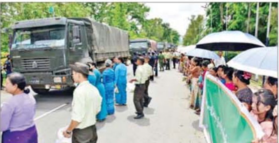
မြစ်ကြီးနားမြို့သို့ ရောက်ရှိလာသည့် ပြန်လည်ထူထောင်ရေးလုပ်ငန်းများ ဆောင်ရွက်ရန် အထောက်အကူပြု ကုန်ပစ္စည်းများ တင်ဆောင်လာသည့် မော်တော်ယာဉ်များကို ဒေသခံများက သောင်းသောင်းဖြဖြ ကြိုဆိုစဉ်။