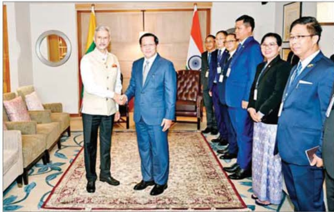
နိုင်ငံတော်သမ္မတ ဦးမင်းအောင်လှိုင်နှင့် အိန္ဒိယနိုင်ငံ ပြည်ပရေးရာဝန်ကြီး H.E. Dr. Subrahmanyam Jaishankar တို့ မေ ၃၀ ရက်က ရင်းရင်းနှီးနှီး တွေ့ဆုံနှုတ်ဆက်စဉ်။

“နိုင်ငံတစ်နိုင်ငံအနေနဲ့ မိမိတို့ရဲ့ အိမ်နီးချင်းနိုင်ငံများနဲ့ ချစ်ကြည်ရင်းနှီးမှု၊ ပူးပေါင်းဆောင်ရွက်မှုများ ကောင်းမွန်တည်တံ့ခိုင်မြဲနေဖို့ လိုအပ်ပါတယ်။ ဒီလိုကောင်းမွန်နေဖို့အတွက် နှစ်နိုင်ငံခေါင်းဆောင်များ အချင်းချင်း ချစ်ကြည်ရင်းနှီးမှုတွေ၊ ရင်းနှီးကျွမ်းဝင်မှုတွေရှိနေဖို့ အထူးလိုအပ်ပါတယ်။ ဒါကြောင့် နိုင်ငံတွေအနေနဲ့ မိမိတို့ အိမ်နီးချင်းနိုင်ငံများနှင့် သံတမန်ရေးအရ၊ နိုင်ငံရေးအရ၊ စီးပွားရေးအရ၊ ယဉ်ကျေးမှုအရ ပူးပေါင်းဆောင်ရွက်မှုများ တိုးတက်ကောင်းမွန်အောင် ကြိုးပမ်းဆောင်ရွက်လျက်ရှိကြပါတယ်။ အိမ်နီးချင်းနိုင်ငံအချင်းချင်း အပြန်အလှန်ပူးပေါင်းဆောင်ရွက်မှုများ တိုးတက်ကောင်းမွန်နေမှသာ နှစ်နိုင်ငံရဲ့ ဖွံ့ဖြိုးတိုးတက်မှုကို အထောက်အကူပြုစေနိုင်မှာဖြစ်”