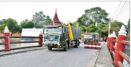
ပြန်လည်ထူထောင်ရေးလုပ်ငန်းများဆောင်ရွက်ရန် အထောက်အကူပြု ကုန်ပစ္စည်းများ တင်ဆောင်လာသည့် မော်တော်ယာဉ်များ မန္တလေးမြို့မှ ထွက်ခွာစဉ်။

နေပြည်တော် မေ ၃၁ နိုင်ငံတော်အစိုးရ အနေဖြင့် တိုင်းရင်းသား လက်နက်ကိုင်အဖွဲ့အချို့နှင့် PDF အမည်ခံ အကြမ်းဖက်သောင်းကျန်းသူများ၏ အကြမ်းဖက်လုပ်ရပ်များကြောင့် ဒေသတွင်း လူမှုစီးပွားဘဝများ ပျက်စီးဆုံးရှုံးမှုဖြစ်ပေါ်ခဲ့သည့် မြို့၊ ရွာများ၌ အစိုးရအုပ်ချုပ်မှုယန္တရားများ ပြန်လည်လည်ပတ်နိုင်ရေးနှင့် ဒေသတွင်းဖွံ့ဖြိုးတိုးတက်ရေးများ ဆောင်ရွက်နိုင်ရန် အတွက် ပြန်လည်ထူထောင်ရေးလုပ်ငန်းများကို အစဉ်တစိုက်ကြိုးပမ်းဆောင်ရွက်လျက်ရှိရာ တပ်မတော်အနေဖြင့် ပြည်သူ့လူထု အေးချမ်းစွာနေထိုင်နိုင်ရေးနှင့် လူမှုစီးပွားဘဝ ဖွံ့ဖြိုးတိုးတက်ရေးအတွက် အကြမ်းဖက်သောင်းကျန်းသူများ ယာယီစိုးမိုးထားသည့် မြို့နယ်၊ ကျေးရွာ၊ ဒေသအချို့တို့၌ အကြမ်းဖက်ချေမှုန်းမှုစစ်ဆင်ရေး(Counter-Terrorism Operation) များကို ဆောင်ရွက်ကာ ပြည်သူ့လူထုအတွက် အရေးပါသည့် ဆက်သွယ်ရေးလမ်းကြောင်းများအနက် တစ်ခုဖြစ်သော မန္တလေး - မတ္တရာ - သပိတ်ကျင်း - တကောင်း-ထီးချိုင့်-ကသာ-အင်းတော်-မော်လူး - နန့်စီးအောင် - မိုးညှင်း - မိုးကောင်း-မြစ်ကြီးနား ဆက်သွယ်ရေးလမ်းကြောင်းတစ်လျှောက်အား အပြည့်အဝ ပြန်လည်ထိန်းချုပ်နိုင်ခဲ့ပြီး လမ်းကြောင်းတစ်လျှောက်ရှိ မြို့၊ ရွာများ၌ ပြန်လည်ထူထောင်ရေးလုပ်ငန်းများ ဆောင်ရွက်နိုင်ရန်အတွက် ပြန်လည်ထူထောင်ရေးလုပ်ငန်းသုံး ပစ္စည်းများနှင့် ဌာနဆိုင်ရာဝန်ထမ်းများကို မန္တလေးမြို့မှ တစ်ဆင့် မြစ်ကြီးနားမြို့သို့ ပထမအကြိမ် အဖြစ် မေလ ၁၂ ရက်တွင် ပို့ဆောင်ပေးခဲ့ပြီးဖြစ်သည်။ အဆိုပါလမ်းကြောင်း တစ်လျှောက်ရှိ မြို့၊ ရွာများ၌ အစိုးရအုပ်ချုပ်ရေးယန္တရားများ ပြန်လည်လည်ပတ်နိုင်ရေး၊ ဒေသခံ