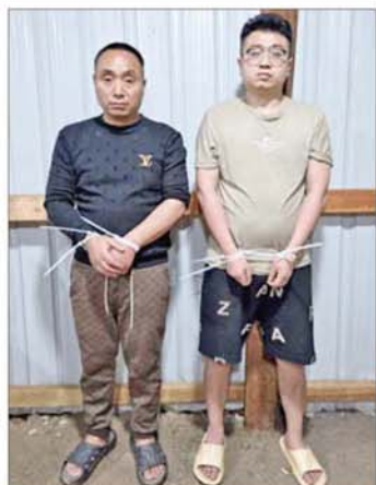
ရှမ်းပြည်နယ်(တောင်ပိုင်း) မိုင်းပန်မြို့နယ် အတွင်း မေ ၆ ရက်တွင် တရားမဝင် အွန်လိုင်းလိမ် လည်လောင်းကစားမှုကျူးလွန်သူ တရုတ်နိုင်ငံ သားနှစ်ဦး ဖမ်းဆီးရမိမှုကို တွေ့ရစဉ်။

ကျူးလွန်ရာတွင် ပါဝင်ပတ်သက်ခဲ့သည့် တရားမဝင် ပြည်ပနိုင်ငံသားများအား လိုအပ်သည့်စစ်ဆေးမှုများ ဆောင်ရွက်ပြီးစီးပါက တည်ဆဲဥပဒေများနှင့်အညီ ထိရောက်ပြင်းထန်စွာ အရေးယူဆောင်ရွက်သွား မည်ဖြစ်ကြောင်း သိရသည်။ ဆက်လက်ဆောင်ရွက်လျက်ရှိ နိုင်ငံတော်အနေဖြင့် အွန်လိုင်းလိမ်လည် လောင်းကစားမှုကျူးလွန်ခြင်းများ ပပျောက်စေရေး နှင့် မြန်မာနိုင်ငံအတွင်း အခြေချလုပ်ကိုင်နိုင်မှုမရှိစေ ရေးအတွက် အိမ်နီးချင်းနိုင်ငံများ၊ ဒေသတွင်းနိုင်ငံ များ၊ နိုင်ငံတကာအဖွဲ့အစည်းများနှင့် ပူးပေါင်း၍ အွန်လိုင်းလိမ်လည်လောင်းကစားမှု တိုက်ဖျက်ရေး လုပ်ငန်းစဉ်များကို တက်ကြွစွာ ဆက်လက်ဆောင် ရွက်လျက်ရှိကြောင်း သိရသည်။ သတင်းဦး