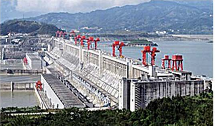
တရုတ်နိုင်ငံအလယ်ပိုင်းရှိ ကမ္ဘာအကြီးဆုံး Three Gorges Dam ရေအားလျှပ်စစ်စက်ရုံ။

အခါတွင်မူ သဘာဝအလျောက် အစဉ်ဖြစ်ပေါ်နေ ခြင်းကို အသုံးပြုခြင်းသာ ဖြစ်လေသည်။ အဘယ် ကြောင့်ဆိုသော် နေ၏အပူကြောင့် ပင်လယ်၊ သမုဒ္ဒရာနှင့် အခြားနေရာများရှိ ရေအချို့သည် လေထုအတွင်းသို့ ရေငွေ့အဖြစ်နှင့် ပျံတက်ကုန် ကြသည်။ ထို့နောက် ထိုရေငွေ့များက တိမ်များ