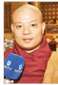
အရှင်ကေလာသ