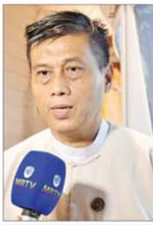
ဦးအောင်ဆန်းဝင်း

ရန်ကုန် မေ ၇ ဆဋ္ဌသင်္ဂါယနာတင် အောင်ပွဲ နှစ်(၇၀)ပြည့် အထိမ်းအမှတ် အထူးပြပွဲကို ရန်ကုန်မြို့ မရမ်းကုန်း မြို့နယ် သီရိမင်္ဂလာကမ္ဘာအေး ကုန်းမြေ မဟာပါသာဏလိုဏ်ဂူ သိမ်တော်ကြီးပတ်လမ်းတွင် ပြသ လျက်ရှိရာ ယနေ့တွင် နိုင်ငံတော် ပရိယတ္တိ သာသနာ့တက္ကသိုလ် (ရန်ကုန်)၊ ရွှေတိဂုံစေတီတော်၊ ဗိုလ်တထောင် ကျိုက်ဒေးအပ် ဆံတော်ဦး စေတီတော်တို့မှ ဂေါပကအဖွဲ့နှင့် ဝန်ထမ်းမိသားစု များ၊ လှည်းကူးပညာရေးဒီဂရီ ကောလိပ်၊ သမိုင်းဓမ္မေယျ သီလရှင် စာသင်တိုက်၊ မင်္ဂလာဒုံမြို့နယ် တောတိုက်ဓမ္မရိပ်သာ ဘုန်းတော် ကြီးသင် ပညာရေးကျောင်းတို့မှ ကျောင်းသား ကျောင်းသူများ၊ စိတ်ပါဝင်စားသူ ရဟန်းရှင်လူ ပြည်သူများ လာရောက်ကြည့်ရှု လေ့လာကြရာ ၎င်းတို့၏ ပြပွဲနှင့် ပတ်သက်သည့် သဘောထား အမြင်များကို ဖော်ပြလိုက်ရပါ သည်။ ဦးအောင်ဆန်းဝင်း နိုင်ငံတော်ပရိယတ္တိ သာသနာ့ပြုတက္ကသိုလ်(ရန်ကုန်) ကျွန်တော်တို့ ထေရဝါဒဗုဒ္ဓ ဘာသာမှာ သင်္ဂါယနာတင်တာ ခြောက်ကြိမ် ရှိခဲ့တယ်။ ဒါကို ရည်ရွယ်ပြီး ဆဋ္ဌသင်္ဂါယနာတင် အောင်ပွဲ နှစ် (၇၀)ပြည့် အထိမ်း အမှတ်အနေနဲ့ ပြပွဲကျင်းပခြင်း ဖြစ်ပါတယ်။ လိုဏ်ဂူပတ်လမ်းမှာ သင်္ဂါယနာတင်တာနဲ့ ပတ်သက် ပြီး အစအဆုံး သိရှိနိုင်အောင် ပြသထားပါတယ်။ ကျွန်တော်တို့ သာသနာရေး ဝန်ကြီးဌာနက အာဏာထဲတွေကို ကွန်ပျူတာ စာစီနဲ့ ဆောင်ရွက်ခဲ့တဲ့ အဆင့်ဆင့် တွေကိုလည်း ပြခန်းတစ်ခုအနေ နဲ့ သီးသန့်ပြသထားပါတယ်။ ဒီပြပွဲပြုလုပ်ရတဲ့ ရည်ရွယ်ချက် ကတော့ နောင်လာနောက်သား လူငယ်တွေ ထေရဝါဒဗုဒ္ဓဘာသာ သာသနာမှာ ဆဋ္ဌသင်္ဂါယနာကို ဘယ်လိုတင်ခဲ့တာဆိုတာ သိရှိ အောင်၊ ရဟန်းရှင်လူ ပြည်သူတွေ လာရောက် ဖူးမြော်နိုင်အောင်