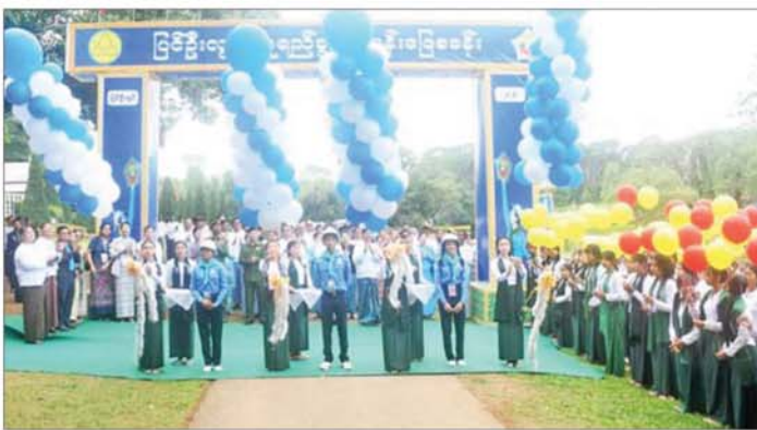
ဆိုင်ရာများ၊ လူရည်ချွန်ကြီးများ၊ ကြီးကြပ်ဆရာ ဆရာမများ၊ ဆရာ ဆရာမများနှင့် လူရည်ချွန် စခန်းသား ကျောင်းသူများ၊ ကြီးကြပ်ဆရာ ဆရာမများ၊ မိတ်ကြားထားသည့် ဧည့်သည် တော်များ တက်ရောက်ကြသည်။ ဦးစွာ ပြင်ဦးလွင်လူရည်ချွန် စခန်းကို လူရည်ချွန်ကျောင်းသား ကျောင်းသူများက ဖဲကြီးဖြတ်

ပြင်ဦးလွင် မေ ၇ မန္တလေး တိုင်းဒေသကြီး ပြင်ဦးလွင် လူရည်ချွန်စခန်းဖွင့်ပွဲကို ယနေ့နံနက် ၈ နာရီက ပြင်ဦးလွင်မြို့နယ်ရှိ ကန်တော်ကြီး အမျိုးသား အထိမ်းအမှတ် ဥယျာဉ်၌ ကျင်းပသည်။ အခမ်းအနားသို့ လူငယ်ရေးရာ ဝန်ကြီးဌာန ပြည်ထောင်စုဝန်ကြီး ဒေါက်တာမောင်သင်း၊ မန္တလေး တိုင်းဒေသကြီး ဝန်ကြီးချုပ် ဦးမျိုးအောင်၊ မန္တလေးတိုင်း ဒေသကြီး လွှတ်တော်ဥက္ကဋ္ဌ၊ ပညာရေးဝန်ကြီးဌာန ဒုတိယ ဝန်ကြီး တိုင်းဒေသကြီးဝန်ကြီး များ၊ လွှတ်တော်ကိုယ်စားလှယ် များ၊ တိုင်းဒေသကြီးအဆင့်ဌာန