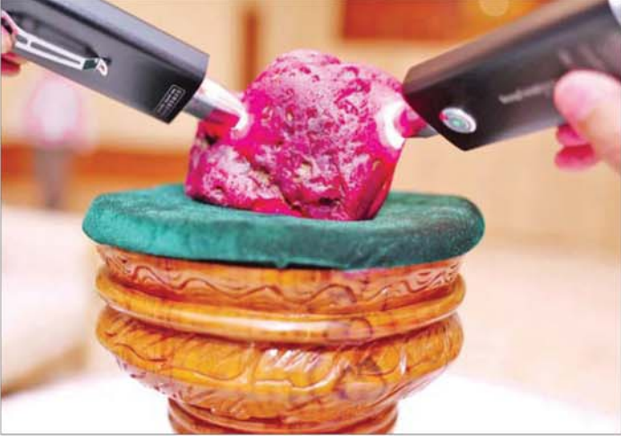
မိုးကုတ်ရတနာမြေမှ ရှာဖွေတွေ့ရှိသည့် ထူးခြားလှပပြီး အရွယ်အစားကြီးမားသော ပတ္တမြားကြီးအား တွေ့ရစဉ်။

အနားတက်ရောက်လာကြသူများသည် ပတ္တမြားကြီးအား ကြည့်ရှုကြသည်။ ယခုရှာဖွေတွေ့ရှိခဲ့သော ပတ္တမြားသည် အလေးချိန် ၂၂၀၀ ဂရမ် (၁၁၀၀၀ ကရက်) ရှိသဖြင့် အရွယ်အစားကြီးမားသောကြောင့် ရှာဖွေတွေ့ရှိရန် ခက်ခဲပြီး ရှားပါးကြောင်း၊ ပတ္တမြားကြီးအနေဖြင့် ခရမ်းရောင်သမ်းသော အနီရောင်တွင် အဝါရိပ်ဖောက်သောအရောင်ရှိပြီး အရောင်အဆင့်အတန်းအားဖြင့် ကောင်းမွန်ကြောင်း၊ အလင်းပေါက်အား သင့်တင့်ပြီးဖန်ရောင်လက်ကောင်းမွန်ကာ ပြုပြင်ထားခြင်းမရှိသော သဘာဝအတိုင်းရှိသည့် ပတ္တမြားကြီးဖြစ်ကြောင်း သိရှိရသည်။ ယခင်က မိမိတို့နိုင်ငံတွင် ရှားပါးပြီးတန်ဖိုးရှိသည့် ၁၉၉၀ ပြည့်နှစ်တွင် ရရှိခဲ့သော အလေးချိန်