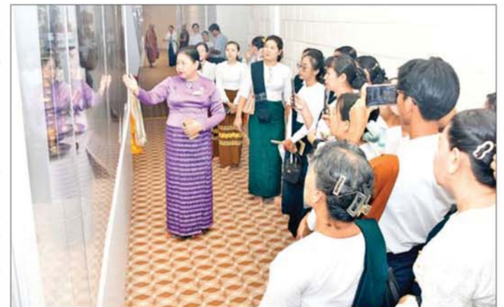
ဆဋ္ဌသင်္ဂါယနာတင်အောင်ပွဲ နှစ်(၇၀)ပြည့်အထိမ်းအမှတ် အထူးပြပွဲသို့ လာရောက်လေ့လာကြည့်ရှု ကြသူများကို တွေ့ရစဉ်။