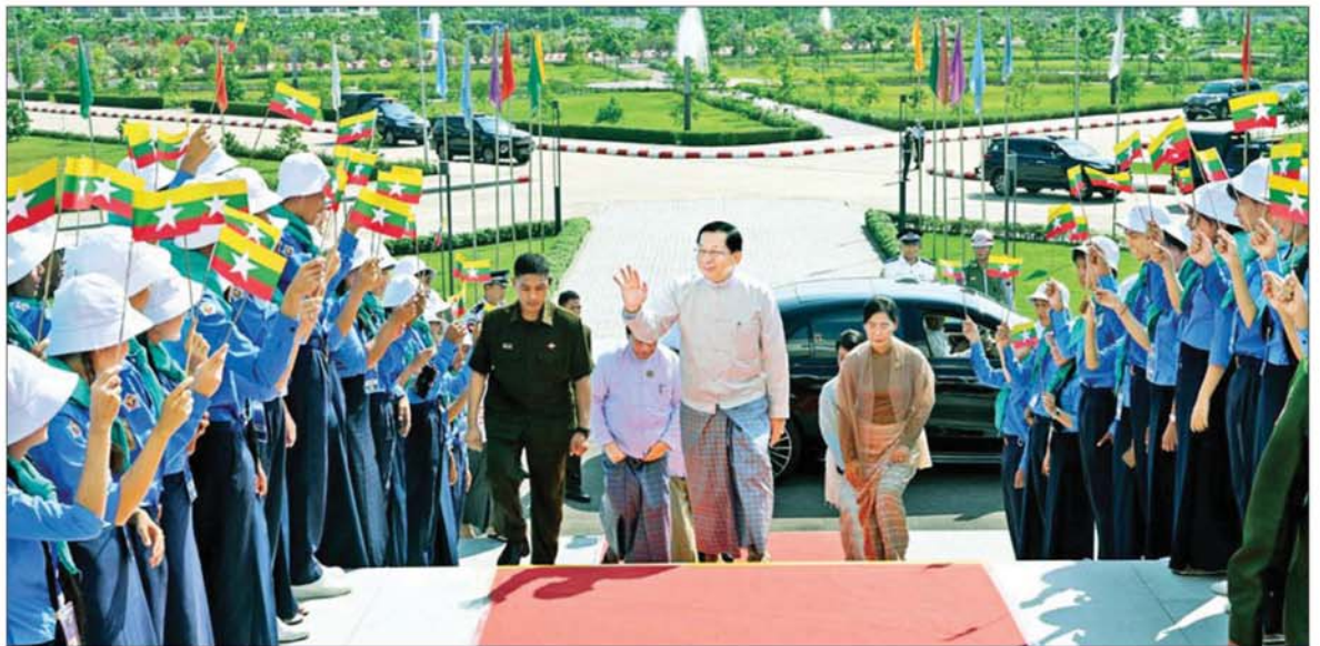
ပြည်ထောင်စုသမ္မတမြန်မာနိုင်ငံတော် နိုင်ငံတော်သမ္မတ ဦးမင်းအောင်လှိုင်အား လူရည်ချွန်မောင်မယ်များ၊ ရေကြောင်းလူငယ်နှင့် လေကြောင်းလူငယ် မောင်မယ်များက လိုက်လှဲနွေးထွေးစွာ ကြိုဆိုနှုတ်ဆက်ကြစဉ်။

ဆက်လက်၍ အခမ်းအနား ဒုတိယပိုင်းကို ကျင်းပပြုလုပ်ရာ နိုင်ငံတော်သမ္မတနှင့် အခမ်းအနားတက်ရောက်လာကြသူများသည် ပြည်ထောင်စုသမ္မတ မြန်မာနိုင်ငံတော်အလံအား အလေးပြု