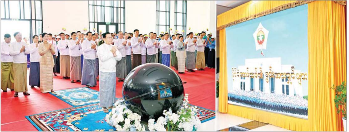
ပြည်ထောင်စုသမ္မတမြန်မာနိုင်ငံတော် နိုင်ငံတော်သမ္မတ ဦးမင်းအောင်လှိုင် "နိုင်ငံတော်သစ်၏ စွမ်းအားရှင်များ" အစီအစဉ်ကို စက်ခလုတ်နှိပ် ဖွင့်လှစ်ပေးစဉ်။

ကျွန်းမှ နေပြည်တော် တိုင်းစစ်ဌာနချုပ် တိုင်းမှူး၊ ဒုတိယဝန်ကြီးများ၊ ပညာရေးဝန်ကြီးဌာနမှ တာဝန်ရှိသူများ၊ အခြေခံပညာကျောင်းများမှ ဆရာ ဆရာမများနှင့် ၂၀၂၅-၂၀၂၆ ပညာသင်နှစ် လူရည်ချွန် မောင်မယ်များ၊ ရေကြောင်းလူငယ်နှင့် လေကြောင်းလူငယ်များ တက်ရောက်ကြသည်။