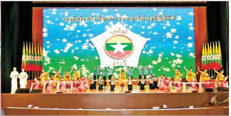
ပြည်ထောင်စုသမ္မတမြန်မာနိုင်ငံတော် နိုင်ငံတော်သမ္မတ ဦးမင်းအောင်လှိုင်နှင့် အခမ်းအနားတက်ရောက်လာကြသူများ ဟိုတယ်၊ ခရီးသွားလာရေးနှင့် ယဉ်ကျေးမှုဝန်ကြီးဌာန အနုပညာဦးစီးဌာနမှ အနုပညာရှင် ဝန်ထမ်းများက "တာဝန်ပညာ" တေးသီချင်းဖြင့် သီဆိုကပြပျော်ဖြေမှုကို ကြည့်ရှုအားပေးကြစဉ်။

၂ စာမျက်နှာ ၄ မှ ယခုကဲ့သို့ ၂၁ ရာစု အသိပညာ ခေတ်၏ စိန်ခေါ်မှုများကို ရင်ဆိုင် နိုင်ရန်မှာ ဘဝတစ်သက်တာ လေ့လာသင်ယူနေရန်၊ စွမ်းဆောင် ရည် ပြည့်ဝနေရန်လိုကြောင်း၊ ထိုသို့ဆိုပါက မိမိတို့ကိုယ်တိုင် အစဉ်အမြဲလေ့လာသင်ယူနေရန် နှင့် ပြင်ပဗဟုသုတနှင့် အသိပညာ အတွက် စာအုပ်စာပေများ ဖတ်ရှု ရမည်ဖြစ်ကြောင်း၊ "ဖတ်လျှင် အမြင်ကျယ်၊ မှတ်လျှင် ပညာမြင့်၊ ကျင့်သော် အောင်မြင်၊ သင်သော် ထူးချွန်၊ ဘဝအတွက် စာကောင်း ပေမွန်" ဆိုသည့် စကားအတိုင်း စာပေလေ့လာဖတ်ရှုသည့် အလေ့ အကျင့်ကို စွဲစွဲမြဲမြဲ လုပ်ဆောင် သွားကြရန် မှာကြားလိုကြောင်း။ ထို့အပြင် ပညာသင်ရာဌာနများ ဖြစ်သည့် အခြေခံပညာကျောင်း များနှင့် တက္ကသိုလ်များတွင်လည်း လူငယ်စကားပိုင်းများ၊ စာပေ ဟောပြောပွဲများ၊ သုတေသန စာတမ်းဖတ်ပွဲများ၊ ပညာရေး