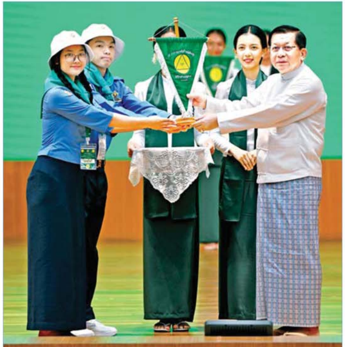
ပြည်ထောင်စုသမ္မတမြန်မာနိုင်ငံတော် နိုင်ငံတော်သမ္မတ ဦးမင်းအောင်လှိုင် ၂၀၂၆ ခုနှစ် လူရည်ချွန် စခန်းအလိုက် အထိမ်းအမှတ်အလံကို နဝမတန်းလူရည်ချွန်မောင်မယ်များထံ ပေးအပ်စဉ်။

တို့ရရှိထားသည့် လူရည်ချွန်ဟု သည့် ဂုဏ်ပုဒ်၊ အဆင့်အတန်းနှင့် အညီ ပြောဆိုနေထိုင်ပြုမူ လုပ်ကိုင်မှုများကို မြှင့်တင်နိုင် အောင် ကြိုးစားသွားကြရမည်ဖြစ် ကြောင်း။ “အတ္တနှင့်ပရ” မျှတမှု ရှိအောင် ကျင့်ကြံနေထိုင်ကြ ရန်နှင့် ခေတ်စနစ်၏တိုးတက်မှု နည်းလမ်းများကို အမြဲမပြတ် ရှာဖွေနေရန် လိုအပ်သကဲ့သို့ မြန်မာမှု၊ မြန်မာဟန်၊ မြန်မာ ရိုးရာယဉ်ကျေးမှု လေ့စရိုက်များ မှေးမှိန်ပျောက်ကွယ်မသွားအောင် လည်း ထိန်းသိမ်းစောင့်ရှောက် သွားကြရန် လိုအပ်ကြောင်း၊ လူငယ်ဘဝတွင် ရှိသည့် ကျင့်ဝတ်များဖြစ်သည့် သားသမီး ကျင့်ဝတ်၊ တပည့်ကျင့်ဝတ်များကို လိုက်နာနေထိုင်ကြရန်နှင့် မိဘ၊ ဆရာသမားတို့ကို ရိုသေလေးစား ပြီး ဘာသာတရား၏ အဆုံးအမ နှင့်အညီ ကိုယ်ချင်းစာမှု၊ သည်းခံ ခွင့်လွှတ်မှုဟူသည့် အခြေခံစိတ် ဓာတ်ကောင်းများ မွေးမြူကြရမည် ဖြစ်ကြောင်း၊ အများကလေးစား အတုယူရမည့် စံပြုပုဂ္ဂိုလ်များဖြစ် အောင် အပတ်တောက် ကြိုးစား အားထုတ်ကြရန် မှာကြား လိုကြောင်း။