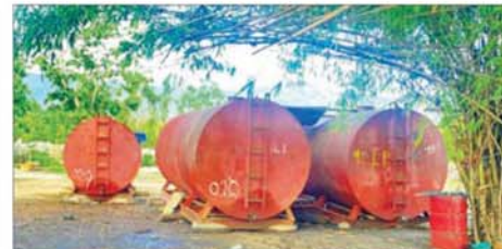
မော်လမြူသို့ ချီတက်တိုက်ခိုက်သိမ်းပိုက်စဉ် လမ်းကြောင်းတစ်လျှောက် အကြမ်းဖက်သောင်းကျန်းသူများ တရားမဝင်လုပ်ကိုင်နေသော စက်သုံးဆီသိုလှောင်သည့် နေရာများမှ ဆီသိုလှောင်ကန်များအား သိမ်းဆည်းရရှိမှုကို တွေ့ရစဉ်။