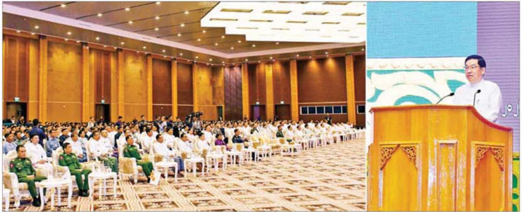
ဒုတိယသမ္မတ ဦးညိုစော နှစ်(၈၀)ပြည့် မြန်မာနိုင်ငံမီးသတ်တပ်ဖွဲ့နေ့အခမ်းအနားတွင် အမှာစကားပြောကြားစဉ်။

မီးသတ်တပ်ဖွဲ့သည် ပြည်ထဲရေးဝန်ကြီးဌာန၏ ဦးဆောင်လမ်းညွှန်မှုများနှင့်အညီ ရည်မှန်းချက် တာဝန်ကြီး(၄)ရပ်ကို ချမှတ်ဆောင်ရွက်လျက်ရှိပြီး မီးသတ်လုပ်ငန်းတာဝန်ဆိုင်ရာ အချိန်နှင့် တစ်ပြေးညီ အရေးပေါ်ချက်ချင်းတုံ့ပြန်ဖြေရှင်း ဆောင်ရွက်ရသည့်လုပ်ငန်းဖြစ်ကြောင်း၊ ယနေ့ခေတ် မီးသတ်တပ်ဖွဲ့သည် မီးငြိမ်းသတ်ရေးလုပ်ငန်း တစ်ခုတည်းသာမက ရှာဖွေကယ်ဆယ်ရေးလုပ်ငန်း