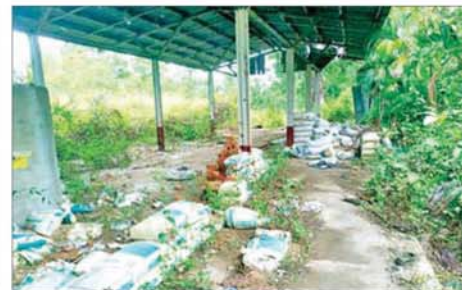
အကြမ်းဖက်သောင်းကျန်းသူများက ဌာနဆိုင်ရာအဆောက်အအုံများအား ဖျက်ဆီး၍ ဘန်ကာများပြုလုပ်ထားရှိမှုကို တွေ့ရစဉ်။