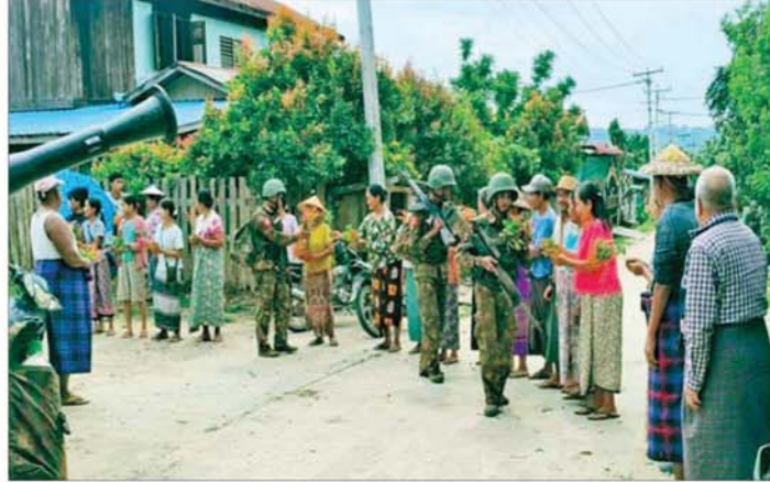
တပ်မတော်စစ်ကြောင်းများ မော်လမြူသို့ ချီတက်သိမ်းပိုက်စဉ် ကျေးရွာများမှ ဒေသခံပြည်သူများက အောင်သပြေပန်းများဖြင့် ဝမ်းသာလှဏ်ယူစွာ ကြိုဆိုကြစဉ်။

မြို့ကို ပြန်လည်သိမ်းပိုက်ထိန်းချုပ်ခဲ့ပြီးနောက် အဆိုပါဒေသတစ်ဝိုက် နယ်မြေရှင်းလင်းခြင်း၊ အောင်မြေချခြင်းများ ဆက်လက်ဆောင်ရွက်ခဲ့ပြီး မော်လမြူအား ဆက်လက်သိမ်းပိုက်ထိန်းချုပ်နိုင်ရေး စစ်ကြောင်းများခွဲ၍ စစ်နည်းဗျူဟာမြောက် ချီတက်ရှင်းလင်းခဲ့ရာ အင်းတော်မြို့နှင့် မော်လမြူအကြားရှိနားမကြိုင်းရွာ၊ ပင့်တင်ရွာနှင့် နဘားကြီးရွာတို့အား စာမျက်နှာ ၉ သို့ ❖