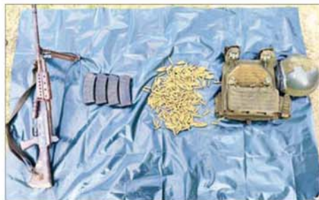
အကြမ်းဖက်သောင်းကျန်းသူပူးပေါင်းအဖွဲ့များထံမှ သိမ်းပိုက်ရရှိသည့် လက်နက်၊ ခဲယမ်းနှင့် ဆက်စပ်ပစ္စည်းများကို တွေ့ရစဉ်။