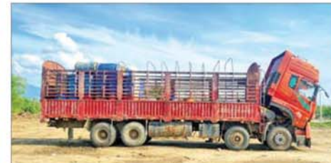
အကြမ်းဖက်သောင်းကျန်းသူများက တရားမဝင်စက်သုံးဆီများ သယ်ဆောင်သည့် မော်တော်ယာဉ်အား သိမ်းဆည်းရမိမှုကို တွေ့ရစဉ်။