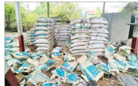
အကြမ်းဖက်သောင်းကျန်းသူများက တရားမဝင်စက်သုံးဆီများ သယ်ဆောင်သည့် မော်တော်ယာဉ်အား သိမ်းဆည်းရမိမှုကို တွေ့ရစဉ်။