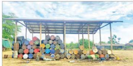
မော်လမြူသို့ ချီတက်တိုက်ခိုက်သိမ်းပိုက်စဉ် လမ်းကြောင်းတစ်လျှောက် အကြမ်းဖက်သောင်းကျန်းသူများ တရားမဝင်လုပ်ကိုင်နေသော စက်သုံးဆီသိုလှောင်သည့် နေရာများမှ ပီပီခွဲများအား သိမ်းဆည်းရရှိမှုကို တွေ့ရစဉ်။