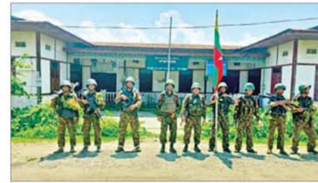
တပ်မတော်စစ်ကြောင်းများက အကြမ်းဖက်သောင်းကျန်းသူပူးပေါင်းအဖွဲ့များ ယာယီစိုးမိုးထားသည့် မော်လမြူအား ပြန်လည်သိမ်းပိုက်ရရှိစဉ်။