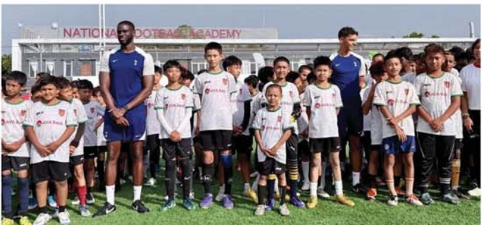
များ ပေးအပ်ခဲ့သည်။ Tottenham Hotspur နည်းပြနစ်ဦးက နွေရာသီဘောလုံးသင်တန်း ဒုတိယလက်တွေ့သင်ကြားပြသပေးခဲ့သည်။ အသင်းကလေးငယ်များအား သည်။ အခြေခံဘောလုံးနည်းစနစ်များကို (NGB)