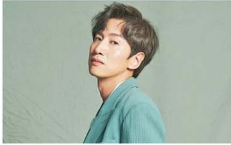
အာရှမင်းသား Running Man အဖွဲ့ဝင်ဟောင်း လီကွမ်ဆူ

အဖြစ် တာဝန်ယူခဲ့ကြောင်း ကိုရီးယားဘိုးဝက်ဘ်ဆိုက်တွင် ဖော်ပြသည်။ လီကွမ်ဆူသည် အနုပညာရှင် နှစ်ဦးဖြစ်သည့် ကင်ဂွာင်းနှင့် ရှင်မင်အာတို့ မင်္ဂလာပွဲတွင် ကင်ဂွာင်း၏ အရင်းနှီးဆုံးသူငယ်ချင်းအဖြစ်သာမက မင်္ဂလာအခမ်းအနားများအဖြစ် တာဝန်ယူပေးခဲ့သည်။ လီကွမ်ဆူနှင့် ကင်ဂွာင်းတို့မှာ GBRB:Joy Pops Laugh