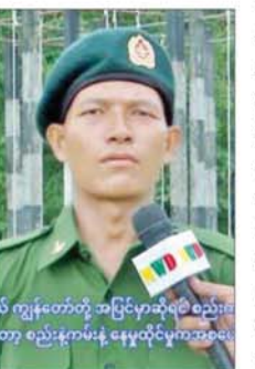
၂။ သင်တန်းမှာ ရရှိခဲ့တဲ့ဆုက တော့ ချေမှုန်းရေးဆု ဖြစ်ပါတယ်။ ကိုယ်တစ်ယောက်ဘာညည်းကောင်းလို့ တော့ မရပါဘူး။ ချေမှုန်းရေးဆု ဆိုတာကတော့ကိုယ်နောက်လိုက် ရဲ့ဘော်တွေ ကောင်းတာရဲ့ ဆရာကြီးတွေရဲ့ သင်ပြပေးတဲ့ နည်းစနစ်တွေကို လိုက်နာ ကျင့်သုံးပြီးမှ ဒီဆုကို ရရှိခဲ့တာပါ။ အများကြီးပြောင်းလဲလာပါတယ်။

ကစပြီး စည်းစနစ်ကျဖို့လိုတယ်။ အချိန် ကန့်သတ်ချက် ရှိတယ်။ တပ်မတော်မှာ One For All ဆိုတဲ့ စကားလုံးရှိပါတယ်။ တစ်ယောက် မကောင်းဘူးဆိုရင် အကုန်လုံး မကောင်းပါဘူး။ တစ်ယောက်ချင်း စီကကောင်းမှ တပ်မတော်က ကောင်းမှာပါ။ ဒါကြောင့် ဒီအတွေ့ အကြုံလေးတွေ ကျွန်တော်ရရှိ ခဲ့ပါတယ်။