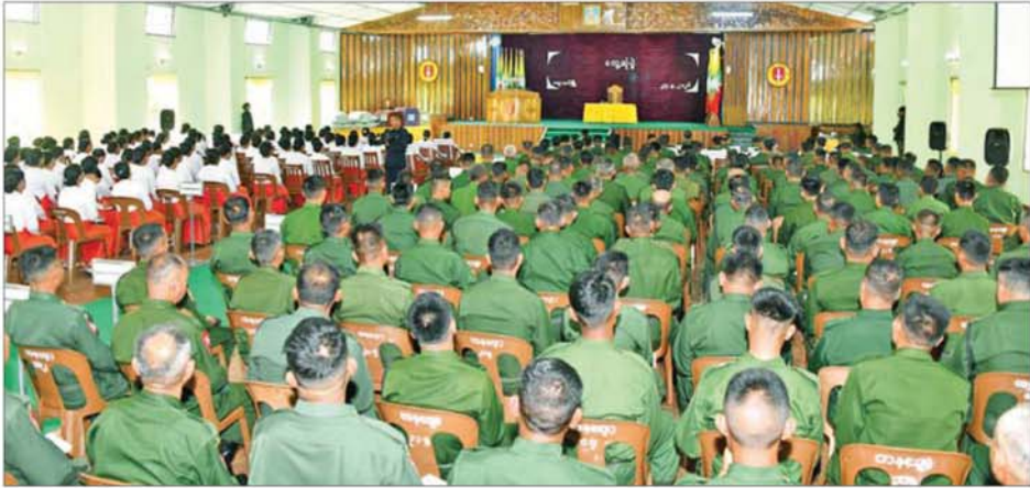
ဒုတိယတပ်မတော်ကာကွယ်ရေးဦးစီးချုပ် ကာကွယ်ရေးဦးစီးချုပ်(ကြည်း) ဗိုလ်ချုပ်ကြီး ကျော်စွာလင်း ဗဟိုတပ်နယ်ရှိ အရာရှိ၊ စစ်သည်၊ မိသားစုများအား တွေ့ဆုံအမှာစကားပြောကြားစဉ်။

နေပြည်တော် မေ ၂၉ ဒုတိယတပ်မတော်ကာကွယ်ရေးဦးစီးချုပ် ကာကွယ်ရေးဦးစီးချုပ်(ကြည်း) ဗိုလ်ချုပ်ကြီးကျော်စွာလင်းသည် စနိုးဒေါ်နန်းကူကူ ကာကွယ်ရေးဦးစီးချုပ်ရုံးမှ အဆင့်မြင့်တပ်မတော်အရာရှိကြီးများနှင့်စနိုးများ၊ အရှေ့ပိုင်းတိုင်းစစ်ဌာနချုပ် တိုင်းမှူးနှင့်တာဝန်ရှိသူများလိုက်ပါ၍ ယနေ့မွန်လွယ်ပိုင်တွင် အောင်ဆန်းခန်းမ၌ ဗဟိုတပ်နယ်ရှိ အရာရှိ၊ စစ်သည်၊ မိသားစုများအား သွားရောက်တွေ့ဆုံ အမှာစကားပြောကြားသည်။