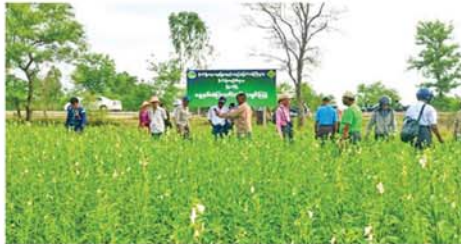
မြို့သစ် မေ ၂၉ မကွေးတိုင်းဒေသကြီး၊ မကွေးခရိုင်၊ မြို့သစ်မြို့နယ် စိုက်

ပျိုးရေးဦးစီးဌာနမှ ၂၀၂၅-၂၀၂၆ ခုနှစ် နေ့နှစ်အထွက်တိုး စံပြ ကွက် ကွင်းသရုပ်ပြပွဲကို ယမန်