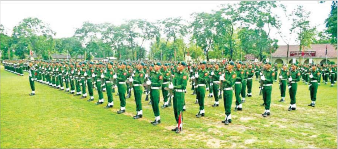
ပြည်သူ့စစ်မှုထမ်းသင်တန်းအမှတ်စဉ်(၂၃) သင်တန်းဆင်းပွဲ ကျင်းပစဉ်။

နေပြည်တော် မေ ၂၉ နိုင်ငံသား တိုင်းသည် ပြည်ထောင်စု မပြိုကွဲရေး၊ တိုင်းရင်းသားစည်းလုံးညီညွတ်မှု မပြိုကွဲရေးနှင့် အချုပ်အခြာ အာဏာ တည်တံ့ခိုင်မြဲရေး ဟူသည့် ဒီတောဝန်အရေးသုံးပါးကို စောင့်ထိန်းရန် တာဝန်ရှိသည့် အပြင် “နိုင်ငံတစ်နိုင်ငံ၏ လွတ်လပ်ရေး၊ အချုပ်အခြာ အာဏာနှင့် နယ်မြေတည်တံ့ ခိုင်မြဲရေးအတွက် နိုင်ငံသားတိုင်း တွင် တာဝန်ရှိသည်” ဟူသည့် ပြည်ထောင်စုသမ္မတ မြန်မာ နိုင်ငံတော် ပွဲစည်းပုံအခြေခံဥပဒေ (၂၀၀၈ ခုနှစ်)ပါ ပြဋ္ဌာန်းချက်များ ကို လက်တွေ့အကောင်အထည် ဖော်ခဲ့သည့် ပြည်သူ့စစ်မှုထမ်း ဥပဒေအရ ယင်းတာဝန်များကို စာမျက်နှာ ၁၀ သို့ ❖