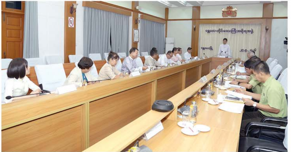
တင်ပြခဲ့ရာ တိုင်းဒေသကြီးအစိုးရအဖွဲ့ဝင် ဝန်ကြီးများက ဖြည့်စွက် ဆွေးနွေးပြောကြားပြီးနောက် တိုင်းဒေသကြီး ဝန်ကြီးချုပ်က ပေါင်းစပ် ခဲ့ကြောင်း သိရသည်။ (မန္တလေးနေ့စဉ်)

ဦးစွာ တိုင်းဒေသကြီးဝန်ကြီးချုပ် ဦးမျိုးအောင်က အဖွင့်အမှာစကားပြောကြားပြီး နောက် မြန်မာ-ဂျပန်မိတ်ဖက်စီးပွားရေးလုပ်ငန်းရှင်များအသင်း (MABA) မှ ဥက္ကဋ္ဌနှင့် တာဝန်ရှိသူများက မြန်မာ-ဂျပန် နှစ်နိုင်ငံ ချစ်ကြည်ရင်းနှီးမှု၊ ယဉ်ကျေးမှုပလ္လင်တန်း၊ ခရီးသွားလုပ်ငန်းမြှင့်တင်ရေးနှင့် MSME စီးပွားရေးလုပ်ငန်းများ ဖွံ့ဖြိုးတိုးတက်စေရန် ရည်ရွယ်ပြီး မြန်မာ-ဂျပန် မိတ်ဖက်စီးပွားရေးလုပ်ငန်းရှင်များအသင်း (MABA)(၁၀)နှစ်ပြည့်အထိမ်းအမှတ်အဖြစ် ၆ ရက်နှင့် ၇ ရက်တို့၌ မင်္ဂလာမန္တလေးပရိမိုးရှင်း ဧရိယာတွင် ကျင်းပမည့် MSME ဈေးရောင်းပွဲတော်နှင့် မြန်မာ-ဂျပန် ပွဲတော်နှင့်ပတ်သက်၍ ဆောင်ရွက်ထားမှုအစီအမံများကို ရှင်းလင်း