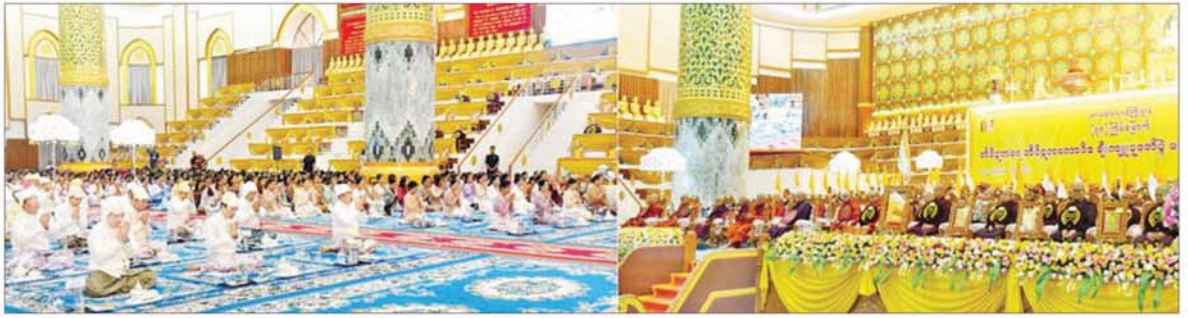
ဒုတိယသမ္မတ ဦးညိုစောနှင့်ဇနီး ဒေါ်စမ်းစမ်းအေးအမှူးပြုသော ဧည့်ပရိသတ်များက တိပိဋကဓရ တိပိဋကကောဝိဒ ရွေးချယ်ရေးစာမေးပွဲ သြဝါဒါစရိယအဖွဲ့ဥက္ကဋ္ဌ ဧရာဝတီတိုင်းဒေသကြီး ဟင်္သာတမြို့ မိုးကောင်းကျောင်းတိုက် ပဓာနနာယက အဘိဓဇမဟာရဋ္ဌဂုရု အဘိဓဇအဂ္ဂမဟာသဒ္ဓမ္မဇောတိက ဘဒ္ဒန္တသုဓမ္မာစရာဘိဝံသ မဟာထေရ် မြတ်ကြီးထံမှ ငါးပါးသီလ ခံယူဆောင်တည်ကြစဉ်။

အခမ်းအနားသို့ နိုင်ငံတော် သံဃမဟာနာယကအဖွဲ့၊ ဥက္ကဋ္ဌ ဆရာတော် သန့်လျင်မြို့မင်းကျောင်း ပထမပြန်စာသင်တိုက် ပဓာနနာယက အဘိဓဇ မဟာရဋ္ဌဂုရု အဂ္ဂမဟာပဏ္ဍိတ အဂ္ဂမဟာသဒ္ဓမ္မ ဇောတိကဓဇ ဒေါက်တာ ဘဒ္ဒန္တစန္ဒိမာဘိဝံသ အမှူးပြုသော ဆရာတော်ကြီးများ၊ တိပိဋကဓရ တိပိဋကကောဝိဒ ရွေးချယ်ရေးအဖွဲ့၊ သြဝါဒါစရိယ ဆရာတော်ကြီးများ၊ တိပိဋကဓရ တိပိဋကကောဝိဒ ဆရာတော်များ၊ တိပိဋကဓရ တိပိဋကကောဝိဒ စာမျက်နှာ ၃ သို့