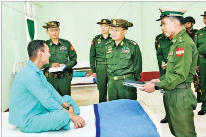
ဒုတိယတပ်မတော်ကာကွယ်ရေးဦးစီးချုပ် ကာကွယ်ရေးဦးစီးချုပ်(ကြည်း) ဝိုင်းချုပ်ကြီးကျော်စွာလင်း ဗဟူးတပ်မြို့ နယ်မြေခံဆေးရုံတွင် တက်ရောက်ကုသမှုခံယူနေသူများအား ရင်းရင်းနှီးနှီး မေးမြန်းအားပေးစကားပြောကြားစဉ်။

နေပြည်တော် မေ ၂၉ ဒုတိယ တပ်မတော်ကာကွယ်ရေးဦးစီးချုပ် ကာကွယ်ရေးဦးစီးချုပ်(ကြည်း) ဝိုင်းချုပ်ကြီးကျော်စွာလင်းသည် ကာကွယ်ရေးဦးစီးချုပ်ရုံးမှ အဆင့်မြင့်တပ်မတော်အရာရှိကြီးများ၊ အရှေ့ပိုင်းတိုင်းစစ်ဌာနချုပ်တိုင်းမှူးနှင့် တာဝန်ရှိသူများလိုက်ပါ၍ ယနေ့တွင် ဗဟူးတပ်မြို့ရှိ သင်တန်းကျောင်းများ၊ နယ်မြေခံတပ်ရင်း/တပ်ဖွဲ့များနှင့် တပ်မတော်ဆေးရုံတို့အား လိုက်လံကြည့်ရှုစစ်ဆေးသည်။