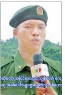
၁။ ပြည်သူ့စစ်မှုထမ်း အမှတ် စဉ်(၂၃)မှ ရရှိခဲ့တဲ့ဆုကတော့ စစ်သည်တော်ကျင့်ဝတ်ဆု ဖြစ်ပါ

ထိုသို့ ပြည်သူ့စစ်မှုထမ်း သင်တန်း အမှတ်စဉ်(၂၃)တွင် တက်ရောက်ခဲ့ကြသည့် အတွေ့ အကြုံများ၊ သင်တန်းမှရရှိခဲ့သည့် အလေ့အကျင့် ကောင်းများ၊ ယုံကြည်ချက်၊ ခံယူချက်များနှင့် သင်တန်းဆင်းပြီးနောက် မိမိတို့ တာဝန်ကျရာတပ်ရင်း၊ တပ်ဖွဲ့ များ၌ ဆက်လက်တာဝန်ထမ်း ဆောင်သွားမည့် အခြေအနေများ နှင့်ပတ်သက်၍ သင်တန်းဆင်း နိုင်ငံ့သားကောင်းစစ်သည်များ၏ စကားသားများကိုလည်း ယခုကဲ့သို့ ကြားသိရပါသည်-