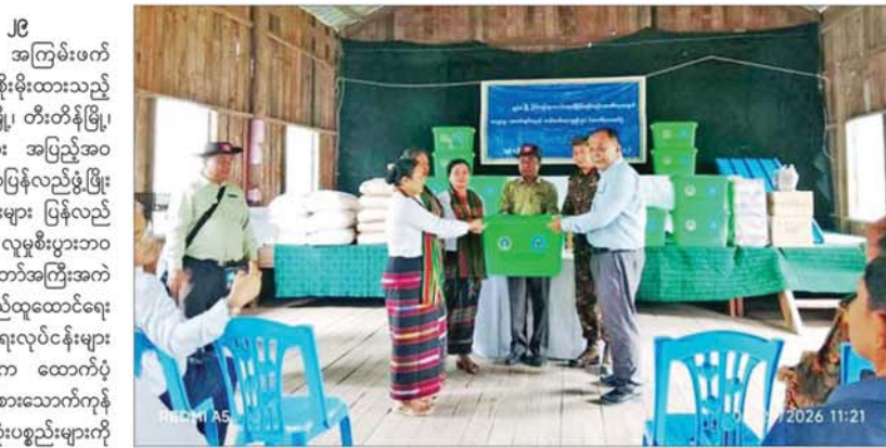
ခဲရသည့် ဆေးရုံများ၊ စာသင်ကျောင်းများ၊ အစိုးရရုံး၊ ဌာနများနှင့် ဘာသာရေးဆိုင်ရာအဆောက်အအုံများ၊ လမ်းတံတားများအား အမြန်ဆုံးပြန်လည်ပြုပြင် တည်ဆောက်ခြင်းလုပ်ငန်းများနှင့် ပြန်လည်ထူထောင်ရေးလုပ်ငန်းများ ဆောင်ရွက်ရာတွင် လိုအပ်သည့် တီလပ်မြေ၊ သွပ်၊ သွပ်ရိုက်သံ အစရှိသည့် ဆောက်လုပ်ရေးလုပ်ငန်းသုံးပစ္စည်းများနှင့် ဒေသခံပြည်သူများအတွက် လူသုံးကုန်ပစ္စည်းများ၊ မီးခိုးချောင်သုံးပစ္စည်းများနှင့် ကျန်းမာရေးသုံးပစ္စည်းများ တင်ဆောင်လာသည့် မော်တော်ယာဉ်

နေပြည်တော် မေ ၂၉ တပ်မတော်အနေဖြင့် အကြမ်းဖက်သောင်းကျန်းသူများ ယာယီစိုးမိုးထားသည့် ချင်းပြည်နယ်အတွင်းရှိ ဖလမ်းမြို့၊ တီးတိန်မြို့၊ တွန်းခဲမြို့နှင့် ဒေသတစ်ဝိုက်တို့အား အပြည့်အဝ ပြန်လည်ထိန်းချုပ်နိုင်ခဲ့ပြီး ဒေသပြန်လည်ဖွံ့ဖြိုးတိုးတက်ရေးနှင့် အုပ်ချုပ်မှုယန္တရားများ ပြန်လည်လည်ပတ်၍ ဒေသခံပြည်သူများ၏ လူမှုစီးပွားဘဝများ တိုးတက်စေရေးအတွက် နိုင်ငံတော်အကြံအကဲ၏ လမ်းညွှန်ချက်နှင့်အညီ ပြန်လည်ထူထောင်ရေးနှင့် ပြန်လည်တည်ဆောက်ရေးလုပ်ငန်းများ ဆောင်ရွက်ရန် နိုင်ငံတော်အစိုးရက ထောက်ပံ့ပေးအပ်သည့် လူသုံးကုန်ပစ္စည်းများ၊ စားသောက်ကုန်များနှင့် ဆောက်လုပ်ရေးလုပ်ငန်းသုံးပစ္စည်းများကို အဆိုပါ မြို့များအရောက် ပို့ဆောင်ပေးလျက်ရှိသည်။