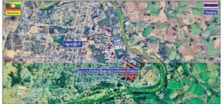
ယနေ့တွင် ယာဉ်ယန္တရားဖြင့် ဖြိုချဖျက်ဆီးရန် သတ်မှတ်ထား သည့် အဆောက်အအုံ ၅၇ လုံး

ဖြင့် ဖြိုချဖျက်ဆီးမည့် အဆောက် အအုံ ၅၇ လုံးနှင့် ဖောက်ခွဲ၍ဖျက်ဆီး မည့် အဆောက်အအုံ အလုံး ၂၀ တို့ကို အဆောက်အအုံ အမျိုး အစားအလိုက် ခွဲခြားသတ်မှတ်၍ စနစ်တကျ ဖြိုချဖျက်ဆီးခြင်း ဖြစ်ကြောင်း သိရသည်။