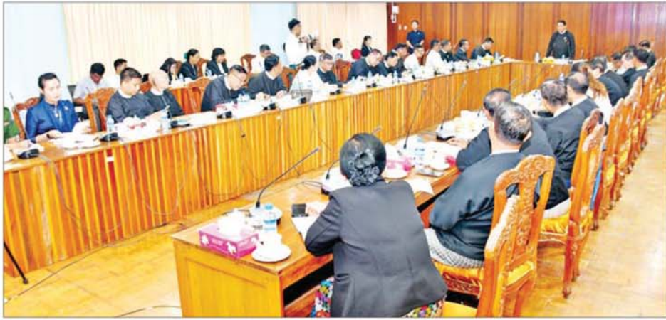
ပြည်သူ့လွှတ်တော်ဥက္ကဋ္ဌ ဦးခင်ရီ ရန်ကုန်တိုင်းဒေသကြီးလွှတ်တော်ဥက္ကဋ္ဌ၊ ဒုတိယဥက္ကဋ္ဌ၊ ဥပဒေကြမ်းကော်မတီနှင့် ဥပဒေရေးရာနှင့် အထူးကိစ္စရပ်များ လေ့လာသုံးသပ်ရေးအဖွဲ့ ဝင်တို့နှင့် တွေ့ဆုံပွဲအခမ်းအနားတွင် အမှာစကားပြောကြားစဉ်။

ရန်ကုန် မေ ၂၉ ပြည်သူ့လွှတ်တော် ဥက္ကဋ္ဌ ဦးခင်ရီသည် ရန်ကုန်တိုင်းဒေသကြီး လွှတ်တော်ဥက္ကဋ္ဌ ဦးဌေးအောင်၊ ဒုတိယဥက္ကဋ္ဌ ဦးကျော်ကျော်စိုး၊ ဥပဒေကြမ်းကော်မတီ၊ ဥပဒေရေးရာနှင့် အထူးကိစ္စရပ်များ လေ့လာသုံးသပ်ရေး အဖွဲ့ဝင်များ၊ ဥပဒေပညာရှင် (အငြိမ်းစား)များ အား ယနေ့မွန်းလွဲပိုင်းတွင် ရန်ကုန် တိုင်းဒေသကြီး လွှတ်တော်ရုံး ပုလဲခန်းမ၌ တွေ့ဆုံသည်။ ဦးစွာ ရန်ကုန်တိုင်းဒေသကြီး လွှတ်တော်ဥက္ကဋ္ဌ ဦးဌေးအောင်က ဥပဒေရေးရာနှင့် အထူးကိစ္စရပ်များ လေ့လာသုံးသပ်ရေးအဖွဲ့ ဖွဲ့စည်း ထားရှိမှုနှင့်စပ်လျဉ်း၍ ရှင်းလင်း တင်ပြပြီး အဖွဲ့ဝင်များက တစ်ဦးချင်း မိတ်ဆက်စကားပြောကြား သည်။