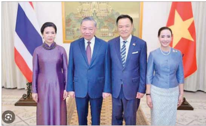
မှုများကို ကိုင်တွယ်ဖြေရှင်းရန် ထိုင်းနှင့် ဗီယက်နမ်တို့ ပိုမိုနီးကပ်စွာ ပူးပေါင်းဆောင်ရွက်ရန် လိုအပ်ကြောင်း ထိုင်းဝန်ကြီးချုပ် အနုတင်က ပြောကြားသည်။

လက်ရှိ ကမ္ဘာ့စီးပွားရေး အခြေအနေ မတည်ငြိမ်