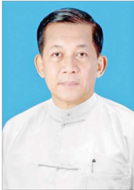
နိုင်ငံတော်သမ္မတ ဦးမင်းအောင်လှိုင်