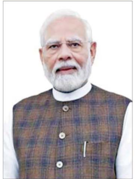
အိန္ဒိယသမ္မတနိုင်ငံ ဝန်ကြီးချုပ် ရှင်္ဂါ နာရန်ဒရာ မိုဒီ