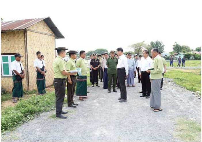
အခက်အခဲမရှိစေရေး တာဝန် ဆောင်ရွက်ပေးခဲ့ပြီး ဆန်ထုတ် လိုက်လံကြည့်ရှုခဲ့ကြောင်း သိရ ရှိသူများနှင့် ပေါင်းစပ်ညှိနှိုင်း လုပ်မှု နည်းစဉ်အဆင့်ဆင့်ကို သည်။ (မန္တလေးနေ့စဉ်)

ဒေသကြီး ဝန်ကြီးချုပ်နှင့် အဖွဲ့ အား ဆန်စက်တာဝန်ခံက ကုန် ကြမ်းများကို မြန်မာနိုင်ငံ ဒေသ အသီးသီးမှထွက်ရှိသည့် ဆန်၊ ဆန်ကွဲများအား တစ်နှစ်လျှင် တန်ချိန် ၃၀၀၀ ခန့် ဝယ်ယူ ကြိုတင်ခွဲ နေမှု၊ တစ် နေ့လျှင် တန်ချိန် ၂၀၀ ခန့် ထုတ်လုပ် နိုင်မှု၊ တစ်နှစ်လျှင် ဆန်၊ ဆန်ကွဲ စုစုပေါင်း တန်ချိန် ၂၅၀၀၀ ကျော် ထုတ်လုပ်နိုင်မှု၊ ပြည်ပသို့ အမည် အသွေးပြည့်စီသောဆန်များ နှစ်စဉ် တင်ပို့နေမှုနှင့် မြန်မာ့လယ်ယာ ဆန်စပါးလုပ်ငန်း ဖွံ့ဖြိုးတိုးတက် ရေးအတွက် ကြိုးစားဆောင်ရွက် နေမှုများကို ရှင်းလင်းတင်ပြရာ တိုင်းဒေသကြီး ဝန်ကြီးချုပ်က လုပ်ငန်း လည်ပတ်နေမှုများ