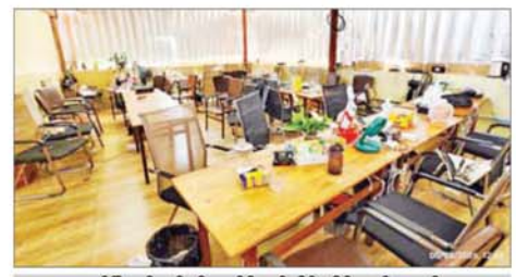
မူဆယ်မြို့ စွမ်းစော်ရပ်ကွက်၌ အွန်လိုင်းလိမ်လည်လောင်းကစားမှုလုပ်ကိုင်သည့် လုပ်ငန်းနေရာအား တွေ့ရစဉ်။

၂၁ ဦးတို့အား အွန်လိုင်းလိမ်လည်လောင်းကစားမှုကျူးလွန်ရာတွင် အသုံးပြုသည့် ဖုန်းမျိုးစုံ ၉၆ လုံး၊ All In One ကွန်ပျူတာ ၃၇လုံး၊ Laptop တစ်လုံး၊ Power Station (အကြီး) တစ်လုံး၊ Power Station