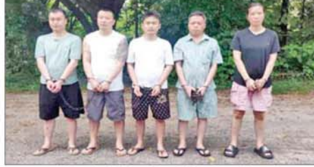
မူဆယ်မြို့ စွမ်းစော်ရပ်ကွက်၌ အွန်လိုင်းလိမ်လည်လောင်းကစားမှုလုပ်ကိုင်သည့် တရုတ်နိုင်ငံသား အမျိုးသား လေးဦးနှင့် အမျိုးသမီး တစ်ဦးတို့အား ဖမ်းဆီးရမိစဉ်။