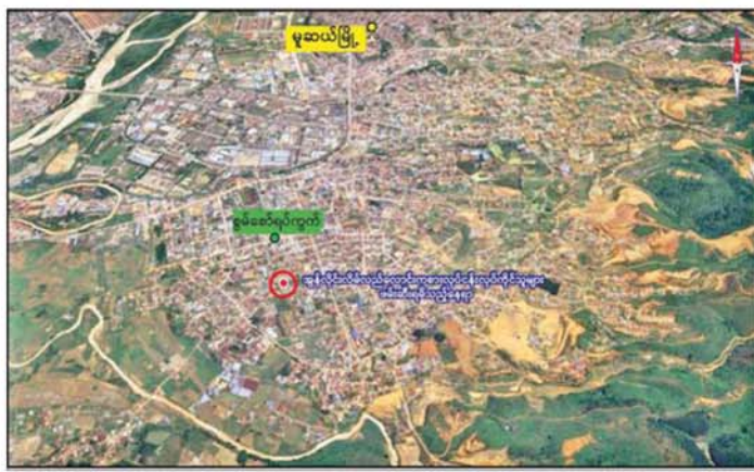
ရှမ်းပြည်နယ် (မြောက်ပိုင်း) မူဆယ်မြို့ စွမ်းစော်ရပ်ကွက်၌ အွန်လိုင်းလိမ်လည်လောင်းကစားမှု ကျူးလွန်ခဲ့သူများနှင့် လုပ်ငန်းလုပ်ကိုင်ရာတွင် အသုံးပြုသည့် ဆက်စပ်ပစ္စည်းများ ဖမ်းဆီးရမိသည့် နေရာပြပုံ။

နေပြည်တော် မေ ၂၈ မြန်မာနိုင်ငံ အစိုးရအနေဖြင့် တစ်ကမ္ဘာလုံးကို အန္တရာယ်ပေးနေသည့် အွန်လိုင်းလိမ်လည်လောင်းကစားမှုများ မြန်မာနိုင်ငံအတွင်း လုံးဝအခြေမပြုနိုင်ရေးအတွက် တိုင်းဒေသကြီးနှင့် ပြည်နယ်အလိုက် နယ်မြေဒေသအသီးသီး၌ ဌာနဆိုင်ရာတာဝန်ရှိသူများပါဝင်သော ပူးပေါင်းအဖွဲ့များဖြင့် ရှာဖွေစစ်ဆေးဖော်ထုတ်မှုများ ဆောင်ရွက်လျက်ရှိရာ ယနေ့ညနေပိုင်းတွင် ရှမ်းပြည်နယ် (မြောက်ပိုင်း) မူဆယ်မြို့ စွမ်းစော်ရပ်ကွက်၌ အွန်လိုင်းလိမ်လည်လောင်းကစားမှုများ ကျူးလွန်လုပ်ကိုင်နေသည့် ပြည်ပနိုင်ငံသားများနှင့် မြန်မာနိုင်ငံသား ၂၈ ဦးအား လုပ်ငန်းလုပ်ကိုင်ရာတွင် အသုံးပြုသည့် ဆက်စပ်ပစ္စည်းများနှင့်အတူ ဖမ်းဆီးရမိခဲ့သည်။ လုံခြုံရေး ပူးပေါင်းအဖွဲ့များက မူဆယ်မြို့နယ်အတွင်း အွန်လိုင်းလိမ်လည် လောင်းကစားမှုများ