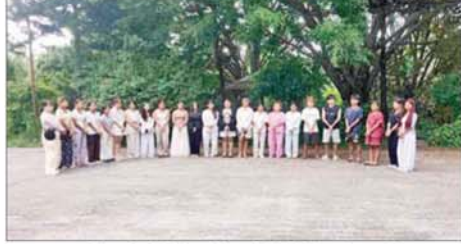
မူဆယ်မြို့ စွမ်းစော်ရပ်ကွက်၌ အွန်လိုင်းလိမ်လည်လောင်းကစားမှုလုပ်ကိုင်သည့် မြန်မာနိုင်ငံသား အမျိုးသား သုံးဦးနှင့် အမျိုးသမီး ၂၀ တို့အား ဖမ်းဆီးရမိစဉ်။

နိုင်ငံတော်အနေဖြင့် အွန်လိုင်းလိမ်လည် လောင်းကစားမှုကျူးလွန်ခြင်းများ ပပျောက်စေရေးနှင့် မြန်မာနိုင်ငံအတွင်း အခြေချလုပ်ကိုင်နိုင်မှု မရှိစေရေးအတွက် အိမ်နီးချင်းနိုင်ငံများ၊ ဒေသတွင်းနိုင်ငံများ၊ နိုင်ငံတကာအဖွဲ့အစည်းများနှင့်ပူးပေါင်း၍ အွန်လိုင်းလိမ်လည်လောင်းကစားမှု တိုက်ဖျက်ရေး လုပ်ငန်းစဉ်များကို တက်ကြွစွာ ဆက်လက်ဆောင်ရွက်လျက်ရှိကြောင်း သိရသည်။ သတင်းစဉ်