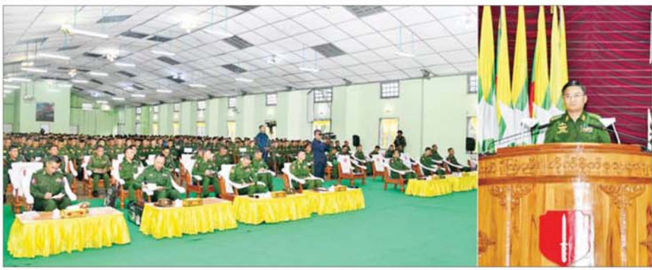
ဒုတိယတပ်မတော်ကာကွယ်ရေးဦးစီးချုပ် ကာကွယ်ရေးဦးစီးချုပ်(ကြည်း) ဗိုလ်ချုပ်ကြီး ကျော်စွာလင်း ဗထူးတပ်နယ်ရှိ ခြေလျင်တပ်စုမှူး၊ တပ်ခွဲမှူး၊ တပ်ရင်းမှူး၊ သင်တန်းသားများနှင့် သင်တန်းနည်းပြများအား တွေ့ဆုံ အမှာစကားပြောကြားစဉ်။

နေပြည်တော် မေ ၂၈ တပ်မတော် အနေဖြင့် နိုင်ငံတော်၏ အမျိုးသား အကျိုးစီးပွားဖြစ်သည့် ဒို့တာဝန် အရေးသုံးပါးကို ကာကွယ်စောင့်ရှောက်ရန်၊ နိုင်ငံတော်ကို ဒီမိုကရေစီနှင့် ဖက်ဒရယ်စနစ်ကို အခြေခံသည့် ပြည်ထောင်စုစနစ် တည်ဆောက်နိုင်ရန်အတွက် နိုင်ငံတော်ပြင် အေးချမ်းမှုသည် အရေးကြီးသဖြင့် အင်အားတောင့်တင်းနိုင်စွမ်း ရှိရမည် ထက်မြက်သည့် တပ်မတော် ဖြစ်စေရေးအတွက် တပ်မတော်သား တစ်ဦးချင်းစီ၏ စွမ်းရည် ထက်မြက်စေရေး လေ့ကျင့်သွားရန် လိုအပ်ကြောင်း ဒုတိယတပ်မတော် ကာကွယ်ရေးဦးစီးချုပ် ကာကွယ်ရေးဦးစီးချုပ်(ကြည်း) ဗိုလ်ချုပ်ကြီး ကျော်စွာလင်းက ယနေ့မွန်လွဲပိုင်းတွင် ဗထူးတပ်နယ်ရှိ ခြေလျင်တပ်စုမှူး၊ တပ်ခွဲမှူး၊ တပ်ရင်းမှူး၊ သင်တန်းသားများနှင့် သင်တန်းနည်းပြများအား တွေ့ဆုံအမှာစကားပြောကြားစဉ် ထည့်သွင်းပြောကြားသည်။ အဆိုပါ တွေ့ဆုံပွဲသို့ ဒုတိယတပ်မတော်ကာကွယ်ရေးဦးစီးချုပ် ကာကွယ်ရေးဦးစီးချုပ်(ကြည်း)နှင့် အတူ ကာကွယ်ရေးဦးစီးချုပ်ရုံးမှ အဆင့်မြင့် တပ်မတော်အရာရှိကြီးများ၊ အရပ်ပိုင်းတိုင်းစစ်ဌာနချုပ် တိုင်းမှူးနှင့် တာဝန်ရှိသူများ၊ ဗထူးတပ်နယ်ရှိ ခြေလျင်တပ်စုမှူး၊ တပ်ခွဲမှူး၊ တပ်ရင်းမှူး၊ သင်တန်းသားများနှင့် သင်တန်းနည်းပြများ တက်ရောက်ကြသည်။ ဦးစွာ ဒုတိယတပ်မတော် ကာကွယ်ရေးဦးစီးချုပ် ကာကွယ်ရေးဦးစီးချုပ်(ကြည်း) ဗိုလ်ချုပ်ကြီး ကျော်စွာလင်းက တွေ့ဆုံအမှာစကားပြောကြားရာတွင် ရှေ့တန်းစစ်မျက်နှာတွင် အသက်နှင့် ခန္ဓာကို အပ်နှံခြင်းဖြစ်သည့် စစ်ဆင်ရေးတာဝန်များကို ရွယ်ရွယ်ချွန်ချွန် ထမ်းဆောင်ခဲ့ပြီး သင်တန်းလာရောက်တက်ကြ