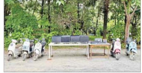
မူဆယ်မြို့ စွမ်းစော်ရပ်ကွက်၌ အွန်လိုင်းလိမ်လည်လောင်းကစားမှုလုပ်ကိုင်သည့် နေရာမှ သိမ်းဆည်းရရှိသည့် လုပ်ငန်းသုံးဆက်စပ်ပစ္စည်းများကို တွေ့ရစဉ်။