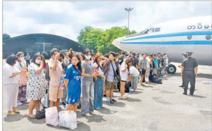
ကမ္ဘောဒီးယားနိုင်ငံတွင် အခက်အခဲကြုံတွေ့နေရသည့် မြန်မာနိုင်ငံသားများအား တပ်မတော် လေယာဉ်ဖြင့် ပြန်လည်ခေါ်ဆောင်စဉ်။