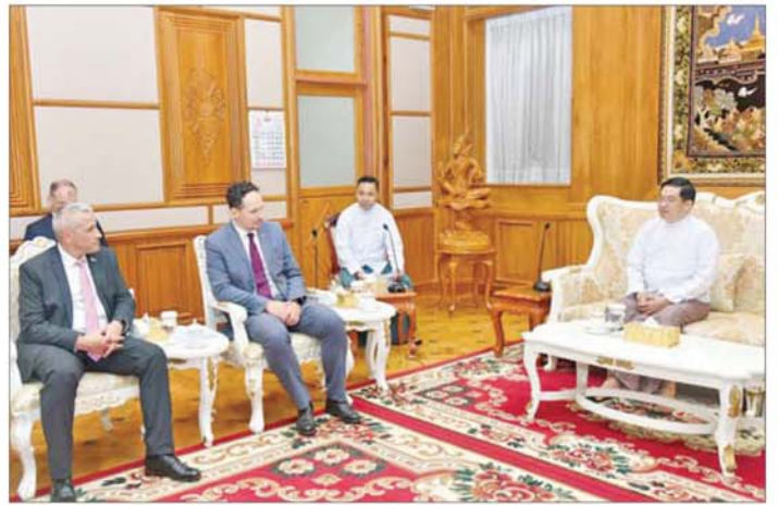
ဒုတိယသမ္မတ ဦးညိုစော ဘယ်လာရစ်သမ္မတနိုင်ငံ ဗဟိုဘဏ်ဒုတိယဥက္ကဋ္ဌ H.E. Mr. Alexander EGOROV ဦးဆောင်သည့် ကိုယ်စားလှယ်အဖွဲ့အား လက်ခံတွေ့ဆုံစဉ်။

ရင်းနှီးမြှုပ်နှံမှုလုပ်ငန်းများကို အထောက်အကူပြု နိုင်မည့် ဘဏ်လုပ်ငန်းဆိုင်ရာဝန်ဆောင်မှုများ ပူးပေါင်းဆောင်ရွက်သွားနိုင်ရေး ကိစ္စရပ်များနှင့် စပ်လျဉ်း၍ ရင်းနှီးပွင့်လင်းစွာ ဆွေးနွေးကြသည်။ တွေ့ဆုံပွဲသို့ ဒုတိယသမ္မတဦးညိုစောနှင့်အတူ ဒုတိယဝန်ကြီး ဦးခင်လတ်၊ မြန်မာနိုင်ငံတော်ဗဟို ဘဏ် ဒုတိယဥက္ကဋ္ဌ ဦးစော်မြင့်နိုင်နှင့် တာဝန်ရှိသူ များ တက်ရောက်ကြပြီး ဘယ်လာရစ်သမ္မတနိုင်ငံ ဗဟိုဘဏ်ဒုတိယဥက္ကဋ္ဌနှင့်အတူ ဟန့်ဗရိုအခြေစိုက် မြန်မာနိုင်ငံဆိုင်ရာ ဘယ်လာရစ်သမ္မတနိုင်ငံ သံအမတ်ကြီး H.E. Mr. Uladzimir BARAVIKOV နှင့် တာဝန်ရှိသူများ တက်ရောက်ကြသည်။ သတင်းစဉ်