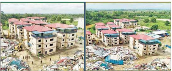
ကရင်ပြည်နယ် မြဝတီမြို့နယ် ရွှေကုက္ကိုလ်ဒေသ၌ အွန်လိုင်းလိမ်လည်လောင်းကစားလုပ်ငန်းလုပ်ကိုင်ခဲ့သော အဆောက်အအုံများကို မဖြိုဖျက်မီနှင့် ဖြိုဖျက်ပြီးနောက် တွေ့ရစဉ်။

နိုင်ငံတော် အစိုးရအနေဖြင့် နိုင်ငံတကာနှင့် တစ်ကမ္ဘာလုံးကို အန္တရာယ်ပေးနေသည့် အွန်လိုင်းလိမ်လည် လောင်းကစားမှုတိုက်ဖျက်ရေး လုပ်ငန်းစဉ်များကို အမျိုးသားရေး တာဝန်တစ်ရပ်အဖြစ် ဖြစ်လာကာ မြန်မာနိုင်ငံအတွင်း လုံးဝအခြေမပြုနိုင်ရေးအတွက် ပြည်တွင်းအင်အားစုများအပြင် အိမ်နီးချင်းနိုင်ငံ အစိုးရများနှင့်လည်း ပေါင်းစပ်ညှိနှိုင်း၍ တက်ကြွစွာ ဆောင်ရွက်လျက်ရှိကြောင်း သိရသည်။ သတင်းစဉ်