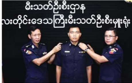
မီးသတ်ဦးစီးဌာန လေးတိုင်းဒေသကြီးမီးသတ်ဦးစီးမှူးရုံး