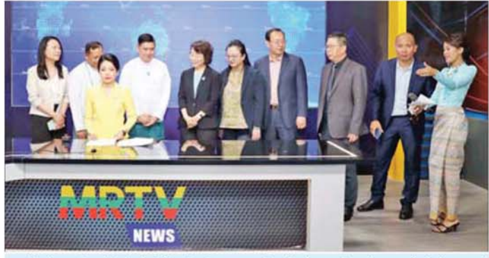
ပြည်ထောင်စုဝန်ကြီး ဦးထိန်လင်းနှင့် မစ္စ ချောင်ရှမ်း ဦးဆောင်သည့် တရုတ်ကိုယ်စားလှယ် အဖွဲ့ တပ်ကုန်းမြို့ရှိ မြန်မာ့အသံနှင့်ရုပ်မြင်သံကြားတွင် လှည့်လည်ကြည့်ရှုစဉ်။

နေပြည်တော် မေ ၂၇ ပြန်ကြားရေးဝန်ကြီးဌာန နိုင်ငံ တရုတ်ကွန်မြူနစ်ပါတီဗဟို ရေဒီယိုနှင့် ရုပ်မြင်သံကြားအုပ် ဖွဲ့ချုပ်အဖွဲ့ဝင်များနှင့် အစည်းအဝေး ပြည်ထောင်စုဝန်ကြီး ဦးထိန်လင်း ကော်မတီ ပြန်ကြားရေးဌာန၏ ချုပ်မှုဆိုင်ရာဝန်ကြီး မစ္စချောင်