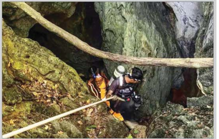
ပျောက်ဆုံးနေသူများကို ရှာဖွေရန်အတွက် လိုက်ဂူအတွင်းသို့ ကယ်ဆယ်ရေးသမားများ ဝင်ရောက်ရန် ကြိုးပမ်းနေမှုကို မေ ၂၆ ရက်က တွေ့ရစဉ်။

ကျေးရွာသား ခုနစ်ဦးသည် လာအိုနိုင်ငံ၏ မြို့တော်ဗီယံကျွန်း၏ အရှေ့မြောက်ဘက် ၁၂၅ ကီလိုမီတာခန့်အကွာ ဆိုင်စမ်ဘွန်းပြည်နယ်ရှိ လိုက်ဂူတစ်ခုအတွင်းသို့ မေ ၂၀ ရက်တွင် ဝင်ရောက် သွားခဲ့ကြောင်း နိုင်ငံပိုင်မီဒီယာ၏ ဖော်ပြချက်အရ သိရသည်။ အဆိုပါ ကျေးရွာသားများသည် ရွှေရှာဖွေ ရန် ဝင်ရောက်သွားခဲ့ခြင်းဖြစ်သော်လည်း မိုးသည်း