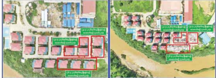
ကရင်ပြည်နယ် မြဝတီမြို့နယ် ရွှေကုက္ကိုလ်ဒေသ အွန်လိုင်းလိမ်လည်လောင်းကစားလုပ်ငန်းလုပ်ကိုင်ခဲ့သော အဆောက်အအုံများကို မဖြိုချဖျက်ဆီးနှင့် ဖြိုချဖျက်ပြီးနောက် တွေ့ရစဉ်။

လောင်းကစားမှုကျူးလွန်မှုများကို အမျိုးသားရေး အပြင် အိမ်နီးချင်းနိုင်ငံအစိုးရများနှင့်လည်း ပေါင်းစပ်တာဝန်တစ်ရပ်အဖြစ်ယူကာ မြန်မာနိုင်ငံအတွင်း ညှိနှိုင်း၍ ဆက်လက်ဆောင်ရွက်သွားမည်ဖြစ်ကြောင်း လုံးဝအခြေမပြုနိုင်ရေး ပြည်တွင်းအင်အားစုများ သိရသည်။ သတင်းစဉ်