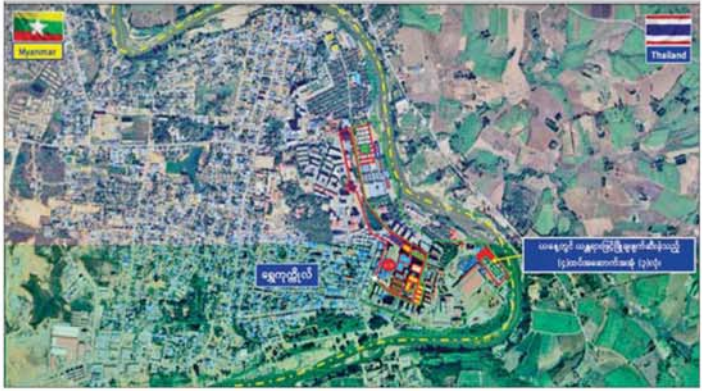
ကရင်ပြည်နယ် မြဝတီမြို့နယ် ရွှေကုက္ကိုလ်ဒေသရှိ တရားမဝင်အဆောက်အအုံများကို ဖောက်ခွဲဖျက်ဆီးမှု။

နိုင်စေရေးအတွက် အပြီးတိုင်ဖြိုချဖျက်ဆီးခြင်းများ ဆောင်ရွက်လျက်ရှိပါသည်။ ထိုသို့ဆောင်ရွက်လျက်ရှိရာ ရွှေကုက္ကိုလ်နယ်မြေအတွင်းရှိ အွန်လိုင်းလိမ်လည်လောင်းကစားလုပ်ငန်းလုပ်ကိုင်ရာတွင် အသုံးပြုသည့် အဆောက်အအုံ ၇၇ လုံးကို အဆောက်အအုံအမျိုးအစားအလိုက် ယာဉ်ယန္တရားဖြင့် ဖြိုချဖျက်ဆီးမည့် အဆောက်အအုံ ၅၇ လုံး၊ ဖောက်ခွဲ၍ဖျက်ဆီးမည့် အဆောက်အအုံ ၂၀ ခွဲခြားသတ်မှတ်၍ စနစ်တကျ ဖြိုချဖျက်ဆီးခြင်းများ ဆောင်ရွက်လျက်ရှိရာ ယနေ့တွင် ယာဉ်ယန္တရားဖြင့်ဖြိုချဖျက်ဆီးရန် သတ်မှတ်ထားသည့် အဆောက်အအုံ ၅၇ လုံးအနက် လေးထပ်လူနေအဆောက်အအုံ သုံးလုံးကို ယာဉ်ယန္တရားများအသုံးပြု၍ စနစ်တကျထပ်မံဖြိုချဖျက်ဆီးခဲ့သဖြင့် စုစုပေါင်းအဆောက်အအုံ ကိုးလုံးအား ဖြိုချဖျက်ဆီးပြီးဖြစ်ရာ ဖျက်ဆီးရန်ကျန် တရားမဝင်အဆောက်အအုံ ၆၈ လုံး ကျန်ရှိနေသေးကြောင်းနှင့် ၎င်းတို့အား ဆက်လက်၍ စနစ်တကျဖျက်ဆီးသွားမည် ဖြစ်ကြောင်း သိရသည်။ နိုင်ငံတော်အစိုးရအနေဖြင့် အွန်လိုင်းလိမ်လည်