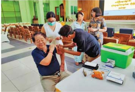
မန္တလေး မေ ၂၇ နှစ်နှင့်အထက် သက်ကြီးဆရာဝန် မြန်မာနိုင်ငံ ဆရာဝန်အသင်း ကြီးများအား တပ်ကွေးရောဂါ (မန္တလေး) သက်ကြီးဆရာဝန်များ ကာကွယ်ဆေးအခမဲ့ထိုးနှံပေးခြင်း ထောက်ကူပြုအဖွဲ့မှ အသက်(၈၀) ကို မေ ၂၆ ရက် နံနက် ၈ နာရီ

က ချမ်းအေးသာစံမြို့နယ်၊ ရန်မျိုး လုံရပ်ကွက်၊ ၃လမ်းနှင့် ၄လမ်း ၇၀ထောင်ရှိ မြန်မာနိုင်ငံ ဆရာဝန် အသင်း(မန္တလေး) ရတနာပုံခန်းမ တွင် ကျင်းပခဲ့သည်။ သက်ကြီးဆရာဝန်ကြီးများ အား တပ်ကွေးရောဂါကာကွယ် ဆေး Flu Vaccine ထိုးနှံပေးရာ မြန်မာနိုင်ငံ ဆရာဝန်အသင်း (မန္တလေး) သက်ကြီးဆရာဝန်များ ထောက်ကူပြုအဖွဲ့မှ အသက်(၈၀) နှစ်အထက် သက်ကြီးဆရာ ဝန်ကြီးများအား ၂၀၂၆ ခုနှစ် အောက်တိုဘာလတွင် ပုဂ္ဂလိက ဆေးရုံကြီးများတွင် Medical Checkup အခမဲ့ ကျန်းမာရေး စစ်ဆေးဆောင်ရွက်ပေးမည်ဖြစ် ကြောင်း သိရသည်။ (အပေါ်ပုံ) (၀၄၅)