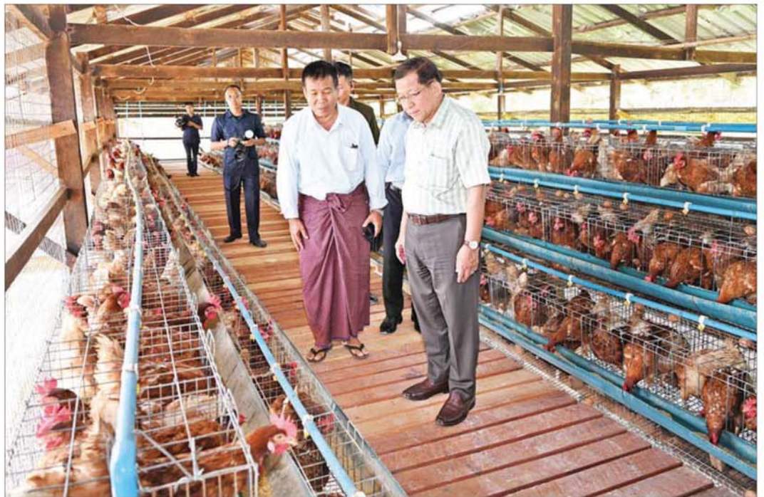
ပြည်ထောင်စုသမ္မတမြန်မာနိုင်ငံတော် နိုင်ငံတော်သမ္မတ ဦးမင်းအောင်လှိုင် အမှတ်(၁) ကြီးမားမြေမြေရန်ရှိ ကြက်မွေးမြူရေးခြံ၌ အသားတိုးကြက်နှင့် ဥစားကြက် မွေးမြူရေးလုပ်ငန်းဆောင်ရွက်နေမှုအခြေအနေများ ကြည့်ရှုစစ်ဆေးစဉ်။

ဥစားကြက်မွေးမြူခြင်းသည် စားရေရိက္ခာပေါများစေခြင်းနှင့် ဈေးနှုန်းသက်သာစွာဖြင့် အာဟာရပြည့်မီစွာ စားသုံးနိုင်စေခြင်းတို့ကို အထောက်အကူဖြစ်စေ