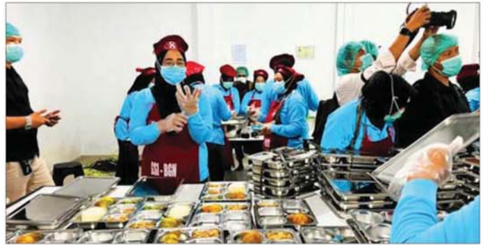
ခြင်းနှင့် ဖြန့်ဝေဆောင်ရွက်ခြင်းတို့တွင် လုပ်သားကြောင်း သိရသည်။ ပေါင်း ၁ ဒသမ ၂၈ သန်းဖြင့် လုပ်ကိုင်ဆောင်ရွက်ရ ဆင်ဟွာ

အကျိုးခံစားခွင့်ရှိသူများအနက် ကျောင်းသားကျောင်းသူများ အများဆုံးဖြစ်ပြီး စုစုပေါင်း ၄၈ ဒသမ ၃၅ သန်းရှိကြောင်း၊ ယင်းပမာဏမှာ အင်ဒိုနီးရှားတစ်နိုင်ငံလုံးရှိ ကျောင်းသား ကျောင်းသူစုစုပေါင်း၏ ၇၆ ဒသမ ၁ ရာခိုင်နှုန်းအထိရှိကြောင်း အဆိုပါ အေဂျင်စီက ပြောသည်။ ၂၀၂၅ ခုနှစ် ဇန်နဝါရီ ၆ ရက်တွင်စတင်ခဲ့သော အဆိုပါအစီအစဉ်သည် အင်ဒိုနီးရှားနိုင်ငံတစ်ဝန်းရှိ လုပ်ငန်းလည်ပတ်သော အာဟာရဆိုင်ရာ ဝန်ဆောင်မှုဌာနပေါင်း ၂၀၀၀၀ ခန့်မှတစ်ဆင့် ထမင်းအနံ့ပေါင်း ၈ ဒသမ ၃ ဘီလီယံအထိ ဖြန့်ဝေပေးခဲ့ပြီးဖြစ်ကြောင်း သိရသည်။ အချက်အလက်များအရ ယင်းအစီအစဉ်သည် စာသင်ကျောင်းပေါင်း ၃၇၀၀၀ ကျော်အထိ အကျိုးခံစားခွင့်ရှိကြောင်း၊ အစားအစာပြင်ဆင်ချက်ပြုတ်