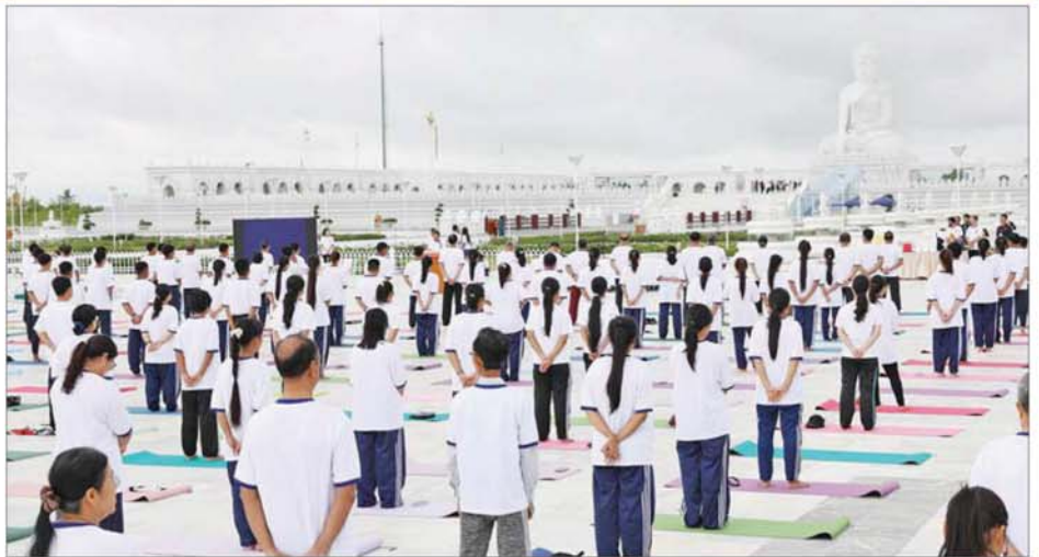
ဒုတိယသမ္မတ ဦးညိုစော (၁၂) ကြိမ်မြောက် အပြည်ပြည်ဆိုင်ရာယောဂနေ့အထိမ်းအမှတ် ယောဂသရုပ်ပြ စုပေါင်းလေ့ကျင့်ခြင်း အခမ်းအနားတွင် အမှာစကားပြောကြားစဉ်။

နေပြည်တော် မေ ၂၄ ၂၀၂၆ ခုနှစ် (၁၂) ကြိမ်မြောက် အပြည်ပြည်ဆိုင်ရာယောဂနေ့ အထိမ်းအမှတ် ယောဂသရုပ်ပြစုပေါင်းလေ့ကျင့်ခြင်းအခမ်းအနားကို ယနေ့ နံနက်ပိုင်းတွင် ပြည်ထောင်စုနယ်မြေနေပြည်တော် ဒက္ခိဏသီရိမြို့နယ်ရှိ မာရဝိဇယဗုဒ္ဓရုပ်ပွားတော်မြတ်ကြီး ဥယျာဉ်တော်အတွင်း ရေပန်းရင်ပြင်၌ ကျင်းပရာ ပြည်ထောင်စုသမ္မတမြန်မာနိုင်ငံတော် ဒုတိယသမ္မတ ဦးညိုစော တက်ရောက်အမှာစကားပြောကြားပြီး စုပေါင်းပါဝင်လေ့ကျင့်ခဲ့သည်။ အခမ်းအနားသို့ ပြည်ထောင်စုဝန်ကြီး ဦးတင်ဦးလွင်၊ ဒုတိယဝန်ကြီးများ၊ နေပြည်တော်ကောင်စီဝင်များ၊ မြန်မာနိုင်ငံဆိုင်ရာ အိန္ဒိယနိုင်ငံသံအမတ်ကြီးနှင့် သံရုံးတာဝန်ရှိသူများ၊ ဌာနဆိုင်ရာအကြီးအကဲများနှင့် တာဝန်ရှိသူများ တက်ရောက်ကြသည်။ ဦးစွာ မြန်မာနိုင်ငံဆိုင်ရာ အိန္ဒိယနိုင်ငံသံအမတ်ကြီး H.E. Mr. Abhay Thakur က ကြိုဆိုနှုတ်ခွန်းဆက်စကား ပြောကြားသည်။ ထို့နောက် ဒုတိယသမ္မတ ဦးညိုစောက မြန်မာ-အိန္ဒိယ နှစ်နိုင်ငံအကြား ချစ်ခင်ရင်းနှီးသောဆက်ဆံရေးကို အခြေပြု၍ ပြည်ထောင်စုသမ္မတမြန်မာနိုင်ငံတော် နိုင်ငံတော်အကြီးအကဲ၏ ခွင့်ပြုမှုနှင့် အိန္ဒိယသံရုံး၏ စီစဉ်ဆောင်ရွက်မှုဖြင့် မြန်မာနိုင်ငံ၌ ၂၀၂၄ ခုနှစ်နှင့် ၂၀၂၅ ခုနှစ်တို့တွင် အပြည်ပြည်ဆိုင်ရာယောဂနေ့ အခမ်းအနားများကို စာမျက်နှာ ၅ သို့ ။