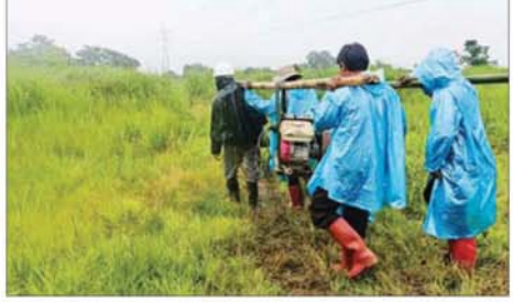
လျှပ်စစ်နှင့် စွမ်းအင်ဝန်ကြီးဌာန ဝန်ထမ်းများက ရာသီအချိန်မရွေး လျှပ်စစ်ဓာတ်အားစနစ် ပြင်ဆင်နေမှုများကို တွေ့ရစဉ်။