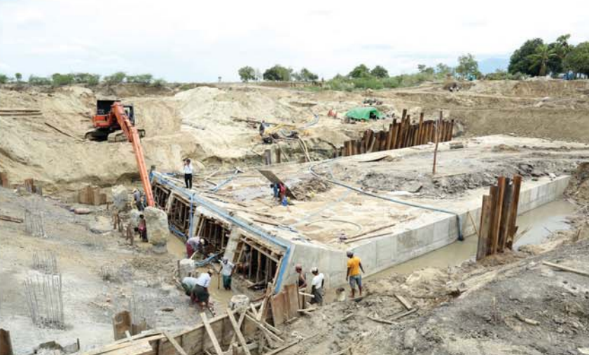
(မန္တလေးနေ့စဉ်)