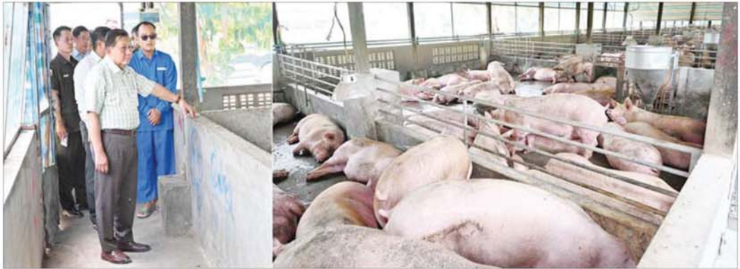
နိုင်ငံတော်သမ္မတ ဦးမင်းအောင်လှိုင် အမှတ်(၁) ကံကြီးမွေးမြူရေးစနစ်ရှိ ဝက်မွေးမြူရေးခြံ၌ အသားတိုးဝက်များ မွေးမြူထားမှုကို ကြည့်ရှုစစ်ဆေးစဉ်။

ထို့နောက် ရှင်းလင်းဆောင်ခန်းမတွင် နေပြည်တော်ကောင်စီဥက္ကဋ္ဌ ဦးကျော်စွာက နေပြည်တော်ကောင်စီနယ်မြေအတွင်း၌ ကံကြီးမွေးမြူရေးစနစ်တို့အား အကောင်အထည်ဖော်ဆောင်ရွက်လျက်ရှိမှု၊ စနစ်အလိုက်မွေးမြူရေးလုပ်ငန်းများဆောင်ရွက်လျက်ရှိမှု၊ သတ်မှတ်ကောင်ရေပြည့်စီအောင် မွေးမြူနိုင်ရေး၊ ကူးစက်ရောဂါဖြစ်ပွားမှုမရှိစေရေး ကြီးကြပ်ဆောင်ရွက်လျက်ရှိမှု၊ မေထုန်မဲ့မှန်ခြင်း မျိုးမြှင့်ဆောင်ရွက်ပေးလျက်ရှိမှုနှင့် ဆက်လက်ဆောင်ရွက်သွားမည့်အခြေအနေများနှင့်ပတ်သက်၍ ရှင်းလင်း