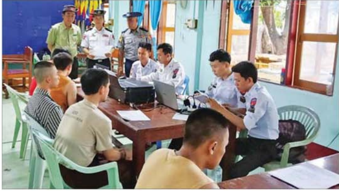
သည့် ပြည်ပနိုင်ငံသား ၁၁၆၄ ဦး တွင် မြန်မာနိုင်ငံ လူဝင်မှုကြီးကြပ် ရေး(လတ်တလော)ပြဋ္ဌာန်းချက် များ အက်ဥပဒေပုဒ်မ ၃(၁)/၃(၁)

ကြောင်းမှတစ်ဆင့် ဝင်ရောက်နေ ခဲ့သည့် တရုတ်နိုင်ငံသား ၂၇ ဦး ထပ်မံဖော်ထုတ် ထိန်းသိမ်းနိုင်ခဲ့ ပြီး ပြည်နှင့်နိုင်ရေး စစ်ဆေးနိုင် ခဲ့သည်။ ၂၀၂၅ ခုနှစ် ဇန်နဝါရီ ၃၀ ရက် မှ ၂၀၂၆ ခုနှစ် မေ ၂၄ ရက်အထိ မြဝတီမြို့နယ်အတွင်းသို့ တရား မဝင် ဝင်ရောက်လာသည့် ပြည်ပ နိုင်ငံသား စုစုပေါင်း ၁၄၆၅၅ ဦး ထိန်းသိမ်းနိုင်ခဲ့ကြောင်းနှင့် ယင်း နိုင်ငံသားအားလုံးကို စစ်ဆေး ပြီးစီးခဲ့ပြီး ၎င်းတို့အနက်မှ ၁၃၅၂၁ ဦးအား ထိုင်းနိုင်ငံမှတစ်ဆင့် သက် ဆိုင်ရာနိုင်ငံများသို့ ဥပဒေ၊ လုပ်ထုံး လုပ်နည်းများနှင့်အညီ စနစ်တကျ ပြည်နှင့်လွှဲပြောင်းပေးခဲ့သည်။ လွှဲပြောင်းပေးအပ်ရန်ကျန်ရှိ