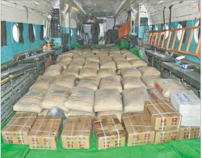
ချင်းသောင်းကျန်းသူများကြောင့် ထိခိုက်ပျက်စီးခဲ့သော ဖလမ်းမြို့၊ တီးတိန်မြို့နှင့် တွန်းစံမြို့တို့၌ ပြန်လည်ထူထောင်ရေးဆောင်ရွက်ရာတွင် လိုအပ်သောတည်ဆောက်ရေးနှင့်ထောက်ပံ့ရေးပစ္စည်းများ တပ်မတော်လေယာဉ်များဖြင့် ပို့ဆောင်နေမှုကို တွေ့ရစဉ်။