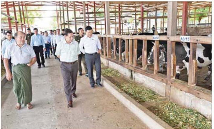
နိုင်ငံတော်သမ္မတ ဦးမင်းအောင်လှိုင် အမှတ်(၁) ကံကြီးမွေးမြူရေးစုနံ့ရှိ ဖန်ဟုနို့စားခွားမွေးမြူရေးခြံ၌ နို့စားခွားနှင့် ခွားသားပေါက်များ မွေးမြူထားရှိမှု ကြည့်ရှုစစ်ဆေးစဉ်။

ရေး၊ အသားထုတ်လုပ်မှုစနစ်တကျဖြစ်စေရေး စီမံဆောင်ရွက်သွားရန်နှင့် အသားထုတ်လုပ်မှုအပြင် ဆိတ်သားရေကိုလည်း ဈေးကွက်သို့ ပြန်ဖြူးသွားနိုင်ကြောင်း၊ မိမိတို့အား ခွင့်ပြုပေးထားသည့် မြေဧရိယာအတွင်း ဆိတ်အစာ နေဗီယာမြက်များအပြင် ဆီးပင်များကိုလည်းထည့်သွင်းစိုက်ပျိုး၍ ဆီးပင်ခြောက်ဖတ်များကို ကျွေးမွေးနိုင်မည်ဖြစ်ကြောင်း၊ ဆိတ်အစာမြက် စိုက်ပျိုးရာ၌ စဉ်ဆက်မပြတ်သည့် စိုက်ပျိုးထုတ်လုပ်မှုစနစ်ဖြစ်စေရေးအတွက်လည်း စနစ်တကျတွက်ချက်စိုက်ပျိုးသွားရန်လိုကြောင်းနှင့် အခြားလိုအပ်သည်များကို လမ်းညွှန်မှာကြားသည်။ ထို့နောက် ရွှေမြို့မွေးမြူရေးစုနံ့အတွင်းရှိ နယ်မြေခံတပ်ရင်း၊ ဝက်မွေးမြူရေးခြံသို့ ရောက်ရှိ