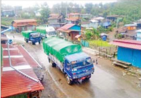
ထောက်ပံ့ရေးပစ္စည်းများသယ်ဆောင်လာသည့် မော်တော်ယာဉ်တန်းများ ဟားခါးမြို့သို့ ထွက်ခွာစဉ်။

စွန့်ခွာခဲ့ရသည့် ဒေသခံပြည်သူများအနေဖြင့် ၎င်းတို့၏ နေရပ်သို့ ပြန်လည်ဝင်ရောက် နေထိုင်နိုင်ရေး၊ အစိုးရအုပ်ချုပ်မှုယန္တရားများ ပြန်လည်လည်ပတ်ကာ ဒေသခံပြည်သူလူထု၏ လူမှုစီးပွားဘဝများ ဖွံ့ဖြိုးတိုးတက်အောင် ပြန်လည်ဖော်ဆောင်ပေးနိုင်ရေး၊ စားသောက်နေထိုင်မှု အဆင်ပြေစေရေးနှင့် ပြန်လည်ထူထောင်ရေးလုပ်ငန်းများကို နိုင်ငံတော်အစိုးရနှင့် လက်တွဲဆောင်ရွက်ပေးလျက်ရှိသည်။