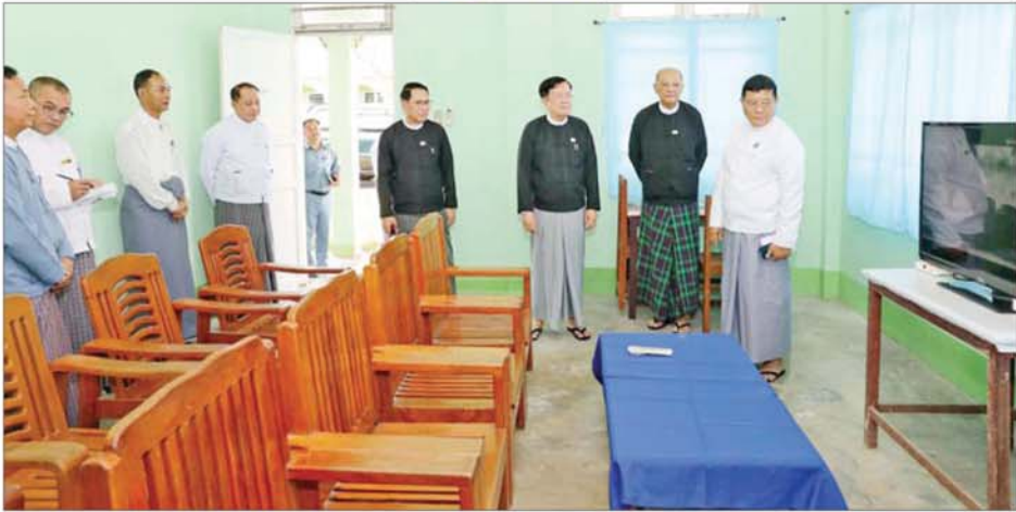
လွှတ်တော်အစည်းအဝေးများ ကျင်းပရေး ဗဟိုကော်မတီနာယက ပြည်ထောင်စုလွှတ်တော်နာယက ဦးအောင်လင်းဒွေးနှင့် အဖွဲ့ဝင်များ နေပြည်တော် စည်ပင်စည်ရပ်သာ(၂)တွင် ကြည့်ရှုစစ်ဆေးစဉ်။

ဦးစွာ လွှတ်တော်အစည်းအဝေးများ ကျင်းပရေးဗဟိုကော်မတီ နာယက က အဖွင့်အမှာစကား ပြောကြားရာတွင် လာမည့် ဇွန် ၂ ရက်မှ ဒီဇင်ဘာ ၃ ရက်အတွင်း ဒုတိယပုံမှန် အစည်းအဝေး၊ တတိယပုံမှန် အစည်းအဝေးကို ကျင်းပပြုလုပ်ရန် ပြည်ထောင်စု လွှတ်တော်ရုံးက လွှတ်တော် ပြက္ခဒိန် လျာထားထုတ်ပြန်ထားပြီး သက်ဆိုင်ရာ အဖွဲ့အစည်းများကို ကြိုတင်သိအောင် ပေးပို့ထားရှိပြီး ဖြစ်ပါကြောင်း၊ ပြည်ထောင်စုလွှတ်တော်၊ ပြည်သူ့ လွှတ်တော်နှင့် အမျိုးသား လွှတ်တော်များ၏ ဒုတိယပုံမှန် အစည်းအဝေး ကျင်းပနိုင်ရန် လွှတ်တော်ကိုယ်စားလှယ်များထံ အစည်းအဝေးစိတ်စာများ ပေးပို့ ထားရှိပြီး ဖြစ်ပါကြောင်း၊ လွှတ်တော် ကိုယ်စားလှယ်များ အနေဖြင့် မေ ၃၀ ရက်ထက်မီစော့ ၃၀ ရက်ထက် နောက်မကျစေ ဘဲ နေပြည်တော်သို့ လာရောက် ရန် ခေါ်ယူထားပြီး ဖြစ်ပါကြောင်း။ တည်းခိုနေထိုင်ရေးနှင့် အခြားအဖွဲ့အစည်းများ ကော်မတီအနေဖြင့် လွှတ်တော် ကိုယ်စားလှယ်များ နေပြည်တော် သို့ ရောက်ရှိချိန်တွင် လုံခြုံစိတ်ချ ချွာ တည်းခိုနေထိုင်နိုင်ရန် အဆောက်အအုံများ ကောင်းမွန် ရေး၊ သောက်သုံးရေးနှင့် အသုံး အဆောင်ပစ္စည်းများ အဆင်ပြေ စွာ အသုံးပြုနိုင်ရေးကို သက်ဆိုင်ရာ ရုံး၊ ဌာန၊ အဖွဲ့အစည်းများနှင့် ပေါင်းစပ်ပြီး ကြိုတင်ပြင်ဆင် ဆောင်ရွက် ထားရှိရမည်ဖြစ်ပါ ကြောင်း၊ လုံခြုံရေးကော်မတီအနေ ဖြင့် လွှတ်တော်အစည်းအဝေးများ ကျင်းပစဉ်နှင့် ရပ်နားစဉ်ကာလ များတွင် လွှတ်တော်ဝင်းအတွင်း အပြင်နှင့် လွှတ်တော်ကိုယ်စား လှယ်များ တည်းခိုနေထိုင်သည့် နေရာများ၊ ယာဉ်တန်းအပါအဝင် သတိမှတ်နေရာအလိုက် လုံခြုံရေး စနစ်တကျ ဆောင်ရွက်ရမည်ဖြစ် ပါကြောင်း။ ဆက်သွယ်ရေး၊ အသံထိန်းစနစ်