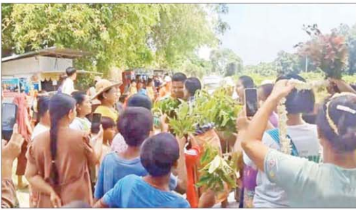
ပြည်သူ့စစ်မှုထမ်းသင်တန်းအမှတ်စဉ်(၂/၂၀၂၄)မှ ပြည်သူ့စစ်မှုထမ်းများ၏ အိမ်အပြန်ခရီးလမ်းများတွင် မိသားစုဝင်များနှင့် ဒေသခံပြည်သူများက ဝမ်းမြောက်စွာ ဂုဏ်ပြုကြိုဆိုကြစဉ်။

ထိုသို့ နိုင်ငံတော်အတွက် နိုင်ငံသားကောင်း၊ တပ်မတော်အတွက် စစ်သည်တော်ကောင်းတစ်ဦး ဝိသဒ္ဓာ တာဝန်များကို ကျေပွန်စွာထမ်းဆောင်ခဲ့ကြသည့် နိုင်ငံသားကောင်း ပြည်သူ့စစ်မှုထမ်းများသည် ၎င်းတို့၏ဘဝတွင် နိုင်ငံတော်အပေါ် သစ္စာစောင့်သိမှု၊ စည်းကမ်းလိုက်နာမှုနှင့် ကိုယ်ကျိုးမဖက်စွန့်လွှတ်အနစ်နာခံမှုတို့ဖြင့် ပေးအပ်လာသော နိုင်ငံတော်ကာကွယ်ရေးတာဝန်များကို အမြဲတမ်းစစ်မှုထမ်းများနှင့် ကိုယ်ကတို့၍ ဂုဏ်ယူစွာထမ်းဆောင်ခဲ့ကြသူများအဖြစ်လည်းကောင်း၊ ဥပဒေပါပြဋ္ဌာန်းချက်များအတိုင်း စည်းကမ်းလိုက်နာ၍ ပေးအပ်လာသည့် နိုင်ငံတာဝန်များကို နိုင်ငံကြီးသားဝိသဒ္ဓာ တာဝန်ကျေပွန်ခဲ့ကြသူများအဖြစ်လည်းကောင်း၊ သမိုင်းဝင်ကမ္ဘာ့ဇာတ်ကားတိုင်းမှတ်တမ်းဝင်ခဲ့ကြပြီဖြစ်သည်။ ထို့ကြောင့် နိုင်ငံသားကောင်း၊ ပြည်သူ့စစ်မှုထမ်းများ၏ အိမ်အပြန်ခရီးများသည်လည်း ၎င်းတို့၏ တာဝန်ကျေပွန်စွာ ထမ်းဆောင်ခဲ့မှုကြောင့် ဂုဏ်ယူရမူ၊ မိသားစုဖြင့် ပြန်လည်ဆုံဆည်းရမှုကြောင့် ဝမ်းသာပျော်ရွှင်မှုတို့ဖြင့် ပြည့်စုံလျက်ရှိပြီး ၎င်းတို့၏မိသားစုဝင်များသာမက ဒေသခံပြည်သူများကပါ ဝမ်းသာ