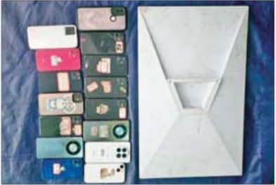
တရုတ်နိုင်ငံသား အမျိုးသား ၂၀ နှင့်အတူ သိမ်းဆည်းရမိ စတားလင့်တစ်လုံးနှင့် ဖုန်း ၁၅ လုံး အား တွေ့ရစဉ်။