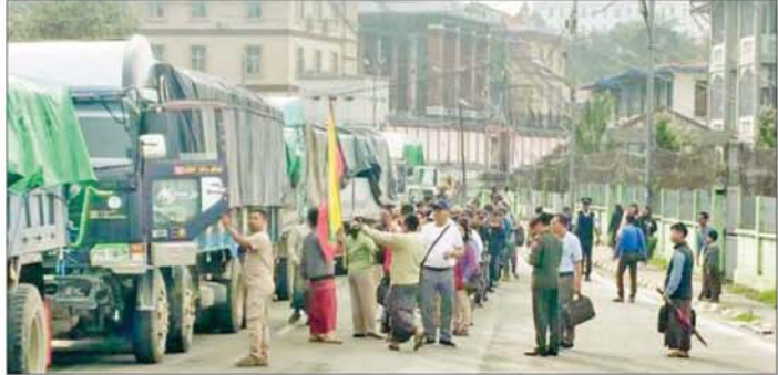
ထောက်ပံ့ရေးပစ္စည်းများသယ်ဆောင်လာသည့် မော်တော်ယာဉ်တန်းများ ဟားခါးမြို့သို့ ရောက်ရှိစဉ်။

ထောက်ပံ့ရေးပစ္စည်းများ ပါဝင်သည့် မော်တော်ယာဉ်များနှင့် မော်တော်ဆိုင်ကယ်များသည် မေ ၂၀ ရက်တွင် ဖလမ်းမြို့သို့ရောက်ရှိခဲ့ပြီးဖြစ်သည်။ အဆိုပါ အခြေခံစားသောက်ကုန်များ၊ လူသုံးကုန်ပစ္စည်းများနှင့် ကူညီထောက်ပံ့ရေး ပစ္စည်းများ ပါဝင်သည့် မော်တော်ယာဉ်များနှင့် မော်တော်ဆိုင် ကယ်များသည် ဌာနဆိုင်ရာ ဝန်ထမ်းများနှင့် ဆက်လက်နေ့တွင် ဟားခါးမြို့သို့ အတူ ယာဉ်ထွက်ခွာကြပြီး ဟားခါးမြို့ရှိ ဒေသခံတိုင်းရင်းသားပြည်သူများ၏ စားဝတ်နေရေး အဆင်ပြေချောမွေ့စေရေး၊ ကျောင်းဖွင့်ရာသီအစီ ကျောင်းသုံးပြဋ္ဌာန်းစာအုပ်များနှင့် စာရေးကိရိယာများ အချိန်မီရောက်ရှိရေး၊ ကျန်းမာရေးတောင့်ရောက်မှု လုပ်ငန်းများ