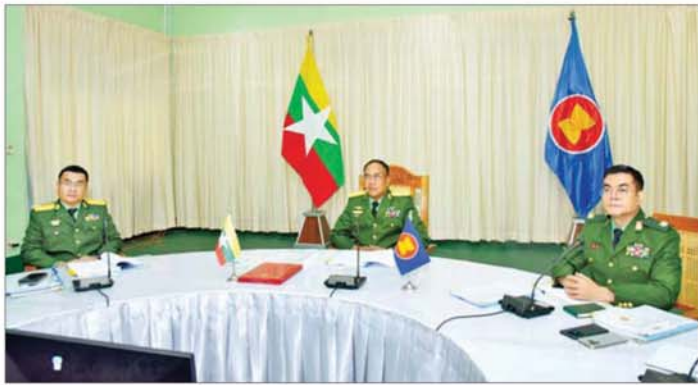
တပ်မတော်စစ်ဘက်ရေးရာလုံခြုံရေးအရာရှိချုပ် ဒုတိယဗိုလ်ချုပ်ကြီး ကျော်ကိုထိုက် ဦးဆောင်သည့် ကိုယ်စားလှယ်အဖွဲ့ အစည်းအဝေးတက်ရောက်စဉ်။

ကမ္ဘောဒီးယား ဘုရင့်တပ်မတော်ကာကွယ်ရေး ဦးစီးချုပ် General Vong Pisenနှင့် ကိုယ်စားလှယ် အဖွဲ့များ၊ အင်ဒိုနီးရှား အမျိုးသားတပ်မတော်စစ်ဦးစီး အရာရှိချုပ် General Agus Subiyanto နှင့် ကိုယ်စား လှယ်အဖွဲ့များ၊ လာအိုပြည်သူ့တပ်မတော် ဒုတိယ ဝန်ကြီးနှင့် စစ်ဦးစီးဌာနအကြီးအကဲ Lieutenant General Saichay Kommasith နှင့် ကိုယ်စားလှယ် အဖွဲ့များ၊ မလေးရှားတပ်မတော်ကာကွယ်ရေးဦးစီးချုပ် General Dato Seri Haji Malek Razak bin Sulai Man နှင့် ကိုယ်စားလှယ်အဖွဲ့များ၊ ဖိလစ်ပိုင် တပ်မတော်မှ စစ်ဦးစီးချုပ် General Romeo Saturnino Brawner Jr နှင့် ကိုယ်စားလှယ်အဖွဲ့များ၊ စင်ကာပူတပ်မတော်ကာကွယ်ရေးဦးစီးချုပ် Vice Admiral Aaron Beng Yao Cheng နှင့် ကိုယ်စားလှယ် အဖွဲ့များ၊ ထိုင်းဘုရင့်တပ်မတော်ကာကွယ်ရေး ဦးစီးချုပ် General Ukirs Boontanonda နှင့် ကိုယ်စားလှယ်အဖွဲ့များ၊ တီမောလန်စစ်တော် တပ်မတော်စစ်ဦးစီးအရာရှိချုပ် Lieutenant General Domingos Raul နှင့် ကိုယ်စားလှယ်အဖွဲ့များ၊ ဗီယက်နမ် ပြည်သူ့တပ်မတော်ဒုတိယဝန်ကြီးနှင့် စစ်ဦးစီးအရာရှိချုပ် General Nguyen TanCuong နှင့် ကိုယ်စားလှယ်အဖွဲ့များ တက်ရောက်ကြသည်။ ဦးစွာ (၂၃) ကြိမ်မြောက် အာဆီယံတပ်မတော် ကာကွယ်ရေးဦးစီးချုပ်များအစည်းအဝေး (23 rd ACDFM) ဥက္ကဋ္ဌ ဖိလစ်ပိုင်တပ်မတော် စစ်ဦးစီးချုပ်က အဖွဲ့ဝင်မိန့်ခွန်းပြောကြားသည်။