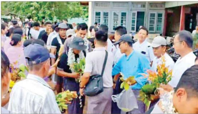
ပြည်သူ့စစ်မှုထမ်းသင်တန်းအမှတ်စဉ်(၂/၂၀၂၄)မှ ပြည်သူ့စစ်မှုထမ်းများ၏ အိမ်အပြန်ခရီးလမ်းများတွင် မိသားစုဝင်များနှင့် ဒေသခံပြည်သူများက ဝမ်းမြောက်စွာ ဂုဏ်ပြုကြိုဆိုကြစဉ်။