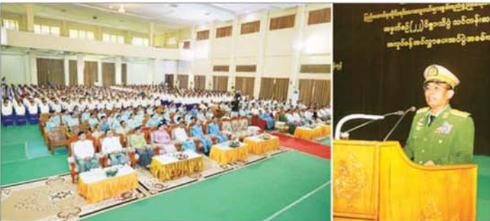
တည်ဆောက်မည့် မြေနေရာကို ကြည့်ရှုစစ်ဆေး ကြီးကြပ်ရေးရုံး၌ ယန္တရားကြီးများနှင့် ထောက်ပံ့ရေး ပစ္စည်းများ ထိန်းသိမ်းထားရှိမှုတို့ကို ကြည့်ရှုစစ်ဆေး သည့်။ ယင်းနောက် ဒဂုံမြို့သစ်မြောက်ပိုင်းရှိ ဗဟို ခဲ့ကြောင်း သိရသည်။ လေ့ကျင့်ရေးကျောင်းနှင့် ဒဂုံမြို့သစ်ခရိုင် ဖွံ့ဖြိုးမှု သတင်းစဉ်

၏ စဉ်ဆက်မပြတ် ကြိုးစားအားထုတ်လေ့လာမှုများ ကြောင့် ယခုအခါ မဟာဝိဇ္ဇာဘွဲ့၊ ၇၃၁ ဦး၊ M.Res ဘွဲ့၊ ၅၅ ဦး၊ Ph.D ဘွဲ့၊ ၁၇ ဦး၊ B.E ဘွဲ့၊ ၃၀၀ ဦး၊ M.E ဘွဲ့၊ ၁၅ ဦး၊ B.Tech ဘွဲ့၊ ၄၅၅ ဦး ရှိလာ သည်မှာ အားရကျေနပ်ဖွယ်ဖြစ်ပါကြောင်း ပြောကြား ပြီး ပြည်ထောင်စုဝန်ကြီးနှင့်ဝန်ကြီးဌာနများမှ ကိုယ်စား လှယ်များက ဝိဇ္ဇာဘာသာနှင့် သိပ္ပံဘာသာထူးချွန်ဆုရ ကျောင်းသားများအား ထူးချွန်ဆုများ၊ သင်တန်းဆင်း ကျောင်းသား ကျောင်းသူများအား အလုပ်ခန့်အပ်လွှာ များ ပေးအပ်သည်။ ထို့နောက် အဆိုပါဒီဂရီကောလိပ် အစည်းအဝေး ခန်းမ၌ ကျောင်းအုပ်ကြီး၊ ဒုတိယကျောင်းအုပ်ကြီး၊ ပါမောက္ခ/ဌာနမှူးများနှင့် တွေ့ဆုံဆွေးနွေးပြီး ကောလိပ် မိုးလုံလေလုံအားကစားရုံ၊ လေးထပ် အင်ဂျင်နီယာအလုပ်ရုံ၊ ဘောလုံးကွင်းနှင့် ပြုကြည့်စင်၊ အိပ်ဆောင်များနှင့် သုံးထပ် ကျောင်းသူအိပ်ဆောင်