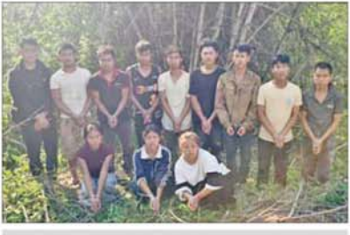
မိုင်းခတ်မြို့နယ်အတွင်း အွန်လိုင်းလိမ်လည်လောင်း ကစားမှု ကျူးလွန်ခဲ့သည့် မြန်မာနိုင်ငံသား အမျိုးသား ကိုးဦးနှင့် အမျိုးသမီး သုံးဦးအား တွေ့ရစဉ်။