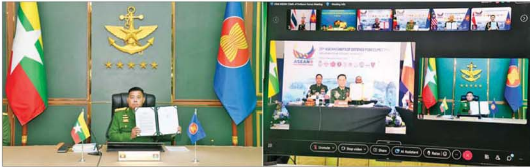
တပ်မတော်ကာကွယ်ရေးဦးစီးချုပ် ဗိုလ်ချုပ်ကြီး ရဲဝင်းဦး (၂၃)ကြိမ်မြောက်အာဆီယံတပ်မတော်ကာကွယ်ရေးဦးစီးချုပ်များ အစည်းအဝေး(23 rd ACDFM) ကို Video Conferencing စနစ်ဖြင့် တက်ရောက်စဉ်။

နေပြည်တော် မေ ၂၁ (၂၃)ကြိမ်မြောက်အာဆီယံတပ်မတော်ကာကွယ်ရေးဦးစီးချုပ်များ အစည်းအဝေး(23 rd ASEAN Chiefs of Defence Forces Meeting - 23 rd ACDFM)ကို ယနေ့နံနက်ပိုင်းတွင် Video Conferencing စနစ်ဖြင့် ကျင်းပပြုလုပ်သည်။