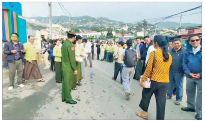
ဟားခါးမြို့သို့ ဌာနဆိုင်ရာဝန်ထမ်းများ ပြန်လည်ရောက်ရှိလာရာ တာဝန်ရှိသူများနှင့် ဒေသခံပြည်သူ များက ကြိုဆိုကြစဉ်။

နေပြည်တော် မေ ၂၁ တပ်မတော်အနေဖြင့် ပြည်သူ့ လူထု အေးချမ်းစွာ နေထိုင်နိုင်ရေး အတွက် အကြမ်းဖက်သောင်းကျန်း သူများ ယာယီဖိုဖိုပြီး အကြမ်းဖက် လုပ်ရပ်များ လုပ်ဆောင်လျက်ရှိ သည့် ဒေသများ၌ အကြမ်းဖက် ချေမှုန်းရေး စစ်ဆင်ရေး(Counter-Terrorism Operation)များကို ပြည်သူ့လူထု၏ ပူးပေါင်းပါဝင်မှု ဖြင့် ဆောင်ရွက်၍ မြို့ရွာများအား အဆင့်ဆင့် ပြန်လည်သိမ်းပိုက်ပြီး အရေးပါသည့် ဆက်သွယ်ရေး လမ်းကြောင်းများအား ပြန်လည် ဖွင့်လှစ်ပေးခြင်း၊ အကြမ်းဖက် သမားများကြောင့် ယာယီနေရပ် စာမျက်နှာ ၅ သို့ □