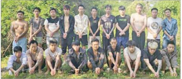
မိုင်းခတ်မြို့နယ်အတွင်း အွန်လိုင်းလိမ်လည်လောင်းကစားမှုကျူးလွန်ခဲ့သည့် တရားမဝင် တရုတ်နိုင်ငံသား အမျိုးသား ၂၀ အား တွေ့ရစဉ်။

ရေးနှင့် မြန်မာနိုင်ငံအတွင်း အခြေချလုပ်ကိုင်နိုင်မှု မရှိစေရေးအတွက် အိမ်နီးချင်းနိုင်ငံများ၊ ဒေသ တွင်းနိုင်ငံများ၊ နိုင်ငံတကာအဖွဲ့အစည်းများနှင့် ပူးပေါင်း၍ အွန်လိုင်းလိမ်လည်လောင်းကစားမှု တိုက်ဖျက်ရေးလုပ်ငန်းစဉ်များကို တက်ကြွစွာ ဆက်လက်ဆောင်ရွက်လျက်ရှိကြောင်း သိရသည်။ သတင်းစဉ်