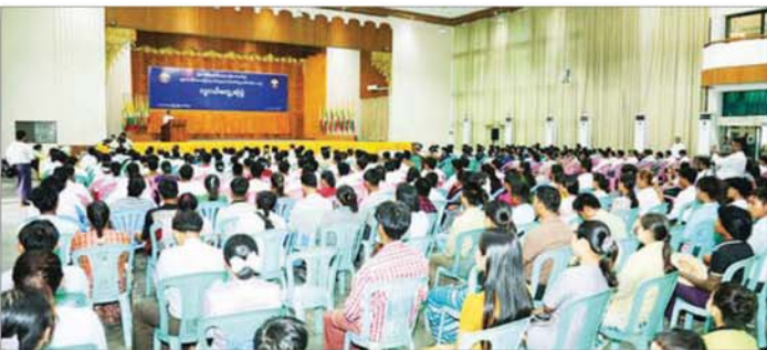
ထို့နောက် ပြည်ထောင်စု ပစ္စည်းများ ထောက်ပံ့ပေးအပ်ပြီး ပြန်လည်ရှင်းလင်းဖြေကြားပေးခဲ့ ဝန်ကြီးက ကျောက်ဆည်မြို့မှ အလွှာပေါင်းစုံမှ လူငယ်များက ကြောင်း သိရသည်။ တာဝန်ရှိသူများထံ အားကစား သိလိုသည်များကို မေးမြန်းကြရာ (မန္တလေးနေ့စဉ်)

ဒုတိယဥက္ကဋ္ဌ(၁)၊ ပြည်ထောင်စု ဝန်ကြီး ဒေါက်တာမောင်သင်း၊ မန္တလေးတိုင်းဒေသကြီး လူငယ် ရေးရာကော်မတီဥက္ကဋ္ဌ၊ တိုင်း ဒေသကြီးဝန်ကြီးချုပ်ဦးမျိုးအောင်၊ မြန်မာနိုင်ငံ လူငယ်ရေးရာ လုပ်ငန်းကော်မတီဥက္ကဋ္ဌ၊ လူငယ် ရေးရာဝန်ကြီးဌာန ဒုတိယဝန်ကြီး ဦးစစ်နိုင်နှင့် တာဝန်ရှိသူများ၊ ကျောင်းသားလူငယ်များ၊ ကြက်ခြေနီ လူငယ်များ၊ အားကစားလူငယ်