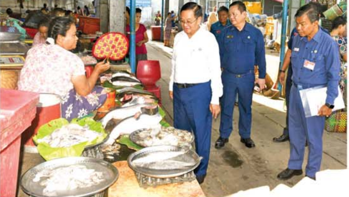
သည့် ဈေးဆိုင်ခန်းအဆောက်အအုံများပြန်လည်ပြုပြင်ခြင်းလုပ်ငန်းများ ပြီးစီးမှုအခြေအနေကို လှည့်လည်ကြည့်ရှုကာ တည်ဆောက်ရေးလုပ်ငန်းများ ပြီးစီးအောင် ဆောင်ရွက်ရန် တာဝန်ရှိသူများအား တွေ့ဆုံပြောကြားခဲ့ကြောင်း သိရသည်။ (အပေါ်ပုံ) (မန္တလေးနေ့စဉ်)

ပစ္စည်းများစုပုံချထားမှုဖြစ်စေရေးနှင့် အဆိုင်ခန်းများ၊ သန့်ရှင်းရေးလုပ်ငန်းများအား နေ့စဉ်စနစ်တကျဆောင်ရွက်သွားရန်မှာကြားခဲ့သည်။ ထို့နောက် ဈေးအတွင်း ဖွင့်လှစ်ရောင်းချလျက်ရှိသော ဈေးဆိုင်ခန်း ပိုင်ရှင်များ၊ ဈေးဝယ်လာပြည်သူများအား ရင်းရင်းနှီးနှီးတွေ့ဆုံကာ ရောင်းဝယ်နေမှုအခြေအနေများကို မေးမြန်းခဲ့သည်။ ဆက်လက်၍ မြို့တော်ဝန်နှင့်အညီ သွားရောက်စစ်ဆေးသောစံမြို့နယ်၊ ၇၈လမ်း၊ ၃၃လမ်းနှင့် ၃၄လမ်းကြားရှိ ရတနာပုံဈေးသို့ ရောက်ရှိကြပြီး မန္တလေးလျှင်ကြီးကြောင့် ထိခိုက်ပျက်စီးခဲ့ရာ