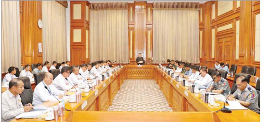
လွှတ်တော်အစည်းအဝေးများ ကျင်းပရေးဗဟိုကော်မတီနာယက ပြည်ထောင်စုလွှတ်တော်နာယက ဦးအောင်လင်းဒွေး လွှတ်တော်အစည်းအဝေးများကျင်းပရေးဗဟိုကော်မတီနှင့် လုပ်ငန်းကော်မတီများ လုပ်ငန်းညှိနှိုင်းအစည်းအဝေး(၁/၂၀၂၆)တွင် အမှာစကားပြောကြားစဉ်။

အစည်းအဝေးသို့ လွှတ်တော်အစည်းအဝေးများ ကျင်းပရေးဗဟိုကော်မတီနာယက ပြည်ထောင်စုလွှတ်တော်နာယက ဦးအောင်လင်းဒွေး၊ ဗဟိုကော်မတီဥက္ကဋ္ဌ Jeng Phang နော်တောင်၊ ဒုတိယဥက္ကဋ္ဌ ဦးမောင်မောင်အုန်း၊ ပြည်ထောင်စုဝန်ကြီးများ၊ နေပြည်တော်ကောင်စီဥက္ကဋ္ဌနှင့် ဗဟိုကော်မတီနှင့် လုပ်ငန်းကော်မတီများမှ အဖွဲ့ဝင်များ၊ လွှတ်တော်အသီးသီးမှ တာဝန်ရှိသူများ တက်ရောက်ကြသည်။ စာမျက်နှာ ၃ သို့ ၆