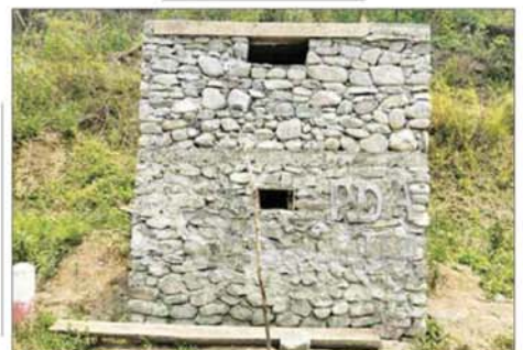
အကြမ်းဖက်သမားများအသုံးပြုထားသည့် အခိုင်အမာ ကွန်ကရစ် ဘန်ကာများကို တွေ့ရစဉ်။