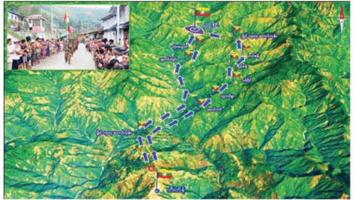
တပ်မတော်စစ်ကြောင်းများက CDF၊ CNA နှင့် PDF အမည်ခံ အကြမ်းဖက်သောင်းကျန်းသူပူးပေါင်း အဖွဲ့များ ယာယီစိုးမိုးထားသည့် တွန်းဇံမြို့အား ပြန်လည်သိမ်းပိုက်ထိန်းချုပ်ရရှိမှု နေရာပြခြေပုံ။