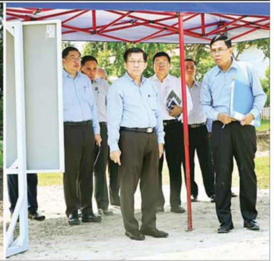
ပြည်ထောင်စုသမ္မတမြန်မာနိုင်ငံတော် နိုင်ငံတော်သမ္မတ ဦးမင်းအောင်လှိုင် နေပြည်တော်မြို့အဝင်မုခ်ဦး (Naypyitaw Gate) နှင့် ပန်းခြံတည်ဆောက်ရေးလုပ်ငန်းခွင်၌ ကြည့်ရှုစစ်ဆေးစဉ်။