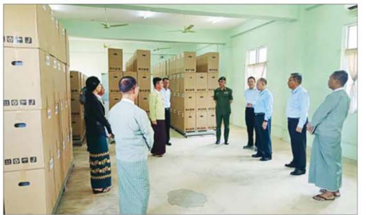
စက်များကို ကြည့်ရှုစစ်ဆေးပြီး ပြင်ဦးလွင်ခရိုင်နှင့် မြို့နယ်အဆင့်များ၊ ဝန်ထမ်းများနှင့် တွေ့ဆုံ

ဗွန်းလွင်ပိုင်းတွင် မန္တလေးတိုင်းဒေသကြီးအတွင်းရှိ မြန်မာအီလက်ထရောနစ် မဲပေးစက်ဆိုင်ရာ တိုင်းဒေသကြီး ကြီးကြပ်မှုအဖွဲ့၊ တိုင်းဒေသကြီး၊ ခရိုင်နှင့် မြို့နယ်ကော်မရှင် အဖွဲ့ခွဲအဆင့်ဆင့်မှ ကော်မရှင်အဖွဲ့ဝင်များ၊ ဝန်ထမ်းများနှင့် တွေ့ဆုံကျင်းပပြီးစီးခဲ့သည့် ရွေးကောက်ပွဲသည် တရားမျှတသည့် ရွေးကောက်ပွဲ၊ ပြည်သူလူထု ထောက်ခံသည့် ရွေးကောက်ပွဲအဖြစ် မှတ်ကျောက်တင်နိုင်ခဲ့ကြောင်း၊ နောင်ကျင်းပမည့် ရွေးကောက်ပွဲများကိုလည်း ကိုယ်စွမ်းဉာဏ်စွမ်းရှိသူရွေးကြီးစားဆောင်ရွက်ပေးကြစေလိုကြောင်း ဆွေးနွေးမှာကြားသည်။ ယမန်နေ့ကလည်း ပြင်ဦးလွင် မြို့၌ ထိန်းသိမ်းထားရှိသည့် မဲပေးစက်များကို ကြည့်ရှုစစ်ဆေးပြီး ပြင်ဦးလွင်ခရိုင်နှင့် မြို့နယ်အဆင့်များ၊ ဝန်ထမ်းများနှင့် တွေ့ဆုံ