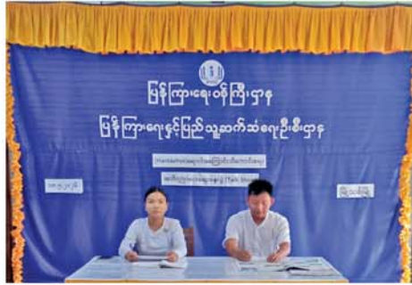
မြို့သစ် မေ ၂၀ ရပ်စ် (Hantavirus)ရောဂါ မကွေးတိုင်းဒေသကြီး၊ နှင့် ပတ်သက်၍ ပြည်သူများ မြို့သစ်မြို့နယ်တွင် ဟန်တာဗိုင်း အသိပညာပေးဟုသုတရရှိစေရန်

နှင့် ရှောင်ကြဉ်ရမည့်အချက်များ သိရှိနိုင်စေရန်အတွက် ဟန်တာ ဗိုင်းရပ်စ်(Hantavirus) ရောဂါ အကြောင်းသိကောင်းစရာ အသိ ပညာပေးဆွေးနွေးပွဲ (Talk Show)ကို ယမန်နေ့ မွန်းလွဲပိုင်း က မြို့နယ်ပြန်ကြားရေးနှင့် ပြည်သူ့ဆက်ဆံရေးဦးစီးဌာန (Community Centre)ခန်းမ၌ ကျင်းပခဲ့သည်။