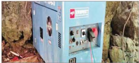
မိုင်းခတ်မြို့နယ် ဖားငင်ကျေးရွာအနီး အွန်လိုင်းလိမ်လည်လောင်းကစားမှုကျူးလွန်ရာတွင် အသုံးပြုခဲ့သည့် အဆောက်အအုံနှင့် လုပ်ငန်းသုံး ပစ္စည်းများအား တွေ့ရစဉ်။