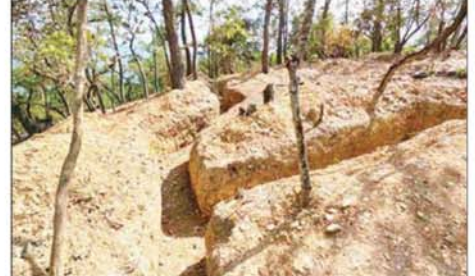
အကြမ်းဖက်သမားများထံမှ သိမ်းပိုက်ရရှိသည့် ခဲစစ်ခန်းများကို တွေ့ရစဉ်။

တပ်မတော်စစ်ကြောင်းများ က တွန်းဇံမြို့နှင့် အဆိုပဒေသ