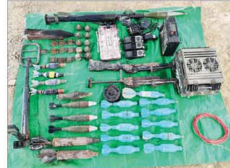
သိမ်းပိုက်ရရှိသည့် လက်နက်ခဲယမ်းနှင့် ဆက်စပ်ပစ္စည်းများကို တွေ့ရစဉ်။

အသီးသီးမှ ဌာနဆိုင်ရာဝန်ထမ်း များသည် လိုအပ်သည့် ကူညီ ထောက်ပံ့ရေးပစ္စည်းများနှင့်အတူ မော်တော်ယာဉ်များ၊ မော်တော် ဆိုင်ကယ်များဖြင့် ကလေးမြို့မှ ထွက်ခွာလာခဲ့ပြီး ညနေပိုင်းတွင် ဖလမ်းမြို့သို့ ရောက်ရှိကြရာ ဒေသခံတိုင်းရင်းသား ပြည်သူများ၊ မြို့မိ မြို့ပုများနှင့် တာဝန်ရှိသူ များက ရိုးရာအကများဖြင့် ဝမ်းပန်းတသာ လှိုက်လှိုက်လှဲလှဲ ကြိုဆိုခဲ့ကြကြောင်း သတင်းရရှိ သည်။ သတင်းစဉ်