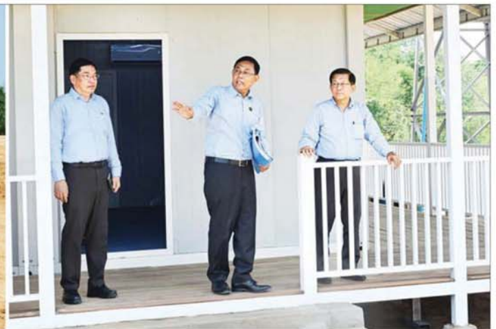
ပြည်ထောင်စုသမ္မတမြန်မာနိုင်ငံတော် နိုင်ငံတော်သမ္မတ ဦးမင်းအောင်လှိုင် အား ပြည်ထောင်စုဂုဏ်ပြုမြိမာန် တည်ဆောက်ရေးလုပ်ငန်းခွင် ရှင်းလင်းဆောင်ခန်းမ၌ ဆောက်လုပ်ရေးဝန်ကြီးဌာန ပြည်ထောင်စုဝန်ကြီးက လုပ်ငန်းဆောင်ရွက်နေမှု အခြေအနေများနှင့်ပတ်သက်၍ ရှင်းလင်းတင်ပြစဉ်။