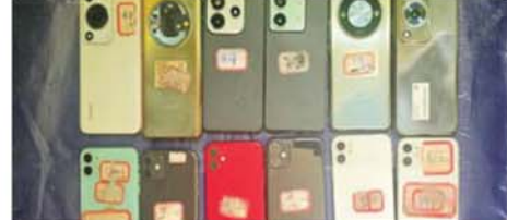
သိမ်းဆည်းရမိသည့် ဖုန်း ၁၂ လုံးကို တွေ့ရစဉ်။