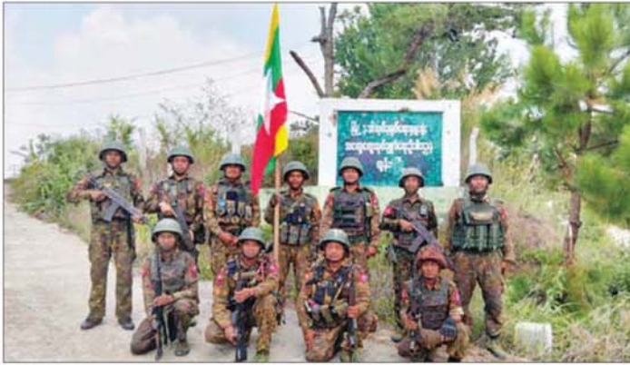
တပ်မတော်စစ်ကြောင်းများက CDF အမည်ခံ အကြမ်းဖက်သောင်းကျန်းသူများ ယာယီစိုးမိုးထားသည့် တွန်းဇံမြို့အား အလုံးစုံပြန်လည်သိမ်းပိုက်ထိန်းချုပ်ရရှိမှုကို တွေ့ရစဉ်။