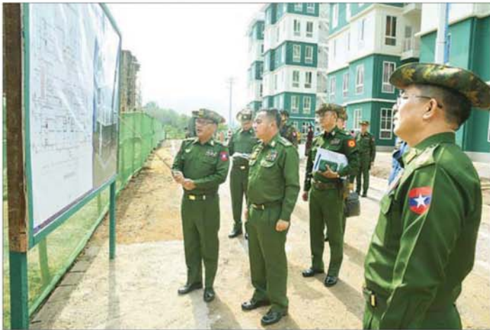
တပ်မတော်ကာကွယ်ရေးဦးစီးချုပ် ဗိုလ်ချုပ်ကြီး ရဲဝင်းဦး အား အဆင့်မြင့်စစ်မှုထမ်းဟောင်းအိမ်ရာ(အေးသာယာ) ဆက်လက်တည်ဆောက်လျက်ရှိမှုအခြေအနေကို တာဝန်ရှိသူတစ်ဦးက ရှင်းလင်းတင်ပြစဉ်။

နေပြည်တော် မေ ၂၀ တပ်မတော်ကာကွယ်ရေး ဦးစီးချုပ် ဗိုလ်ချုပ်ကြီး ရဲဝင်းဦးသည် ဇနီး ဒေါ်နီလာ၊ ကာကွယ်ရေး ဦးစီးချုပ်(ရေ) ဗိုလ်ချုပ်ကြီး ထိန်ဝင်းနှင့် ဇနီး၊ ကာကွယ်ရေးဦးစီးချုပ်(လေ) ဒုတိယဗိုလ်ချုပ်ကြီး ထွန်းဝင်းနှင့် ဇနီး၊ ကာကွယ်ရေးဦးစီးချုပ်ရုံးမှ အဆင့်မြင့် တပ်မတော် အရာရှိကြီးများနှင့် ဇနီးများ၊ အရှေ့ပိုင်းတိုင်းစစ်ဌာနချုပ် တိုင်းမှူးနှင့်တာဝန်ရှိသူများ လိုက်ပါ၍ ယနေ့နံနက်ပိုင်းတွင် ရှမ်းပြည်နယ်(တောင်ပိုင်း) အေးသာယာမြို့ရှိ အဆင့်မြင့် စစ်မှုထမ်းဟောင်း အိမ်ရာ(အေးသာယာ) သို့ သွားရောက်၍ အိမ်ရာ တည်ဆောက်ပြီးစီးမှု အခြေအနေများကို လိုက်လံကြည့်ရှုစစ်ဆေးသည်။