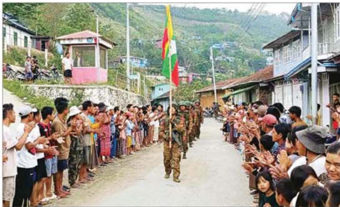
တွန်းဇံမြို့သို့ ဝင်ရောက်လာသည့် တပ်မတော်စစ်ကြောင်းများအား ဒေသခံပြည်သူများ ဝမ်းမြောက်ဝမ်းသာ ကြိုဆိုကြစဉ်။

နေပြည်တော် မေ ၂၀ ချင်းပြည်နယ် တီးတိန်ခရိုင်အတွင်းပါဝင်သည့် တွန်းဇံမြို့နယ်သည် ချင်းပြည်နယ်၏ မြောက်ဘက်ပိုင်းတွင်တည်ရှိသည့် တောင်တန်းဒေသမြို့တစ်မြို့ဖြစ်ပြီး အိန္ဒိယနိုင်ငံနှင့် နယ်စပ်ကုန်သွယ်စီးဆင်းမှုအတွက် အရေးပါသော ဒေသတစ်ခုဖြစ်သည်။ တွန်းဇံမြို့နယ်၏ တောင်ဘက်တွင် တီးတိန်မြို့၊ အရှေ့ဘက်တွင် စစ်ကိုင်းတိုင်းဒေသကြီး ကလေးမြို့နှင့် မြောက်ဘက်တွင် အနောက်ဘက်တွင် အိန္ဒိယနိုင်ငံ၏ Manipur နှင့် Mizoram ပြည်နယ်များတည်ရှိပြီး ဒေသခံပြည်သူများအနေဖြင့် စိုက်ပျိုးရေးနှင့် မွေးမြူရေးလုပ်ငန်းများကို အဓိကထားလုပ်ကိုင်ကာ ရိုးရာယဉ်ကျေးမှု ဓလေ့ထုံးတမ်းများ၊ ရိုးရာပွဲတော်များဖြင့် အေးချမ်းစွာနေထိုင်ကြသည့် မြို့တစ်မြို့ဖြစ်သည်။ ထိုသို့ ရိုးရာယဉ်ကျေးမှုဓလေ့ထုံးတမ်းများဖြင့် အေးချမ်းပျော်ရွှင်စွာ နေထိုင်လျက်ရှိကြသည့် တွန်းဇံမြို့မှ ဒေသခံတိုင်းရင်းသား ပြည်သူများအား CRPH ၊ NUG အမည်ခံ အကြမ်းဖက်အဖွဲ့များနှင့် ၎င်းတို့၏ လက်ဝေခံဖြစ်သော CDF ၊ CNA နှင့် PDF အမည်ခံ အကြမ်းဖက်အဖွဲ့များသည် ၂၀၂၁ ခုနှစ်တွင် ဖြစ်ပွားခဲ့သည့် နိုင်ငံရေးဖြစ်စဉ်များကြောင့် နိုင်ငံ၏ အချို့မြို့များတွင် ဖြစ်ပေါ်ခဲ့သည့် အစွန်းရောက်တို့၏ ဆူပူအကြမ်းဖက် ဆန္ဒပြမှုများအပေါ် အခွင့်ကောင်းယူကာ နိုင်ငံတော်တည်ငြိမ်အေးချမ်းမှုကို