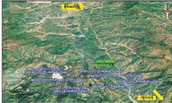
ရှမ်းပြည်နယ်(အရှေ့ပိုင်း) မိုင်းခတ်မြို့နယ် ဖားငင်ကျေးရွာအနီး၌ အွန်လိုင်းလိမ်လည်လောင်းကစားမှု ကျူးလွန်ခဲ့သူများနှင့် လုပ်ငန်းလုပ်ကိုင်ရာတွင် အသုံးပြုသည့် ဆက်စပ်ပစ္စည်းများ ဖမ်းဆီးရမိသည့် နေရာပြပုံ

လုံခြုံရေးပူးပေါင်းအဖွဲ့သည် အွန်လိုင်းလိမ်လည်လောင်းကစားမှုများကို လက်ခံနိုင်ခြင်းမရှိသည့်