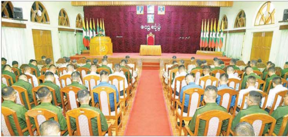
တပ်မတော်ကာကွယ်ရေးဦးစီးချုပ် ဗိုလ်ချုပ်ကြီး ရဲဝင်းဦး ကလောမြို့ရှိ နယ်မြေခံသင်တန်းကျောင်းမှ နည်းပြအရာရှိကြီးများနှင့် သင်တန်းသားအရာရှိကြီးများအား တွေ့ဆုံအမှာစကားပြောကြားစဉ်။

တပ်မှူးများသည် တရားစီရင်ခွင့်အခွင့်အာဏာရှိသူများ ဖြစ်၍ စစ်ဘက်တရားစီရင်မှု အပိုင်းကို မှန်ကန်သော ဆင်ခြင်တုံတရားဖြင့် ဆောင်ရွက်ရန်လိုကြောင်း၊ အရာရှိများနှင့် ပတ်သက်၍ Commander အဆင့်ဆင့်က ထိန်းသိမ်းပေးရန်လိုပြီး ညီအစ်ကိုစိတ်ဓာတ်ဖြင့် ထိန်းသိမ်းပေးရန် လိုကြောင်း၊ Guardian စနစ်၊ စိတ်ဓာတ်ဖြင့် အထက်အောက် ထိန်းသိမ်းမှုဖြင့် သွားရမည်ဖြစ်ပြီး ကောင်းမွန်သော အစဉ်အလာကောင်းများဖြင့် ကြပ်မတ်ကွပ်ကဲခြင်းဖြင့် စည်းလုံးညီညွတ်မှုကို ရရှိနိုင်မည် ဖြစ်ကြောင်း၊ ဦး၊ ရေ၊ ထောက် လုပ်ငန်းများကို Check, Recheck, Counter Check ဖြင့် လုပ်ဆောင်ခြင်းဖြင့် လုပ်ငန်းလစ်ဟင်းမှုမရှိစေဘဲ တပ်မှူး၏ စွမ်းရည်တိုးတက်လာမည် ဖြစ်ကြောင်း။