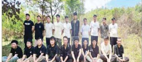
မိုင်းခတ်မြို့နယ်အတွင်း အွန်လိုင်းလိမ်လည်လောင်းကစားမှုကျူးလွန် ခဲ့သည့် တရားမဝင် တရုတ်နိုင်ငံသား အမျိုးသား ၂၀ အား တွေ့ရစဉ်။