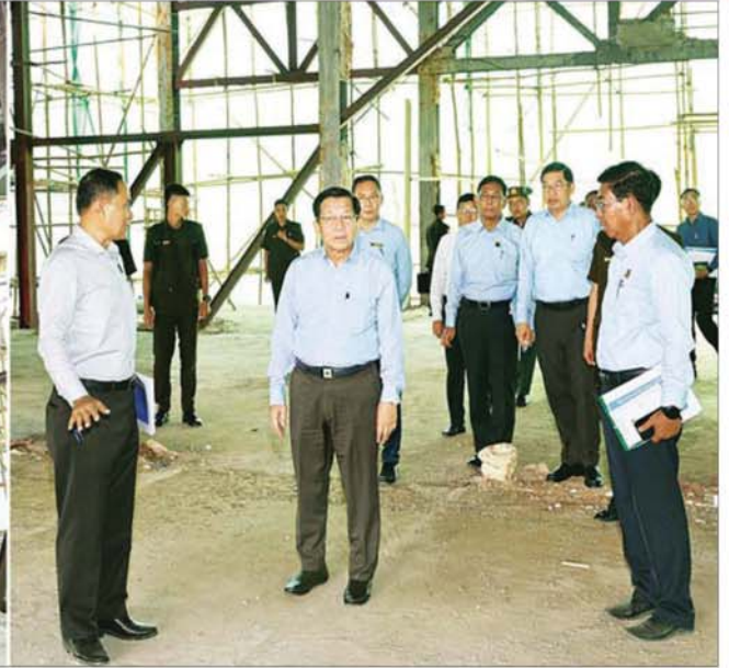
ပြည်ထောင်စုသမ္မတမြန်မာနိုင်ငံတော် နိုင်ငံတော်သမ္မတ ဦးမင်းအောင်လှိုင် မန္တလေးငလျင်ကြီးကြောင့် ထိခိုက်ပျက်စီးမှုများဖြစ်ပေါ်ခဲ့သည့် မြန်မာ့ကျောက်မျက်ရတနာပြတိုက် (နေပြည်တော်) ၌ ပြန်လည်ပြင်ဆင် တည်ဆောက်ခြင်းလုပ်ငန်းများ ဆောင်ရွက်ထားရှိမှုအခြေအနေကို ကြည့်ရှုစစ်ဆေးစဉ်။