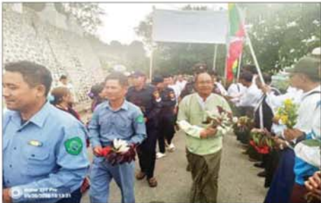
ဖလမ်းမြို့သို့ ဒေသခံပြည်သူများနှင့် ဌာနဆိုင်ရာဝန်ထမ်းများ ရောက်ရှိလာစဉ်။