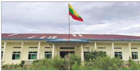
တပ်မတော်စစ်ကြောင်းများက အကြမ်းဖက်သောင်းကျန်းသူပုဂ္ဂိုလ်များအဖို့ အဖွဲ့များ ယာယီစိုးမိုးထားသည့် မောတောင်မြို့ အထွေထွေအုပ်ချုပ်ရေး ဦးစီးဌာနရုံးအား ပြန်လည်သိမ်းပိုက်ရရှိစဉ်။