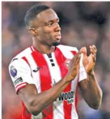
လန်ဒန် မေ ၁၉

ထို့ကြောင့် နည်းပြကွန်တီ အနေဖြင့် လက်ရှိထွက်ပေါ်နေသည့် သတင်းများအတိုင်း နာပိုလီအသင်းမှ ထွက်ခွာသွားမည်လားဆိုသည်မှာ စောင့်ကြည့်ရမည်ဖြစ်သည်။ (အပေါ်ပုံ) (NGB)