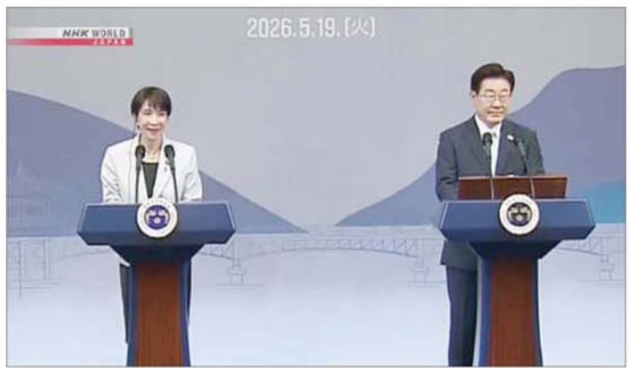
ဂျပန်ဝန်ကြီးချုပ် တာကာအိချီဆာနာအိနှင့် တောင်ကိုရီးယားသမ္မတ လီဂျေမြောင်။

များကို အတူတကွ ရင်ဆိုင်ကျော်လွှားနိုင်မည်ဖြစ်ကြောင်း လီဂျေမြောင်က ပြောကြားခဲ့သည်။ တာကာအိချီဆာနာအိကလည်း အထူးသဖြင့် အရှေ့အလယ်ပိုင်းဒေသ အခြေအနေများကိုကြည့်လျှင် နိုင်ငံတကာအသိုင်းအဝိုင်းအနေဖြင့် ခက်ခဲသည့် အချိန်ကာလတစ်ခုနှင့် ရင်ဆိုင်နေရကြောင်း၊ ထို့ကြောင့် ဂျပန်နှင့် တောင်ကိုရီးယားနိုင်ငံတို့အကြား ရရှိထားသည့် ကောင်းမွန်သော ပူးပေါင်းဆောင်ရွက်မှုအရှိန်အဟုန်ကို ဆက်လက်ထိန်းသိမ်းသွားရန် အရေးကြီးကြောင်း ပြောကြားခဲ့သည်။ ထို့ပြင် ခေါင်းဆောင်နှစ်ဦးသည် အရှေ့အလယ်ပိုင်းဒေသအတွင်း တင်းမာမှုများ လျော့ချရန်နှင့် ဟော်မစ်ရေလက်ကြား၌ သဘောတူမှုများ ဘေးကင်းလုံခြုံစွာ သွားလာနိုင်ရေးအတွက် ပူးပေါင်းဆောင်ရွက်သွားရန်လည်း သဘောတူခဲ့ကြောင်း သိရသည်။ အင်န်အိတ်ချီက