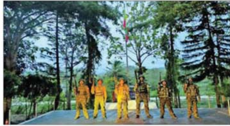
တပ်မတော်စစ်ကြောင်းများက အကြမ်းဖက်သောင်းကျန်းသူ ပုဂ္ဂိုလ်များအဖို့ အဖွဲ့များ ယာယီစိုးမိုးထားသည့် မောတောင်မြို့အား ပြန်လည် သိမ်းပိုက်ရရှိစဉ်။