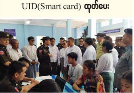
မန္တလေး မေ ၁၉

နိုင်ငံတော်အစိုးရ၏ရက်(၁၀၀)လမ်းစီမံချက်အရ နိုင်ငံသားစိစစ်ရေးကတ်နှင့် UID (Smart card) ထုတ်ပေးခြင်းကို ယနေ့နံနက် ၁၀နာရီက လူဝင်မှုကြီးကြပ်ရေးနှင့် ပြည်သူ့အင်အားဝန်ကြီးဌာန ချမ်းအေးသာစံမြို့နယ်ဦးစီးမှူးရုံးတွင် ဆောင်ရွက်ပေးလျက်ရှိသည်။