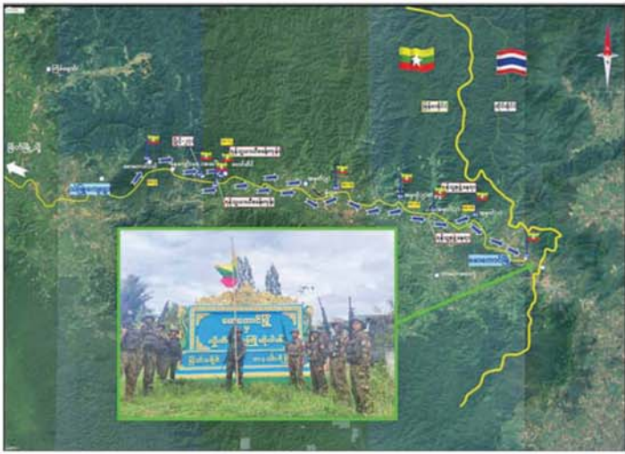
တပ်မတော်စစ်ကြောင်းများက အကြမ်းဖက်သောင်းကျန်းသူများ ယာယီစိုးမိုးထားသည့် မောတောင်မြို့အား ပြန်လည်သိမ်းပိုက်ထိန်းချုပ်မှုကို တွေ့ရစဉ်။

နေပြည်တော် မေ ၁၉ တနင်္သာရီ တိုင်းဒေသကြီး မြိတ်ခရိုင် တနင်္သာရီမြို့နယ် အတွင်း တည်ရှိသည့် မောတောင် မြို့သည် မြန်မာနိုင်ငံအောက်ပိုင်းရှိ အရှေ့ဘက်အကျဆုံး မြို့ဖြစ်ပြီး ထိုစစ်ပွဲအတွင်း မြန်မာနိုင်ငံ၏ နယ်စပ်ကုန်သွယ် ရေးစခန်းရှိသည့် နယ်စပ်မြို့ ဖြစ်သည်။ မြန်မာနိုင်ငံမှ ရေထွက် ပစ္စည်းများနှင့် ဒေသထွက်ကုန် များကို ထိုင်းနိုင်ငံသို့ တင်ပို့ ရောင်းချရာ၌ မြိတ်-မောတောင်မှ ထိုင်းနိုင်ငံသို့ တင်ပို့ပါက အချိန် ၇ နာရီခန့်သာ ကြာသည့် အနီးဆုံး လမ်းကြောင်းဖြစ်ပြီး မောတောင် မြို့မှာ စီးပွားရေးအရ အရေးပါ သည့် နယ်စပ်မြို့တစ်မြို့လည်း ဖြစ်သည်။