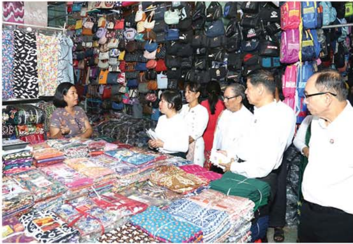
မန္တလေး၊ မေ ၁၉

မန္တလေးတိုင်းဒေသကြီးအစိုးရအဖွဲ့က ဦးဆောင်မှု တိုင်းဒေသကြီးပညာရေးမှူးရုံးမှ ပူးပေါင်းဆောင်ရွက်မှုတို့ဖြင့် ကျောင်းနေအရွယ်ကလေးများအားလုံး ကျောင်းသို့ ရောက်ရှိစေရန်နှင့် ပညာသင်ခွင့်မဆုံးရှုံးစေရန်အတွက် လှုပ်ရှားမှုတွင် မိဘအုပ်ထိန်းသူများနှင့် လူထုတစ်ရပ်လုံးပါဝင်လာစေရန် ရည်ရွယ်၍ တိုင်းဒေသကြီးရှိ မြို့နယ် ၂၈ မြို့နယ်အတွင်း လူစည်ကားရာ နေရာများ၊ လမ်းဆုံများ၊ ဈေးများ၊ ကျောင်းများရှေ့နှင့် ရပ်ကွက်များအတွင်း ယနေ့နံနက်ပိုင်းက ၂၀၂၆-၂၀၂၇ ပညာသင်နှစ် ကျောင်းအပ်နှံရေးသီတင်းပတ်လူထုအသွင်လှုပ်ရှားမှု အသိပညာပေးလက်ကမ်းစာစောင်များ ဖြန့်ဝေခြင်းများကို ဆောင်ရွက်ခဲ့ကြသည်။