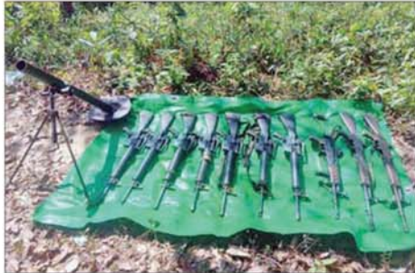
အကြမ်းဖက်သောင်းကျန်းသူ ပုဂ္ဂိုလ်များအဖို့ အဖွဲ့များထံမှ သိမ်းပိုက်ရရှိသည့် လက်နက်၊ ခဲယမ်းနှင့် ဆက်စပ်ပစ္စည်းများ။