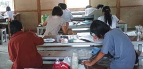
(အောက်ပုံ) ဝင်းဆီစွန့်(ပြန်/ဆက်)

မြို့သစ် မေ ၁၉ မကွေးတိုင်းဒေသကြီး၊ မြို့သစ်မြို့နယ်တွင် (၂၀)ကြိမ် မြောက် အပြည်ပြည်ဆိုင်ရာ မူး ယစ်ဆေးဝါးအလွဲသုံးမှုနှင့် တရား မဝင် ရောင်းဝယ်မှုတိုက်ဖျက်ရေး နေ့အထိမ်းအမှတ်အကြို ပန်းချီ၊ ပုံစတာ၊ ကာတွန်းနှင့် ကွန်ပျူတာ ပန်းချီပြိုင်ပွဲကို မေ ၁၆ ရက် နံနက်ပိုင်းက အမှတ်(၁)အခြေခံ ပညာအထက်တန်းကျောင်းစာသင် ဆောင်များ၌ ကျင်းပခဲ့သည်။ အဆိုပါ အပြည်ပြည်ဆိုင်ရာ မူးယစ်ဆေးဝါးအလွဲသုံးမှုနှင့် တရားမဝင်ရောင်းဝယ်မှု တိုက် ဖျက်ရေးနေ့အထိမ်းအမှတ်အကြို ပန်းချီ၊ ပုံစတာ၊ ကာတွန်းနှင့် ကွန်ပျူတာပန်းချီပြိုင်ပွဲတွင် မြို့နယ်အတွင်းရှိ အခြေခံပညာ