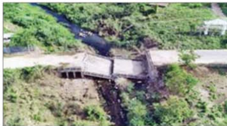
အကြမ်းဖက်သောင်းကျန်းသူပုဂ္ဂိုလ်များအဖို့ အဖွဲ့များ ယာယီစိုးမိုးထားစဉ် အမှတ်(၉)တံတားအား မိုင်းထောင်ဖောက်ခွဲဖျက်ဆီးခဲ့မှုကြောင့် တံတား ပျက်စီးမှုအား တွေ့ရစဉ်။