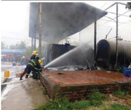
စော်ထက်(သရက်)

ဝေခြင်းကို ယနေ့ နံနက် ၇ နာရီက အဆိုပါ ဈေးအတွင်း ဆောင်ရွက်ခဲ့ကြသည်။ အဆိုပါ ဆောင်ရွက်ခြင်းကို မြို့နယ်စည်ပင်သာယာရေးကော်မတီ၊ မြို့နယ်စည်ပင်သာယာရေးအဖွဲ့နှင့် မြို့နယ်ပြည်သူ့ကျန်းမာရေးဦးစီးဌာနတို့မှ ဝန်ထမ်းများက ပူးပေါင်းဆောင်ရွက်ခဲ့ကြခြင်းဖြစ်ပြီး ပလတ်စတစ်သုံးစွဲမှုလျော့ချရေး အသိပညာပေး ပြုလုပ်ခြင်းကို အပတ်စဉ် တနင်္လာနေ့တိုင်း ပြုလုပ်လျက်ရှိကြောင်း မြို့နယ်စည်ပင်သာယာရေးအဖွဲ့မှ သိရသည်။ (အပေါ်ပုံ)