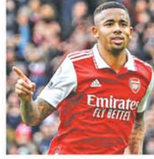
အသင်းတို့က ခေါ်ယူရန် စိတ်ဝင်စားလျက်ရှိသည်။ (အပေါ်ပုံ)

အသက်(၂၉)နှစ်အရွယ်ရှိ တိုက်စစ်မှူးကို လက်ရှိအချိန်တွင် အေစီမီလန်အသင်းနှင့် ဂျူဗင်တပ်