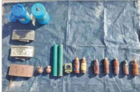
အကြမ်းဖက်သောင်းကျန်းသူ ပုဂ္ဂိုလ်များအဖို့ အဖွဲ့များထံမှ သိမ်းပိုက်ရရှိသည့် လက်နက်၊ ခဲယမ်းနှင့် ဆက်စပ်ပစ္စည်းများ။