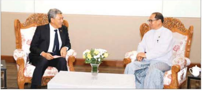
အပြည်ပြည်ဆိုင်ရာလေဆိပ်တွင် ကြိုဆိုခဲ့သည်။ နိုင်ငံသို့ ပြန်လည်ထွက်ခွာသွားကြောင်း သိရသည်။ ကိုယ်စားလှယ်အဖွဲ့သည် ညနေပိုင်းတွင် မလေးရှား သတင်းစဉ်