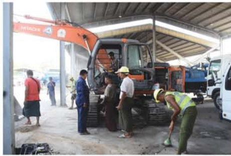
မန္တလေး မေ ၁၉

မန္တလေးမြို့တော်စည်ပင်သာယာရေးကော်မတီ စက်ရုံနှင့် ဖော်တော်ယာဉ်ဌာနသည် ပြည်သူ့အကျိုးပြုလုပ်ငန်းများဆောင်ရွက်လျက်ရှိသော မန္တလေးမြို့တော်