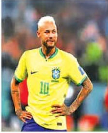
လန်ဒန် မေ ၁၉

တိုက်စစ်မှူးနေဟာ ၂၀၂၆ ကမ္ဘာ့ဖလား ပြိုင်ပွဲဝင်မည့် ဘရာဇီးလက်ရွေးစင်အသင်းတွင် ပြန်လည်ရွေးချယ်ခြင်းခံခဲ့ရသည်။ အဆိုပါ တိုက်စစ်မှူးသည် ၂၀၂၃ ခုနှစ် အောက်တိုဘာလ အတွင်း ဥရောပအသင်းနှင့် ယှဉ်ပြိုင်ကစားခဲ့သည့် ကမ္ဘာ့ဖလား ခြေစစ်ပွဲတွင် ခူးအရွတ်ဒဏ်ရာ