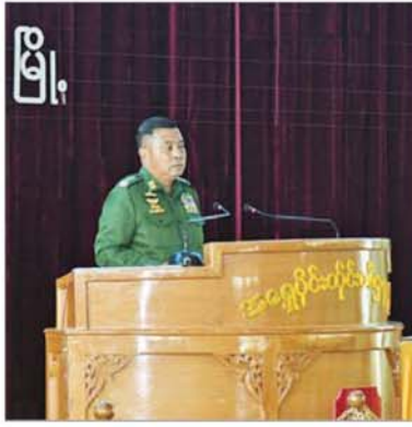
တပ်မတော်ကာကွယ်ရေးဦးစီးချုပ် ဗိုလ်ချုပ်ကြီး ရဲဝင်းဦး တောင်ကြီးတပ်နယ်မှ အရာရှိ၊ စစ်သည်၊ မိသားစုများအား တွေ့ဆုံအမှာစကားပြောကြားစဉ်။

နေပြည်တော် မေ ၁၉ တပ်မတော်ကာကွယ်ရေးဦးစီးချုပ် ဗိုလ်ချုပ်ကြီး ရဲဝင်းဦးသည် ယနေ့နံနက်ပိုင်းတွင် ကာကွယ်ရေးဦးစီးချုပ်(ရှေ့) ဗိုလ်ချုပ်ကြီး ထိန်ဝင်း၊ ကာကွယ်ရေးဦးစီးချုပ်(လေ) ဒုတိယဗိုလ်ချုပ်ကြီး ထွန်းဝင်း၊ ကာကွယ်ရေးဦးစီးချုပ်ရုံးမှ အဆင့်မြင့်တပ်မတော်အရာရှိကြီးများလိုက်ပါ၍ အရှေ့ပိုင်းတိုင်းစစ်ဌာနချုပ်၏ စစ်ဦးစီး၊ စစ်ရေးနှင့် စစ်ထောက်ဆိုင်ရာများ၊ နယ်မြေလုံခြုံရေးနှင့် တရားဥပဒေစိုးမိုးရေး ဆောင်ရွက်ထားရှိမှုအခြေအနေများကို ကြည့်ရှုစစ်ဆေးသည်။ ဦးစွာ တိုင်းစစ်ဌာနချုပ်အစည်းအဝေးခန်းမ၌ တိုင်းမှူးက အရှေ့ပိုင်းတိုင်းစစ်ဌာနချုပ်၏ သမိုင်းအကျဉ်း၊ တိုင်းစစ်ဌာနချုပ်နယ်မြေအတွင်း လုံခြုံရေး၊ နယ်မြေစိုးမိုးရေးနှင့် တရားဥပဒေစိုးမိုးရေး ဆောင်ရွက်နေမှုအခြေအနေများ၊ တိုင်းစစ်ဌာနချုပ်၏ စစ်ဦးစီး၊ စစ်ရေးနှင့် စစ်ထောက်လုပ်ငန်းဆိုင်ရာများ ဆောင်ရွက်ထားရှိမှုအခြေအနေများကို ရှင်းလင်းတင်ပြသည်။