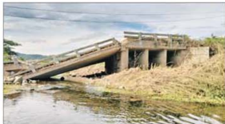
တပ်မတော်စစ်ကြောင်းများက အကြမ်းဖက်သောင်းကျန်းသူ ပုဂ္ဂိုလ်များအဖို့ အဖွဲ့များ ယာယီစိုးမိုးထားသည့် မောတောင်မြို့အား ပြန်လည် သိမ်းပိုက်ရရှိစဉ်။