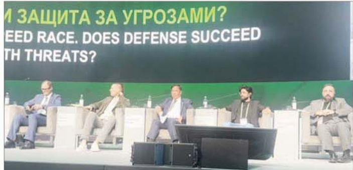
ကျင်းပသောဆွေးနွေးပွဲသို့ တက်ရောက်ဆွေးနွေးပြီး ယနေ့နိုင်ငံတကာတွင် အဓိကစိန်ခေါ်မှုတစ်ခုဖြစ်ပြီး တစ်ကမ္ဘာလုံးကို ခြိမ်းခြောက်လျက်ရှိသည့် ဆိုက်ဘာနည်းပညာဆိုင်ရာခြိမ်းခြောက်မှု အန္တရာယ်ကို ကြိုကြိုခံနိုင်ရေးနှင့် အကောင်းဆုံးတုံ့ပြန်ဆောင်ရွက်နိုင်မည့် အခြေအနေများကို ရုရှားနိုင်ငံနှင့် နိုင်ငံတကာမှ ပညာရှင်များ၊ လုပ်ငန်းရှင်များတာဝန်ရှိသူများနှင့် ဆွေးနွေးကြသည်။

နေပြည်တော် မေ ၁၉ သိပ္ပံနှင့်နည်းပညာဝန်ကြီးဌာန ပြည်ထောင်စုဝန်ကြီး ဒေါက်တာမျိုးသိန်းကျော်သည် ရုရှားဖက်ဒရေးရှင်းနိုင်ငံ Nizhny Novgorod မြို့၌ မေ ၁၈ ရက်မှ ၂၂ ရက်အထိကျင်းပသည့် (၁၁)ကြိမ်မြောက် “Digitalization of Industrial Russia (2026)” ဖိုရမ်ဖွင့်ပွဲအခမ်းအနားသို့ တက်ရောက်သည်။ အခမ်းအနားတွင် ရုရှားဖက်ဒရေးရှင်းနိုင်ငံ ဝန်ကြီးချုပ် Mr. Mikhail Mishustin က အဖွင့်အမှာစကားပြောကြားပြီး ရုရှားနိုင်ငံ၏ အဓိကစက်မှုလုပ်ငန်းများမှ တာဝန်ရှိသူများနှင့် ပညာရှင်များက သက်ဆိုင်ရာစက်မှုကဏ္ဍအလိုက် ဒီဂျစ်တယ်နည်းပညာအသုံးပြုဆောင်ရွက်နေသူများ၊ ရှေ့ဆက်ဆောင်ရွက်မည့်လုပ်ငန်းများကို တင်ပြဆွေးနွေးကြသည်။ မွန်းလုံပိုင်းတွင် “The Speed Race: Is Defense Keeping Pace with Threats?” ခေါင်းစဉ်ဖြင့်