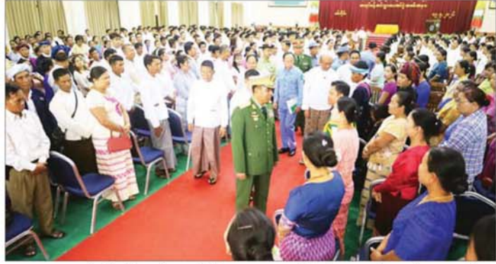
ကျရာဒေသများ၏ ဖွံ့ဖြိုးတိုးတက်ရေးလုပ်ငန်းများအတွက် ဒေသခံတိုင်းရင်းသားများနှင့်အတူ ပူးပေါင်းပါဝင် ဆောင်ရွက်ကြရန်နှင့် မူလလုပ်ငန်းတာဝန်များအပြင် ဒေသခံတိုင်းရင်းသားလူမျိုးများ၏ စာပေ၊ ရိုးရာ၊ လေ့ထုံးစံအမွေအနှစ်များကို လေးစားလိုက်နာကာ ချစ်မြတ်နိုးစွာ ပိုင်းဝန်းထိန်းသိမ်းကာကွယ်

စစ်ကိုင်း မေ ၁၉ ပြည်ထောင်စုတိုင်းရင်းသားလူငယ်များ စွမ်းရည်ဖွံ့ဖြိုးရေးဒီဂရီကောလိပ်(စစ်ကိုင်း) ၂၀၂၅-၂၀၂၆ ပညာသင်နှစ် ဝိဇ္ဇာဘွဲ့၊ သိပ္ပံဘွဲ့ အမှတ်စဉ်(၁၉) သင်တန်းဆင်းပွဲနှင့် အလုပ်ခန့်အပ်လွှာပေးအပ်ပွဲ အခမ်းအနားကို ယနေ့နံနက်ပိုင်းက အဆိုပါကောလိပ်ဘွဲ့နှင့်သင်တန်းဆင်းပွဲ ကျင်းပသည်။ အခမ်းအနားသို့ နယ်စပ်ရေးရာဝန်ကြီးဌာန ပြည်ထောင်စုဝန်ကြီး ဒုတိယဗိုလ်ချုပ်ကြီး ဖုန်းမြတ်၊ စစ်ကိုင်းတိုင်းဒေသကြီးဝန်ကြီးချုပ်၊ တိုင်းဒေသကြီးဝန်ကြီးများ၊ ပြည်ထောင်စုတိုင်းရင်းသား လူငယ်များ စွမ်းရည်ဖွံ့ဖြိုးရေးဒီဂရီကောလိပ် (စစ်ကိုင်း) ကျောင်းအုပ်ကြီး၊ ဆရာ ဆရာမများ၊ ကျောင်းသားကျောင်းသူများနှင့် မိသားစုဝင်များ တက်ရောက်ကြသည်။ ဦးစွာ ပြည်ထောင်စုဝန်ကြီးက မိမိတို့တာဝန်