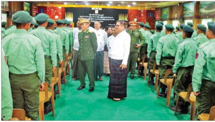
ကချင်ပြည်နယ်ဝန်ကြီးချုပ် ဦးခက်ထိန်နန်နှင့် မြောက်ပိုင်းတိုင်းစစ်ဌာနချုပ် တိုင်းမှူး ဝိုလ်ချုပ် အောင်စော်ထွေးတို့ စစ်မှန်ထမ်းတာဝန် ကျေပွန်စွာထမ်းဆောင်ပြီးသည့် ပြည်သူ့စစ်မှန်ထမ်းများအား ရင်းရင်းနှီးနှီး လိုက်လံနှုတ်ဆက်စဉ်။

ယခုကဲ့သို့ နိုင်ငံတဝန်ကို ကျေပွန်စွာ ထမ်းဆောင်၍ သတ်မှတ်ကာလ ပြည့်မြောက်ခဲ့ ကြသည့် နိုင်ငံသားကောင်း ပြည်သူ့စစ်မှန်ထမ်းများအား ဂုဏ်ပြု ချီးမြှင့်သည့် အခမ်းအနားသည် နိုင်ငံတော်အတွက် နိုင်ငံ သားကောင်းများပီပီ တာဝန် ကျေပွန်စွာ ထမ်းဆောင်ခဲ့ကြသူ များကို ထိုက်ထိုက်တန်တန် တန်ဖိုးထားခြင်းဖြစ်ပြီး တပ်မတော် နှင့် ပြည်သူ့အကြား ယုံကြည်မှု၊ အပြန်အလှန် လေးစားမှု၊ ကိုယ်ချင်းစာနားလည်မှုနှင့် နိုင်ငံ တော်ကာကွယ်ရေး အတွက် နိုင်ငံသားတိုင်း၏ တာဝန်ရှိမှု၊ တာဝန်ခံမှုတို့ကို ဖော်ပြသည့် သမိုင်းဝင်မှတ်တိုင်တစ်ခု ဖြစ်ရာ လက်ရှိတာဝန်ထမ်းဆောင်လျက် ရှိသည့် ပြည်သူ့စစ်မှန်ထမ်းများ၊ သင်တန်းတက်ရောက်နေဆဲဖြစ် သည့် ပြည်သူ့စစ်မှန်ထမ်းများနှင့်