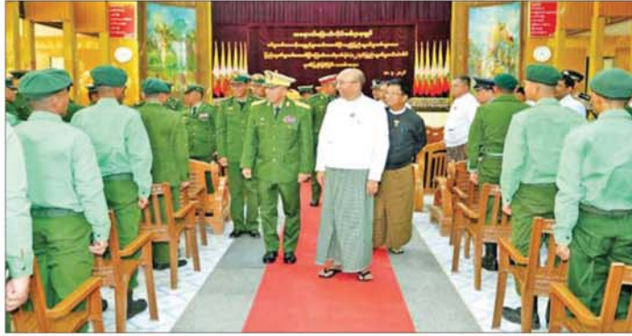
စစ်ကိုင်းတိုင်းဒေသကြီးဝန်ကြီးချုပ် ဦးကိုလေး သတ်မှတ်စစ်မှုထမ်းကာလပြည့်မြောက်ခဲ့သည့် ပြည်သူ့ စစ်မှုထမ်းများအား ရင်းရင်းနှီးနှီးလိုက်လံနှုတ်ဆက်စဉ်။

နေပြည်တော် မေ ၁၈ “နိုင်ငံသားတိုင်းသည် ဥပဒေ ပြဋ္ဌာန်းချက်များနှင့်အညီ စစ်ပညာ သင်ကြားရန်နှင့် နိုင်ငံတော် ကာကွယ်ရေးအတွက် စစ်မှုထမ်း ရန် တာဝန်ရှိသည်” ဟူသည့် ပြည်ထောင်စု သမ္မတမြန်မာ နိုင်ငံတော် ဖွဲ့စည်းပုံအခြေခံဥပဒေ (၂၀၀၈ ခုနှစ်) ပါ ပြဋ္ဌာန်းချက်များ ကို လက်တွေ့အကောင်အထည် ဖော်ခဲ့ပြီး ပြည်သူ့စစ်မှုထမ်းဥပဒေ အရ ပြည်သူ့စစ်မှုထမ်းအမှတ်စဉ် (၂/၂၀၂၄)တွင် မိမိဆန္ဒအလျောက် စိတ်အားထက်သန်စွာ ပါဝင် စာရင်းပေးသွင်းပြီး နိုင်ငံတော် ကာကွယ်ရေးနှင့် နယ်မြေ တည်ငြိမ်အေးချမ်းရေး တာဝန် များကို နိုင်ငံသားကောင်းများ ဝိသစွာ စွမ်းစွမ်းတမ်းတမ်းဆောင် ခဲ့ကြသော ပြည်သူ့စစ်မှုထမ်းများ သည် ယခုအခါ သတ်မှတ်စစ်မှု ထမ်းကာလ ပြည့်မြောက်ခဲ့ပြီဖြစ် သည်။ ထိုသို့ တာဝန်ကျေပွန်စွာ ထမ်းဆောင်ခဲ့ကြသည့် နိုင်ငံ သားကောင်း ပြည်သူ့စစ်မှုထမ်း များအား ပြည်သူ့စစ်မှုထမ်းဆောင် ပြီးကြောင်းလက်မှတ် ချီးမြှင့် ပေးအပ်ခြင်းနှင့် ပြည်သူ့စစ်မှုထမ်း တံဆိပ် ဂုဏ်ပြုချီးမြှင့်ခြင်း အခမ်း အနားများကို ယနေ့တွင် တိုင်းစစ် ဌာနချုပ်အသီးသီး၌ ကျင်းပ ပြုလုပ်ရာ နေပြည်တော်ကောင်စီ ဥက္ကဋ္ဌ တိုင်းဒေသကြီးနှင့်ပြည်နယ် များမှ ဝန်ကြီးချုပ်များ၊ ကာကွယ် ရေးဦးစီးချုပ်ရုံး (ကြည်း)မှ တပ်မတော် အရာရှိကြီးများ၊ သက်ဆိုင်ရာ တိုင်းစစ်ဌာနချုပ် အသီးသီးမှ တိုင်းမှူးများနှင့် တာဝန်ရှိသူများ၊ ဌာနဆိုင်ရာ တာဝန်ရှိသူများနှင့် သတ်မှတ် စစ်မှုထမ်းကာလကို တာဝန် ကျေပွန်စွာ ထမ်းဆောင် ပြီး မြောက်ခဲ့သည့် ပြည်သူ့စစ်မှုထမ်း