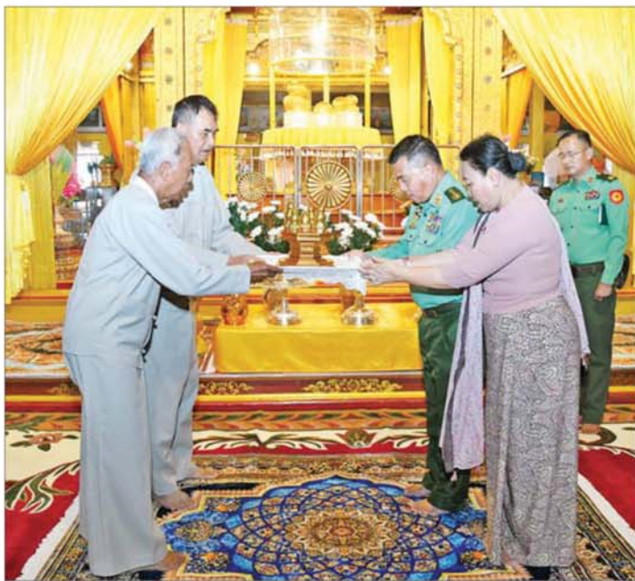
တပ်မတော်ကာကွယ်ရေးဦးစီးချုပ် ဗိုလ်ချုပ်ကြီးရဲဝင်းဦးနှင့် ဇနီး ဒေါ်နီလာ အင်းလေးဖောင်တော်ဦးမြတ်စွာဘုရား ဘက်စုံပြုပြင်မွမ်းမံရန်အတွက် အလှူငွေများပေးအပ်လှူဒါန်းစဉ်။

အဖွဲ့ဝင်များသည် အင်းလေးဖောင်တော်ဦး ရင်ပြင်တော်ရှိ စိန်နှင့်မြကျောင်းတိုက်သို့ သွားရောက်၍ ကျောင်းထိုင်ဆရာတော် ဘဒ္ဒန္တဝိဇယအား ဖူးမြော်ကြည်ညိုပြီး လှူဖွယ်ပစ္စည်းများ ဆက်ကပ်လှူဒါန်းသည်။ ထို့နောက် တပ်မတော်ကာကွယ်ရေးဦးစီးချုပ်နှင့် အဖွဲ့ဝင်များအား ရှင်းလင်းဆောင်၍ တာဝန်ရှိသူများက နိုင်ငံတော်အကြီးအကဲ၏ လမ်းညွှန်ချက်များအပေါ် လိုက်နာအကောင်အထည်ဖော် ဆောင်ရွက်ပြီးစီးမှု၊ ငလျင်ကြောင့် ထိခိုက်ပျက်စီးဆုံးရှုံးမှုနှင့် ပြန်လည်ပြုပြင်ခြင်းလုပ်ငန်းများ ဆောင်ရွက်ပြီးစီးမှုအခြေအနေများကို ရှင်းလင်းတင်ပြရာ တပ်မတော်ကာကွယ်ရေးဦးစီးချုပ်က လိုအပ်သည်များကို တာဝန်ရှိသူများနှင့် ပေါင်းစပ်ညှိနှိုင်း ဆောင်ရွက်ပေးသည်။ ယင်းနောက် တပ်မတော် ကာကွယ်ရေးဦးစီးချုပ်နှင့် အဖွဲ့ဝင်များသည် ငလျင်ဒဏ်ကြောင့် ဘုရားရင်ပြင်တော်ရှိ နေပူခံကျောက်ပြားများ ကွဲအက်ပျက်စီးခြင်း၊ မုခ်ဦးများ၊ လှေကားများ၊ ကရဝိတ်ဖောင်တော် ထားရှိရာ အဆောင်နှင့် အခြားသာသနိက အဆောက်အအုံများ ပြိုကျပျက်စီး