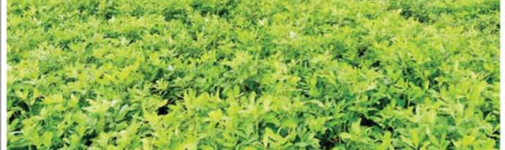
(ခဲပုံ) မေဝတီ(ပုသိမ်ကြီး)

စိုက်ပျိုးနိုင်ရေး၊ ဒေသနှင့်ကိုက်ညီသည့် မျိုးကောင်း၊ မျိုးသန့်များ ရရှိရေး၊ စိုက်ပျိုးစနစ်မှန်တန်ရေး၊ အထွက်နှုန်းကောင်းသောမျိုးများ စိုက်ပျိုးနိုင်ရေးတို့အတွက် အသိပညာပေးလုပ်ငန်းများ ဆောင်ရွက်ပေးသွားမည်ဖြစ်သည်။ မြေပဲကို အထွက်နှုန်းတိုးတက်ကောင်းမွန်အောင် စိုက်ပျိုးနိုင်မည်ဆိုပါက ဒေသတွင်း ဆီစားသုံးမှုဖူလုံစေမည့်အပြင် ပိုလှုံမှုကို ရောင်းချနိုင်သဖြင့် ဝင်ငွေရရှိပြီး လူမှုစီးပွားဘဝများ ဖွံ့ဖြိုးတိုးတက်လာမည်ဖြစ်သောကြောင့် မြေပဲကို တိုးချဲ့စိုက်ပျိုးနိုင်ရေး ကြိုးပမ်းဆောင်ရွက်ကြရမည်ဖြစ်ကြောင်း မြို့နယ်ဦးစီးမှူးက ပြောသည်။ (အောက်ပုံ) (၄၄၅)