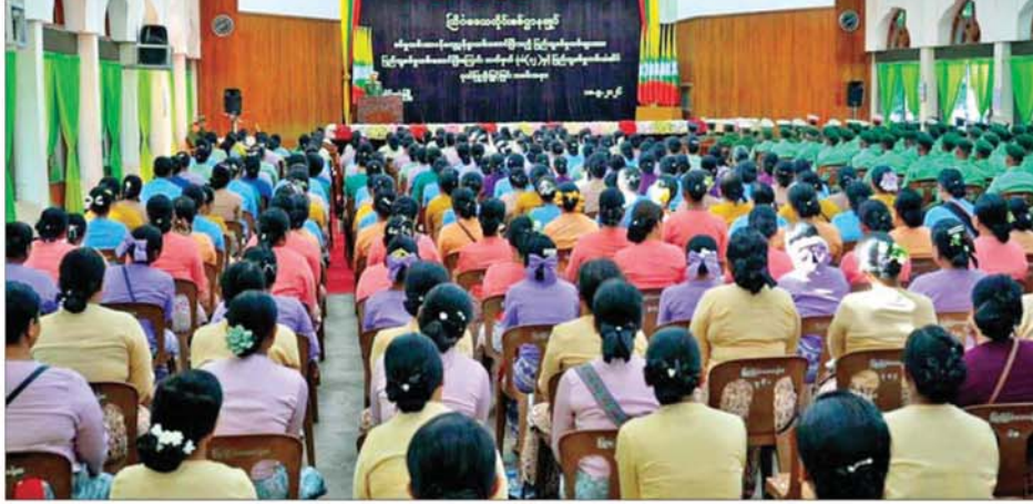
ကြိုက်ဒေသတိုင်းစစ်ဌာနချုပ်တိုင်းမှူး ဗိုလ်ချုပ်မှူးကြီးတို့နှင့် ပြည်သူ့စစ်မှုထမ်းများအား ပြည်သူ့စစ်မှုထမ်းဆောင်ပြီးကြောင်း လက်မှတ်နှင့် ပြည်သူ့စစ်မှုထမ်းတံဆိပ်များဂုဏ်ပြုချီးမြှင့်ပွဲ အခမ်းအနားတွင် အမှာစကားပြောကြားစဉ်။

၍ တပ်မတော်တွင် ဆက်လက် တာဝန် ထမ်းဆောင်ကြသည့် များလည်းရှိကြကြောင်း သိရ သည်။