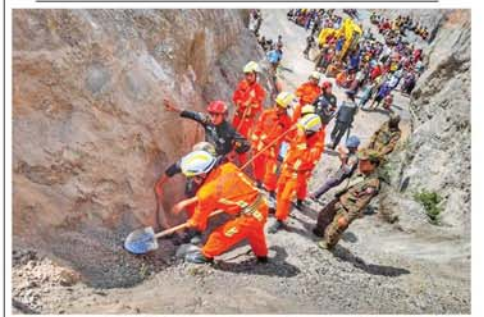
ကျောက်သဲကျင်းပြိုကျ၍ အမျိုးသားနှစ်ဦး သေဆုံး