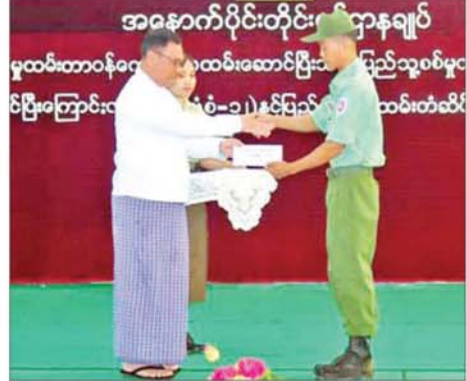
ရခိုင်ပြည်နယ်ဝန်ကြီးချုပ် ဦးနိုင်ဦး ပြည်သူ့စစ်မှုထမ်းတစ်ဦးအား ပြည်သူ့စစ်မှုထမ်းဆောင်ပြီးကြောင်း လက်မှတ်နှင့် ဂုဏ်ပြုချီးမြှင့်ငွေ ပေးအပ်စဉ်။

အဖြစ်လည်းကောင်း သမိုင်းဝင် ကမ္ဘာ့ဦးစွန်းထိုး မှတ်တမ်း ဝင်ခံခဲ့ကြပြီဖြစ်သည်။ နိုင်ငံတော် နှင့် တပ်မတော်အနေဖြင့်လည်း ၎င်းတို့ စစ်မှုထမ်းဆောင်စဉ် ကာလတစ်လျှောက်တွင် ရသင့် ရထိုက်သည့် အကျိုးခံစားခွင့်များ၊ လစာ၊ ရိက္ခာနှင့် အခြားထောက်ပံ့