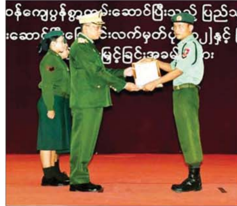
တောင်ပိုင်းတိုင်းစစ်ဌာနချုပ်တိုင်းမှူး ဝိုလ်ချုပ် မိုးကျော်ထက် ပြည်သူ့စစ်မှန်ထမ်းတစ်ဦးအား ပြည်သူ့စစ်မှန်ထမ်းဆောင်ပြီးကြောင်း လက်မှတ်နှင့် ဂုဏ်ပြုချီးမြှင့်ပေးအပ်စဉ်။