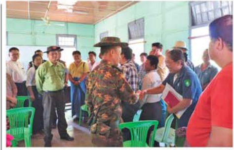
မြို့ပိ မြို့ပများ၊ ကျောင်းအကျိုးတော်ဆောင်များ၊ ကျောင်းသားပိဏ္ဍိများနှင့် တွေ့ဆုံ