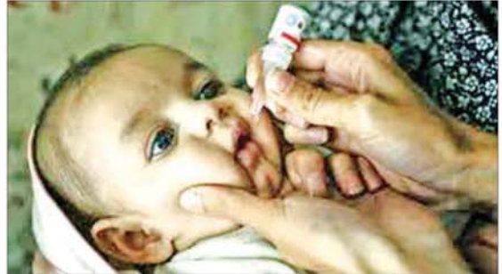
ပါကစ္စတန်နိုင်ငံတွင် ပိုလီယိုရောဂါ တိုက်ဖျက်ရေးလုပ်ငန်း ဆောင်ရွက်ရာတွင် အောင်မြင်မှုများ ရရှိနေသည်။ ကိုးကား-ဆင်ဟွာဘာသာပြန် - ဇွဲးသုရ

ဆယ်စုနှစ်လုံးအတွင်း ပိုလီယိုကာကွယ်ဆေးတိုက်ကျွေးရေး လုပ်ငန်းများ ဆောင်ရွက်ရာတွင် အောင်မြင်မှုများ ရရှိခဲ့ပြီး ၂၀၂၅ ခုနှစ်တွင် ရောဂါဖြစ်ပွားသူ ၃၁ ဦးသာ ရှိခဲ့သည်။ နိုင်ငံအတွင်း ရောဂါဖြစ်ပွားမှုနည်းပါးနေသော်လည်း အချို့ဒေသများတွင် ရောဂါကူးစက်မှုများထပ်မံတွေ့ရှိရသဖြင့် ကာကွယ်ဆေးတိုက်ကျွေးရေးလုပ်ငန်းများကို မြှင့်တင်ဆောင်ရွက်နေကြောင်း တာဝန်ရှိသူများက ပြောကြားသည်။