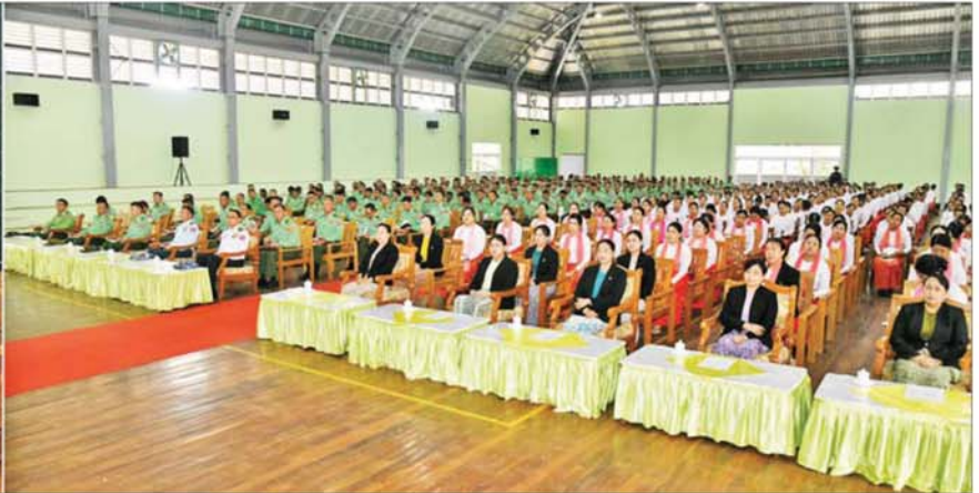
တပ်မတော်ကာကွယ်ရေးဦးစီးချုပ် ဗိုလ်ချုပ်ကြီး ရဲဝင်းဦး ကလောတပ်နယ်မှ အရာရှိ၊ စစ်သည်၊ မိသားစုများအား တွေ့ဆုံအမှာစကားပြောကြားစဉ်။

အဆိုပါ တွေ့ဆုံပွဲတွင် တပ်မတော်ကာကွယ်ရေးဦးစီးချုပ် ၏ဇနီး ဒေါ်နီလာ၊ ကာကွယ်ရေးဦးစီးချုပ် (ရေ) ဗိုလ်ချုပ်ကြီး ထိန်ဝင်းနှင့် ဇနီး၊ ကာကွယ်ရေးဦးစီးချုပ်(လေ) ဒုတိယဗိုလ်ချုပ်ကြီး ထွန်းဝင်းနှင့် ဇနီး၊ ကာကွယ်ရေးဦးစီးချုပ်ရုံးမှ အဆင့်မြင့် တပ်မတော်အရာရှိကြီး များနှင့်ဇနီးများ၊ အရှေ့ပိုင်းတိုင်း စစ်ဌာနချုပ်တိုင်းမှူးနှင့် တာဝန်ရှိသူများ၊ ကလောတပ်နယ်မှ အရာရှိ၊ စစ်သည်၊ မိသားစုများ တက်ရောက်ကြသည်။