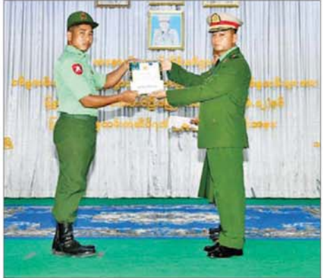
အနောက်တောင်တိုင်းစစ်ဌာနချုပ် တိုင်းမှူး ဝိုလ်မှူးချုပ် အောင်ကျော်ခိုင် ပြည်သူ့စစ်မှန်ထမ်းတစ်ဦးအား ပြည်သူ့စစ်မှန် ထမ်းဆောင်ပြီးကြောင်း လက်မှတ်နှင့် ဂုဏ်ပြုချီးမြှင့်ပေးအပ်စဉ်။

ပြည်သူတစ်သားတည်း ဖြစ်တည် မှုကို အပြည့်အဝသက်သေထူ သည့် သမိုင်းဝင်မှတ်တိုင်တစ်ခု လည်း ဖြစ်သည်။ သတ်မှတ်ကာလပြည့်မြောက် ခဲ့သည့် နိုင်ငံသားကောင်းပြည်သူ