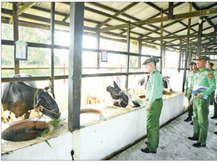
တပ်မတော်ကာကွယ်ရေးဦးစီးချုပ် ဗိုလ်ချုပ်ကြီးရဲဝင်းဦး အရှေ့ပိုင်းတိုင်းစစ်ဌာနချုပ် နန်းသီတာဘက်စုံစိုက်ပျိုးမွေးမြူရေးစခန်းတွင် ကြည့်ရှုစစ်ဆေးစဉ်။

ရိုကြောင်း၊ သို့ဖြစ်၍ ၎င်းတို့၏ မိသားစုဝင်များ၏ နေထိုင်စားသောက်ရေး၊ ကျန်းမာရေး၊ ပညာရေး စသည့်လိုအပ်ချက်များကို ဖြည့်ဆည်းဆောင်ရွက်ပေးရေးရန်လိုကြောင်း ပြောကြားပြီး အရာရှိ၊ စစ်သည်၊ ရဲမေများ တစ်ဦးချင်းစီ၏ တင်ပြချက်များအပေါ် လိုအပ်သည်များကို တာဝန်ရှိသူများနှင့် ပေါင်းစပ်ညှိနှိုင်းဆောင်ရွက်ပေးသည်။ တွေ့ဆုံပွဲအပြီးတွင် တပ်မတော်ကာကွယ်ရေးဦးစီးချုပ်က အရာရှိ၊ စစ်သည်၊ မိသားစုများအတွက် စားသောက်ဖွယ်ရာများကို ပေးအပ်ရာ တပ်နယ်မှူးက လည်းကောင်း၊ တပ်မတော်ကာကွယ်ရေးဦးစီးချုပ်၏ဇနီးဒေါ်နီလာက မိခင်နှင့်ကလေးစောင့်ရှောက်ရေး အသင်းများအတွက် ချီးမြှင့်ငွေများ ပေးအပ်ရာ တပ်နယ်မှူး၏ ဇနီးက လည်းကောင်း၊ လက်ခံရယူကြသည်။ ထို့နောက် တပ်မတော်ကာကွယ်ရေးဦးစီးချုပ်နှင့် အဖွဲ့ဝင်များသည် တက်ရောက်လာကြသည့် အရာရှိ၊ စစ်သည်၊ မိသားစုများအား ရင်းရင်းနှီးနှီးလိုက်လံ နှုတ်ဆက်ခဲ့ကြသည်။