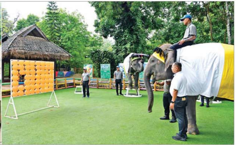
နိုင်ငံတော်သမ္မတ ဦးမင်းအောင်လှိုင် ပြင်ဦးလွင်မြို့ ပွဲကောက်ရေတံခွန် အပန်းဖြေခန်း (B.E FALLS) ၌ ဆင်လေးများ၏ ကျွမ်းကျင်မှုနှင့် အလှပြ ပြကွက်များကို ကြည့်ရှုအားပေးစဉ်။