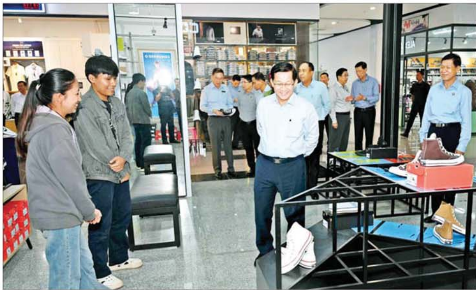
နိုင်ငံတော်သမ္မတ ဦးမင်းအောင်လှိုင် သုမင်္ဂလာဈေး (ညတောဈေး) အဆင့်မြှင့်တင်ရေးအဖွဲ့ဝင်များအဖွဲ့ဝင် ဖွင့်လှစ်ရောင်းချနေမှုများကို ကြည့်ရှုစဉ်။

၀ စာမျက်နှာ ၃ မှ ပြင်ဦးလွင်ဒေသတွင် ဆယ့်နှစ်လ ရာသီပတ်လုံးဖွေးပွင့်နိုင်ပြီး ရန်နဲ့ ညာညာ ပန်းမျိုးစုံရှိသည့်အတွက် ဒေသသို့ လာရောက်ကြသည့် ခရီးသွားအပန်းဖြေသူ စည်သည် များ မည်သည့်အချိန်တွင် လာရောက်သည်ဖြစ်စေ စိတ်ချမ်းသာမှုရှိစေရေး ပန်းများအမြဲဖြတ်ဖွေးပွင့်လှပနေအောင် စီမံဆောင်ရွက်ရမည်ဖြစ်ကြောင်း၊ ပန်းတို့၏ သဘောသည် လူကိုလန်းဆန်းစေပြီး လူတိုင်းနှစ်သက်ကြကြောင်း၊ ပန်းအလှအပများ၊ ကန်ရေပြင်၊ အေးမြလတ်ဆတ်သည့် ရေထု၊ လေထုတို့ဖြင့် မြို့ကိုလာရောက်သူများ စိတ်အေးချမ်းမှုရရှိစေရန် ပေးစွမ်းနိုင်ရမည် ဖြစ်ကြောင်း၊ ထို့ကြောင့် ကန်တော်ကြီးဥယျာဉ် အမြဲစိမ်းလန်း စိုပြည်စေရေး၊ ရေကန်များ ရေဝင်ရေထွက်ကောင်းမွန်စေရေး တာဝန်ရှိသူတို့က ဝိုင်းဝန်းထိန်းသိမ်းဆောင်ရွက်ကြရန်လိုကြောင်း။