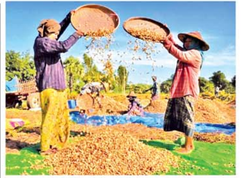
မြေပဲ၊ နှမ်း စိုက်တောင်သူများကို တိုးချဲ့စိုက်ပျိုးနိုင်ရန် အာမခံ သီးနှံဈေးနှုန်းများ သတ်မှတ်

နှမ်းမျိုးစုံဈေးကွက်မှာ မေ ၁၇ ရက်တွင် နှမ်းနက် သုံးတင်းဝင် တစ်အိတ်လျှင် ငွေကျပ် ၆၂၀၀၀၊ နှမ်းဖြူ(ဂျာပန်)သုံးတင်းဝင် တစ် အိတ်လျှင် ငွေကျပ် ၃၇၀၀၀၊ နှမ်းဖြူ(မာ)သုံးတင်းဝင်တစ်အိတ် လျှင် ငွေကျပ် ၃၆၅၀၀၊ နှမ်းညို သုံးတင်းဝင် တစ်အိတ်လျှင် ငွေ ကျပ် ၃၇၅၀၀ ပေါက်ဈေးရှိနေ ပြီး မြေပဲအနီလုံးဆန်တစ်ပိဿာ လျှင် ငွေကျပ် ၁၂၀၀၊ မြေပဲဆီ တစ်ပိဿာလျှင် ငွေကျပ် ၂၀၀၀ အသီးသီး ပေါက်ဈေးရှိနေကြောင်း သိရသည်။