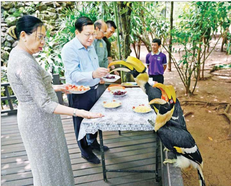
နိုင်ငံတော်သမ္မတ ဦးမင်းအောင်လှိုင်နှင့် စနိုး ဒေါ်ကြူကြူလှ ပြင်ဦးလွင်မြို့ အမျိုးသားကန်တော်ကြီးဥယျာဉ်အတွင်းရှိ ငှက်များအား အစာကျွေးစဉ်။

၀ ရှေးမှပု ရှင်းလင်းတင်ပြမှုအပေါ် လိုအပ် သည်များ လမ်းညွှန်မှာကြားပြီး အပန်းဖြေခန်းအတွင်း ဘာကို ယာဉ်ငယ်များဖြင့် လှည့်လည် ကြည့်ရှုစစ်ဆေးကြသည်။ ထိုသို့ လှည့်လည်ကြည့်ရှု စစ်ဆေးစဉ် တာဝန်ရှိသူများ၏ တင်ပြချက်များအပေါ် နိုင်ငံတော် သမ္မတက ပွဲကောက်ရေတံခွန် အပန်းဖြေခန်း (B.E FALLS) အတွင်း ခရီးသွားများ၊ ပြည်သူများ စိတ်အေးချမ်းသာစွာဖြင့် အပန်း ဖြေ အနားယူနိုင်ရေးအတွက် အမြဲသန့်ရှင်း သာယာလှပပြီး စိမ်းလန်းစိုပြည်မှုရှိအောင် ဆောင် ရွက်ထားရှိရန်၊ သစ်ပင်ပန်းမန် များကို စနစ်တကျစိုက်ပျိုးရန်၊ လျှောက်လမ်းများနှင့် တံတားများ ကောင်းမွန်စေရေး ဆောင်ရွက်