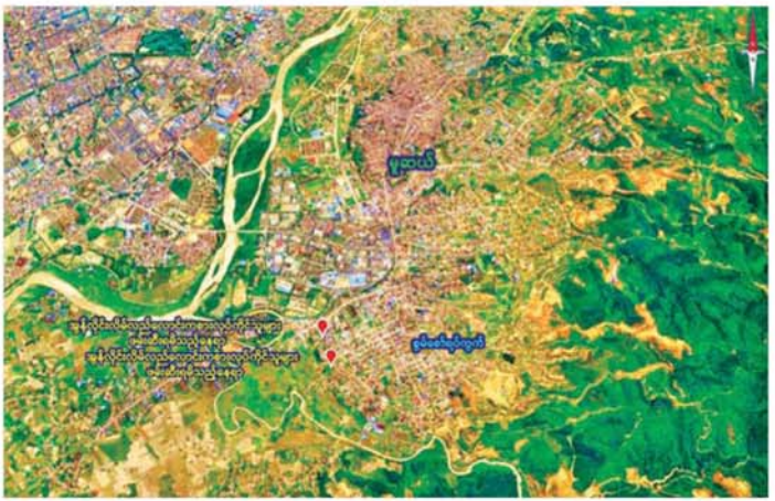
ရှမ်းပြည်နယ်(မြောက်ပိုင်း) မူဆယ်မြို့ စွမ်းစော်ရပ်ကွက်အတွင်း အွန်လိုင်းလိမ်လည်လောင်းကစား လုပ်ကိုင်နေကြသူများအား လုပ်ငန်းသုံးပစ္စည်းများနှင့်အတူ ဖမ်းဆီးရမိနေရာပြပုံ။

ဦးတို့အား ဖုန်းမျိုးစုံ ၁၅၅လုံး၊ All In One ကွန်ပျူတာ အလုံး ၃၀၊ တရုတ်ငွေ ယွမ် ၁၀၀၀၀၊ မြန်မာငွေ ၁၀ သိန်းကျပ်နှင့် Crown အမျိုးအစား မော်တော်ယာဉ် နှစ်စီးတို့နှင့်အတူ ဖမ်းဆီးရမိခဲ့သည်။ ဆက်လက်၍ လုံခြုံရေးပူးပေါင်းအဖွဲ့များသည် နယ်မြေရှင်းလင်းခြင်းနှင့် ရှာဖွေဖော်ထုတ်စစ်ဆေး ခြင်းလုပ်ငန်းများ ဆက်လက်ဆောင်ရွက်ခဲ့ရာ ညနေ ၅နာရီခန့်တွင် အဆိုပါရပ်ကွက်အတွင်းရှိ နေအိမ် တစ်လုံးမှ အွန်လိုင်းလိမ်လည်လောင်းကစားမှု ကျူးလွန်သူ မြန်မာနိုင်ငံသား အမျိုးသား လေးဦး အား ဖုန်းမျိုးစုံ ၉၅ လုံး၊ Laptop တစ်လုံး၊ Wifi စက် နှစ်လုံးတို့နှင့်အတူ ထပ်မံဖမ်းဆီးရမိခဲ့သည်။