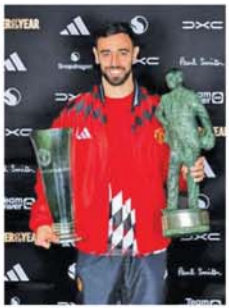
အောင်မြင်မှုဆုဖလားတွေ ရယူနိုင်ဖို့ ဆက်လက်ကြိုးစားသွားမှာပါ ဟု ပြောသည်။ (အပေါ်ပုံ)

လန်ဒန် မေ ၁၇ မန်ယူအသင်းမှ ပေးအပ်ချီးမြှင့်သည့် တစ်နှစ်တာအကောင်းဆုံး ဆုရရှိခဲ့ခြင်းဖြစ်သည့် Sir Matt Busby Player of the year နှင့် Players' Player of the year ဆုနှစ်ခုကို ကွင်းလယ်ကစားသမား ဘရန်နိုအသင်းက ထိုက်ထိုက်တန်တန် ဆွတ်ခူးခဲ့သည်။