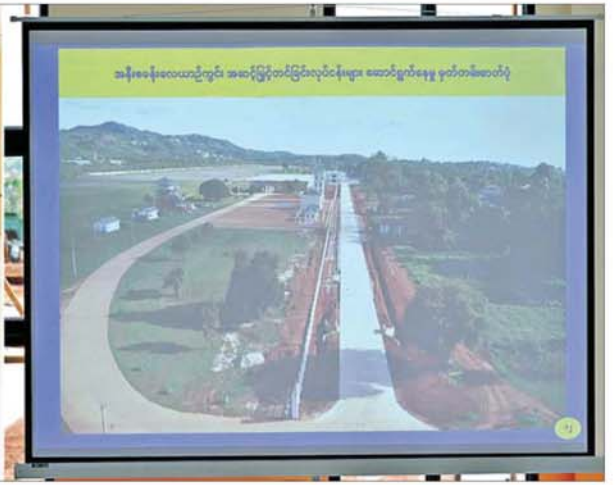
နိုင်ငံတော်သမ္မတ ဦးမင်းအောင်လှိုင်အား အနီးစခန်းလေဆိပ် အဆင့်မြှင့်တင်နေမှုအခြေအနေများကို နယ်မြေခံစစ်အင်ဂျင်နီယာတပ်မှ တာဝန်ရှိသူတစ်ဦးက ရှင်းလင်းတင်ပြစဉ်။

၀ စာမျက်နှာ ၃ မှ ပြင်ဦးလွင်ဒေသတွင် ဆယ့်နှစ်လ ရာသီပတ်လုံးဖွေးပွင့်နိုင်ပြီး ရန်နဲ့ ညာညာ ပန်းမျိုးစုံရှိသည့်အတွက် ဒေသသို့ လာရောက်ကြသည့် ခရီးသွားအပန်းဖြေသူ စည်သည် များ မည်သည့်အချိန်တွင် လာရောက်သည်ဖြစ်စေ စိတ်ချမ်းသာမှုရှိစေရေး ပန်းများအမြဲဖြတ်ဖွေးပွင့်လှပနေအောင် စီမံဆောင်ရွက်ရမည်ဖြစ်ကြောင်း၊ ပန်းတို့၏ သဘောသည် လူကိုလန်းဆန်းစေပြီး လူတိုင်းနှစ်သက်ကြကြောင်း၊ ပန်းအလှအပများ၊ ကန်ရေပြင်၊ အေးမြလတ်ဆတ်သည့် ရေထု၊ လေထုတို့ဖြင့် မြို့ကိုလာရောက်သူများ စိတ်အေးချမ်းမှုရရှိစေရန် ပေးစွမ်းနိုင်ရမည် ဖြစ်ကြောင်း၊ ထို့ကြောင့် ကန်တော်ကြီးဥယျာဉ် အမြဲစိမ်းလန်း စိုပြည်စေရေး၊ ရေကန်များ ရေဝင်ရေထွက်ကောင်းမွန်စေရေး တာဝန်ရှိသူတို့က ဝိုင်းဝန်းထိန်းသိမ်းဆောင်ရွက်ကြရန်လိုကြောင်း။