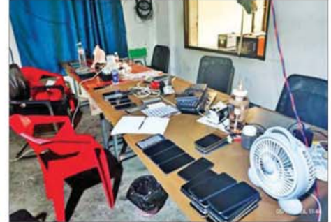
ရှမ်းပြည်နယ်(မြောက်ပိုင်း) မူဆယ်မြို့ စွမ်းစော်ရပ်ကွက်အတွင်း အွန်လိုင်းလိမ်လည်လောင်းကစားမှုကျူးလွန်ရာတွင် အသုံးပြုသည့်အဆောက်အအုံများ၊ လုပ်ငန်းသုံးပစ္စည်းများနှင့် ဆက်စပ်ပစ္စည်းများအား တွေ့ရစဉ်။