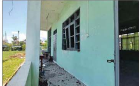
Drone ကျရောက်ပေါက်ကွဲမှုကြောင့် အခြေခံပညာအထက်တန်းကျောင်း(ခွဲ) အောင်ဇေယျရှိ စာသင်ဆောင်များ ပျက်စီးခဲ့မှုကို တွေ့ရစဉ်။