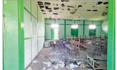
Drone ကျရောက်ပေါက်ကွဲမှုကြောင့် အခြေခံပညာအထက်တန်းကျောင်း(ခွဲ) အောင်ဇေယျရှိ စာသင်ဆောင်များ ပျက်စီးခဲ့မှုကို တွေ့ရစဉ်။