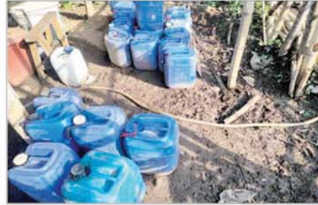
မေ ၁၂ ရက်က သံလွင်မြစ်၏ အရှေ့ဘက်ကမ်းတစ်လျှောက်တွင် တရားမဝင်အွန်လိုင်းလိမ်လည်မှုလုပ်ငန်းများ ဆောင်ရွက်ခဲ့သည့် သိမ်းဆည်းရမိ အဆောက်အအုံများနှင့် လုပ်ငန်းသုံးပစ္စည်းများကို တွေ့မြင်ရစဉ်။