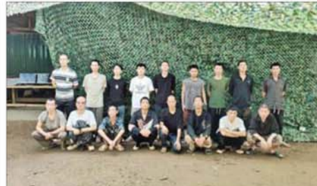
တရားမဝင်တရုတ်နိုင်ငံသား အမျိုးသား ၁၇ ဦးကို တွေ့ရစဉ်။

အနီး၌ အွန်လိုင်းလိမ်လည် လောင်းကစားမှု လုပ်ငန်းများ လုပ်ကိုင်ပြီး ထွက်ပြေးတိမ်းရှောင် နေသည့်တရားမဝင် တရုတ်နိုင်ငံ သား ၁၈ ဦး ပါဝင်သော အဖွဲ့ တစ်ဖွဲ့၊ ၁၉ ဦး ပါဝင်သော အဖွဲ့ တစ်ဖွဲ့၊ ၂၀ ဦး ပါဝင်သော အဖွဲ့ နှင့် ၁၇ ဦးပါဝင်သော အဖွဲ့တစ်ဖွဲ့ တို့ဖြင့် စုစုပေါင်းတရားမဝင် တရုတ် နိုင်ငံသား ၇၅ ဦးကို တွေ့ရှိဖမ်းဆီး ရမိခဲ့ပြီး ညနေ ၅ နာရီခန့်တွင် အဆိုပါ အနီးတစ်ဝိုက်၌ တရားမဝင် တရုတ် နိုင်ငံသား ၁၅ ဦးကို ထပ်မံတွေ့ရှိ ဖမ်းဆီးရမိခဲ့ရာ စုစုပေါင်း တရား မဝင် တရုတ်နိုင်ငံသား ၉၀ ကို တွေ့ရှိဖမ်းဆီးရမိခဲ့သည်။