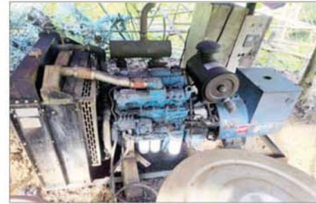
မေ ၁၂ ရက်က သံလွင်မြစ်၏ အရှေ့ဘက်ကမ်းတစ်လျှောက်တွင် တရားမဝင်အွန်လိုင်းလိမ်လည်မှုလုပ်ငန်းများ ဆောင်ရွက်ခဲ့သည့် သိမ်းဆည်းရမိ အဆောက်အအုံများနှင့် လုပ်ငန်းသုံးပစ္စည်းများကို တွေ့မြင်ရစဉ်။