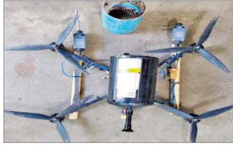
အကြမ်းဖက်သောင်းကျန်းသူများ ပစ်လွှတ်သည့် FPV Suicide Drone အား တွေ့ရစဉ်။