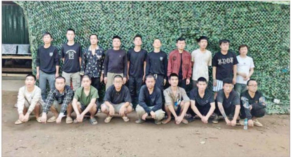
အွန်လိုင်းလိမ်လည်လောင်းကစားမှုကျူးလွန်ရာတွင် ပါဝင်ပတ်သက်ခဲ့သည့် တရုတ်နိုင်ငံသား ၁၉ ဦးကို တွေ့ရစဉ်။

ရှမ်းပြည်နယ်(မြောက်ပိုင်း) မက်မန်းမြို့နယ်အတွင်းရှိ သံလွင်မြစ်အရှေ့ဘက်ကမ်းတစ်လျှောက်၌ အွန်လိုင်းလိမ်လည်လောင်းကစားမှုများ လုပ်ဆောင်နေကြောင်း သတင်းအရ လုံခြုံရေးတပ်ဖွဲ့ဝင်များပါဝင်သော ပူးပေါင်းအဖွဲ့က ရှာဖွေစစ်ဆေးမှုများဆောင်ရွက်ခဲ့ရာ မေ ၁၂ ရက်ညနေ ၄ နာရီခန့်တွင် မက်မန်းမြို့၏ အနောက်တောင်ဘက် ၅၅ ကီလိုမီတာခန့်အကွာရှိ သံလွင်မြစ်အနီး၌ အွန်လိုင်းလိမ်လည်လောင်းကစားမှုများလုပ်ကိုင်ရာတွင် အသုံးပြုသည့် အလျားပေ ၈၀၊ အနံပေ ၄၀ ရှိ လူနေနံ့ကာတံ သုံးလုံးနှင့် စာမျက်နှာ ၁၆ သို့ ၀