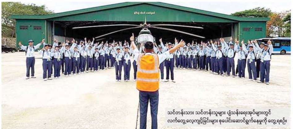
သင်တန်းသား သင်တန်းသူများ ပုံသန်းရေးအုပ်များတွင် လက်တွေ့လေ့ကျင့်ခြင်းများ စုပေါင်းဆောင်ရွက်နေမှုကို တွေ့ရစဉ်။

ထိုသို့ လေ့ကျင့်သင်ကြားလျက်ရှိရာ ယနေ့တွင် ရေတပ် ဆက်သွယ်ရေးဘာသာရပ်၌ ပါဝင်သည့် ဗျည်း၊ သရ၊ လက္ခဏာ လက်ရှိကံအလံအချက်ပြသင်ခန်းစာ၊ လေ့လျော်ရွက်တိုက်ဘာသာရပ် ၌ ပါဝင်သည့် လေ့နှင့် လှော်တက်အမျိုးအစားများ သင်ခန်းစာ၊ လှော်ခတ်ပုံနည်းစနစ်သင်ခန်းစာ၊ ရွက်လှော်အမျိုးအစားနှင့် ရွက်လှော် ပုံသင်ခန်းစာများကို နေပြည်တော်ကောင်စီနယ်မြေရှိ နေပြည်တော် ရေကြောင်းလူငယ်စခန်းမှ သင်တန်းသား၊ သင်တန်းသူ ၉၅ ဦး၊ ရန်ကုန်တိုင်းဒေသကြီး ရန်ကုန်မြို့ရှိ အင်းလျားရေကြောင်းလူငယ် စခန်းမှ သင်တန်းသား၊ သင်တန်းသူ ၁၀၀၊ ဘားအံမြို့ရှိ ရေကြောင်း လူငယ်စခန်းမှ သင်တန်းသား၊ သင်တန်းသူ ၁၂၀၊ ရှမ်းပြည်နယ် ကျိုင်းတုံမြို့ရှိ ရေကြောင်းလူငယ်စခန်းမှ သင်တန်းသား၊ သင်တန်းသူ ၆၀၊ ဧရာဝတီတိုင်းဒေသကြီး ဟိုင်းကြီးကျွန်းမြို့ရှိ ရေကြောင်းလူငယ် စခန်းမှ သင်တန်းသား၊ သင်တန်းသူ ၅၀၊ ဟိန်းခဲဒေသရှိ ရေကြောင်း လူငယ်စခန်းမှ သင်တန်းသား၊ သင်တန်းသူ ၄၀၊ ကျွန်းစုမြို့ရှိ ရေကြောင်းလူငယ်စခန်းမှ သင်တန်းသား၊ သင်တန်းသူ ၅၀ နှင့် မန္တလေးတိုင်းဒေသကြီး၊ မန္တလေးမြို့ရှိ ရေကြောင်းလူငယ်စခန်းမှ သင်တန်းသား၊ သင်တန်းသူ ၇၅ ဦးတို့ကို သက်ဆိုင်ရာနယ်မြေ