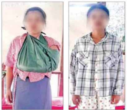
Drone ကျရောက်ပေါက်ကွဲမှုကြောင့် ထိခိုက်ဒဏ်ရာရရှိခဲ့သည့် မူလတန်း ကျောင်းအုပ်ဆရာနှင့် ရုံးဝန်ထမ်းများအား တွေ့ရစဉ်။

ထိုသို့ လုပ်ဆောင်လျက်ရှိရာ မေ ၁၂ ရက်တွင် စစ်ကိုင်းတိုင်းဒေသကြီး အင်းတော်မြို့ရှိ အခြေခံပညာအထက်တန်းကျောင်း (ခွဲ) (အောင်ဇေယျ)၌ ဆရာ ဆရာမများနှင့် ရုံးအဖွဲ့များက ကျောင်းဖွင့်ရာသို့တွင် ကျောင်းသားကျောင်းသမားများအား အသိပေးခဲ့ခြင်း၊ စာသင်ခန်းများနှင့် သင်ထောက်ကူပစ္စည်းများ စနစ်တကျရှိစေရေး စသည့် ကြိုတင်ပြင်ဆင်မှု လုပ်ငန်းများ ဆောင်ရွက်နေစဉ် နံနက် ၁၁