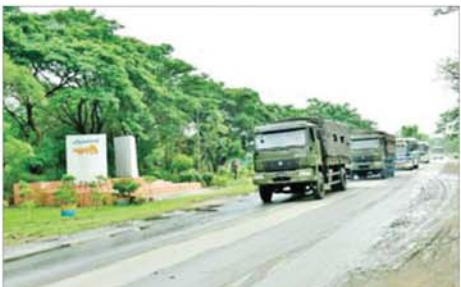
ဌာနဆိုင်ရာ ဝန်ထမ်းများနှင့်အတူ ကုန်ပစ္စည်းများ တင်ဆောင်လာသည့် မော်တော်ယာဉ်များ မတ္တရာမြို့အား ဖြတ်သန်းထွက်ခွာစဉ်။