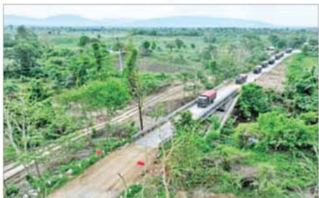
ဌာနဆိုင်ရာ ဝန်ထမ်းများနှင့်အတူ ကုန်ပစ္စည်းများ တင်ဆောင်လာသည့် မော်တော်ယာဉ်များ မတ္တရာမြို့အား ဖြတ်သန်းထွက်ခွာစဉ်။