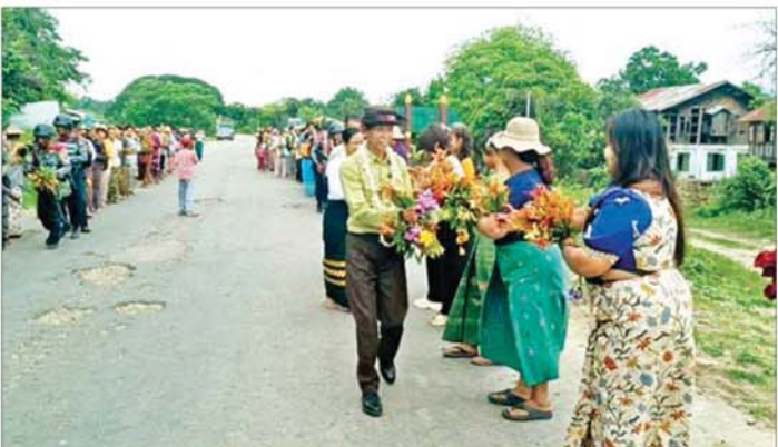
အင်းတော်မြို့တွင် တာဝန်ထမ်းဆောင်ကြမည့် ဌာနဆိုင်ရာဝန်ထမ်းများအား ဒေသခံများက သောင်းသောင်းဖြဖြကြိုဆိုကြစဉ်။

အ ရှေ့မှ မြန်မာနိုင်ငံ၏ မြောက်ပိုင်း ဒေသ ဖွံ့ဖြိုးတိုးတက်ရေးအတွက် အရေးကြီးသော အခြေခံအဆောက်အအုံတစ်ခုဖြစ်သည့် မန္တလေးတိုင်းဒေသကြီးမှ စစ်ကိုင်းတိုင်းဒေသကြီးနှင့် ကချင်ပြည်နယ်အထိ ဆက်သွယ်ထားသည့် မန္တလေး-မတ္တရာ-သပိတ်ကျင်း-တကောင်း- ထီးချိုင့်- ကသာ-အင်းတော်-ဖော်လူး-နန်စီးအောင်-မိုးညှင်း-မိုးကောင်း-မြစ်ကြီးနား ဆက်သွယ်ရေး လမ်းကြောင်းအား အကြမ်းဖက်သောင်းကျန်းသူများက ယာယီစိုးမိုးပိတ်ဆို့ထားစဉ် ဒေသခံတိုင်းရင်းသားပြည်သူများ၏ ကုန်စည်သယ်ယူပို့ဆောင်ရေးနှင့် ကုန်စည်စီးဆင်းမှုများတွင် အခက်အခဲများ ဖြစ်ပေါ်ခဲ့ပြီး စားနပ်ရိက္ခာနှင့် နေထိုင်ပစ္စည်းများ ရှားပါးလာခြင်း၊ ဆေးဝါးနှင့် အရေးပေါ်သုံး ပစ္စည်းများ