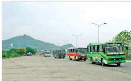
ဌာနဆိုင်ရာ ဝန်ထမ်းများနှင့်အတူ ကုန်ပစ္စည်းများ တင်ဆောင်လာသည့် မော်တော်ယာဉ်များ မန္တလေးမြို့မှ စတင်ထွက်ခွာစဉ်။

အမျိုးသားလွှတ်တော်ကိုယ်စားလှယ်များအနေဖြင့် အစည်းအဝေးအတွက် လိုအပ်သည့် ပြင်ဆင်မှုများ ပြုလုပ်နိုင်ရန် ဖိတ်စာလက်ခံရရှိသည်ဖြစ်စေ၊ မရရှိသည်ဖြစ်စေ နေပြည်တော်၊ အမျိုးသားလွှတ်တော်ရုံး၊ ရေးရာဆောင်အမှတ်-၁၉ (I -19)သို့ ၂၀၂၆ ခုနှစ် မေလ ၃၀ ရက်(စနေနေ့) ထက်မစော မေလ ၃၁ ရက်(တနင်္ဂနွေနေ့)ထက် နောက်မကျစေဘဲ ရုံးချိန်အတွင်းသတင်းပို့ကြရန်နှင့် လွှတ်တော်ကိုယ်စားလှယ်စိစစ်ရေးကော်မရှာ ယူဆောင်လာကြရန်ဖြစ်ပါသည်။ သတင်းစဉ်