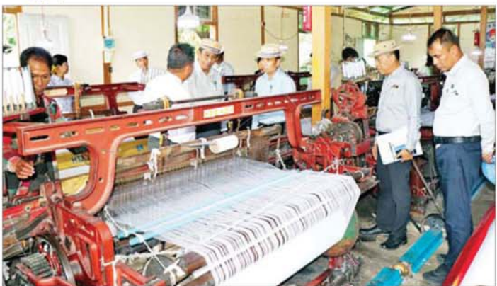
ရေးလုပ်ငန်းသမဝါယမအသင်းသား တောင်သူတစ်ဦး အသင်း၏ သဘာဝမြေဩဇာထုတ်လုပ်နေမှုနှင့် ၏ နွေစပါးစိုက်ပျိုးထားရှိမှု၊ ပုဗ္ဗသီရိမြို့နယ် နို့စားနွားများ မွေးမြူထားရှိမှုကို ကြည့်ရှုစစ်ဆေးပြီး ကျောက်စရစ်ကုန်းကျေးရွာအနီးရှိ စမ်းဝတ်မွေးမြူလုပ်ငန်းလိုအပ်ချက်များအပေါ် ပြည်ဆည်းဆောင်ရေးနှင့် သဘာဝမြေဩဇာထုတ်လုပ်ရေး သမဝါယမရွက်ပေးခဲ့ကြောင်း သိရသည်။ သတင်းစဉ်

ညီညွတ်ညွတ်ဖြင့် စုပေါင်းဆောင်ရွက်ကြရန် လိုအပ်ကြောင်း ဆွေးနွေးပြောကြားပြီး ကျေးရွာတွင်း လမ်းတံတားလုပ်ငန်းများ၊ ကျေးရွာရေရရှိရေးနှင့် ကျေးရွာစီးရရှိရေးလုပ်ငန်းများနှင့် ကျေးလက်ဆေးပေးခန်းကိုလည်းကောင်း၊ ဝက်မွေးမြူရေးလုပ်ငန်းများနှင့် စက်ရက်ကန်းလုပ်ငန်း လည်ပတ်ဆောင်ရွက်နေမှုကိုလည်းကောင်း လှည့်လည်ကြည့်ရှုစစ်ဆေးပြီး လုပ်ငန်းလိုအပ်ချက်များကို ဆွေးနွေးမှာကြားကာ လိုအပ်သည်များ ပေါင်းစပ်ညှိနှိုင်းဆောင်ရွက်ပေးသည်။ ယင်းနောက် အေးချမ်းသာစွာပြကျေးရွာရှိ အေးချမ်းသာစွာပြစိုက်ပျိုးရေးနှင့် အထွေထွေစီးပွား