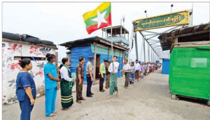
ထီးချိုင့်မြို့တွင် တာဝန်ထမ်းဆောင်ကြမည့် ဌာနဆိုင်ရာဝန်ထမ်းများအား ဒေသခံများက သောင်းသောင်းဖြဖြကြိုဆိုကြစဉ်။