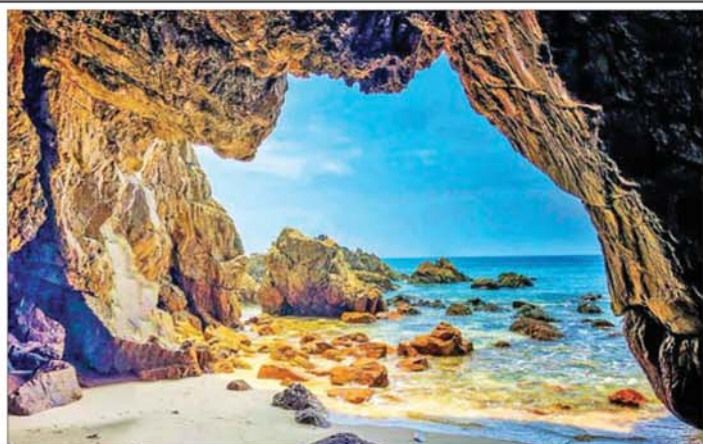
ဝါးအလယ်ကျွန်းတွင် နိုင်ငံခြားသားခရီးသွားများ လည်ပတ်ရာ ထုံးကျောက်ဂူတစ်ခုကိုတွေ့ရစဉ်။

* စာမျက်နှာ ၂၄ မှ ခရီးသွား ဝင်ရောက်မှုများသည် ဒီဇင်ဘာလ၊ ဇန်နဝါရီလတို့တွင် တစ်ဦးလျှင် အမေရိကန် ဒေါ်လာ ၈၅၀ နှင့် ကျန်သောလများ၌ အမေရိကန်ဒေါ်လာ ၈၀၀ ဖြင့် ဝန်ဆောင်မှုပေးသည်။ ဝါးအလယ်ကျွန်း အပန်းဖြေစခန်းသို့ နိုင်ငံဘာလမှ ဧပြီလကုန်ပိုင်းအထိ ခရီးသွားများ လည်ပတ်လေ့ရှိပြီး ပုံမှန်အားဖြင့် ဩဂုတ်လမှစ၍ ခရီးသွားလက်ခံလေ့ရှိသော်လည်း ယခုခရီးသွားရာသီ၌ ခရီးသွား ပိုမိုဝင်ရောက်ခဲ့မှုကြောင့် လာမည့်ခရီးသွားရာသီ ကာလအတွက် ယခုမေလမှစကာ ကြိုတင်စာရင်း လက်ခံလျက်ရှိသည်။ "ကျွန်တော်တို့က ဝါးအလယ်ကျွန်းကို စဉ်းစားသည့်အများကြီး