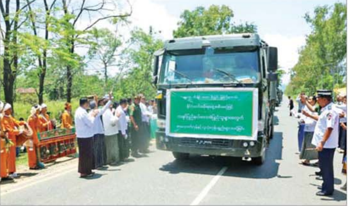
ဌာနဆိုင်ရာ ဝန်ထမ်းများနှင့်အတူ ကုန်ပစ္စည်းများ တင်ဆောင်လာသည့် မော်တော်ယာဉ်များအား မြစ်ကြီးနားမြို့မှ ဒေသခံများက သောင်းသောင်းဖြူကြိုဆိုကြစဉ်။

အင်တိုက်အားတိုက် ဆက်လက် ဆောင်ရွက်ပေးသွားမည် ဖြစ်ကြောင်းနှင့် မော်တော်ယာဉ်များဖြင့် ပါရှိလာသည့် အခြေခံစားသောက်ကုန်များနှင့် လူသုံးကုန်ပစ္စည်းများကို မြို့ရွာအသီးသီး ရှိ ဒေသခံပြည်သူများအား သက်ဆိုင်ရာ တာဝန်ရှိသူများမှ တစ်ဆင့် ထောက်ပံ့ပေးအပ်သွားမည်ဖြစ်သည်။ ထို့အပြင် အဆိုပါ မော်တော်ယာဉ်များနှင့် အတူ ပါရှိလာသည့် ကုန်သည်များ သယ်ဆောင်လာသည့် လူသုံးကုန်ပစ္စည်းများအား လမ်းကြောင်းတစ်လျှောက်ရှိ မြို့ရွာများအတွင်း ပို့ဆောင် ရောင်းချနိုင်ခဲ့သဖြင့် ဒေသတွင်း ကုန်ချေးနှုန်းကြီးမြင့် ခဲ့မှုများကို လျှော့ချပေးနိုင်ခဲ့ပြီဖြစ်ကြောင်းနှင့် ယခုအခါ အဆိုပါ လမ်းကြောင်း တစ်လျှောက်တွင် ခရီးသွား မော်တော်ယာဉ်များ၊ ကုန်စည်သယ်ယူပို့ဆောင်ရေး မော်တော်ယာဉ်များ ပုံမှန်အတိုင်း သွားလာလျက်ရှိကြောင်း သိရသည်။ ယခုကဲ့သို့ မန္တလေး-မြစ်ကြီးနား ဆက်သွယ်ရေး လမ်းကြောင်း ပြန်လည် ဖွင့်လှစ်နိုင်သည့် အတွက် ဒေသခံပြည်သူများအနေဖြင့် ၎င်းတို့၏ သွားလာရေးထိုင်ရေးနှင့် ကူးသန်းရောင်းဝယ်ရေး လုပ်ငန်းများ ပုံမှန်အတိုင်း အဆင်ပြေချောမွေ့လာပြီး လူမှုစီးပွားဘဝများ ပြန်လည်ဖွံ့ဖြိုးတိုးတက်လာတော့မည် ဖြစ်ကြောင်း၊ တည်ငြိမ်အေးချမ်းမှု၏ အကျိုးကျေးဇူးများကို ပြန်လည်ခံစားနိုင်ပြီး ကျန်းမာရေးစောင့်ရှောက်မှုနှင့် ကျောင်းသားလူငယ်များ၏ ပညာရေးကဏ္ဍများလည်း ပြန်လည်ရရှိတော့မည်ဖြစ်သဖြင့် ဝမ်းမြောက်လျက်ရှိကြောင်းနှင့် အကြမ်းဖက်လုပ်ရပ်များကြောင့် အဘက်ဘက်က ပျက်စီးဆုံးရှုံးခဲ့ရသည့် မြို့ရွာများ