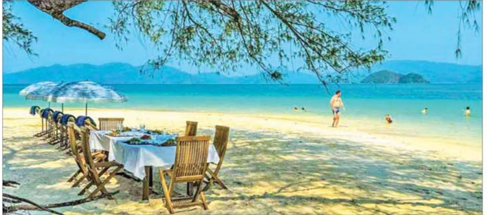
ဝါးအလယ်ကျွန်းသောင်ပြင်၌ နိုင်ငံခြားသားခရီးသွားများ အပန်းဖြေအနားယူရန် ပြင်ဆင်ထားစဉ်။

ဝါးအလယ်ကျွန်းအပန်းဖြေစခန်းမှ တစ်ရက်လျှင် ခရီးသွား ၄၀ ကျော် လက်ခံပြီး ပင်လယ်အစားအစာနှင့် သဘာဝသစ်သားအိမ်များဖြင့် ဝန်ဆောင်မှုပေးထားကာ စာမျက်နှာ ၁၀ သို့ *