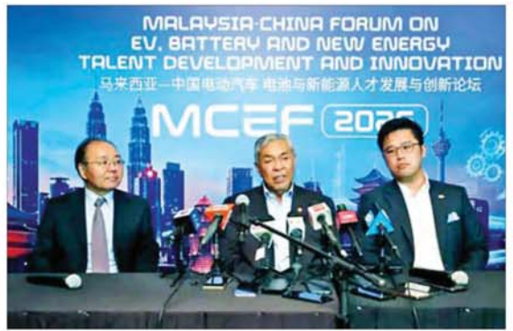
ကျွမ်းကျင်သူ အရေအတွက် ၁၀၀၀ ဖြစ်ကြောင်း သိရသည်။ မွေးထုတ်ရေးအတွက် ဆောင်ရွက်မည့် ကိုးကား-ဆင်ယူ၊ ဘာသာပြန် - စိုးသူရ

ပလက်ဖောင်းတစ်ခု ဖြစ်လာမည်ဖြစ် သည်။ အဆိုပါ ထိပ်သီးဆွေးနွေးပွဲအတွင်း လျှပ်စစ်ကားနှင့် အစိမ်းရောင်သယံဇာ တ်ဆောင်ရေးကဏ္ဍ ဖွံ့ဖြိုးရေးအတွက် အဆင့်နှစ်ဆင့်မြင့် ဆောင်ရွက်မည့်အစီ အမံတစ်ရပ်ကို တရုတ်နှင့်မလေးရှား ကုမ္ပဏီများက အဆိုပြုခဲ့သည်။ အစီအမံ ပထမအဆင့်တွင် မလေးရှား-တရုတ် အစိမ်းရောင် ရွေ့လျားမှု ပူးပေါင်းဆောင်ရွက်ရေး ဗဟိုဌာနကို တည်ထောင်မည်ဖြစ်ပြီး ဒုတိယအဆင့်တွင် မလေးရှားနိုင်ငံ အတွက် လာမည့်ငါးနှစ်အတွင်း လျှပ်စစ် ကား၊ ဘက်ထရီနှင့် စွမ်းအင်ဆိုင်ရာ