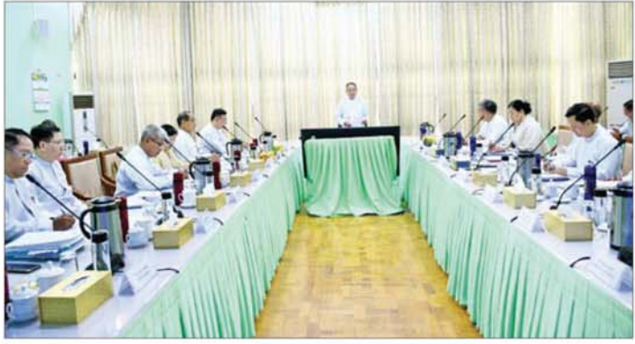
ကြောင်း မိမိတို့ဝန်ကြီးဌာနအနေဖြင့် အစိုးရ၏ ရက်(၁၀၀)အတွင်း ဆောင်ရွက်မည့် စီမံကိန်းများကို ဒေသန္တရစီမံကိန်း၊ ကဏ္ဍစီမံကိန်းများဖြင့် ချိတ်ဆက်

နေပြည်တော် ၁၉ ဇူလိုင် နိုင်ငံတော်သမ္မတ၏လမ်းညွှန်မှာကြားချက်များနှင့် အစိုးရ၏ ရက်(၁၀၀) အတွင်း ဦးစားပေးဆောင်ရွက်မည့် စီမံကိန်းများ အကောင်အထည်ဖော်နိုင်ရေး လုပ်ငန်းညှိနှိုင်းအစည်းအဝေးကို ယနေ့မနန်းလွှဲပိုင်းတွင် အမျိုးသားစီမံကိန်း၊ ရင်းနှီးမြှုပ်နှံမှုနှင့် နိုင်ငံခြားစီးပွားဆက်သွယ်ရေးဝန်ကြီးဌာန ရုံးအမှတ်(၃၂)၌ ကျင်းပသည်။ အဆိုပါ ရှင်းလင်းပွဲသို့ ပြည်ထောင်စုဝန်ကြီးဦးအောင်ကျော်ဟိန်၊ ဒုတိယဝန်ကြီးများဖြစ်ကြသည့် ဦးကျော်ထင်နှင့် ဦးသန်းစင်လှိုင်၊ အမြဲတမ်းအတွင်းဝန်နှင့် ဌာနဆိုင်ရာတာဝန်ရှိသူများ တက်ရောက်ကြသည်။ ဦးစွာပြည်ထောင်စုဝန်ကြီးက နိုင်ငံတော်သမ္မတ၏ လမ်းညွှန်မှာကြားချက်ဖြစ်သည့် တိုင်းပြည်တည်ငြိမ်အေးချမ်းဖွံ့ဖြိုးရေးနှင့် ဖွံ့ဖြိုးတိုးတက်မှုရရှိရေးကို အလေးထား၍ ဦးစားပေးဆောင်ရွက်သွားရန်ဖြစ်