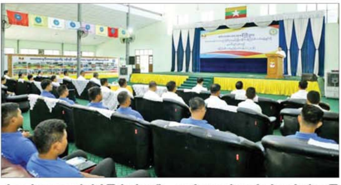
နှင့် ဖုဆယ်အားကစားကွင်းတို့ကို ကြည့်ရှုစစ်ဆေးပြီး အားကစားကွင်း/ အားကစားရုံအတွင်း ပြိုင်ပွဲများ စဉ်ဆက်မပြတ် ကျင်းပပြုလုပ်၍ မျိုးဆက်သစ်ဆက်စားသမားများ ပေါ်ထွက်လာစေရေးတို့အတွက် ဝိုင်းဝန်းပူးပေါင်းဆောင်ရွက်သွားကြရန် တာဝန်ရှိသူများကို မှာကြားသည်။ ထို့နောက် တောင်ဥက္ကလာပမြို့နယ် ပဒေသာအားကစားကွင်းရှိ ပဒေသာအားကစားခန်းမနှင့် ဘောလုံးကွင်းတို့ကို ကြည့်ရှုစစ်ဆေးပြီး လုပ်ငန်းဆိုင်ရာများ မှာကြားသည်။ ယင်းနောက် ရန်ကုန်တိုင်းဒေသကြီး အားကစားနှင့်ကာယပညာဦးစီးဌာနရုံးရှိ အစည်းအဝေးခန်းမ၌ အရာထမ်း/အမှုထမ်းများနှင့်တွေ့ဆုံ ပြည်ထောင်စုဝန်ကြီးက နိုင်ငံတော်သမ္မတ၏ ရက် ၁၀၀ အတွင်း ဆောင်ရွက်ရမည့်လုပ်ငန်းစဉ်များကို ထိထိရောက်

တိုင်းဒေသကြီးနှင့် ပြည်နယ်များတွင် အကျိုးရှိစွာ ပြန်လည်အသုံးပြုပြီး နိုင်ငံ့ဂုဏ်ဆောင်နိုင်သည့် မျိုးဆက်သစ်အားကစားသမားကောင်းများ မွေးထုတ်ပေးနိုင်ရေးအတွက် ဝိုင်းဝန်းပူးပေါင်းဆောင်ရွက်သွားကြရန်လိုကြောင်း တိုက်တွန်းပြောကြားသည်။ ထို့နောက် ပြည်ထောင်စုဝန်ကြီးနှင့်အဖွဲ့သည် စမ်းချောင်းမြို့နယ်ရှိ ပုဒုမ္မာအားကစားကွင်း၌ တိုင်းဒေသကြီးနှင့် ပြည်နယ် U-18 အမျိုးသားဘောလုံးရုံး/ ထွက်ပြိုင်ပွဲ ကျင်းပပြုလုပ်နိုင်ရေး ဘောလုံးကွင်းကောင်းမွန်စေရန်ပြင်ဆင်ထားရှိမှုများ၊ ဘောလုံးကွင်းအတွင်း အလံတိုင်း၊ ဂိုးတိုင်း၊ ဂိုးပိုက်များနှင့် ကွင်းပတ်လည်နံရံပြင်ဆင်ထားရှိမှုများကို ကြည့်ရှုစစ်ဆေးပြီး တာဝန်ရှိသူများကို လိုအပ်သည်များမှာကြားသည်။ ယင်းနောက် ဝန်ထမ်းများနှင့်တွေ့ဆုံပြီး ပြည်ထောင်စုဝန်ကြီးက နိုင်ငံတော်သမ္မတ၏လမ်းညွှန်မှာကြားချက်အတိုင်း ရက် ၁၀၀ အတွင်း ဆောင်ရွက်ရမည့်လုပ်ငန်းစဉ်များကို စနစ်တကျ လုပ်ကိုင်ဆောင်ရွက်သွားရန်နှင့် လုပ်ငန်းဆောင်ရွက်ရာတွင် အခက်အခဲများရှိပါက အချိန်နှင့်တစ်ပြေးညီ သတင်းပို့တင်ပြဆောင်ရွက်သွားရန် မှာကြားသည်။ ဆက်လက်၍ သန့်လျှင်ခိုင် သီဟာပီပ အားကစားကွင်းရှိ ဘောလုံးကွင်း၊ ပွဲကြည့်စင်၊ ရေလှော်ကန်၊ ရေကူးကန်၊ ပြိုင်ပွဲရုံ(က) သီဟာပီပအားကစားခန်းမ