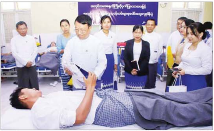
တာဝန်ရှိသူများထံသို့ အလှူငွေ ရာ ပြည်သူ့ဆေးရုံကြီး (ခုတင်- ပြန်လည်ပေးအပ်ခဲ့ကြောင်း သိရ ကျပ်သိန်း ၃၀ ကို အေးအပ်လှူဒါန်း ၁၀၀၀) မှ ဂုဏ်ပြုမှတ်တမ်းလွှာ သည်။ သတင်းစဉ်

သမားဝန်ကြီးဌာနရှိ ဦးစီးဌာန၊ အဖွဲ့ရုံးများမှ ဝန်ထမ်းများအနေဖြင့် စုပေါင်းသွေးလှူဒါန်းပွဲကျင်းပခြင်းဖြစ်သည်။ စုပေါင်း သွေးလှူဒါန်းပွဲတွင် အလုပ်သမားဝန်ကြီးဌာနမှ ဝန်ထမ်း ၇၂ ဦးက သွေးလှူဒါန်းကြပြီး ပြည်ထောင်စုဝန်ကြီး၊ ဒုတိယဝန်ကြီးနှင့် တာဝန်ရှိသူများသည် သွေးလှူရှင်ဝန်ထမ်းများအား ဆေးဝါးများနှင့် အာဟာရပစ္စည်းများပေးအပ်၍ ဝန်ထမ်းများ စုပေါင်းသွေးလှူဒါန်းနေမှုကို ကြည့်ရှုအားပေးသည်။ ထို့နောက် ပြည်ထောင်စုဝန်ကြီးက ပြည်သူ့ဆေးရုံကြီး (ခုတင်-၁၀၀၀) နေပြည်တော်မှ