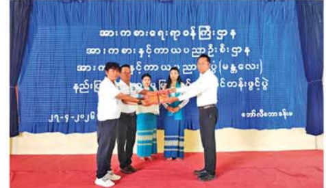
ကစားနှင့် ကာယပညာသိပ္ပံ နိုင်က အဖွင့်အမှာစကား ပြော (မန္တလေး)ကျောင်းအုပ်ကြီး ဦးမြင့် ကြားပြီး သင်တန်းသား၊ သင်

မန္တလေး ဧပြီ ၂၀ အားကစားရေးရာဝန်ကြီးဌာန၊ အားကစားနှင့်ကာယပညာဦးစီးဌာန၊ အားကစားနှင့် ကာယပညာသိပ္ပံ(မန္တလေး)ရှိ ဘော်လီဘော အားကစားခန်းမတွင် အားကစားနည်းပြရွေးချယ်ပေးဆောင်မှုဖြင့် တင်ရေးသင်တန်းဖွင့်ပွဲကို ဧပြီ ၂၇ ရက် နံနက် ၈နာရီခွဲက ကျင်းပခဲ့သည်။ သင်တန်းဖွင့်ပွဲတွင် အား