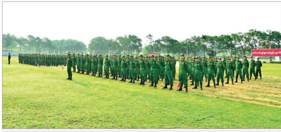
ပြည်သူ့စစ်မှုထမ်းသင်တန်း အမှတ်စဉ် (၂၄) သင်တန်းဖွင့်ပွဲ ကျင်းပစဉ်။

□ စာမျက်နှာ ၂၄ မှ အဆိုပါ သင်တန်းဖွင့်ပွဲများသို့ နေပြည်တော်ကောင်စီ ဥက္ကဋ္ဌ တိုင်းဒေသကြီးနှင့် ပြည်နယ်ဝန်ကြီးချုပ်များ၊ တိုင်းမှူးများနှင့် တာဝန်ရှိသူများ တက်ရောက်၍ ပြည်သူ့စစ်မှုထမ်း သင်တန်းအမှတ်စဉ် (၂၄) မှုသင်တန်းသားများအတွက် ဂုဏ်ပြုချီးမြှင့်ငွေ၊ စားသောက်ဖွယ်ရာများနှင့် အသုံးအဆောင်ပစ္စည်းများ ပေးအပ်ကြပြီး သင်တန်းသားများအား လိုက်လံနှုတ်ခက် အားပေးခဲ့ကြသည်။