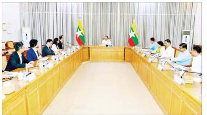
ညွှန်ကြားရေးမှူးချုပ်များ၊ တာဝန် ရှိသူများ၊ ထိုင်းသံရုံးနှင့် ထိုင်းနိုင်ငံ စီးပွားရေး လုပ်ငန်းရှင်များအသင်း ခဲ့ကြကြောင်း သိရသည်။ မှုကိုယ်စားလှယ်များတက်ရောက် သတင်းစဉ်

နေပြည်တော် ဧပြီ ၂၇ အမျိုးသားစီမံကိန်း၊ ရင်းနှီး မြှုပ်နှံမှုနှင့် နိုင်ငံခြားစီးပွား ဆက်သွယ်ရေး ဝန်ကြီးဌာန ပြည်ထောင်စုဝန်ကြီး ဦးအောင် ကျော်ဟိုးသည် ရန်ကုန်မြို့ အခြေစိုက် ထိုင်းနိုင်ငံသံရုံးမှ သံရုံး ယာယီတာဝန်ခံ Mr. Yordying Supasri ဦးဆောင်သော ကိုယ်စား လှယ်အဖွဲ့အား ယနေ့မွန်းလွဲပိုင်း တွင် အမျိုးသားစီမံကိန်း၊ ရင်းနှီး မြှုပ်နှံမှုနှင့် နိုင်ငံခြားစီးပွား ဆက်သွယ်ရေး ဝန်ကြီးဌာန ထိုင်းနိုင်ငံသား စီးပွားရေးလုပ်ငန်း ရှင်များ၏ ရင်းနှီးမြှုပ်နှံမှုလုပ်ငန်း များ တိုးတက်မြှင့်တင်ရေး၊ နှစ်နိုင်ငံကုန်သွယ်မှုများ မြန်ဆန် စေရေးဆိုင်ရာ ကိစ္စရပ်များကို ရင်းနှီးပွင့်လင်းစွာ အမြင်ချင်း ဖလှယ် ဆွေးနွေးကြသည်။ တွေ့ဆုံပွဲ၌ အမျိုးသားစီမံကိန်း၊ ဆောင်ရွက်မှုများ မြှင့်တင်ရေး၊ မြန်မာနိုင်ငံတွင် စီးပွားရေး လုပ်ငန်းများ ဆောင်ရွက်နေသော