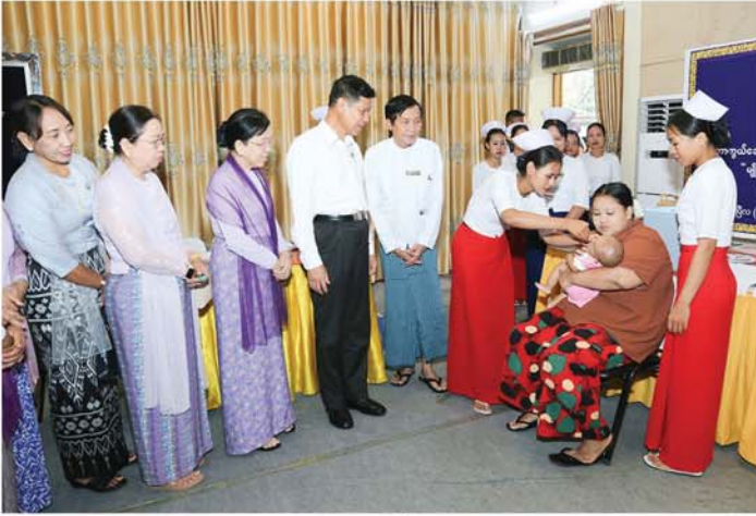
မန္တလေး၊ ဧပြီ ၂၇

မန္တလေးတိုင်းဒေသကြီး ကမ္ဘာ့ကာကွယ်ဆေးထိုးနှံတိုက်ကျွေးရေး ရက်သတ္တပတ် (၂၀၂၆)အထိမ်းအမှတ်အခမ်းအနားကို ယနေ့နံနက်ပိုင်းက ချမ်းအေးသာစံမြို့နယ်ရှိ မန္တလေးမြို့တော်စည်ပင်သာယာရေးကော်မတီရုံး မြို့တော်ခန်းမတွင် ကျင်းပသည်။