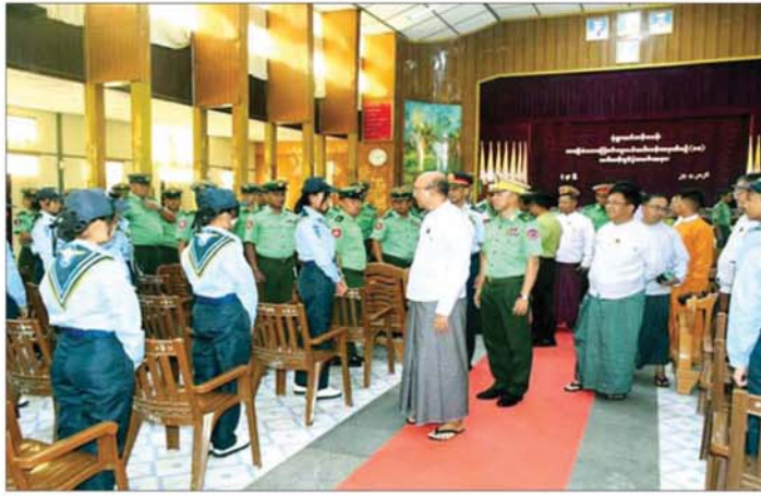
စစ်ကိုင်းတိုင်းဒေသကြီးဝန်ကြီးချုပ် ဦးကိုလေး မုံရွာမြို့တွင်ဖွင့်လှစ်သည့် အခြေခံလေကြောင်းလူငယ်သင်တန်းအမှတ်စဉ်(၁၀)မှ သင်တန်းသား သင်တန်းသူများအား လိုက်လံတွေ့ဆုံ နှုတ်ဆက်စဉ်။

အဆိုပါ ရေကြောင်းလူငယ်အခြေခံနှင့် တန်းမြင့် သင်တန်းအမှတ်စဉ် (၁/၂၀/၂၆) ကို ယနေ့မှ မေ ၂၉ ရက်အထိ ရက်သတ္တ ၅ ပတ်ကြာ သင်ကြားပို့ချပေးသွားမည်ဖြစ်ကြောင်း သိရသည်။ ယင်းသင်တန်းများကို ၁၉၅၉ ခုနှစ်မှစတင်၍ ဖွင့်လှစ်ခဲ့ခြင်းဖြစ်ပြီး ၂၀၂၄ ခုနှစ်အထိ ရေကြောင်းလူငယ်အခြေခံနှင့်