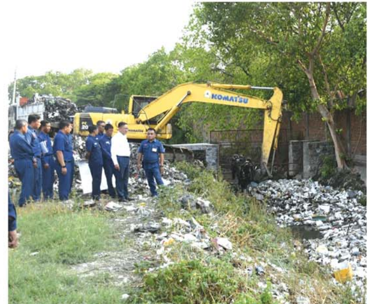
(ယာဝုံ) (မန္တလေးနေ့စဉ်)

ရေစီးရေလာကောင်းအောင် မြောင်း ဆယ်သန့်ရှင်းရေးလုပ်ငန်းများကို စဉ်ဆက်မပြတ်ဆောင်ရွက်သွား ရေး၊ မြောင်းဆယ်ယူရှင်းလင်းမှု များနှင့်အတူ စက်ယန္တရားများ၊ အမှိုက်သိမ်းယာဉ်များ လွယ်ကူစွာ ဝင်၊ ထွက်နိုင်ရေးအတွက် မြောင်း ဘေးဝဲယာ တစ်လျှောက်တွင် ကျူးကျော်အိမ်ရာဆောက်လုပ်မှု များမရှိအောင် ကွင်းဆင်းကြပ် မတ်ဆောင်ရွက်သွားရေးနှင့် မြောင်းဆယ်ယူရှင်းလင်းရေးလုပ် ငန်းများအတွက် စက်သုံးဆီများ လေလှင့်မှုမရှိစေဘဲ စနစ်တကျ သုံးစွဲသွားရန်တို့ကို မှာကြားခဲ့ ကြောင်း သိရသည်။