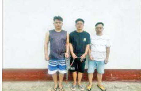
တာချီလိတ်မြို့၊ ဝိန်းကျောက်ရပ်ကွက် တော်ကော့(တွင်း)ရပ် လိုမာဟိုတယ်အနီးရှိ နေအိမ်၌ဖမ်းဆီးရမိခဲ့သည့် တရားမဝင် တရုတ် နိုင်ငံသား အမျိုးသား သုံးဦးကို တွေ့ရစဉ်။