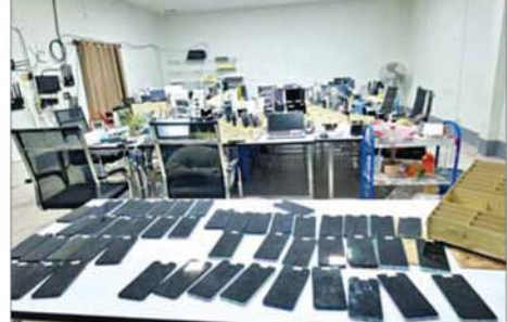
တာချီလိတ်မြို့၊ ဝိန်းကျောက်ရပ်ကွက် တော်ကော့(တွင်း)၌ တရားမဝင်အွန်လိုင်းလောင်းကစားမှုကျူးလွန်ရာတွင် အသုံးပြုသည့် လုပ်ငန်းသုံးပစ္စည်းများ သိမ်းဆည်းရမိမှုကို တွေ့ရစဉ်။