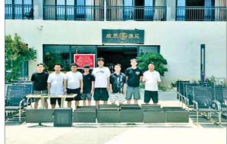
တာချီလိတ်မြို့၊ ဝိန်းကျောက်ရပ်ကွက် တော်ကော့(တွင်း)၌ ဖမ်းဆီးရမိသည့် တရုတ်နိုင်ငံသား အမျိုးသား ရှစ်ဦးကို တွေ့ရစဉ်။