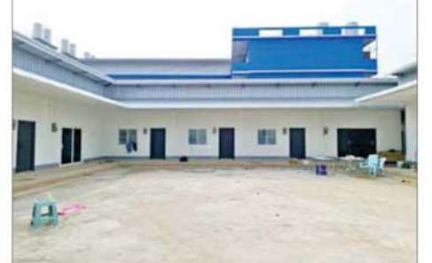
တာချီလိတ်မြို့၊ ဝိန်းကျောက်ရပ်ကွက် တော်ကော့(တွင်း)ရပ် လိုမာဟိုတယ်အနီးရှိ တရားမဝင် အွန်လိုင်းလောင်းကစားမှုကျူးလွန် ရာတွင် အသုံးပြုသည့် အဆောက်အအုံများ သိမ်းဆည်းရမိမှုကို တွေ့ရစဉ်။