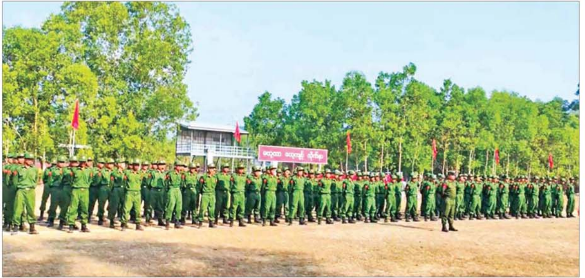
ပြည်သူ့စစ်မှုထမ်းသင်တန်းအမှတ်စဉ်(၂၄)သင်တန်းဖွင့်ပွဲ ကျင်းပစဉ်။

နေပြည်တော် ဧပြီ ၂၇ နိုင်ငံတော် ကာကွယ်ရေးနှင့် လုံခြုံရေးတာဝန် ထမ်းဆောင် နိုင်ရန်အတွက် ပြည်သူ့စစ်မှုထမ်း သင်တန်း အမှတ်စဉ်(၂၄)တွင် ပါဝင်တက်ရောက်ကြမည့် အရည် အချင်းကိုကိုင်ညွှန်သောကောင်း များသည် သက်ဆိုင်ရာတိုင်းစစ် ဌာနချုပ်နယ်မြေများရှိ သင်တန်း ကျောင်းအသီးသီးသို့ ရောက်ရှိ၍ လိုအပ်သည့် ကြိုတင်ပြင်ဆင်မှု များ ဆောင်ရွက်ခဲ့ကြသည်။ ယနေ့နံနက်ပိုင်းတွင် အဆိုပါ သင်တန်းကျောင်း အသီးသီး၌ ပြည်သူ့စစ်မှုထမ်း သင်တန်း အမှတ်စဉ်(၂၄) သင်တန်းဖွင့်ပွဲများ ကျင်းပကြသည်။ သင်တန်းဖွင့်ပွဲ များတွင် သင်တန်းကျောင်းများ အလိုက် ကျောင်းအုပ်ကြီးများ က သင်တန်းဖွင့်အမှာစကားများ ပြောကြားကြသည်။