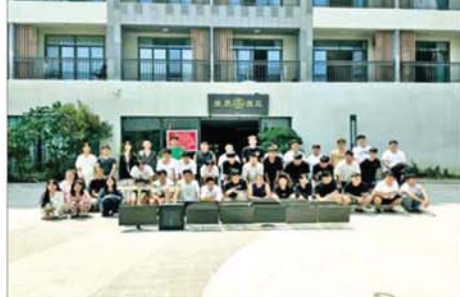
တာချီလိတ်မြို့၊ ဝိန်းကျောက်ရပ်ကွက် တော်ကော့(တွင်း)၌ တရားမဝင် အွန်လိုင်းလောင်းကစားလုပ်ကိုင်သူများအား အွန်လိုင်း လောင်းကစားပြုလုပ်ရာတွင် အသုံးပြုသည့် ပစ္စည်းများနှင့်အတူ ဖမ်းဆီးရမိစဉ်။