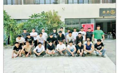
တာချီလိတ်မြို့၊ ဝိန်းကျောက်ရပ်ကွက် တော်ကော့(တွင်း)၌ တရားမဝင် အွန်လိုင်းလောင်းကစားလုပ်ကိုင်သူ မြန်မာနိုင်ငံသား အမျိုးသား ၂၇ ဦးကို ဖမ်းဆီးရမိစဉ်။