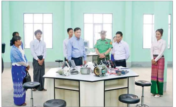
(တောင်ကြီး)သို့သွားရောက်၍ လက်တွေ့ခန်းများ အလက်တင်ပြချက်များအပေါ် လိုအပ်သည်များ ပြင်ဆင်ထားရှိမှုကို ကြည့်ရှုစစ်ဆေးပြီး ကျောင်းအစည်းမှာကြားဖြည့်ဆည်း ဆောင်ရွက်ပေးခဲ့ကြောင်း သိရအဝေးခန်းမတွင် ကျောင်းနှင့်စပ်လျဉ်းသည့် အချက်သည်။

ယင်းနောက် ပြည်ထောင်စုဝန်ကြီးနှင့်အဖွဲ့သည် ရမ်းပြည်နယ်ဝန်ကြီးချုပ် ဦးစိုင်းထိန်စိုး၊ ပြည်နယ်တာဝန်ရှိသူများနှင့်အတူ အစိုးရစက်မှုလက်မှုသိပ္ပံ