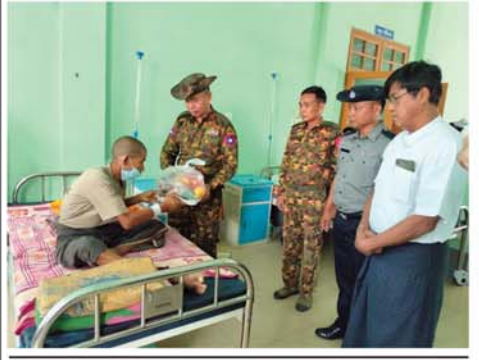
အသက်သည် သွေး၊ သွေးသည် အသက်။