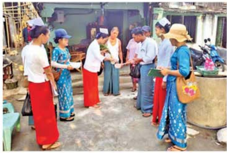
(ဝဲပုံ) စော်ထက်(သရက်)

အဆိုပါ လုပ်ငန်းများဆောင်ရွက်ရာတွင် မြို့နယ်ကျန်းမာရေးဦးစီးဌာနမှ ဝန်ထမ်းများက နေအိမ်များအတွင်းရှိ ရေတွင်း၊ ရေကန်များကို ပုံး၊ သွန်၊ လဲ၊ စစ် လုပ်ငန်းများဆောင်ရွက်ခြင်း၊ ပိုးလောက်လမ်းသေဆေး Abate ခတ်ခြင်း၊ ကျန်းမာရေးအသိပညာပေးခြင်းနှင့် လက်ကမ်းစာစောင်များ ဖြန့်ဝေခြင်း လုပ်ငန်းများဆောင်ရွက်ခဲ့ကြသည်။