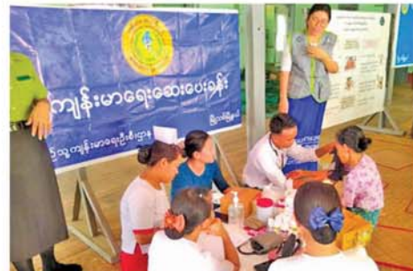
အောင်ဝင်းငြိမ်း(ကန့်ဘလူ) ရှိကြောင်း သိရသည်။

ထိုသို့ ရက် (၁၀၀) စီမံချက်ဖြင့် ရပ်ကွက်များအတွင်း ကွင်းဆင်းဆောင်ရွက်ခြင်းကို ဧပြီ ၄ ရက်မှစတင်ဆောင်ရွက်ခဲ့ပြီး ယနေ့အထိ အသက် ၁၀ နှစ်ပြည့်ပြီးသူ အမျိုးသား ၅၁၆ ဦး၊ အမျိုးသမီး ၅၆၆ ဦးနှင့် အသက် ၁၈ နှစ်ပြည့်ပြီးသူ အမျိုးသား တစ်ဦး၊ အမျိုးသမီး သုံးဦး စုစုပေါင်း ၁၀၈၆ ဦးကို နိုင်ငံသားစိစစ်ရေးကတ်များ ပြုလုပ်ပေးခဲ့ကြောင်းနှင့်ဆက်လက်၍ ကျန်ရပ်ကွက်များနှင့်ကျေးရွာများတွင်လည်း ကွင်းဆင်းဆောင်ရွက်ပေးသွားမည်ဖြစ်ကြောင်း မြို့နယ်လူဝင်မှုကြီးကြပ်ရေးနှင့်ပြည်သူ့အင်အားဦးစီးဌာန ဦးစီးအရာရှိ ဦးလေးဆွေထံမှ သိရသည်။