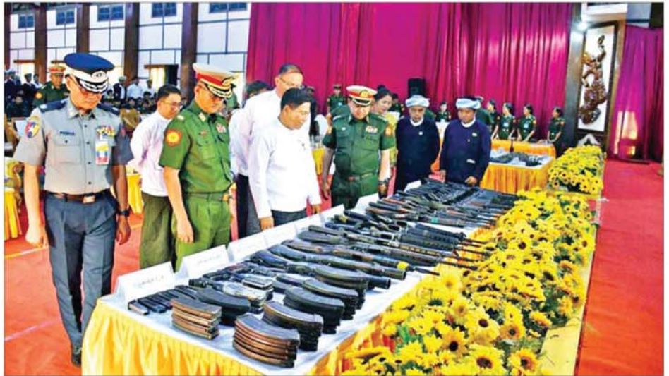
ရှမ်းပြည်နယ်ဝန်ကြီးချုပ် ဦးစိုင်းထိန်စိုး၊ အရှေ့ပိုင်းတိုင်းစစ်ဌာနချုပ် တိုင်းမှူး ဗိုလ်မှူးချုပ် ကျော်နိုင်ဦးနှင့် တာဝန်ရှိသူများက ဥပဒေဘောင်အတွင်း ပြန်လည်ဝင်ရောက်လာသူများ အပ်နှံထားသည့် လက်နက်ခဲယမ်းများကို ကြည့်ရှုစစ်ဆေးစဉ်။

ထိုသို့ဆောင်ရွက်ပေးမှုများကြောင့် PDF အမည်ခံအဖွဲ့ဝင်များသည် ဥပဒေဘောင်အတွင်းသို့ တစ်ဖွဲ့ပြီးတစ်ဖွဲ့ ပြန်လည်ဝင်ရောက်လျက်ရှိသည်။ ထို့အတူ တပ်မတော်စစ်ကြောင်းများက တိုင်းဒေသကြီး/ပြည်နယ်များရှိ လက်နက်ကိုင်အကြမ်းဖက်အဖွဲ့အစည်းများနှင့် PDF အမည်ခံပူးပေါင်းအဖွဲ့များ ယာယီစိုးမိုးထားသည့်နေရာများကို တစ်ခုပြီးတစ်ခု ပြန်လည်သိမ်းပိုက် ထိန်းချုပ်နိုင်ခဲ့ခြင်းကြောင့် ပြည်သူများအနေဖြင့် နယ်မြေတည်ငြိမ်အေးချမ်းရေးအတွက် သက်စွန့်ဆံ့ဖျား တာဝန်ထမ်းဆောင်နေကြသည့် တပ်မတော်သားများအား ဝမ်းသာအားရကြိုဆိုထောက်ခံလျက်ရှိကြပြီး စိတ်အေးထက်သန်စွာ အားပေးထောက်ခံမှု၊ ယုံကြည်အားကိုးမှု တပ်မတော်နှင့်အတူ ပူးပေါင်းပါဝင်ဆောင်ရွက်လာခဲ့မှုများကြောင့် အကြမ်းဖက်အဖွဲ့ဝင်များအနေဖြင့် စိတ်ဓာတ်ကျဆင်းကာ ဆက်လက်ခုခံလိုခြင်းမရှိတော့သည့်အတွက် လက်နက်ကိုင်လမ်းစဉ်ကို စွန့်လွှတ်၍ အမြင်မှန်ရရှိကာ အေးချမ်းစွာနေထိုင်လိုကြသည့် PDF အမည်ခံအဖွဲ့ဝင်များသည် စာမျက်နှာ ၁၀ သို့ *