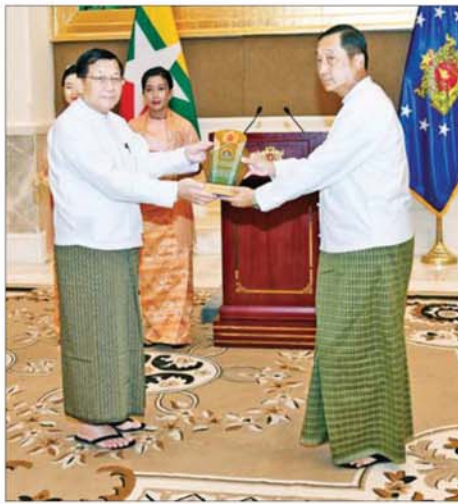
ရွေးကောက်တင်မြောက်ခြင်းခံရသော သမ္မတ နိုင်ငံတော်လုံခြုံရေးနှင့် အေးချမ်းသာယာရေးကော်မရှင်ဥက္ကဋ္ဌ ဗိုလ်ချုပ်မှူးကြီး မင်းအောင်လှိုင် ဒုတိယဗိုလ်ချုပ်ကြီးတေဇကော်(ငြိမ်း)အား ဂုဏ်ပြုအထိမ်းအမှတ်လက်ဆောင် ချီးမြှင့်ပေးအပ်စဉ်။

✽ စာမျက်နှာ ၃ မှ ၂၀၂၄ ခုနှစ် စက်တင်ဘာလ ၁၁ ရက်နေ့တွင် တောင်တရုတ်ပင်လယ်ဘက်က စခဲ့သည့် စူပါတိုင်းပွန်းမုန်တိုင်း ရာဂီကြောင့် နေပြည်တော်၊ ကရင်ပြည်နယ်၊ ကယားပြည်နယ်၊ ရှမ်းပြည်နယ်၊ မန္တလေးတိုင်းဒေသကြီး၊ မကွေးတိုင်းဒေသကြီးနှင့် မွန်ပြည်နယ်တို့တွင် နှစ်ပေါင်း ၇၀ အတွင်း အကြီးမားဆုံးသော မိုးရွာသွန်းမှုများ ဖြစ်ပေါ်ခဲ့ပြီး ရေကြီးရေလျှံမှုများ ဖြစ်ပေါ်ခဲ့ကြောင်း အဆိုပါ သဘာဝဘေး ကျရောက်စဉ် ကလည်း တပ်မတော်အနေဖြင့် နိုင်ငံတော်အစိုးရ ပြည်သူများနှင့် အတူ ကူညီကယ်ဆယ်ရေးနှင့် ပြန်လည်ထူထောင်ရေး လုပ်ငန်းများကို ပူးပေါင်းပါဝင်ဆောင်ရွက်ခဲ့ကြခြင်းဖြစ်ကြောင်း။ အလားတူ ၂၀၂၅ ခုနှစ် မတ်လ ၂၈ ရက်နေ့တွင် လုပ်ခတ်ခဲ့သည့် အလွန်အင်အားပြင်း မန္တလေး ငလျင်ကြီးကြောင့် နေပြည်တော်၊