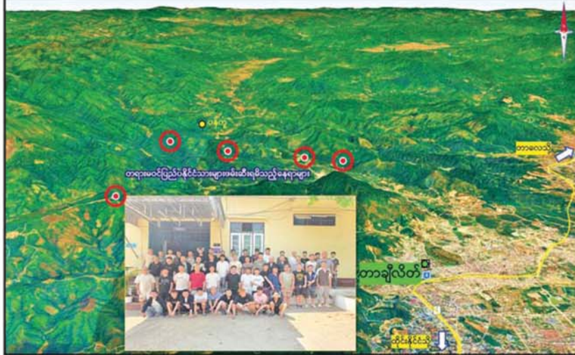
ရမ်းပြည်နယ်(အရှေ့ပိုင်း) တာချီလိတ်မြို့နယ် ပန်ကူကျေးရွာအနီး၌ အွန်လိုင်းလိမ်လည်လောင်းကစားမှုလုပ်ငန်းများ လုပ်ကိုင်ခဲ့သည့် တရားမဝင်ပြည်ပနိုင်ငံသားများအား ထပ်မံဖမ်းဆီးရမိသည့် နေရာပြပုံ။

နေပြည်တော် ဧပြီ ၈ နိုင်ငံတော်အစိုးရအနေဖြင့် နိုင်ငံတကာနှင့် တစ်ကမ္ဘာလုံးကို အန္တရာယ်ပေးနေသည့် အွန်လိုင်းလိမ်လည်လောင်းကစားမှုတိုက်ဖျက်ရေး လုပ်ငန်းစဉ်များကို အမျိုးသားရေးတာဝန်တစ်ရပ်အဖြစ်ခံယူကာ မြန်မာနိုင်ငံအတွင်း လုံးဝအခြေမပြုနိုင်ရေးအတွက် ပြည်တွင်းအင်အားစုများအပြင် အိမ်နီးချင်းနိုင်ငံအစိုးရများနှင့်လည်း ပေါင်းစပ်ညှိနှိုင်း၍ တက်ကြွစွာဆောင်ရွက်လျက်ရှိသည်။ ထိုသို့ဆောင်ရွက်လျက်ရှိရာ ရှမ်းပြည်နယ်(အရှေ့ပိုင်း) တာချီလိတ်မြို့နယ်အတွင်း၌ အွန်လိုင်းလိမ်လည်လောင်းကစားမှုလုပ်ငန်းများ လုပ်ဆောင်နေကြောင်း သတင်းအရ လုံခြုံရေးတပ်ဖွဲ့ဝင်များပါဝင်သော ပူးပေါင်းအဖွဲ့က သွားရောက်စစ်ဆေးရာ ဧပြီ ၇ ရက် မွန်းလွဲ ၁ နာရီခွဲခန့်တွင် တာချီလိတ်မြို့နယ် ပန်ကူကျေးရွာအနီး၌ အွန်လိုင်းလိမ်လည် လောင်းကစားမှုလုပ်ငန်းများ လုပ်ကိုင်နေသည့် တရားမဝင်ပြည်ပနိုင်ငံသားများအား ထပ်မံဖမ်းဆီးရမိခဲ့သည်။ ဆက်လက်၍ လုံခြုံရေးတပ်ဖွဲ့ဝင်များပါဝင်သော ပူးပေါင်းအဖွဲ့က ရှာဖွေစစ်ဆေးမှုများ ဆက်လက်ဆောင်ရွက်ရာ ယနေ့နံနက် ၇ နာရီ ခန့် ၄၀ ခန့်တွင် အဆိုပါ ပန်ကူကျေးရွာ၏ အရှေ့တောင်ဘက် မိတာ ၅၂၀၀ ခန့်အကွာသို့အရောက်၌ အွန်လိုင်းလိမ်လည်လောင်းကစားမှုလုပ်ငန်းများ ကျူးလွန်ရာတွင် ပါဝင်ခဲ့သည့် တရုတ်နိုင်ငံသား အမျိုးသား ၁၇ ဦး၊ အမျိုးသမီး ၃ ဦးနှင့် လာအိုနိုင်ငံသူ အမျိုးသမီး တစ်ဦး စုစုပေါင်း ၂၀ တို့ကို လည်းကောင်း၊ ပန်ကူကျေးရွာ၏ အနောက်တောင်ဘက် မိတာ ၂၇၀၀ ခန့်အကွာသို့အရောက်၌ အွန်လိုင်းလိမ်လည်လောင်းကစားမှုလုပ်ငန်းများ