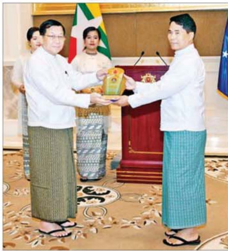
ရွေးကောက်တင်မြောက်ခြင်းခံရသော သမ္မတ နိုင်ငံတော်လုံခြုံရေးနှင့် အေးချမ်းသာယာရေးကော်မရှင်ဥက္ကဋ္ဌ ဗိုလ်ချုပ်မှူးကြီး မင်းအောင်လှိုင် ဒုတိယဗိုလ်ချုပ်ကြီးမင်းနောင်(ငြိမ်း)အား ဂုဏ်ပြုအထိမ်းအမှတ်လက်ဆောင် ချီးမြှင့်ပေးအပ်စဉ်။