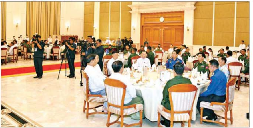
ရွေးကောက်တင်မြောက်ခြင်းခံရသော သမ္မတ နိုင်ငံတော်လုံခြုံရေးနှင့် အေးချမ်းသာယာရေးကော်မရှင်ဥက္ကဋ္ဌ ဗိုလ်ချုပ်မှူးကြီးမင်းအောင်လှိုင် တာဝန်ကျေပွန်စွာထမ်းဆောင်ခဲ့သည့် ပြည်ထောင်စုဝန်ကြီးနှင့် တပ်မတော်အရာရှိကြီးများ၊ မိုခိမုန်တိုင်းအပါအဝင် သဘာဝဘေးဒဏ် ပြန်လည်ထူထောင်ရေးလုပ်ငန်းများတွင် တာဝန်ကျေပွန်စွာထမ်းဆောင်ခဲ့ကြသည့် အရာရှိကြီးများအား ဂုဏ်ပြုအထိမ်းအမှတ်လက်ဆောင်များ ချီးမြှင့်ခြင်းအခမ်းအနားတွင် အမှာစကားပြောကြားစဉ်။