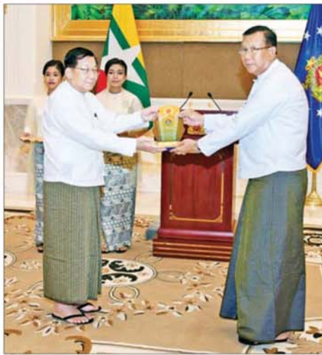
ရွေးကောက်တင်မြောက်ခြင်းခံရသော သမ္မတ နိုင်ငံတော်လုံခြုံရေးနှင့် အေးချမ်းသာယာရေးကော်မရှင်ဥက္ကဋ္ဌ ဗိုလ်ချုပ်မှူးကြီး မင်းအောင်လှိုင် ဒုတိယဗိုလ်ချုပ်ကြီးအေးဝင်း(ငြိမ်း)အား ဂုဏ်ပြုအထိမ်းအမှတ်လက်ဆောင် ချီးမြှင့်ပေးအပ်စဉ်။