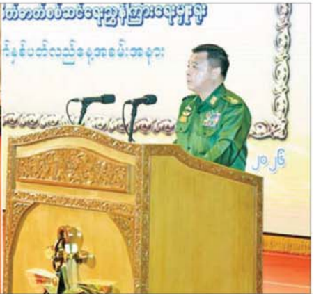
နိုင်ငံတော်လုံခြုံရေးနှင့် အေးချမ်းသာယာရေးကော်မရှင် အတွင်းရေးမှူး တပ်မတော်ကာကွယ်ရေးဦးစီးချုပ် ဗိုလ်ချုပ်ကြီး ရဲဝင်းဦး ကာကွယ်ရေးဦးစီးချုပ်ရုံး(ကြည်း) ပြည်သူ့ဆက်ဆံရေးနှင့် စိတ်ဓာတ်စစ်ဆင်ရေး ညွှန်ကြားရေးမှူးရုံး (၇၉)နှစ်မြောက် နှစ်ပတ်လည်နေ့အခမ်းအနားတွင် အမှာစကားပြောကြားစဉ်။

ဦးစွာ နိုင်ငံတော်လုံခြုံရေးနှင့် အေးချမ်းသာယာရေး ကော်မရှင် အတွင်းရေးမှူး တပ်မတော် ကာကွယ်ရေး ဦးစီးချုပ်နှင့် အဖွဲ့ဝင်များသည် အခမ်းအနား