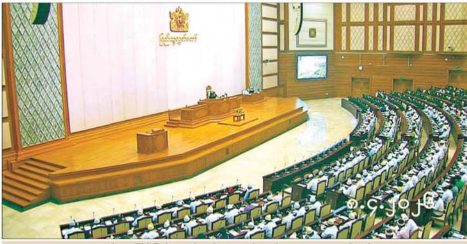
တတိယအကြိမ် ပြည်သူ့လွှတ်တော် ပထမပုံမှန်အစည်းအဝေး ပဉ္စမနေ့ ကျင်းပစဉ်။

ထိုသို့ ဆောင်ရွက်ရာတွင် ပြည်သူ့လွှတ်တော် ဥက္ကဋ္ဌက တတိယအကြိမ် ပြည်သူ့လွှတ်တော် ပထမပုံမှန် အစည်းအဝေးကို ၂၀၂၆ ခုနှစ် မတ် ၁၆ ရက်မှ စတင်ပြီး ယနေ့ပဉ္စမနေ့အထိ ကျင်းပခဲ့ပါကြောင်း၊ ရွေးကောက်ခံ ပြည်သူ့လွှတ်တော် ကိုယ်စားလှယ်များ အစုအဖွဲ့ အစည်းအဝေးကိုလည်း ၂၀၂၆ ခုနှစ် မတ် ၃၀ ရက်နှင့် ၃၁ ရက်များတွင် ကျင်းပခဲ့ပါကြောင်း၊ တတိယအကြိမ် ပြည်သူ့လွှတ်တော် ပထမပုံမှန်အစည်းအဝေးကာလအတွင်း ဆောင်ရွက်ချက်များအနေဖြင့် လွှတ်တော်အစည်းအဝေး ပထမနေ့တွင် သဘာပတိ တင်မြောက်ခြင်း၊ ပြည်သူ့လွှတ်တော် ဥက္ကဋ္ဌနှင့် ဒုတိယဥက္ကဋ္ဌ ရွေးချယ်တင်မြောက်ခြင်းတို့ကို ဆောင်ရွက်ခဲ့ပါကြောင်း၊ လွှတ်တော်အစည်းအဝေးဒုတိယနေ့၊ တတိယနေ့နှင့် စတုတ္ထနေ့များတွင် ဖွဲ့စည်းပုံအခြေခံဥပဒေ၊ ၂၀၁၂ ခုနှစ် ပြည်သူ့လွှတ်တော်ဆိုင်ရာဥပဒေနှင့် ၂၀၁၃ ခုနှစ် ပြည်သူ့လွှတ်တော်ဆိုင်ရာ ဥပဒေကြမ်းဥပဒေများနှင့်အညီ ဥပဒေကြမ်းကော်မတီ၊ လွှတ်တော်အခွင့်အရေးကော်မတီနှင့် အစိုးရ၏ အာမခံချက်များ၊ ကတိများနှင့် တာဝန်ခံချက်များ စိစစ်ရေးကော်မတီတို့က ဖွဲ့စည်းနိုင်ခဲ့ပြီး