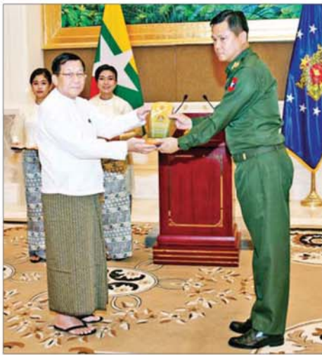
ရွေးကောက်တင်မြောက်ခြင်းခံရသော သမ္မတ နိုင်ငံတော်လုံခြုံရေးနှင့် အေးချမ်းသာယာရေးကော်မရှင်ဥက္ကဋ္ဌ ဗိုလ်ချုပ်မှူးကြီး မင်းအောင်လှိုင် ကာကွယ်ရေးပစ္စည်းထုတ်လုပ်ရေးအရာရှိချုပ် ဒုတိယဗိုလ်ချုပ်ကြီးစိုးမြင့်ဆွေအား ဂုဏ်ပြုအထိမ်းအမှတ်လက်ဆောင် ချီးမြှင့်ပေးအပ်စဉ်။