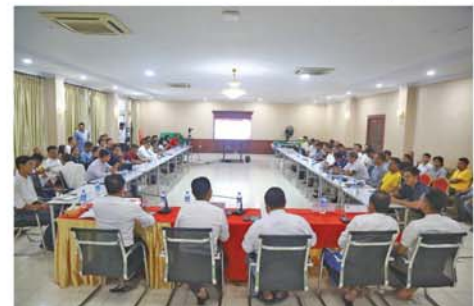
စာမျက်နှာ ၇ သို့ ☆

သွားမည့် အစီအစဉ်များ၊ တန်းဆင်း၊ တန်းတက်ကိစ္စရပ်များ၊ ဒဂုံပေါ်အက်ဖ်စီ(လိင်-၁)နှင့် ကချင်ယူနိုက်တက်(လိင်-၂)အသင်းတို့ နုတ်ထွက်ခွင့်တင်ပြလာသည့် အခြေအနေများ၊ League Cup ပြိုင်ပွဲအစား နိုင်ငံတကာပြိုင်ပွဲများ၏ ပြကွဒိန်နှင့်အညီ ရှုံး၊ ထွက်ပြိုင်ပွဲ