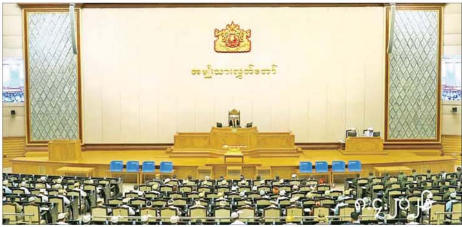
တတိယအကြိမ် အမျိုးသားလွှတ်တော် ပထမပုံမှန်အစည်းအဝေး စတင်နေ့ကျင်းပစဉ်။

နေပြည်တော် ဧပြီ ၈ တတိယအကြိမ် အမျိုးသားလွှတ်တော် ပထမပုံမှန်အစည်းအဝေးစတင်နေ့ကို ယနေ့နံနက် ၁၀ နာရီတွင် နေပြည်တော်ရှိ လွှတ်တော် အဆောက်အအုံ အမျိုးသားလွှတ်တော် အစည်းအဝေးခန်းမ၌ ကျင်းပသည်။ အစည်းအဝေးတွင် အမျိုးသားလွှတ်တော်ဥက္ကဋ္ဌ ဦးအောင်လင်းဒွေးက တတိယအကြိမ် အမျိုးသားလွှတ်တော် ပထမပုံမှန်အစည်းအဝေး စတင်နေ့သို့ တက်ရောက်ခွင့်ရှိသည့် အမျိုးသားလွှတ်တော် ကိုယ်စားလှယ် ဦးရေ စုစုပေါင်း ၂၁၂ ဦးရှိသည့် အနက် ယနေ့အစည်းအဝေးသို့ ၂၁၁ ဦး တက်ရောက်သဖြင့် ထက်ဝက်ကျော်သည့် အတွက် အစည်းအဝေး အထမြောက်ကြောင်းနှင့် စတင်ကျင်းပကြောင်း ကြေညာကာ အစည်းအဝေး တက်ရောက်မှု အခြေအနေကို လွှတ်တော်၏ အတည်ပြုချက် ရယူ၍ မှတ်တမ်းတင်သည်။ ထို့နောက်အမျိုးသားလွှတ်တော် ဥက္ကဋ္ဌက တရုတ်ပြည်သူ့သမ္မတနိုင်ငံ တရုတ်အမျိုးသား ပြည်သူ့