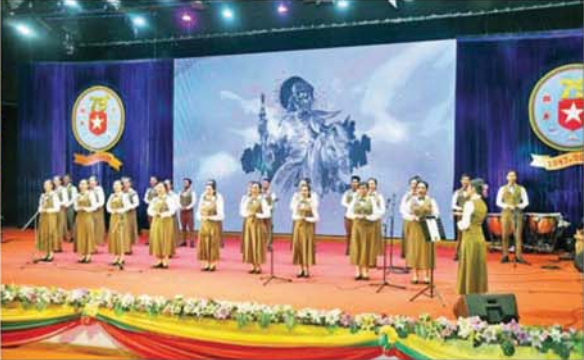
နိုင်ငံတော်လုံခြုံရေးနှင့် အေးချမ်းသာယာရေးကော်မရှင်အတွင်းရေးမှူး တပ်မတော်ကာကွယ်ရေးဦးစီးချုပ် ဗိုလ်ချုပ်ကြီး ရဲဝင်းဦးနှင့်အဖွဲ့ဝင်များ ကာကွယ်ရေးဦးစီးချုပ်ရုံး(ကြည်း) ပြည်သူ့ဆက်ဆံရေးနှင့် စိတ်ဓာတ်စစ်ဆင်ရေး ညွှန်ကြားရေးမှူးရုံး (၇၉)နှစ်မြောက် နှစ်ပတ်လည်နေ့အထိမ်းအမှတ် ဂုဏ်ပြုဖျော်ဖြေတင်ဆက်မှုများကို ကြည့်ရှုအားပေးစဉ်။

အဆင့်မြှင့်တင်နိုင်ခဲ့ပြီး နိုင်ငံတော်၏ ပညာရည်မြှင့်တင်ရေးကို အားဖြည့် ကူညီဆောင်ရွက်ပေး နိုင်ခဲ့သည်ကိုလည်း တွေ့မြင်ရမည်ဖြစ်ကြောင်း။ တပ်မတော်သည် နိုင်ငံတော် တည်ရှိနေသရွေ့ တည်ရှိနေရမည့် အခိုင်မာဆုံးသော အဖွဲ့အစည်း တစ်ခုဖြစ်ကြောင်း၊ ပြည်သူ့လူထု တစ်ရပ်လုံးနှင့်အတူ လက်တွဲပြီး နိုင်ငံတော်ကာကွယ်ရေး တာဝန်များကို ထမ်းဆောင်သွားရမည့် တပ်မတော် တစ်ရပ်အနေဖြင့် အသိပညာ၊ အတတ်ပညာများနှင့် ပြည့်စုံသည့် တပ်မတော်သား အရင်းအမြစ်ကောင်းများ စဉ်ဆက်မပြတ်ထွန်းကားရေးသည် အရေးကြီးဆုံးအချက်ပင် ဖြစ်ကြောင်း။ ထို့ကြောင့် လာမည့် ၂၀၂၆-၂၀၂၇ ပညာသင်နှစ်မှ စတင်၍ ပညာရေးနှင့် ပတ်သက်သည့် ကဏ္ဍသစ်တစ်ခုကို စတင် အကောင်အထည်ဖော်ဆောင်ရွက် သွားမည်ဖြစ်ကြောင်း၊ အဆိုပါ ပညာရေးကဏ္ဍသစ်မှာ တပ်မတော် တွင် စစ်မှုထမ်းဆောင်ဆဲ တပ်မတော်သား အရာရှိ၊ စစ်သည်များ၏ သား၊ သမီးများ၊ တပ်မတော် သား အငြိမ်းစား အရာရှိ၊ စစ်သည်များ၏ သား၊ သမီးများနှင့် ကျဆုံး သွားကြသော တပ်မတော်သား အရာရှိ၊ စစ်သည်များ၏ သား၊ သမီးများ၏ မပြတ် တာဝန်ယူစောင့်ရှောက် နိုင်ရန် တပ်မတော်လူငယ်ပညာရေး သင်တန်းကျောင်းများကို ရန်ကုန်