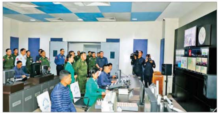
နိုင်ငံတော်လုံခြုံရေးနှင့် အေးချမ်းသာယာရေးကော်မရှင်အတွင်းရေးမှူး တပ်မတော်ကာကွယ်ရေးဦးစီးချုပ် ဗိုလ်ချုပ်ကြီး ရဲဝင်းဦး မြဝတီရုပ်မြင်သံကြား (နေပြည်တော်) ထုတ်လွှင့်ရေးစက်ရုံအတွင်း ကြည့်ရှုစစ်ဆေးစဉ်။

ကြိုးပမ်းဆောင်ရွက်သွားမည်ဖြစ်ကြောင်း၊ ထို့အတူလက်ရှိနိုင်ငံတော်အစိုးရသစ် လက်ထက်တွင်လည်း ပြည်သူ့ဆက်ဆံရေးနှင့် စိတ်ဓာတ်စစ်ဆင်ရေး တပ်ဖွဲ့များ၏ စွမ်းပကားနှင့် နိုင်ငံအရေးအတွက် ဆက်လက်အားပြည့် ကူညီကြိုးပမ်း ဆောင်ရွက်ပေးသွားကြရန်လည်း အလေးအနက်ထား မှာကြားလိုကြောင်း၊ ထို့ကြောင့် ပြည်သူ့ဆက်ဆံရေးနှင့်စိတ်ဓာတ်စစ်ဆင်ရေး ညွှန်ကြားရေးမှူးရုံး ကွပ်ကဲမှုအောက် တပ်ဖွဲ့ဝင်များအနေဖြင့် မိမိတပ်ဖွဲ့၏ လေးမြတ်သည့် ဂုဏ်ဒြပ်ကို ဆက်လက်ထိန်းသိမ်းစောင့်ရှောက်