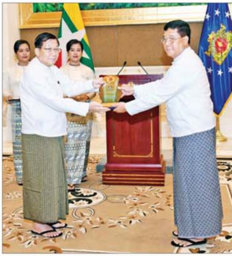
ရွေးကောက်တင်မြောက်ခြင်းခံရသော သမ္မတ နိုင်ငံတော်လုံခြုံရေးနှင့် အေးချမ်းသာယာရေးကော်မရှင်ဥက္ကဋ္ဌ ဗိုလ်ချုပ်မှူးကြီး မင်းအောင်လှိုင် ဒုတိယဗိုလ်ချုပ်ကြီးကန်မြင့်သန်း(ငြိမ်း)အား ဂုဏ်ပြုအထိမ်းအမှတ်လက်ဆောင် ချီးမြှင့်ပေးအပ်စဉ်။