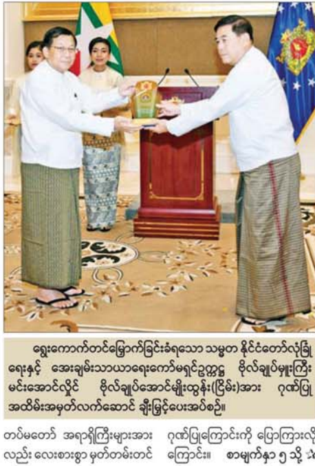
ရွေးကောက်တင်မြောက်ခြင်းခံရသော သမ္မတ နိုင်ငံတော်လုံခြုံရေးနှင့် အေးချမ်းသာယာရေးကော်မရှင်ဥက္ကဋ္ဌ ဗိုလ်ချုပ်မှူးကြီး မင်းအောင်လှိုင် ဗိုလ်ချုပ်အောင်မျိုးထွန်း(ငြိမ်း)အား ဂုဏ်ပြုအထိမ်းအမှတ်လက်ဆောင် ချီးမြှင့်ပေးအပ်စဉ်။

မန္တလေး၊ စစ်ကိုင်းတို့၌ ထိခိုက်ပျက်စီးမှုများပြီး အခြားဒေသများတွင်လည်း ထိခိုက်ပျက်စီးမှုများရှိခဲ့ကြောင်း၊ ငလျင်ဒဏ်ကြောင့် ထိခိုက်ပျက်စီးမှုများကို ကယ်ဆယ် ရှင်းလင်းရေးနှင့် ပြန်လည်ထူထောင်ရေး လုပ်ငန်းများ၌ တပ်မတော်သားများ ပူးပေါင်းပါဝင်ခဲ့ကြခြင်း ဖြစ်ကြောင်း၊ ထိုကဲ့သို့ မိုခါမုန်တိုင်းအပါအဝင် နိုင်ငံတော်တွင် ကျရောက်ခဲ့သည့် သဘာဝဘေးအန္တရာယ်များ၏ ပြန်လည်ထူထောင်ရေး လုပ်ငန်းများတွင် တပ်မတော်မှ ထိထိရောက်ရောက် မြန်မြန်ဆန်ဆန် ပူးပေါင်းပါဝင်နိုင်ရေး စီစဉ်ဆောင်ရွက်ပေးခဲ့ကြသည့် တပ်မတော်မှ အဆင့်မြင့်အရာရှိကြီးများနှင့် အရာရှိများ၊ တပ်မတော်သားများအားလုံးကိုလည်း ကျေးဇူးတင်ဂုဏ်ပြုသည်ကို ပြောကြားလိုပါကြောင်း။ အလားတူ မိမိတို့တာဝန်ယူခဲ့သည့် (၅)နှစ်တာကာလအတွင်း၌ စက်မှုလုပ်ငန်းများ ဖွံ့ဖြိုးတိုးတက်ရေးနှင့် နိုင်ငံတော်၏ စီးပွားရေးအခြေခံဖြစ်သည့် အသေးစား၊ အငယ်စား၊ အလတ်စား စီးပွားရေးလုပ်ငန်းများတိုးတက်အောင်မြင်အောင် စက်မှုဝန်ကြီးဌာန၊ ပြည်ထောင်စုဝန်ကြီး အနေဖြင့် ကြိုးစား လုပ်ဆောင်ခဲ့သည်ကိုလည်း မှတ်တမ်းတင်ဂုဏ်ပြုလိုကြောင်း။ ယခုကဲ့သို့ နိုင်ငံတော်အတွက် အရေးကြီးလာတိုင်း၌ တပ်မတော်အနေဖြင့် နိုင်ငံတော်အစိုးရ ပြည်သူတို့နှင့် တစ်သားတည်း ပူးပေါင်းပါဝင်ဆောင်ရွက်မှုများအား အထူးကျေးဇူးတင်ကြောင်းကို ထပ်မံပြောကြားလိုကြောင်း၊ ထိုကဲ့သို့ ဆောင်ရွက်နိုင်အောင် ကြိုးကြပ်ကွပ်ကဲစီမံပေးခဲ့ကြသည့် တပ်မတော် အရာရှိကြီးများအား ဂုဏ်ပြုကြောင်းကို ပြောကြားလိုလည်း လေးစားစွာ မှတ်တမ်းတင်ကြောင်း။ စာမျက်နှာ ၅ သို့ ✽