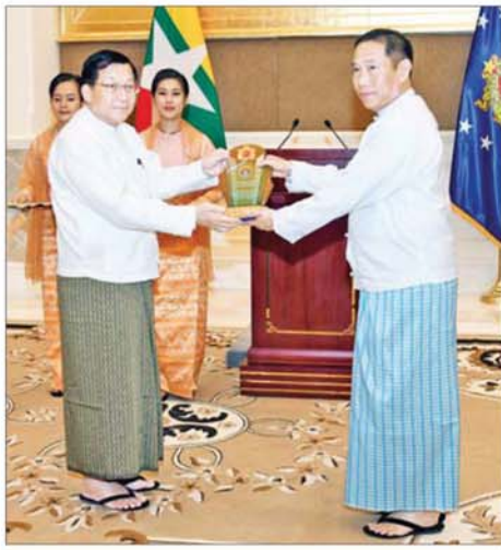
ရွေးကောက်တင်မြောက်ခြင်းခံရသော သမ္မတ နိုင်ငံတော်လုံခြုံရေးနှင့် အေးချမ်းသာယာရေးကော်မရှင်ဥက္ကဋ္ဌ ဗိုလ်ချုပ်မှူးကြီး မင်းအောင်လှိုင် ဒုတိယဗိုလ်ချုပ်ကြီးသက်ပုံ(ငြိမ်း)အား ဂုဏ်ပြုအထိမ်းအမှတ်လက်ဆောင် ချီးမြှင့်ပေးအပ်စဉ်။