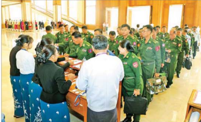
တတိယအကြိမ် အမျိုးသားလွှတ်တော် ပထမပုံမှန်အစည်းအဝေး စတင်နေ့သို့ တက်ရောက်လာသော အမျိုးသားလွှတ်တော်ကိုယ်စားလှယ်များကို တွေ့ရစဉ်။