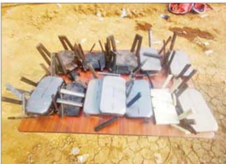
Wireless Router ၁၃ လုံးကို တွေ့ရစဉ်။