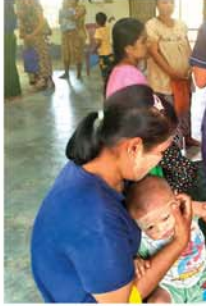
စော်ထက်(သရက်)