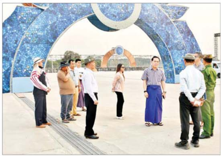
ပြည်သူ့လွှတ်တော် ဒုတိယဥက္ကဋ္ဌ ဦးမောင်မောင်အုန်း နေပြည်တော်ရင်ပြင်၌ လမ်းလျှောက်သင်္ကြန် ကျင်းပနိုင်ရေး ကြိုတင်ပြင်ဆင်မှုများ ကြည့်ရှုစစ်ဆေးစဉ်။

နေပြည်တော် ဧပြီ ၄ ယခုနှစ် ကျင်းပမည့် မဟာသင်္ကြန်ပွဲတော်သည် သာမန်ပျော်ရွှင်ပွဲတစ်ခုထက်ပို၍ နိုင်ငံတော်အစိုးရ လွှတ်တော်ကိုယ်စားလှယ်များ၊ ဝန်ထမ်းများ၊ ပြည်သူ များအားလုံးပူးပေါင်းပြီး စိတ်သစ်၊ လူသစ်၊ နိုင်ငံရေး အခင်းအကျင်းသစ်များဖြင့် အတူတကွပျော်ရွှင်စွာ ဆင်နွှဲနိုင်ရန် အနှစ်သာရရှိသည့် မြန်မာ့ရိုးရာပွဲတော် တစ်ခုဖြစ်စေရန် ရည်ရွယ်ကျင်းပသွားမည်ဖြစ်ရာ ပြည်သူ့လွှတ်တော် ဒုတိယဥက္ကဋ္ဌဦးမောင်မောင်အုန်း သည် တာဝန်ရှိသူများနှင့်အတူ ယနေ့တွင် နေပြည်တော်ရင်ပြင်၌ လမ်းလျှောက်သင်္ကြန်ကျင်းပ နိုင်ရေး ကြိုတင်ပြင်ဆင်မှုများကို သွားရောက်ကြည့်ရှု စစ်ဆေးသည်။