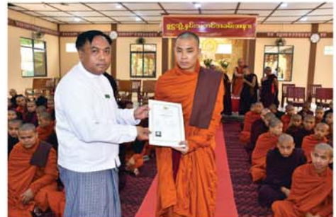
တန်းအောင် ၆၆ ပါး၊ အခြေပြုမူလတန်းအောင် ၁၁၂ ပါး၊ စုစုပေါင်း စာအောင် ရဟန်း၊ သီလရှင် ၂၁၉ ပါးအား စာအောင်လက်မှတ်နှင့်တကွ လှူဖွယ်ဝတ္ထုပစ္စည်းများကို မြို့နယ်စီမံခန့်ခွဲရေးနှင့် အုပ်ချုပ်ရေးကော်မတီဥက္ကဋ္ဌနှင့် တာဝန်ရှိသူများက အသီးသီးဆက်ကပ်လှူဒါန်းကြပြီး နေ့ဆွမ်းဆက်ကပ်ခဲ့ကြောင်း သိရသည်။ (အပေါ်ပုံ) ၀-၀-၀-၀-၀