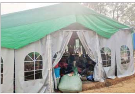
အလုပ်ရုံကို တွေ့ရစဉ်။