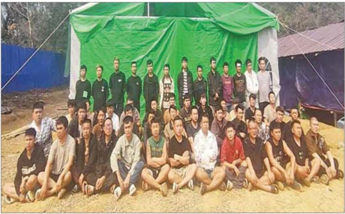
တရုတ်နိုင်ငံသားများအား တွေ့ရစဉ်။

လုပ်ကိုင်သူများ ဝင်ရောက် အခြေပြုနေထိုင်ခြင်း မရှိစေရန် အတွက် ယနေ့နံနက်ပိုင်းတွင် ရှမ်းပြည်နယ် (မြောက်ပိုင်း) တန့်ယန်းမြို့နယ်အတွင်း လိုအပ် သည့် စုံစမ်းစစ်ဆေးခြင်းနှင့် ရှာဖွေ ဖော်ထုတ်ခြင်းများကို လုပ်ဆောင်စဉ် အဆိုပါမြို့၏ အရှေ့မြောက်ဘက် မီတာ ၂၅၀၀ ခန့်အကွာ ကောင်းဆန်းကျေးရွာ အနီး၌ အွန်လိုင်းလိမ်လည် လောင်းကစား လုပ်ကိုင်သူများ နေထိုင် အသုံးပြုလျက်ရှိသည့် အိမ်ဆောင် သုံးလုံး၊ အလုပ်ရုံ နှစ်လုံး၊ စားသောက်ခန်း တစ်လုံး၊ မီးဖိုဆောင် နှစ်လုံးနှင့် ဆောက်လုပ် ဆဲ အဆောက်အအုံ ၁၅ လုံးတို့ကို ရှာဖွေဖော်ထုတ် တွေ့ရှိခဲ့ပြီး ၎င်းအဆောက်အအုံများအတွင်းမှ အွန်လိုင်းလိမ်လည်လောင်းကစား မှုများ လုပ်ကိုင်လျက်ရှိသည့် တရုတ်နိုင်ငံသား အမျိုးသား ၁၀၀၊ အမျိုးသမီး တစ်ဦး၊ မြန်မာနိုင်ငံသား အမျိုးသား ၁၂ ဦး၊ အမျိုးသမီး