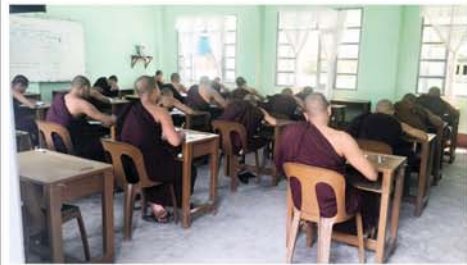
မြို့နယ်ရှိ အမှတ်(၁၄)အခြေစိုက်ပညာ အထက်တန်းကျောင်း၌

ပါဠိပထမပြန်စာမေးပွဲကို ယနေ့မွန်းလွဲပိုင်းက ကျင်းပခဲ့ရာ စာဖြေသံဃာတော်၊ သီလရှင်စုစုပေါင်း ၇၃ ရာခိုင်နှုန်း ဖြေဆိုခဲ့သည်။ (ဝဲပုံ) ၂၀၂၆ ခုနှစ် ပါဠိပထမပြန်စာမေးပွဲတွင် စာရင်းရှိ သံဃာ၊ သီလရှင်စုစုပေါင်း ၆၇ ပါးဖြေဆို ၄၉ ပါး၊ ပျက်ကွက် ၁၈ ပါးရှိရာ သံဃာတော်၊ သီလရှင် စုစုပေါင်း ၇၃ ရာခိုင်နှုန်း