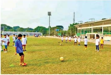
ပျဉ်းမနား ဧပြီ ၄ အတွင်းရှိ ကျောင်းသား၊ ကျောင်းပြည်ထောင်စုနေသဖြင့် သူ၊ လူငယ်များအတွက် ရွှေရာသီနေပြည်တော်၊ ပျဉ်းမနားမြို့နယ် ကျောင်းပိတ်ရက်ကာလအတွင်း

မိမိဝါသနာပါသည့် အားကစား နည်းများကို စနစ်တကျ လေ့လာ သင်ယူနိုင်ရေးအတွက် မြို့နယ် အားကစားနှင့် ကာယပညာဦးစီးဌာနအနေဖြင့် ၂၀၂၆ ခုနှစ်၊ ရွှေရာသီ အခြေခံအားကစားသင်တန်းများကို ပေါင်းလောင်းအားကစား ကွင်းနှင့် သတ်မှတ်ထားသည့် အခြေခံပညာကျောင်းများတွင် အခမဲ့ဖွင့်လှစ်သင်ကြားပေးလျက်ရှိ သည်။ သား၊ ကျောင်းသူ၊ လူငယ်များ အတွက် ဘောလုံး၊ ဘောလုံး၊ ဘတ်စကက်ဘော၊ တိုက်ကွမ်ဒို၊ မြန်မာ့သိုင်း၊ အေရိုဗစ် စသည့် အားကစားနည်းများကို အခြေခံ သင်ကြားပေးခြင်းဖြစ်ကြောင်း၊ အဆိုပါ သင်တန်းများကို မတ် ၂၅ ရက်မှ ဧပြီ ၇ ရက်အထိ အခမဲ့ ဖွင့်လှစ်သင်ကြားပေးလျက် ရှိကြောင်း သိရသည်။ (ဝဲပုံ) မြို့နယ်အားကစားနှင့်ကာယ ပညာဦးစီးဌာနအနေဖြင့် ကျောင်း မြို့နယ်(ပြန်/ဆက်) ၀-၀-၀-၀-၀-၀-၀-၀