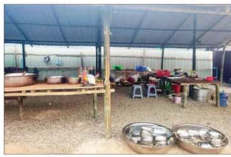
မီးဖိုဆောင်ကို တွေ့ရစဉ်။