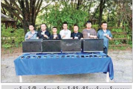
တန့်ယန်းမြို့နယ်အတွင်း အွန်လိုင်းလိမ်လည်လောင်းကစားမှု ကျူးလွန်သူများကို တွေ့ရစဉ်။