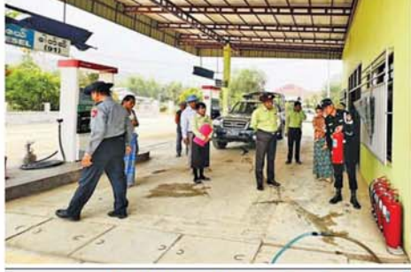
လျှပ်စစ်သုံးလျှင် သတိယှဉ် ဝန်အားမမျှ မသုံးရ။