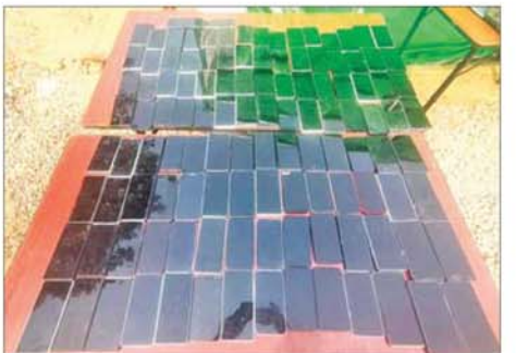
ဖုန်းမျိုးစုံ ၁၁၈ လုံးကို တွေ့ရစဉ်။