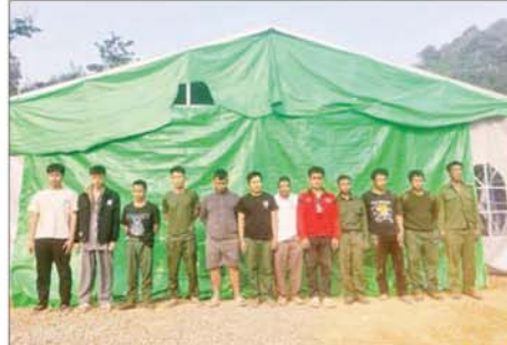
မြန်မာနိုင်ငံသား အမျိုးသားများကို တွေ့ရစဉ်။

လျက်ရှိသည့် ဖမ်းဆီးရမိသူများ အား လိုအပ်သည့်စစ်ဆေးမှုများ ဆောင်ရွက်ပြီးစီးပါက တည်ဆဲ ဥပဒေများနှင့်အညီ ထိရောက် ပြင်းထန်စွာ အရေးယူဆောင်ရွက် သွားမည်ဖြစ်ပြီး သိမ်းဆည်းရမိ ဆက်စပ်ပစ္စည်းများအား လုပ်ထုံး ဆောင်ရွက်သွားမည်ဖြစ်ကြောင်း သိရသည်။ နိုင်ငံတော်အနေဖြင့် အွန်လိုင်း လိမ်လည် လောင်းကစားမှု ကျူးလွန်ခြင်းများ ပပျောက်စေ ရေးနှင့် မြန်မာနိုင်ငံအတွင်း အခြေချလုပ်ကိုင်နိုင်မှု မရှိစေရေး အတွက် အိမ်နီးချင်းနိုင်ငံများ၊ ဒေသတွင်းနိုင်ငံများ၊ နိုင်ငံတကာ အဖွဲ့အစည်းများနှင့် ပူးပေါင်း၍ အွန်လိုင်းလိမ်လည်လောင်းကစား မှု တိုက်ဖျက်ရေးလုပ်ငန်းစဉ် များကို တက်ကြွစွာ ဆက်လက် ဆောင်ရွက်လျက်ရှိကြောင်း သိရ သည်။ သတင်းစဉ်