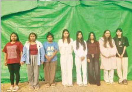
မြန်မာနိုင်ငံသား အမျိုးသမီးများကို တွေ့ရစဉ်။