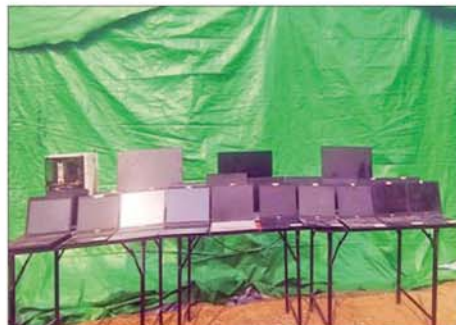
All in one နှစ်လုံး၊ Desktop တစ်စုံနှင့် Laptop ၂၁ လုံးကို တွေ့ရစဉ်။