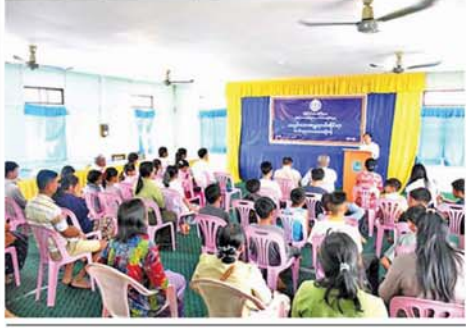
ကာကွယ်ရေးကိုလည်း အသင့်ပြင် အတွက် မြို့နယ်စီမံခန့်ခွဲရေး ဆင်ထားရှိသည်။ အဆိုပါ အပူရှောင်စခန်းကို ဦးဆောင်မှုဖြင့် ဌာနဆိုင်ရာတာဝန် ဧပြီ ၃ ရက်မှ ၁၂ ရက်အထိ ရှိသူများ၊ လူမှုရေးအသင်းအဖွဲ့ နေ့စဉ် နံနက် ၉ နာရီမှ ညနေ ၆ များနှင့် စေတနာအလှူရှင်များ နာရီအထိ ဖွင့်လှစ်ဆောင်ရွက် စုပေါင်း၍ လိုအပ်သည်များ ဖြည့် ဆည်းဆောင် ရွက်ပေးလျက်ရှိ ဆည်းဆောင် ရွက်ပေးလျက်ရှိ ကြောင်း သိရသည်။ (၄၄၅)

ပွင့်ဖြူ ဧပြီ ၄ သာစွာ နေထိုင်နိုင်ရန်အတွက် မြို့ မကွေးတိုင်းဒေသကြီး၊ နယ်စီမံခန့်ခွဲရေးနှင့် အုပ်ချုပ်ရေး မင်းဘူးခရိုင်၊ ပွင့်ဖြူမြို့နယ်တွင် ကော်မတီ၏ ကြီးကြပ်မှုဖြင့် ဌာနဆိုင်ရာတာဝန်ရှိသူများက နေရာထိုင်ခင်းများ၊ ပန်ကာများ၊ သောက်ရေသန့်များ၊ Water Cooler များ၊ ဓာတ်ဆားထုပ် များ ဆောင်ရွက်ထားရှိပေးထား ကြောင်း၊ ထို့အပြင် အပူဒဏ် အန္တရာယ်ကင်းစေးစေရန် အပူဒဏ် အန္တရာယ်အကြောင်းနှင့် ကြိုတင် ကာကွယ်ရမည့် ဆောင်ရွက်မှု ရှောင် ရန်များ အသိပညာပေးခြင်း၊ ကျန်း မာရေးစောင့်ရှောက်မှုများ ချက်ချင်း ဆောင်ရွက်နိုင်ရန် ယာယီဆေး ဆောင်များ၊ ကလေးသူငယ်များ ပေးခန်း ဖွင့်လှစ်ထားရှိပေးထား နှင့် ပြည်သူများ စိတ်အေးချမ်း ပြီး အရေးပေါ် ကျန်းမာရေး