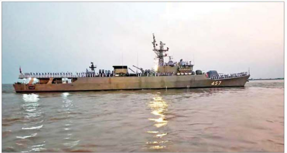
ထိုင်းဘုရင့်ရေတပ်မှ ချစ်ကြည်ရေးခရီးအလည်အပတ်ရောက်ရှိနေသည့် စစ်ရေယာဉ် HTMS Kraburi (FFG-457) ပြန်လည်ထွက်ခွာစဉ်။