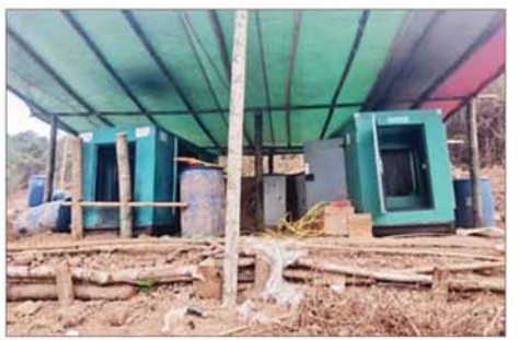
မီးစက်နှစ်လုံးကို တွေ့ရစဉ်။