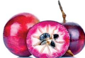
ကြယ်ပန်းသီး

သွားကိုက်၊ သွားနာဖြစ်ပါက သွားအခေါင်းထဲသို့ မုရိုးအစေးကို ဝှမ်းစလေးနဲ့ သိပ်ထည့်ထားပေးလျှင် ပျောက်ကင်းပါတယ်။