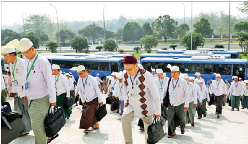
တတိယအကြိမ် ပြည်ထောင်စုလွှတ်တော် ပထမပုံမှန်အစည်းအဝေးသို့ တက်ရောက်လာကြသည့် ပြည်ထောင်စုလွှတ်တော်ကိုယ်စားလှယ်များအား တွေ့ရစဉ်။