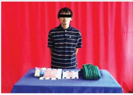
ယာဉ်တိုက်မှုဖြစ်ပွား၍ အမျိုးသား တစ်ဦးနှင့် အမျိုးသမီး နှစ်ဦး သေဆုံး

နေပြည်တော် ဧပြီ ၂ များ၊ ဝက်ရုံများနှင့် ဈေးများအား ဆောင်ရွက်ရာ၌ ခရိုင်မီးသတ် များ၊ ခလုတ်များနှင့် မီးသုံးစွဲမှု ပွင့်လင်းရာသီ ရောက်ရှိလာ စဉ်ဆက်မပြတ် ကွင်းဆင်းစစ်ဆေး အခြေအနေများ၊ မီးသတ်ဆေးဘူး သည့်အတွက် မီးလောင်မှု၊ မီး မီးသတ်တပ်ဖွဲ့ဝင်များ ပူးပေါင်း၍ များ ကောင်းမွန်မှု ရှိ၊ မရှိနှင့် ရေ လန့်မှုများ မဖြစ်ပေါ်စေရေး ကျောက်ဆည်မြို့၊ အေးမြကြည်လင်၊ စုကြီး၊ ဘောက သုံးစွဲမှုများကို စစ်ဆေးခဲ့ကြောင်း သိရသည်။ (ယာဝု) ထက်ထက်(ကျောက်ဆည်) * - * - * - * - * - * - *