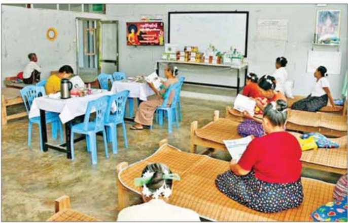
အပူရှောင်စခန်းသို့ လာရောက်အပူရှောင်နားခိုကြသူများအား တွေ့ရစဉ်။

မင်းဘူး(စကျ)မြို့နယ်၌ ပူရှောင်စခန်းများကို ပထမဦးစားပေးအဖြစ် မင်းဘူးမြို့ ပညာအလင်း ရောင်ကိုယ်ပိုင်အထက်တန်းကျောင်း၊ မင်းဘူးမြို့ သာသနာဗိမာန်နှင့် စကျမြို့ရှိ မိုးကုတ်ဓမ္မရိပ်သာတို့ တွင် နေ့စဉ် နံနက် ၈ နာရီမှ ညနေ ၆ နာရီခွဲအချိန်ထိ ဖွင့်လှစ်ထားပြီး နားနေခန်း၊ တရားနာခန်း၊ ထမင်း စားခန်းနှင့် TV ကြည့်ခန်းများအပြင် တိုင်းရင်းဆေး ပညာဦးစီးဌာနနှင့် ခရိုင်ပြည်သူ့ဆေးရုံကြီးမှ ကျန်းမာရေးစောင့်ရှောက်မှု ဆောင်ရွက်ပေးခြင်း၊ TV ကြည့်ခြင်း၊ ပြန်ကြားရေးနှင့်ပြည်သူ့ဆက်ဆံ ရေးဦးစီးဌာနမှ သတိပေးစာအုပ်စာပေနှင့် နေ့စဉ် ထုတ်သတင်းစာများ ဖတ်ရှုလေ့လာနိုင်ရန်နှင့် အကြံ/အယူအဆအညီအညီအုပ်စုထောက်ပံ့မှုဆိုင်ရာ ကိစ္စရပ်များကို ဆောင်ရွက်ပေးလျက်ရှိကြောင်း၊ အပူရှောင်စခန်း စတင်ဖွင့်လှစ်သည့် ပထမရက် တွင် မင်းဘူးမြို့ ပညာအလင်းရောင်ကိုယ်ပိုင် အထက်တန်းကျောင်း၌ သက်ကြီးဘိုးဘွား ၂၀ က