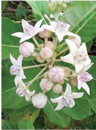
မုရိုးပင်

အရိုးတစ်ချောင်းမှာ အရွက်က တစ်ဖက် တစ်ချက်ကထွက်ပြီး အကိုင်းများအထိ အရွက်က အစိမ်းရောင်ရင့်ရင့်၊ အမွှေးနုပါတဲ့ဘက်က အဖြူရောင်ဘက်ကို နည်းနည်းယိမ်းပါတယ်။ အသီးက စိန်တလုံးသရက်သီးလို ပုံသဏ္ဍာန်ရှိပါတယ်။ မုရိုးပင်လို့လည်းခေါ်ကြသလို ကျွဲပေါက်ပင်လို့လည်း ခေါ်ကြပါတယ်။ ရခိုင်ဒေသမှာတော့ ငဖြူကြီးပင်လို့ ခေါ်ကြပါတယ်။ ပြည်ဘက်မှာတော့ နွားဖြူကြီးပင်(နွားနို့ခဲ)ပင်လို့ ခေါ်ကြပါတယ်။