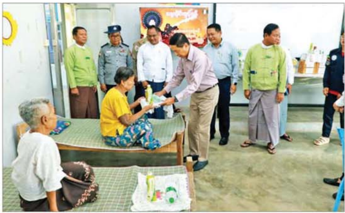
ပြည်သူ့ဆေးရုံကြီးသို့ သွားရောက်၍ အပူရောင်ကြောင့် ပင်ပန်းနွမ်းနယ်ခြင်း၊ အပူရောင်ကြောင့် သတိလစ်ခြင်း၊ လက္ခဏာများဖြစ်ပေါ်ပါက အရေးပေါ်ကျန်းမာရေး စစ်သပ်ခန်း၊ ဆေးနှင့်ဆေးဝါးများ ကြိုတင်ပြင်ဆင်

နေပြည်တော် ဧပြီ ၂ လူမှုဝန်ထမ်း၊ ကယ်ဆယ်ရေးနှင့် ပြန်လည်နေရာချထားရေးဝန်ကြီးဌာန ပြည်ထောင်စုဝန်ကြီး ဒေါက်တာစိုးဝင်းသည် မကွေးတိုင်းဒေသကြီး လူမှုရေးဝန်ကြီး တာဝန်ရှိသူများနှင့်အတူ ယနေ့နံနက်ပိုင်းတွင် မင်းဘူးမြို့ ပညာအလင်းရောင်ကိုယ်ပိုင်အထက်တန်းကျောင်း၌ သက်ကြီးပုဂ္ဂိုလ်များအတွက် ဦးစားပေးဖွင့်လှစ်ထားရှိသည့် အပူရောင်စခန်းသို့ သွားရောက်၍ သက်ကြီးပုဂ္ဂိုလ်များ အပူရောင်ကြောင့် မလိုလားအပ်သော အကျိုးဆက်များ မဖြစ်ပေါ်စေရေး ကာကွယ်ရေးနည်းလမ်းများ ဆောင်ရွက်/ ရောင်ရန်များကို အသိပညာပေးရှင်းလင်းပြောကြားပြီး နိုင်ငံတော်ယာယီသမ္မတက ထောက်ပံ့သည့်ဓာတ်ဆားနှင့် အချိုရည်များကို ထောက်ပံ့ပေးအပ်ကာ အပူရောင်သက်ကြီးပုဂ္ဂိုလ်များအား ကျန်းမာရေးစောင့်ရှောက်မှု ဆောင်ရွက်ပေးနေမှုများကို လှည့်လည်ကြည့်ရှုသည်။