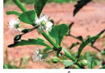
ဓန္ဒသုစပင်

ပင်စည်ကို အမျိုးအစားကောင်းတဲ့ စက္ကူထုတ်လုပ်ရာမှာ အသုံးပြုပါတယ်။