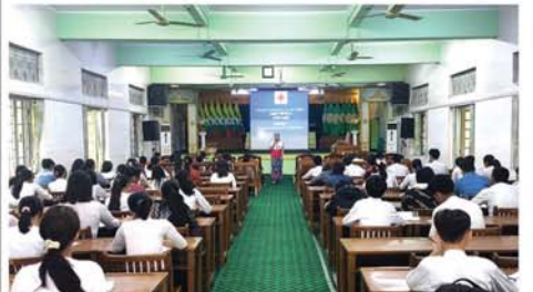
မြို့နယ်(ပြန်/ ဆက်)