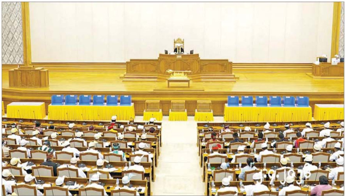
တတိယအကြိမ် ပြည်ထောင်စုလွှတ်တော် ပထမပုံမှန်အစည်းအဝေး ဒုတိယနေ့ကျင်းပစဉ်။

နေပြည်တော် ဧပြီ ၂ တတိယအကြိမ် ပြည်ထောင်စု လွှတ်တော် ပထမပုံမှန်အစည်းအဝေး ဒုတိယနေ့ကို ယနေ့နံနက် ၁၀ နာရီတွင် နေပြည်တော်ရှိ လွှတ်တော်အဆောက် အအုံ ပြည်ထောင်စုလွှတ်တော်အစည်း အဝေးခန်းမ၌ ကျင်းပသည်။ ဦးစွာ ပြည်ထောင်စုလွှတ်တော် နာယက ဦးအောင်လင်းခွေးက တတိယ အကြိမ် ပြည်ထောင်စုလွှတ်တော် ပထမ ပုံမှန်အစည်းအဝေး ဒုတိယနေ့သို့ တက်ရောက်ခွင့်ရှိသည့် ပြည်ထောင်စု လွှတ်တော်ကိုယ်စားလှယ်ဦးရေစုစုပေါင်း ၅၈၆ ဦးရှိသည့်အနက် ယနေ့အစည်းအဝေး သို့ ၅၈၄ ဦး တက်ရောက်သဖြင့် ထက်ဝက် ကျော်သည့်အတွက် အစည်းအဝေး အထမြောက်ကြောင်းနှင့် စတင်ကျင်းပ ကြောင်း ကြေညာပြီး အစည်းအဝေး တက်ရောက်မှုအခြေအနေကို လွှတ်တော် ၏ အတည်ပြုချက်ရယူ၍ မှတ်တမ်းတင် သည်။