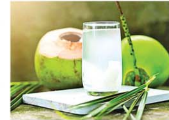
ဇုန်းရည်

အမြစ်ကို ပြုတ်ပြီး ရာသီသွေးလွန်ခြင်း၊ သောင်းကျခြင်းတို့ဖြစ်လျှင် တိုက်ပေးရပါတယ်။ အမြစ်ကို ဆန်ဆေးရည်နဲ့သွေး၍ ဆားထည့်သောက်ပါက အနာဝင်၍ဖျားခြင်းပျောက်ကင်းပါတယ်။