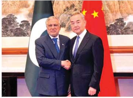
ပေကျင်း စဗြီ ၂ အလယ်ပိုင်းဒေသတွင် ငြိမ်းချမ်းရေးနှင့် တည်ငြိမ်မှု ပြန်လည်ဖော်ဆောင်ရန်အတွက် ပဋိပက္ခများ

ကို ချက်ချင်းရပ်တန့်ရန် တောင်းဆိုထားသည် အချက် ငါးချက် ပါဝင်သော အစည်းအဝေးတွင် ချက်တစ်ခုကို ယခင်နေ့က ထုတ်ပြန်ခဲ့ကြောင်း စီအင်အေအသတင်းဌာနက ဖော်ပြသည်။ တရုတ်နှင့် ပါကစ္စတန်နိုင်ငံတို့သည် ပဋိပက္ခများကို ချက်ချင်းရပ်တန့်ရန်နှင့် ပဋိပက္ခများ ပျံ့နှံ့မသွားစေရန် အစွမ်းကုန်ကြိုးပမ်းဆောင်ရွက်ကြရန် တောင်းဆိုကြောင်း ပေကျင်းမြို့တွင် ပြုလုပ်သည့် အဆင့်မြင့်ဆွေးနွေးပွဲအပြီး ထုတ်ပြန်သည့် ကြေညာချက်တွင် ဖော်ပြထားသည်။ ပါကစ္စတန် ဒုတိယဝန်ကြီးချုပ်နှင့် နိုင်ငံခြားရေးဝန်ကြီးအီရှက်ဒါးသည် ပေကျင်းမြို့သို့ ရောက်ရှိနေပြီး ၎င်းသည် တရုတ်နိုင်ငံခြားရေးဝန်ကြီး ဝမ်ယီနှင့် တွေ့ဆုံကာ ငြိမ်းချမ်းရေးလုပ်ငန်းစဉ်များနှင့် အရှေ့အလယ်ပိုင်းတွင် ပြင်းထန်နေသော ပဋိပက္ခအဆုံးသတ်ရန် အစွဲလားမာဘတ်မြို့တော်က ပါဝင်ဆောင်ရွက်နေသည့် အခန်းကဏ္ဍများကို ဆွေးနွေးခဲ့ကြကြောင်း သိရသည်။