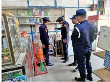
သုံးဘီးဆိုင်ကယ် အရှိန်မထိန်းနိုင်ဘဲ ထိုးကျတိမ်းပျောက်မှုဖြစ်ပွား

ကျောက်ဆည် ဧပြီ ၂ များ၊ စက်ရုံများနှင့် ဈေးများအား ဆောင်ရွက်ရာ၌ ခရိုင်မီးသတ် များ၊ ခလုတ်များနှင့် မီးသုံးစွဲမှု ပွင့်လင်းရာသီ ရောက်ရှိလာ စဉ်ဆက်မပြတ် ကွင်းဆင်းစစ်ဆေး အခြေအနေများ၊ မီးသတ်ဆေးဘူး သည့်အတွက် မီးလောင်မှု၊ မီး မီးသတ်တပ်ဖွဲ့ဝင်များ ပူးပေါင်း၍ များ ကောင်းမွန်မှု ရှိ၊ မရှိနှင့် ရေ လန့်မှုများ မဖြစ်ပေါ်စေရေး ကျောက်ဆည်မြို့၊ အေးမြကြည်လင်၊ စုကြီး၊ ဘောက သုံးစွဲမှုများကို စစ်ဆေးခဲ့ကြောင်း သိရသည်။ (ယာဝု) ထက်ထက်(ကျောက်ဆည်) * - * - * - * - * - * - *