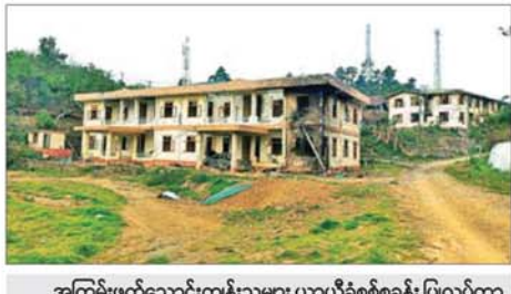
အကြမ်းဖက်သောင်းကျန်းသူများ ယာယီစစ်ခန်း ပြုလုပ်ကာ မိုင်းတောင်ဖောက်ခွဲဖျက်ဆီးခဲ့သည့် ဖလမ်းမြို့ရှိ ဌာနဆိုင်ရာ အဆောက်အအုံများကို တွေ့ရစဉ်။