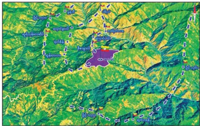
တပ်မတော်စစ်ကြောင်းများက CDF အမည်ခံ အကြမ်းဖက်သောင်းကျန်းသူများ ယာယီစိုးမိုးထားသည့် ဖလမ်းမြို့အား အလုံးစုံပြန်လည်သိမ်းပိုက်ထိန်းချုပ်။

သည် ထိခိုက်၊ ဒဏ်ရာရရှိမှု များပြားလာမှုများကြောင့် လုံခြုံရေးတပ်ဖွဲ့ဝင်များသည် စစ်နည်းဗျူဟာမြောက် ကြားခံစစ်အဆင့်ဆင့်ဖြင့် ၂၀၂၅ ခုနှစ် မေလ ၆ ရက်နေ့တွင် စနစ်တကျဆုတ်ခွာခဲ့ရသဖြင့် အကြမ်းဖက်သောင်းကျန်းသူများသည် ဖလမ်းမြို့အား ယာယီစိုးမိုးခဲ့သည်။ တပ်မတော်စစ်ကြောင်းများအနေဖြင့် ချင်းပြည်နယ် ခရိုင်မြို့တော်ကြီးတစ်ခုဖြစ်သည့် ဖလမ်းမြို့အား အမြန်ဆုံးပြန်လည်သိမ်းပိုက်ရရှိနိုင်ရေးနှင့် CDF အမည်ခံ အကြမ်းဖက်သောင်းကျန်းသူများအား တိုက်ခိုက်ချေမှုန်းနိုင်ရေးအတွက် ကလေးမြို့နှင့် တီးတိန်မြို့တို့၌ လိုအပ်သည့် ပြင်ဆင်စုပွဲမှုများနှင့် အုပ်ချုပ်ထောက်ပံ့မှုများကို ဖြည့်တင်းဆောင်ရွက်ခဲ့ပြီး မြေပြင်/ဝေဟင် ဟန်ချက်ညီပေါင်းစပ်စုပွဲ၍ စစ်ကြောင်းများခွဲပြီး နယ်မြေရှင်းလင်းခြင်းများ စတင်ခဲ့ကာ တန်ပြန်တိုက်စစ်များ တစ်ဆင့်ပြီးတစ်ဆင့် ခြေကုပ်ယူထိုးဖောက်တိုက်ခိုက်ခဲ့ရာ ၂၀၂၅ ခုနှစ်အောက်တိုဘာလ ၂၇ ရက်နေ့တွင် အကြမ်းဖက်သောင်းကျန်းသူများ ယာယီစိုးမိုးထားသော သာယာကုန်းကျေးရွာအားလည်းကောင်း၊ အောက်တိုဘာလ ၃၀ ရက်နေ့တွင် နတ်ချောင်းတံတားအားလည်းကောင်း၊