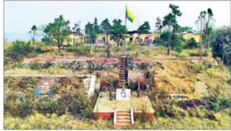
နယ်မြေခံတပ်ရင်းဌာနချုပ်အား ပြန်လည်သိမ်းပိုက်ရရှိစဉ်။