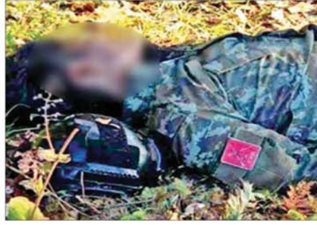
CDF အမည်ခံအကြမ်းဖက်သောင်းကျန်းသူပူးပေါင်းအဖွဲ့များ၏ အလောင်းများ။

CDF အမည်ခံ အကြမ်းဖက်သောင်းကျန်းသူ ပူးပေါင်းအဖွဲ့များ အနေဖြင့် ဖလမ်းမြို့နှင့် ၎င်းဒေသတစ်ဝိုက်အား ယာယီစိုးမိုးထားစဉ် မြို့/ရွာများအတွင်းရှိ ဘာသာရေးဆိုင်ရာ အဆောက်အအုံများ၊ စာသင် ကျောင်းများ၊ ဌာနဆိုင်ရာအဆောက်အအုံများ၊ ဆေးရုံများနှင့် လူနေအိမ် များတွင် ဘန်ကာများဆောက်လုပ်ပြီး တပ်မတော်စစ်ကြောင်းများအား ပစ်ခတ်တိုက်ခိုက်ခြင်း၊ ဒေသခံပြည်သူများ၏ အိုးအိမ်များကို ခံစစ် တံတိုင်းအဖြစ် အကာအကွယ်ရယူ၍ ပစ်ခတ်တိုက်ခိုက်ခြင်း၊ နေအိမ်များ နှင့် ဈေးဆိုင်ခန်းများအားဖောက်ထွင်း၍ တန်ဖိုးကြီးပစ္စည်းများ၊ စားသောက်ကုန်နှင့် အသုံးအဆောင်ပစ္စည်းများကို အဓမ္မလုဆောင်ခြင်း များလုပ်ဆောင်ခဲ့သဖြင့် ကလေးသူငယ်များ၊ သက်ကြီးရွယ်အိုများ အပါအဝင် ဒေသခံတိုင်းရင်းသားများအနေဖြင့်လည်း အကြမ်းဖက်သမား များအား စက်ဆုပ်ရွံရှာမုန်းတီးခြင်းနှင့်အတူ ဆင်းရဲမှုဘေးဒုက္ခ ကြီးစွာဖြင့် နီးစပ်ရာမြို့ရွာများသို့ ထွက်ပြေးတိမ်းရှောင်ခဲ့ရသည်။ တပ်မတော်စစ်ကြောင်းများအနေဖြင့် ဖလမ်းမြို့အတွင်းသို့ ယာယီ