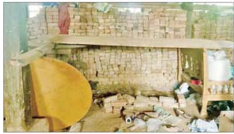
အကြမ်းဖက်သောင်းကျန်းသူများ ဖလမ်းမြို့ရှိ ဌာနဆိုင်ရာအဆောက်အအုံ၊ ဘာသာရေးအဆောက်အအုံများနှင့် လူနေအဆောက်အအုံများအတွင်း ဘန်ကာများပြုလုပ်၍ ယာယီစစ်ခန်းပြုလုပ်ခဲ့သည့် မှတ်တမ်းဓာတ်ပုံ။