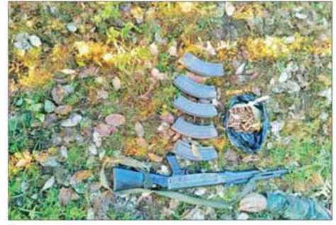
CDF အမည်ခံအကြမ်းဖက်သောင်းကျန်းသူပူးပေါင်းအဖွဲ့များ ထံမှ သိမ်းပိုက်ရရှိသည့် လက်နက်ခဲယမ်းများ။

နေ့ရပ်စွန့်ခွာနေကြရသည့် ဒေသခံတိုင်းရင်းသားပြည်သူများအား အန္တရာယ်ကင်းရှင်းစွာ ပြန်လည်ဝင်ရောက်နေထိုင်နိုင်ရေး၊ အစိုးရ အုပ်ချုပ်မှုယန္တရားများ အမြန်ဆုံးလည်ပတ်နိုင်ရေးနှင့် အကြမ်းဖက် သောင်းကျန်းသူများ၏ ယုတ်မာရက်စက်စွာ လုပ်ဆောင်ခဲ့သည့် မြေမြှုပ်ခိုင်းများအား ဦးစားပေးရှင်းလင်းဖော်ထုတ်ခြင်းကို ဆောင်ရွက်လျက်ရှိပြီး အကြမ်းဖက်သောင်းကျန်းသူများပျက်ဆီးခဲ့ သည့် စာသင်ကျောင်းများ၊ ဆေးရုံ/ ဆေးခန်းများ၊ ရုံး/ဌာနအဆောက် အအုံများ၊ ဘာသာရေးဆိုင်ရာအဆောက်အအုံများနှင့် လူနေအိမ်များ အား ဒေသခံတိုင်းရင်းသားများနှင့်ပူးပေါင်း၍ အမြန်ဆုံး ပြန်လည်ပြုပြင် ခြင်းလုပ်ငန်းများကို ဆောင်ရွက်ပေးသွားမည်ဖြစ်ကြောင်းနှင့် လုံခြုံရေး တပ်ဖွဲ့ဝင်များအနေဖြင့် ချင်းပြည်နယ်အတွင်း အကြမ်းဖက်သောင်းကျန်း သူများ လုံးဝကင်းစင်ပပျောက်ရေးအတွက် အကြမ်းဖက်ချေမှုန်းမှု စစ်ဆင်ရေး (Counter- Terrorism Operation)ကို ဆက်လက်တိုးမြှင့် ဆောင်ရွက်သွားမည်ဖြစ်သည်။ နိုင်ငံတော်အစိုးရအနေဖြင့် လက်နက်ကိုင်ပဋိပက္ခများ ချုပ်ငြိမ်း ရန်နှင့် နိုင်ငံရေးပြဿနာကို နိုင်ငံရေးနည်းလမ်းဖြင့် ဖြေရှင်းရန်အတွက် ကြိုတင်ကန့်သတ်ချက်များမထားသည့် ငြိမ်းချမ်းရေးဆွေးနွေးမှုများ ပြုလုပ်ရန် တိုင်းရင်းသားလက်နက်ကိုင် အဖွဲ့အစည်းများကို ဖိတ်ခေါ်