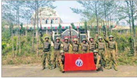
ဖလမ်းမြို့ ဆူရီဘုန်းလေဆိပ်အား သိမ်းပိုက်ရရှိစဉ်။