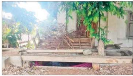
အကြမ်းဖက်သောင်းကျန်းသူများ ဖလမ်းမြို့ရှိ ဌာနဆိုင်ရာအဆောက်အအုံ၊ ဘာသာရေးအဆောက်အအုံများနှင့် လူနေအဆောက်အအုံများအတွင်း ဘန်ကာများပြုလုပ်၍ ယာယီစစ်ခန်းပြုလုပ်ခဲ့သည့် မှတ်တမ်းဓာတ်ပုံ။