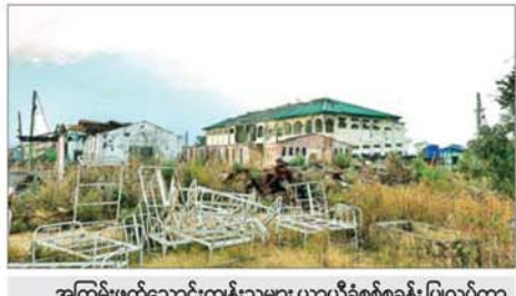
အကြမ်းဖက်သောင်းကျန်းသူများ ယာယီစစ်ခန်း ပြုလုပ်ကာ မိုင်းတောင်ဖောက်ခွဲဖျက်ဆီးခဲ့သည့် ဖလမ်းမြို့ ပြည်သူ့ဆေးရုံကြီးကို တွေ့ရစဉ်။