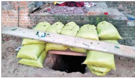
အကြမ်းဖက်သောင်းကျန်းသူများ ဖလမ်းမြို့ရှိ ဌာနဆိုင်ရာအဆောက်အအုံ၊ ဘာသာရေးအဆောက်အအုံများနှင့် လူနေအဆောက်အအုံများအတွင်း ဘန်ကာများပြုလုပ်၍ ယာယီစစ်ခန်းပြုလုပ်ခဲ့သည့် မှတ်တမ်းဓာတ်ပုံ။