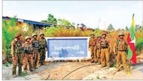
ဖလမ်းမြို့ ပြည်သူ့ဆေးရုံကြီးအား ပြန်လည်သိမ်းပိုက်ရရှိစဉ်။

နိုင်ငံဘာလ ၃ ရက်နေ့တွင် ပွိုင့်-၂၄၄ တောင်ကုန်းအားလည်းကောင်း၊ နိုင်ငံဘာလ ၄ ရက်နေ့တွင် နိုင်ငံဘာလ ၈ ရက်နေ့တွင် ပွိုင့်-၂၀၆၄ တောင်ကုန်းအားလည်းကောင်း၊ နိုင်ငံဘာလ ၉ ရက်နေ့တွင် သိုင်းငင်းစခန်းအားလည်းကောင်း၊ စာမျက်နှာ ၁၀ သို့