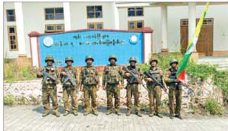
ဖလမ်းမြို့ရှိ ကျန်းမာရေးလူစွမ်းအားအရင်းအမြစ်ဦးစီးဌာန သူနာပြုသင်တန်းကျောင်းအား သိမ်းပိုက်ရရှိစဉ်။