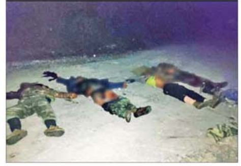
CDF အမည်ခံအကြမ်းဖက်သောင်းကျန်းသူပူးပေါင်းအဖွဲ့များ၏ အလောင်းများ။