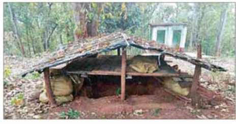
အကြမ်းဖက်သောင်းကျန်းသူများ ဖလမ်းမြို့ရှိ ဌာနဆိုင်ရာအဆောက်အအုံ၊ ဘာသာရေးအဆောက်အအုံများနှင့် လူနေအဆောက်အအုံများအတွင်း ဘန်ကာများပြုလုပ်၍ ယာယီစစ်ခန်းပြုလုပ်ခဲ့သည့် မှတ်တမ်းဓာတ်ပုံ။