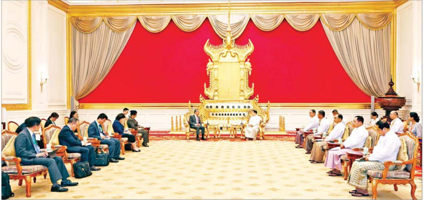
ပြည်ထောင်စုသမ္မတမြန်မာနိုင်ငံတော် နိုင်ငံတော်သမ္မတ ဦးမင်းအောင်လှိုင် တရုတ်ကွန်မြူနစ်ပါတီဗဟိုကော်မတီ နိုင်ငံရေးရာဇဝန်အဖွဲ့ဝင်နှင့် နိုင်ငံခြားရေးဝန်ကြီး H.E. Mr. Wang Yi ဦးဆောင်သော ကိုယ်စားလှယ်အဖွဲ့အား လက်ခံတွေ့ဆုံစဉ်။

အတွဲ(၂၉)၊ အမှတ်(၁၃၉)၊ ၁၃၈၈ ခုနှစ်၊ ကဆုန်လဆန်း ၁၁ ရက်၊ ၂၆-၄-၂၀၂၆၊ တနင်္ဂနွေနေ့။