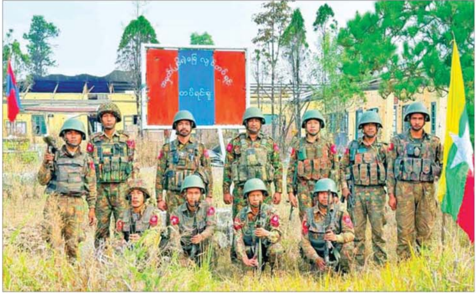
တပ်မတော်စစ်ကြောင်းများက CDF အမည်ခံ အကြမ်းဖက်သောင်းကျန်းသူများ ယာယီစိုးမိုးထားသည့် ဖလမ်းမြို့အား ပြန်လည်သိမ်းပိုက်ရရှိစဉ်။

နေပြည်တော် ဧပြီ ၂၅ ချင်းပြည်နယ်၏ ဒုတိယမြို့တော်ဖြစ်သည့် ဖလမ်းမြို့သည် ခရိုင် ရုံး၊ မြို့နယ်ရုံးများစိုက်ရာ တောင်ပေါ်မြို့တစ်မြို့ ဖြစ်သည်။ မြောက်ဘက်တွင် တီးတိန်မြို့နယ်နှင့် တောင်ဘက်တွင် ဟားခါးမြို့နယ်တို့ တည်ရှိကာ ဖလမ်းမြို့အနီး ဆူရီဘုန်းတောင်တွင် လေယာဉ်ကွင်းရှိပြီး ချင်းပြည်နယ်၏ ပထမဆုံးလေဆိပ်ရှိသည့်မြို့ဖြစ်သည်။ ဖလမ်းမှတစ်ဆင့် စစ်ကိုင်းတိုင်းဒေသကြီး ကလေးမြို့နယ်သို့လည်းကောင်း၊ ဖလမ်း-ဟားခါးမှတစ်ဆင့် မကွေးတိုင်းဒေသကြီး ဂန့်ဂေါမြို့နယ်ဘက်သို့လည်းကောင်း သွားလာနိုင်ပြီး အချက်အချာကျပြီး နယ်မြေအေးချမ်းသည့် မြို့တစ်မြို့ဖြစ်သည်။ ထိုကဲ့သို့သော နယ်မြေအေးချမ်းသည့် တောင်ပေါ်ဒေသတွင် ရိုးသားစွာနေထိုင်လုပ်ကိုင်စားသောက်နေကြသည့် ပြည်သူများအား CDF အမည်ခံ အကြမ်းဖက်သောင်းကျန်းသူ ပူးပေါင်းအဖွဲ့များက CRPH၊ NUG အကြမ်းဖက်အဖွဲ့တို့၏ သွေးထိုးမြှောက်ပင်မှုနှင့်အတူ ဒီမိုကရေစီအရေးနှင့် ဒေသကောင်းစားရေးဟု နိုင်ငံရေးမကလေးများဖြင့် စည်းရုံးသိမ်းသွင်း၍ အကြမ်းဖက်သတ်တန်းများပို့ချပေးခဲ့သည်။ ထိုသို့ အကြမ်းဖက်သမားများအဖြစ်မှူးထုတ်ပေးကာ နယ်မြေပြည်သူများ၏ အသက်အိုးအိမ်၊ စည်းစိမ်များကို ဖျက်ဆီးပြီး အစိုးရအုပ်ချုပ်ရေးယန္တရားများ ပျက်စီးကာ ဖွံ့ဖြိုးတိုးတက်မှု နှောင့်နှေးစေရန်ရည်ရွယ်၍ ချင်းပြည်နယ် စစ်ဆင်ရေးအမည်ဖြင့် မြို့ရွာများတွင် တိုက်ပွဲများ ဖော်ဆောင်ခြင်း၊ လုံခြုံရေးအားနည်းသော တပ်စခန်းငယ်များကို အင်အားအလုံးအရင်း အသုံးပြု၍ တိုက်ခိုက်ခြင်းများ လုပ်ဆောင်လျက်ရှိရာ ဖလမ်းမြို့အား ၂၀၂၄ ခုနှစ် နိုဝင်ဘာလ ၈ ရက်နေ့တွင် စာမျက်နှာ ၉ သို့ ၀