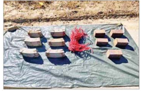
CDF အမည်ခံအကြမ်းဖက်သောင်းကျန်းသူပူးပေါင်းအဖွဲ့များ ထံမှ သိမ်းပိုက်ရရှိသည့် ခဲယမ်းများ။

နေ့ရပ်စွန့်ခွာနေကြရသည့် ဒေသခံတိုင်းရင်းသားပြည်သူများအား အန္တရာယ်ကင်းရှင်းစွာ ပြန်လည်ဝင်ရောက်နေထိုင်နိုင်ရေး၊ အစိုးရ အုပ်ချုပ်မှုယန္တရားများ အမြန်ဆုံးလည်ပတ်နိုင်ရေးနှင့် အကြမ်းဖက် သောင်းကျန်းသူများ၏ ယုတ်မာရက်စက်စွာ လုပ်ဆောင်ခဲ့သည့် မြေမြှုပ်ခိုင်းများအား ဦးစားပေးရှင်းလင်းဖော်ထုတ်ခြင်းကို ဆောင်ရွက်လျက်ရှိပြီး အကြမ်းဖက်သောင်းကျန်းသူများပျက်ဆီးခဲ့ သည့် စာသင်ကျောင်းများ၊ ဆေးရုံ/ ဆေးခန်းများ၊ ရုံး/ဌာနအဆောက် အအုံများ၊ ဘာသာရေးဆိုင်ရာအဆောက်အအုံများနှင့် လူနေအိမ်များ အား ဒေသခံတိုင်းရင်းသားများနှင့်ပူးပေါင်း၍ အမြန်ဆုံး ပြန်လည်ပြုပြင် ခြင်းလုပ်ငန်းများကို ဆောင်ရွက်ပေးသွားမည်ဖြစ်ကြောင်းနှင့် လုံခြုံရေး တပ်ဖွဲ့ဝင်များအနေဖြင့် ချင်းပြည်နယ်အတွင်း အကြမ်းဖက်သောင်းကျန်း သူများ လုံးဝကင်းစင်ပပျောက်ရေးအတွက် အကြမ်းဖက်ချေမှုန်းမှု စစ်ဆင်ရေး (Counter- Terrorism Operation)ကို ဆက်လက်တိုးမြှင့် ဆောင်ရွက်သွားမည်ဖြစ်သည်။ နိုင်ငံတော်အစိုးရအနေဖြင့် လက်နက်ကိုင်ပဋိပက္ခများ ချုပ်ငြိမ်း ရန်နှင့် နိုင်ငံရေးပြဿနာကို နိုင်ငံရေးနည်းလမ်းဖြင့် ဖြေရှင်းရန်အတွက် ကြိုတင်ကန့်သတ်ချက်များမထားသည့် ငြိမ်းချမ်းရေးဆွေးနွေးမှုများ ပြုလုပ်ရန် တိုင်းရင်းသားလက်နက်ကိုင် အဖွဲ့အစည်းများကို ဖိတ်ခေါ်