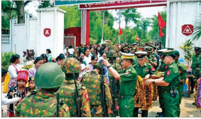
မိသားစုဝင်များ၊ မြန်မာနိုင်ငံ စစ်မှထမ်းဟောင်း အဖွဲ့ဝင်များ၊ ဌာနဆိုင်ရာ တာဝန်ရှိသူများ၊ ပါဝင်တက်ရောက် ဂုဏ်ပြုကြိုဆို ဒေသခံတိုင်း ရင်းသားပြည်သူများ ကြသည်။

နေပြည်တော် မေ ၂၅ နိုင်ငံတော် တည်ငြိမ်ရေးနှင့် နယ်မြေ အေးချမ်းသာယာရေး တို့အတွက် ရှမ်းပြည်နယ် (မြောက်ပိုင်း) မှဆယ်ဒေသတစ်ဝိုက် နယ်မြေလုံခြုံရေး တာဝန်များကို ထမ်းဆောင်၍ ပြန်လည်ရောက်ရှိ လာသော ရှေ့တန်းပြန် နိုင်ငံ သားကောင်း တပ်မတော်သားများ အား ဂုဏ်ပြုကြိုဆိုခြင်းကို ယနေ့ မွန်းလွဲပိုင်းတွင် ရှမ်းပြည်နယ် (အရှေ့ပိုင်း) မိုင်းတွင်းမြို့ရှိ နယ်မြေတပ်ရင်း၌ ပြုလုပ်ရာ ကြိမ်ဒေသ တိုင်းစစ်ဌာနချုပ် တိုင်းမှူး ဗိုလ်ချုပ်စိုးမြတ်ထွဋ်နှင့် တာဝန်ရှိသူများ အရာရှိ စစ်သည်။