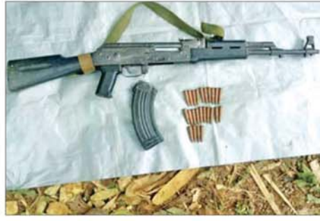
CDF အမည်ခံအကြမ်းဖက်သောင်းကျန်းသူပူးပေါင်းအဖွဲ့များ ထံမှ သိမ်းပိုက်ရရှိသည့် လက်နက်ခဲယမ်းများ။