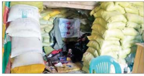
အကြမ်းဖက်သောင်းကျန်းသူများ ဖလမ်းမြို့ရှိ ဌာနဆိုင်ရာအဆောက်အအုံ၊ ဘာသာရေးအဆောက်အအုံများနှင့် လူနေအဆောက်အအုံများအတွင်း ဘန်ကာများပြုလုပ်၍ ယာယီစစ်ခန်းပြုလုပ်ခဲ့သည့် မှတ်တမ်းဓာတ်ပုံ။