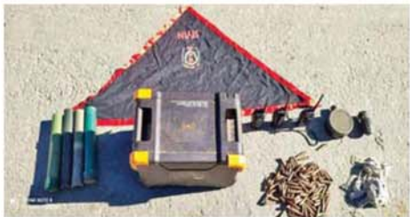
CDF အမည်ခံ အကြမ်းဖက်သောင်းကျန်းသူပေါင်းအဖွဲ့များ ထံမှ သိမ်းပိုက်ရရှိသည့် ခဲယမ်းများကို တွေ့ရစဉ်။