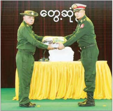
တပ်မတော်ကာကွယ်ရေးဦးစီးချုပ် ဗိုလ်ချုပ်ကြီး ရဲဝင်းဦး တပ်နယ် များမှ အရာရှိ၊ စစ်သည်၊ မိသားစုများအတွက် စားသောက်ဖွယ်ရာ ပစ္စည်းများနှင့် ချီးမြှင့်ငွေများကို တပ်နယ်မှူးထံ ပေးအပ်စဉ်။

မိုင်းဖြတ်၊ မိုင်းယောင်း၊ တာလေ၊ တာချီလိတ်ဒေသတို့ သည် တိုင်းရင်းသားပြည်သူလူထု အများစု နေထိုင်ရာနယ်မြေများ ဖြစ်၍ ဒေသခံတိုင်းရင်းသားများ နှင့် ထိတွေ့ဆက်ဆံရာတွင် တပ်မတော်သားတို့သစ္စာ ကျင့်ဝတ် နှင့်အညီ ပြုမူပြောဆိုရန်နှင့် ဒေသ အလိုက် သဘာဝဓားအန္တရာယ် များ ကြုံတွေ့လာခဲ့ပါကလည်း အထက်အမိန့်စောင့်ထိထိရောက် သောကူညီမှုများ ဆောင်ရွက်ပေး ခြင်းဖြင့် ပြည်သူလူထု၏ ယုံကြည် လေးစားမှုကိုရရှိအောင် ဆောင် ရွက်ကြရန်လိုကြောင်း ပြောကြား ပြီး အရာရှိ၊ စစ်သည်၊ မိသားစု များ၏ လိုအပ်ချက်များကို မေးမြန်း ကာ လိုအပ်သည်များကို တာဝန် ရှိသူများနှင့် ပေါင်းစပ်ညှိနှိုင်း ပြည့်ဆည်းဆောင်ရွက်ပေးသည်။ ထို့နောက် တပ်မတော် ကာကွယ်ရေးဦးစီးချုပ်က တပ်နယ် များမှ အရာရှိ၊ စစ်သည်၊ မိသားစု များအတွက် စားသောက်ဖွယ်ရာ ပစ္စည်းများနှင့် ချီးမြှင့်ငွေများကို ပေးအပ်ရာ တပ်နယ်မှူးက လည်းကောင်း၊ တပ်မတော် ကာကွယ်ရေးဦးစီးချုပ်၏ ဇနီးက တပ်နယ်မှူးရှိ မိခင်နှင့်ကလေး စောင့်ရှောက်ရေးအသင်းအတွက် ချီးမြှင့်ငွေများကို ပေးအပ်ရာ တပ်နယ်မှူး၏ ဇနီးက လည်း ကောင်း လက်ခံရယူကြသည်။ ယင်းနောက် တပ်မတော် ကာကွယ်ရေးဦးစီးချုပ်နှင့် ဇနီး၊ အဖွဲ့ဝင်များသည် တက်ရောက် လာကြသည့် အရာရှိ၊ စစ်သည် တပ်မတော် မိသားစုများအား ရင်းရင်းနှီးနှီး လိုက်လံနှုတ်ဆက်ကြသည်။ တွေ့ဆုံပွဲ အပြီးတွင် တပ်မတော် ကာကွယ်ရေးဦးစီး ချုပ်နှင့်အဖွဲ့ဝင်များသည် မိုင်း ဖြတ် တပ်နယ်အတွင်းရှိ တပ်ရင်း/ တပ်ဖွဲ့များအား မော်တော်ယာဉ် များဖြင့် လိုက်လံကြည့်ရှုစစ်ဆေး ခဲ့ကြောင်း သတင်းရရှိသည်။ သတင်းစဉ်