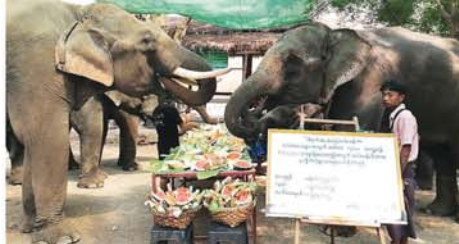
(အောက်ပုံ) (၀၄၅)

မိုင်းယန်း၊ ဧပြီ ၂၄ မိုင်းယန်းခရိုင်၊ မိုင်းယန်းမြို့နယ် တွင် ကိုယ်ဝန်ဆောင်ပိဏ်များအား ကျန်းမာဖွံ့ဖြိုးပြီး လွယ်ကူစွာ မွေးဖွားနိုင်ရန် ကျန်းမာရေး စစ်ဆေးစောင့်ရှောက်ပေးခြင်းနှင့် လစဉ် ပုံမှန်ကကွယ်ဆေးထိုးနှံ ပေးခြင်းကို ဧပြီ ၂၃ ရက် နံနက် ၉ နာရီက ကျိုင်းတုံရပ်ကွက် အတွင်းရှိ မြို့နယ်မိခင်နှင့်ကလေး ကျန်းမာရေးဌာနရုံးတွင် ထိုးနှံ ပေးလျက်ရှိသည်။ အဆိုပါ ကိုယ်ဝန်ဆောင်