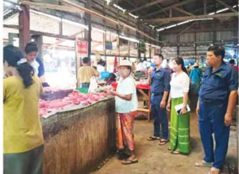
အေးငြိမ်းစံ(ပြန်/ဆက်)

တောင်တွင်းကြီး ဧပြီ ၂၄ မကွေးတိုင်းဒေသကြီး၊မကွေး ခရိုင်၊ တောင်တွင်းကြီးမြို့နယ် မြို့နယ်စည်ပင်သာယာရေးနှင့် ဒဂုန်ဇာရေးအတွင်း ရောင်းချ လျက်ရှိသည့် အသားငါးဈေးနှုန်း မြင့်တင်ရောင်းချမှု မရှိစေရေး အတွက် တာဝန်ရှိသူများ ယနေ့ နေ့ နံနက် ၈ နာရီက ကွင်းဆင်း စစ်ဆေးခဲ့သည်။ (အောက်ပုံ) အဆိုပါလုပ်ငန်းများ ဆောင် ရွက်ရာတွင် မြို့နယ်စည်ပင်သာယာ ရေးအဖွဲ့ကော်မတီဝင်များ၊ မြို့မ