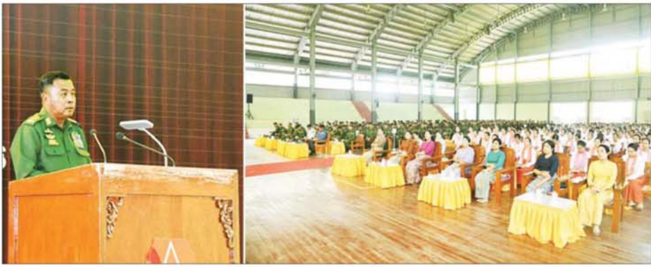
တပ်မတော်ကာကွယ်ရေးဦးစီးချုပ် ဗိုလ်ချုပ်ကြီး ရဲဝင်းဦး ရှမ်းပြည်နယ်(အရှေ့ပိုင်း) မိုင်းဖြတ်၊ မိုင်းယောင်း၊ တာလေ၊ တာချီလိတ်တပ်နယ်များမှ အရာရှိ၊ စစ်သည်၊ မိသားစုများအား တွေ့ဆုံအမှာစကားပြောကြားစဉ်။

ထိုသို့တွေ့ဆုံစဉ် တပ်မတော် ကာကွယ်ရေး ဦးစီးချုပ်က အမှာစကား ပြောကြားရာတွင် တပ်မတော်သားများသည် နိုင်ငံတော်ကိုချစ်သောစိတ်၊ တိုင်းပြည်ကို ချစ်သောစိတ်တို့ဖြင့် မိမိဆန္ဒအလျောက် စွန့်လွှတ်စွန့်စားစွာ တာဝန် ထမ်းဆောင်နေသူများ ဖြစ်ကြောင်း၊ အလားတူတပ်မတော် သားများ၏ ဇနီးများသည်လည်း ကောင်းတူဆိုးဖက် တာဝန်ကျ ရာနေရာတွင် ပါရမီပြည့်ဖက် ကောင်းများအဖြစ် လိုက်ပါ နေထိုင်၍ တပ်မတော်တပ်ရက်စွဲပုံ များတွင် ပူးပေါင်းပါဝင်လုပ်ကိုင် လျက်ရှိကြကြောင်း၊ ထို့အပြင် တပ်မတော်သည် ရဲဘော်စိတ်ကို အခြေခံ၍ တည်ဆောက်ထားကာ အထက်အောက် လေးစားသော စိတ်ဓာတ်၊ ရွယ်တူကိုလေးစား သောစိတ်ဓာတ်၊ ငယ်သူ့ကို