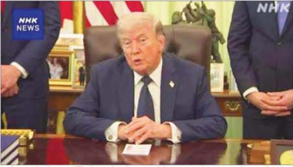
မည်ဟု ရည်မှန်းထားကြောင်းလည်း ၎င်းက ဆိုသည်။ မူလအပစ်အခတ်ရပ်စဲရေးသဘောတူညီချက်မှာ ၁၀ ရက်ဖြစ်သည်။ တိုက်ပွဲများ အပြီးအင်န်အိတ်ချီက