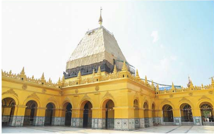
မန္တလေး ဧပြီ ၂၃

မန္တလေးငလျင်ကြီးလုပ်ခတ်မှုကြောင့် မဟာမုနိဘုရားကြီးနှင့် ဘုရားကြီးပရိဝုဏ်အတွင်းရှိ သာသနိက အဆောက်အအုံများ ထိခိုက်ပြိုကျပျက်စီးဆုံးရှုံးခဲ့မှုများဖြစ်ပေါ်ခဲ့၍ ပြန်လည်ပြုပြင်မွမ်းမံတည်ဆောက်ခြင်းလုပ်ငန်းများကို အစီအမံများချမှတ်၍ ဆောင်ရွက်လျက်ရှိရာ မန္တလေးတိုင်းဒေသကြီး ဝန်ကြီးချုပ် ဦးမျိုးအောင်သည် တိုင်းဒေသကြီးအစိုးရအဖွဲ့ စည်ပင်သာယာရေးဝန်ကြီး ဦးခင်မောင်အေး လိုက်ပါပြီး ယနေ့မုန်းလွဲပိုင်းက လုပ်ငန်းပြီးစီးမှုအခြေအနေများကို ကွင်းဆင်းစစ်ဆေးခဲ့သည်။