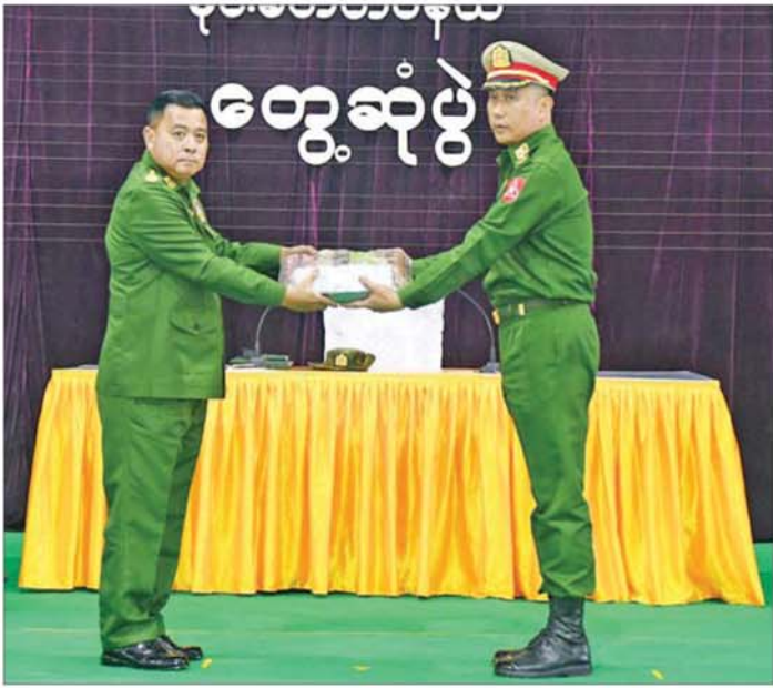
တပ်မတော်ကာကွယ်ရေးဦးစီးချုပ် ဗိုလ်ချုပ်ကြီး ရဲဝင်းဦး မိုင်းခတ်နှင့် မိုင်းယန်းတပ်နယ်မှ အရာရှိ၊ စစ်သည်၊ မိသားစုများအတွက် စားသောက်ဖွယ်ရာပစ္စည်းများနှင့် ချီးမြှင့်ငွေများ ပေးပို့စဉ်။

အဆိုပါ တွေ့ဆုံပွဲသို့ တပ်မတော်ကာကွယ်ရေးဦးစီးချုပ်၏ ဇနီး ဒေါ်နီလာ၊ ကာကွယ်ရေးဦးစီးချုပ် (ရေ) ဗိုလ်ချုပ်ကြီး ထိန်ဝင်းနှင့် ဇနီး၊ ကာကွယ်ရေးဦးစီးချုပ်(လေ) ဒုတိယဗိုလ်ချုပ်ကြီး ထွန်းဝင်းနှင့် ဇနီး၊ ကာကွယ်ရေးဦးစီးချုပ်ရုံးမှ အဆင့်မြင့် တပ်မတော်အရာရှိကြီးများနှင့် ဇနီးများ၊ ကြိတ်ဒေသတိုင်းစစ်ဌာနချုပ် တိုင်းမှူးနှင့် တပ်နယ်များမှ အရာရှိ၊ စစ်သည်၊ မိသားစုများ တက်ရောက်ကြသည်။