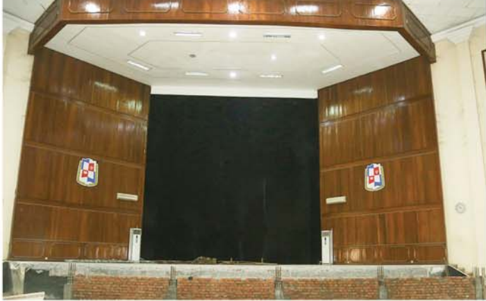
တာဝန်ရှိသူများအား ဖွဲ့ကြားပြီး ရှင်းလင်းတင်ပြချက်များအပေါ် လိုအပ်သည်များကို ဖြည့်စွက်ဆောင်ရွက်ပေးခဲ့ကြောင်း သိရသည်။