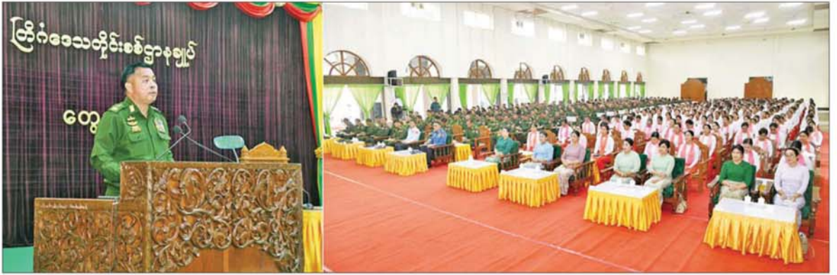
တပ်မတော်ကာကွယ်ရေးဦးစီးချုပ် ဗိုလ်ချုပ်ကြီး ရဲဝင်းဦး ကျိုင်းတုံတပ်နယ်မှ အရာရှိ၊ စစ်သည်၊ မိသားစုများအား တွေ့ဆုံအမှာစကားပြောကြားစဉ်။

နေပြည်တော် ဧပြီ ၂၃ တပ်မတော်ကာကွယ်ရေးဦးစီးချုပ် ဗိုလ်ချုပ်ကြီး ရဲဝင်းဦးသည် ယမန်နေ့ မွန်းလွဲပိုင်းတွင် ကျိုင်းတုံတပ်နယ်မှ အရာရှိ၊ စစ်သည်၊ မိသားစုများအား တိုင်းစစ်ဌာနချုပ် ပြည်ငြိမ်းအေးခန်းမ၌လည်းကောင်း၊ ယနေ့ မွန်းလွဲပိုင်းတွင် မိုင်းခတ်နှင့် မိုင်းယန်းတပ်နယ်မှ အရာရှိ၊ စစ်သည်၊ မိသားစုများအား မိုင်းခတ်တပ်နယ်ခန်းမ၌လည်းကောင်း သီးခြားစီ တွေ့ဆုံအမှာစကားပြောကြားသည်။