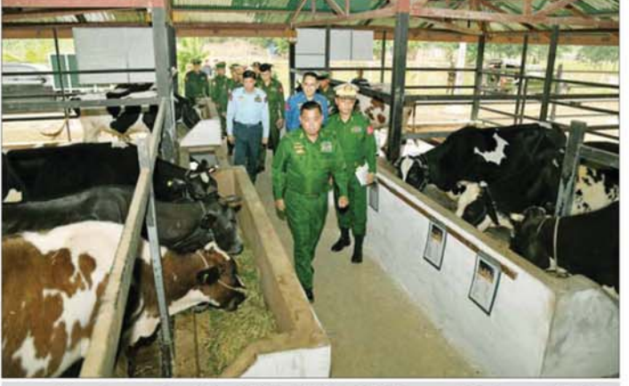
တပ်မတော်ကာကွယ်ရေးဦးစီးချုပ် ဗိုလ်ချုပ်ကြီး ရဲဝင်းဦး ကြိတ်ဒေသတိုင်းစစ်ဌာနချုပ် စိုက်ပျိုး/မွေးမြူရေးဇုန်တွင် ကြည့်ရှုစစ်ဆေးစဉ်။

တပ်မတော် အနေဖြင့် တပ်မတော်သားများနှင့် မိသားစုဝင်များ၏ သက်သာချောင်ချိရေးအတွက် နေရေး၊ စားရေး၊ ဝတ်ရေး၊ ကျန်းမာရေးနှင့် အခြားအထွေထွေလိုအပ်ချက်များကို တတ်စွမ်းသရွေ အမြဲပြတ်ဖြည့်ဆည်းပေးလျက်ရှိပြီး ထိုကဲ့သို့သည့် ချီးမြှင့်မှုများနှင့်လိုအပ်သည့် သက်သာချောင်ချိရေး ကိစ္စပုံများကို စာမျက်နှာ ၆ သို့ ။