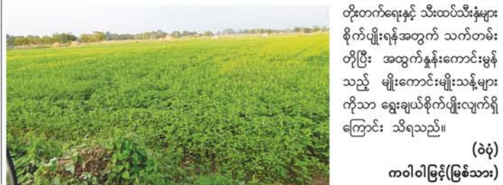
(ဝဲပုံ) ကာကွယ်ရေး(မြစ်သား)

လျက်ရှိသည်။ ထိုသို့ ပင်စင်လစာပျား ထုတ်ပေးရာတွင် အကြောင်းအမျိုးမျိုးကြောင့် ကာယကံရှင်ကိုယ်တိုင် လာရောက်ထုတ်ယူနိုင်ခြင်း မရှိသူများ အနေဖြင့်လည်း မိသားစုဝင်တစ်ဦးဦးက ကိုယ်စားလှယ်လွှဲစာဖြင့် ကိုယ်စားထုတ်ယူနိုင်ကြောင်း၊ ကံမမြို့နယ်တွင် မြို့ပြပင်စင် ၆၁၈ ဦး၊ ကာကွယ်ရေး