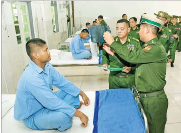
တပ်မတော်ကာကွယ်ရေးဦးစီးချုပ် ဗိုလ်ချုပ်ကြီးရဲဝင်းဦး၊ မကွေးမြို့ရှိ နယ်မြေခံတပ်မတော်ဆေးရုံတွင် တက်ရောက်ဆေးကုသမှုခံယူလျက်ရှိသည့် အရာရှိ၊ စစ်သည်များအား ရင်းရင်းနှီးနှီး အားပေးစကား ပြောကြားစဉ်။

ထောက်ပံ့ပစ္စည်းများနှင့် ဆေးရုံ အတွက် အလှူငွေများ ပေးအပ် သည်။ ထို့နောက်တပ်မတော်ကာကွယ် ရေးဦးစီးချုပ်နှင့် အဖွဲ့ဝင်များသည် ဆေးရုံအတွင်း လှည့်လည်ကြည့်ရှု စစ်ဆေးကြပြီး လိုအပ်သည်များ လမ်းညွှန်မှာကြားခဲ့ကြောင်း သိရ သည်။ သတင်းစဉ်