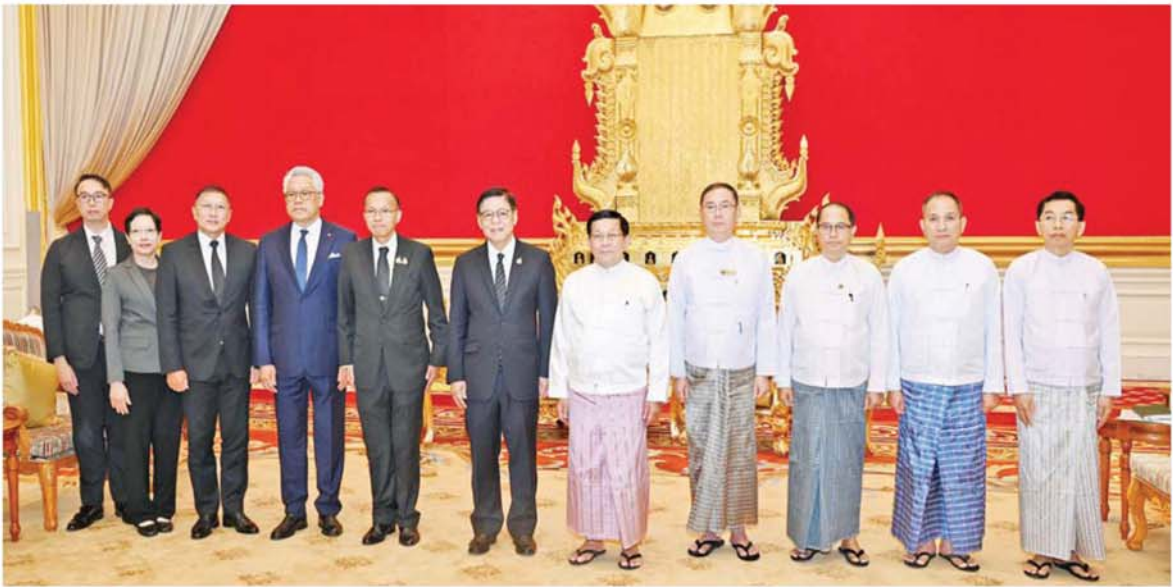
ပြည်ထောင်စုသမ္မတမြန်မာနိုင်ငံတော် နိုင်ငံတော်သမ္မတ ဦးမင်းအောင်လှိုင် ထိုင်းနိုင်ငံ ဒုတိယဝန်ကြီးချုပ်နှင့် နိုင်ငံခြားရေးဝန်ကြီး H.E. Mr. Sihasak Phuangketkaew ဦးဆောင်သော ကိုယ်စားလှယ်အဖွဲ့နှင့်အတူ စုပေါင်းမှတ်တမ်းတင်ဓာတ်ပုံရိုက်စဉ်။