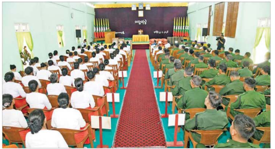
တပ်မတော်ကာကွယ်ရေးဦးစီးချုပ် ဗိုလ်ချုပ်ကြီး ရဲဝင်းဦး မကွေးတပ်နယ်ရှိ အရာရှိ၊ စစ်သည်၊ မိသားစုများအား တွေ့ဆုံ အမှာစကားပြောကြားစဉ်။

စစ်ပညာ၏ အခြေခံသည် စစ်ရေးပြပင်ဖြစ်ပြီး အဓိကနံ့ခံတတ်မှုနှင့် စစ်စည်းကမ်းကောင်းမွန်စေမှုအတွက် ရည်ရွယ်လေ့ကျင့်ပေးခြင်းဖြစ်၍ စစ်ကျောင်းကြီးများအနေဖြင့် စနစ်တကျ လေ့ကျင့်ပေးသွားရန်လိုကြောင်း၊ အဓိကနံ့ခံတတ်မှုတွင် တစ်ဦးချင်းနှင့်အဖွဲ့လိုက်ဟူ၍ရှိပြီး မိမိတို့ တပ်မတော်အနေဖြင့် အဖွဲ့စနစ်ဖြင့် ဆောင်ရွက်ခြင်းဖြစ်သောကြောင့် တစ်ဦးချင်းစွမ်းရည်များ စုပေါင်းပြီး အဖွဲ့အစည်း၏ စွမ်းရည်များ ရရှိအောင် တည်ဆောက်ခြင်းဖြစ်ကြောင်း။