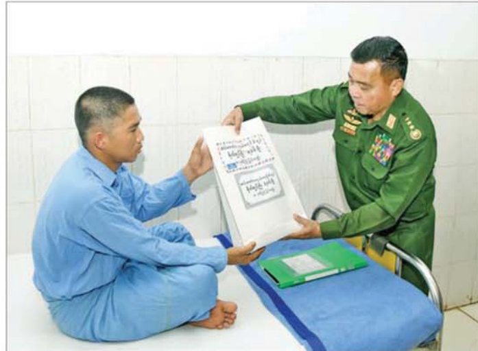
တပ်မတော်ကာကွယ်ရေးဦးစီးချုပ် ဗိုလ်ချုပ်ကြီးရဲဝင်းဦး၊ မကွေးမြို့ရှိ နယ်မြေခံတပ်မတော်ဆေးရုံတွင် တက်ရောက်ဆေးကုသမှုခံယူလျက်ရှိသည့် အရာရှိ၊ စစ်သည်များအား ဂုဏ်ပြုချီးမြှင့်ငွေများ ပေးအပ်စဉ်။

★ စာမျက်နှာ ၄ မှ ပြည်သူနှင့် တပ်မတော်ဆို သည့်မှာ ခွဲခြား၍မရဘဲ ပြည်သူနှင့် တပ်မတော်သည် ချစ်ချစ်ခင်ခင် နှင့် စည်းစည်းလုံးလုံးရှိနေစေရန် လုပ်ဆောင်ရမည် ဖြစ်ကြောင်း၊ မိမိတို့နိုင်ငံတွင် တပ်မတော်သည် နိုင်ငံတော် ကာကွယ်ရေးအတွက် (၂၄)နာရီတာဝန်ရှိပြီး ပြည်သူ့ အကျိုးစီးပွားကို ဖော်ဆောင်ပေး ရမည်ဖြစ်ကြောင်း၊ တပ်မတော် သည် ပြည်သူများက ပေါက်ဖွား