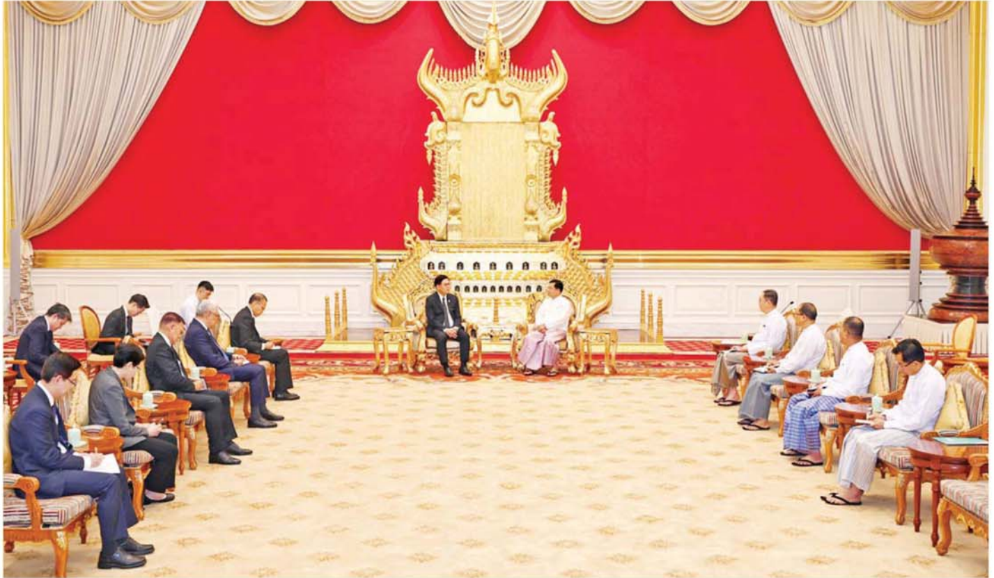
ပြည်ထောင်စုသမ္မတမြန်မာနိုင်ငံတော် နိုင်ငံတော်သမ္မတ ဦးမင်းအောင်လှိုင် ထိုင်းနိုင်ငံ ဒုတိယဝန်ကြီးချုပ်နှင့် နိုင်ငံခြားရေးဝန်ကြီး H.E. Mr. Sihesak Phuanketkaew ဦးဆောင်သော ကိုယ်စားလှယ်အဖွဲ့အား လက်ခံတွေ့ဆုံစဉ်။

အတွဲ(၂၉)၊ အမှတ်(၁၃၆)၊ ၁၃၈၈ ခုနှစ်၊ ကဆုန်လဆန်း ၈ ရက်၊ ၂၃-၄-၂၀၂၆၊ ကြာသပတေးနေ့။