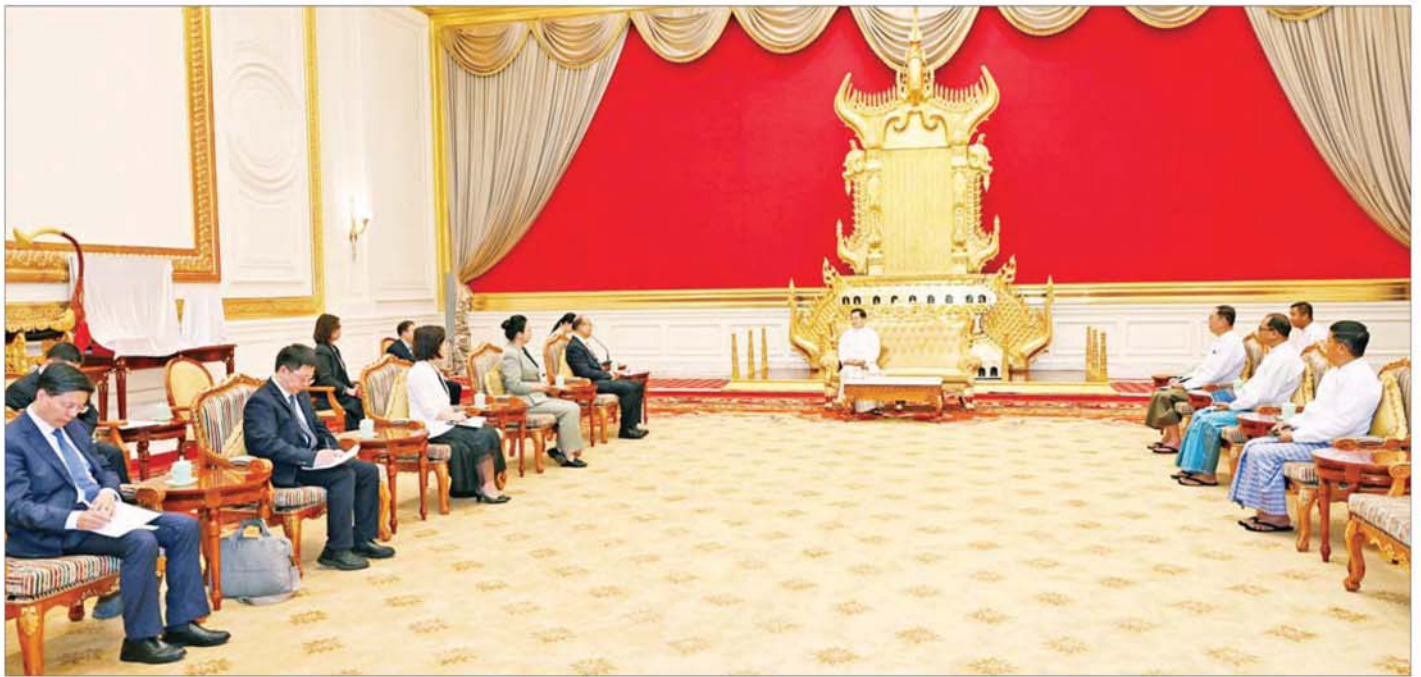
ပြည်ထောင်စုသမ္မတမြန်မာနိုင်ငံတော် နိုင်ငံတော်သမ္မတ ဦးမင်းအောင်လှိုင် တရုတ်ပြည်သူ့သမ္မတနိုင်ငံ ဟေလုံကျွန်းပြည်နယ် ပြည်သူ့ကွန်ဂရက်အမြဲတမ်းကော်မတီဥက္ကဋ္ဌနှင့် တရုတ်ကွန်မြူနစ်ပါတီ၏ ဟေလုံကျွန်းပြည်နယ်ဆိုင်ရာကော်မတီ အတွင်းရေးမှူး H.E. Mr. Xu Qin ဦးဆောင်သော ကိုယ်စားလှယ်အဖွဲ့အား လက်ခံတွေ့ဆုံစဉ်။