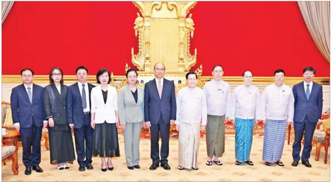
ပြည်ထောင်စုသမ္မတမြန်မာနိုင်ငံတော် နိုင်ငံတော်သမ္မတ ဦးမင်းအောင်လှိုင် တရုတ်ပြည်သူ့သမ္မတနိုင်ငံ ဟေလုံကျွန်းပြည်နယ် ပြည်သူ့ကွန်ဂရက် အမြဲတမ်းကော်မတီ ဥက္ကဋ္ဌနှင့် တရုတ်ကွန်မြူနစ်ပါတီ၏ ဟေလုံကျွန်းပြည်နယ်ဆိုင်ရာကော်မတီ အတွင်းရေးမှူး H.E. Mr. Xu Qin ဦးဆောင်သော ကိုယ်စားလှယ်အဖွဲ့နှင့်အတူ စုပေါင်းမှတ်တမ်းတင် ဓာတ်ပုံရိုက်စဉ်။

ထိုသို့တွေ့ဆုံရာတွင် နှစ်နိုင်ငံနှင့် နှစ်နိုင်ငံ ခေါင်းဆောင်များအကြား ချစ်ကြည်ရင်းနှီးမှုနှင့် ပူးပေါင်းဆောင်ရွက်မှုများ ရှည်ကြာကောင်းမွန်ခဲ့ပြီး ဆွေးနွေးပေါက်ဖော် ချစ်ကြည်ရေးရှိသည့် အခြေအနေများ၊ နှစ်နိုင်ငံအကြား ငြိမ်းချမ်းစွာ အတူယှဉ်တွဲနေထိုင်ရေး မှုကြီး(၅)ရပ်နှင့်အညီ အေးအတူ ပူအမျှ အသိုက်အဝန်း တည်ဆောက်လျက်ရှိမှု အခြေအနေများ၊ မြန်မာနိုင်ငံနှင့် ဟေလုံ ကျွန်းပြည်နယ်တို့အကြား ပူးပေါင်း ဆောင်ရွက်မှုများမြှင့်တင်ပြီး နှစ်နိုင်ငံ ဆက်ဆံရေးကို ပိုမိုမြှင့်တင်ဆောင်ရွက် နိုင်မှုအခြေအနေများ၊ နှစ်နိုင်ငံဆိုင်ရာ ခေါင်းဆောင်များ ချစ်ကြည်ရေးခရီးစဉ် များ အပြန်အလှန်လည်ပတ်ခဲ့မှုအခြေ အနေများ၊ သိပ္ပံနှင့်နည်းပညာကဏ္ဍ၊ စက်မှုကဏ္ဍ၊ စိုက်ပျိုးရေးကဏ္ဍ၊ လုံခြုံရေး ကဏ္ဍ၊ ခရီးသွားလာရေးကဏ္ဍ၊ ကျန်းမာ ရေးကဏ္ဍ၊ ယဉ်ကျေးမှုကဏ္ဍ၊ လူငယ် ကဏ္ဍနှင့် ပညာရေးကဏ္ဍများအပါအဝင် ကဏ္ဍပေါင်းစုံ၌ ပူးပေါင်းဆောင်ရွက်မှု များ ပိုမိုမြှင့်တင်ဆောင်ရွက်သွားမည့် အခြေအနေများ၊ စိုက်ပျိုးရေးလုပ်ငန်းများ တိုးတက်စေရေး နှစ်နိုင်ငံအကြား လယ်ယာထုတ်ကုန်ပစ္စည်းများ ထုတ်လုပ် ရေးနှင့် စိုက်ပျိုးရေးနည်းပညာများ တိုးတက်စေရေး ပူးပေါင်းဆောင်ရွက်နိုင်