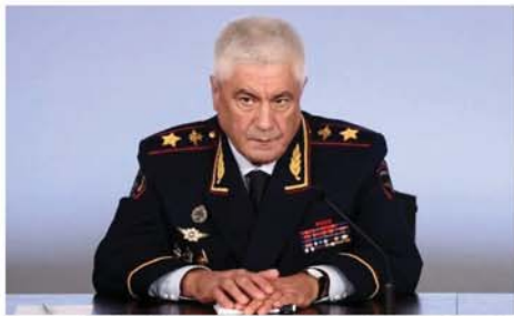
မော်စကို ဧပြီ ၂၁ ရုရှားပြည်ထဲရေးဝန်ကြီး

ပူးပေါင်းဆောင်ရွက်ရေးဆိုင်ရာ ကိစ္စရပ်များကို ဆွေးနွေးရန် အတွက် မြောက်ကိုရီးယားနိုင်ငံသို့ ရောက်ရှိလာသည်ဟု ဝန်ကြီးဌာန ပြောရေးဆိုခွင့်ရှိသူ အီနိုဗာဗာလ်စ်က အတည်ပြုပြောကြားကြောင်း စီအင်န်အေသတင်းဌာနက ဖော်ပြသည်။ ရုရှားနှင့်မြောက်ကိုရီးယား နှစ်နိုင်ငံအကြား တရားဥပဒေစိုးမိုးရေးနယ်ပယ်တွင် ပူးပေါင်းဆောင်ရွက်မည့် ကိစ္စရပ်များကို ထည့်သွင်းစဉ်းစား ဆွေးနွေးသွားမည် ဟုလည်း ဗောလ်စ်က တယ်လီဂရမ်လူမှုကွန်ရက်တွင် ရေးသားလွှင့်တင်ထားသည်။ မြောက်ကိုရီးယားနိုင်ငံ ပြုလုပ်သည့် ဝန်ကြီးအား လာရောက်ကြိုဆိုနေသည့် ဓာတ်ပုံများကိုလည်း တယ်လီဂရမ်တွင် ဖော်ပြထားကြောင်း သိရသည်။ Mon