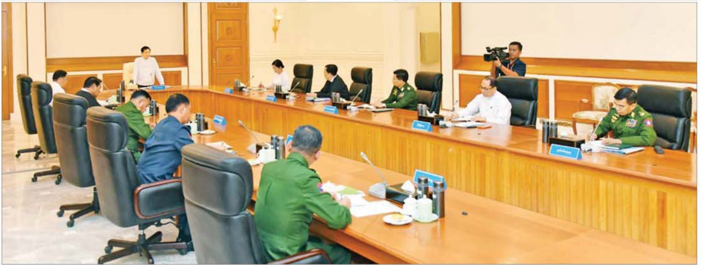
နိုင်ငံတော်သမ္မတ ဦးမင်းအောင်လှိုင် ပြည်ထောင်စုသမ္မတမြန်မာနိုင်ငံတော် အမျိုးသားကာကွယ်ရေးနှင့် လုံခြုံရေးကောင်စီအစည်းအဝေးတွင် အမှာစကားပြောကြားစဉ်။