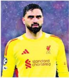
လန်ဒန် ဧပြီ ၂၁

လီဗာပူးအသင်း ရိုးသမား ရော်ဂျီဟာမာဒက်ဂိုပီလီသည် ခြေထောက်ဒဏ်ရာကြောင့် ကာလရှည်အနားယူရမည်။ အဆိုပါ ရိုးသမားသည် လီဗာပူးအသင်းက အဲဗာတန်