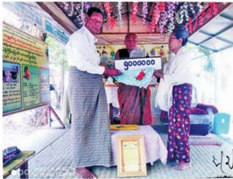
မန္တလေး ဧပြီ ၂၀ မန္တလေး၊ တောင်စလင်း အဘိဓဇအဂ္ဂမဟာသဒ္ဓမ္မဓေတီက တိုက်သစ်ဘာဝနာဌာန ပဓာန ဦးဆောင်သည့် နယ်စပ်တောင်တန်း