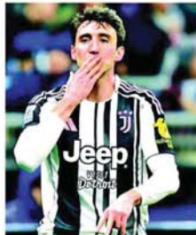
လန်ဒန် ၁ ဇူလိုင် ၂၀

အာဆင်နယ်အသင်းသည် ဂျူဗင်တပ်အသင်း နောက်ခံကစားသမား ကမ်ဘီယာဆိုအား ခေါ်ယူရန် စီစဉ်လျက်ရှိသည်။ အသက်(၂၆)နှစ်အရွယ်ရှိ နောက်ခံကစားသမားသည် ဂျူဗင်တပ်အသင်းနှင့်အတူ ယခုနှစ်