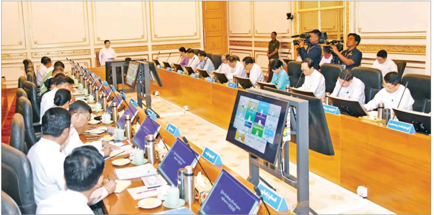
ပြည်ထောင်စုသမ္မတမြန်မာနိုင်ငံတော် နိုင်ငံတော်သမ္မတ ဦးမင်းအောင်လှိုင် ပြည်ထောင်စုအစိုးရအဖွဲ့အစည်းအဝေးတွင် အမှာစကားပြောကြားစဉ်။

(သစ္စာလေးပါးဟူသည်ကား) ဆင်းရဲအမှန်ဖြစ်သော ဒုက္ခသစ္စာ၊ ဆင်းရဲခြင်း၏ အကြောင်းရင်းအမှန်ဖြစ်သော သမုဒယသစ္စာ၊ ဆင်းရဲမှ လွတ်မြောက်ရာအမှန်ဖြစ်သော နိရောဓသစ္စာ၊ ဆင်းရဲခြင်းရာ နိဗ္ဗာန်သို့ရောက်ကြောင်း အစစ်ဖြစ်၍ မြတ်သော အင်္ဂါရုပ်ပါးနှင့် ပြည့်စုံသော မဂ္ဂသစ္စာ။ (ဤလေးပါးတည်း။) (ဓမ္မပဒ)