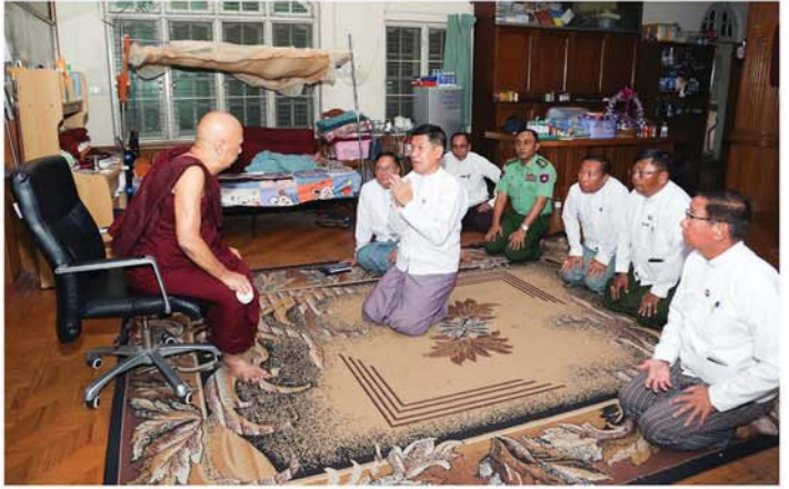
(မန္တလေးနေ့စဉ်)

မန္တလေး ဧပြီ ၂၀ ချမ်းအေးသာစံမြို့နယ်ရှိ မဟာဝိတောရုံပရိယတ္တိစာသင်တိုက်တွင် သီတင်းသုံးတော်မူနေသည့် မဟာဝိတောရုံပရိယတ္တိစာသင်တိုက်၏ ဦးစီးပဓာနနာယက၊ နိုင်ငံတော်သြဝါဒါစရိယ အဘိဓမ္မဟာရဋ္ဌဂုရု၊ အဘိဓမ္မ အဂ္ဂမဟာသဒ္ဓမ္မဇောတိက ဘဒ္ဒန္တဝိစာရိန္ဒာဘိဝံသ သက်တော်ရှည်ဆရာတော်ကြီးအား မန္တလေးတိုင်းဒေသကြီးဝန်ကြီးချုပ် ဦးမျိုးအောင်နှင့်အဖွဲ့က သွားရောက် ပူးပေါင်းခဲ့သည်။ ဦးစွာ သက်တော်ရှည် ဆရာတော်ကြီး သီတင်းသုံးနေတော်မူသည့် မဟာဝိတောရုံ ပရိယတ္တိစာသင်တိုက်ရှိ မူလသိမ်ကျောင်းတော်ကြီးသို့ သွားရောက်ပြီး သက်တော်ရှည်ဆရာတော်ကြီး၏ ကျန်းမာရေးကို အနီးကပ်ပြုစုစောင့်ရှောက်ပေးနေသည့် ပရိယတ္တိစာသင်တိုက် တိုက်အုပ်ဆရာတော် မဟာဂန္ထဝါစကပဏ္ဍိတ ဘဒ္ဒန္တယာနိကအား တိုင်းဒေသကြီးဝန်ကြီးချုပ်နှင့် အဖွဲ့က ပူးပေါင်းပြီး တိုက်အုပ်ဆရာတော်အား တိုင်းဒေသကြီး ဝန်ကြီးချုပ်က လှူဖွယ်