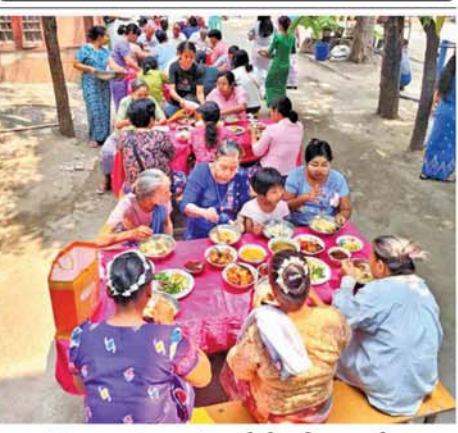
သုအပေါင်းအား နံနက်စာဝတ်မင်း၊ စပ်ဝန်းကျင်များမှ လှူဦးရေ ၃၀၀ ဟင်းလျာ၊ အချိုပြုများဖြင့် တည် ကျော်အား ထမင်း၊ ဟင်းများ စတုဒိသာ ကျေးမွေးလှူဒါန်းခဲ့ ခင်းစဉ်ခံခြင်း၊ ရပ်ကွက်နှင့် ထိ ကြောင်း သိရသည်။ (၀၇၀)

မန္တလေး ဧပြီ ၂၀ အိမ်ခြံမြေအကျိုးဆောင်ကုမ္ပဏီ) ပြင်ဦးလွင်မြို့နှင့် ဆွေမျိုးသား ချင်းများ၊ ပုလဲမြင့်ဘုန်းတော်ကြီး သင် အလယ်တန်းကျောင်းမှ ဆရာ၊ ဆရာမများ၊ ကျောင်းသား၊ ကျောင်းသူများ၊ ဖိတ်ကြားထား သူများ၊ ဝေယျာဝစ္စဆောင်ရွက်သူ များ တက်ရောက်ကြည့်ညိုကြ သည်။ (ယာပုံ) အခမ်းအနားတွင် ကျောင်း အုပ်ဆရာတော်ဘဒ္ဒန္တနန္ဒသာရထံမှ ပရိသတ်များက သီလခံယူဆောင် တည်ကြပြီး ဆရာတော်၊ သံဃာ တော်များအား နဝကမ္မဝတ္ထုငွေ၊ သင်္ကန်းနှင့် လှူဖွယ်များ၊ ဆွမ်း ဆက်ကပ်လှူဒါန်းခြင်းများ ဆောင် ရွက်ကြသည်။ ထို့နောက် တက်ရောက်လာ