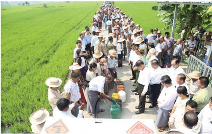
မန္တလေး၊ ဧပြီ ၂၀

လျှပ်စစ်နှင့်စွမ်းအင်ဝန်ကြီးဌာန၊ စိုက်ပျိုးရေး၊ မွေးမြူရေးနှင့်ဆည်မြောင်းဝန်ကြီးဌာန၊ မန္တလေးတိုင်းဒေသကြီးအစိုးရအဖွဲ့တို့နှင့် ပူးပေါင်း၍ ပြည်တွင်းထုတ် ဒီဇယ်ဆီများကို ဆီသယ်ယာဉ်ဖြင့် မန္တလေးတိုင်းဒေသကြီး၊ အမရပူရခရိုင်အတွင်းရှိ နွေစပါးစိုက်ကေကျန်ရှိသည့် တောင်သူများအား အထူးသက်သာသည့်ဈေးနှုန်းဖြင့် တိုက်ရိုက်ဖြန့်ဖြူးရောင်းချပေးနေသည့် တမာ့စိုက်ကေများအုပ်စု စုရပ်သို့ မန္တလေးတိုင်းဒေသကြီး ဝန်ကြီးချုပ် ဦးမျိုးအောင်၊ အစိုးရအဖွဲ့ဝင် ဝန်ကြီးများနှင့် တာဝန်ရှိသူများသည် ယနေ့နံနက်ပိုင်းက သွားရောက်ကြည့်ရှုအားပေးခဲ့သည်။