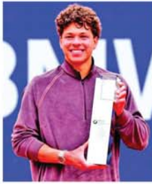
နောက်ထပ်လည်း ယခုလိုဆုတွေ အပြင် နိုင်ငံအတွက် ဂုဏ်ဆောင်နိုင်ဖို့ ဆက်လက်ကြိုးစားသွားမှာပါ ဟု ပြောသည်။

Bitpanda တမ်းနစ်ပြိုင်ပွဲ ဝိုလ်လုပွဲအဆင့်တွင် အီတလီတမ်းနစ်ကစားသမား Flavio Cobolli အား ၆-၂၊ ၇-၅ ဖြင့် အနိုင်ရရှိကာ ချန်ပီယံဆုကို ဆွတ်ခူးခဲ့ခြင်းဖြစ်သည်။ (ယာဝဲ) အသက်(၂၃)နှစ်အရွယ်ရှိ Ben Shelton က ကျွန်တော်အခုလို 2026 Rolex Monte-Carlo Masters တမ်းနစ်ပြိုင်ပွဲ ချန်ပီယံဆုကို ဆွတ်ခူးနိုင်ခဲ့လို့ အတိုင်းမသိ ဂုဏ်ယူမိပါတယ်။