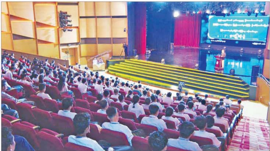
ပြည်သူ့လွှတ်တော် ဒုတိယဥက္ကဋ္ဌ ဦးမောင်မောင်အုန်း မြန်မာ့အသံနှင့် ရုပ်မြင်သံကြား၌ ဝန်ထမ်းများအား တွေ့ဆုံအမှာစကား ပြောကြားစဉ်။

ထို့နောက် ပြည်သူ့လွှတ်တော် ဒုတိယဥက္ကဋ္ဌ ဦးမောင်မောင်အုန်း က အဖွင့်အမှာစကား ပြောကြား ရာတွင် ယနေ့အချိန်အခါသည်