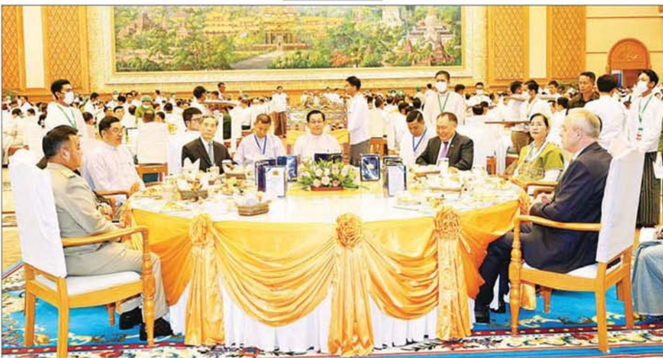
နိုင်ငံတော်သမ္မတ ဦးမင်းအောင်လှိုင် တတိယအကြိမ် လွှတ်တော်များ၏ ပထမပုံမှန်အစည်းအဝေးများ အောင်မြင်စွာပြီးမြောက်ခြင်း ဂုဏ်ပြုနေ့လယ်စာစားပွဲသို့ တက်ရောက်စဉ်။

ပြည်ထောင်စု လွှတ်တော်ဆိုသည်မှာ ပြည်သူ့လွှတ်တော်နှင့် အမျိုးသားလွှတ်တော်တို့ ပူးတွဲဆောင်ရွက်ကြသည့် လွှတ်တော်ဖြစ်သည်နှင့်အညီ နိုင်ငံတော်၏ အမျိုးသားအကျိုးစီးပွား၊ နိုင်ငံတော်နှင့် နိုင်ငံသားများ၏ အကျိုးစီးပွားကို ဖော်ဆောင်နိုင်ရန် အတွက် လက်တွဲညီညွတ် ဆောင်ရွက်သွားကြရမည် ဖြစ်ပါကြောင်း၊ ဖွဲ့စည်းပုံအခြေခံဥပဒေ ပုဒ်မ ၁၁၊ ပုဒ်မ ၉၇ (က) တွင် နိုင်ငံတော်၏ ခက်မသုံးဖြာဖြစ်သည့် ဥပဒေပြုရေးအာဏာ၊ အုပ်ချုပ်ရေးအာဏာနှင့် တရားစီရင်ရေးအာဏာများကို တတ်နိုင်သမျှ ပိုင်းခြားသုံးစွဲခြင်းနှင့် အချင်းချင်း အပြန်အလှန် ထိန်းကျောင်းခြင်းတို့ ပြုသည်ဆိုသည့် ပြဋ္ဌာန်းချက်အရ အချင်းချင်း အပြန်အလှန်ထိန်းကျောင်းသည့် ဆိုင်ရာတွင်လည်း ကဏ္ဍရပ် တစ်ခုကို အခြားကဏ္ဍရပ်တစ်ခုက ထိပါရန်မဟုတ်ဘဲ ဥပဒေနှင့်အညီ လျော်ကန်သင့်မြတ်မှုရှိရေး အပြုသဘောအမြင်များနှင့် ဆောင်ရွက်သွားကြရန်သာ ဖြစ်ပါကြောင်း။