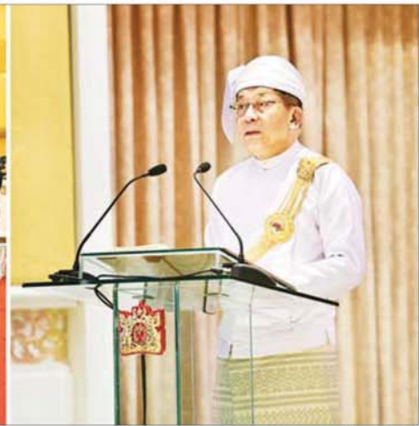
နိုင်ငံတော်သမ္မတ၏ မိန့်ခွန်းနာခံခြင်းနှင့် ကတိသစ္စာပြုခြင်းအခမ်းအနားတွင် ပြည်ထောင်စုသမ္မတမြန်မာနိုင်ငံတော် နိုင်ငံတော်သမ္မတ ဦးမင်းအောင်လှိုင် မိန့်ခွန်းပြောကြားစဉ်။