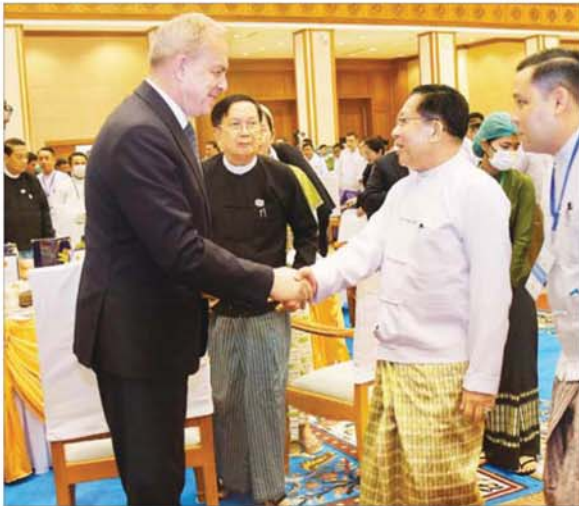
နိုင်ငံတော်သမ္မတ ဦးမင်းအောင်လှိုင် တတိယအကြိမ် လွှတ်တော်များ၏ ပထမပုံမှန်အစည်းအဝေးများ အောင်မြင်စွာပြီးမြောက်ခြင်း ဂုဏ်ပြုနေ့လယ်စာစားပွဲတွင် တက်ရောက်လာကြသည့် နိုင်ငံတကာမှ သံတမန်များအား ရင်းရင်းနှီးနှီးနှုတ်ဆက်စဉ်။

ဖွဲ့စည်းပုံအခြေခံဥပဒေပုဒ်မ ၁၂ အရ ပြည်ထောင်စုလွှတ်တော်တွင် ဥပဒေပြုရေး အာဏာရှိပြီး ပုဒ်မ ၉၆ အရ ဇယား (၁) တွင် ပါရှိသည့် ကိစ္စရပ်များကို ဥပဒေပြုနှင့်ရရှိခြင်းကြောင့် ဇယား (၁) တွင်ပါရှိသည့် ကဏ္ဍရပ်၊ ကိစ္စရပ်များကို ထံထံဝင်ဝင် လေ့လာထားကြရန် လိုအပ်ပါကြောင်း၊ ထို့ကြောင့် ဥပဒေကြမ်းရေးဆွဲရာ ဆိုင်ရာ သဘောလက္ခဏာများ၊ ဥပဒေရေးထုံးများကိုလည်း လေ့လာထားကြရန် လိုအပ်ပါကြောင်း၊ ယခုကျင်းပပြီးစီးခဲ့သည့် လွှတ်တော် အစည်းအဝေးများတွင် ဥပဒေပြုရေး၊ အုပ်ချုပ်ရေး၊ တရားစီရင်ရေးဆိုင်ရာ ကိစ္စရပ်များနှင့် စပ်လျဉ်းပြီး ပြည်ထောင်စုလွှတ်တော်မှ နိုင်ငံတော်သမ္မတနှင့် ဒုတိယသမ္မတများ ရွေးချယ်တင်မြှောက်ပေးခြင်း၊ အစိုးရအဖွဲ့ ဖွဲ့စည်းနိုင်ရေး ဆောင်ရွက်ပေးခြင်း၊ လွှတ်တော်ကော်မတီများ ဖွဲ့စည်းခြင်း၊ တရားရေးရာ အဖွဲ့အစည်းများ ပေါ်ပေါက်လာရေး ဆောင်ရွက်ပေးခြင်း စသည်