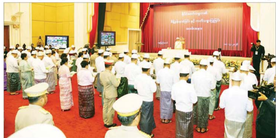
ပြည်ထောင်စုရာထူးဝန်အဖွဲ့ဥက္ကဋ္ဌ၊ နေပြည်တော်ကောင်စီဥက္ကဋ္ဌ၊ ဒုတိယဝန်ကြီးများ၊ ဒုတိယစာရင်းစစ်ချုပ်၊ ပြည်ထောင်စုရာထူးဝန်အဖွဲ့ အဖွဲ့ဝင်များနှင့် နေပြည်တော်ကောင်စီအဖွဲ့ဝင်များအဖြစ် ခန့်အပ်တာဝန်ပေးရန် ရွေးချယ်ထားသော ပုဂ္ဂိုလ်များ နိုင်ငံတော်သမ္မတ၏ ရှေ့မှောက်၌ ကတိသစ္စာပြုကြစဉ်။

၏ရှေ့မှောက်၌ နေရာယူကြသည်။ ထို့နောက် နိုင်ငံတော်သမ္မတရုံးဝန်ကြီး ဦးတင်အောင်စန်းက ကတိသစ္စာကို တိုင်ပေးပြီး ကတိသစ္စာပြုသည့် ပုဂ္ဂိုလ်အားလုံးက “ကျွန်ုပ် ----- သည် ပြည်ထောင်စုသမ္မတ မြန်မာနိုင်ငံတော်နှင့် နိုင်ငံသားများအပေါ် သစ္စာစောင့်သိရှိသောပြီး ပြည်ထောင်စုမပြိုကွဲရေး၊ တိုင်းရင်းသားစည်းလုံးညီညွတ်မှု မပြိုကွဲရေး၊ အချုပ်အခြာအာဏာ တည်တံ့ခိုင်မြဲရေးတို့ကို ထာဝစဉ်ဦးထိပ်ပန်ဆင်ဆောင်ရွက်ပါမည်။ ကျွန်ုပ်သည် ဖွဲ့စည်းပုံအခြေခံဥပဒေနှင့် နိုင်ငံတော်၏ တရားဥပဒေများကို ထိန်းသိမ်းစောင့်ရှောက်ပါမည်။ ကျွန်ုပ်ထမ်းဆောင်ရမည့် တာဝန်ဝတ္တရားများကို ဖြောင့်မတ်မှန်ကန်စွာဖြင့် ကိုယ်စွမ်းရှိသရွေ့ ဉာဏ်စွမ်းရှိသရွေ့ အစွမ်းကုန် ထမ်းဆောင်ပါမည်ဟု စာမျက်နှာ ၇ သို့