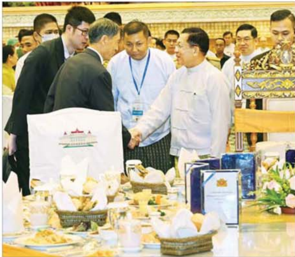
နိုင်ငံတော်သမ္မတ ဦးမင်းအောင်လှိုင် တတိယအကြိမ် လွှတ်တော်များ၏ ပထမပုံမှန်အစည်းအဝေးများ အောင်မြင်စွာပြီးမြောက်ခြင်း ဂုဏ်ပြုနေ့လယ်စာစားပွဲတွင် တက်ရောက်လာကြသည့် နိုင်ငံတကာမှ သံတမန်များအား ရင်းရင်းနှီးနှီးနှုတ်ဆက်စဉ်။

တို့ကို ဆောင်ရွက်ပေးနိုင်ခဲ့သည့် အတွက်လည်း လွှတ်တော်ကိုယ်စားလှယ်များ တင်ပြဆွေးနွေး အတည်ပြုကြသည့် ချွေးစွာ ဂုဏ်ယူဝမ်းမြောက်မိပါကြောင်း။