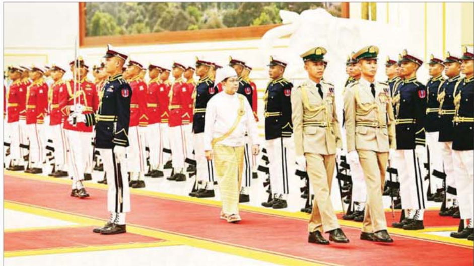
ပြည်ထောင်စုသမ္မတမြန်မာနိုင်ငံတော် နိုင်ငံတော်သမ္မတ ဦးမင်းအောင်လှိုင် ဂုဏ်ပြုတပ်ဖွဲ့အား စစ်ဆေးစဉ်။

ဦးစွာ နိုင်ငံတော်သမ္မတ ဦးမင်းအောင်လှိုင် လိုက်ပါလာသည့် အထူးယာဉ်တန်းသည် ဂုဏ်ပြုခြင်းစီးတပ်ဖွဲ့၏ ဦးဆောင်ကြိုဆိုမှုဖြင့် နိုင်ငံတော်သမ္မတ၏ ဧည့်ဆောင်တော်ရှိ ဂုဏ်ပြုဆောင်ခန်းမကြီးသို့ ရောက်ရှိလာရာ ဒုတိယသမ္မတ ဦးညိုစော၊ နိုင်ငံတော်သမ္မတရုံး ပြည်ထောင်စုဝန်ကြီး ဦးခင်မောင်ရီတို့က ကြိုဆိုနှုတ်ဆက်ကြသည်။ ထို့နောက် နိုင်ငံတော်သမ္မတ ဦးမင်းအောင်လှိုင်သည် ဂုဏ်ပြုခံစင်မြင့်၌နေရာယူပြီး ဂုဏ်ပြုတပ်ဖွဲ့၏ အလေးပြုခြင်းကို ခံယူသည်။ ထိုသို့ ဂုဏ်ပြုတပ်ဖွဲ့၏ အလေးပြုခြင်းကို ခံယူနေချိန်တွင် ဂုဏ်ပြုအမြောက်တပ်ဖွဲ့မှလည်း အမြောက် ၂၁ ချက်ကို စစ်ရေးပြအခမ်းအနားဖြင့် ဂုဏ်ပြုပစ်ဖောက်သည်။