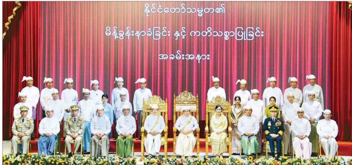
ပြည်ထောင်စုသမ္မတမြန်မာနိုင်ငံတော် နိုင်ငံတော်သမ္မတ ဦးမင်းအောင်လှိုင်၊ ဒုတိယသမ္မတများဖြစ်ကြသည့် ဦးညိုစောနှင့် ဒေါ်နန်းနီနီအေးတို့ အမျိုးသားကာကွယ်ရေးနှင့် လုံခြုံရေးကောင်စီအဖွဲ့ဝင်များနှင့်အတူ စုပေါင်းမှတ်တမ်းတင်ဓာတ်ပုံရိုက်စဉ်။