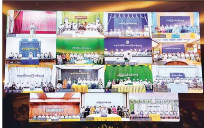
တိုင်းဒေသကြီး၊ ပြည်နယ်ဝန်ကြီးချုပ်များနှင့် အစိုးရအဖွဲ့ဝင်များက Video Conferencing ဖြင့် တက်ရောက်ကြစဉ်။

ထို့နောက် နိုင်ငံတော်သမ္မတ ဦးမင်းအောင်လှိုင်သည် နိုင်ငံတော်သမ္မတ၏ ဧည့်ဆောင်တော်မှ နိုင်ငံတော် သမ္မတရုံးတော်သွားရောက်ရာ လမ်းကြောင်း တစ်လျှောက်၌ နိုင်ငံတော်သမ္မတရုံး ဝန်ထမ်းများက လိုက်လံ နွေးထွေးစွာဖြင့် ခရီးဦးကြိုဆို နှုတ်ဆက်ခဲ့ကြကြောင်း သတင်းရရှိသည်။ သတင်းစဉ်