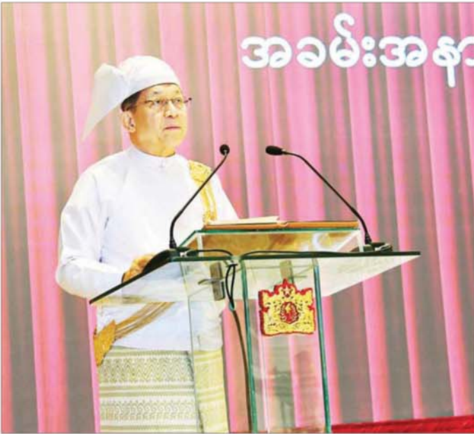
ပြည်ထောင်စုသမ္မတမြန်မာနိုင်ငံတော် နိုင်ငံတော်သမ္မတ ဦးမင်းအောင်လှိုင်က နိုင်ငံတော်အဆင့်ပုဂ္ဂိုလ်များ၊ ပြည်ထောင်စုအစိုးရအဖွဲ့ဝင်များ၊ တိုင်းဒေသကြီးအစိုးရ၊ ပြည်နယ်အစိုးရအဖွဲ့များမှ ဝန်ကြီးချုပ်များ၊ ဒုတိယဝန်ကြီးများအား မိန့်ခွန်းပြောကြားစဉ်။

ကျွန်တော်တို့ပြည်သန်းခဲ့တဲ့ သမိုင်းကို ပြန်ကြည့်ရင် လွတ်လပ်ရေး ဆုံးရှုံးခဲ့ရတာ၊ ကိုလိုနီ လက်အောက်မှာ ကာလရှည်ကြာခဲ့တာ၊ လွတ်လပ် ရေး ရပြီးစကတည်းကအချိန်ထိ တည်ငြိမ်အေးချမ်းမှု မရှိသေးတာတွေရဲ့ အဓိကအကြောင်းရင်းကလည်း အချင်းချင်း စည်းလုံးညီညွတ်မှုအားနည်းလို့ ဖြစ်တယ်ဆိုတာ အားလုံးအသိပဲ ဖြစ်ပါတယ်။ ဒါကြောင့် တိုင်းရင်းသားစည်းလုံးညီညွတ်ရေးနဲ့ ထာဝရငြိမ်းချမ်းရေးကို အလေးထားပြီး ဆက်လက် ဆောင်ရွက်သွားကြဖို့ အလေးထား မှာကြား