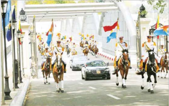
နိုင်ငံတော်သမ္မတ ဦးမင်းအောင်လှိုင် လိုက်ပါလာသည့် အထူးယာဉ်တန်း ဂုဏ်ပြုမြင်းစီးတပ်ဖွဲ့၏ ဦးဆောင်ကြိုဆိုမှုဖြင့် နိုင်ငံတော်သမ္မတ၏ ဧည့်ဆောင်တော်ရှိ ဂုဏ်ပြုဆောင်ခန်းမကြီးသို့ ရောက်ရှိလာစဉ်။