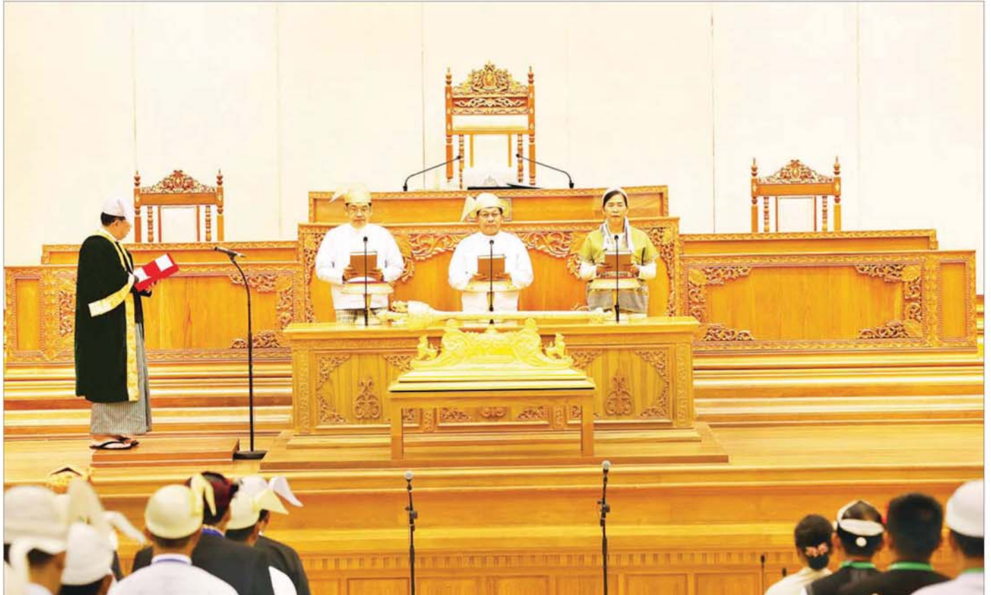
နိုင်ငံတော်သမ္မတအဖြစ် ရွေးချယ်တင်မြှောက်ခံရသူ ဦးမင်းအောင်လှိုင်၊ ဒုတိယသမ္မတအဖြစ် ရွေးချယ်တင်မြှောက်ခံရသူများဖြစ်သည့် ဦးညိုစောနှင့် ဒေါ်နန်းနီနီအေးတို့က ပြည်ထောင်စုလွှတ်တော် နာယက၏ရှေ့မှောက်၌ ကတိသစ္စာပြုကြစဉ်။

(သစ္စာလေးပါးဟူသည်ကား) ဆင်းရဲအမှန်ဖြစ်သော ဒုက္ခသစ္စာ၊ ဆင်းရဲခြင်း၏ အကြောင်းရင်းအမှန်ဖြစ်သော သမုဒယသစ္စာ၊ ဆင်းရဲမှ လွတ်မြောက်ရာအမှန်ဖြစ်သော နိရောဓသစ္စာ၊ ဆင်းရဲငြိမ်းရာ နိဗ္ဗာန်သို့ရောက်ကြောင်း အစစ်ဖြစ်၍ မြတ်သော အင်္ဂါရှစ်ပါးနှင့် ပြည့်စုံသော မဂ္ဂသစ္စာ။ (ဤလေးပါးတည်း။) (ဓမ္မပဒ)