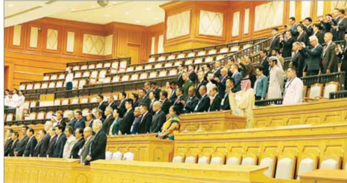
ပြည်ထောင်စုလွှတ်တော် အစည်းအဝေးသို့ အထူးဧည့်သည်တော်များအဖြစ် တပ်မတော်ကာကွယ်ရေးဦးစီးချုပ် ဗိုလ်ချုပ်ကြီး ရဲဝင်းဦး၊ ဒုတိယတပ်မတော်ကာကွယ်ရေးဦးစီးချုပ်၊ ကာကွယ်ရေးဦးစီးချုပ် (ကြည်း) ဗိုလ်ချုပ်ကြီး ကျော်စွာလင်းနှင့် တာဝန်ရှိသူများ၊ နိုင်ငံတကာမှ သံတမန်ကြီးများနှင့် သံတမန်များ တက်ရောက်လေ့လာကြစဉ်။