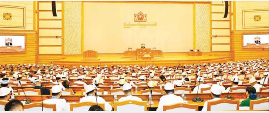
တတိယအကြိမ် ပြည်ထောင်စုလွှတ်တော် ပထမပုံမှန်အစည်းအဝေး ဆွဲမနေ့ ကျင်းပစဉ်။

အစည်းအဝေးတွင် ပြည် ထောင်စု လွှတ်တော်နာယက ဦးအောင်လင်းဌေးက တတိယ အကြိမ် ပြည်ထောင်စုလွှတ်တော် ပထမပုံမှန်အစည်းအဝေး ဆွဲမ နေသို့ တက်ရောက်ခွင့်ရှိသည့် ပြည်ထောင်စု လွှတ်တော် ကိုယ်စားလှယ်ဦးရေ စုစုပေါင်း ၅၅၅ ဦး ရှိသည့်အနက် ယနေ့ အစည်းအဝေးသို့ ၅၅၃ ဦး တက်ရောက်သဖြင့် ထက်ဝက် ကျော်သည့်အတွက် အစည်း အဝေး အထမြောက်ကြောင်းနှင့် စတင်ကျင်းပကြောင်း ကြေညာ ပြီး အစည်းအဝေးတက်ရောက်မှု အခြေအနေကို လွှတ်တော်၏ အတည်ပြုချက်ရယူ၍ မှတ်တမ်း တင်သည်။ ယနေ့ကျင်းပသည့် ပြည် ထောင်စုလွှတ်တော် အစည်း အဝေးသို့ အထူးအညီညီတော် များအဖြစ် တပ်မတော်ကာကွယ် ရေးဦးစီးချုပ် ဗိုလ်ချုပ်ကြီး ရဲဝင်း ဦး၊ ဒုတိယတပ်မတော်ကာကွယ် ရေးဦးစီးချုပ်၊ ကာကွယ်ရေးဦးစီး ချုပ် (ကြည်း) ဗိုလ်ချုပ်ကြီး ကျော်စွာလင်း၊ တရုတ်ပြည်သူ့ သမ္မတနိုင်ငံသမ္မတ၏ အထူး ကိုယ်စားလှယ်၊ တရုတ်ပြည်သူ့ နိုင်ငံရေးအတိုင်ပင်ခံ ကွန်မြူနစ် ဒုတိယဥက္ကဋ္ဌ H.E. Mr. Jiang