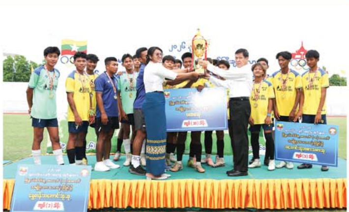
၎င်းနောက် တိုင်းဒေသကြီး မိတ္ထီလာမြို့နယ်အသင်းအား တံဆိပ် ချီးမြှင့်ခဲ့ကြောင်း သိရသည်။ ဝန်ကြီးချုပ်က ပထမဆုရရှိသည့် စိုက်ဆုဖလားနှင့် ဂုဏ်ပြုဆုငွေကို (မန္တလေးနေ့စဉ်)

မန္တလေး ဧပြီ ၉ ၂၀၂၆ ခုနှစ် မန္တလေးတိုင်းဒေသကြီးအစိုးရအဖွဲ့ ဝန်ကြီးချုပ်ဖလားမြို့နယ်ပေါင်းစုံ အသက်(၁၈)နှစ်အောက်(အမျိုးသား)ဘောလုံးပြိုင်ပွဲဗိုလ်လုပွဲနှင့် ဆုချီးမြှင့်ပွဲအခမ်းအနားကို ယနေ့ညနေပိုင်းက အောင်မြေသာစံမြို့နယ်ရှိ အောင်မြေမန္တလာအားကစားကွင်းတွင် ကျင်းပရာ မန္တလေးတိုင်းဒေသကြီးအစိုးရအဖွဲ့ ဝန်ကြီးချုပ် ဦးမျိုးအောင်၊ တိုင်းဒေသကြီးလွှတ်တော်တရားဦးအောင်ကျော်စိုး၊ တိုင်းဒေသကြီးတရားလွှတ်တော်တရားသူကြီးချုပ် အစိုးရအဖွဲ့ဝင် ဝန်ကြီးချုပ်၊ တိုင်းဒေသကြီးအစိုးရအဖွဲ့ ဝန်ကြီးများနှင့် တာဝန်ရှိသူများ၊ ဖြိုင်ပွဲဝင်အားကစားသမားများနှင့် အားကစားဝါသနာရှင်များ တက်ရောက်ကြပြီး ပုသိမ်ကြီးမြို့နယ်အသင်းနှင့် မိတ္ထီလာမြို့နယ်အသင်းတို့ ယှဉ်ပြိုင်ကစားနေမှုများကို ကြည့်ရှုအားပေးကြပြီး မိတ္ထီလာမြို့နယ်အသင်းက ပုသိမ်ကြီးမြို့နယ်အသင်းကို လေးဂိုး သုံးဂိုး ဖြင့် အနိုင်ရရှိလှခဲ့သည်။ ဆက်လက်၍ ဆုချီးမြှင့်ပွဲအခမ်းအနားကို ကျင်းပရာ တိုင်းဒေသကြီးလွှတ်တော်တရားဦးအောင်ကျော်စိုး၊ တိုင်းဒေသကြီးတရားလွှတ်တော်တရားသူကြီးချုပ် အစိုးရအဖွဲ့ဝင် ဝန်ကြီးချုပ်၊ တိုင်းဒေသကြီးအစိုးရအဖွဲ့ ဝန်ကြီးများနှင့် တာဝန်ရှိသူတို့က ဆုများကို ချီးမြှင့်ခဲ့ရာ ပွဲစဉ်တစ်လျှောက် အကောင်းဆုံးအားကစားသမားဆု၊ ရှေ့တန်း၊ အလယ်တန်း၊ နောက်တန်းနှင့် ဂိုးသမားအကောင်းဆုံးဆုရ အားကစားသမားများအား ဆုတံဆိပ်နှင့် ဂုဏ်ပြုဆုငွေများ၊ တတိယဆုရရှိသည့် သာစည်မြို့နယ်အသင်းအား တစ်ဦးချင်းဆုတံဆိပ်များနှင့် ဂုဏ်ပြုဆုငွေများ၊ ဒုတိယဆုရရှိသည့် ပုသိမ်ကြီးမြို့နယ်အသင်းအား တစ်ဦးချင်းဆုတံဆိပ်များနှင့် ဂုဏ်ပြုဆုငွေများ၊ ပထမဆုရရှိသည့် မိတ္ထီလာမြို့နယ်အသင်းအား တစ်ဦးချင်းဆုတံဆိပ်များကို ချီးမြှင့်ပေးခဲ့သည်။