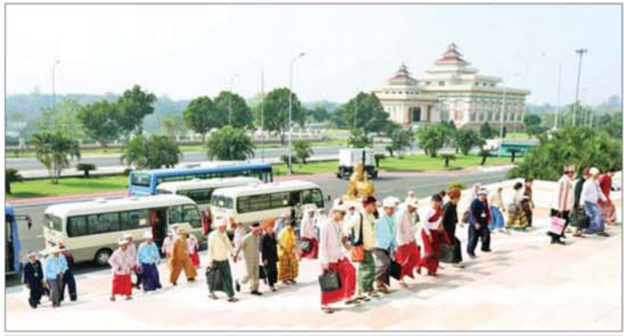
တတိယအကြိမ် ပြည်ထောင်စုလွှတ်တော် ပထမပုံမှန်အစည်းအဝေး ပဉ္စမနေ့သို့ တက်ရောက်လာ ကြသည့် ပြည်ထောင်စုလွှတ်တော်ကိုယ်စားလှယ်များအား တွေ့ရစဉ်။