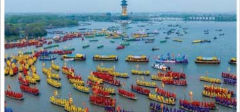
လှေပွဲအစဉ် ၅၀၀ ကျော်တည်ဆောက်ရန်ပြင်ထက်၌ ချင်ထုံ လှေပွဲတော် ခတ်ပြသခဲ့ကြသည်။ လှေလှော်ပွဲ စတင်သည်နှင့် တစ်ပြိုင်နက် ထူးခြားသော အသွင်သဏ္ဍာန်ကိုယ်စီရှိကြသည့် ဂုဏ်ပြုလှေပွဲစဉ်စဉ် ပြုကြည့်စင် ရှေ့မှ ဖြည့်လင်းစွာ ဖြတ်သန်းသွားကြသည်။ ယင်းနောက်တွင် ရည်မှန်းချက်ကြီးမားခြင်းကို ကိုယ်စားပြုသည့် မြင်းနှစ် သင်္ကေတဖြင့် ဖန်တီးထားသော လှေက လိုက်ပါလာခဲ့ကြောင်း သိရသည်။ Mon

ဟေကျင်း ဧပြီ ၉ ၂၀၂၆ ခုနှစ် ချင်ထုံ လှေပွဲတော်ကို တရုတ်နိုင်ငံ ထိုက်ကျိုးမြို့၊ ကျန်းယန်ခရိုင်ရှိ ချင်ဟူ အမျိုးသား ရေပစ်ဒေသပန်းခြံ၌ ယမန်နေ့က ခမ်းနားထည်ဝါစွာ ကျင်းပခဲ့ကြောင်း စီအင်န်အေ သတင်းဌာနက ဖော်ပြသည်။ ကမ္ဘာ့အကြီးဆုံး ရေပေါ်ဘုရားပွဲတော်အဖြစ် တင်စားခေါ်ဝေါ်ကြသည့် အဆိုပါပွဲတော်တွင် ဝါးလုံးချင်များနှင့် တက်များကို ကိုင်ဆောင်ထားသည့် လှေလှော်ခတ်သူ ထောင်ပေါင်းများစွာနှင့်