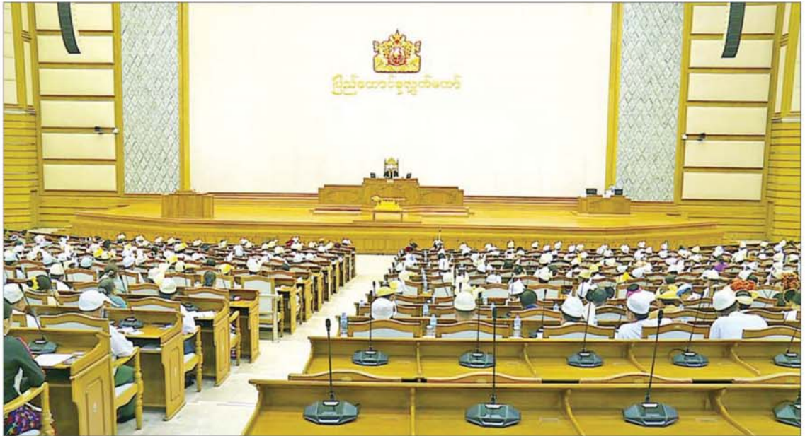
တတိယအကြိမ် ပြည်ထောင်စုလွှတ်တော် ပထမပုံမှန်အစည်းအဝေး ပဉ္စမနေ့ကျင်းပစဉ်။