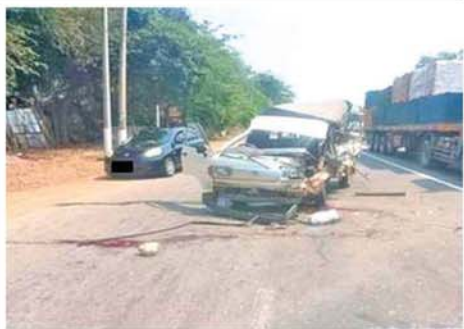
ယာဉ်တိုက်မှုဖြစ်ပွား၍ အမျိုးသား တစ်ဦး သေဆုံး၊ အမျိုးသား လေးဦးနှင့် အမျိုးသမီး သုံးဦး ထိခိုက်ဒဏ်ရာရရှိ

လျှပ်စစ်မီးလောင်မှုအကြောင်းနှင့် သဘာဝဘေးအန္တရာယ်များ အကြောင်း အသိပညာပေးပြောကြားခဲ့သည်။ ထို့နောက် တိုင်းဒေသကြီး မီးသတ်ဦးစီးမှူး ဦးဆောင်သော တပ်ဖွဲ့ဝင်များက 191 Report Mobile Application အသုံးပြုနည်း၊ ဂတ်စ်အိုး မီးလောင်မှုအား မီးသတ်ဆေးဘူးဖြင့် လက်တွေ့မီးငြိမ်းသတ်ခြင်း၊ Dry Chemical Powder (DCP) မီးသတ်ဆေးဘူးဖြင့် စနစ်တကျ လက်တွေ့မီးငြိမ်းသတ်ခြင်းများကို သရုပ်ပြခဲ့ပြီး ရဲတပ်ဖွဲ့ဝင်များနှင့် မိသားစုဝင်များက ကိုယ်တိုင်လက်တွေ့ပါဝင်ဆောင်ရွက်ခဲ့ကြသည်။