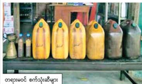
တရားမဝင် စက်သုံးဆီများ

စစ်ကိုင်းတိုင်းဒေသကြီး တရားမဝင်ကုန်သွယ်မှုတိုက်ဖျက်ရေးအထူးအဖွဲ့၏ စီမံခန့်ခွဲမှုဖြင့် တာဝန်ကျပူးပေါင်းအဖွဲ့များက စစ်ဆေးမှုများ ဆောင်ရွက်ခဲ့ရာ မတ် ၁ ရက်နှင့် ၂ ရက်တို့တွင် ရေဦးမြို့နယ်၊ အောင်ချမ်းသာရပ်ကွက်၌ တရားမဝင်စက်သုံးဆီဓာတ်ဆီ ၁ ဂရမ် ၅ ဂါလန်၊ ဒီဇယ်ဆီ ၁ ဂရမ် ၅ ဂါလန်ကို ရေနှင့် ရေနှင့်ထွက်ပစ္စည်းများဆိုင်ရာ ဥပဒေအရလည်းကောင်း၊ စစ်ကိုင်းမြို့နယ် ရတနာပုံဘေး ပူးပေါင်းစစ်ဆေးရေးဂိတ်၌ ယာဉ်တစ်စီးပေါ်မှ တရားဝင်စာရွက်စာတမ်းအထောက်အထား တင်ပြနိုင်ခြင်းမရှိသည့် လုပ်ငန်းသုံးပစ္စည်းလေးမျိုးကို ပို့ကုန်၊ သွင်းကုန်ဥပဒေအရလည်းကောင်း သိမ်းဆည်းအရေးယူ ဆောင်ရွက်လျက်ရှိကြောင်း သိရသည်။