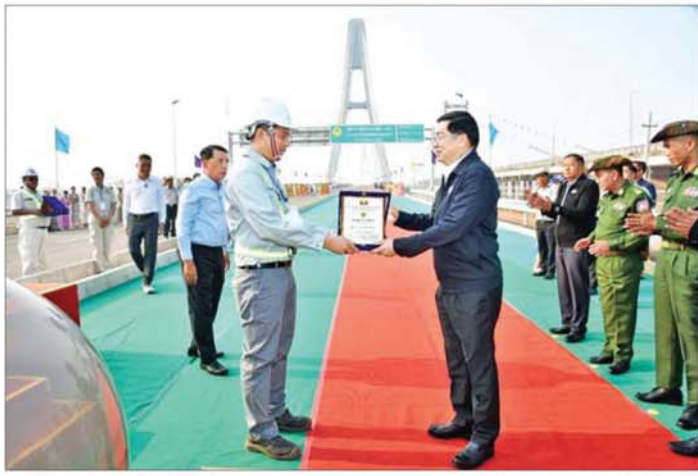
နိုင်ငံတော်ဝန်ကြီးချုပ် ဦးညိုစောက တံတားတည်ဆောက်ရာတွင် ပါဝင်ခဲ့ကြသည့် အင်ဂျင်နီယာ အဖွဲ့များအား အထိမ်းအမှတ် ဂုဏ်ပြုလက်ဆောင်ပေးစဉ်ပင်။

ဦးအောင်ကြည်သိန်း တို့က မင်္ဂလာအချိန်တွင် ဂျိုင်း (ဇာသပြင်) တံတားအသစ်ကို ဖဲကြိုးဖြတ်ဖွင့်လှစ်ပေးကြသည်။ ယင်းနောက် နိုင်ငံတော်ဝန်ကြီး ချုပ် ဦးညိုစောက ဂျိုင်း(ဇာသပြင်) တံတားအသစ် ကမ္ဘည်းမော်ကွန်း ကို စက်ခလုတ်နှိပ်ဖွင့်လှစ်ပေး ပြီး အမွှေးနံ့သာရည်များ ပက်ဖျန်း ပေးသည်။