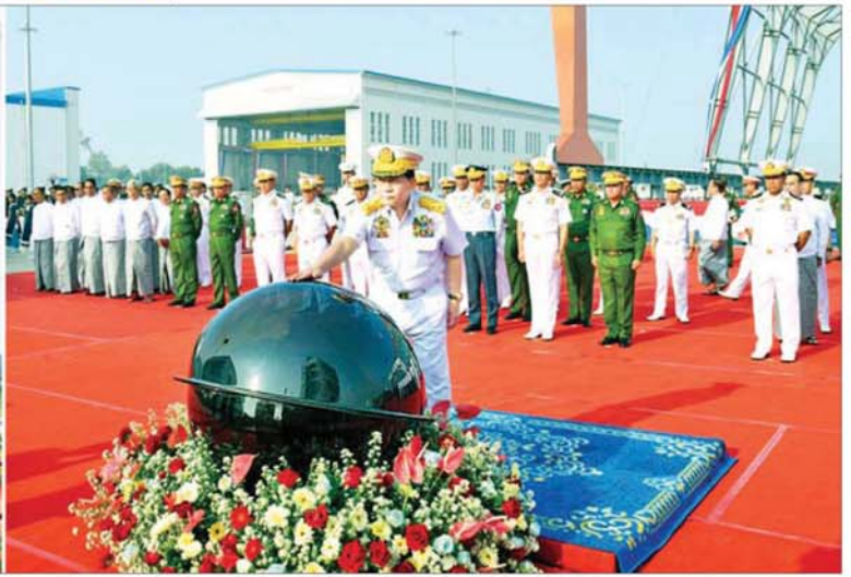
နိုင်ငံတော်လုံခြုံရေးနှင့်အေးချမ်းသာယာရေးကော်မရှင်ဥက္ကဋ္ဌ တပ်မတော်ကာကွယ်ရေးဦးစီးချုပ် ဗိုလ်ချုပ်မှူးကြီးမင်းအောင်လှိုင် ရေတပ်သင်တန်းကျင်းပဌာနချုပ် တန် ၄၀၀၀ ရေလုံလွန်းကျင်းကမ္ဘည်းကျောက်စာတိုင်အား စက်ခလုတ်နှိပ်ဖွင့်လှစ်ပေးစဉ်။