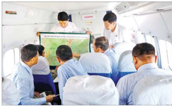
လုပ်ငန်းများကို ထိရောက်စွာ ဆောင်ရွက်နိုင်ရန် ကြိုးကြပ် ဆောင်ရွက်နိုင်ရန် အတွက် လေယာဉ်ဖြင့်လှည့်လည် စစ်ဆေးခြင်း လုပ်ငန်းများကို လည်းဆောင်ရွက်လျက်ရှိကြောင်း သိရသည်။ သတင်းစဉ်

ထိန်းသိမ်းခြင်း၊ စနစ်တကျစီမံအုပ်ချုပ်ခြင်း၊ ရေဝေရေလဲဒေသများထိန်းသိမ်းခြင်း၊ သစ်တောစိုက်ခင်းများ တည်ထောင်ခြင်းတို့ကို အရှိန်အဟုန်မြှင့်တင်ဆောင်ရွက်လျက်ရှိရာ တရားမဝင်ကျူးကျော် အခြေချခြင်းများနှင့် တရားမဝင်မြေအသုံးချခြင်းများ မရှိစေရန် မြေအသုံးချနေမှုများ ဥပဒေနှင့်အညီ စနစ်ကျမှန်ကန်စေရန် သက်ဆိုင်ရာဌာနများမှ ကိုယ်စားလှယ်များစုဖွဲ့ပြီး မြေပြင်ကျင်းဆင်းစစ်ဆေး ဆောင်ရွက်သွားမည်ဖြစ်သည်။ ထို့ပြင် သစ်တောထိန်းသိမ်းရေးလုပ်ငန်းများ၊ တောစိုစွန်းစိုပြည်ရေး အန္တရာယ် တားဆီးကာကွယ်ရေး