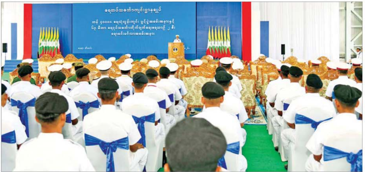
နိုင်ငံတော်လုံခြုံရေးနှင့် အေးချမ်းသာယာရေးကော်မရှင်ဥက္ကဋ္ဌ တပ်မတော်ကာကွယ်ရေးဦးစီးချုပ် ဗိုလ်ချုပ်မှူးကြီးမင်းအောင်လှိုင် ရေတပ်သင်တန်းကျင်းပဌာနချုပ် တန် ၄၀၀၀ ရေလုံလွန်းကျင်းဖွင့်ပွဲနှင့် ရေတပ်သင်တန်းတိုက်ဖျက်ရေးရေယာဉ်များ၏ ဧရာခင်းမင်္ဂလာအခမ်းအနားတွင် အမှာစကားပြောကြားစဉ်။

ထို့နောက် တန် ၄၀၀၀ ရေလုံလွန်းကျင်း ကမ္ဘည်းကျောက်စာတိုင်ကို အမွှေးနံ့သာရည်များဖြင့် ပက်ဖျန်းပေးကြသည်။