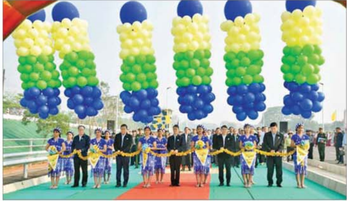
ပြည်ထောင်စုဝန်ကြီးများဖြစ်ကြသည့် ဦးထွန်းအုံ၊ ဦးမင်းနောင်၊ ဦးမျိုးသန့်၊ ကရင်ပြည်နယ်ဝန်ကြီးချုပ် ဦးစောမြင့်ဦးနှင့် မွန်ပြည်နယ်ဝန်ကြီးချုပ် ဦးအောင်ကြည်သိန်းတို့က ဂျိုင်း(ဇာသပြင်) တံတားအသစ်ကို ဖဲကြိုးဖြတ်ဖွင့်လှစ်ပေးစဉ်။

၄၀ ရှိကာ တံတား၏ခိုင်ခံ့မှုမှာ ယာဉ်တစ်စီးချင်း ၇၅ တန် ဖြစ် ကြောင်း၊ အတ္ထရံတံတားသစ်တည် လည်း သံမဏိကြိုးဆိုင်းတံတား ဖြစ်ပြီး တံတား၏အရှည်မှာ ၁၅၇၅ ပေ၊ ယာဉ်သွားလမ်း အကျယ် လေးလမ်းသွား၊ ရေလမ်း ကင်းလွတ်အကျယ် ပေ ၄၀၀၊ အမြင့်ပေ ၄၀ ရှိကာ တံတား၏ ခိုင်ခံ့မှုမှာ ယာဉ်တစ်စီးချင်း ၇၅ တန်ဖြစ်ကြောင်း၊ အဆိုပါခေတ်မီသံမဏိကြိုးဆိုင်း တံတားကြီးများ တည်ဆောက် ပြီးစီးခဲ့ခြင်းကြောင့် နိုင်ငံတော်