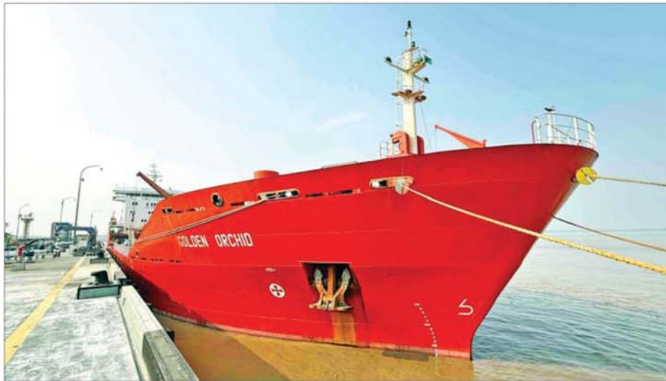
စက်သုံးဆီဖူလုံမှုအတွက် သီလဝါဆိပ်ကမ်းသို့ စက်သုံးဆီသင်္ဘောများ ထပ်မံရောက်ရှိမှုကို တွေ့ရစဉ်။

❖ နိုင်ငံတော်သာယာဖို့ သဘာဝပတ်ဝန်းကျင် ထိန်းကြစို့။