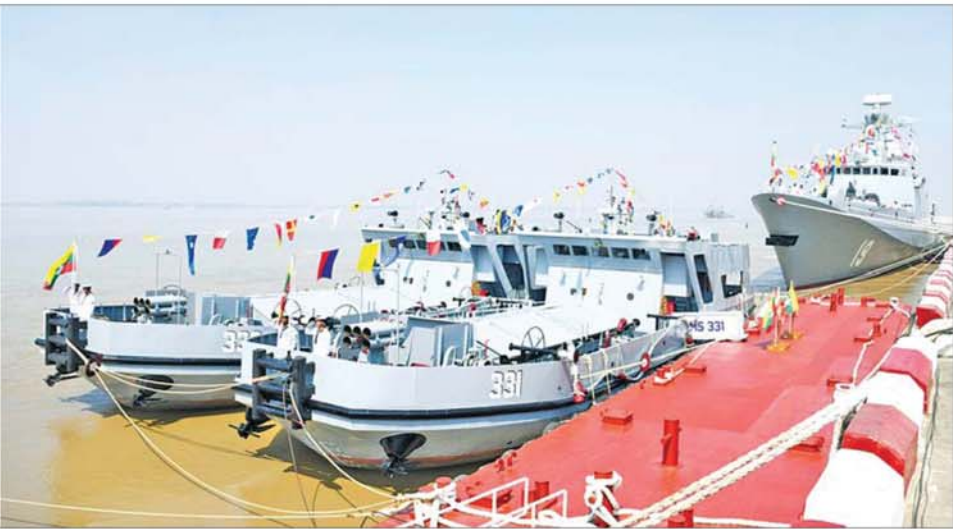
နိုင်ငံတော်လုံခြုံရေးနှင့် အေးချမ်းသာယာရေးကော်မရှင်ဥက္ကဋ္ဌ တပ်မတော်ကာကွယ်ရေးဦးစီးချုပ် ဗိုလ်ချုပ်မှူးကြီးမင်းအောင်လှိုင် တပ်မတော်(ရေ)စစ်ရေယာဉ်များ တပ်တော်ဝင်ခြင်းအခမ်းအနားတွင် ဂုဏ်ပြု တပ်ပွဲ၏ အလေးပြုခြင်းကိုခံယူနေစဉ် တပ်တော်ဝင်စစ်ရေယာဉ်များက ဂုဏ်ပြုအလေးပြုကြစဉ်။