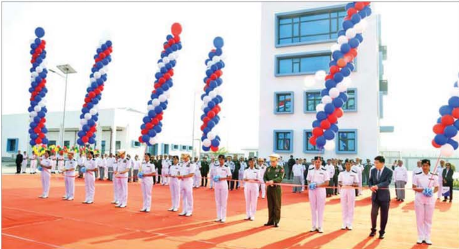
ရေတပ်သင်တန်းကျင်းပဌာနချုပ် တန် ၄၀၀၀ ရေလုံလွန်းကျင်းအား တာဝန်ရှိသူများက ဖဲကြိုးဖြတ်ဖွင့်လှစ်ပေးစဉ်။

စစ်ရေယာဉ်များကို လည်း တပ်တော်ဝင်နိုင်မည် ဖြစ်ခြင်းကြောင့် နိုင်ငံတော်နှင့် တပ်မတော်အတွက် ဂုဏ်ယူစရာကောင်းပြီး အားသစ်လောင်းသည့် နေ့တစ်နေ့ပင်ဖြစ်ကြောင်း။