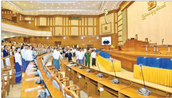
နိုင်ငံတော်ဝန်ကြီးချုပ် ဦးညိုစော လွှတ်တော်အစည်းအဝေးများ ကျင်းပနိုင်ရေးအတွက် ကြိုတင်ပြင်ဆင်ဆောင်ရွက်ထားရှိမှု အခြေအနေများကို ကြည့်ရှုစစ်ဆေးစဉ်။

အဆိုပါ လွှတ်တော်ကိုယ်စားလှယ်များ နေပြည်တော်သို့ ရောက်ရှိလာချိန်တွင် သတ်မှတ်နေရာများသို့ အသွား/အပြန် သယ်ယူပို့ဆောင်ရေးကိစ္စရပ်များကို သက်ဆိုင်ရာရုံး၊ ဌာနအဖွဲ့အစည်းများနှင့် ကြိုတင်ညှိနှိုင်းဆောင်ရွက်ထားရှိရန် တည်းခိုနေထိုင်မည့်အဆောင်များ ရှေ့မီး၊ မိလ္လာ အခန်းတွင်း