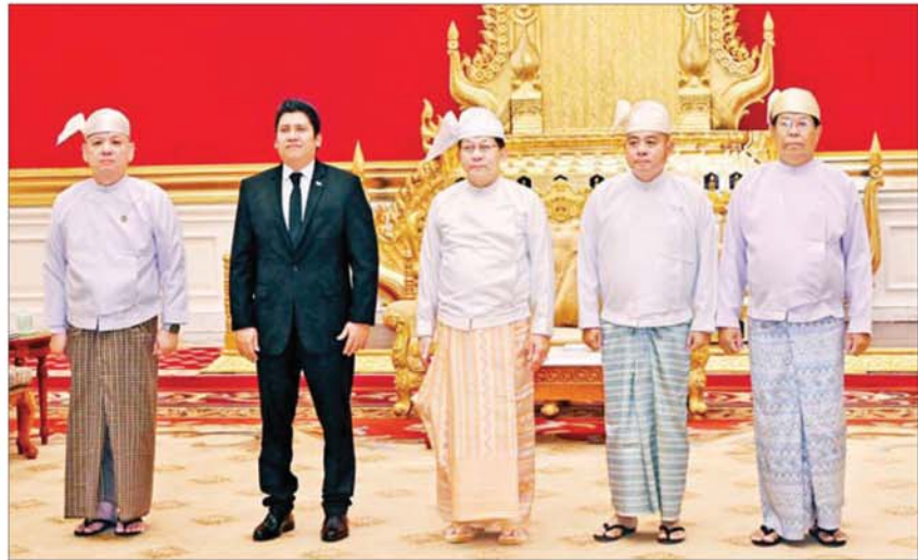
ပြည်ထောင်စုသမ္မတမြန်မာနိုင်ငံတော် ယာယီသမ္မတ နိုင်ငံတော်လုံခြုံရေးနှင့် အေးချမ်းသာယာရေးကော်မရှင်ဥက္ကဋ္ဌ ဗိုလ်ချုပ်မှူးကြီး မင်းအောင်လှိုင်နှင့် အဖွဲ့ဝင်များ မြန်မာနိုင်ငံဆိုင်ရာ နီကာရာဂွါသမ္မတနိုင်ငံသံအမတ်ကြီး H.E. Mr. Segundo Martin Calero Escorcía နှင့်အတူ စုပေါင်းမှတ်တမ်းတင်ဓာတ်ပုံရိုက်စဉ်။

ယာယီသမ္မတ နိုင်ငံတော်လုံခြုံရေးနှင့် အေးချမ်းသာယာရေးကော်မရှင်ဥက္ကဋ္ဌနှင့် မြန်မာနိုင်ငံဆိုင်ရာ နီကာရာဂွါသမ္မတနိုင်ငံသံအမတ်ကြီးတို့သည် စုပေါင်းမှတ်တမ်းတင်ဓာတ်ပုံရိုက်ကြသည်။ အဆိုပါ သံအမတ်ခန့်အပ်လွှာပေးအပ်ပွဲသို့ ကော်မရှင်အတွင်းရေးမှူးဗိုလ်ချုပ်ကြီး ရဲဝင်းဦး၊ နိုင်ငံခြားရေးဝန်ကြီးဌာန ပြည်ထောင်စုဝန်ကြီး ဦးသန်းဆွေနှင့် သံတမန်ရေးရာဦးစီးဌာန ညွှန်ကြားရေးမှူးချုပ် ဦးသက်ထွန်းတို့ တက်ရောက်ခဲ့ကြကြောင်း သိရသည်။ သတင်းစဉ်