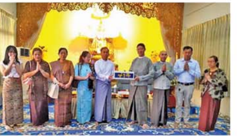
သံယာဆေးရုံကြီးသို့ အလှူ လှူဒါန်းနိုင်ကြောင်း သိရသည်။ (အပေါ်ပုံ)