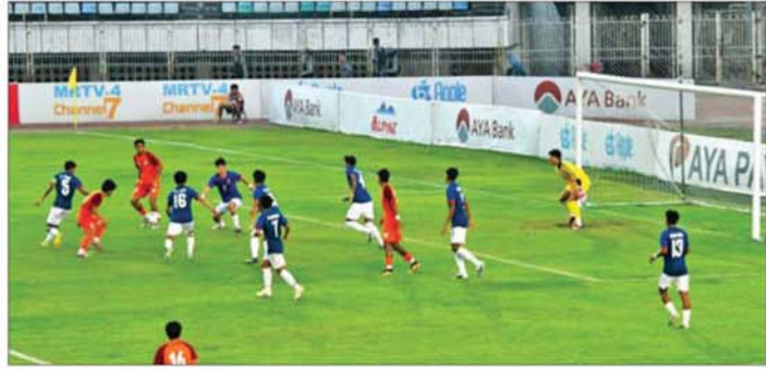
မြန်မာယူ-၁၇ အသင်းနှင့် အိန္ဒိယ ယူ-၁၇ အသင်းတို့ ယှဉ်ပြိုင်ကစားကြစဉ်။

ရန်ကုန် မတ် ၅ ၂၀၂၆ ခုနှစ် အာရှဖလား ယူ-၁၇ ဘောလုံးပြိုင်ပွဲမတိုင်မီ ဧပြီလတွင် ကျင်းပမည့် အာဆီယံ ယူ-၁၇ ချန်ပီယံရှစ်ပြိုင်ပွဲ၌ ဝင်ရောက်ယှဉ်ပြိုင်ကြမည့် မြန်မာယူ-၁၇ အသင်းနှင့် အိန္ဒိယ ယူ-၁၇ အသင်းတို့သည် ယနေ့ညနေ ၆ နာရီတွင် ရန်ကုန်မြို့ သုဝဏ္ဏအားကစားကွင်း၌ ဒုတိယခြေစမ်းပွဲအဖြစ် ယှဉ်ပြိုင်ကစားခဲ့ကြရာ ဂိုးမရှိသရေရလဒ် ထွက်ပေါ်ခဲ့သည်။ စာမျက်နှာ ၆ သို့ ၀