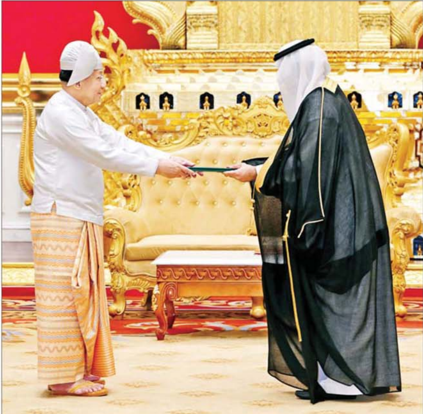
ပြည်ထောင်စုသမ္မတမြန်မာနိုင်ငံတော် ယာယီသမ္မတ နိုင်ငံတော်လုံခြုံရေးနှင့် အေးချမ်းသာယာရေးကော်မရှင်ဥက္ကဋ္ဌ ဗိုလ်ချုပ်မှူးကြီးမင်းအောင်လှိုင်ထံ မြန်မာ နိုင်ငံဆိုင်ရာ ဆော်ဒီအာရေဗျနိုင်ငံ သံအမတ်ကြီး H.E. Mr. Maziad Mohammed M Al Howishan က ၎င်း၏ သံအမတ်ခန့်အပ်လွှာကို ပေးအပ်စဉ်။

ထိုနေ့က မြန်မာနိုင်ငံနှင့် ဆော်ဒီအာရေဗျ နှစ်နိုင်ငံတို့အကြား ရှည်လျားခိုင်မာ သည့် သံတမန်ဆက်ဆံရေးရှိမှုနှင့် ချစ်ကြည်ရင်းနှီးမှုနှင့် ပူးပေါင်းဆောင်ရွက်မှုများ တိုးတက်ခိုင်မာလျက်ရှိမှုအခြေအနေများ၊ နှစ်နိုင်ငံအကြား ထိတွေ့ဆက်ဆံမှုများ တိုးမြှင့်ဆောင်ရွက်သွားမည့်အခြေအနေများ၊ နှစ်နိုင်ငံအကြား ရင်းနှီးမြှုပ်နှံမှုများ တိုးမြှင့်ဆောင်ရွက်ရေးနှင့် ကုန်သွယ်မှုမြှင့်တင်ရေးလုပ်ငန်းများ ဆောင်ရွက်နိုင်သည့် အခြေအနေများ၊ မြန်မာနိုင်ငံတွင် လွတ်လပ်ပြီး တရားမျှတသည့် ရွေးကောက်ပွဲ အောင်မြင်စွာကျင်းပပြုလုပ်နိုင်ခဲ့မှုနှင့် မကြာမီကာလအတွင်း လွှတ်တော်ခေါ်ယူ ဆောင်ရွက်သွားမည့်အခြေအနေများနှင့် စာမျက်နှာ ၃ သို့ ။