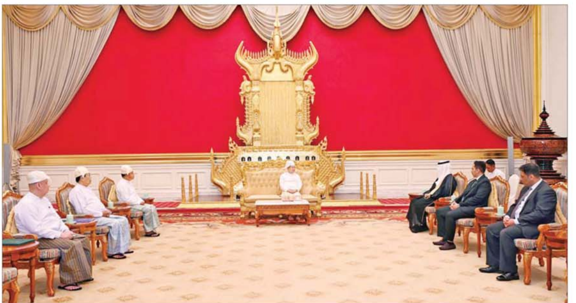
ပြည်ထောင်စုသမ္မတ မြန်မာနိုင်ငံတော် ယာယီသမ္မတ နိုင်ငံတော်လုံခြုံရေးနှင့် အေးချမ်းသာယာရေးကော်မရှင်ဥက္ကဋ္ဌ ဗိုလ်ချုပ်မှူးကြီးမင်းအောင်လှိုင် မြန်မာနိုင်ငံဆိုင်ရာ ဆော်ဒီအာရေဗျနိုင်ငံ သံအမတ်ကြီး H.E. Mr. Maziad Mohammed M Al Howishan အား လက်ခံတွေ့ဆုံစဉ်။

၎င်း ရှေ့ပွဲမှ နှစ်နိုင်ငံအကြား ပူးပေါင်းဆောင်ရွက်မှုများ ယခုထက်ပိုမိုတိုးတက်အောင် ဆောင်ရွက်သွားမည့် အခြေအနေများနှင့် ပတ်သက်၍ ရင်းရင်းနှီးနှီးဆွေးနွေးခဲ့ကြသည်။ စုပေါင်းမှတ်တမ်းတင် ဓာတ်ပုံရိုက်တွင် နိုင်ငံတော် ယာယီသမ္မတ နိုင်ငံတော်လုံခြုံရေးနှင့် အေးချမ်းသာယာရေး ကော်မရှင်ဥက္ကဋ္ဌနှင့် မြန်မာနိုင်ငံဆိုင်ရာ ဆော်ဒီအာရေဗျ နိုင်ငံသံအမတ်ကြီးတို့သည် စုပေါင်းမှတ်တမ်းတင်ဓာတ်ပုံရိုက်ကြသည်။ အဆိုပါ သံအမတ်ခန့်အပ်လွှာပေးအပ်ပွဲသို့ ကော်မရှင်အတွင်းရေးမှူးဗိုလ်ချုပ်ကြီး ရဲဝင်းဦး၊ နိုင်ငံခြားရေးဝန်ကြီးဌာန ပြည်ထောင်စုဝန်ကြီးဦးသန်းဆွေနှင့် သံတမန်ရေးရာဦးစီးဌာန ညွှန်ကြားရေးမှူးချုပ် ဦးသက်ထွန်းတို့ တက်ရောက်ခဲ့ကြောင်း သိရသည်။ သတင်းစဉ်