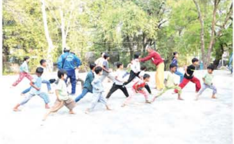
မြို့နယ်သိုင်းဆင်ကော်မတီတို့ ပူးပေါင်း၍ ခရိုင်လူထုအခြေပြုဗဟိုဌာနတွင် အခမဲ့ဖွင့်လှစ်ပို့ချ လျက်ရှိကြောင်း သိရသည်။ (အပေါ်ပုံ) (၄၅၃)