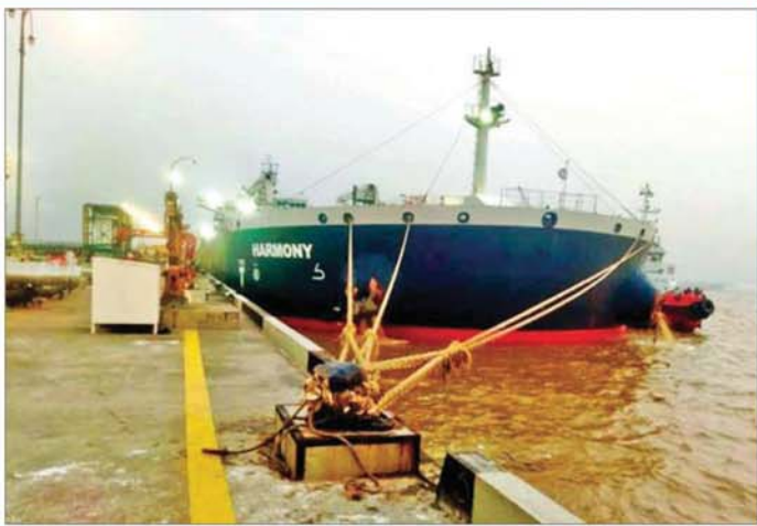
သီလဝါရှိ Terminal များတွင် စက်သုံးဆီတင်သင်္ဘောများ ဝင်ရောက်လျက်ရှိမှုကို တွေ့ရစဉ်။

စီမံဆောင်ရွက်ထားရှိပြီးဖြစ်ပါ သည်။ မြန်မာနိုင်ငံတွင် စွမ်းအင်ဝန်ကြီးဌာနမှ စက်သုံး ဆီဖုလုံမှုရှိစေရေး အစီအမံဖြင့် ဆောင်ရွက်ထားရှိသည့်အတွက် ရက် ၄၀ ခန့်စာ တင်သွင်း သို့လောင်ထားရှိပြီး စက်သုံးဆီ များကို သီလဝါမှ နိုင်ငံတစ်ဝန်း သို့ ဆီတင်ယာဉ်များဖြင့် ဖြည့်တင်းဖြန့်ဖြူးပေးလျက် ရှိပါ သည်။ ဆက်လက်၍ ကြိုတင်စီမံ ထားသည့် အစီအစဉ်အတိုင်း သီလဝါဆိပ်ကမ်းတွင် သင်္ဘော နှစ်စင်း၊ လမ်းခရီးတွင် သင်္ဘော ခြောက်စင်း၊ ဆီတင်ရန် စောင့် ဆိုင်းနေသည့် သင်္ဘော ရှစ်စင်း ဖြင့် ထပ်မံဖြည့်တင်းသွားမည် ဖြစ်ပါသည်။ ပြည်ပမှ စက်သုံးဆီ သင်္ဘောများ စဉ်ဆက်မပြတ် ရောက်ရှိစေရေး သက်ဆိုင်ရာ အဖွဲ့အစည်းများဖြင့် ညှိနှိုင်း ဆောင်ရွက်ထားရှိပြီး ဖြစ်သည့် အပြင် အရေးပေါ်အခြေအနေ ဖြစ်ပေါ်လာပါက ဖြေရှင်းဆောင် ရွက်နိုင်ရန်အတွက် နည်းလမ်း