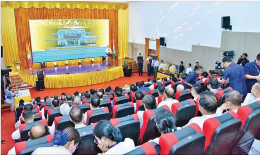
နိုင်ငံတော်ဝန်ကြီးချုပ် ဦးညိုစော စာဆိုဗိမာန်အဆောက်အအုံ ဖွင့်ပွဲအခမ်းအနားတွင် အမှာစကားပြောကြားစဉ်။