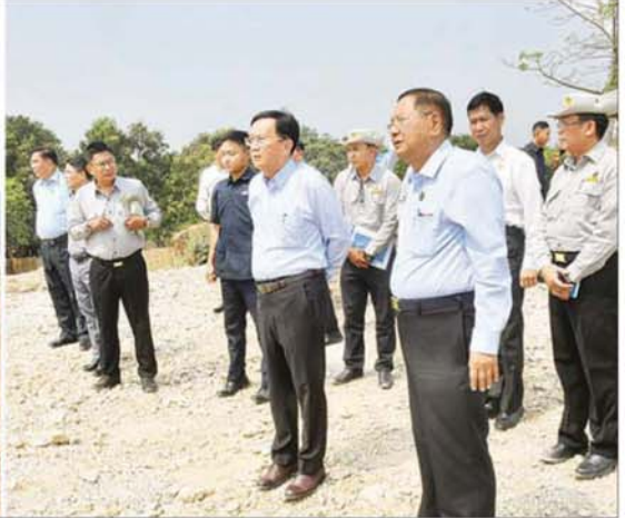
အမျိုးသားကာကွယ်ရေးနှင့်လုံခြုံရေးကောင်စီရုံး အမှုဆောင်ချုပ် ဦးအောင်လင်းဒွေးနှင့်အဖွဲ့ဝင်များ ရန်ကုန် - မန္တလေး အမြန်လမ်းမကြီး မိုင်တိုင် ၃၅၈၊ ၁ ဖာလုံနှင့် ၃ ဖာလုံကြားရှိ အရှည်ပေ ၁၀၀၀ သံကူကွန်ကရစ်တံတား ဒုဋ္ဌဝတီတံတားသစ်တည်ဆောက်ရေးစီမံကိန်းအတွင်း ကြည့်ရှုစစ်ဆေးစဉ်။