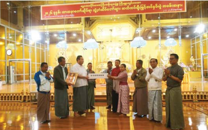
မုနိရုပ်ရှင်တော်မြတ်ကြီး ဘဏ္ဍာ ရယူပြီး ဂုဏ်ပြု မှတ်တမ်းလွှာ သည်။ (အပေါ်ပုံ)