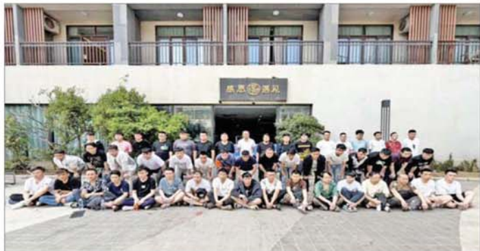
ရှမ်းပြည်နယ်(အရှေ့ပိုင်း) တာချီလိတ်မြို့ မယ်ခေါင်(၂) ရပ်ကွက်တွင် အွန်လိုင်းလိပ်လည် လောင်းကစားမှုကျူးလွန်သူ တရုတ်နိုင်ငံသား အမျိုးသား ၅၀ အား ဖမ်းဆီးရမိမှုကို တွေ့ရစဉ်။