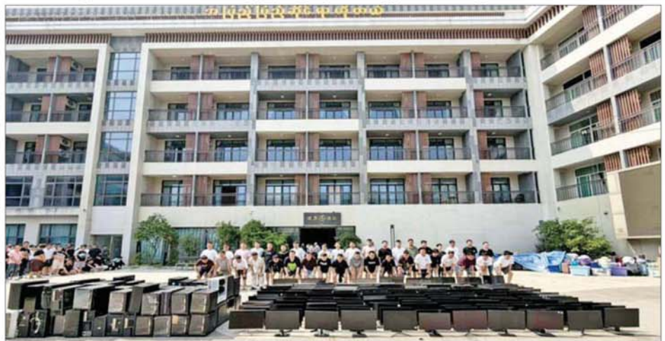
ရှမ်းပြည်နယ်(အရှေ့ပိုင်း) တာချီလိတ်မြို့ မယ်ခေါင်(၂) ရပ်ကွက်တွင် အွန်လိုင်းလိမ်လည် လောင်းကစားမှုကျူးလွန်သူ တရုတ်နိုင်ငံသား ၃၉ ဦးအား ဖမ်းဆီးရမိမှုကို တွေ့ရစဉ်။

ထိုသို့ဆောင်ရွက်လျက်ရှိရာ ရှမ်းပြည်နယ်(အရှေ့ပိုင်း) တာချီလိတ် မြို့နယ်အတွင်း လုံခြုံရေးဆောင်ရွက်နေသော ပူးပေါင်းအဖွဲ့များသည် တာချီလိတ်မြို့ မယ်ခေါင်(၂) ရပ်ကွက် မယ်ခေါင်(၂)လမ်း ဟိုတယ်လိုင်စင် ရယူထားခြင်းမရှိသော အပြည်ပြည်ဆိုင်ရာ ဟိုတယ်အမည်ရှိ အဆောက်အအုံ၌ တရားမဝင် အွန်လိုင်းလိမ်လည်မှုများ၊ အွန်လိုင်း လောင်းကစားမှုများ လုပ်ကိုင်နေကြောင်း သတင်းအရ ယနေ့ မွန်းလွဲ ပိုင်းတွင် ဝင်ရောက်ရှာဖွေစစ်ဆေးခဲ့ရာ အွန်လိုင်းလိမ်လည်မှုနှင့် လောင်းကစားမှုများလုပ်ကိုင်သည့် တရားမဝင် တရုတ်နိုင်ငံသား အမျိုးသား ၂၈၅ ဦး၊ အမျိုးသမီး ၅၆ ဦး ပေါင်း ၂၄၁ ဦး၊ မလေးရှားနိုင်ငံ သား အမျိုးသား ၃၁ ဦး၊ အမျိုးသမီး ၃၈ ဦး ပေါင်း ၆၉ ဦး၊ ဗီယက်နမ် နိုင်ငံသား အမျိုးသား ၄၆ ဦး၊ အမျိုးသမီး ၁၁ ဦး ပေါင်း ၅၇ ဦး၊ ဖိလစ်ပိုင် နိုင်ငံသား စာမျက်နှာ ၁၀ သို့ ၀