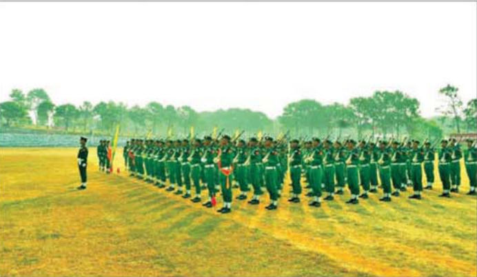
ပြည်သူ့စစ်မှုထမ်းသင်တန်း အမှတ်စဉ်(၂၀) သင်တန်းဆင်းပွဲ ကျင်းပစဉ်။