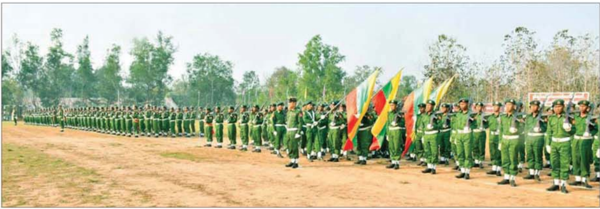
ပြည်သူ့စစ်မှုထမ်းသင်တန်း အမှတ်စဉ်(၂၀) သင်တန်းဆင်းပွဲ ကျင်းပစဉ်။

နေပြည်တော် မတ် ၃ နိုင်ငံ သားတိုင်းသည် ပြည်ထောင်စု မပြိုကွဲရေး၊ တိုင်းရင်းသား စည်းလုံးညီညွတ်မှု မပြိုကွဲရေးနှင့် အချုပ်အခြာ အာဏာ တည်တံ့ခိုင်မြဲရေးဟု သည့် ဦးတောဝန် အရေးသုံးပါးကို စောင့်ထိန်းရန် တာဝန်ရှိသဖြင့် ယင်းတာဝန်များကို ထမ်းဆောင် နိုင်ရန်အတွက် နိုင်ငံ့သားတိုင်း စစ်ပညာ သင်ကြားရန်နှင့် နိုင်ငံတော်ကာကွယ်ရေးအတွက် စစ်မှုထမ်းဆောင်နိုင်ရန် ပြည်သူ့ စစ်မှုထမ်းပွဲပေးပေးပေးပေးပေး ကို ၂၀၂၄ ခုနှစ် ဖေဖော်ဝါရီလ ၁၀ ရက်တွင် စတင် အာဏာတည်ခဲ့ပြီး နိုင်ငံတော် ကာကွယ်ရေးနှင့် လုံခြုံရေးတာဝန် များကို ထမ်းဆောင်ရန် စိတ်အား ထက်သန်စွာ လာရောက်စာရင်း ပေးသွင်းကြသည့် လူငယ်များကို ပြည်သူ့စစ်မှုထမ်းသင်တန်းများ ဖွင့်လှစ် သင်ကြားပေးလျက်ရှိ သည်။ ယခုအခါ ပြည်သူ့စစ်မှုထမ်း သင်တန်း အမှတ်စဉ်(၂၀) သင်တန်းဆင်းပွဲ အခမ်းအနားများ ကို ယနေ့နံနက်ပိုင်းတွင် တိုင်းစစ်ဌာနချုပ် များအလိုက် နယ်မြေခွဲ သင်တန်းကျောင်း အသီးသီး၌ ကျင်းပပြုလုပ်ကြ သည်။ အဆိုပါ သင်တန်းဆင်းပွဲ များကို သင်တန်းဆင်းစစ်ရေးပြ အစီအစဉ်အတိုင်း ဆောင်ရွက်ကြ ပြီး သင်တန်းသားများက နိုင်ငံတော်အလံကိုကိုး၍ ကတိ သစ္စာခံယူကြသည်။ ထို့နောက် သင်တန်းကျောင်း များအလိုက် သက်ဆိုင်ရာတာဝန်ရှိ သူများက သင်တန်းဆင်း အမှာ စကားများအသီးသီးပြောကြားကြ ပြီး သင်တန်းဆင်း ထူးချွန်ဆုများ ဖြစ်သည့် စံပြတပ်သားဆု၊ စစ်ရေးပြထူးချွန်ဆု၊ လက်ဖြောင့် တပ်သားဆု၊ စစ်သည်တော် ကျင့်ဝတ်ဆု၊ မိုင်းကျွမ်းကျင်ဆု၊ တပ်စိတ်တိုက်ခတ်ဆု၊ ပထမဆု၊ ချေးမွန်းရေးပထမဆု၊ အိမ်ဆောင် အကောင်းဆုံးဆု ရရှိသူများအား