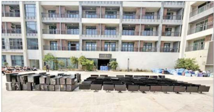
ရှမ်းပြည်နယ်(အရှေ့ပိုင်း) တာချီလိတ်မြို့ မယ်ခေါင်(၂) ရပ်ကွက်တွင် အွန်လိုင်းလိပ်လည် လောင်းကစားမှုကျူးလွန်သူများအား ဖမ်းဆီးရမိသည့် အဆောက်အအုံကို တွေ့ရစဉ်။