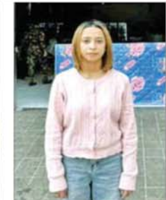
ရှမ်းပြည်နယ် (အရှေ့ပိုင်း) တာချီလိတ်မြို့ မယ်ခေါင် (၂) ရပ်ကွက်တွင် အွန်လိုင်း လိပ်လည် လောင်းကစားမှု ကျူးလွန်သူ ဖိလစ်ပိုင်နိုင်ငံသား အမျိုးသမီးတစ်ဦးကို တွေ့ရစဉ်။