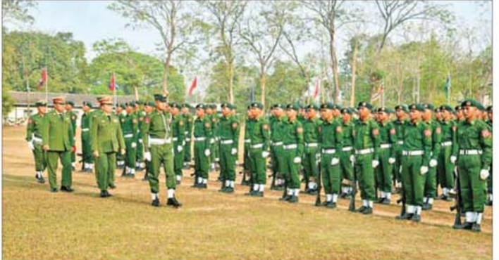
ပြည်သူ့စစ်မှုထမ်းသင်တန်း အမှတ်စဉ်(၂၀) သင်တန်းဆင်းပွဲ ကျင်းပစဉ်။

အကောင်းဆုံး ကြိုးစားသွားပါ မယ်။ ၂။ ပြောင်းလဲမှုကတော့ အများ ကြီးရှိပါတယ်။ ရောက်ခါစတုန်းက တော့ အခက်အခဲတွေ အများကြီး ရှိတာပေါ့။ အရပ်သားဘဝကနေ လာတာဆိုတော့ တပ်မတော်နဲ့ အထိအတွေ့ မရှိဘူးဆိုတော့ အခက်အခဲတွေတော့ ရှိခဲ့ပါတယ်။ စစ်မြေပြင်မှာ ဆိုင်ရင်တော့ တစ်ယောက်တည်း ဆောင်ရွက်ဖို့ လည်း မဖြစ်နိုင်ဘူးလေ။ အဲဒီတော့ အဖွဲ့လိုက် စနစ်နဲ့ပဲ သွားတာဖြစ် တဲ့အတွက် အဖွဲ့လိုက်ကြိုးစား တတ်အောင် ဆရာတွေက အများ ကြီး သင်ပေးထားပါတယ်။ ဆရာ တွေ သင်ပေးထားတဲ့အတိုင်းပဲ ကျွန်တော်တို့ စစ်မြေပြင် ရောက်သွားရင်လည်း စစ်နည်း ဗျူဟာရပ်တွေ၊ စစ်ပညာတွေကို အကောင်းဆုံး အသုံးချသွားပါမယ် လို့ ပြောချင်ပါတယ်။ သတင်းစဉ်