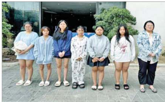
ရှမ်းပြည်နယ်(အရှေ့ပိုင်း) တာချီလိတ်မြို့ မယ်ခေါင်(၂)ရပ်ကွက်တွင် အွန်လိုင်း လိပ်လည်လောင်းကစားမှုကျူးလွန်သူ မလေးရှားနိုင်ငံသား အမျိုးသမီး ခုနစ်ဦးအား တွေ့ရစဉ်။