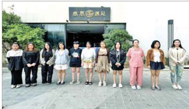
ရှမ်းပြည်နယ်(အရှေ့ပိုင်း) တာချီလိတ်မြို့ မယ်ခေါင်(၂)ရပ်ကွက်တွင် အွန်လိုင်း လိပ်လည် လောင်းကစားမှုကျူးလွန်သူ ဗီယက်နမ်နိုင်ငံသား အမျိုးသမီး ၁၁ ဦးအား တွေ့ရစဉ်။