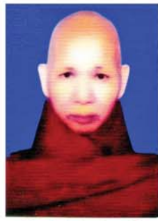
လှဒါန်းခဲ့ကြောင်း သိရသည်။ (အပေါ်ပုံ) (၄၄၀)