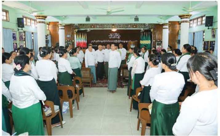
မန္တလေး မတ် ၃

မန္တလေးတိုင်းဒေသကြီး ၂၀၂၆ ခုနှစ်၊ တက္ကသိုလ်ဝင်စာမေးပွဲနှင့် စက်မှု၊ စိုက်ပျိုး၊ မွေးမြူရေး တက္ကသိုလ်ဝင်စာမေးပွဲ စာစစ်ဌာနများ၏ ကြီးကြပ်ရေးမှူးများအား စာမေးပွဲဆိုင်ရာဆောင်ရွက်ရန် လုပ်ငန်းများနှင့် စပ်လျဉ်း၍ ဆွေးနွေးပွဲအခမ်းအနားကို ယနေ့နံနက်ပိုင်းက ချမ်းအေးသာစံမြို့နယ်ရှိ အမှတ်(၁၆) အခြေစိုက်ပညာအထက်တန်းကျောင်း ပညာရတနာခန်းမတွင် ကျင်းပသည်။