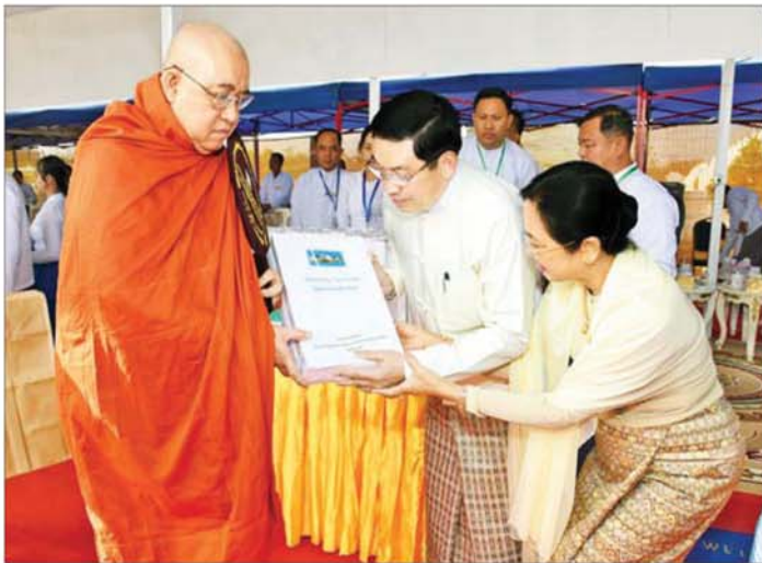
နိုင်ငံတော်လုံခြုံရေးနှင့် အေးချမ်းသာယာရေးကော်မရှင်အဖွဲ့ဝင် နိုင်ငံတော်ဝန်ကြီးချုပ် ဦးညိုစောနှင့် ဇနီး ဆရာတော်ထံ ဆွမ်းဆန်စိမ်းနှင့် လှူဖွယ်ဝတ္ထုပစ္စည်းများ ဆက်ကပ်လောင်းလှူစဉ်။