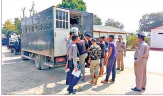
လားရှိုးမြို့၌ ပြစ်ဒဏ်လွတ်ငြိမ်းခွင့်ရရှိခဲ့သည့် အကျဉ်းသား၊ အကျဉ်းသူများအား တွေ့ရစဉ်။