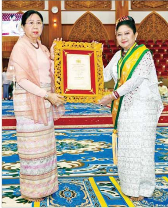
ပြည်ထောင်စုသမ္မတ မြန်မာနိုင်ငံတော် ယာယီသမ္မတ နိုင်ငံတော်လုံခြုံရေးနှင့် အေးချမ်းသာယာရေးကော်မရှင်ဥက္ကဋ္ဌ ဗိုလ်ချုပ်မှူးကြီးမင်းအောင်လှိုင်၏စနိုး ဒေါ်ကြူကြူလှ အဂ္ဂမဟာသီရိသုဓမ္မသီရိဘွဲ့ ရရှိသည့် ဒေါ်ညွန့်ယဉ်ဝင်းအား ဘွဲ့တံဆိပ်နှင့် အဆောင်အယောင်များ ချီးမြှင့်အပ်နှင်းစဉ်။