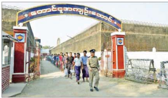
တောင်သူမြို့၌ ပြစ်ဒဏ်လွတ်ငြိမ်းခွင့်ရရှိခဲ့သည့် အကျဉ်းသား၊ အကျဉ်းသူများအား တွေ့ရစဉ်။

နေပြည်တော် မတ် ၂ ပြည်ထောင်စုသမ္မတမြန်မာနိုင်ငံတော် ယာယီသမ္မတသည် ယနေ့တွင်ကျရောက်သည့် (၆၄)နှစ်မြောက် တောင်သူလယ်သမားနေ့ အထိမ်းအမှတ်နေ့ကို ဂုဏ်ပြုသောအားဖြင့် ပြည်သူ့လူထုနည်းစိတ်ဝမ်းအေးချမ်းစေရန်နှင့် လူသားချင်းစာနာထောက်ထားမှုကို အလေးထားသောအားဖြင့် နိုင်ငံတော်၏မေတ္တာနှင့် စောနက်နှိုးဆော်လှည့်စေရန် ရှေးရှု၍ ၂၀၂၆ ခုနှစ် မတ်လ ၂ ရက်နေ့မတိုင်မီ လူသတ်မှု၊ မုဒ်မီးမှု၊ ပေါက်ကွဲစေတတ်သော ဝတ္ထုပစ္စည်းများအက်ဥပဒေအရ ပြစ်မှုများ၊ မတရားအသင်းများ အက်ဥပဒေအရ ပြစ်မှုများ၊ ၁၈၇၈ ခုနှစ် လက်နက်များအက်ဥပဒေပုဒ်မ ၁၉(စ)အရ ပြစ်မှုများ၊ ၁၉၄၉ ခုနှစ် လက်နက်(အရေးပေါ်) ပြစ်ဒဏ်စီရင်စွဲ (ယာယီ) အက်ဥပဒေအရ ပြစ်မှုများ၊ ၁၉၅၁ ခုနှစ် လက်နက်(ယာယီ) ပြင်ဆင်ချက်) အက်ဥပဒေအရပြစ်မှုများ၊ ၁၉၂၄ ခုနှစ် ရှမ်းပြည်နယ် လက်နက်အမိန့်အရ ပြစ်မှုများ၊ ၂၀၂၃ ခုနှစ်၊ လက်နက်ဥပဒေအရပြစ်မှုများ၊ မူးယစ်ဆေးဝါးနှင့် စိတ်ကိုပြောင်းလဲစေတတ်သော ဆေးဝါးများဆိုင်ရာဥပဒေအရ ပြစ်မှုများ၊ သဘာဝဘေးအန္တရာယ်ဆိုင်ရာ စီမံခန့်ခွဲမှုဥပဒေအရပြစ်မှုများ၊ အကြမ်းဖက်မှုတိုက်ဖျက်ရေး ဥပဒေအရပြစ်မှုများနှင့် အကတ်လိုက်စားမှုတိုက်ဖျက်ရေးဥပဒေအရ ပြစ်မှုများမှအပ တည်ဆဲဥပဒေတစ်ရပ်ရပ်အရ ပြစ်မှုတစ်ခုခုနှင့်စပ်လျဉ်း၍ ပြစ်ဒဏ်ချမှတ်ခြင်းခံရပြီး အကျဉ်းထောင်/ အချုပ်ထောင်/ စခန်းအသီးသီးတွင် ပြစ်ဒဏ်ကျခံလျက်ရှိသော အကျဉ်းသား၊ အကျဉ်းသူများကို ရာဇဝတ်ကျင့်ထုံးဥပဒေပုဒ်မ ၄၀၁၊ ပုဒ်မခွဲ(၁)အရ ယင်းတို့ကျခံရန်ကျန်ရှိသော ပြစ်ဒဏ်၏ ခြောက်ပုံတစ်ပုံကို လွတ်ငြိမ်းသက်သာခွင့်အားလည်းကောင်း၊ နိုင်ငံတစ်ဝန်းရှိ