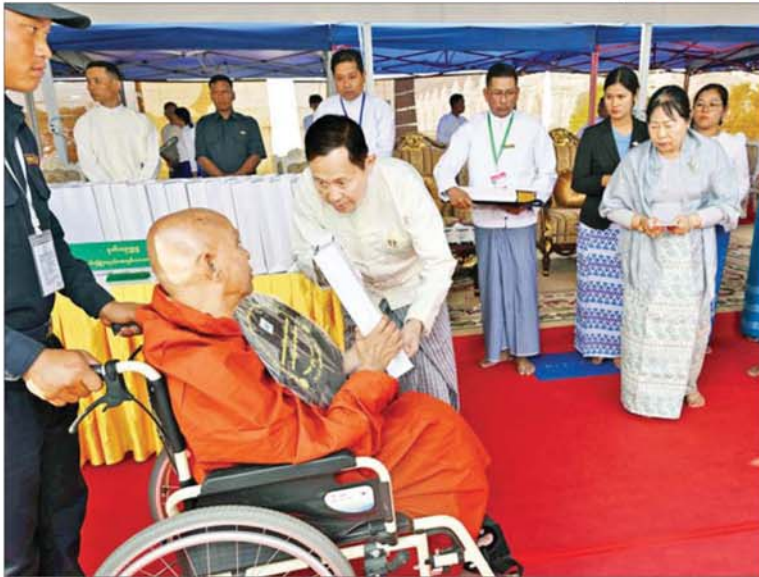
နိုင်ငံတော်လုံခြုံရေးနှင့် အေးချမ်းသာယာရေးကော်မရှင်ဥက္ကဋ္ဌ ဒုတိယဗိုလ်ချုပ်မှူးကြီးစိုးဝင်းနှင့် ဇနီး ဒေါ်သန်းသန်းနွယ် ဆရာတော်ထံ ဆွမ်းဆန်စိမ်းနှင့် လှူဖွယ်ဝတ္ထုပစ္စည်းများ ဆက်ကပ်လောင်းလှူစဉ်။