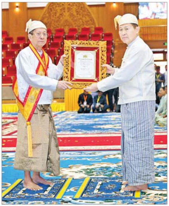
ပြည်ထောင်စုသမ္မတ မြန်မာနိုင်ငံတော် ယာယီသမ္မတ နိုင်ငံတော်လုံခြုံရေးနှင့် အေးချမ်းသာယာရေး ကော်မရှင်ဥက္ကဋ္ဌ ဗိုလ်ချုပ်မှူးကြီး မင်းအောင်လှိုင် အဂ္ဂမဟာသီရိသုဓမ္မ မဏိဇောတဓရ ဘွဲ့ရရှိသည့် ဦးကျော်စိုးဝင်း(ခ) ဦးခန့်စည်သူအား ဘွဲ့တံဆိပ်နှင့် အဆောင်အယောင်များ ချီးမြှင့်အပ်နှင်းစဉ်။