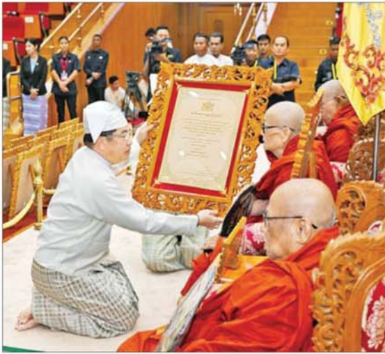
နိုင်ငံတော်လုံခြုံရေးနှင့် အေးချမ်းသာယာရေးကော်မရှင်အဖွဲ့ဝင် နိုင်ငံတော်ဝန်ကြီးချုပ် ဦးညိုစော အဘိဓမ္မာရတနာရ ဘွဲ့တံဆိပ်တော်ရ မန္တလေးတိုင်းဒေသကြီး ချမ်းမြသာစည်မြို့နယ် ဒက္ခိဏာရာဇာဓိရာဇာကြီးတိုက် နယားကျောင်းဆရာတော် ဘဒ္ဒန္တ နန္ဒိယထံ ဘွဲ့တံဆိပ်တော်နှင့် အဆောင်အယောင်များ ဆက်ကပ်ပူဇော်စဉ်။