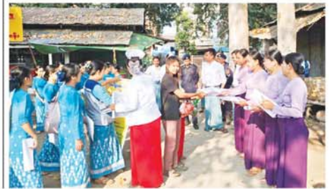
အဆိုပါ အသိပညာပေး

လက်ကမ်းစာစောင်တွင် အပူဒဏ် ကြောင့် ပင်ပန်းနွမ်းနယ်ခြင်း၊ ဂနာမပြင်ခြင်း၊ ခေါင်းမူးနောက် ခြင်း၊ ခေါင်းကိုက်ခြင်း၊ တစ်ကိုယ် လုံး နုံးချိုပျော့ခြင်းနှင့် ကြွက် တက်ခြင်း၊ ချွေးအလွန်အကျွံ ထွက်ခြင်းကြောင့် ခန္ဓာကိုယ် အရေပြားအေး၍ စိုရွက်ခြင်း၊ ခန္ဓာကိုယ်အပူချိန်မြင့်တက်ခြင်း စသည့် သတိပြုရမည့် အပူဒဏ် အန္တရာယ်ကျရောက်သည့်လူနာ ကို အရေးပေါ်ရှေးဦးပြုစုခြင်းနှင့် အပူဒဏ်အန္တရာယ် ကာကွယ်ရေး နှိုးဆော်ချက်များ ပါဝင်သော အသိပညာပေး လက်ကမ်းစာ စောင်များ ပြန့်ဝေခဲ့ကြောင်း သိရသည်။ (ဆင်ပေါင်ဝဲ)