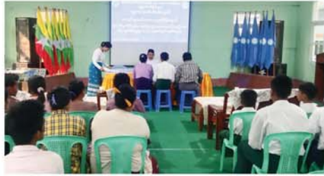
မန္တလေးလူငယ်သင်တန်းကျောင်းတွင် ပြစ်ဒဏ်လွတ်ငြိမ်းချမ်းသာခွင့်ရရှိသည့် ကလေးသူငယ် ၁၃ ဦးအား မိဘ၊ အုပ်ထိန်းသူများထံ ပြန်လည်အပ်နှံသည့် အခမ်းအနား ကျင်းပ

သတင်း - မင်းထက်အောင် (မန်ကွယ်ပွား)