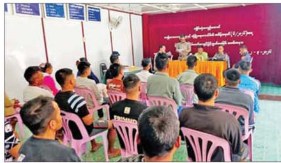
ကျိုင်းတုံမြို့၌ ပြစ်ဒဏ်လွတ်ငြိမ်းခွင့်ရရှိခဲ့သည့် အကျဉ်းသား၊ အကျဉ်းသူများအား တွေ့ရစဉ်။