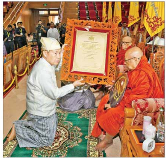
နိုင်ငံတော်လုံခြုံရေးနှင့် အေးချမ်းသာယာရေးကော်မရှင် ဒုတိယဥက္ကဋ္ဌ ဒုတိယဗိုလ်ချုပ်မှူးကြီးစိုးဝင်း အဘိဓမ္မာရတနာရတနာ ဘွဲ့တံဆိပ်တော်ရ စစ်ကိုင်းမြို့ မဟာဂန္ဓာရုံကျောင်းတိုက်ဆရာတော် ဒေါက်တာ ဘဒ္ဒန္တ ဝိဇ္ဇာနန္ဒာဘိဝံသထံ ဘွဲ့တံဆိပ်တော်နှင့် အဆောင်အယောင်များ ဆက်ကပ်ပူဇော်စဉ်။