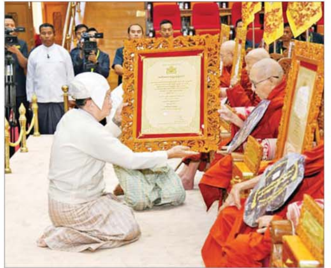
နိုင်ငံတော်လုံခြုံရေးနှင့် အေးချမ်းသာယာရေးကော်မရှင်အမှုဆောင်ချုပ် ဦးအောင်လင်းဒွေး အဘိဓမ္မေမဟာရဋ္ဌဂရု ဘွဲ့တံဆိပ်တော်ရ မကျေးတိုင်းဒေသကြီး ပခုက္ကူမြို့ မဟာဝိသုတာရာမ (အလယ်)တိုက်ကျောင်းဆရာတော် ဘဒ္ဒန္တ ပညာဇောတတ် ဘွဲ့တံဆိပ်တော်နှင့် အဆောင် အယောင်များ ဆက်ကပ်ပူဇော်စဉ်။