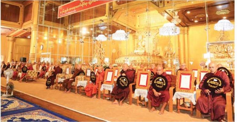
မန္တလေး မတ် ၂

မန္တလေးတိုင်းဒေသကြီး ၂၀၂၆ ခုနှစ်၊ သာသနာတော်ဆိုင်ရာ ဘွဲ့တံဆိပ်တော်ရရှိသည့် ဆရာတော်ကြီးများ၊ သီလရှင်ဆရာကြီးများနှင့် သာသနာ့နဂ္ဂဟဘွဲ့ရ လူပုဂ္ဂိုလ်များအား သာသနာတော်ဆိုင်ရာ ဘွဲ့တံဆိပ်တော်များ ဆက်ကပ်လှူဒါန်းပွဲ အခမ်းအနားကို ယနေ့မနန်းလွဲပိုင်းက အောင်မြေသာစံမြို့နယ်ရှိ မဟာအတုလဝေယံ(အတုမရှိ)ကျောင်းတော်ကြီးတွင် ကျင်းပရာ မန္တလေးတိုင်းဒေသကြီး သံဃာ့ဌာန အဖွဲ့က ဖခိုးရိမ်တိုက်သစ်၊ ဓမ္မဂါရဝကျောင်းဆရာတော် အဂ္ဂမဟာဂန္ထဝါစကပဏ္ဍိတ ဘဒ္ဒန္တတိက္ခိန္ဒိယဘိဝံသ၊ မန္တလေးတိုင်းဒေသကြီး သံဃာ့ဌာနအဖွဲ့က (ရွှေကျင်) မဟာဓမ္မိကာရာမ ရွှေကျင်တိုက်မကြီး ဆရာတော် အဂ္ဂမဟာပဏ္ဍိတ ဘဒ္ဒန္တထုတိဝရ အမှူးပြု၍ ဆရာတော် သံဃာတော်များ ကြွရောက်ချီးမြှင့်တော်မူပြီး မန္တလေးတိုင်းဒေသကြီးအစိုးရအဖွဲ့ ဝန်ကြီးချုပ် ဦးမျိုးအောင်နှင့်ဇနီး၊ တိုင်းဒေသကြီး တရားလွှတ်တော် တရားသူကြီးချုပ်၊ တိုင်းဒေသကြီးအစိုးရအဖွဲ့ဝင် ဝန်ကြီးများနှင့်၎င်းတို့၏ဇနီးများ၊ တာဝန်ရှိသူများ၊ အလှူရှင်များနှင့် ဖိတ်ကြားထားသူများ တက်ရောက်ကြည့်ညိကြသည်။