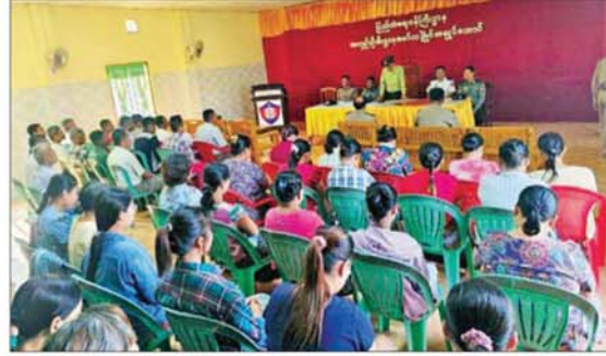
မော်လမြိုင်မြို့၌ ပြစ်ဒဏ်လွတ်ငြိမ်းခွင့်ရရှိခဲ့သည့် အကျဉ်းသား၊ အကျဉ်းသူများအား တွေ့ရစဉ်။

အကျဉ်းထောင်/ အချုပ်ထောင်/ စခန်းအသီးသီးတွင် ပြစ်ဒဏ်ကျခံလျက်ရှိသော အကျဉ်းသား၊ အကျဉ်းသူ ၂၈၂၅ ဦးကို ရာဇဝတ်ကျင့်ထုံးဥပဒေပုဒ်မ ၄၀၁၊ ပုဒ်မခွဲ(၁)အရ "နောက်တစ်ကြိမ် ပြစ်မှုထပ်မံကျူးလွန်ပါက ၎င်းပြစ်ဒဏ်အပြင် ယခုကျခံရန်ကျန်ရှိသော ပြစ်ဒဏ်များကိုပါ ဆက်လက်ကျခံပါမည်" ဟူသော စည်းကမ်းသတ်မှတ်ချက်ဖြင့် ယင်းတို့ကျခံရန်ကျန်ရှိသော ပြစ်ဒဏ်များအပေါ် လျှော့ပေါ့၍ ပြစ်ဒဏ်လွတ်ငြိမ်းခွင့်အားလည်းကောင်း၊ ခွင့်ပြုခဲ့သည်။