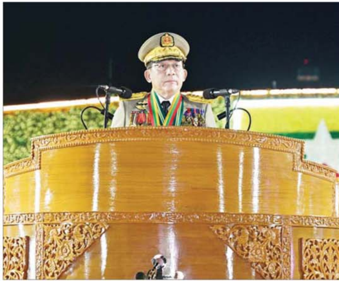
နိုင်ငံတော်လုံခြုံရေးနှင့် အေးချမ်းသာယာရေးကော်မရှင်ဥက္ကဋ္ဌ တပ်မတော်ကာကွယ်ရေးဦးစီးချုပ် ဗိုလ်ချုပ်မှူးကြီး သတိုးမဟာသရေစည်သူ သတိုးသီရိသုဓမ္မ မင်းအောင်လှိုင် (၈၁)နှစ်မြောက် တပ်မတော်နေ့စစ်ရေးပြအခမ်းအနားတွင် မိန့်ခွန်းပြောကြားစဉ်။

အင်္ဂလိပ်တို့ ဆုတ်ခွာထွက်ပြေးသွားချိန်မှာ ဂျပန်တို့က လွတ်လပ်ရေးပေးမယ်ဆိုတဲ့ ကတိကို ပျက်ကွက်ခဲ့တဲ့အပြင် တပ်မတော်ကိုလည်း အင်အားလျော့ချခဲ့တယ်။ နောက်ပိုင်းမှာ အတုအယောင်ရွှေရည်စိမ်းလွတ်လပ်ရေးပေးခဲ့ပြီး ပြည်သူတွေအပေါ်မှာ မမျှော်လင့်တဲ့ ဆိုးရွားစွာနှိပ်စက်မှုတွေ ပြုလုပ်လာခဲ့တာကြောင့် ဒိုတပ်မတော်အနေနဲ့ ၁၉၄၇ ခုနှစ်၊ မတ်လ ၂၇ ရက်မှာ သမိုင်းဝင်ဖက်ဆစ်တော်လှန်ရေးကြီးကို ပြည်သူလူထုနဲ့အတူ လက်တွဲဆင်နွှဲခဲ့ကြတယ်။ အဲဒီအချိန်ကစပြီး တပ်မတော်ဟာ မြန်မာနိုင်ငံ