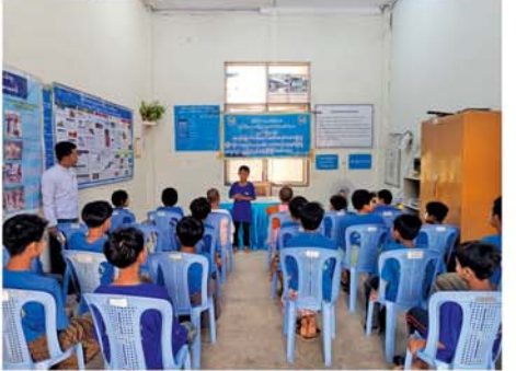
ပူဇွန်ကမ္ဘာ တားဆီးရာ ဖြေရှာတစ်ခု တောပြုစု။

ရရှိသူများက ဂုဏ်ပြုဆုများ ပေးအပ်ချီးမြှင့်ခဲ့သည်။ ထို့နောက် တက်ရောက်လာ သည့် ကျောင်းသား၊ ကျောင်းသူ များက ခင်းကျင်းပြသထားသည့် စာအုပ်၊ စာစောင်များနှင့် အသိ ပညာပေး နံရံကပ်စာစောင်များ အား စိတ်ဝင်တစား ကြည့်ရှု လေ့လာခဲ့ပြီး ကျောင်းသား၊ ကျောင်းသူများအား ပြန်ကြား ရေးနှင့်ပြည်သူ့ဆက်ဆံရေးဦးစီး ဌာနမှ လှူဒါန်းသည့် (၈၁)နှစ် မြောက် တပ်မတော်နေ့အထိမ်း အမှတ် လက်ကမ်းစာစောင်များ ဖြန့်ဝေပေးခဲ့ကြောင်း သိရသည်။ (အောက်ပုံ) အောင်ကို(ပြန်/ဆက်) ၀-၀-၀-၀-၀