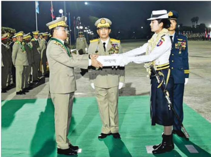
နိုင်ငံတော်လုံခြုံရေးနှင့် အေးချမ်းသာယာရေးကော်မရှင်အဖွဲ့ဝင် ညွှန်ကြားရေးမှူး (ကြည်း၊ ရေ၊ လေ) ဗိုလ်ချုပ်ကြီး ဇေယျကျော်ထင် သရေစည်သူ ကျော်စွာလင်း မြန်မာနိုင်ငံရဲတပ်ဖွဲ့ ကိုယ်စားပြု (အမျိုးသမီး) စစ်ရေးပြတပ်ခွဲ(၁)အား ဂုဏ်ပြုဆုငွေများ ပေးအပ်ချီးမြှင့်ပွဲ။

နေပြည်တော် မတ် ၂၇ (၈၁)နှစ်မြောက် တပ်မတော်နေ့ စစ်ရေးပြ အခမ်းအနားတွင် ဆုရရှိကြသော စစ်ရေးပြတပ်ခွဲများအား ဂုဏ်ပြုဆုချီးမြှင့်ပွဲကို ယနေ့ညပိုင်းတွင် နေပြည်တော်ရှိ စုရပ်သစ်တပ် စစ်ရေးပြတွင်း၌ ကျင်းပပြုလုပ်ရာ နိုင်ငံတော်လုံခြုံရေးနှင့် အေးချမ်းသာယာရေးကော်မရှင်အဖွဲ့ဝင် ညွှန်ကြားရေးမှူး (ကြည်း၊ ရေ၊ လေ) ဗိုလ်ချုပ်ကြီး ဇေယျကျော်ထင် သရေစည်သူ ကျော်စွာလင်း အား စစ်ရေးပြများကြီး ဗိုလ်ချုပ် ရဲရင့်ဝင်း၊ ဦးဆောင်သည့် စစ်ရေးပြစစ်ကြောင်းများက အလေးပြုကြသည်။