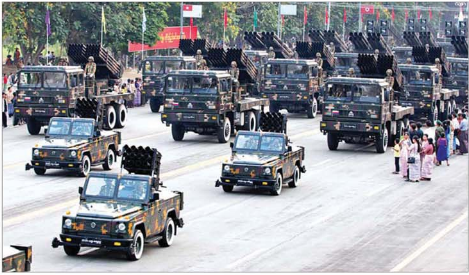
(၈၁)နှစ်မြောက် တပ်မတော်နေ့စစ်ရေးပြအခမ်းအနားတွင် ယန္တရားစစ်ကြောင်းကြီးများ ချီတက်လာစဉ်။

ယာဉ် နှစ်စင်းက Trail Formation ပုံစံဖြင့် ရှုရပ်၏ လက်ဝဲဘက်မှ လက်ယာဘက်သို့ ပျံသန်း၍လည်း ကောင်း၊ H-125 ရဟတ်ယာဉ် နှစ်စင်းက Trail Formation ပုံစံဖြင့် ရှုရပ်၏ လက်ဝဲဘက်မှ လက်ယာဘက်သို့ ပျံသန်း၍လည်း ကောင်း၊ Bell-206 ရဟတ်ယာဉ် နှစ်စင်းက Trail Formation ပုံစံဖြင့် ရှုရပ်၏ လက်ဝဲဘက်မှ လက်ယာဘက်သို့ ပျံသန်း၍လည်း ကောင်း၊ Eurocopter ရဟတ် ယာဉ် နှစ်စင်းက Trail Formation ပုံစံဖြင့် ရှုရပ်၏ လက်ဝဲဘက်မှ လက်ယာဘက်သို့ ပျံသန်း၍လည်း ကောင်း၊ H-125 ရဟတ်ယာဉ် နှစ်စင်းက ရှုရပ်၏ အရှေ့ဘယ် ၄၅ ဒီဂရီမြင့်ကွင်းမှ ဝင်ရောက် လာပြီး Echelon Formation ပုံစံဖြင့် ဒုတိယအကြိမ် ပျံသန်း၍ လည်းကောင်း၊ Bell-206 ရဟတ်ယာဉ် နှစ်စင်းက ရှုရပ်၏ ရှေ့တည့်တည့်မှ ဝင်ရောက်ပြီး Echelon Formation ပုံစံဖြင့် ဒုတိယအကြိမ် ပျံသန်း၍လည်း ကောင်း၊ Eurocopter ရဟတ် ယာဉ် နှစ်စင်းက ရှုရပ်၏ အရှေ့ဘာ ၄၅ ဒီဂရီမှ ဝင်ရောက်လာပြီး Echelon Formation ပုံစံဖြင့် ဒုတိယအကြိမ် ပျံသန်း၍လည်း ကောင်း၊ BEECH 1900D အမျိုး အစား သယ်ယူပို့ဆောင်ရေး လေယာဉ် တစ်စင်းက ရှုရပ်၏ အရှေ့ဘယ် ၄၅ ဒီဂရီ မြင့်ကွင်း မှပျံသန်း၍ လည်းကောင်း၊ စာမျက်နှာ ၈ သို့ »»