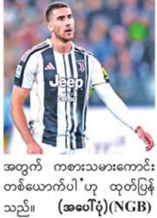
အတွက် ကစားသမားကောင်းတစ်ယောက်ပါ ဟု ထုတ်ပြန်သည်။ (အပေါ်ပုံ)(NGB)

စီစဉ်လာခြင်းဖြစ်သည်။ တိုက်စစ်မှူး ဗလာဟိုပစ်သည် ဂျူဗင်တပ်အသင်းနှင့် အတူ ၂၀၂၁-၂၀၂၂ မှ ၂၀၂၅-၂၀၂၆ ဘောလုံးရာသီအထိ ပြိုင်ပွဲ ၁၆၃ ပွဲကစားကာ ၆၄ ဂိုးထိ သွင်းယူပြီး ခြေစွမ်းပြထားသည်။ ဂျူဗင်တပ်အသင်း၏ထုတ်ပြန်ချက်တွင် 'ဗလာဟိုပစ် အသင်းနှင့် သက်တမ်းတိုးစာချုပ် ချုပ်ဆိုသွားမှာပါ။ သူဟာ အသင်း