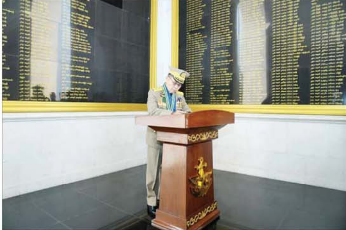
နိုင်ငံတော်လုံခြုံရေးနှင့် အေးချမ်းသာယာရေးကော်မရှင် ဒုတိယဥက္ကဋ္ဌ ဒုတိယတပ်မတော် ကာကွယ်ရေးဦးစီးချုပ် ဒုတိယဗိုလ်ချုပ်မှူးကြီး သီရိပျံချို မဟာသရေစည်သူ စိုးဝင်း သူရဲကောင်းဗိမာန် (နေပြည်တော်) စည်သူတော် မှတ်တမ်းစာအုပ်တွင် လက်မှတ်ရေးထိုးစဉ်။

ထို့နောက် နိုင်ငံတော်လုံခြုံရေးနှင့် အေးချမ်းသာယာရေး