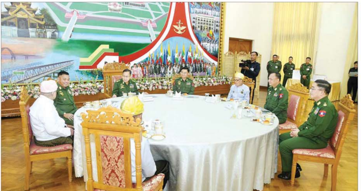
နိုင်ငံတော်လုံခြုံရေးနှင့် အေးချမ်းသာယာရေးကော်မရှင် ဒုတိယဥက္ကဋ္ဌ ဒုတိယတပ်မတော်ကာကွယ်ရေးဦးစီးချုပ် ဒုတိယဗိုလ်ချုပ်မှူးကြီး စိုးဝင်း (၈၁) နှစ်မြောက် တပ်မတော်နေ့အခမ်းအနားသို့ တက်ရောက်ကြမည့် လွတ်လပ်ရေးမော်ကွန်းဝင်ပုဂ္ဂိုလ်များအား လက်ဖက်ရည်ပိုင်းဖြင့် တည်ခင်းဧည့်ခံ၍ ဂါရဝပြုတွေ့ဆုံစဉ်။

နေပြည်တော် မတ် ၂၇ (၈၁)နှစ်မြောက် တပ်မတော်နေ့ စစ်ရေးပြအခမ်းအနားသို့ တက်ရောက်ကြမည့် လွတ်လပ်ရေးမော်ကွန်းဝင်ပုဂ္ဂိုလ် ဒုတိယအဆင့် တစ်ဦးနှင့် တတိယအဆင့် နှစ်ဦး စုစုပေါင်း သုံးဦးတို့အား နိုင်ငံတော်လုံခြုံရေးနှင့် အေးချမ်းသာယာရေးကော်မရှင် ဒုတိယဥက္ကဋ္ဌ ဒုတိယတပ်မတော်ကာကွယ်ရေးဦးစီးချုပ် ဒုတိယဗိုလ်ချုပ်မှူးကြီးစိုးဝင်းက ယနေ့ နံနက်ပိုင်းတွင် နေပြည်တော်ရှိ ဘုရင့်နောင်ရိပ်သာ ဧည့်ခန်းမဆောင်၌ လက်ဖက်ရည်ပိုင်းဖြင့် တည်ခင်းဧည့်ခံ၍ ဂါရဝပြုတွေ့ဆုံသည်။ ထိုသို့တွေ့ဆုံစဉ် နိုင်ငံတော်လုံခြုံရေးနှင့် အေးချမ်းသာယာရေးကော်မရှင် ဒုတိယဥက္ကဋ္ဌ ဒုတိယတပ်မတော်ကာကွယ်ရေးဦးစီးချုပ်၊ ကော်မရှင်အတွင်းရေးမှူး ကာကွယ်ရေးဦးစီးချုပ် (ကြည်း) ဗိုလ်ချုပ်ကြီး ရဲဝင်းဦး၊ စာမျက်နှာ ၁၀ သို့