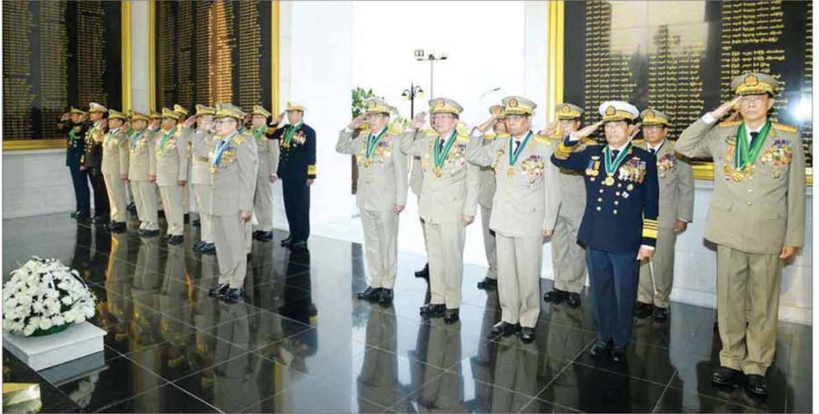
နိုင်ငံတော်လုံခြုံရေးနှင့် အေးချမ်းသာယာရေးကော်မရှင် ဒုတိယဥက္ကဋ္ဌ ဒုတိယတပ်မတော်ကာကွယ်ရေးဦးစီးချုပ် ဒုတိယဗိုလ်ချုပ်မှူးကြီး သီရိပျံချို မဟာသရေစည်သူ စိုးဝင်းနှင့်တပ်မတော်အရာရှိကြီးများ နိုင်ငံတော်ကာကွယ်ရေးနှင့် လုံခြုံရေးတာဝန်များ ထမ်းဆောင်စဉ် အသက်စွန့်လွှတ်ပေးလှူခဲ့ရသည့် သူရဲကောင်းစစ်သည်များအား အလေးပြုကြစဉ်။

နေပြည်တော် မတ် ၂၇ ယနေ့တွင် ကျရောက်သည့် (၈၁)နှစ်မြောက် တပ်မတော်နေ့ အထိမ်းအမှတ်အဖြစ် ယနေ့နံနက် ပိုင်းတွင် သူရဲကောင်းဗိမာန် (နေပြည်တော်)၌ ဂုဏ်ပြုပန်းခြင်း ချ အလေးပြုခြင်းအခမ်းအနားကို ကျင်းပပြုလုပ်ရာ နိုင်ငံတော်လုံခြုံရေးနှင့် အေးချမ်းသာယာရေး ကော်မရှင်ဥက္ကဋ္ဌ တပ်မတော် ကာကွယ်ရေးဦးစီးချုပ် ဗိုလ်ချုပ်မှူးကြီး သတိုးမဟာသရေစည်သူ သတိုးသီရိပျံချို မင်းအောင်လှိုင် ကိုယ်စား နိုင်ငံတော်လုံခြုံရေးနှင့် အေးချမ်းသာယာရေး ကော်မရှင် ဒုတိယဥက္ကဋ္ဌ ဒုတိယတပ်မတော် ကာကွယ်ရေးဦးစီးချုပ် ဒုတိယဗိုလ်ချုပ်မှူးကြီး သီရိပျံချို မဟာသရေစည်သူ စိုးဝင်း တက်ရောက်၍ ဂုဏ်ပြုပန်းခြင်းချ အလေးပြုသည်။