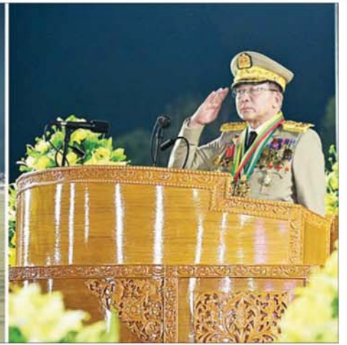
နိုင်ငံတော်လုံခြုံရေးနှင့် အေးချမ်းသာယာရေးကော်မရှင်ဥက္ကဋ္ဌ တပ်မတော်ကာကွယ်ရေးဦးစီးချုပ် ဗိုလ်ချုပ်မှူးကြီး သတိုးမဟာသရေစည်သူ သတိုးသိရီသုဓမ္မ မင်းအောင်လှိုင်အား စစ်ရေးပြစစ်ကြောင်းကြီးများက ချီတက်အလေးပြုစဉ်။

၂၃ ရှေ့မှ ထို့နောက် ဗဟိုစစ်တိုင်းအဖွဲ့ သည် စစ်ရေးပြကွင်းအတွင်းရှိ သတ်မှတ်နေရာ၌ ဆက်လက် နေရာယူပြီး ယန္တရားစစ်ကြောင်းမှ စစ်ကြောင်းမှူး ဗိုလ်မှူးချုပ် ဝေလင်းအောင် ဦးဆောင်၍ အမြောက်တပ်ဖွဲ့ညွှန်ကြားရေးမှူး ရုံးကိုယ်စားပြု ယန္တရားတပ်ခွဲ၊ ခိုးတပ်ဖွဲ့၊ ညွှန်ကြားရေးမှူးရုံး ကိုယ်စားပြု ယန္တရားတပ်ခွဲ၊ လေကြောင်းရန် ကာကွယ်ရေး တပ်ဖွဲ့ အရာရှိချုပ်ရုံးကိုယ်စားပြု ယန္တရားတပ်ခွဲ၊ သံချပ်ကာယန္တရား တပ်ဖွဲ့၊ ညွှန်ကြားရေးမှူးရုံး ကိုယ်စားပြု ယန္တရားတပ်ခွဲ၊ စစ်အင်ဂျင်နီယာညွှန်ကြားရေးမှူး ရုံးကိုယ်စားပြု ယန္တရားတပ်ခွဲ၊ ကာကွယ်ရေး ဦးစီးချုပ်ရုံး(ရေ) ကိုယ်စားပြု ယန္တရားတပ်ခွဲတို့က ချီတက်နေရာယူကြပြီး ဘက်ပိုက် တပ်စုက သတ်မှတ်နေရာတွင် နေရာယူသည်။ ယင်းနောက်တပ်ခွဲမှူး ဗိုလ်ကြီး ဒေါ်နှင်းနုရိန် ဦးဆောင်သည့် တပ်မတော်(ကြည်း) အထူးတာဝန် တပ်ဖွဲ့ အမျိုးသမီးစစ်ရေးပြတပ်ခွဲ နှင့် တပ်ခွဲမှူး ဗိုလ်မှူး ဝင်းသုထွန်း ဦးဆောင်သည့် တပ်မတော်(ရေ) အထူးတာဝန်တပ်ဖွဲ့ စစ်ရေးပြ