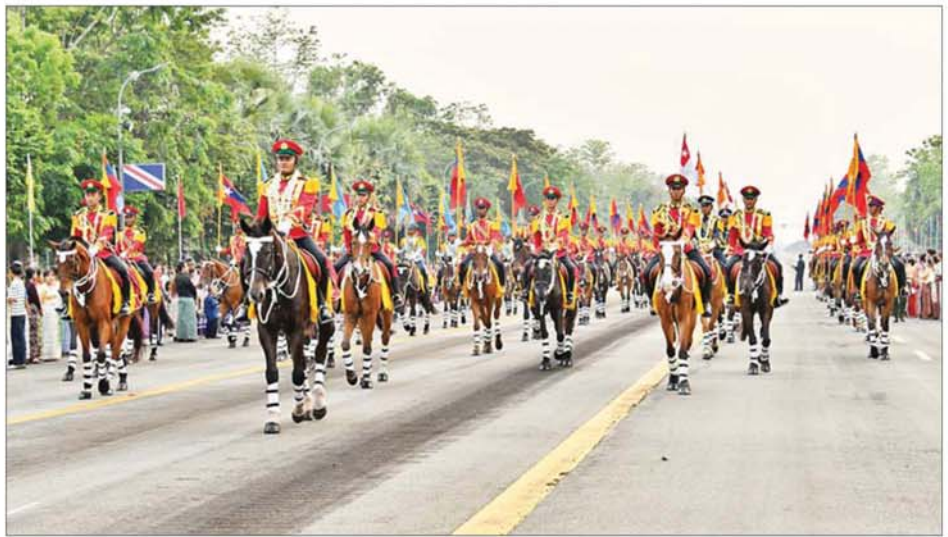
(၈၁)နှစ်မြောက် တပ်မတော်နေ့စစ်ရေးပြအခမ်းအနားတွင် စစ်ရေးပြစစ်ကြောင်းကြီးများ ချီတက်လာစဉ်။

ဥက္ကဋ္ဌ တပ်မတော်ကာကွယ်ရေး ဦးစီးချုပ်အား အလေးပြုကြသည်။ ယင်းနောက်နိုင်ငံတော်လုံခြုံရေးနှင့်အေးချမ်းသာယာရေးကော်မရှင် ဥက္ကဋ္ဌ တပ်မတော်ကာကွယ်ရေး ဦးစီးချုပ် ဗိုလ်ချုပ်မှူးကြီး သတိုးမဟာသရေစည်သူ သတိုးသီရိ သုဓမ္မ မင်းအောင်လှိုင်သည် တက်ရောက် လာကြသည့် ဧည့်သည် တော်ကြီးများအား ရင်းရင်းနှီးနှီး နှုတ်ဆက်ခဲ့ကာ စစ်ရေးပြကွင်းကြီးမှ ပြန်လည်ထွက်ခွာခဲ့ပြီး ၂၀၂၆ ခုနှစ် (၈၁)နှစ်မြောက် တပ်မတော်နေ့ စစ်ရေးပြ အခမ်းအနားကို အောင်မြင်စွာ ရုပ်သိမ်းခဲ့သည်။ (၈၁)နှစ်မြောက် တပ်မတော်နေ့ စစ်ရေးပြ ကျင်းပသော နေပြည်တော် စစ်ရေးပြကွင်းကြီးတွင် ခုံညားစွာစိုက်ထူထားသည့် ပထမ၊ ဒုတိယနှင့် တတိယမြန်မာနိုင်ငံတော်တို့ကို တည်ထောင်ခဲ့ကြသော မင်းသုံးပါးတို့၏ကြေးရုပ်တုကြီးများကို လည်းကောင်း၊ တပ်မတော်နေ့ မီးရှူးတိုင်နှင့် (၈၁)နှစ်မြောက် တပ်မတော်နေ့