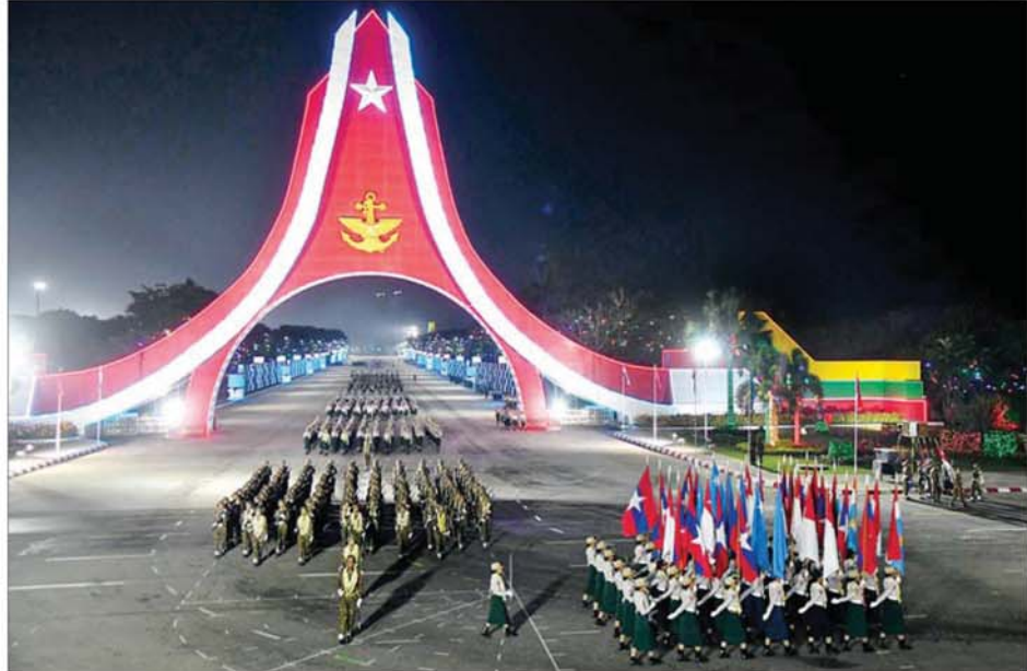
စစ်ရေးပြစစ်ကြောင်းကြီးများ စစ်ရေးပြကွင်းကြီးအတွင်းမှ ပြန်လည်ထွက်ခွာကြစဉ်။

လုံခြုံရေးနှင့်အေးချမ်းသာယာရေး ကော်မရှင်ဥက္ကဋ္ဌ တပ်မတော် ကာကွယ်ရေးဦးစီးချုပ် ဗိုလ်ချုပ်မှူးကြီး သတိုးမဟာသရေစည်သူ သတိုးသီရိသုဓမ္မ မင်းအောင်လှိုင် ပြန်လည် ထွက်ခွာမည့် လမ်းတစ်လျှောက်တွင်လည်း ဖြစ်နိုင်ပါသည်။