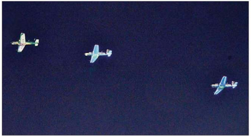
စစ်ရေးပြစစ်ကြောင်းကြီးများ ချီတက်အလေးပြုချိန်တွင် တပ်မတော်(လေ)မှ လေယာဉ်များ သရုပ်ပြပုံသန်းကြစဉ်။

»» စာမျက်နှာ ၇ မှ BEECH 1900D အမျိုးအစား သယ်ယူပို့ဆောင်ရေး လေယာဉ် တစ်စင်းက ရှုရပ်၏ အရှေ့ဘက် ၄၅ ဒီဂရီမြင်ကွင်းမှ ပုံသန်း၍ လည်းကောင်း၊ ATR 72 သယ်ယူပို့ဆောင်ရေး လေယာဉ်တစ်စင်းက ရှုရပ်၏ ရှေ့တည့်တည့်မှ ပုံသန်း၍လည်းကောင်း၊ K-8 W တိုက်ခိုက်ရေး လေယာဉ် နှစ်စင်းက Echelon Formation ပုံစံဖြင့် ရှုရပ်၏ ရှေ့ဘက် ၄၅ ဒီဂရီ မြင်ကွင်းမှ ပုံသန်း၍ လည်းကောင်း၊ Su-30 SME စတုတ္ထမျိုးဆက်လွန် ဘက်စုံသုံး အကြီးစားတိုက်လေယာဉ် သုံးစင်းက ရှုရပ်၏အရှေ့ဘက် ၄၅ ဒီဂရီမြင်ကွင်းမှ ဝင်ရောက်ကာ Arrow Head Formation ပုံစံဖြင့် လည်းကောင်း၊ Su-30 SME စတုတ္ထမျိုးဆက်လွန် ဘက်စုံသုံး အကြီးစားတိုက်လေယာဉ် သုံးစင်းက ပွဲကြည့်စင်နောက်မှ ရှုရပ်၏ အရှေ့ဘက်သို့ပုံသန်း၍ Flare မီးကျည်များ ထုတ်လွှတ်၍လည်းကောင်း၊ အသီးသီး သရုပ်ပြပုံသန်းကြပြီး နိုင်ငံတော်လုံခြုံရေးနှင့် အေးချမ်းသာယာရေးကော်မရှင်