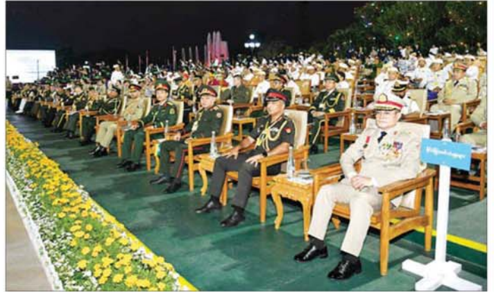
(၈၁)နှစ်မြောက် တပ်မတော်နေ့စစ်ရေးပြအခမ်းအနားသို့ တက်ရောက်ကြသူများအား တွေ့ရစဉ်။

»» စာမျက်နှာ ၆ မှ တာဝန်ရှိသူများ၊ တပ်မတော်နေ့ ဂုဏ်ပြုစာတံလမ်းတွင် ပါဝင်ခဲ့ သည့် အနုပညာရှင်များ၊ စစ်ချီ သီချင်း၊ စစ်သင်တေးသီချင်း၊ ကဗျာ၊ ဝတ္ထုတို၊ ဝတ္ထုရှည်ဖြိုင့်ပွဲ များတွင် ဆုရရှိကြသူများ၊ တပ်မတော်နေ့ အလှူရှင်များ၊ တက္ကသိုလ်လေ့ကျင့်ရေးတပ်များ မှ တပ်ဖွဲ့ဝင်များ၊ တိုင်းရင်းသား ဖွံ့ဖြိုးရေးတက္ကသိုလ်မှ ဆရာ ဆရာမများနှင့် ကျောင်းသား ကျောင်းသူများ၊ အထူးဖိတ်ကြား ထားသည့် စည်သူတော်များ၊ အရာရှိ၊ စစ်သည်၊ မိသားစုများ။