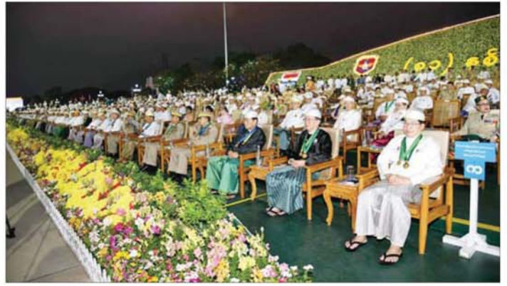
(၈၁)နှစ်မြောက် တပ်မတော်နေ့စစ်ရေးပြအခမ်းအနားသို့ တက်ရောက်ကြသူများအား တွေ့ရစဉ်။