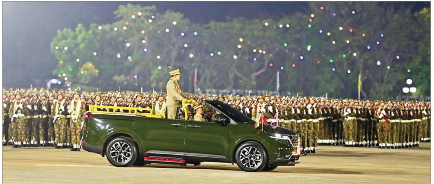
နိုင်ငံတော်လုံခြုံရေးနှင့် အေးချမ်းသာယာရေးကော်မရှင်ဥက္ကဋ္ဌ တပ်မတော်ကာကွယ်ရေးဦးစီးချုပ် ဗိုလ်ချုပ်မှူးကြီး သတိုးမဟာသရေစည်သူ သတိုးသီရိသုဓမ္မ မင်းအောင်လှိုင် စစ်ရေးပြစစ်ကြောင်းကြီးများအား လိုက်လံစစ်ဆေးစဉ်။