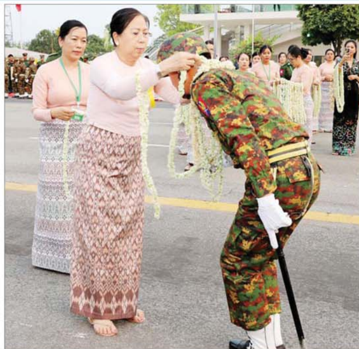
နိုင်ငံတော်လုံခြုံရေးနှင့် အေးချမ်းသာယာရေးကော်မရှင်ဥက္ကဋ္ဌ တပ်မတော်ကာကွယ်ရေးဦးစီးချုပ် ဗိုလ်ချုပ်မှူးကြီး သတိုးမဟာသရေစည်သူ သတိုးသိရီသုဓမ္မ မင်းအောင်လှိုင်၏ စနိုး ဒေါ်ကြူကြူလှ စစ်ကြောင်းကြီးများချီတက်ချိန်တွင် စစ်သည်များအား ဂုဏ်ပြုပန်းကုံးများစွပ်၍ ကြိုဆိုစဉ်။

တပ်ခွဲတို့သည် စစ်ရေးပြကွင်းကြီး အတွင်းသို့ ချီတက်နေရာယူကြ သည်။ ဆက်လက်ပြီး စစ်ရေးပြမှူးကြီး ဗိုလ်ချုပ် ရဲရင့်ဝင်း ဦးဆောင်၍ အလံတော်အဖွဲ့၊ ၎င်းနောက်မှ စစ်ကြောင်းမှူး ဗိုလ်မှူးချုပ် ကျော်မြဝင်း ဦးဆောင်သည့် ဂုဏ်ပြုတပ်ခွဲ၊ စစ်အင်ဂျင်နီယာ ညွှန်ကြားရေးမှူးရုံး ကိုယ်စားပြု စစ်ရေးပြတပ်ခွဲ၊ လေကြောင်းရန် ကာကွယ်ရေးတပ်ဖွဲ့ အရာရှိချုပ်ရုံး ကိုယ်စားပြု စစ်ရေးပြတပ်ခွဲ၊ ဆက်သွယ်ရေးညွှန်ကြားရေးမှူး ရုံးကိုယ်စားပြု စစ်ရေးပြတပ်ခွဲ၊ မြောက်ပိုင်းတိုင်း စစ်ဌာနချုပ် ကိုယ်စားပြု စစ်ရေးပြတပ်ခွဲ၊ အလယ်ပိုင်းတိုင်း စစ်ဌာနချုပ် ကိုယ်စားပြု စစ်ရေးပြတပ်ခွဲ၊ ကမ်းရိုးတန်းဒေသတိုင်း စစ်ဌာန ချုပ် ကိုယ်စားပြု စစ်ရေးပြတပ်ခွဲ၊ အနောက်ပိုင်းတိုင်း စစ်ဌာနချုပ် ကိုယ်စားပြု စစ်ရေးပြတပ်ခွဲတို့ပါဝင် သည့် အနော်ရထာစစ်ကြောင်း။ စစ်ကြောင်းမှူး ဗိုလ်မှူးချုပ် အောင်ကိုနိုင် ဦးဆောင်သည့် ဂုဏ်ပြုတပ်ခွဲ၊ သံချပ်ကာယန္တရား တပ်ဖွဲ့၊ ညွှန်ကြားရေးမှူးရုံး ကိုယ်စားပြု စစ်ရေးပြတပ်ခွဲ၊ ကာကွယ်ရေးပစ္စည်း ထုတ်လုပ်ရေး